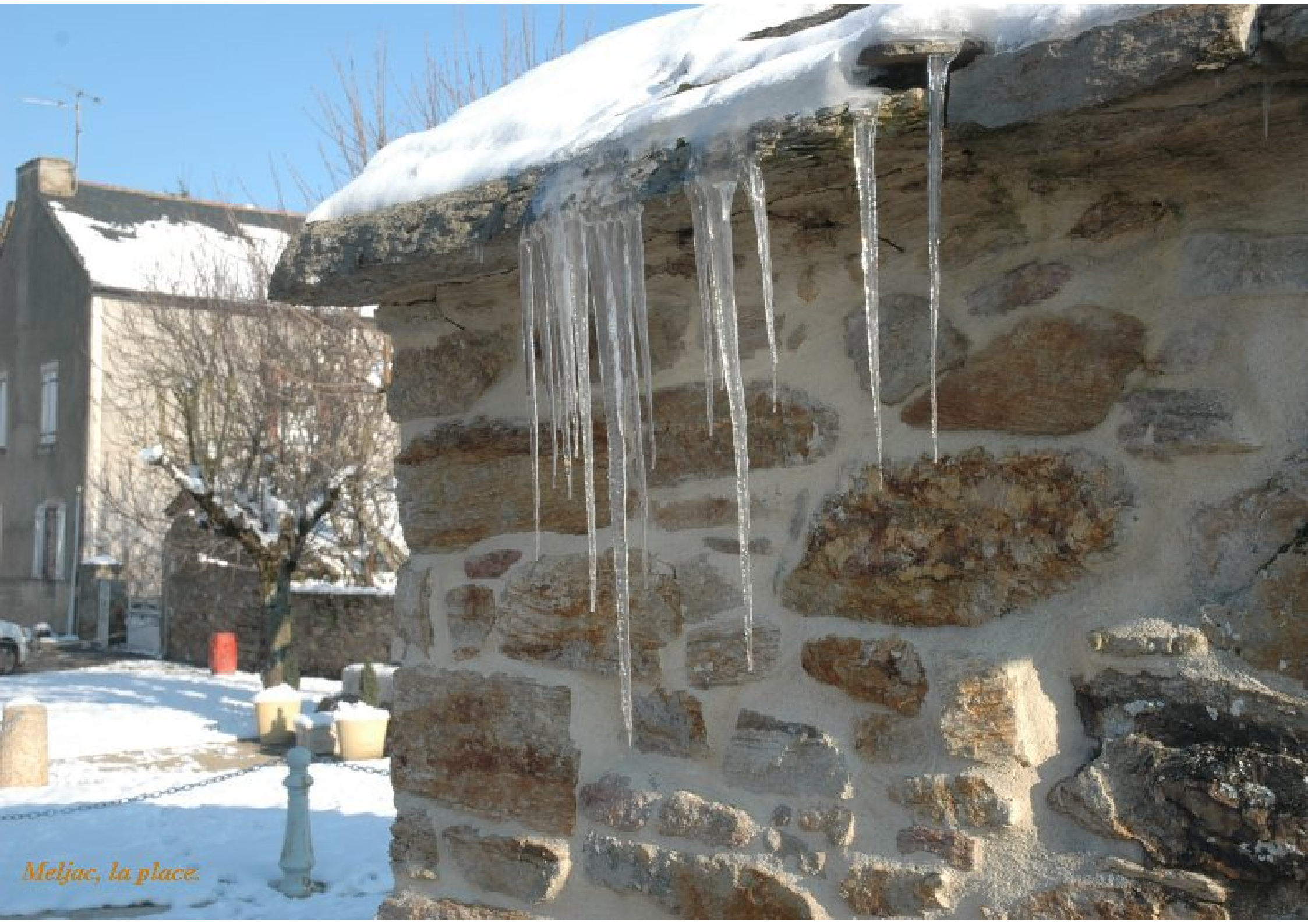
Meljac, la place.