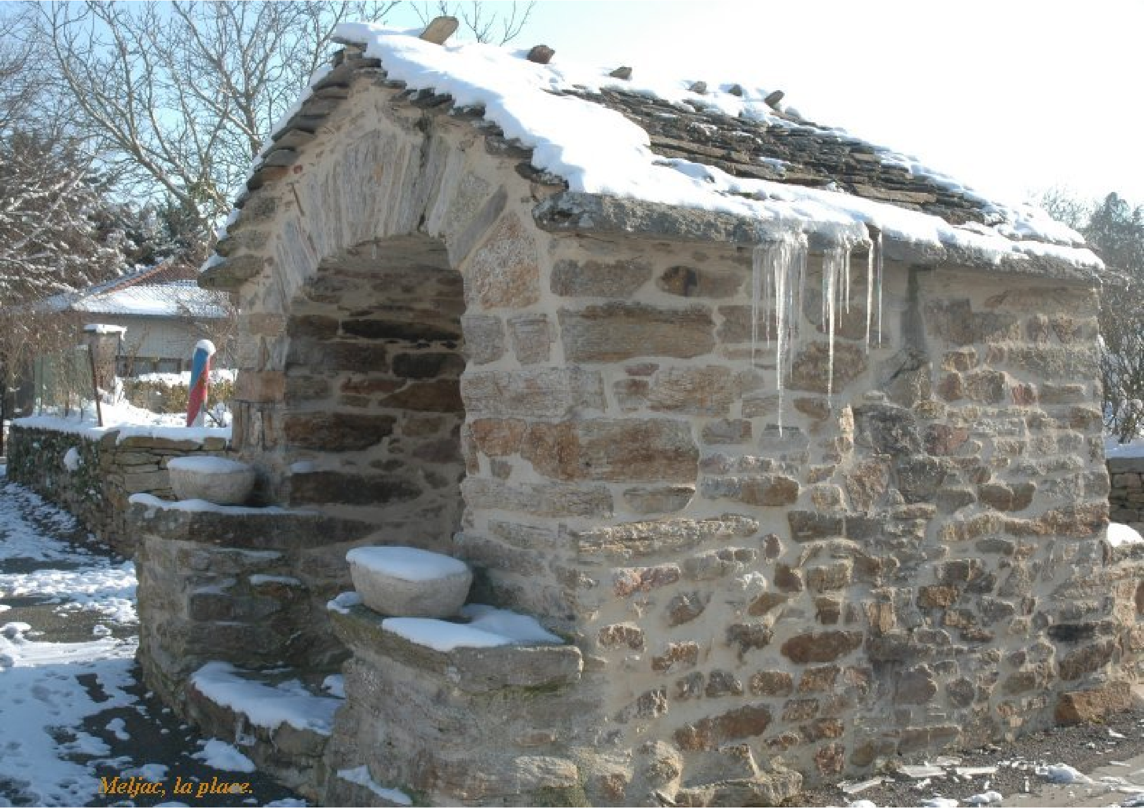
Meljac, la place.