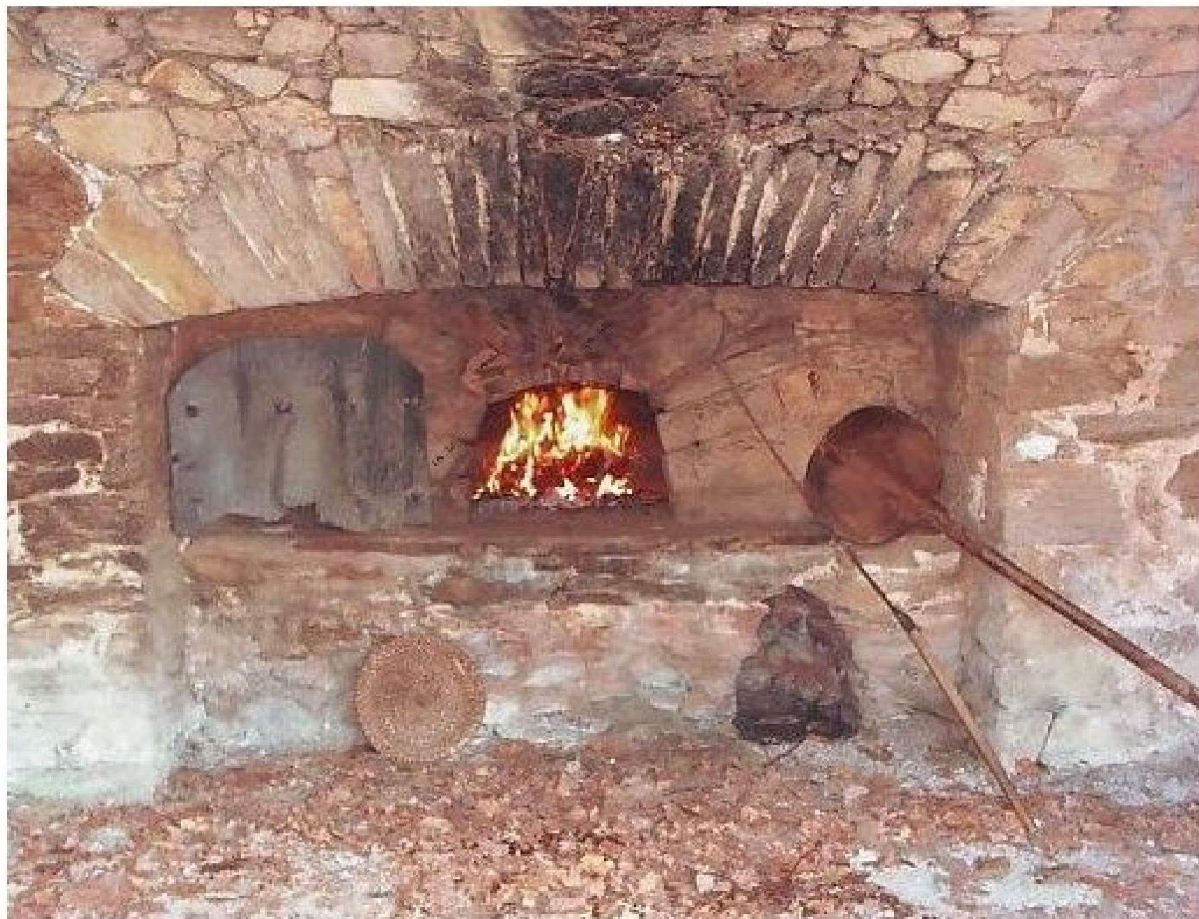
four - ferme Mazars à la Bessière