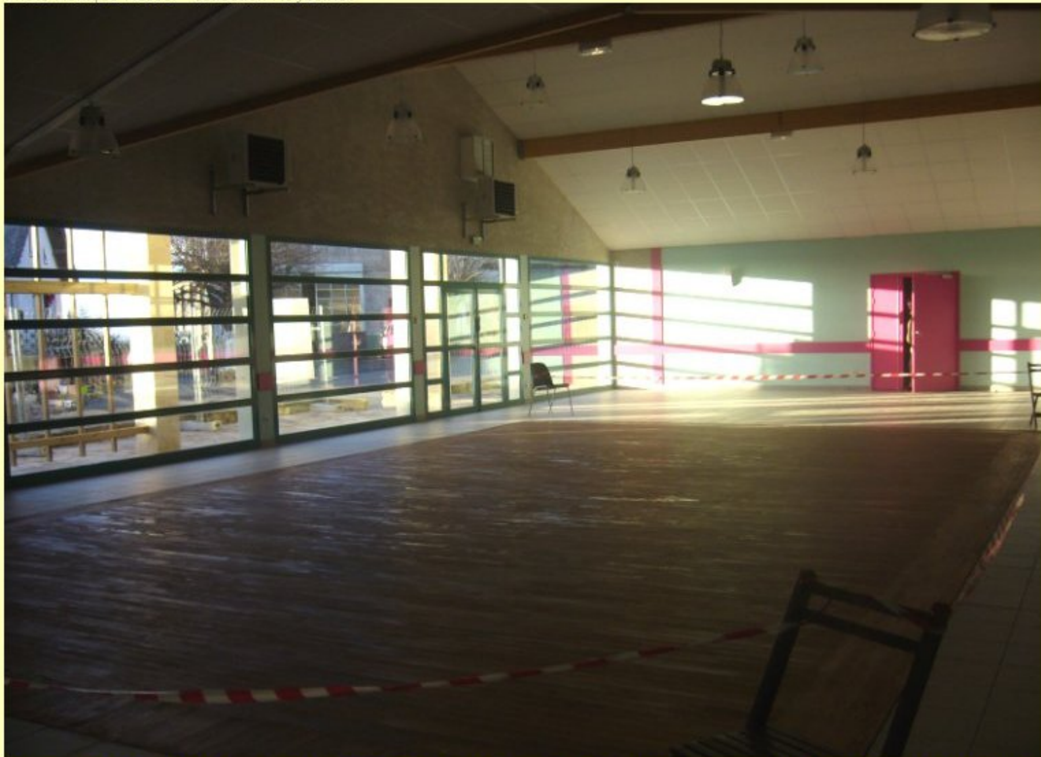
Salle des fêtes de Meljac - vue intérieure - travaux en voie d'achèvement - inauguration fixée au 19 janvier 2008