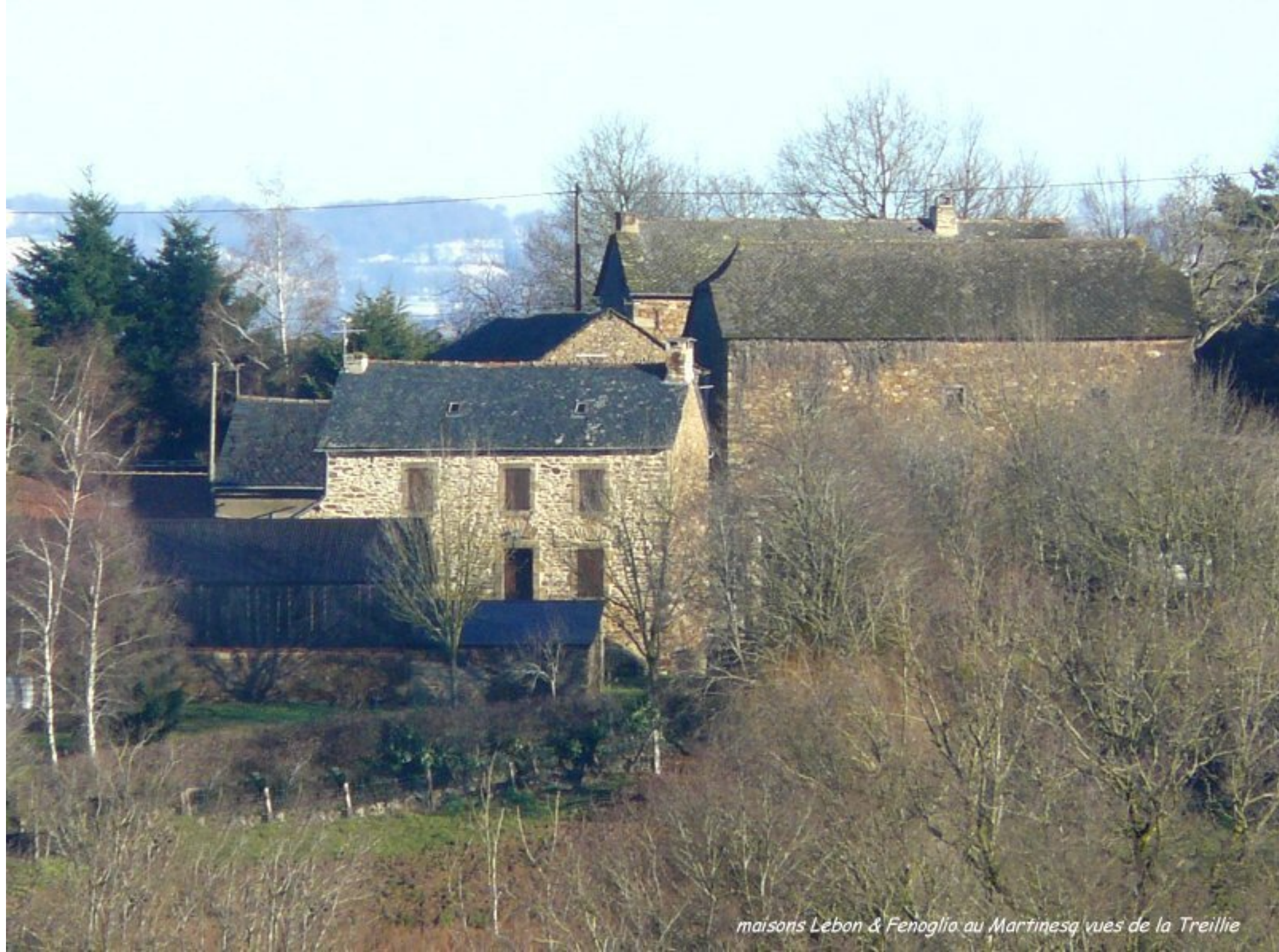
maisons Lebon & Fenoglio au Martinesq vues de la Treillie