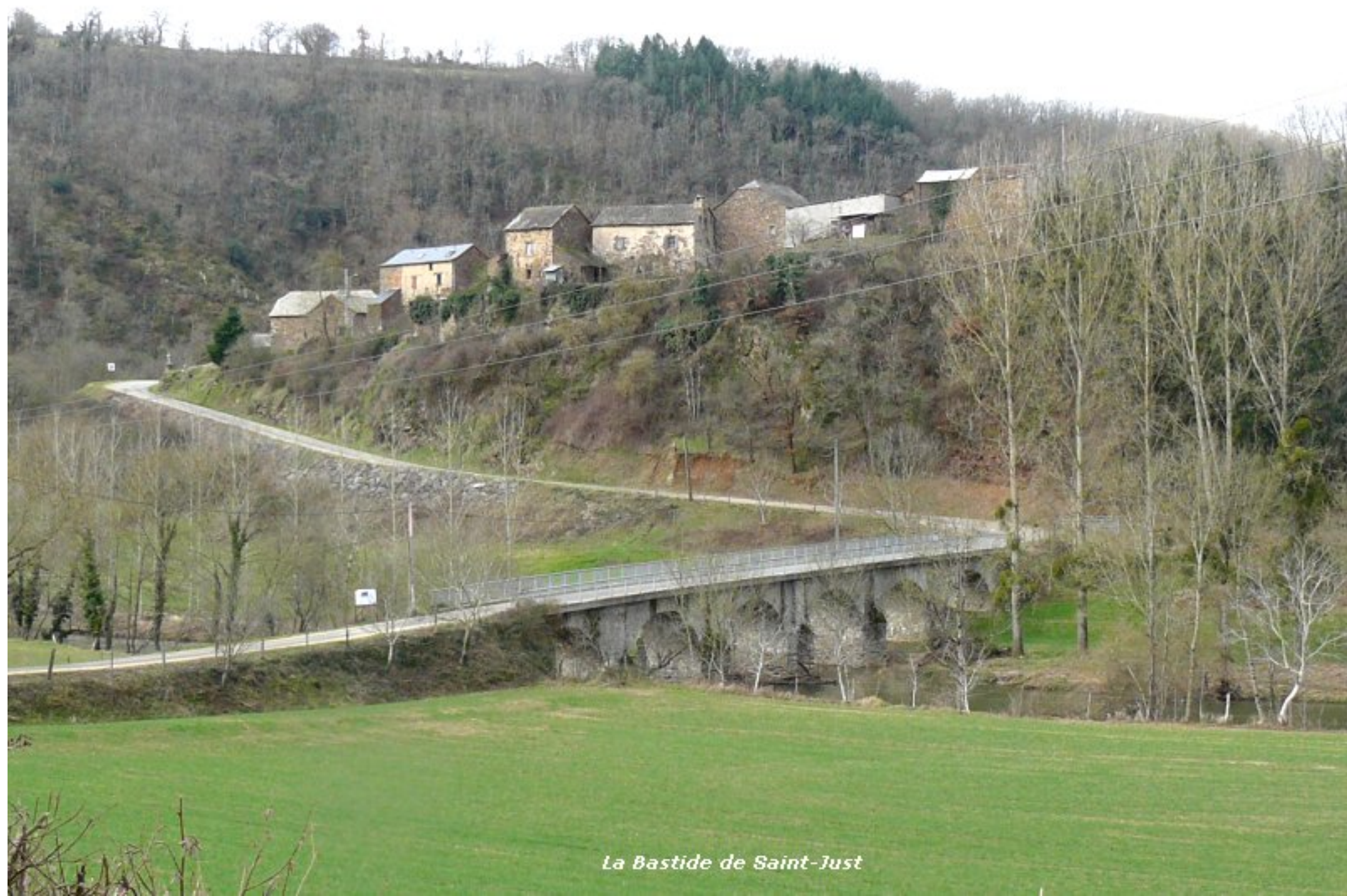
La Bastide de Saint-Just