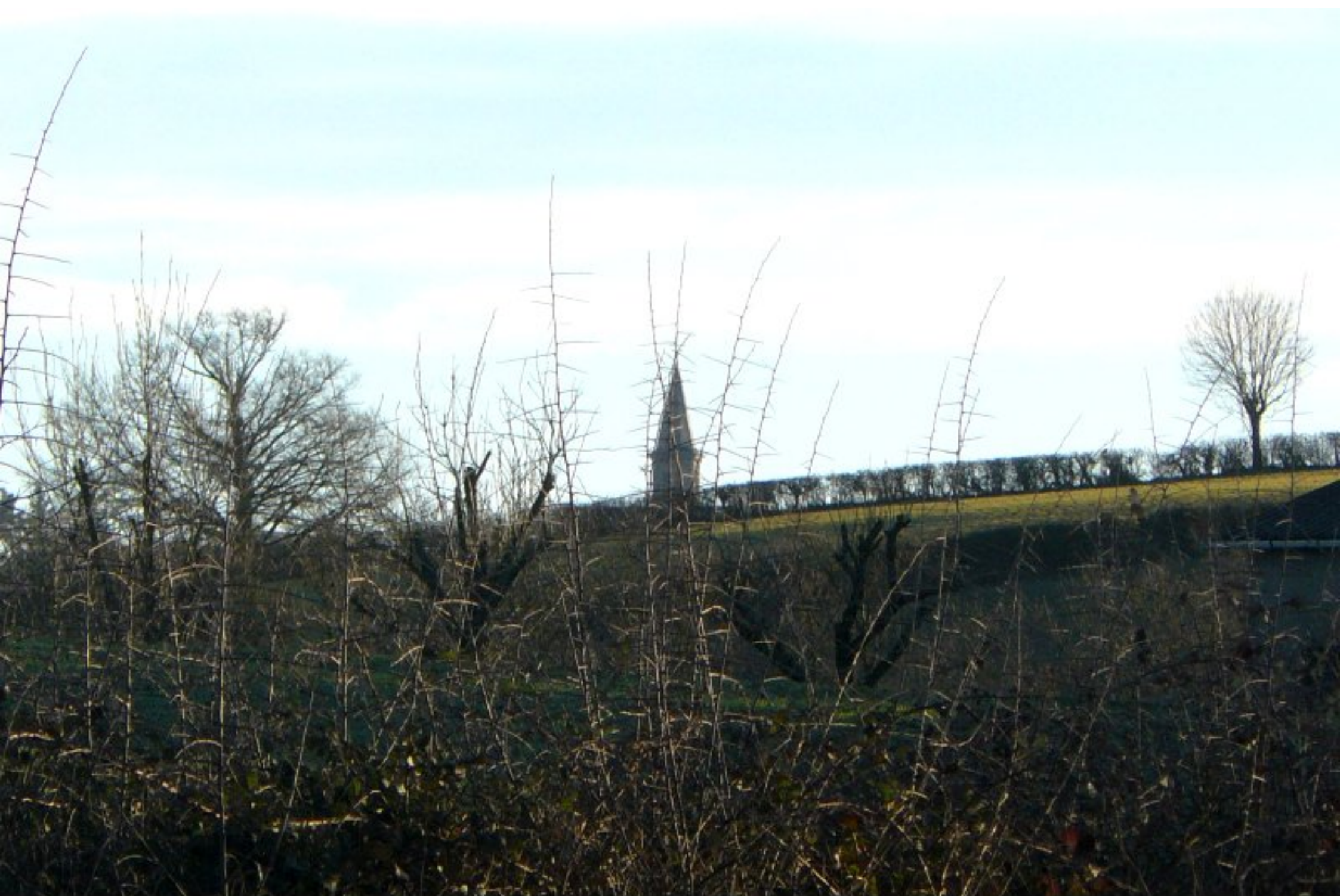
Le eloher de Meljae, du Martinesq