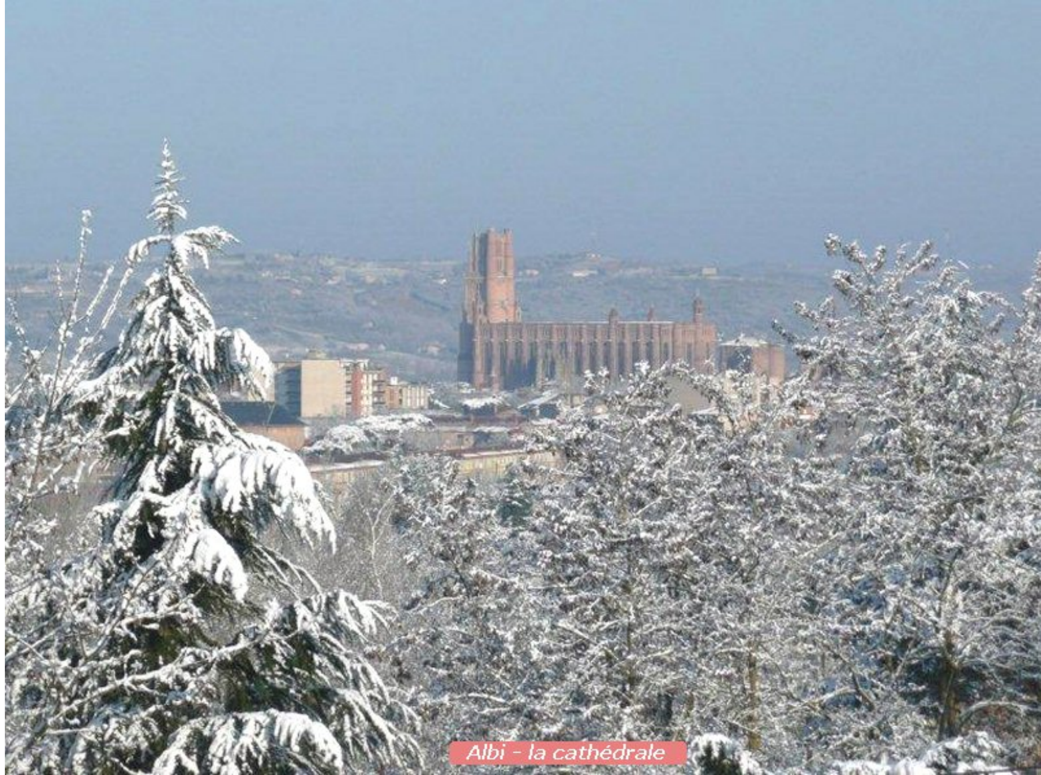
Albi - la cathédrale