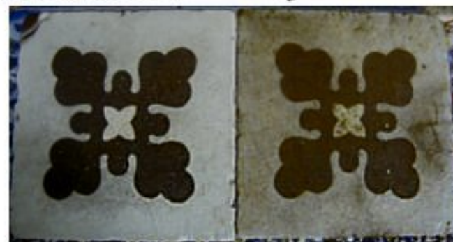
carrelage de l'ancienne église de Meljac