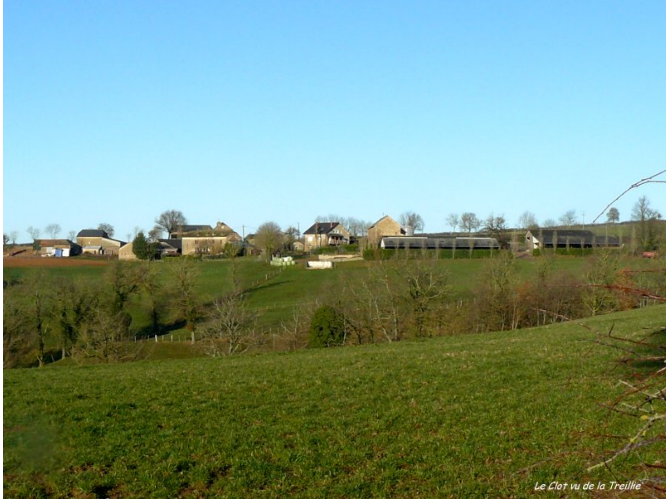
Le Clot vu de la Treillie