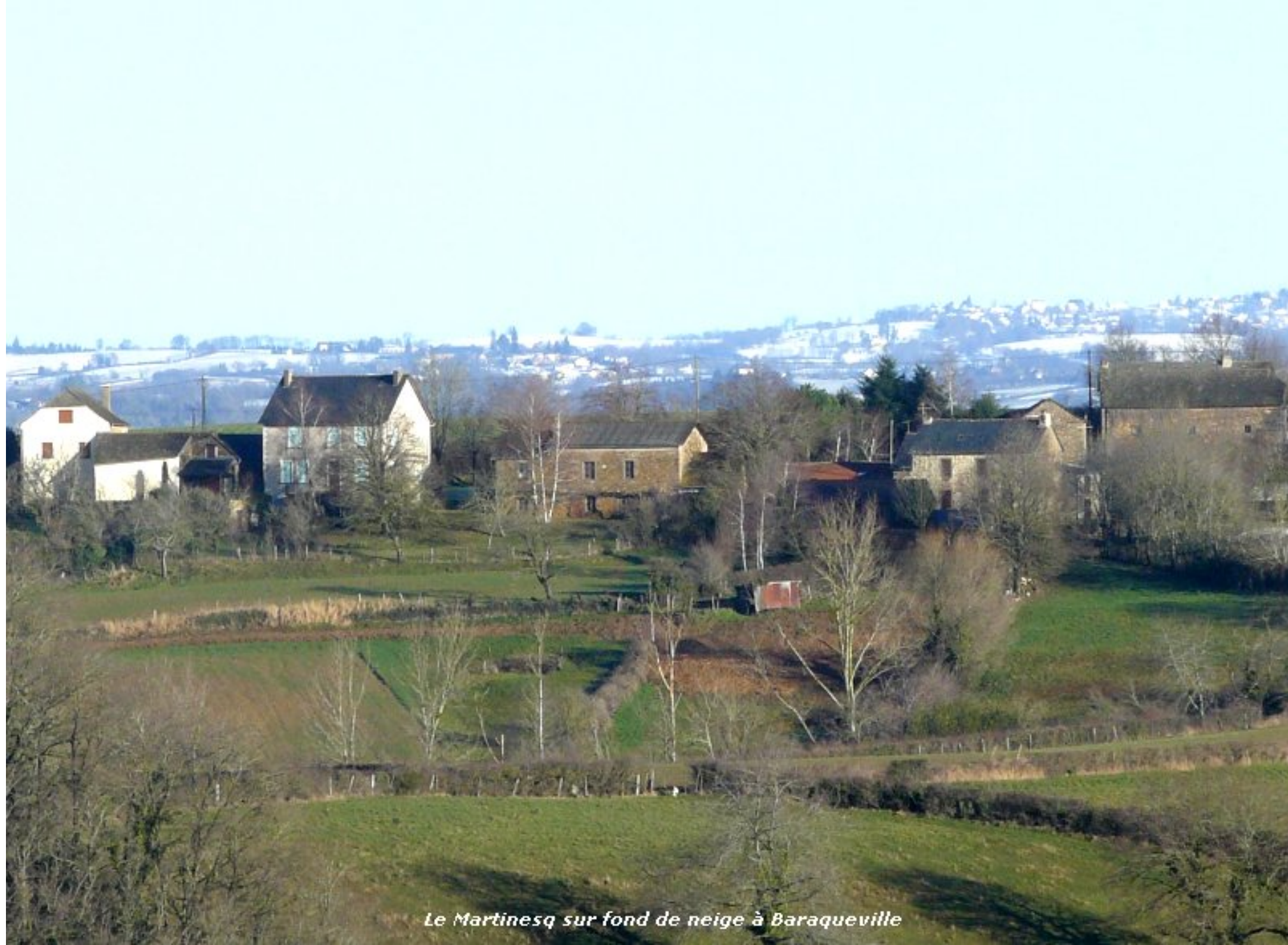
Le Martinesq sur fond de neige à Baraqueville