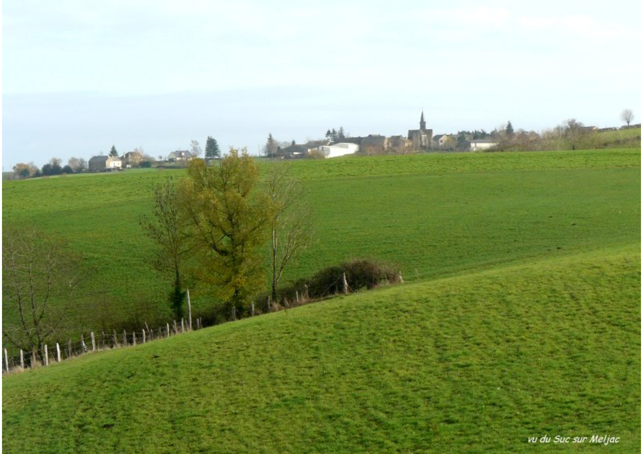
vu du Suc sur Meljac