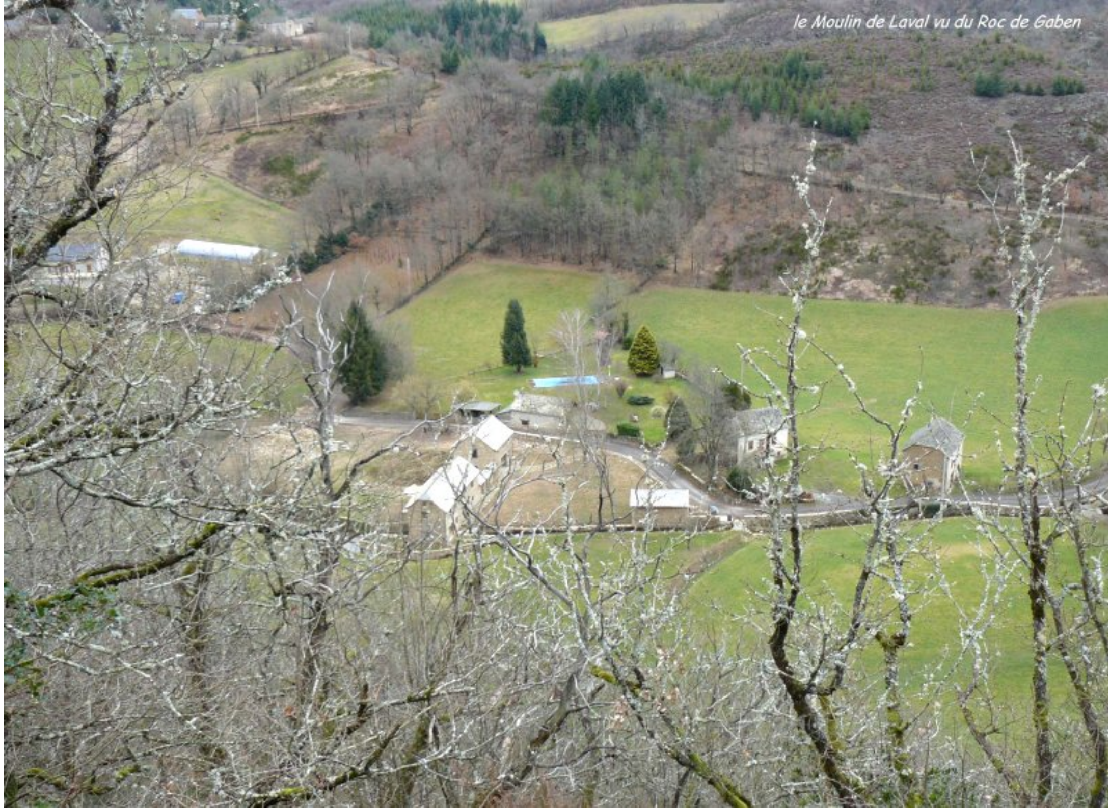
le Moulin de Laval vu du Roc de Gaben