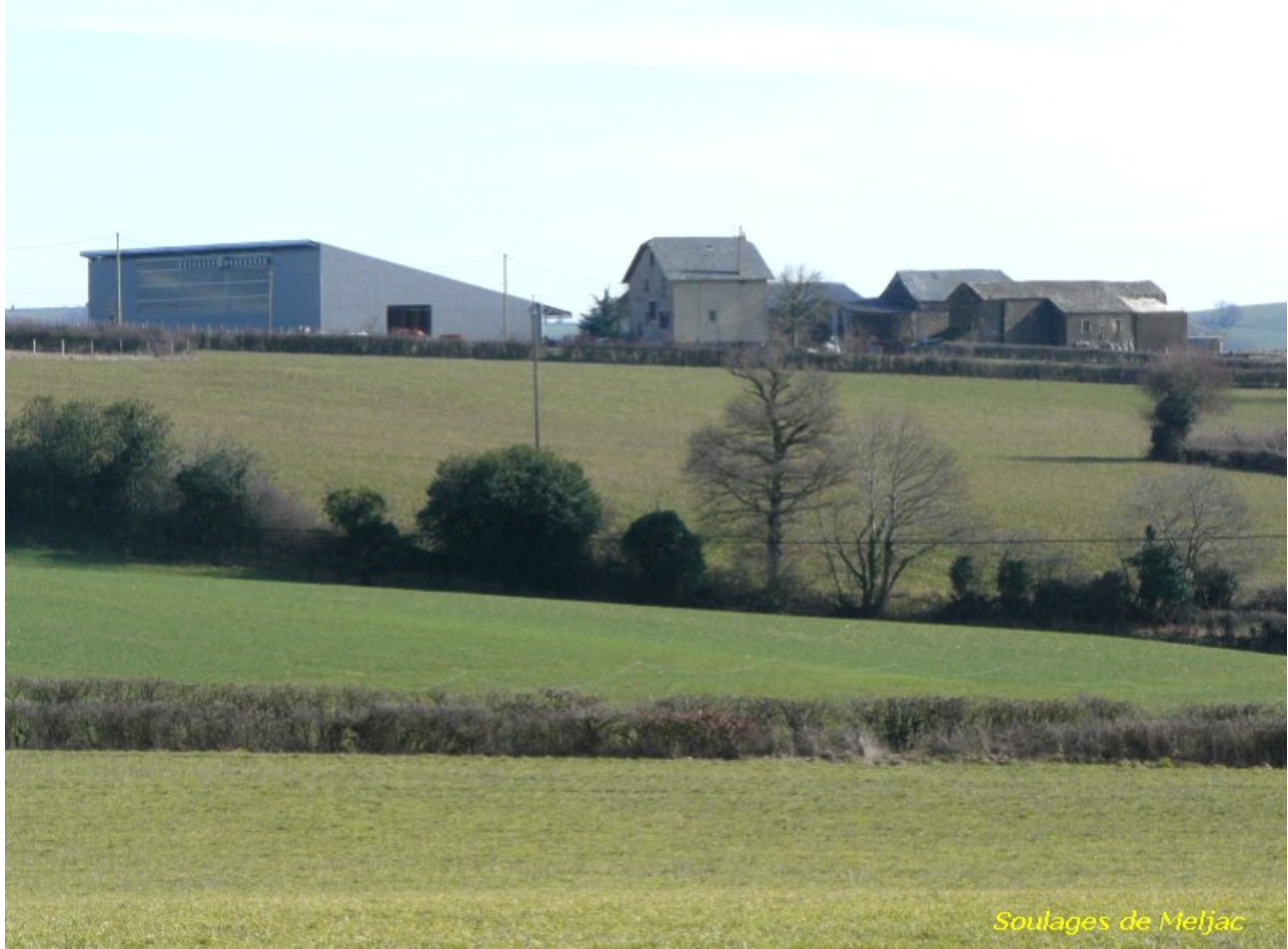
Soulages de Meljac