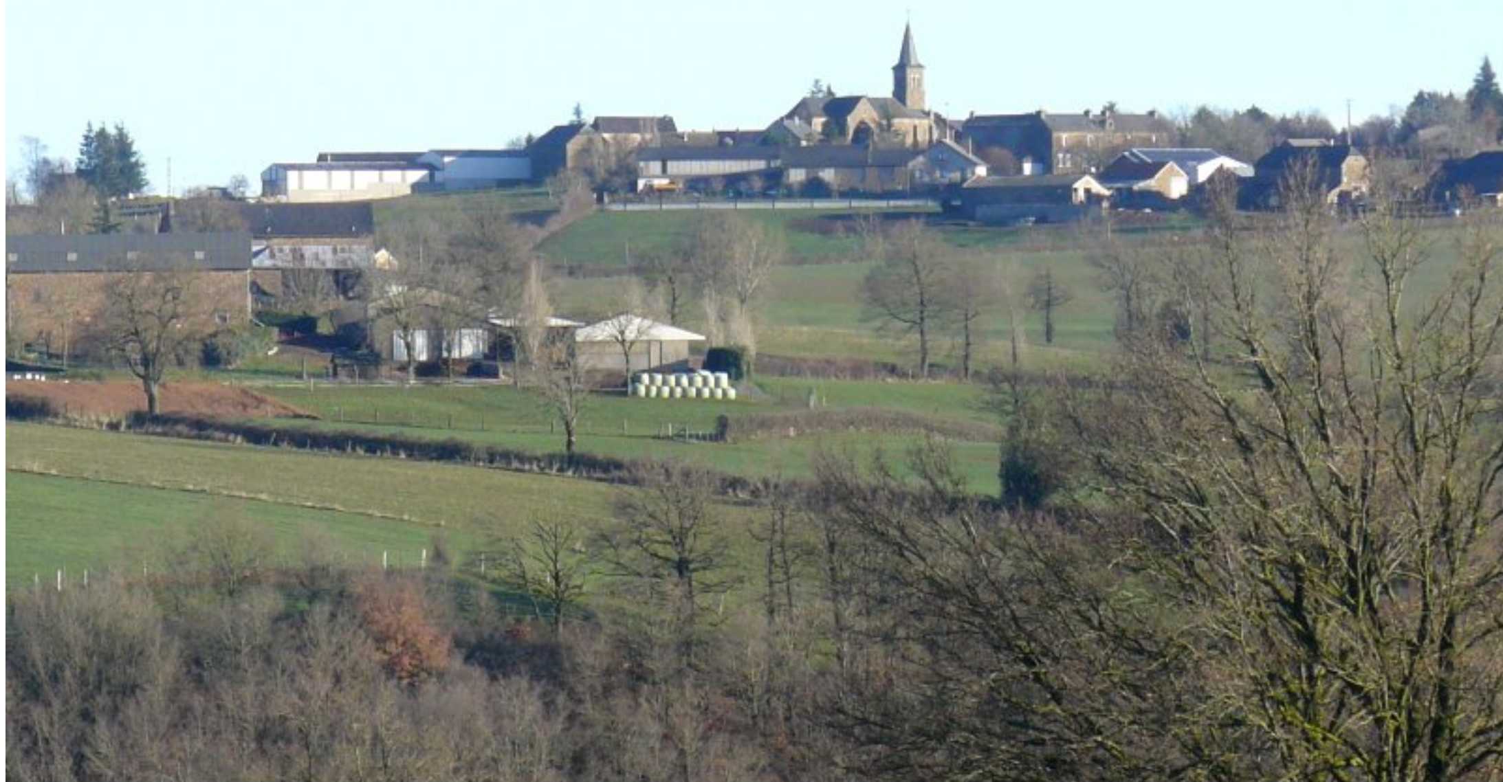
Meljæ vu de la Treillie