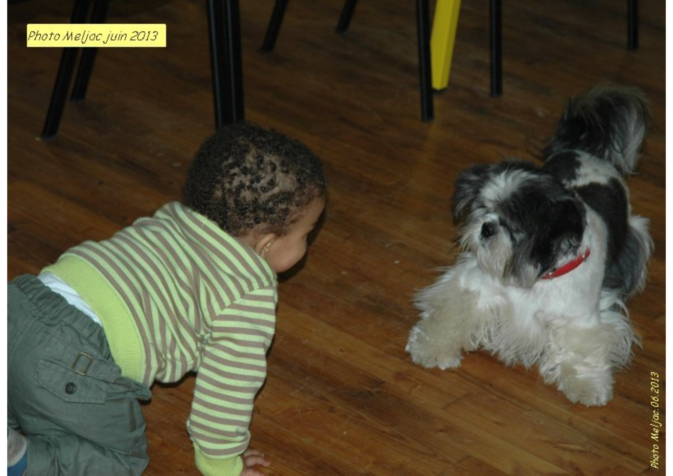
Photo Meljac 06 2013