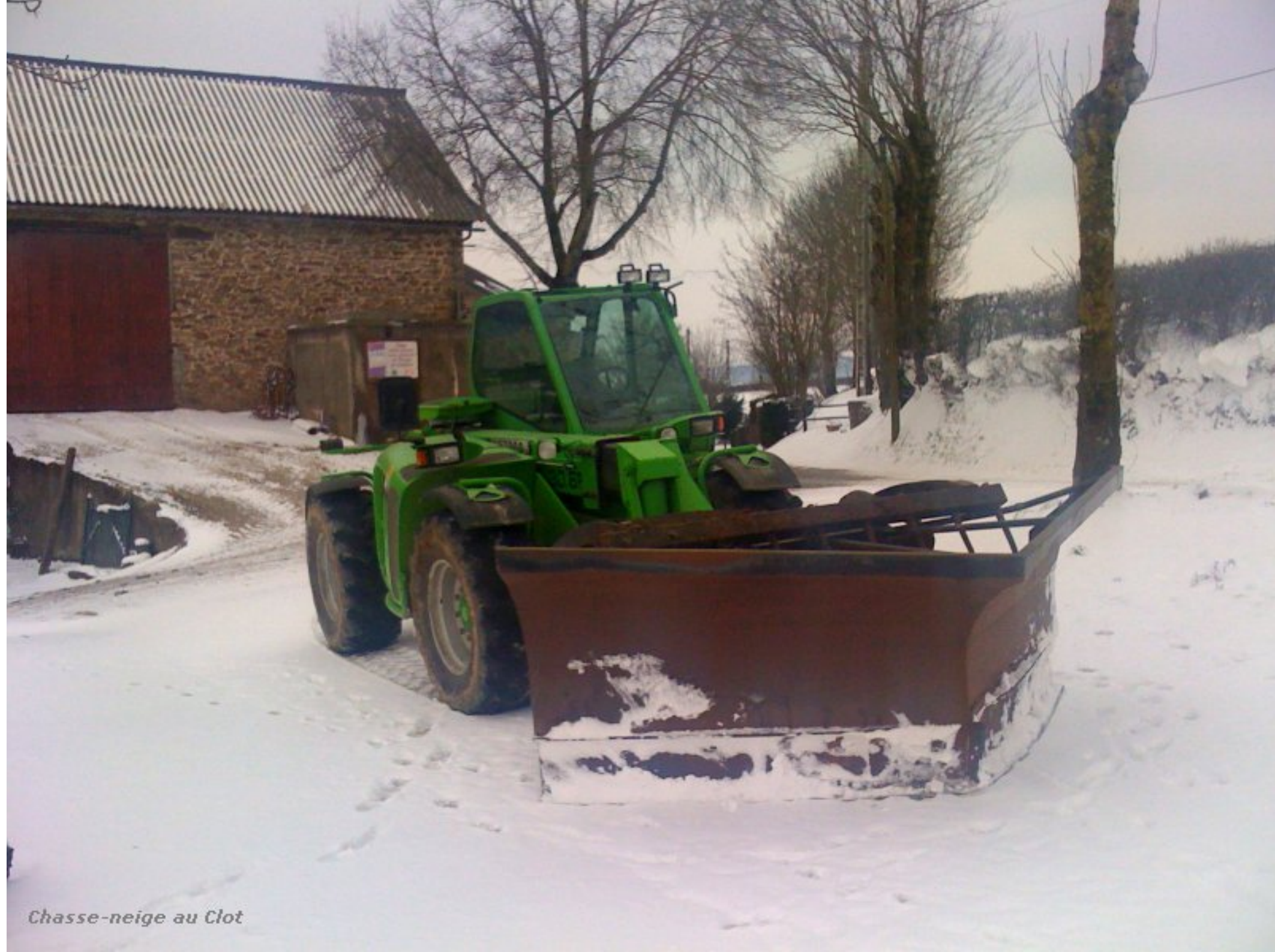
Chasse-neige au Clot