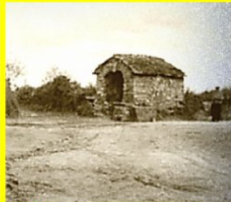
Le puits de Meljac, hier et aujourd'hui