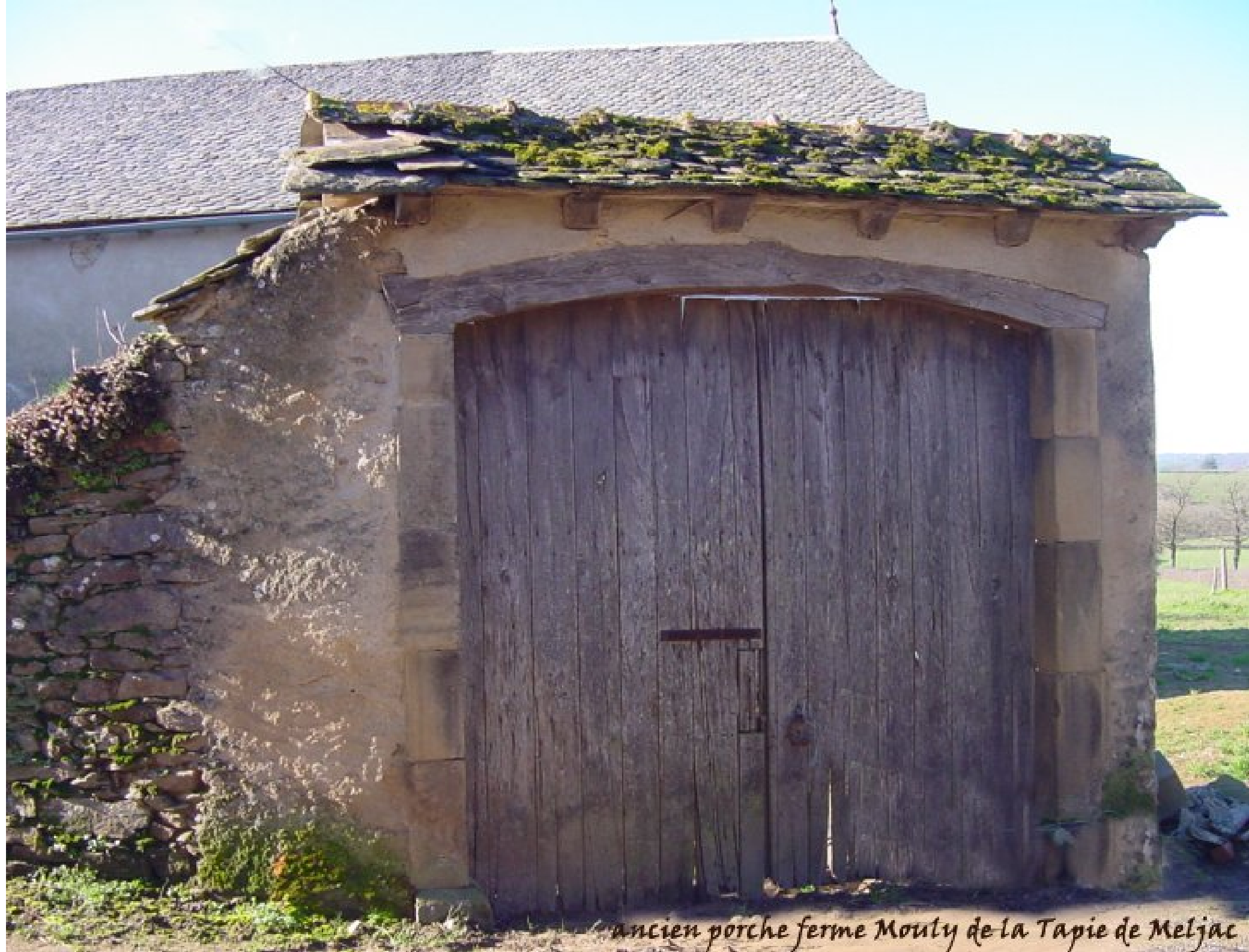
ancien porche ferme Mouty de la Tapie de Meljac