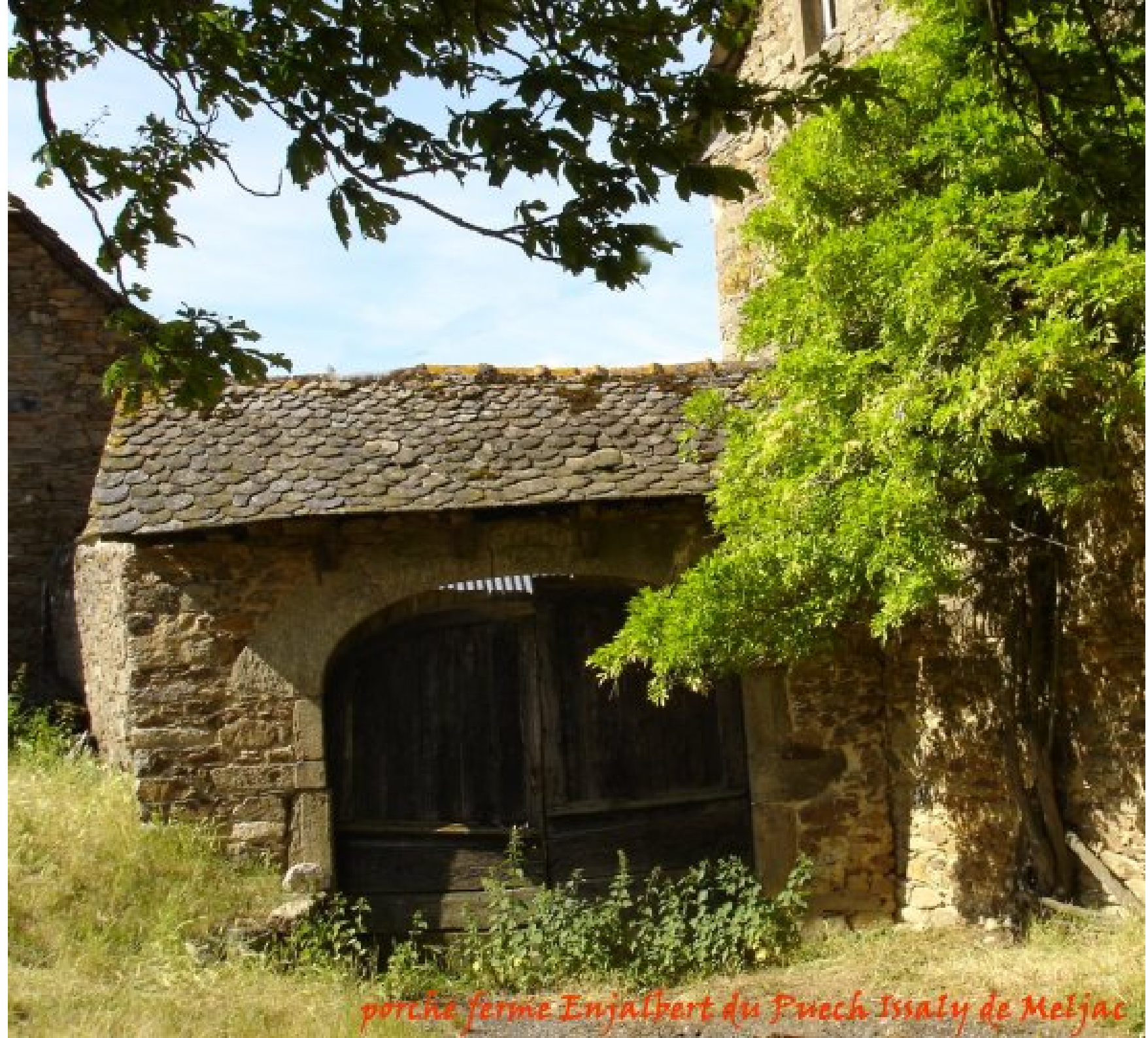
porche ferme Enjalbert du Puech Issaly de Meljac