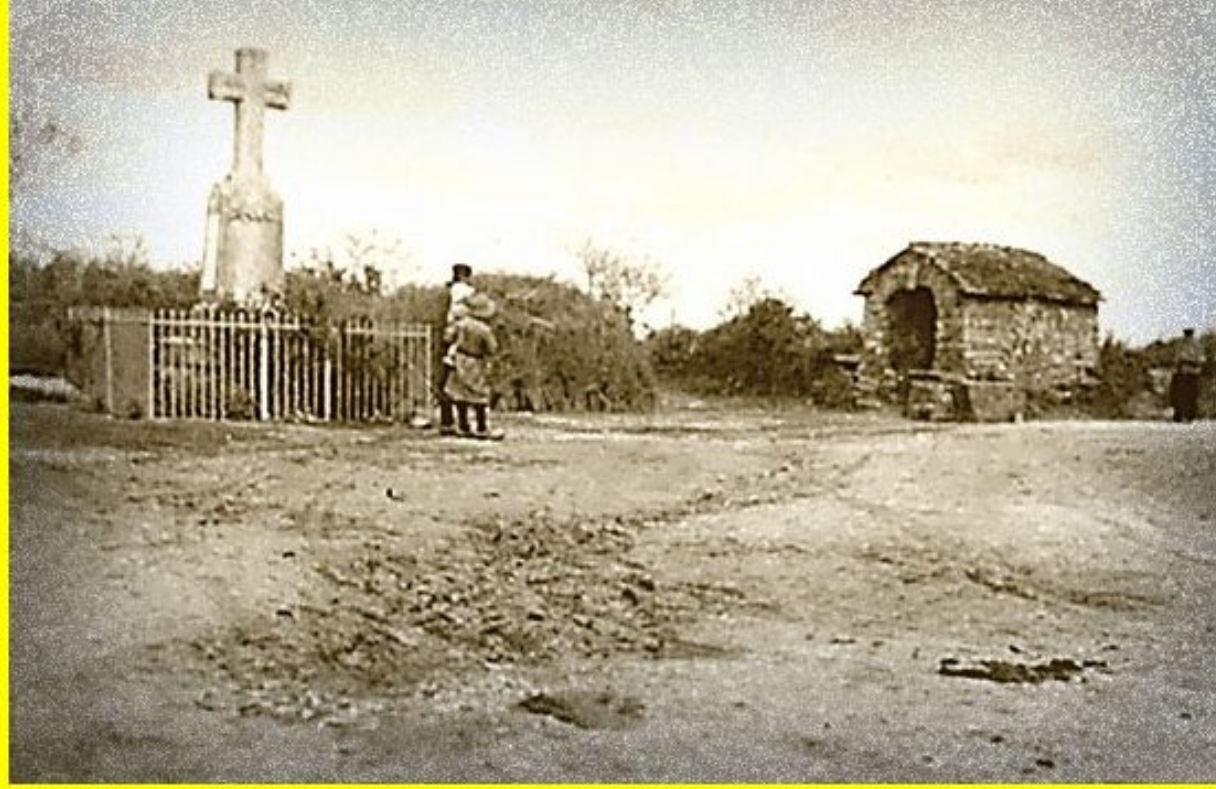
Monument de Meljac, hier et aujourd'hui