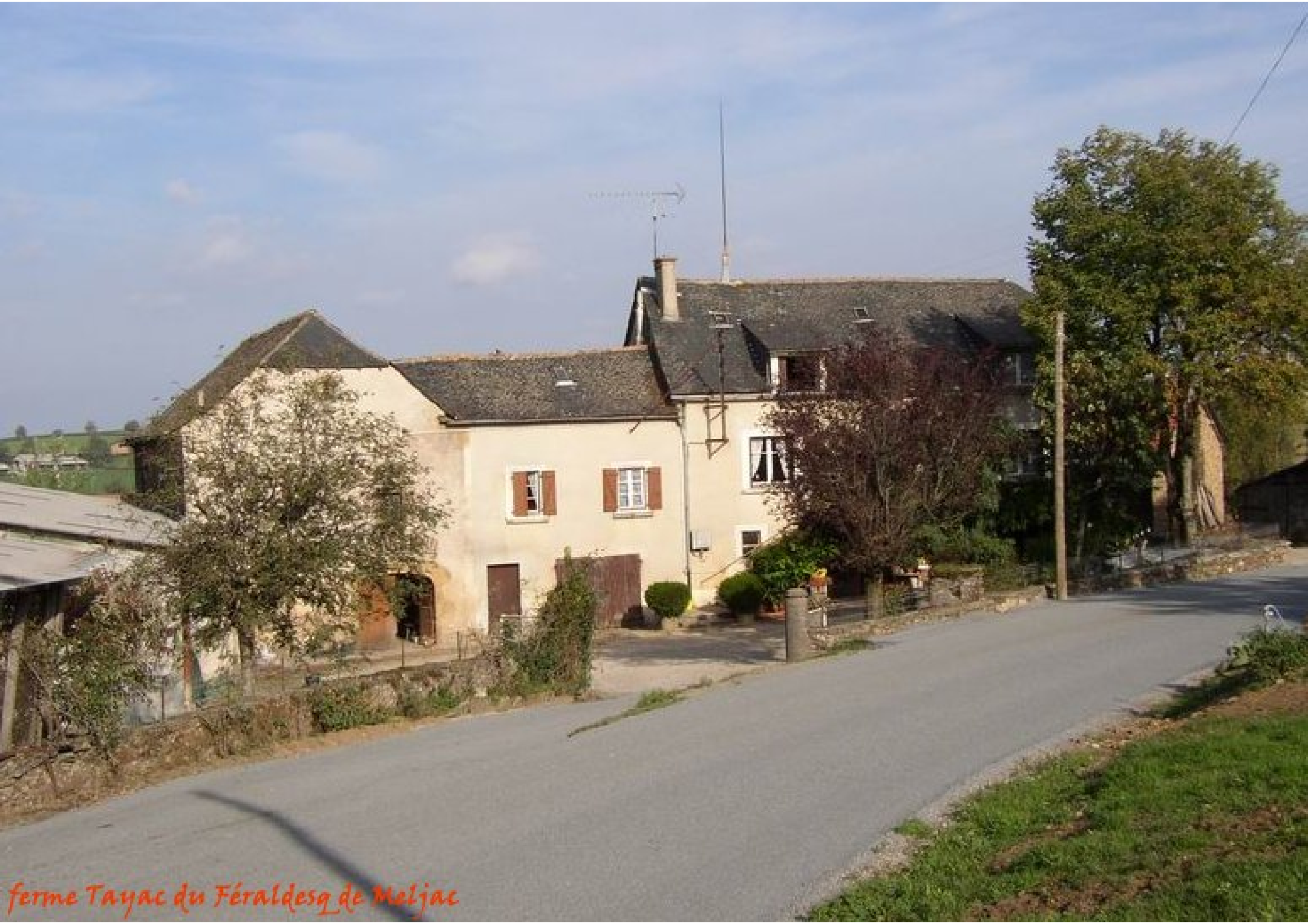
ferme Tayac du Féraldesq de Meljac