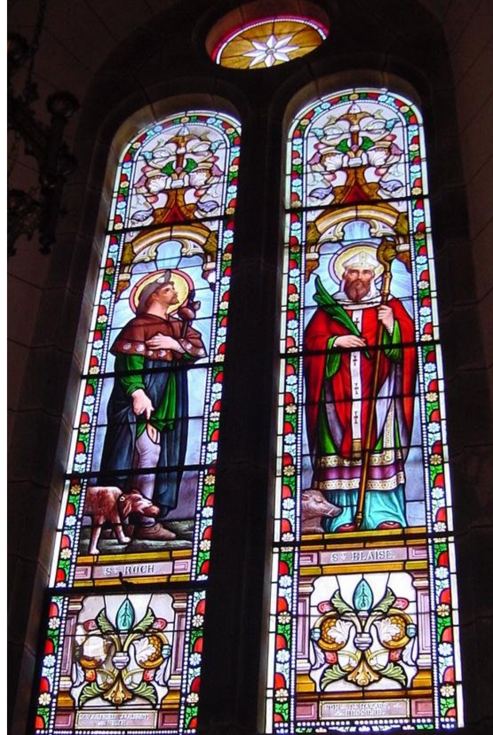
Saint Roch & Saint Blaise