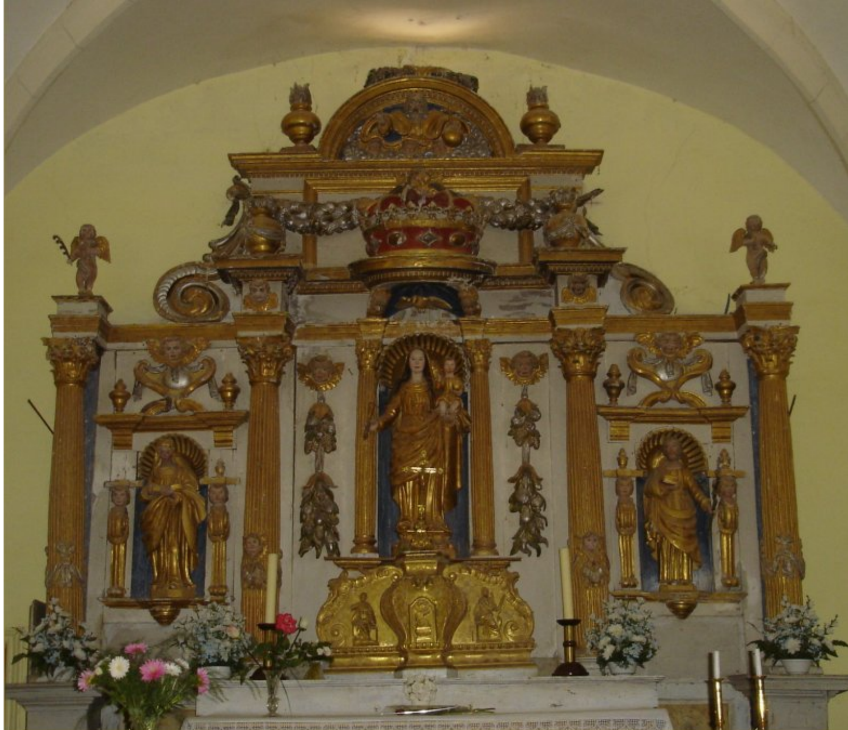
Notre-Dame de Roucaurol