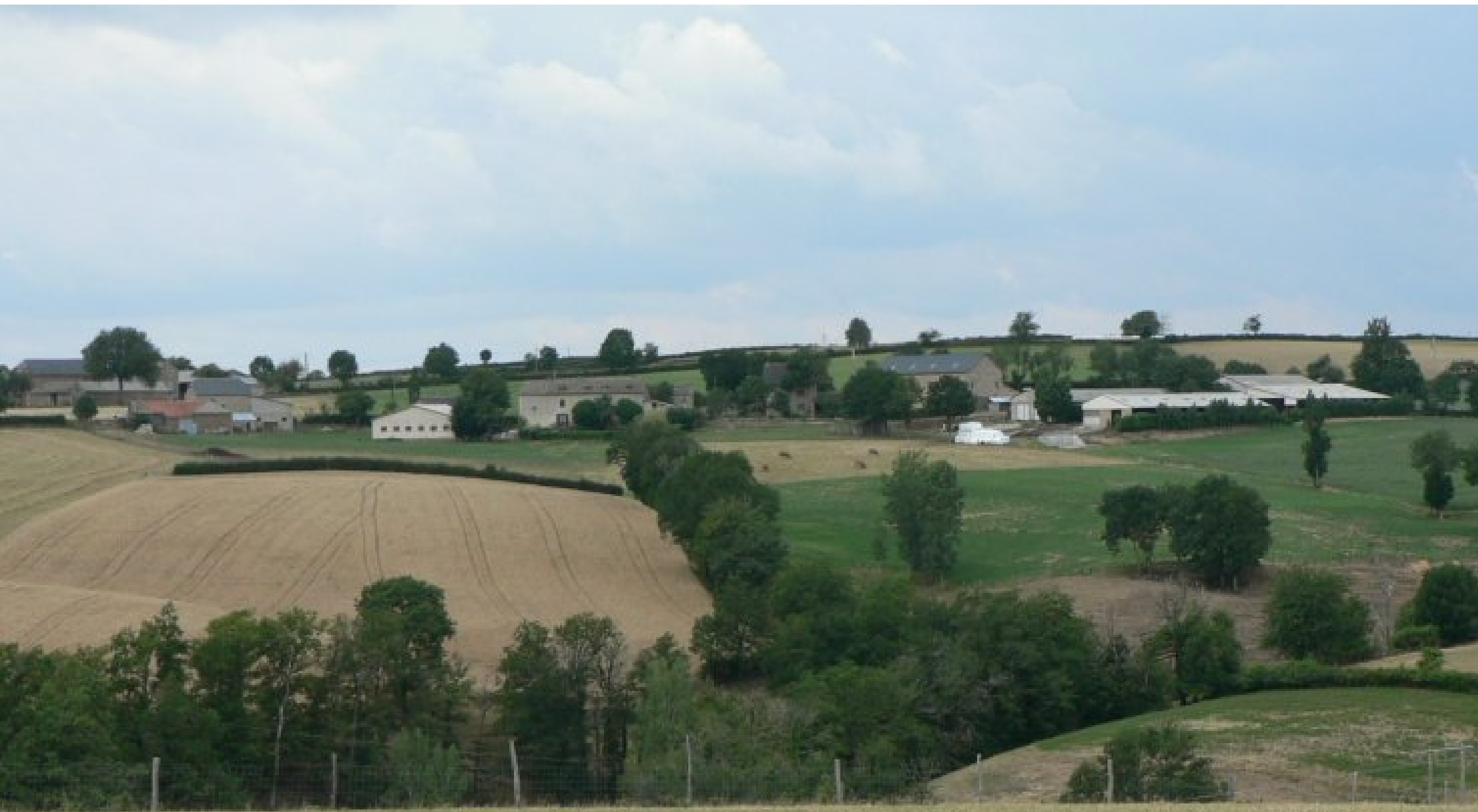
ferme Gaubert-Capoulade du Cîlot de Meljac