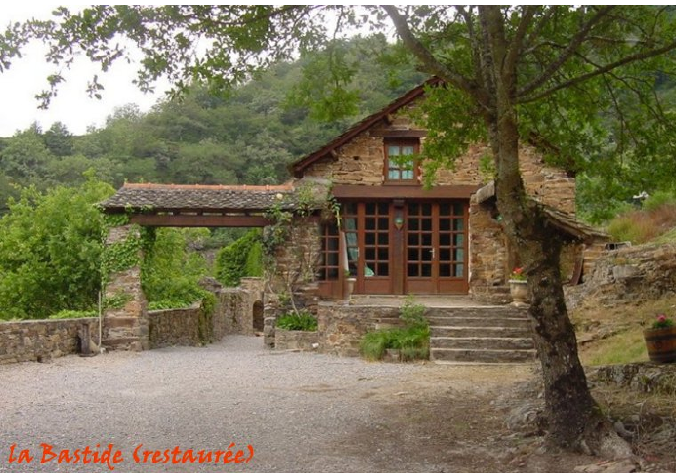
La Bastide (restaurée)