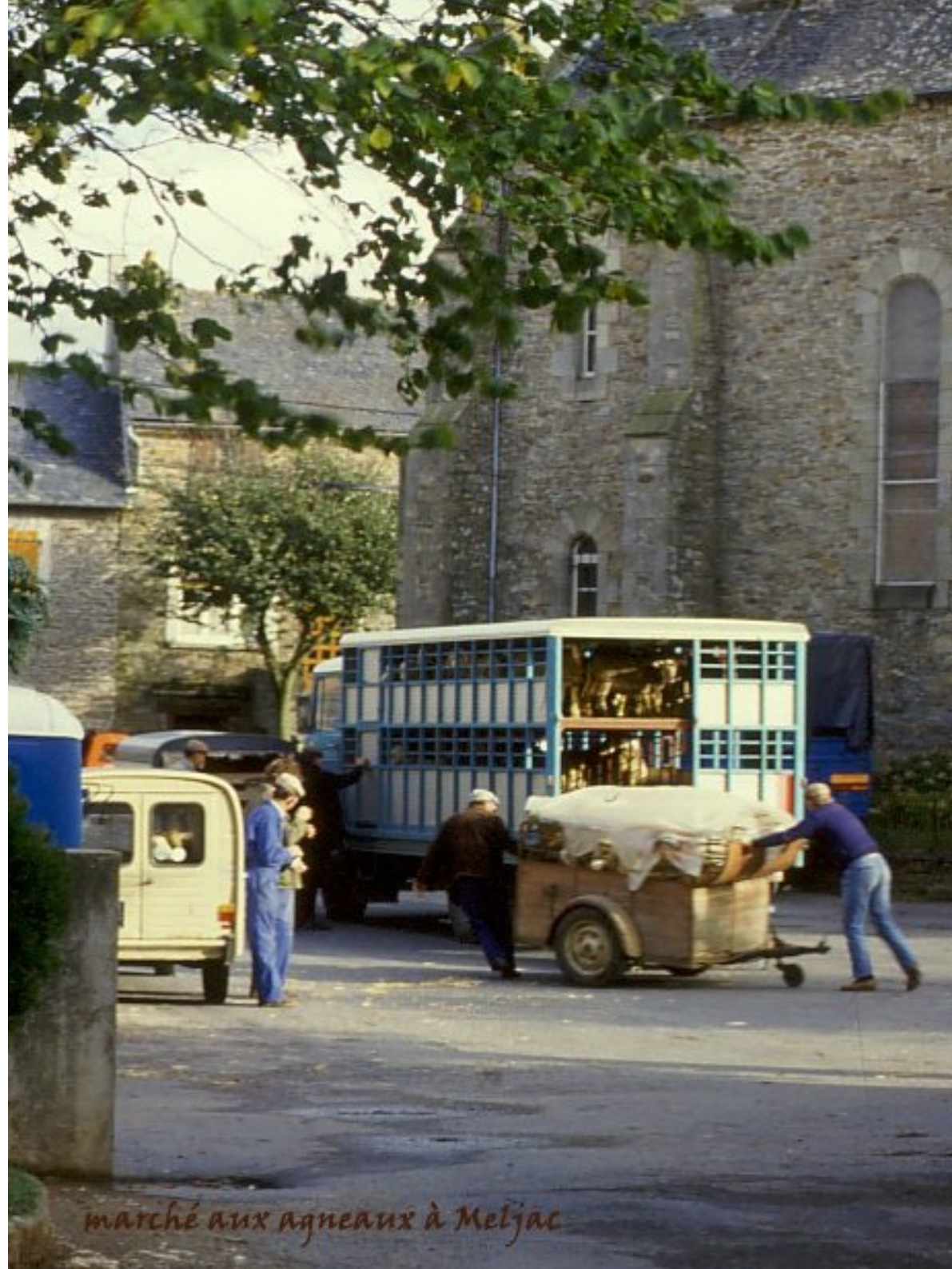
marché aux agneaux à Meljac