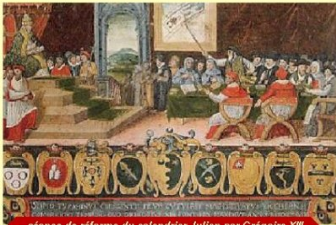
séance de réforme du calendrier Julien par Grégoire XIII

La bulle du 3 mars 1582, du Pape Grégoire XIII remplace le calendrier Julien par le calendrier Grégorien. La durée de la révolution de la Terre autour du Soleil étant de 365 jours et 6 heures, ce calendrier rattrape les heures cumulées pendant quatre années successives en un bloc d'une journée tous les quatre ans. C'est ce qu'on appelle une année bissextile. Le premier 29 février du calendrier Grégorien est ainsi « né » le 29 février 1584.