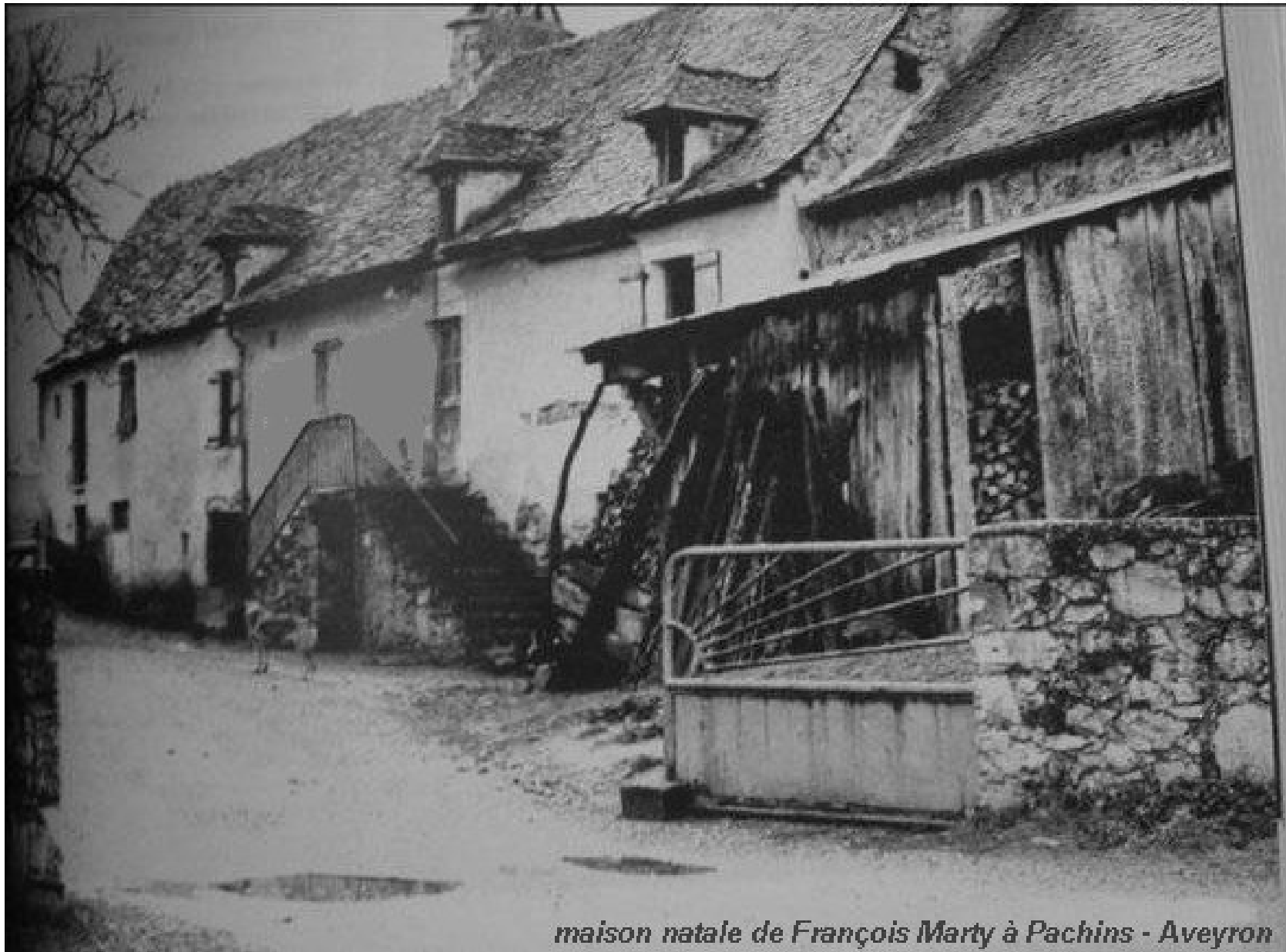
maison natale de François Marty à Pachins - Aveyron