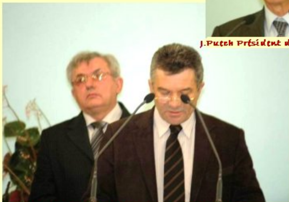
Jean-Pierre MAZARS Président de la Communauté de Communes du Naurcellois