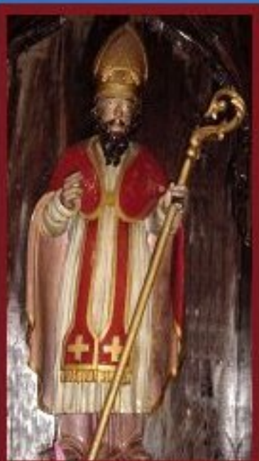
Saint-Blaise - statue en bois