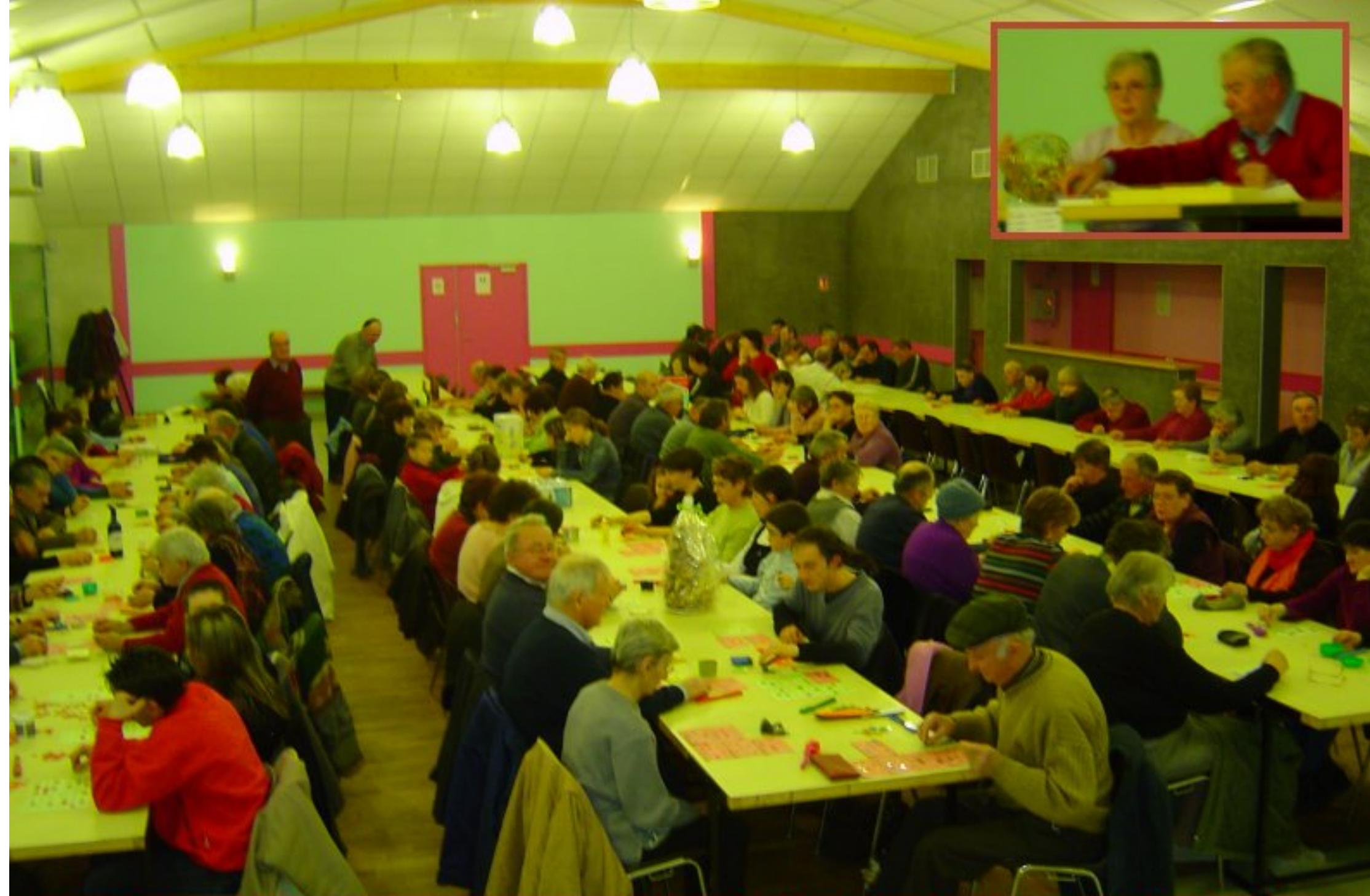
Forte affluence et franc succès au quîne du club des aînés de Meljac, le 9 février dernier dans la nouvelle salle des fêtes du village.