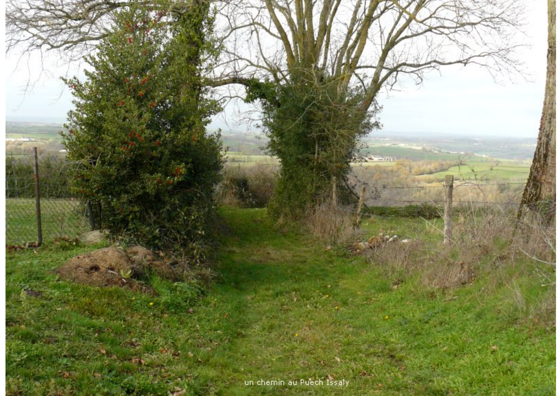
un chemin au Puech Issaly