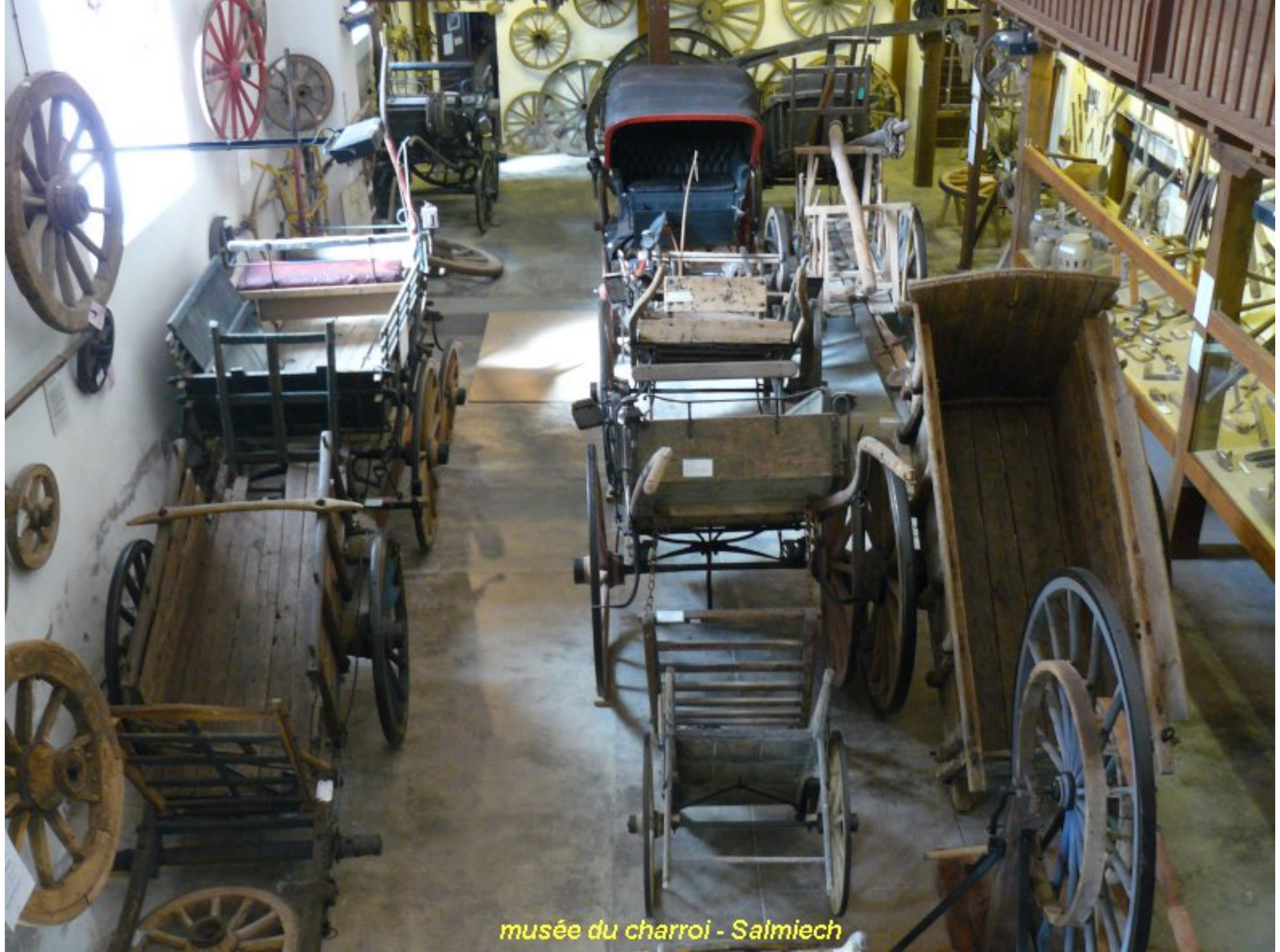
musée du charroi - Salmiech