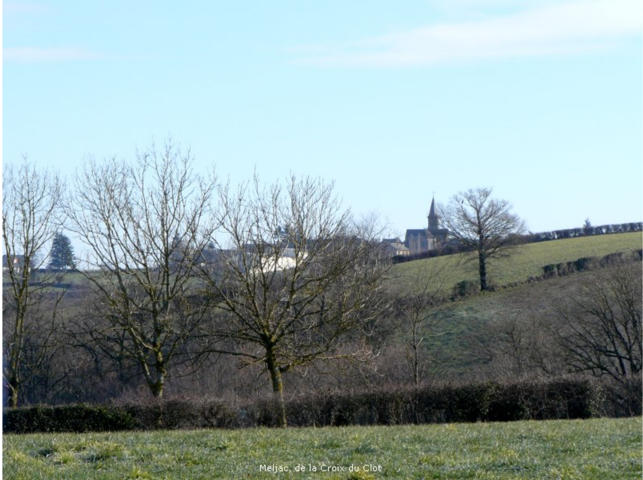
Meljac, de la Croix du Clot