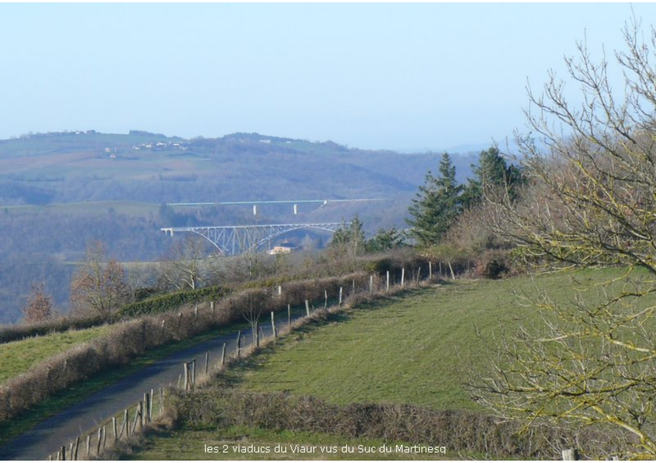
les 2 viaducs du Viaur vus du Suc du Martinesq