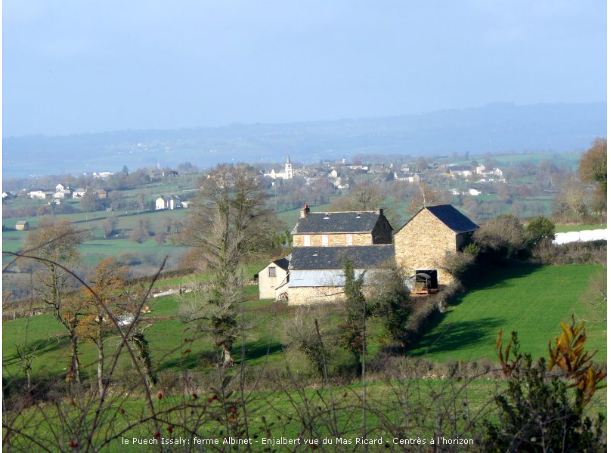
le Puech Issaly: ferme Albinet - Enjalbert vue du Mas Ricard - Centrès à l'horizon