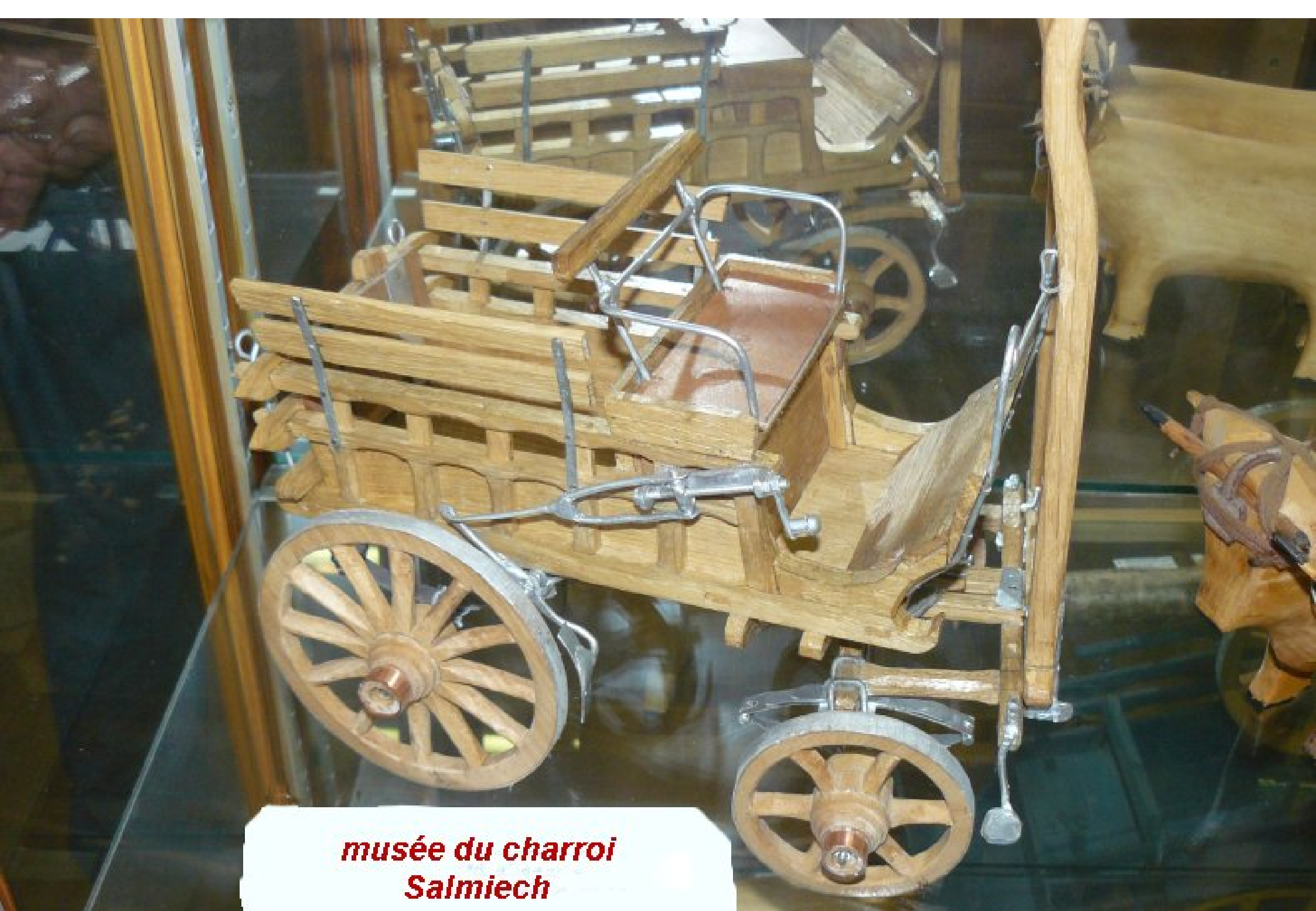
musée du charroi Salmiech