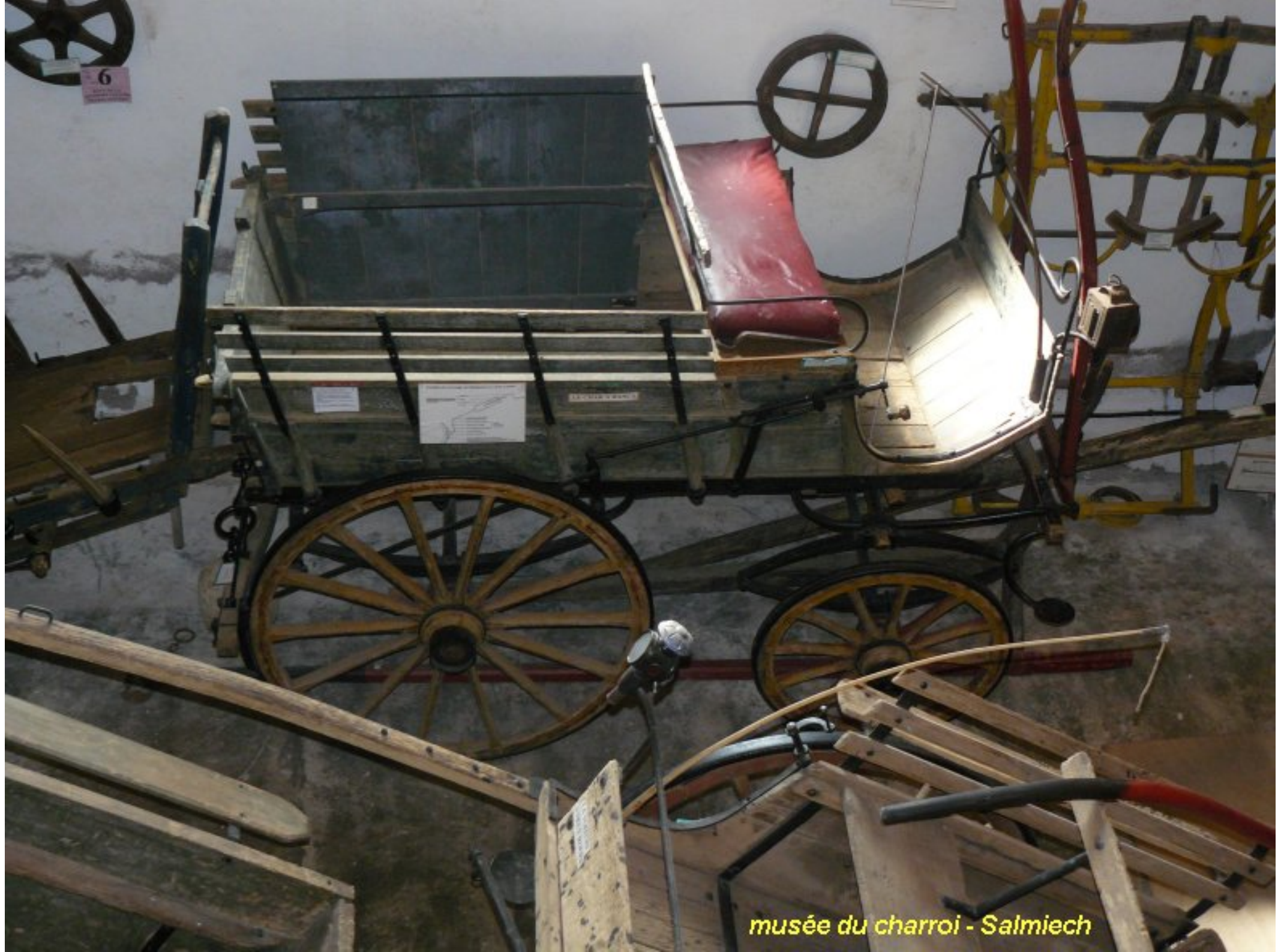
musée du charroi - Salmiech