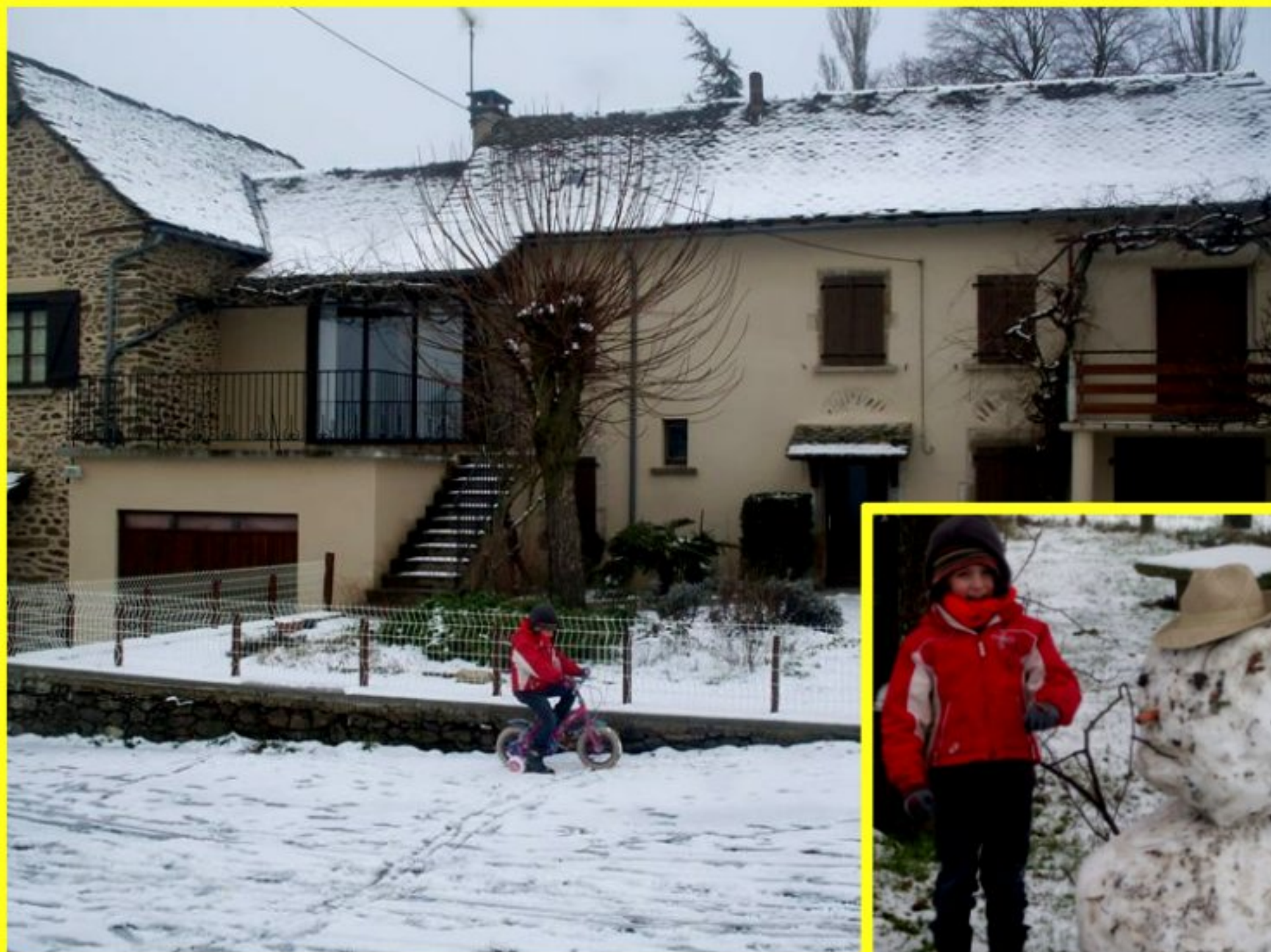
dimanche 26 janvier 2013