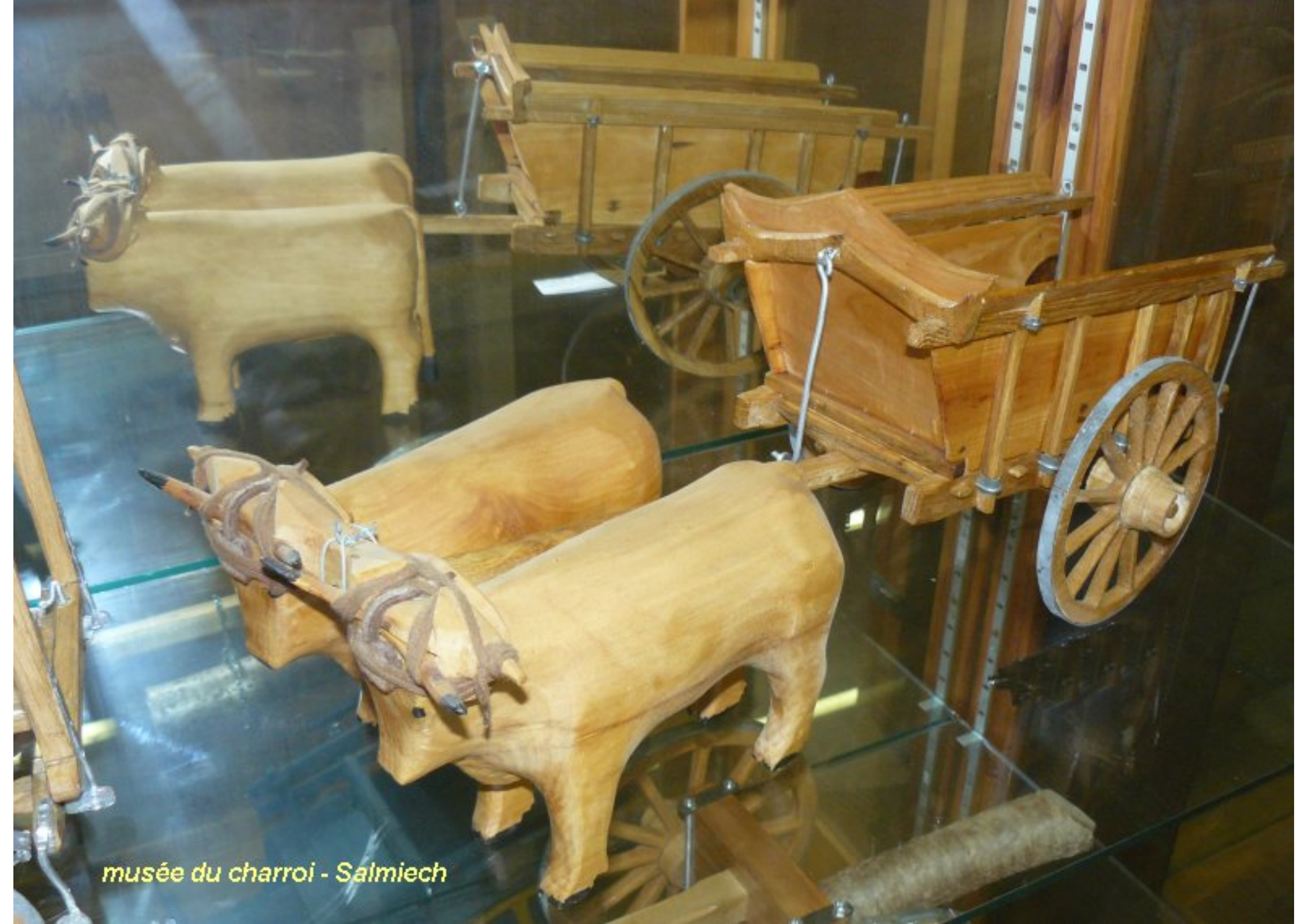
musée du charroi - Salmiech