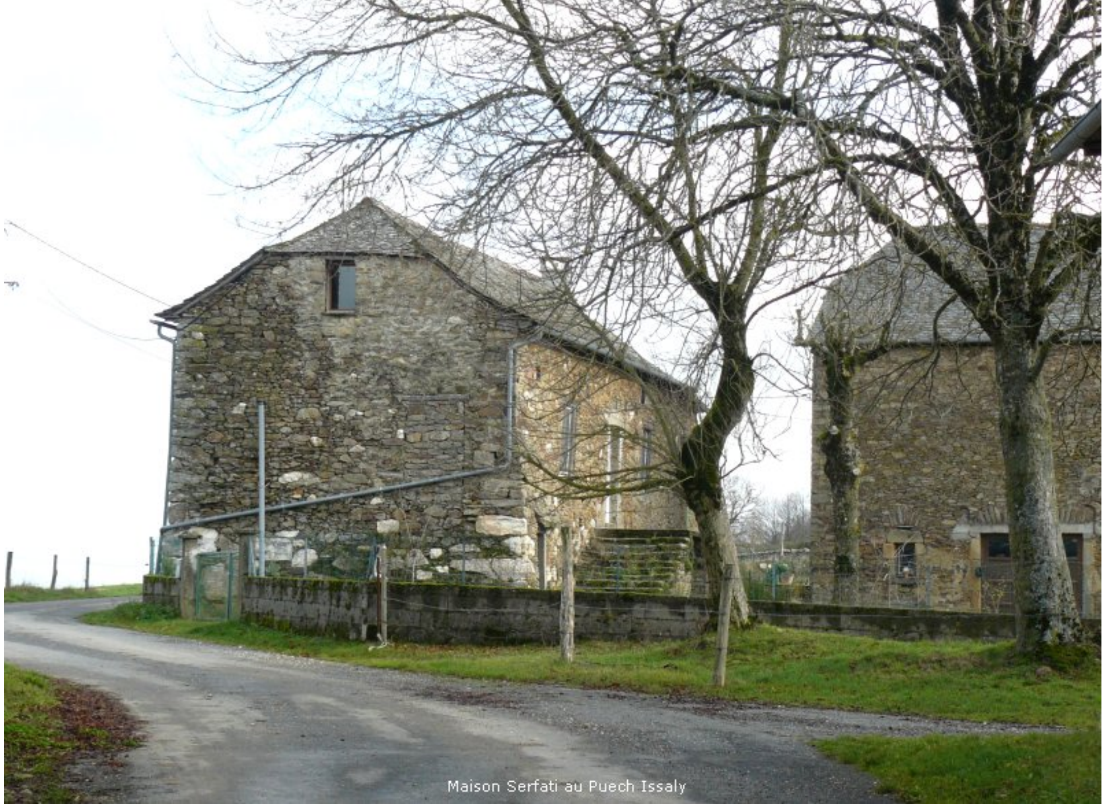
Maison Serfati au Puech Issaly