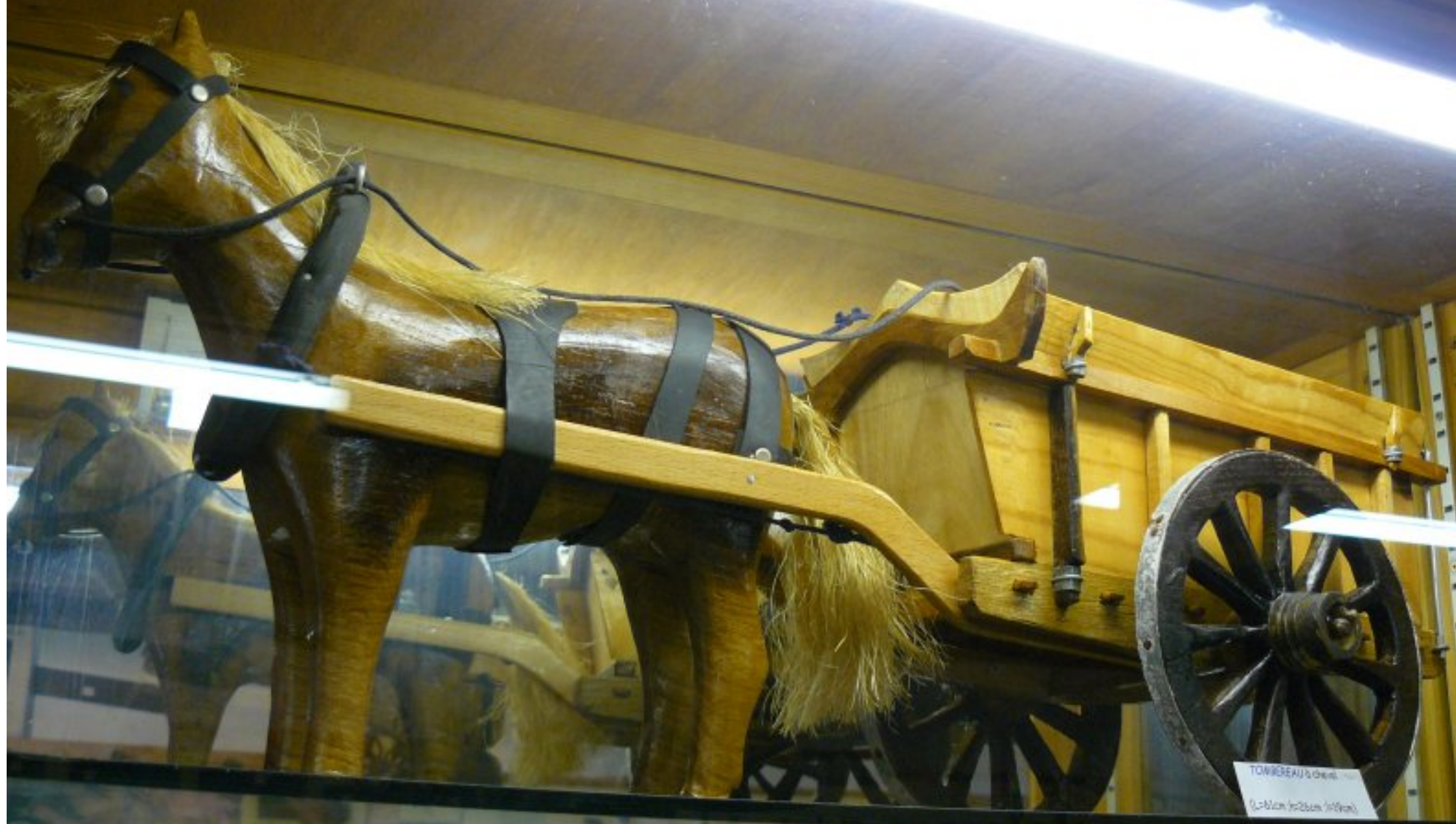
TOMBEAU à cheval (L=1,10m h=2,50m l'âge=1900)