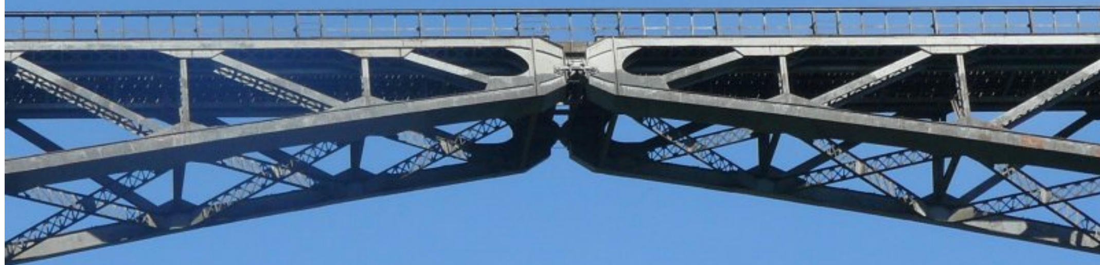
Viaduc ferré du Viaur: liaison Aveyron-Tarn