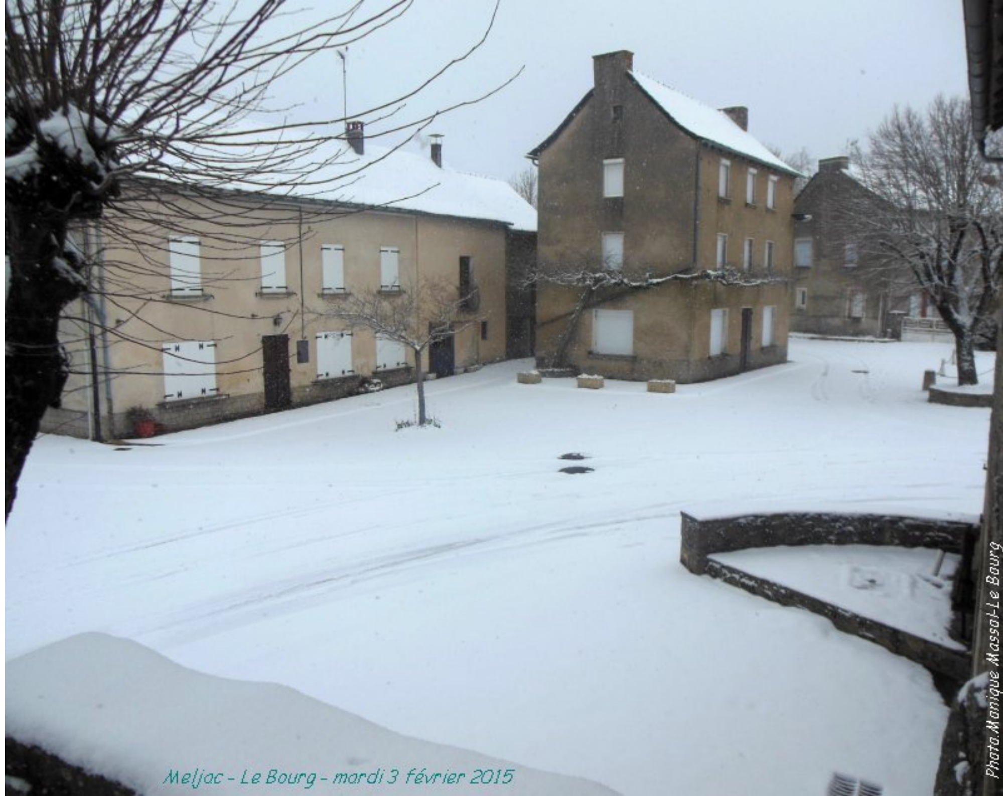
Meljac - Le Bourg - mardi 3 février 2015