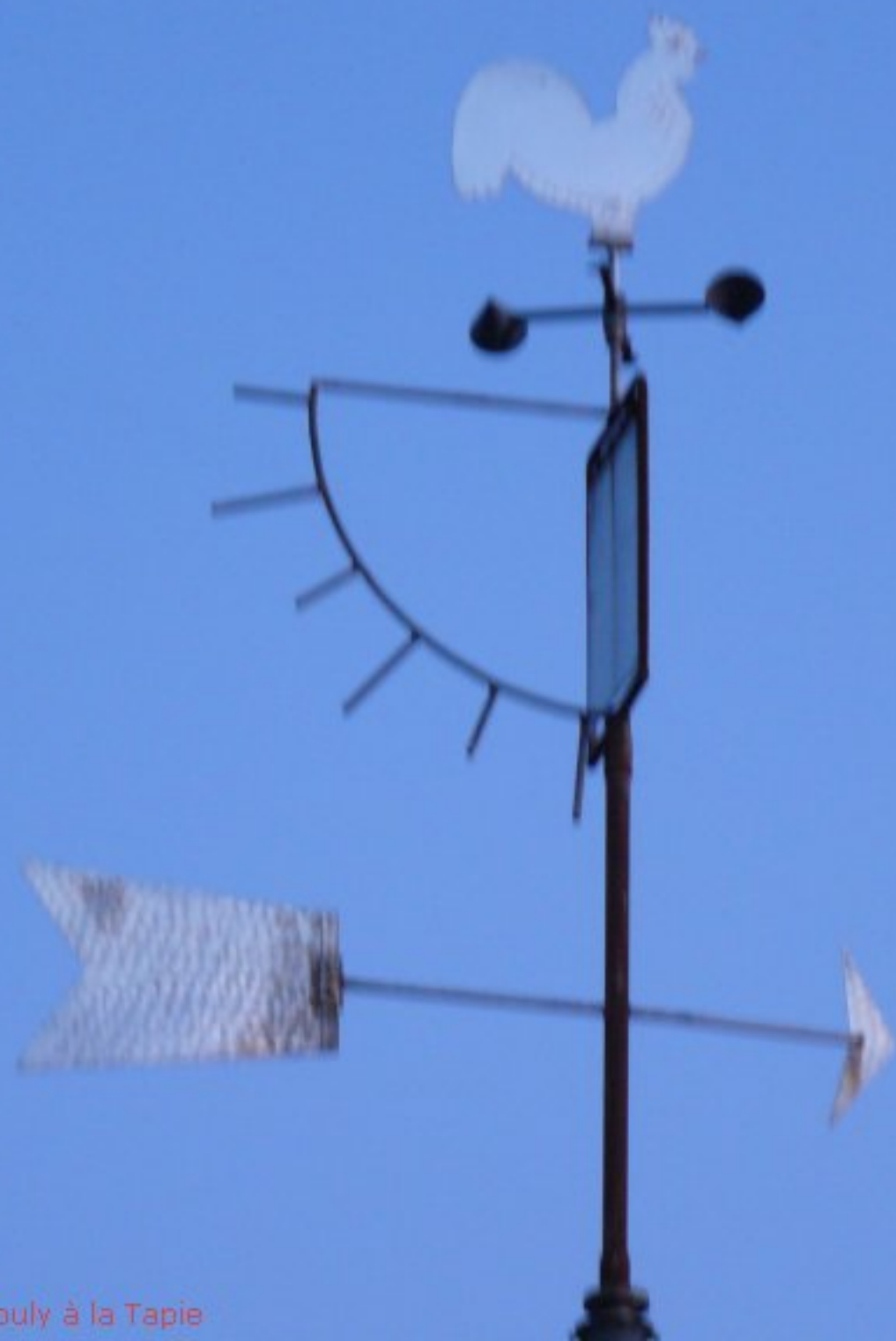
girouette - maison Mouly à la Tapie