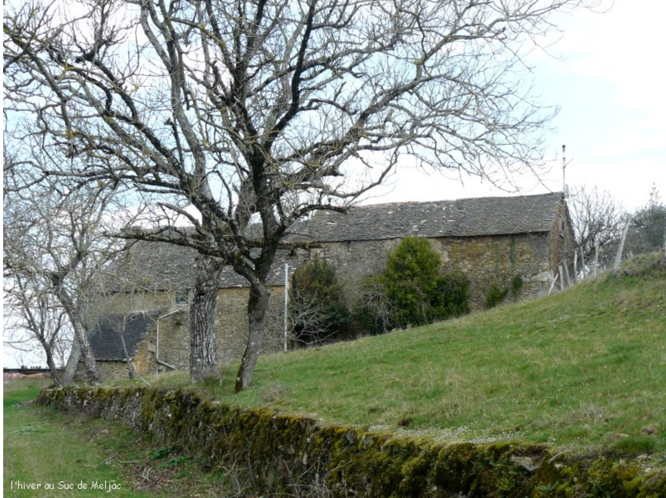
l'hiver au Suc de Meljāc