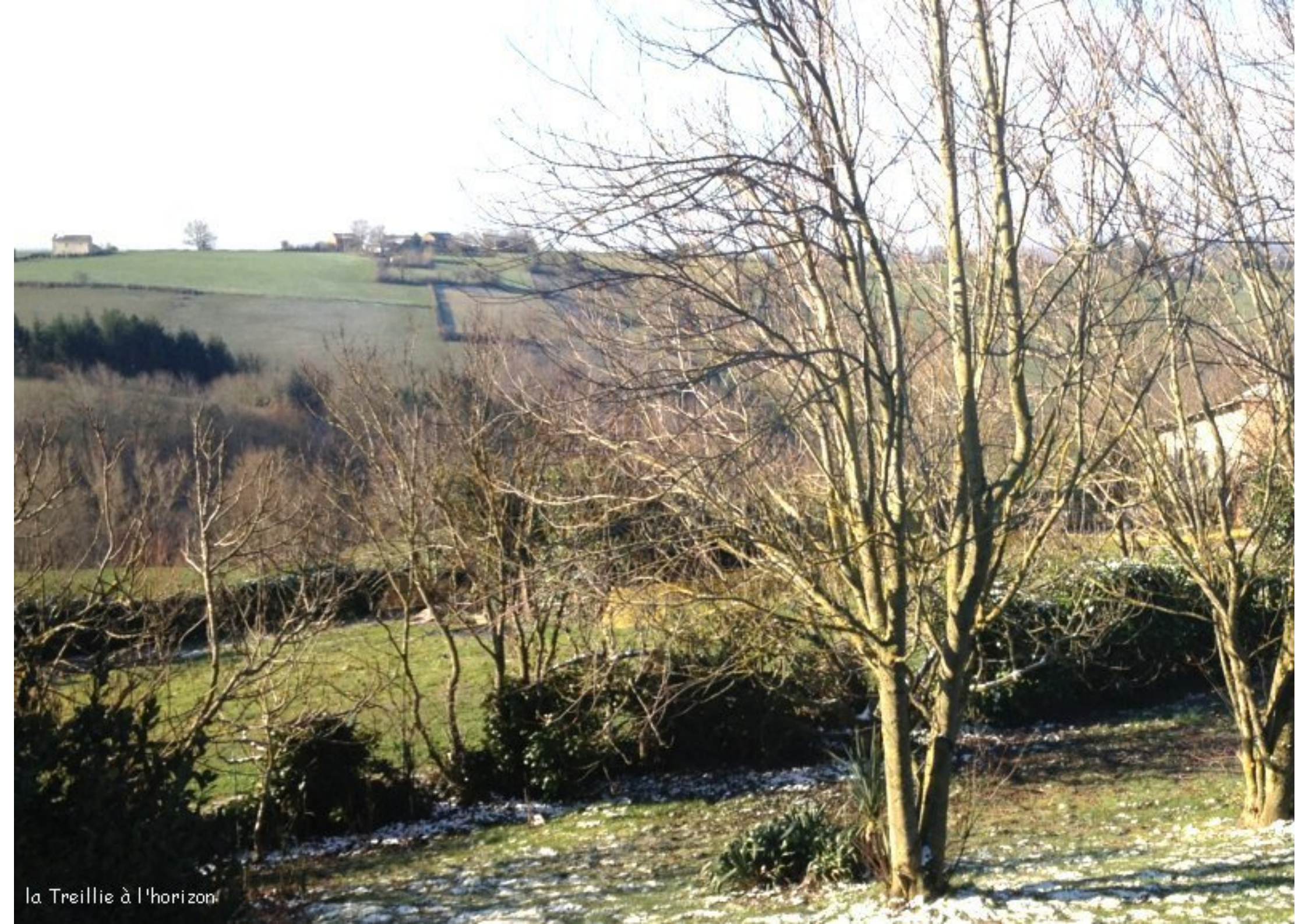
la Treillie à l'horizon