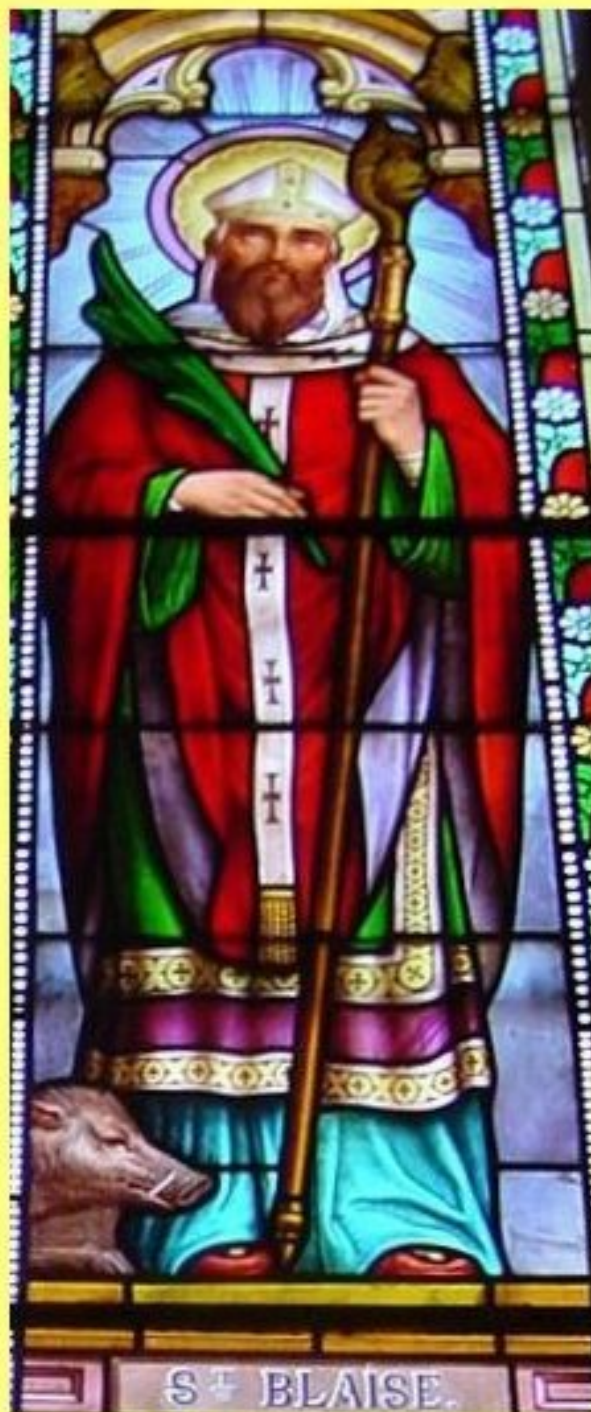
vitrail de l'église de Meljac

Saint Blaise est né et a vécu au 3ème siècle après Jésus-Christ en Arménie dans la ville de Sébaste. Médecin, il fut élu par acclamation, évêque de Sébaste. Il se retira alors sur une montagne nommée Argée, dans une caverne dont il fit sa résidence épiscopale.