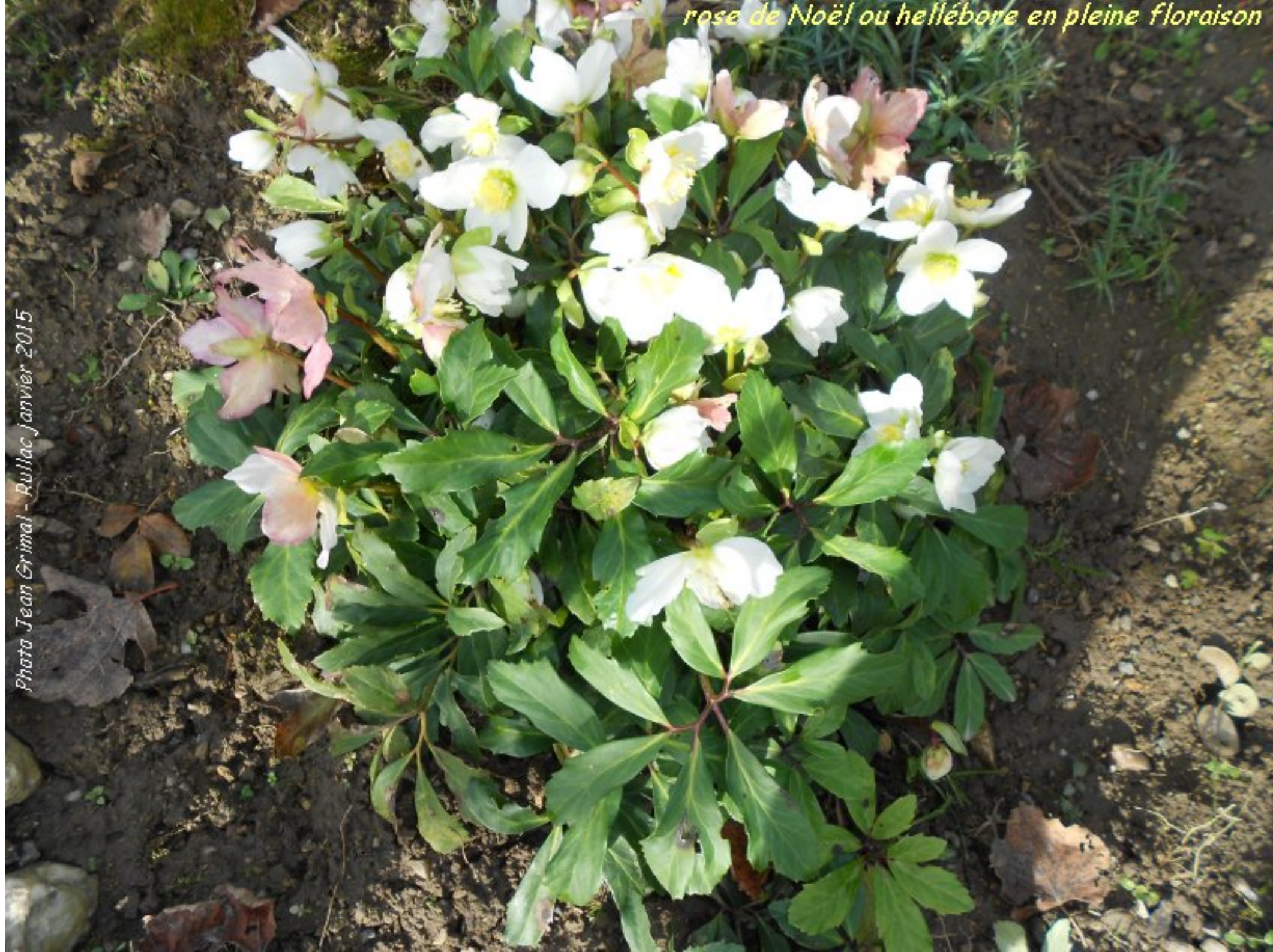
Rullac janvier 2015