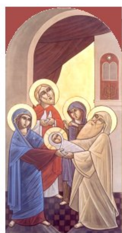
Présentation de Jésus au Temple Fête "des chandelles"