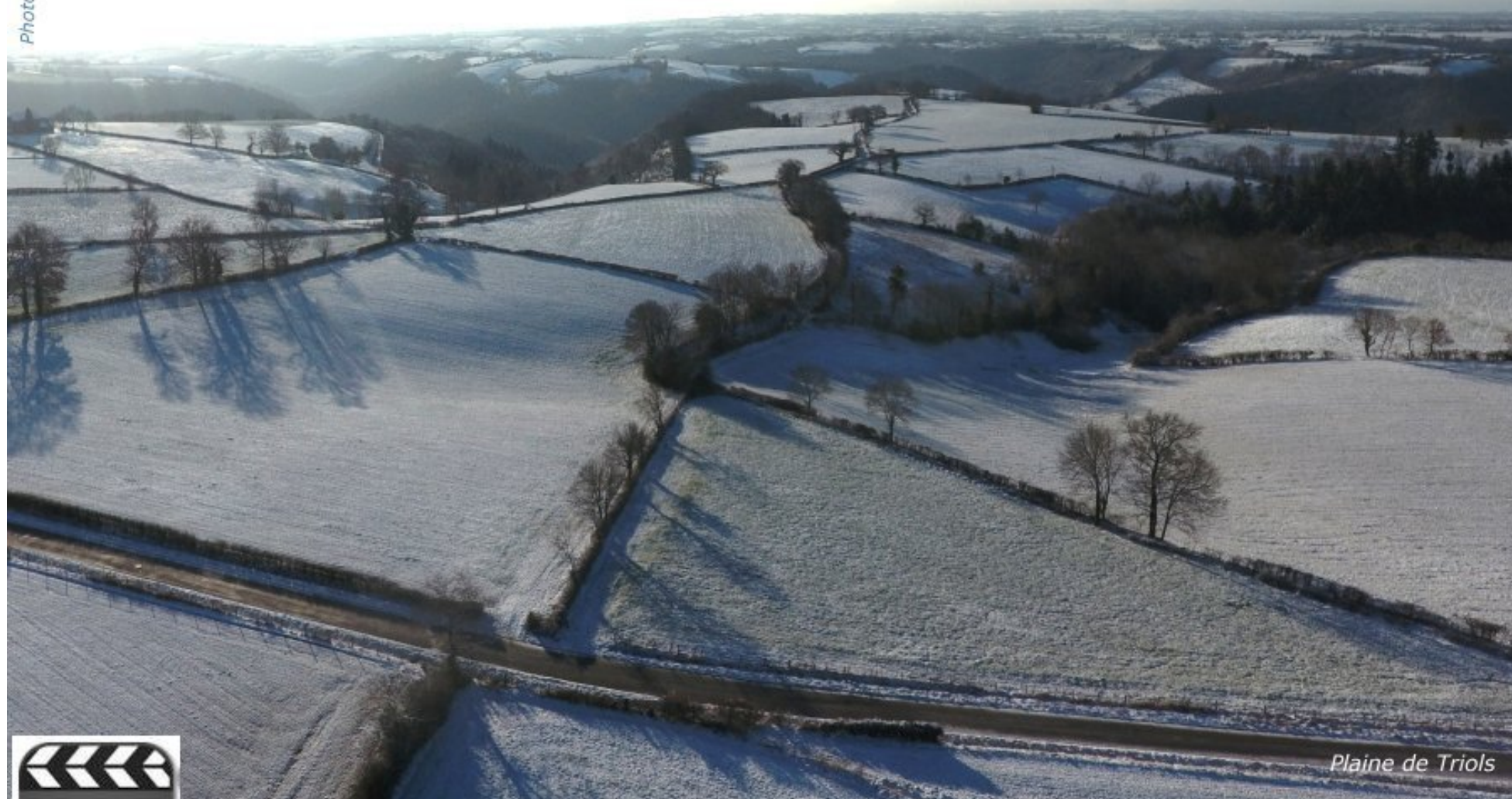
Plaine de Triols