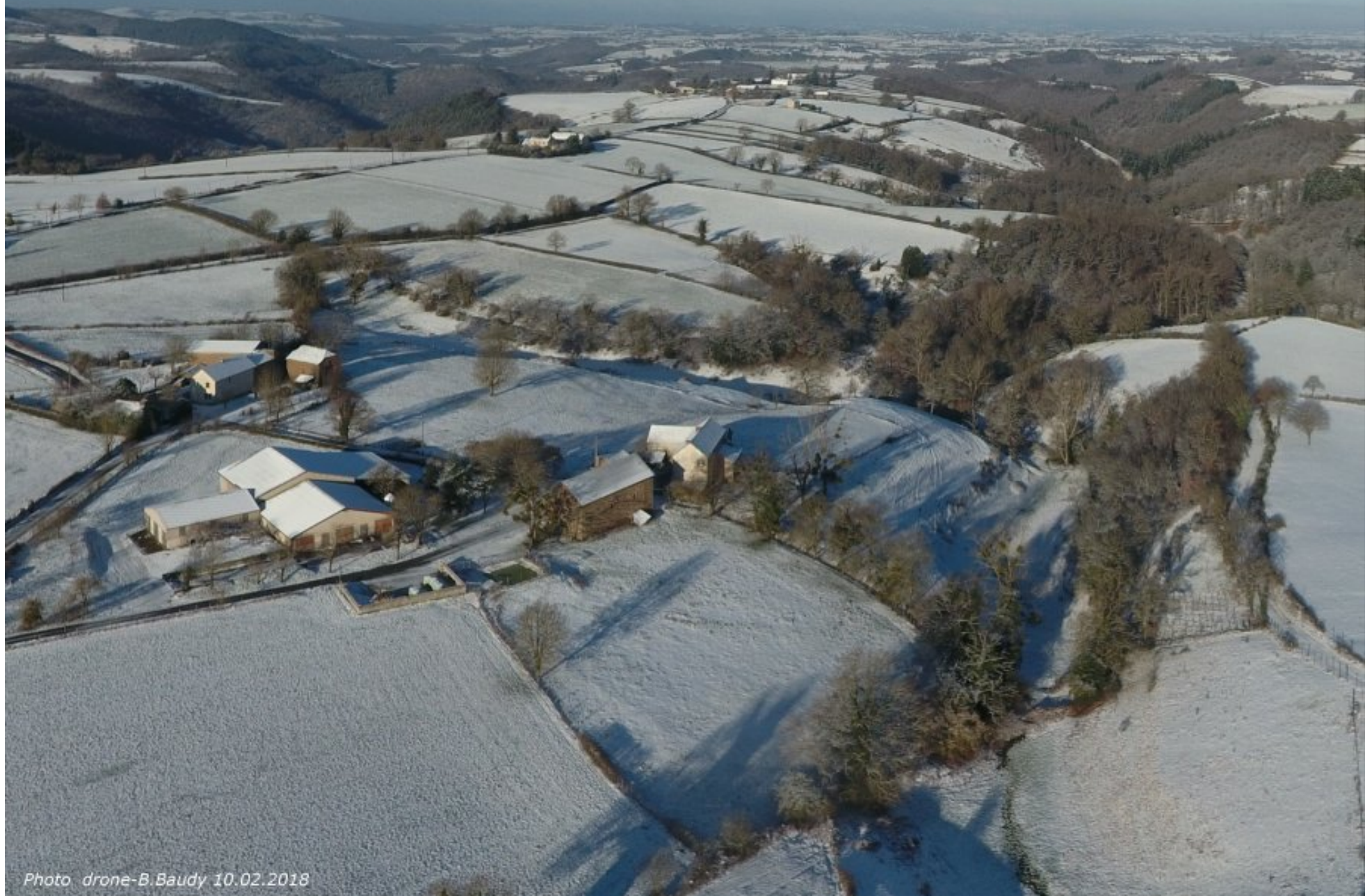
la vallée du Gintou au centre droit avec à gauche la ferme Flottes de la Tourénie et à l'arrière, le lieu dit Gintou et la Treillie