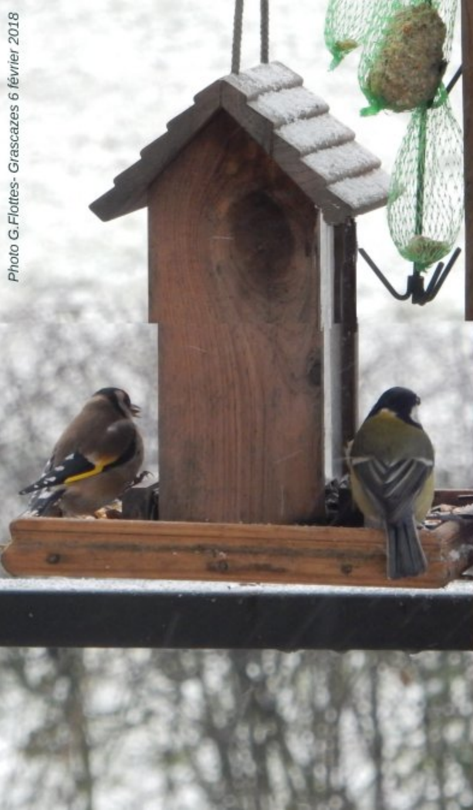
6 février 2018

Pas facile de prendre des oiseaux en photos