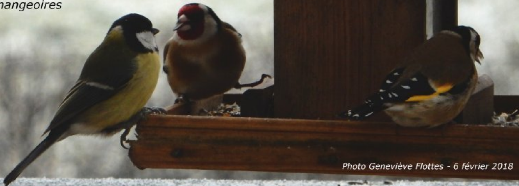
6 février 2018

Avec ce temps hivernal chardonnerets et mésanges s'invitent aux mangeoires