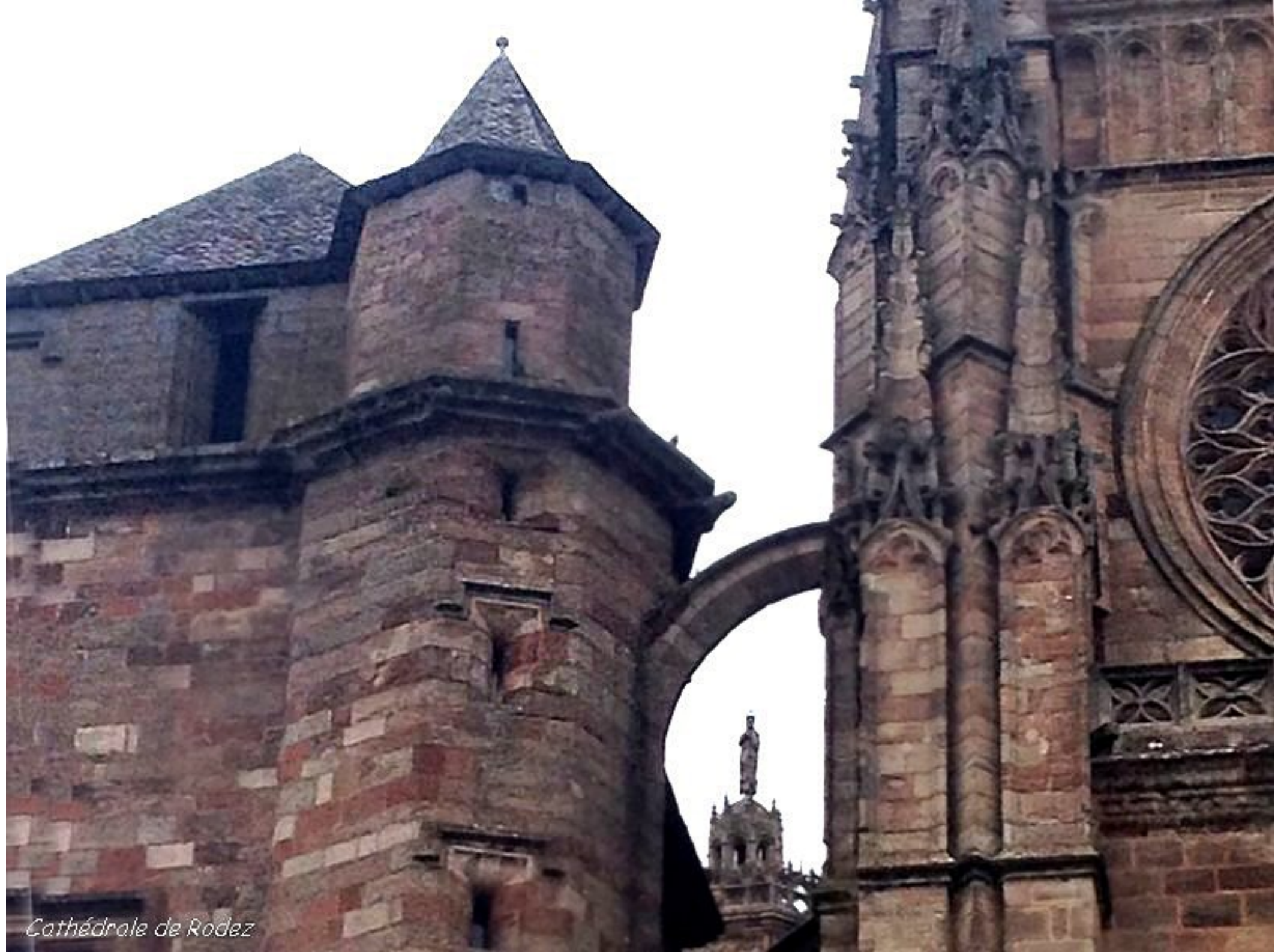
Cathédrale de Rodez