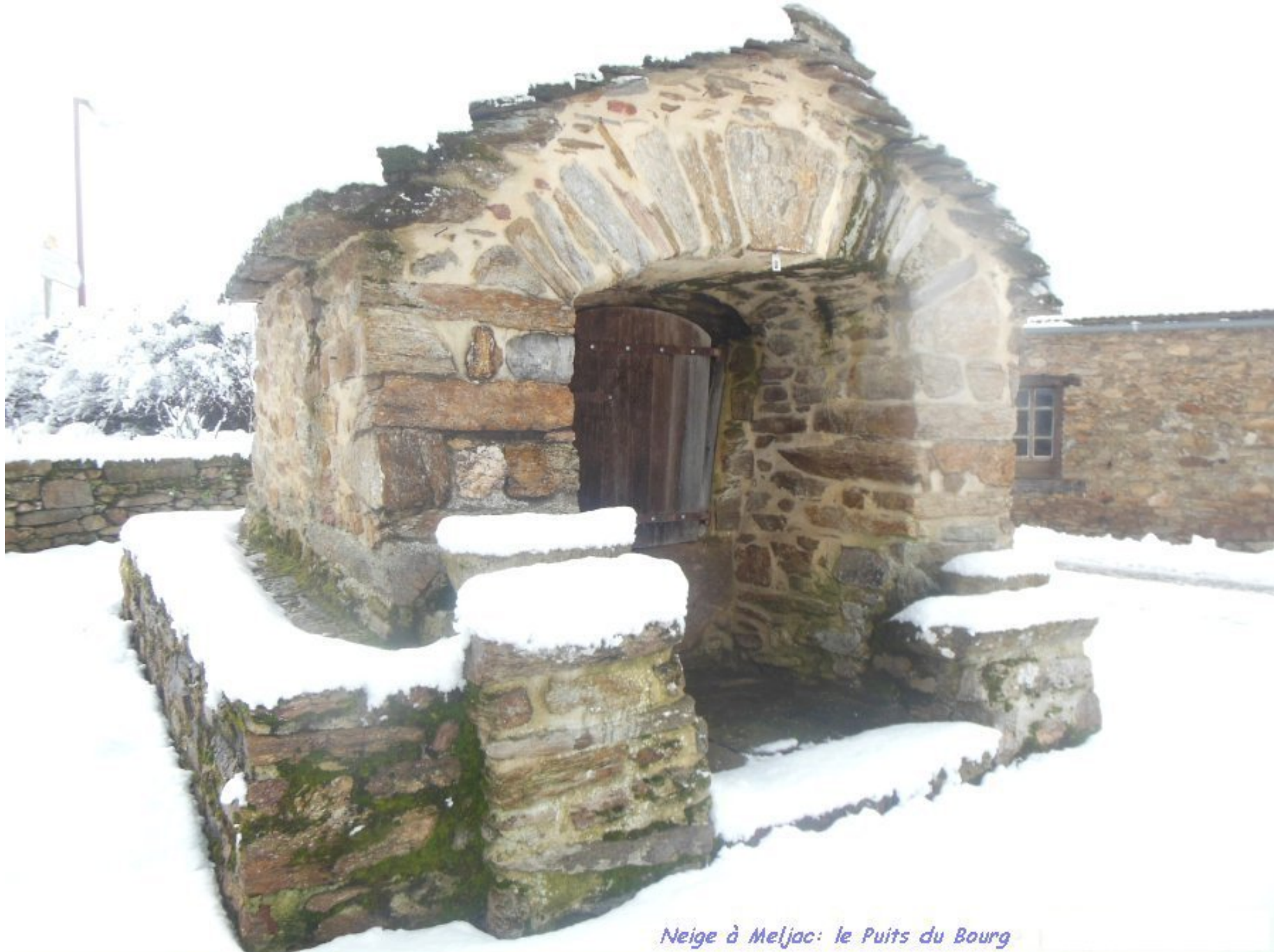
Neige à Meljac: le Puits du Bourg

Voir dans PHOTOS 2019 la galerie "MELJAC EN NEIGE" du lundi 28 janvier 2019