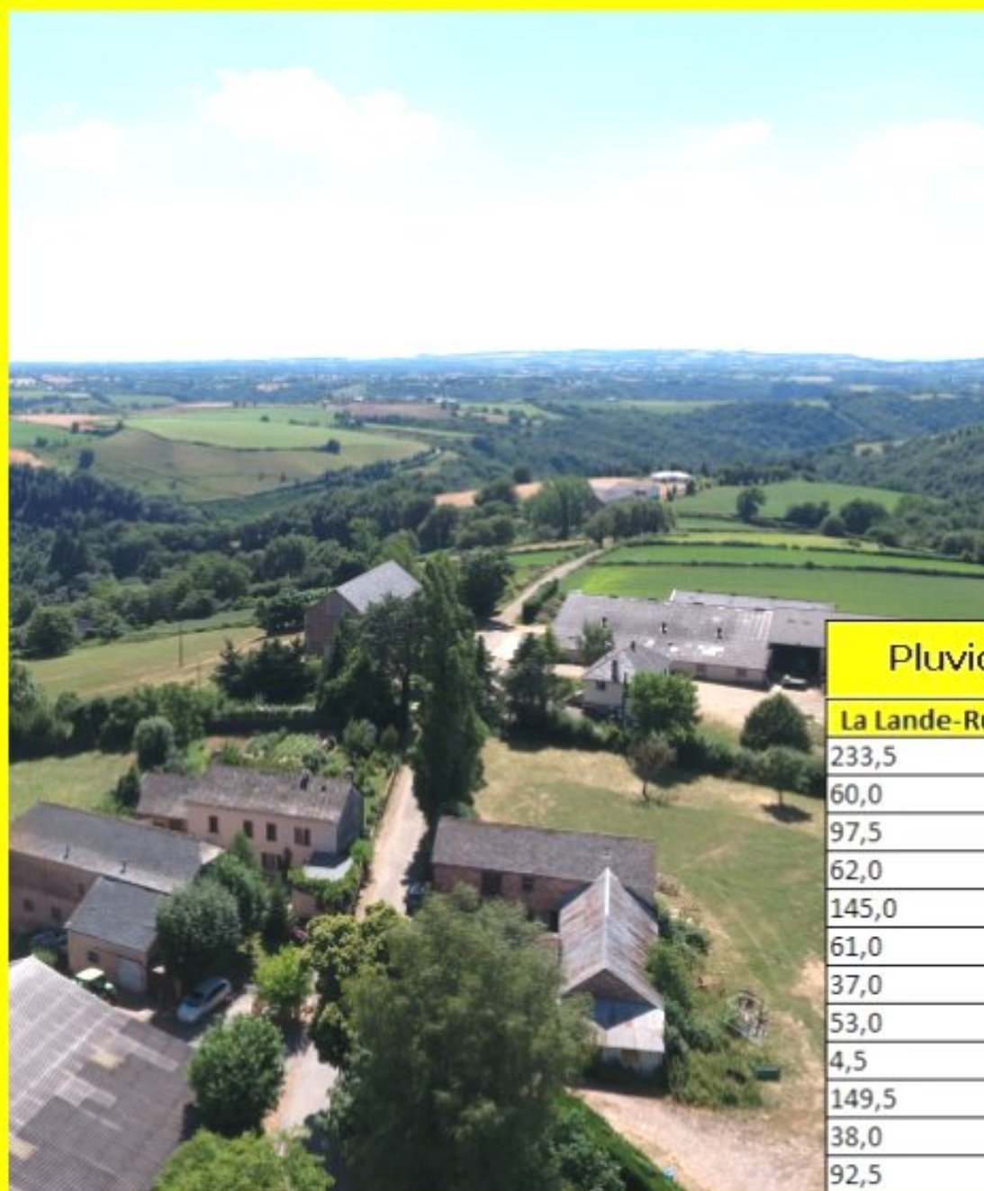
La Lande de Rullac