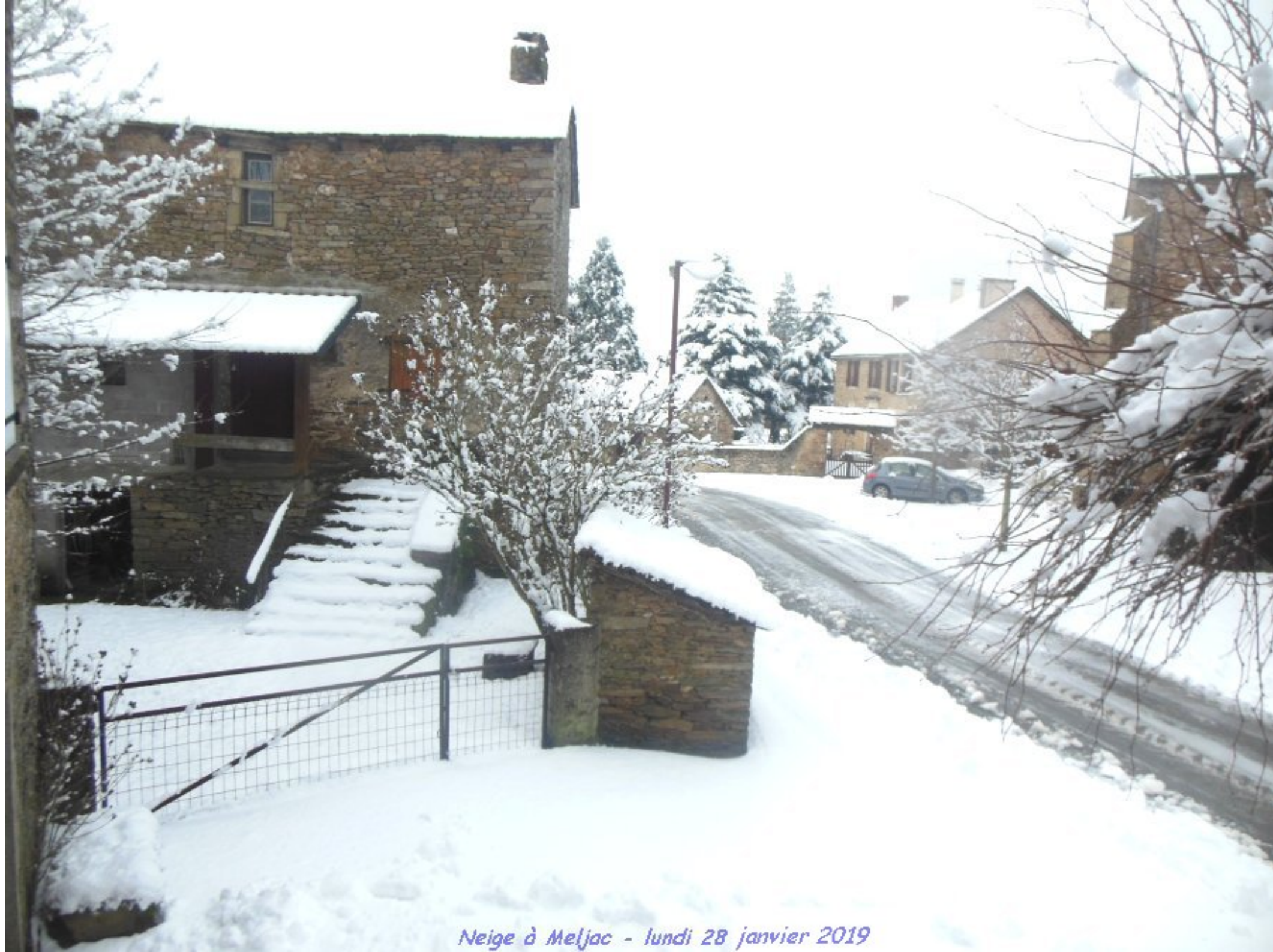
Neige à Meljac - lundi 28 janvier 2019