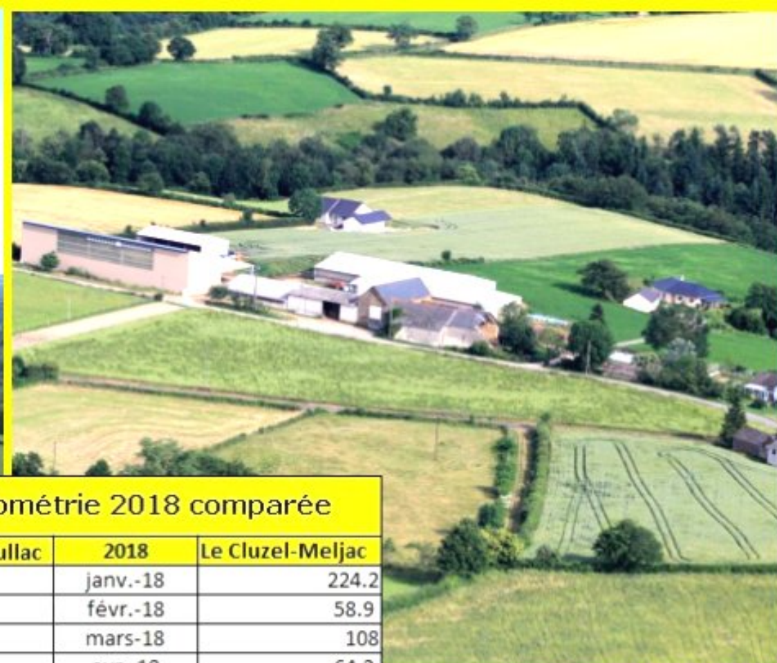
Le Cluzel de Meljac