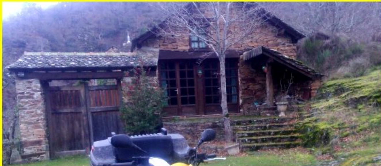
La Bastide de Meljac - 10 février 2019