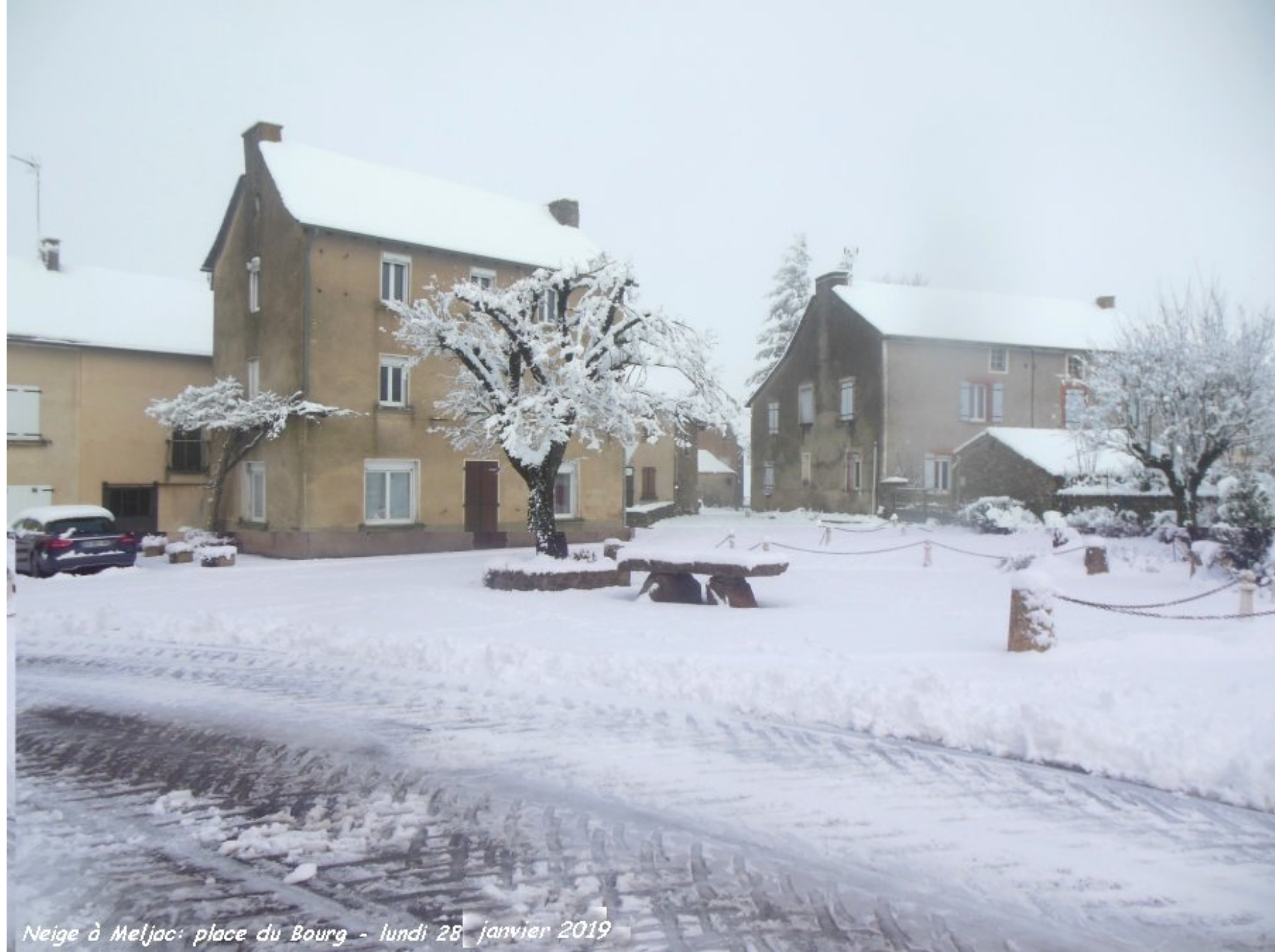
Neige à Meljac: place du Bourg - lundi 28 janvier 2019