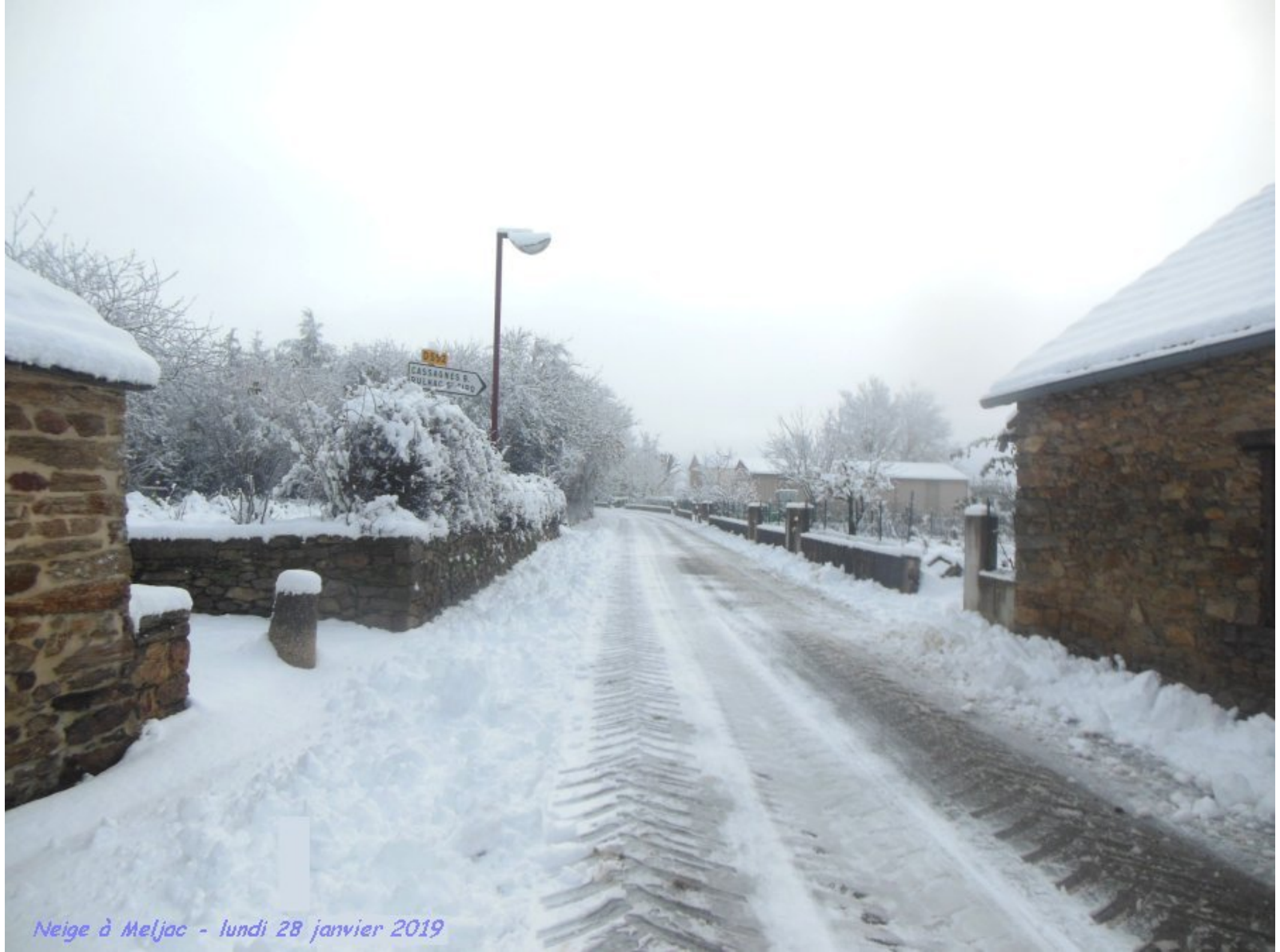
Neige à Meljac - lundi 28 janvier 2019