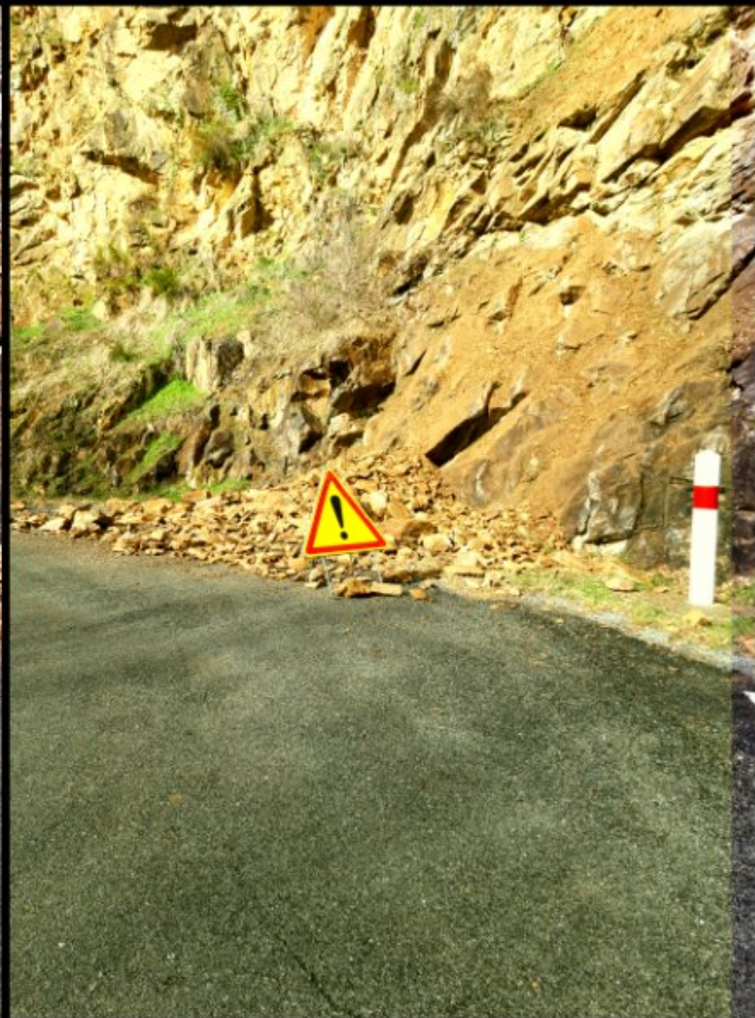
Important éboulement du rocher qui borde la D592 (route de Meljac à Naucelle) à Lestréaldie de Centrès après le pont qui traverse le Céor au croisement du chemin de La Coste.

Lundi 11 février 2019