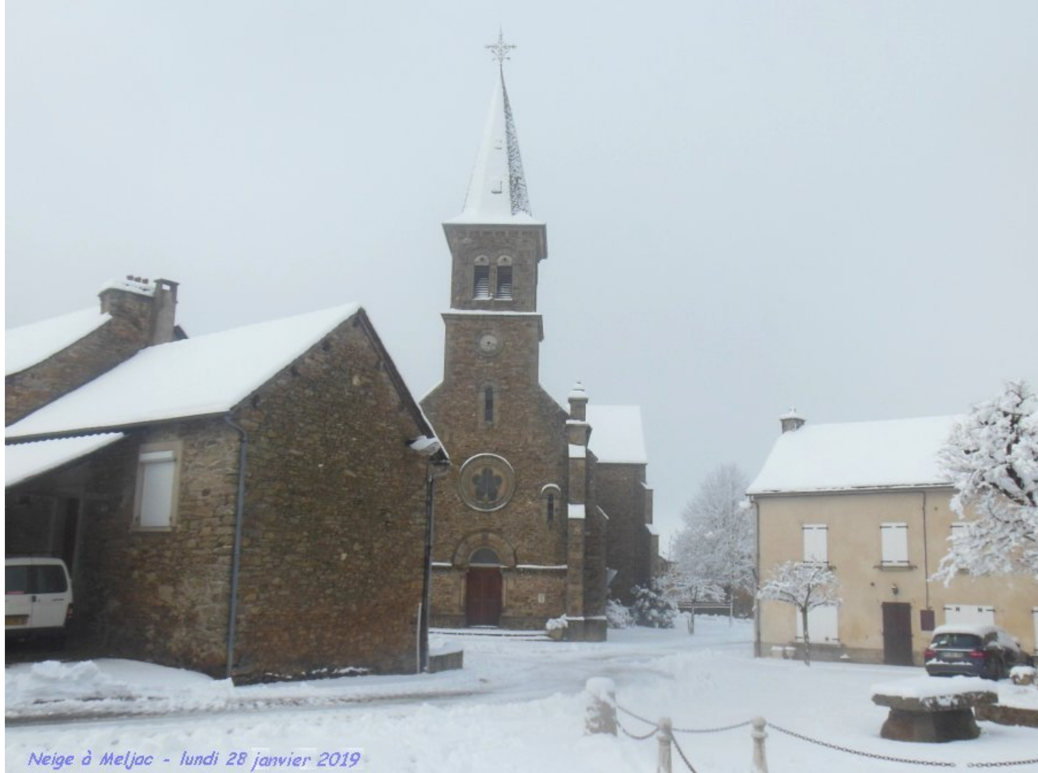
Neige à Meljac - lundi 28 janvier 2019