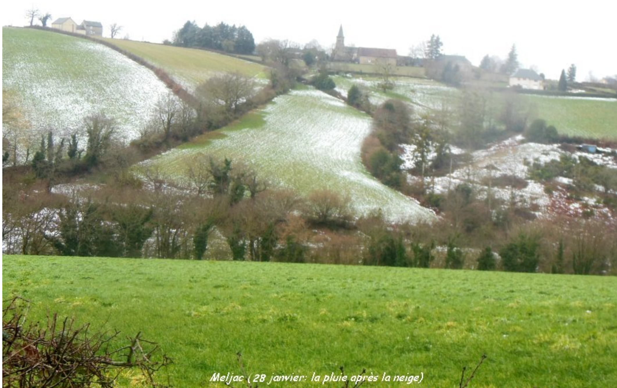
Meljac (28 janvier: la pluie après la neige)