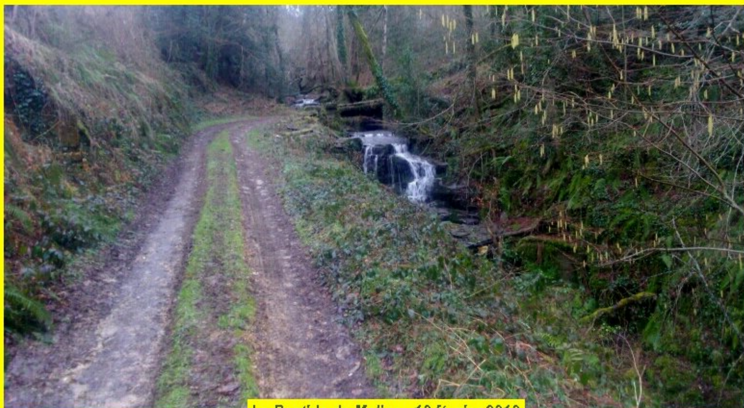
La Bastide de Meljac - 10 février 2019