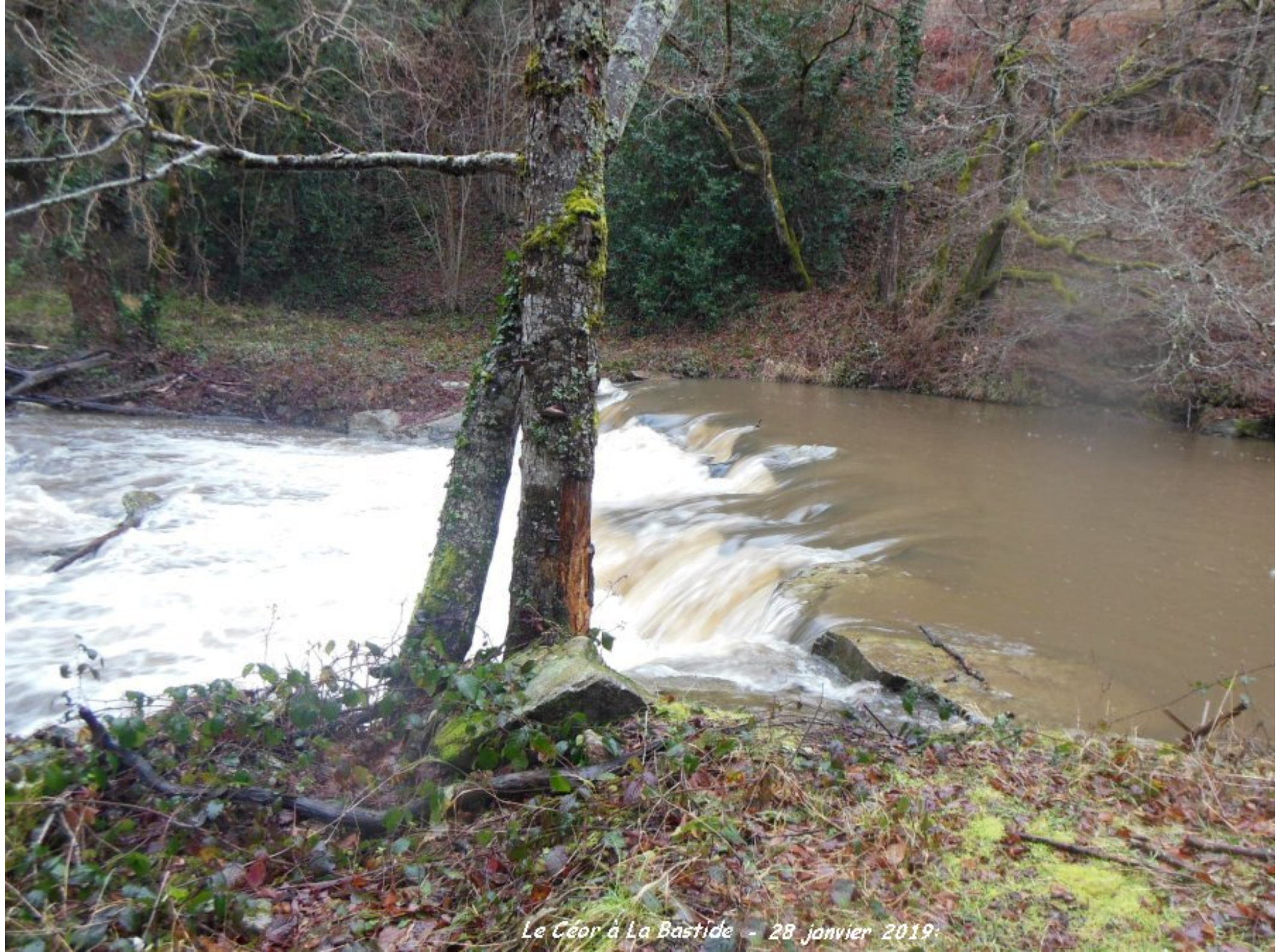
Le Céor à La Bastide - 28 janvier 2019.