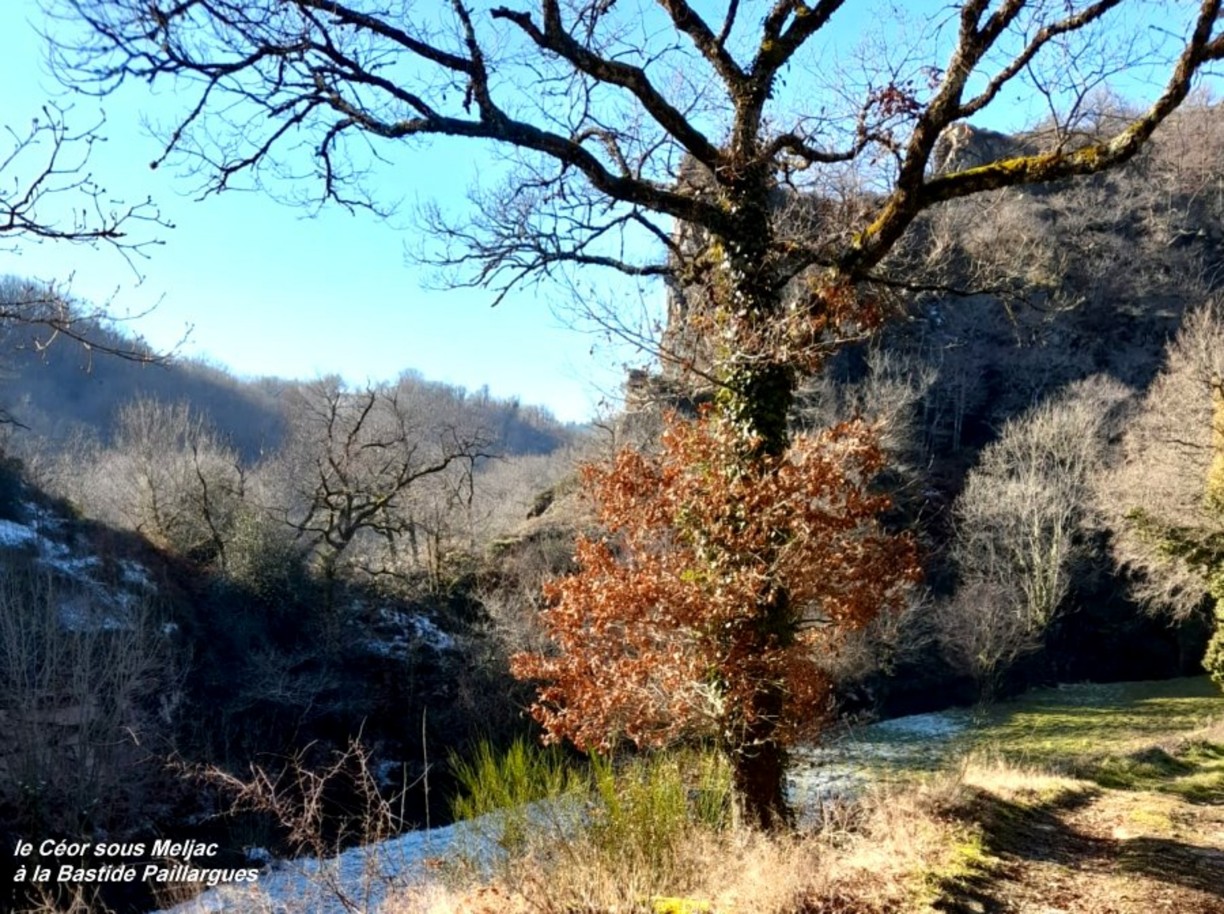
le Céor sous Meljac à la Bastide Paillargues