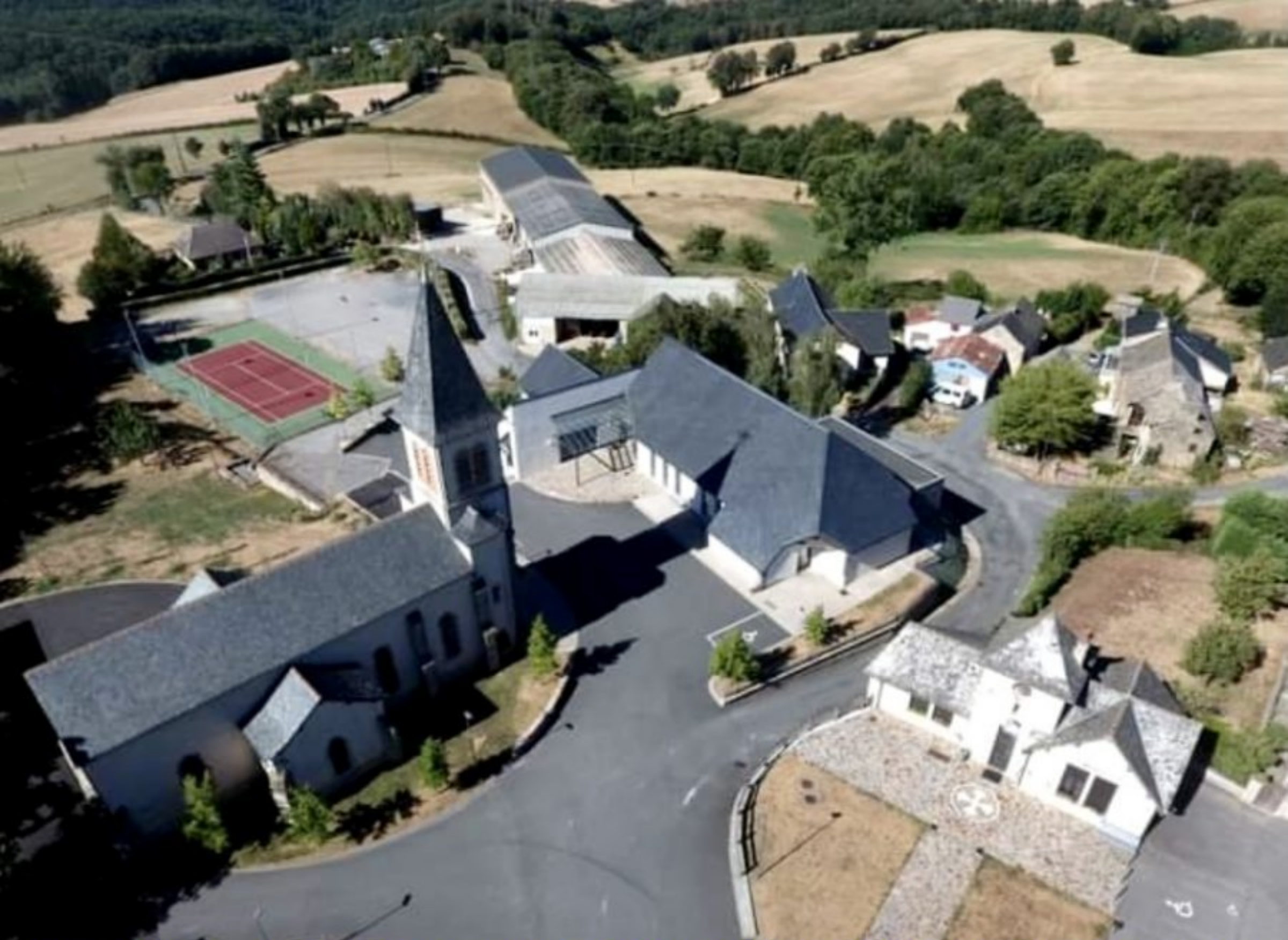
RULLAC 20 Février 2022 à 14h - SUPERQUINE DES INFATIGABLES - salle polyvalente