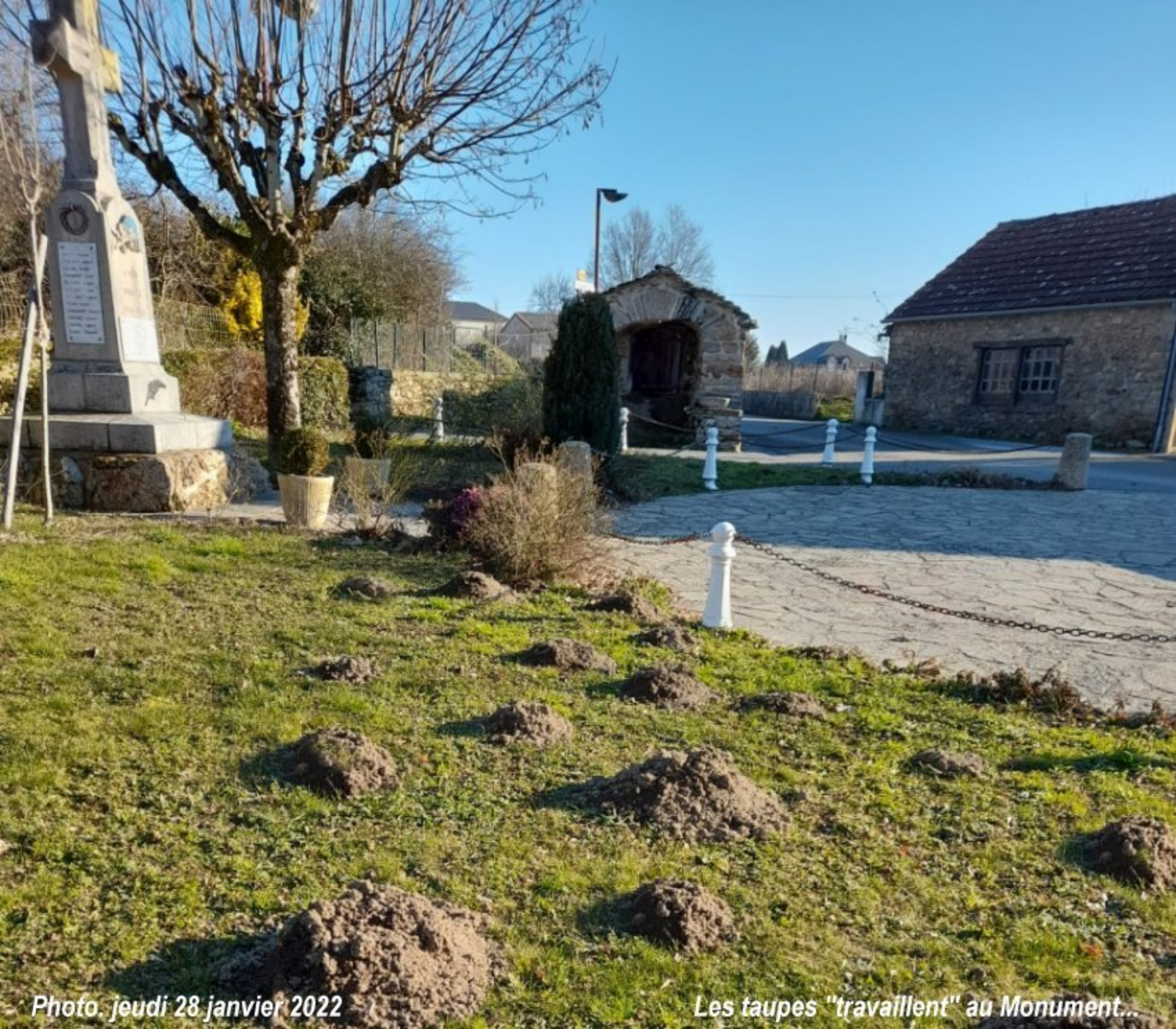
Photo. jeudi 28 janvier 2022