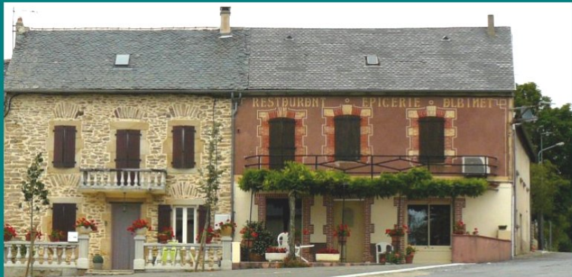
Rullac - La place du village - Le restaurant-épicerie Albinet (Photos 2016 / 2011)