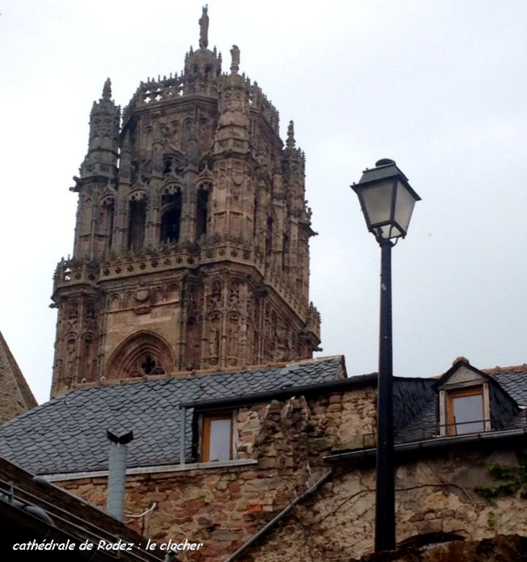
cathédrale de Rodez : le clocher