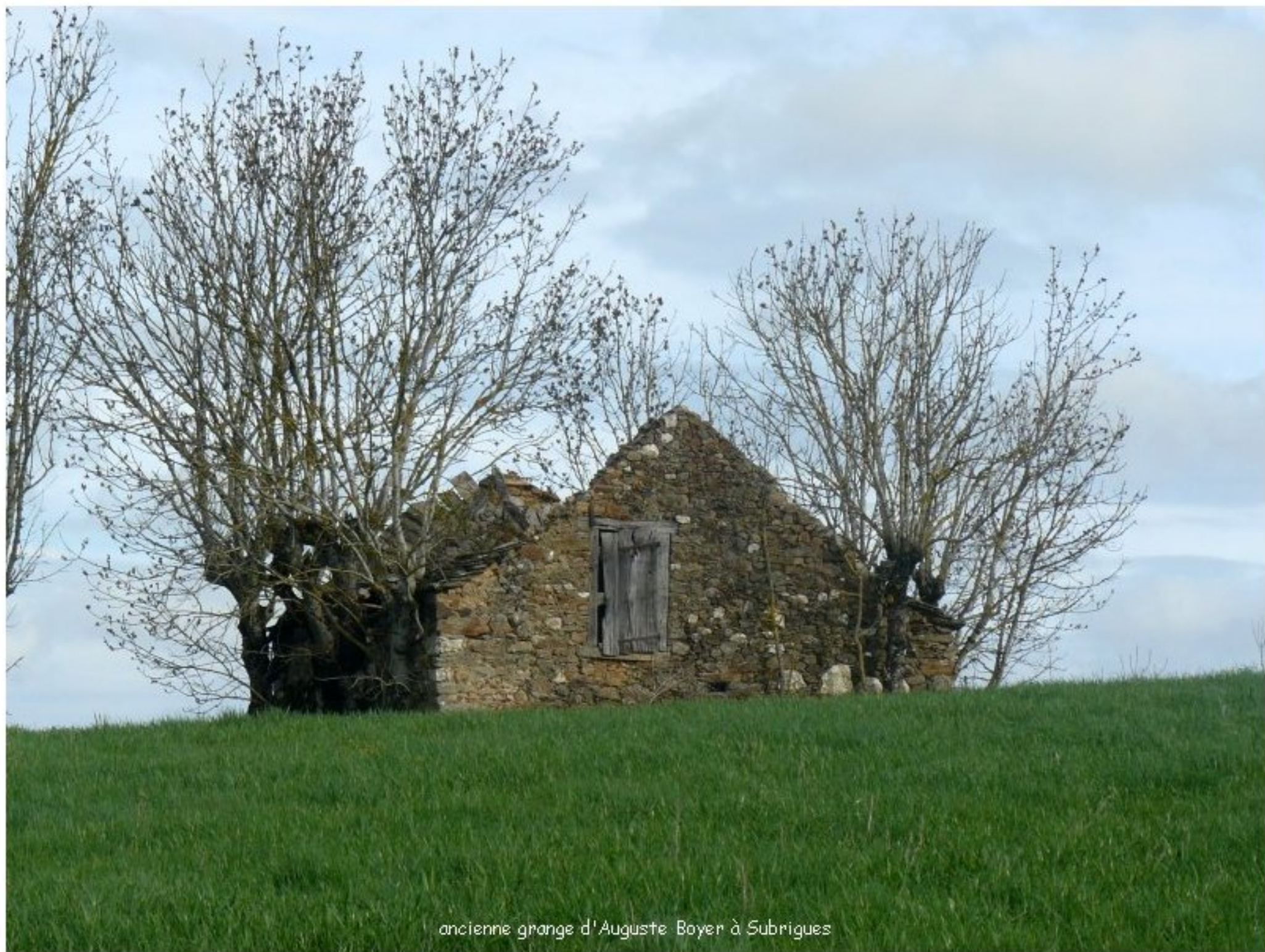
ancienne grange d'Auguste Boyer à Subrigues