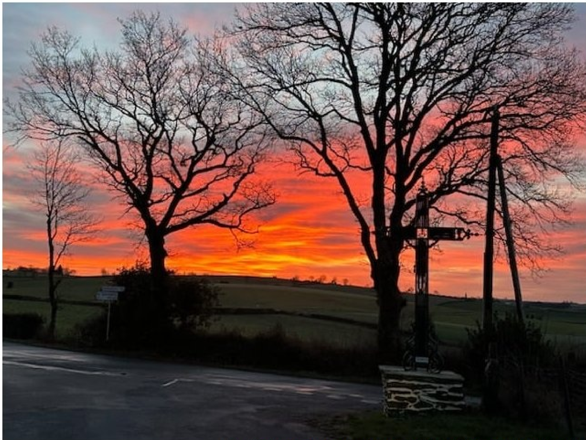
La Croix de l'Homme Mort - Rullac 13 février 2024 à 18h