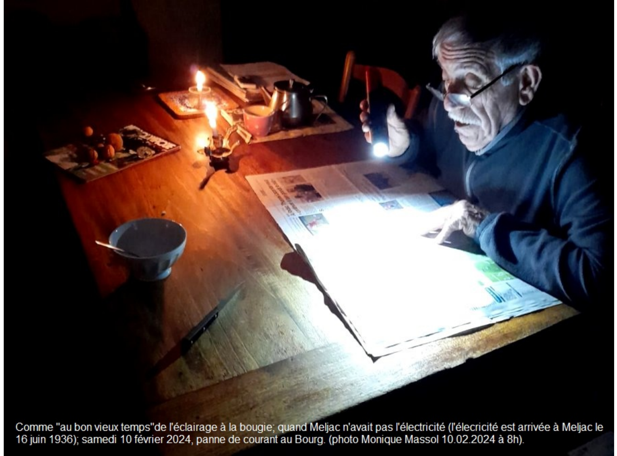
Comme "au bon vieux temps" de l'éclairage à la bougie; quand Meljac n'avait pas l'électricité (l'électricité est arrivée à Meljac le 16 juin 1936); samedi 10 février 2024, panne de courant au Bourg.