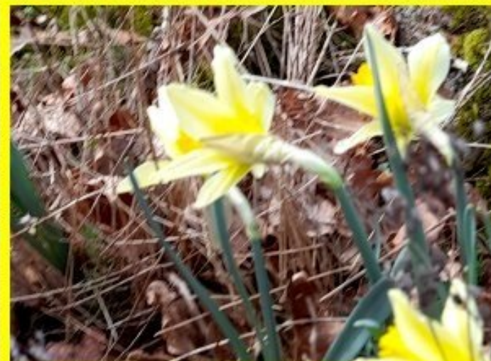
Un champ de jonquilles sous Meljac jusqu'à La Bastide - Photo M & A Massol - Jeudi 15 février 2024