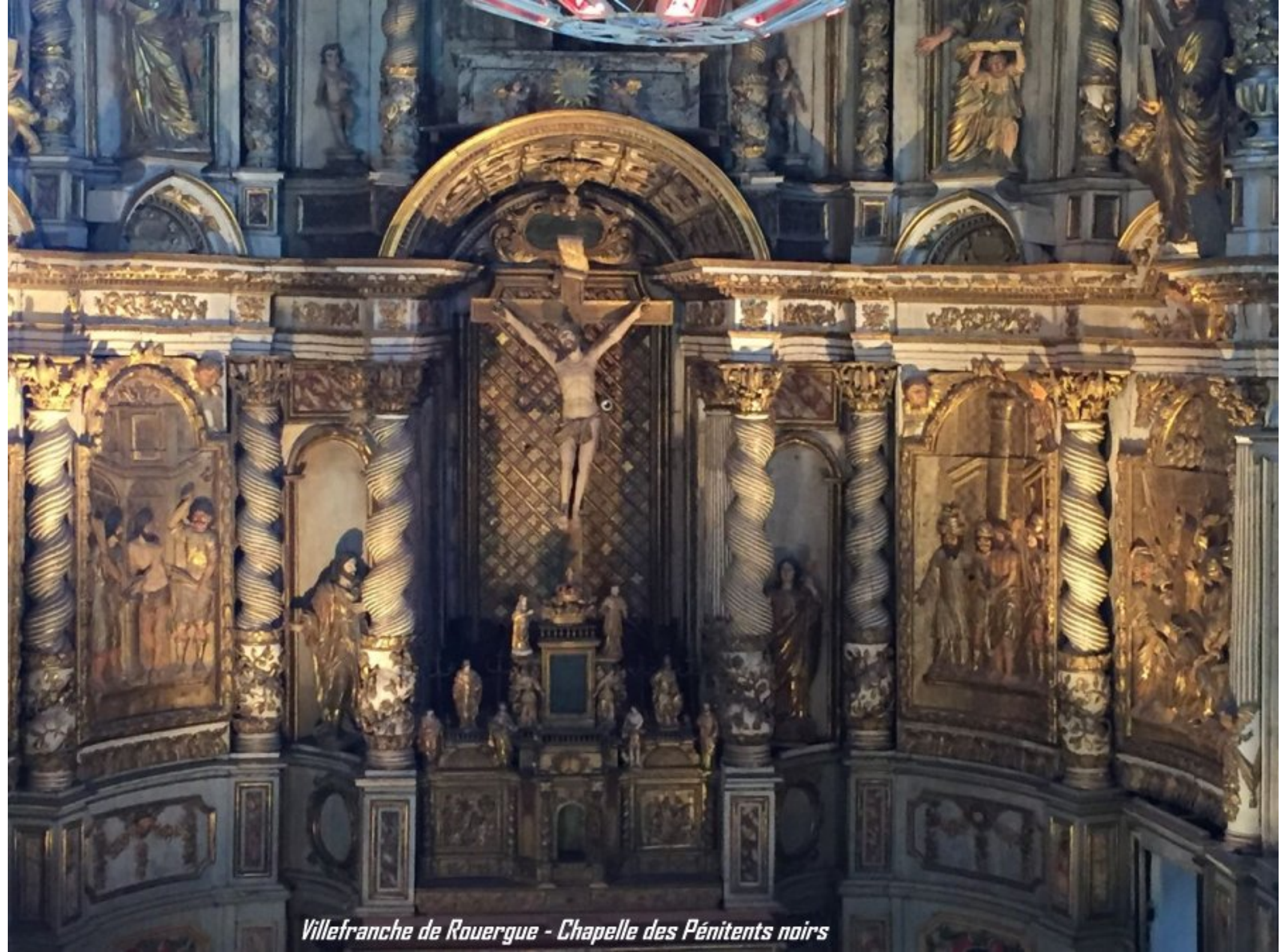
Villefranche de Rouergue - Chapelle des Pénitents noirs