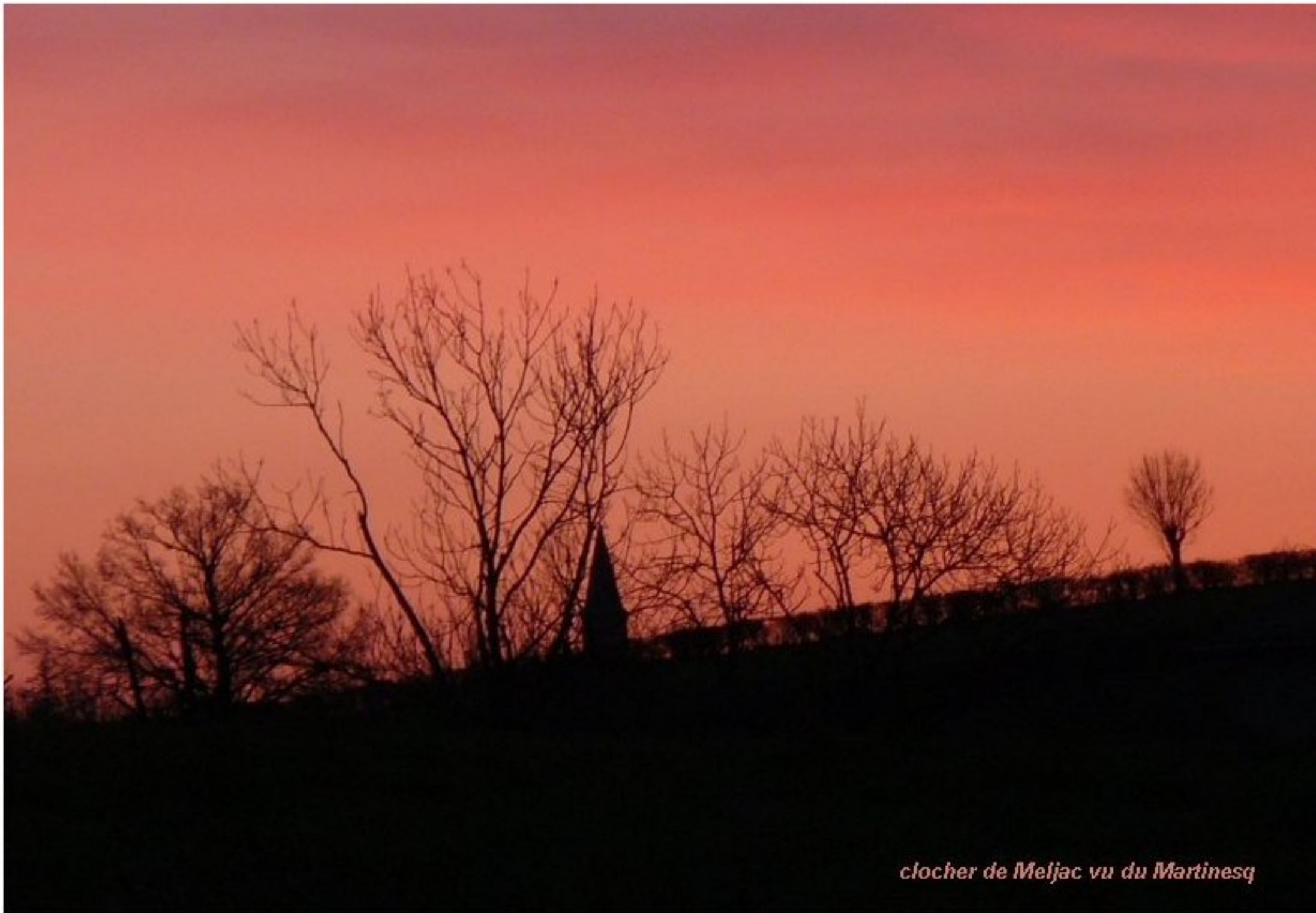
clocher de Meljac vu du Martinesq