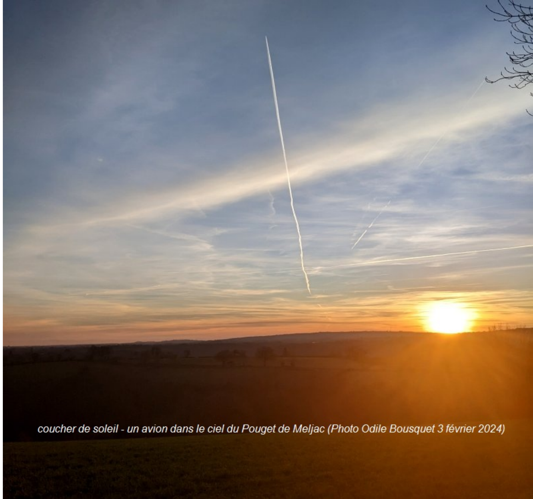
coucher de soleil - un avion dans le ciel du Pouget de Meljac (Photo Odile Bousquet 3 février 2024)