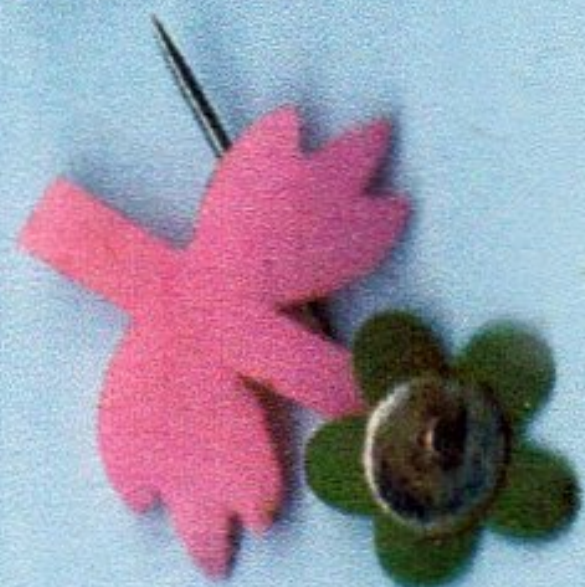
Les cocardes de la fête de St Blaise d ' autrefois