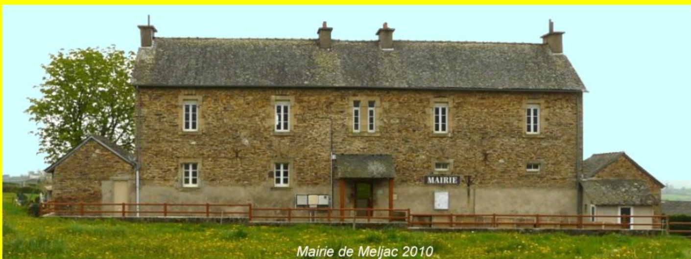
Mairie de Meljac 2010