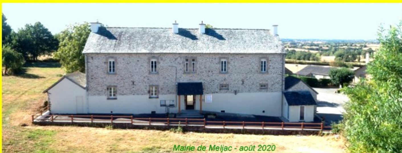
Mairie de Meljac - août 2020