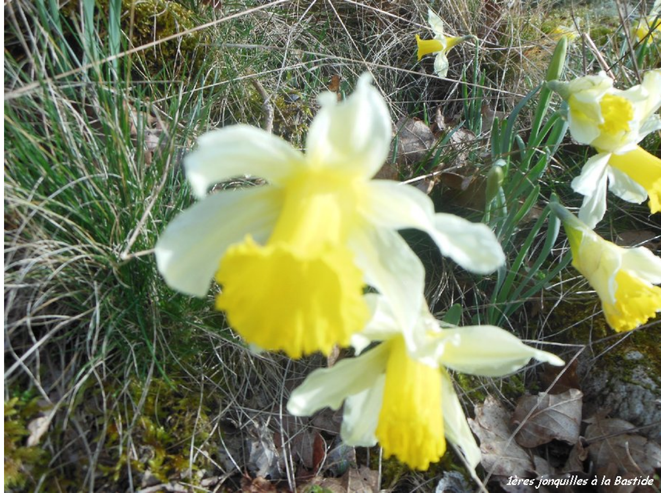
1ères jonquilles à la Bastide