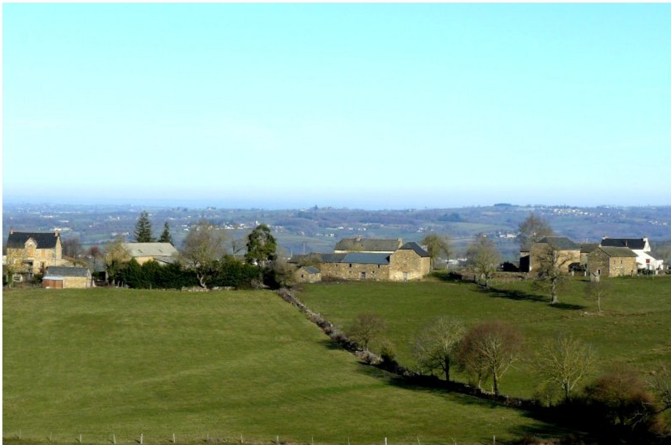
Le Puech Issaly vu du Mas Ricard