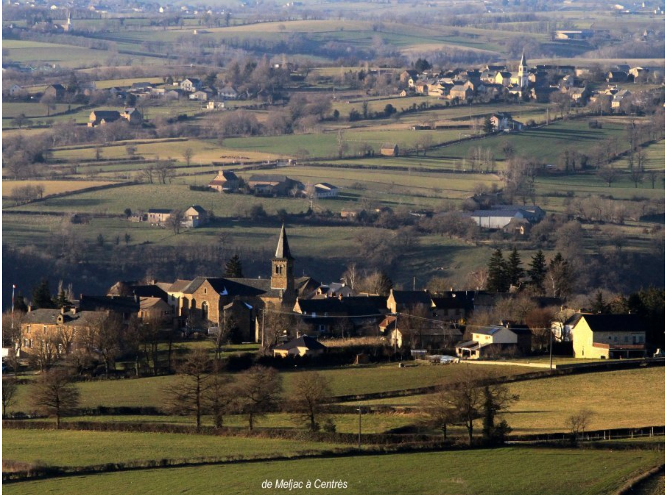
de Meljac à Centrès