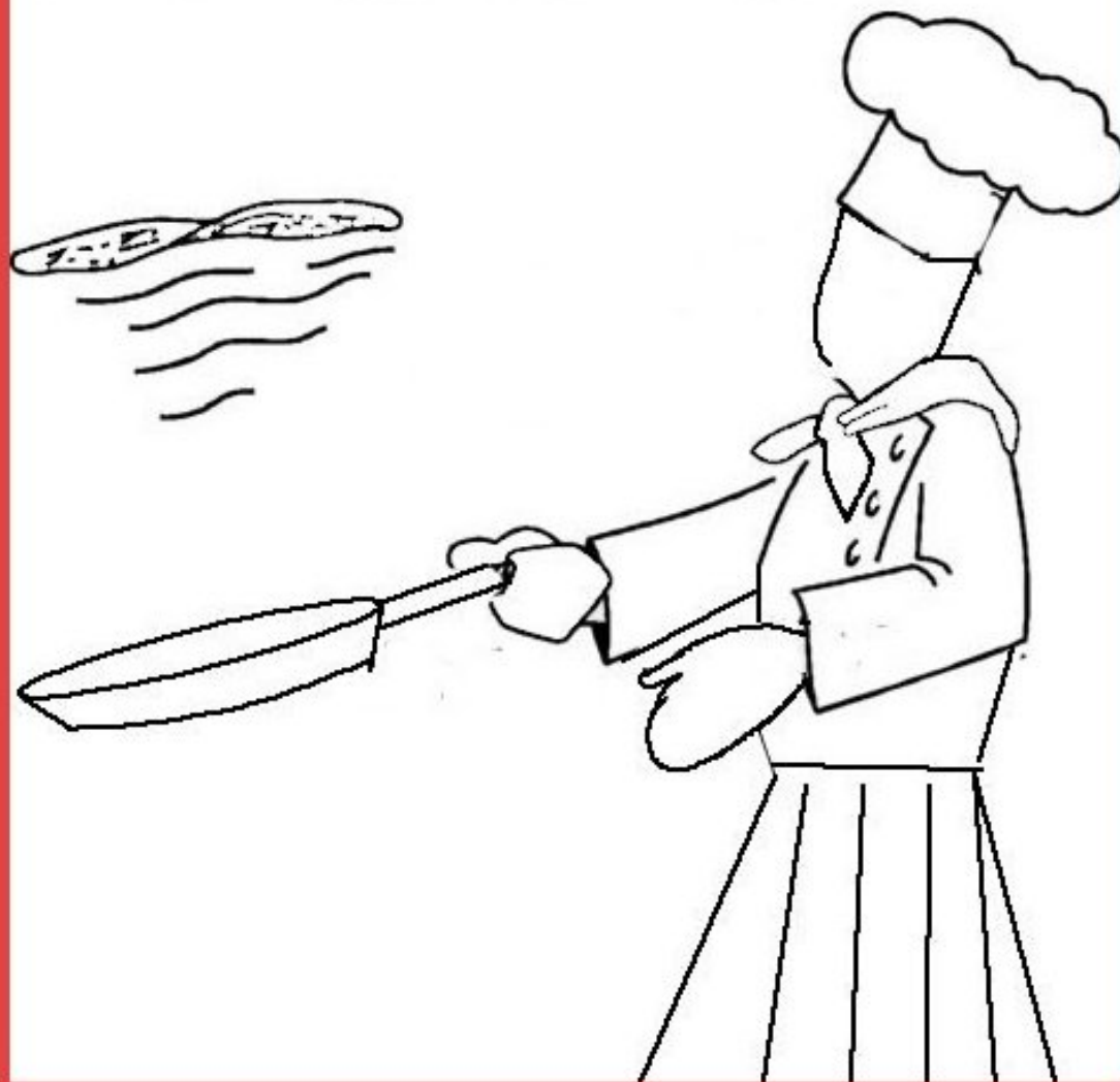
Fête traditionnelle de la chandeleur

Manger des crêpes à la chandeleur apporte un an de bonheur