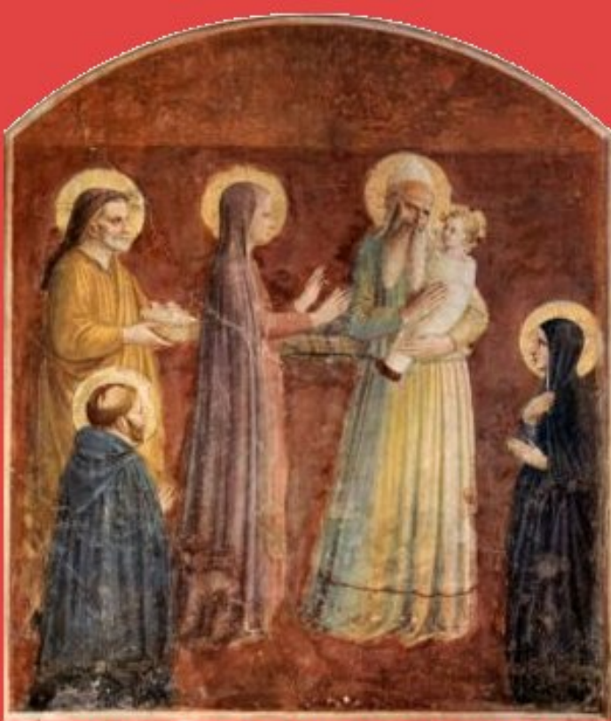
Présentation de Jésus au Temple