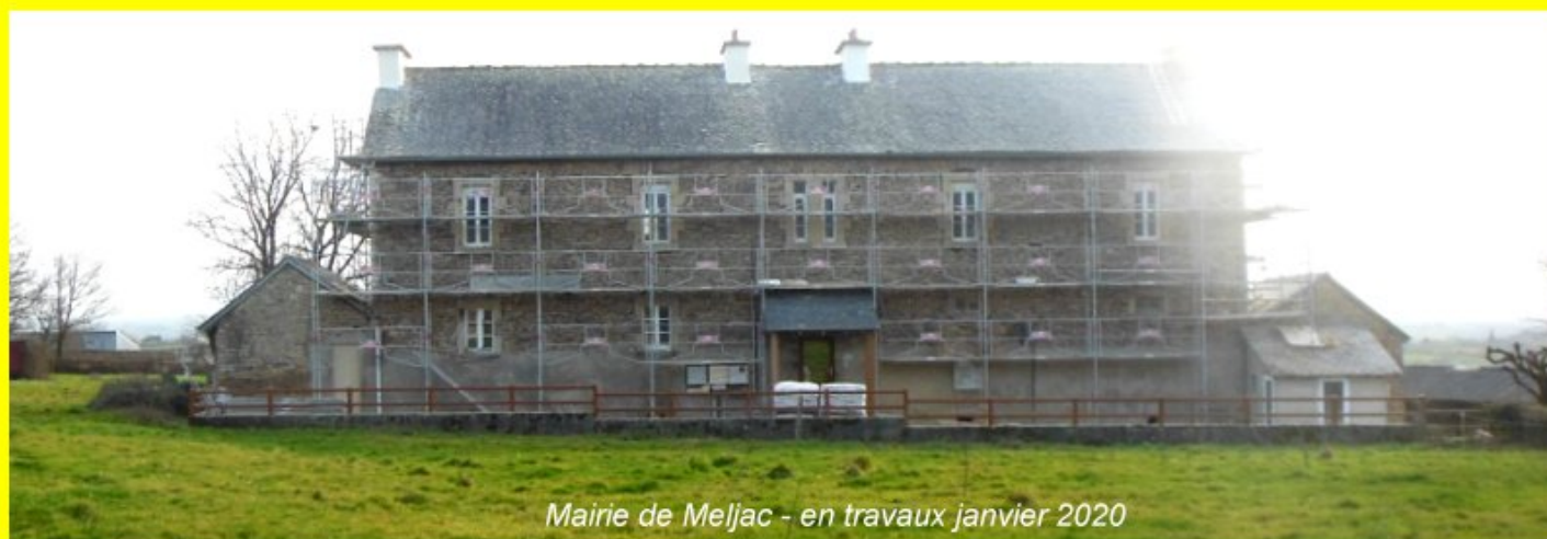
Mairie de Meljac - en travaux janvier 2020