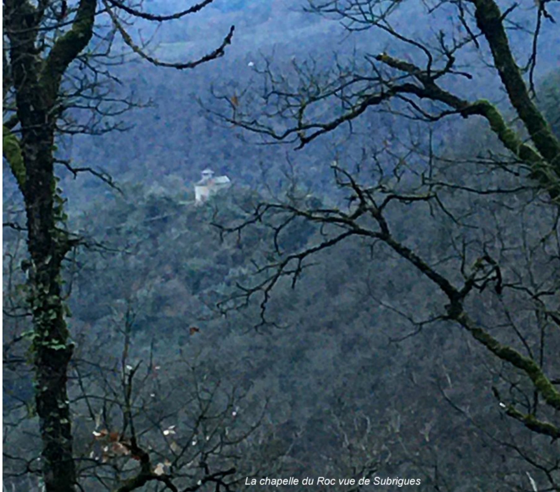
La chapelle du Roc vue de Subrigues