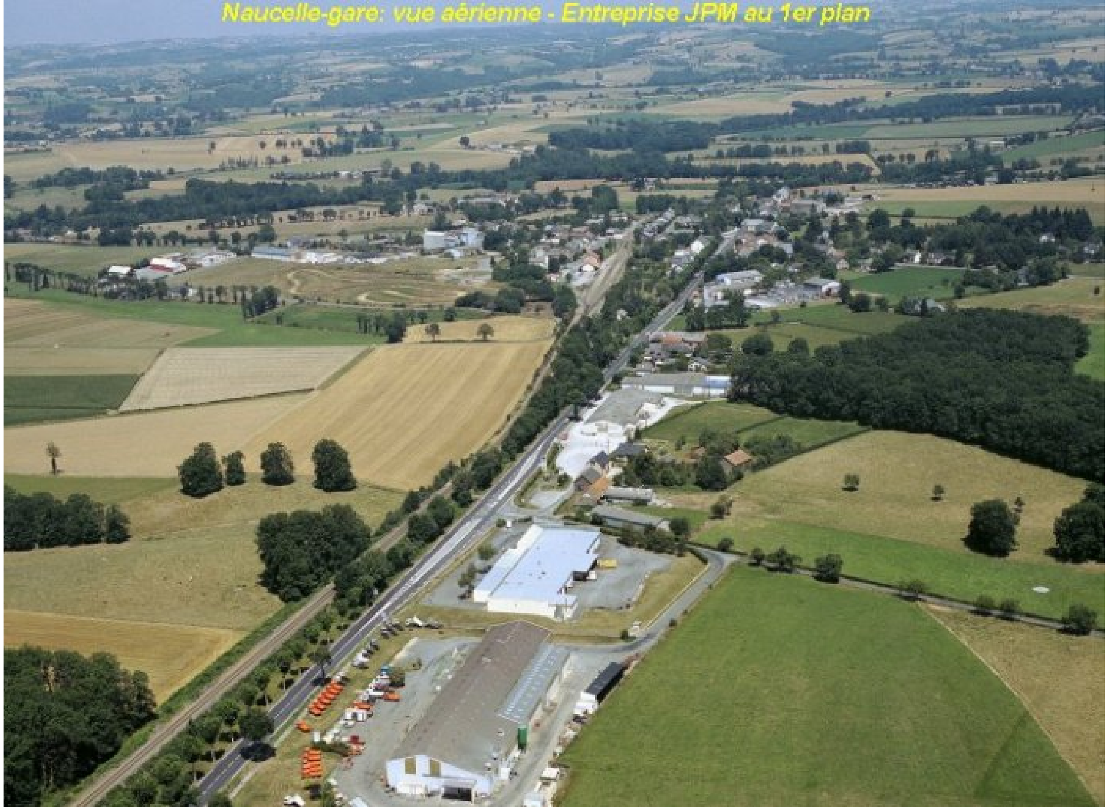
Naucelle-gare: vue aérienne - Entreprise JPM au 1er plan