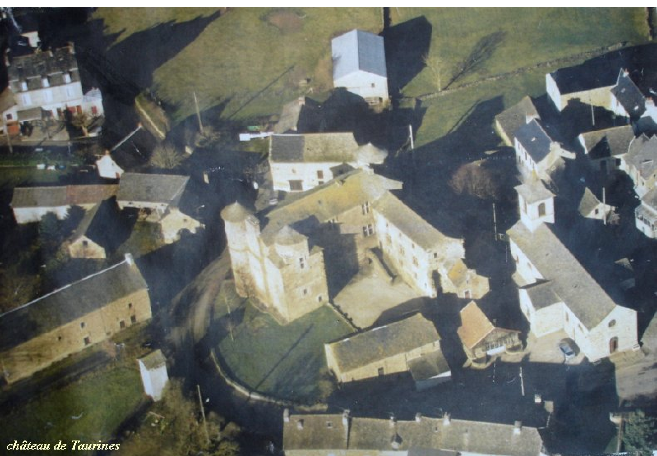
château de Taurines