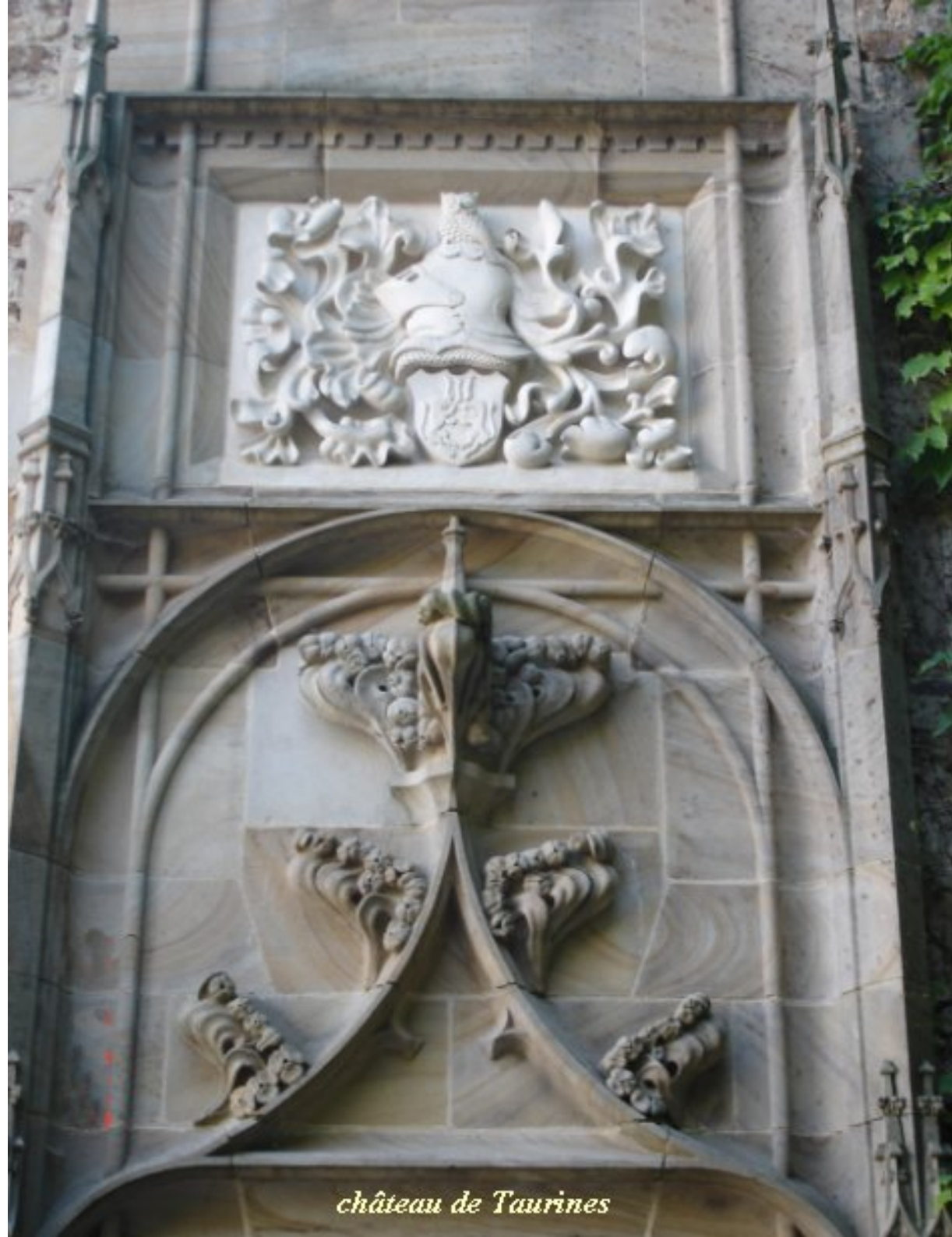
château de Taurines