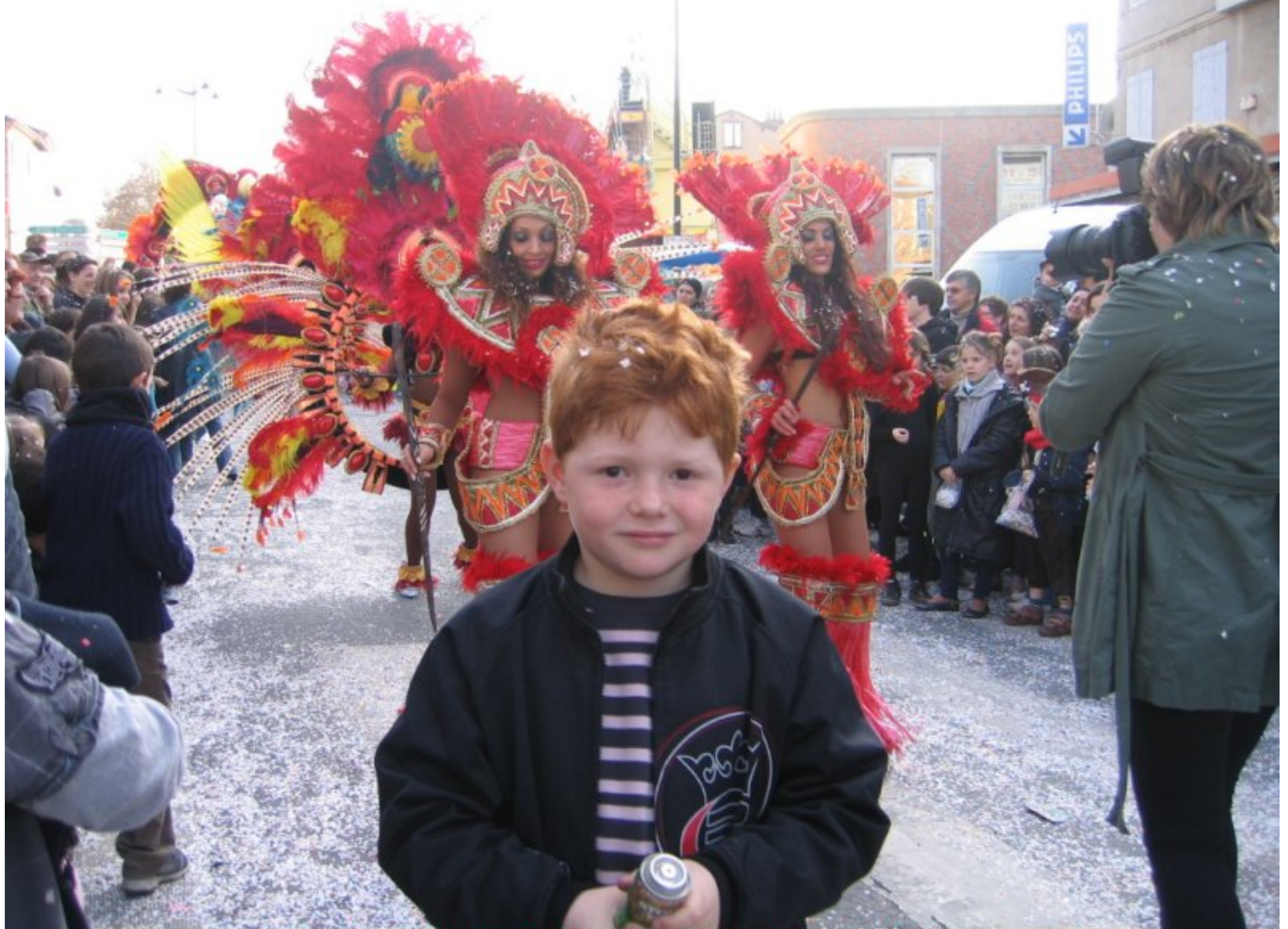
on pouvait aussi rencontrer des meljacois, au carnaval d'Albi, dimanche dernier...