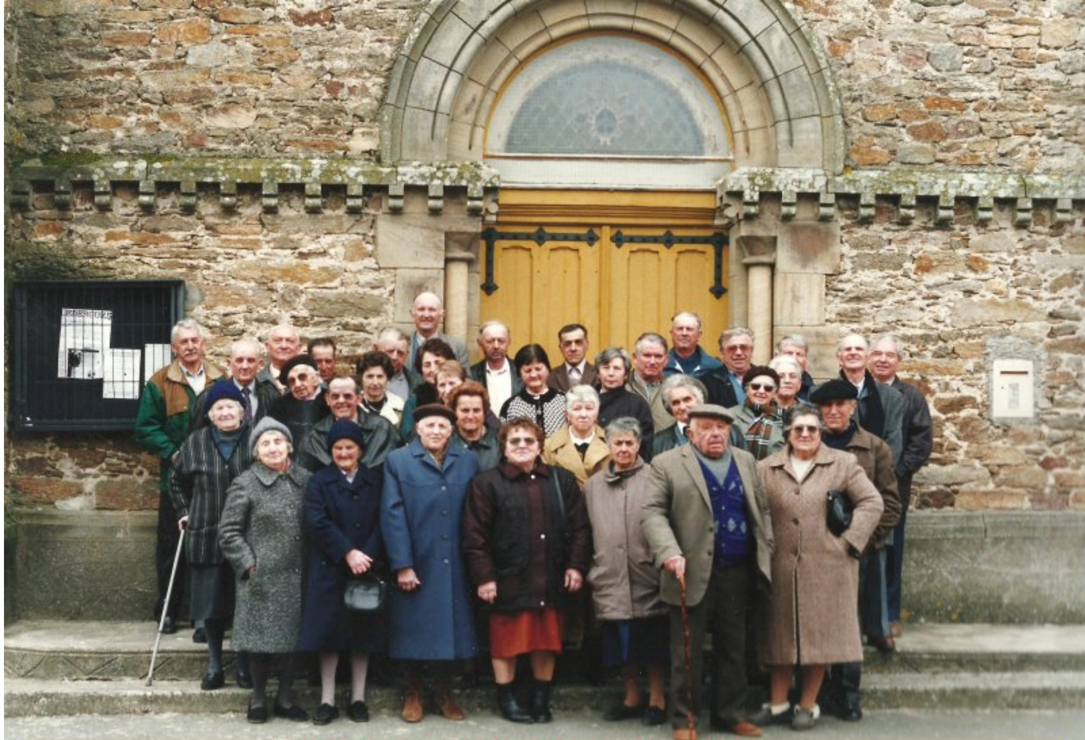
Jeudi 17 mars 2011: Réunion des Aînés de Meljac à 11H Messe en l'église de Meljac à 12H Déjeuner à la salle des fêtes