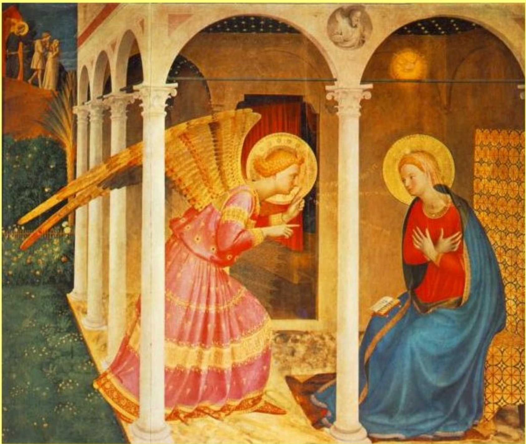
Fra Angelico, L'Annonciation (Couvent San Marco, Florence, Italie, XVème siècle)