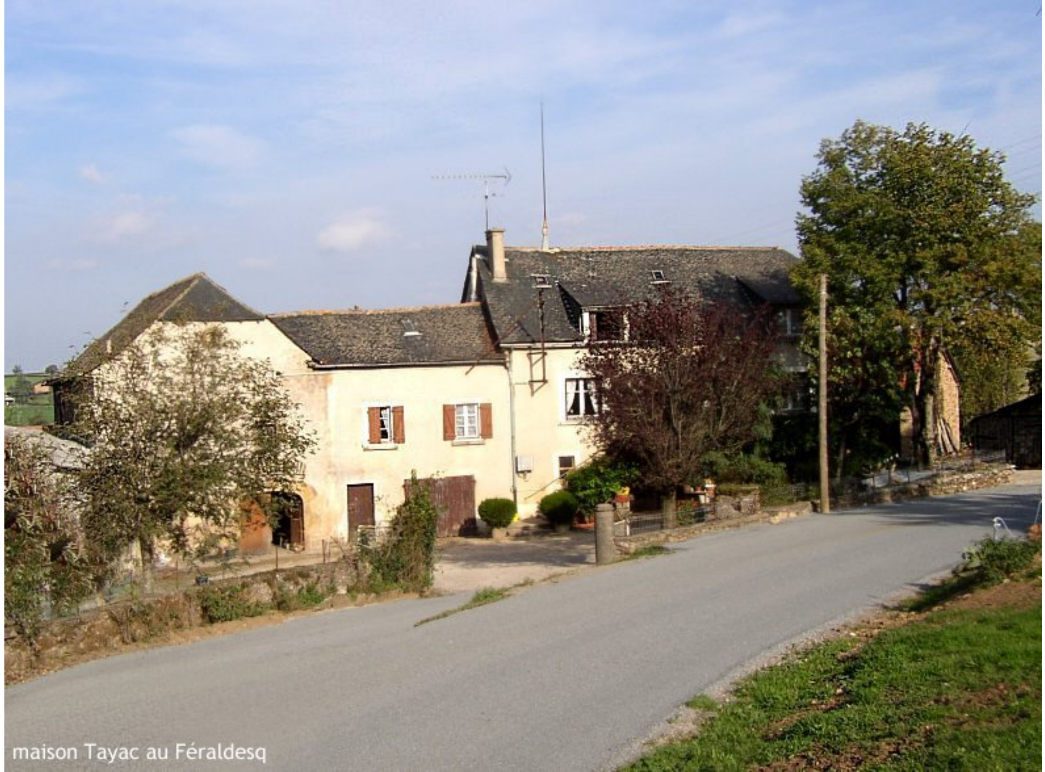
maison Tayac au Féraldesq