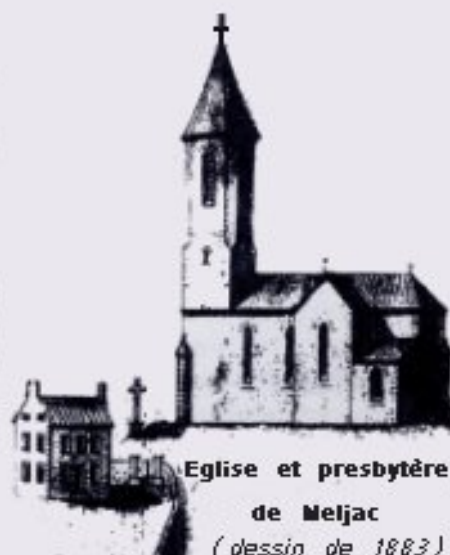
Eglise et presbytère de Meljac (dessin de 1883)

Le 15 septembre 1878, une souscription volontaire fut entreprise pour la réparation du chœur de l'église (cf. 1) dont les boiseries entièrement dégradées par l'humidité donnaient au sanctuaire un air de malpropreté intolérable au regard d'une âme chrétienne et indigne du Dieu de l'Eucharistie.