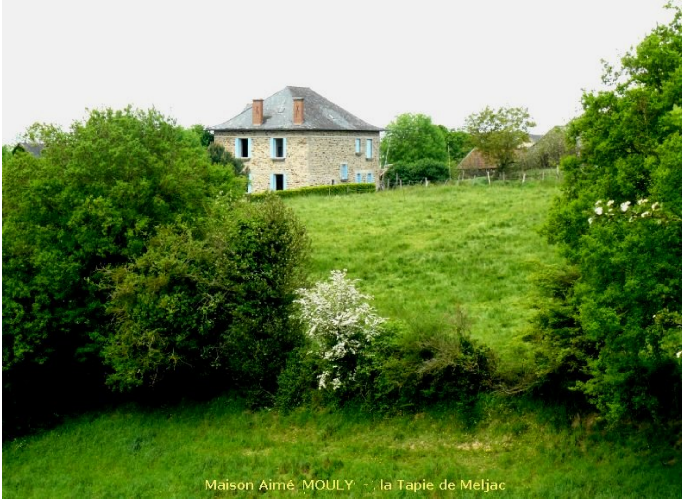
Maison Aimé MOULY - la Tapie de Meljac