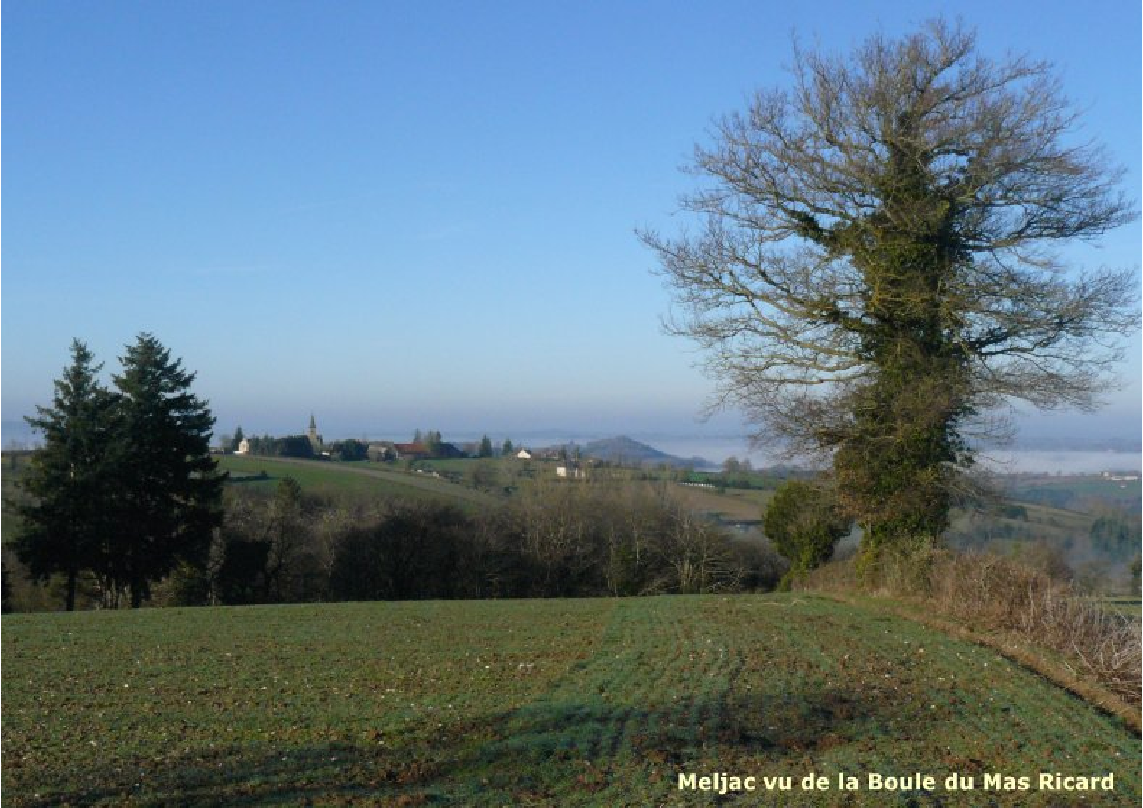
Meljac vu de la Boule du Mas Ricard