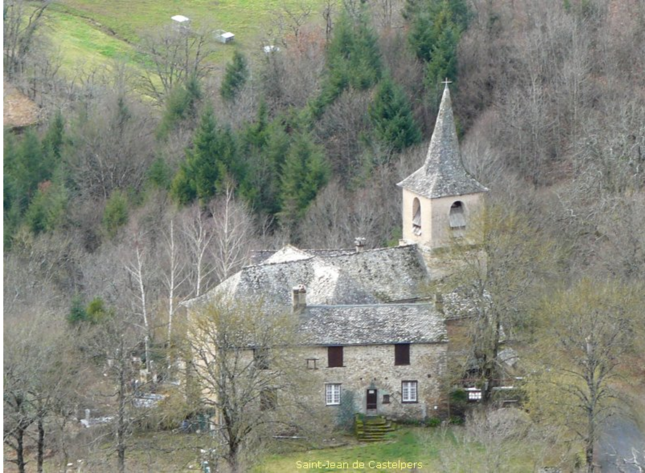
Saint-Jean de Castelpers