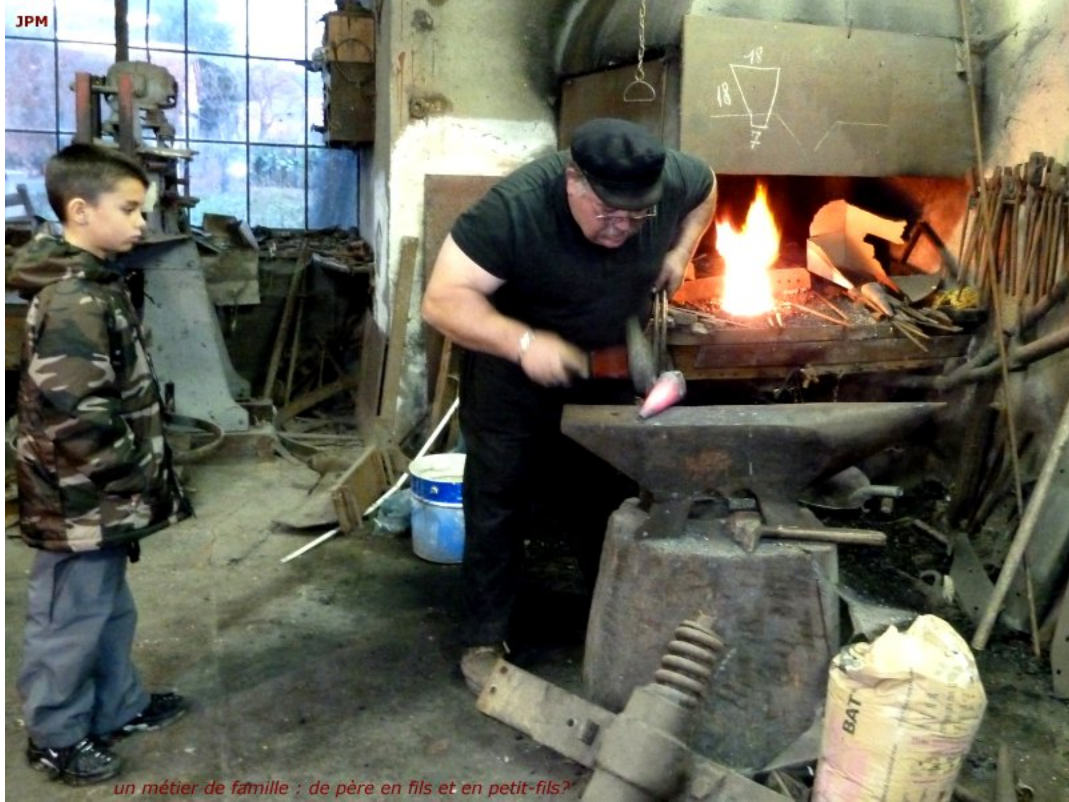
un métier de famille : de père en fils et en petit-fils?