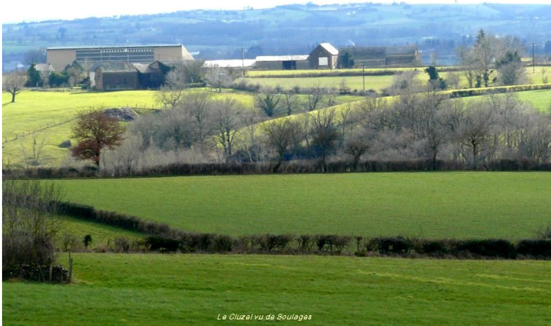
Le Cluzel vu de Soulagès