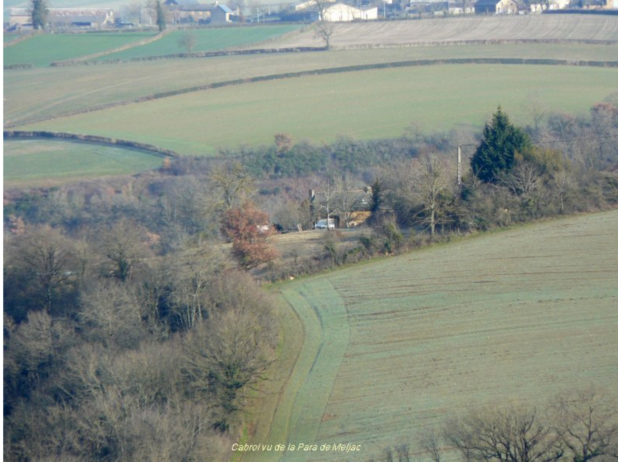
Cabrol vu de la Para de Meljac