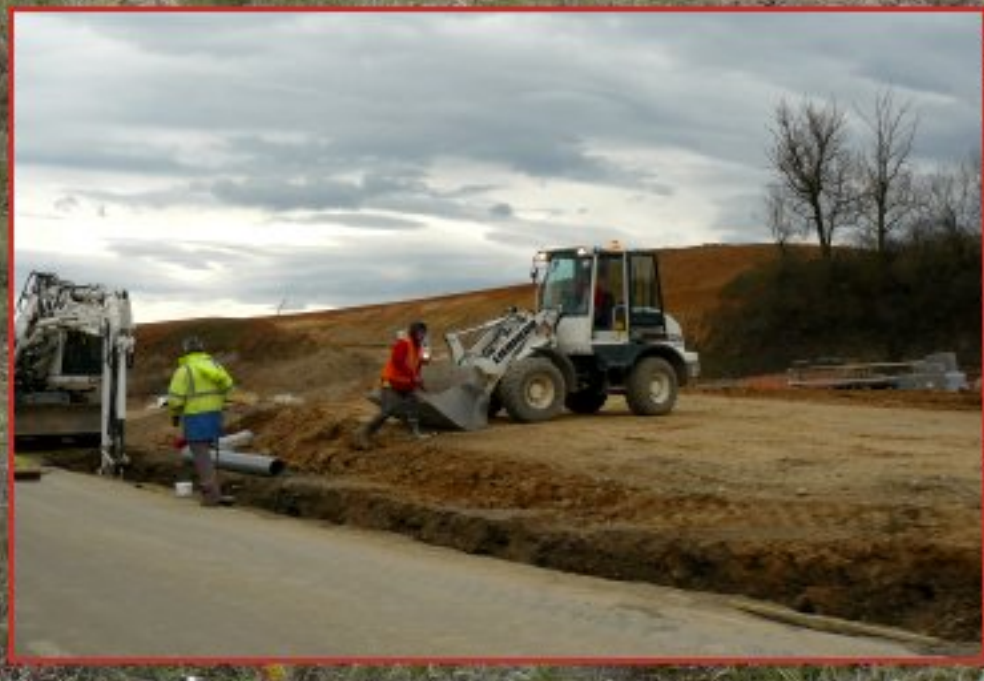
Travaux de la 2x2 voies à Naucelle-gare - 22 mars 2012: