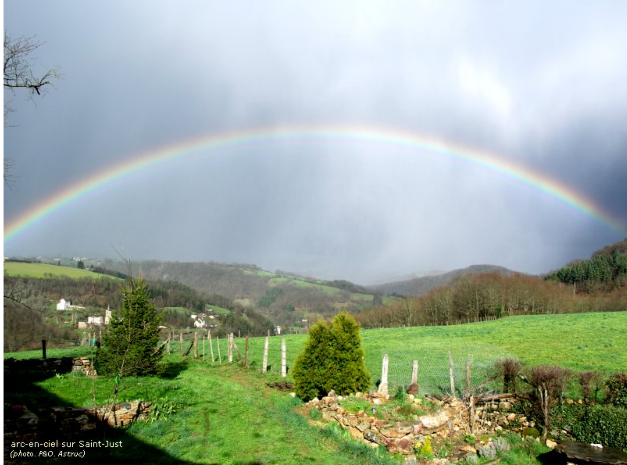
arc-en-ciel sur Saint-Just