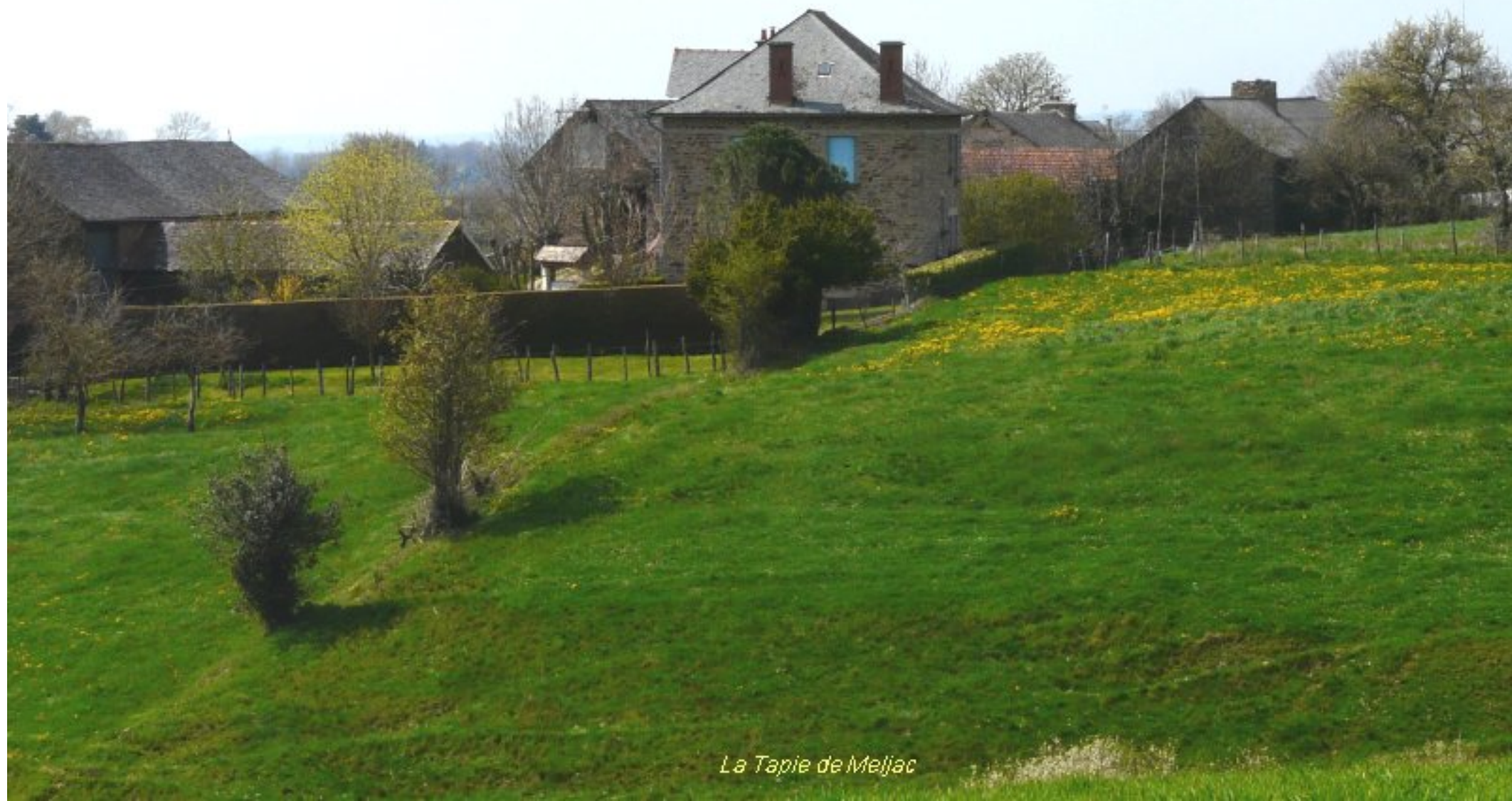
La Tapie de Meljac