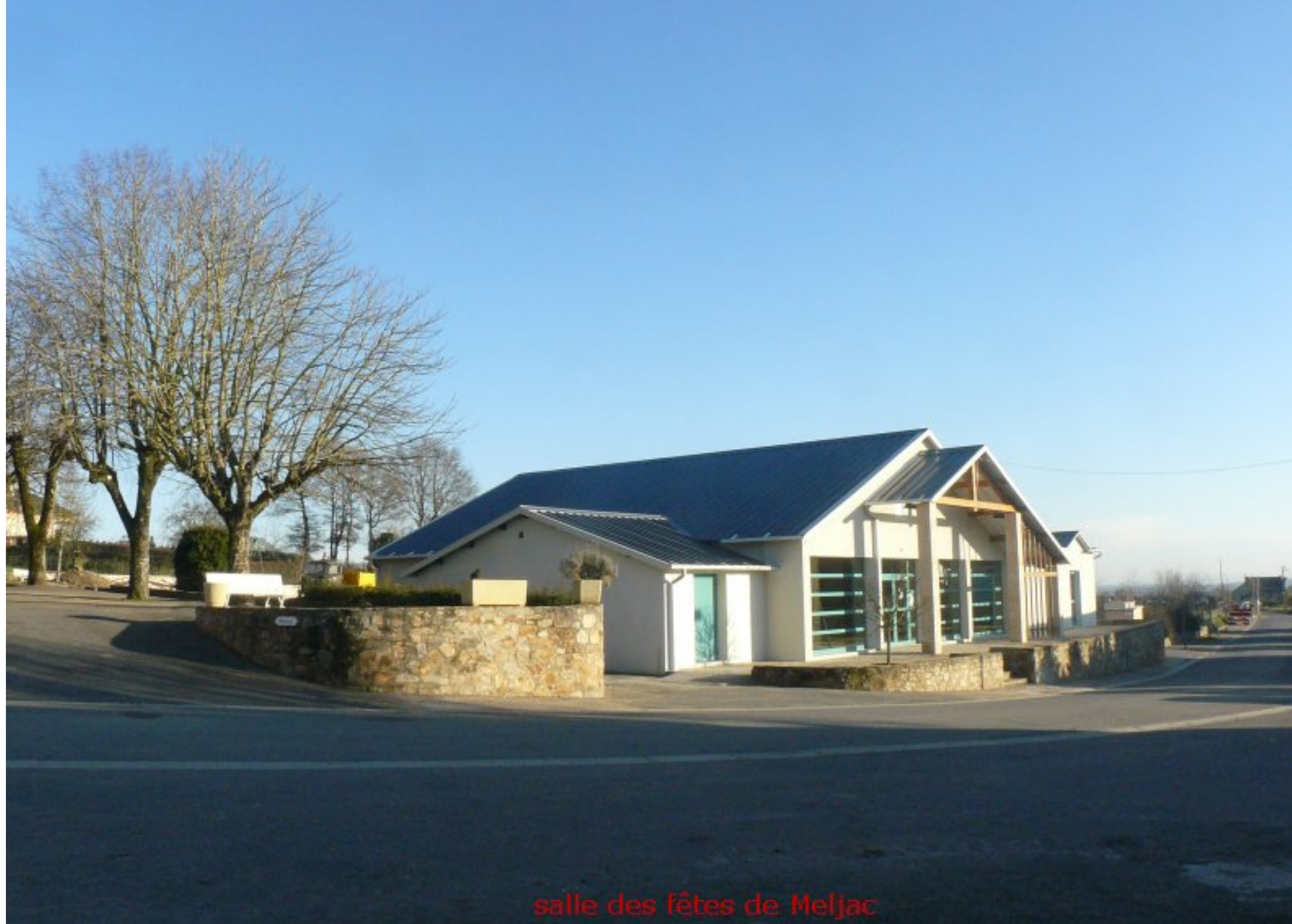
salle des fêtes de Meljac