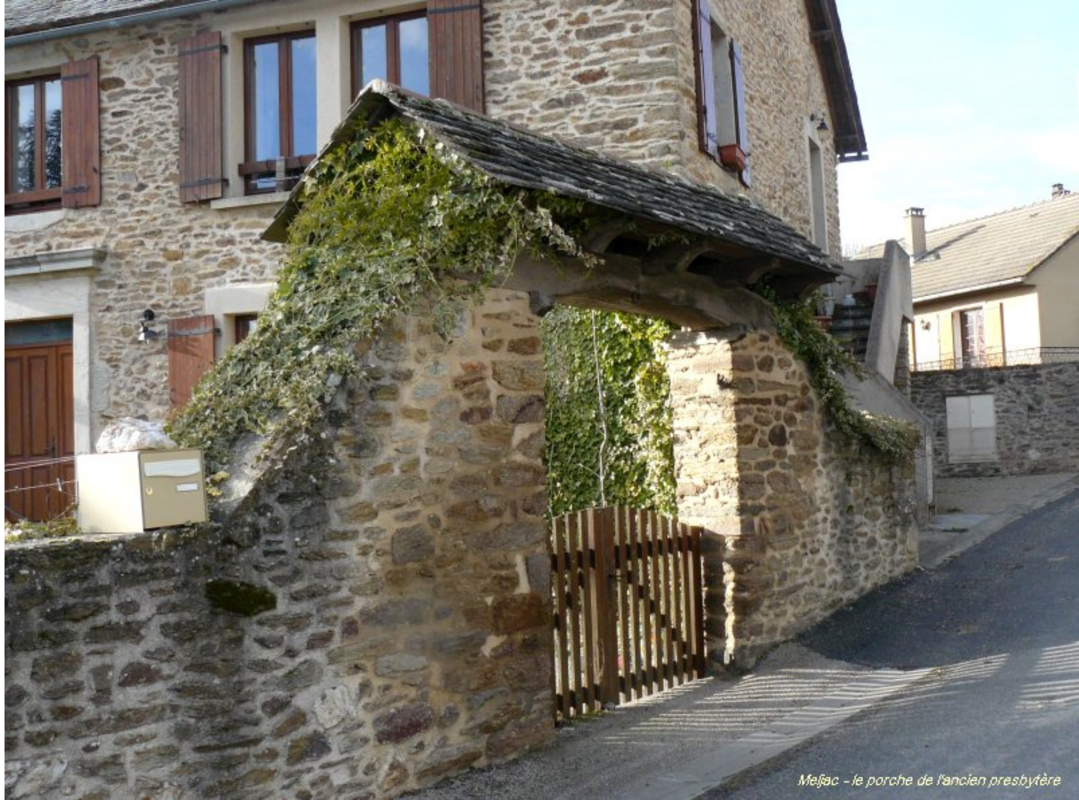
Mejác - le porche de l'ancien presbytère