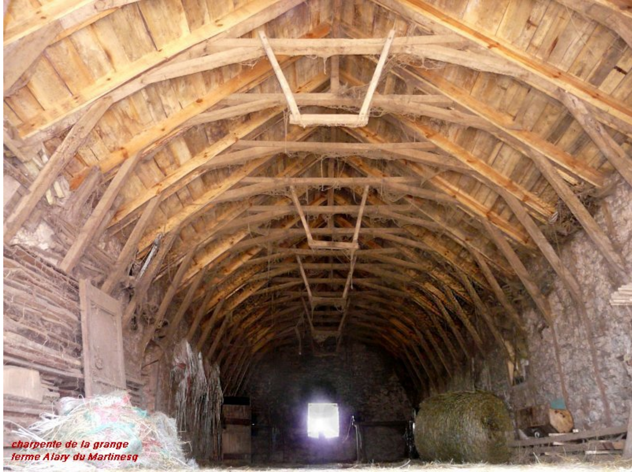
charpente de la grange ferme Alary du Martinesq