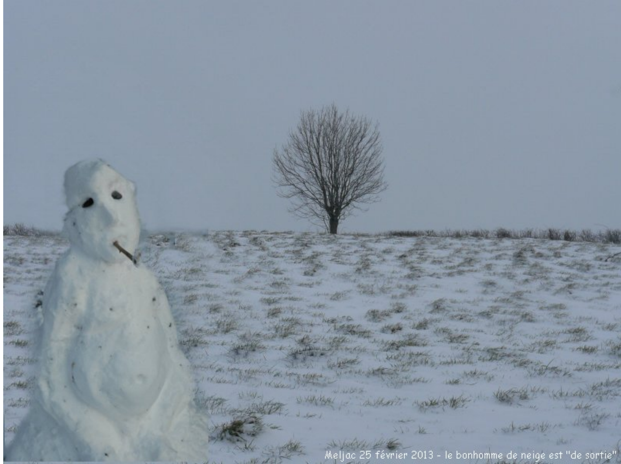
Meljac 25 février 2013 - le bonhomme de neige est "de sortie"