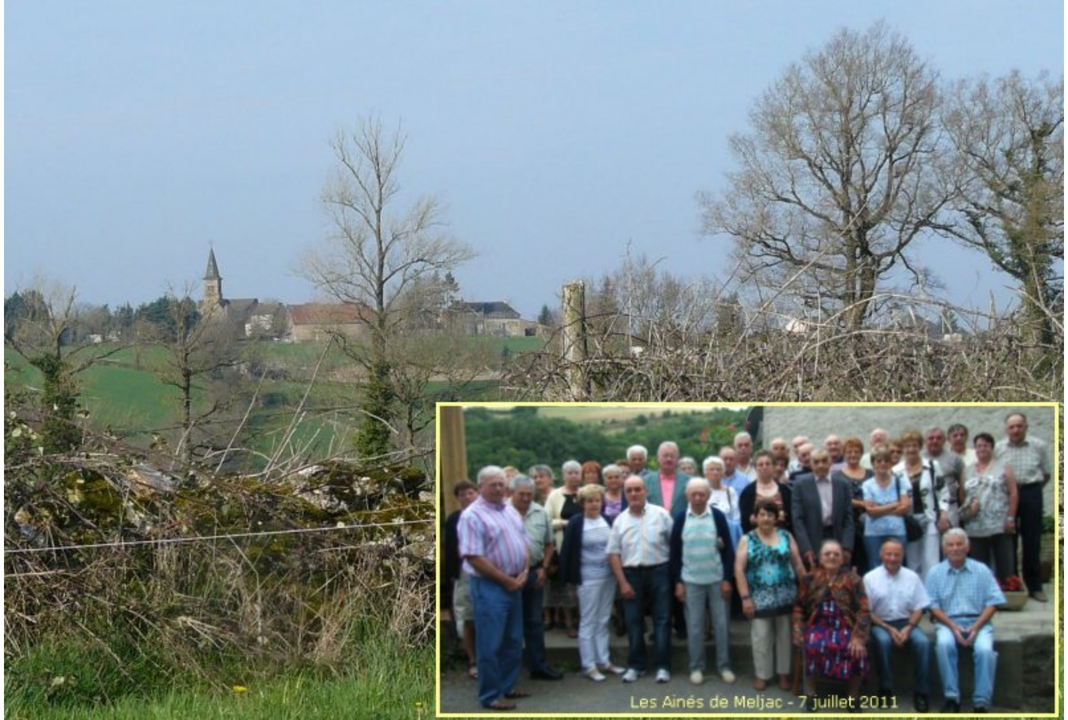
Les Aînés de Meljac - 7 juillet 2011

Réunion des Aînés de Meljac-mardi 12 mars- salle des Fêtes de Meljac 1ère rencontre de l'Année 2013 - déjeuner à 12H - renouvellement des timbres