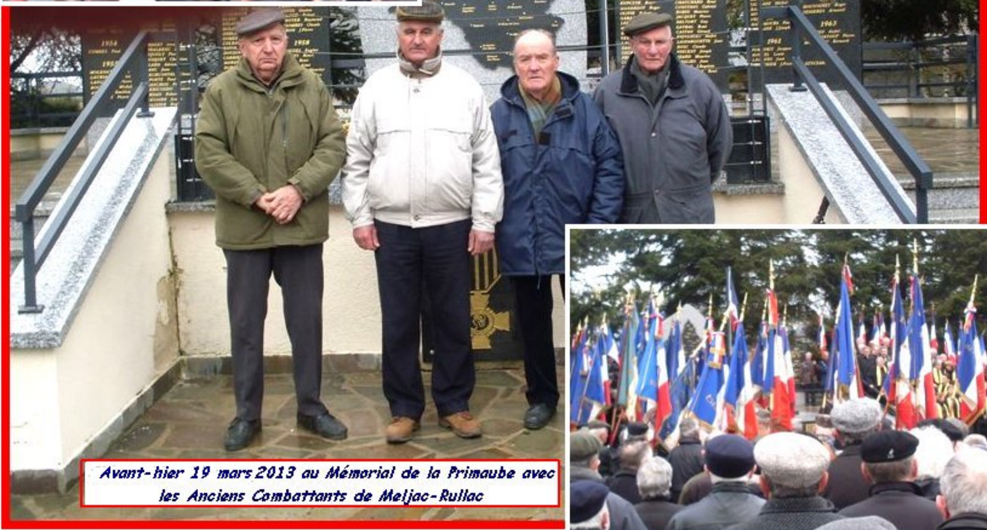
Avant-hier 19 mars 2013 au Mémorial de la Primaube avec les Anciens Combattants de Meljac-Rullac