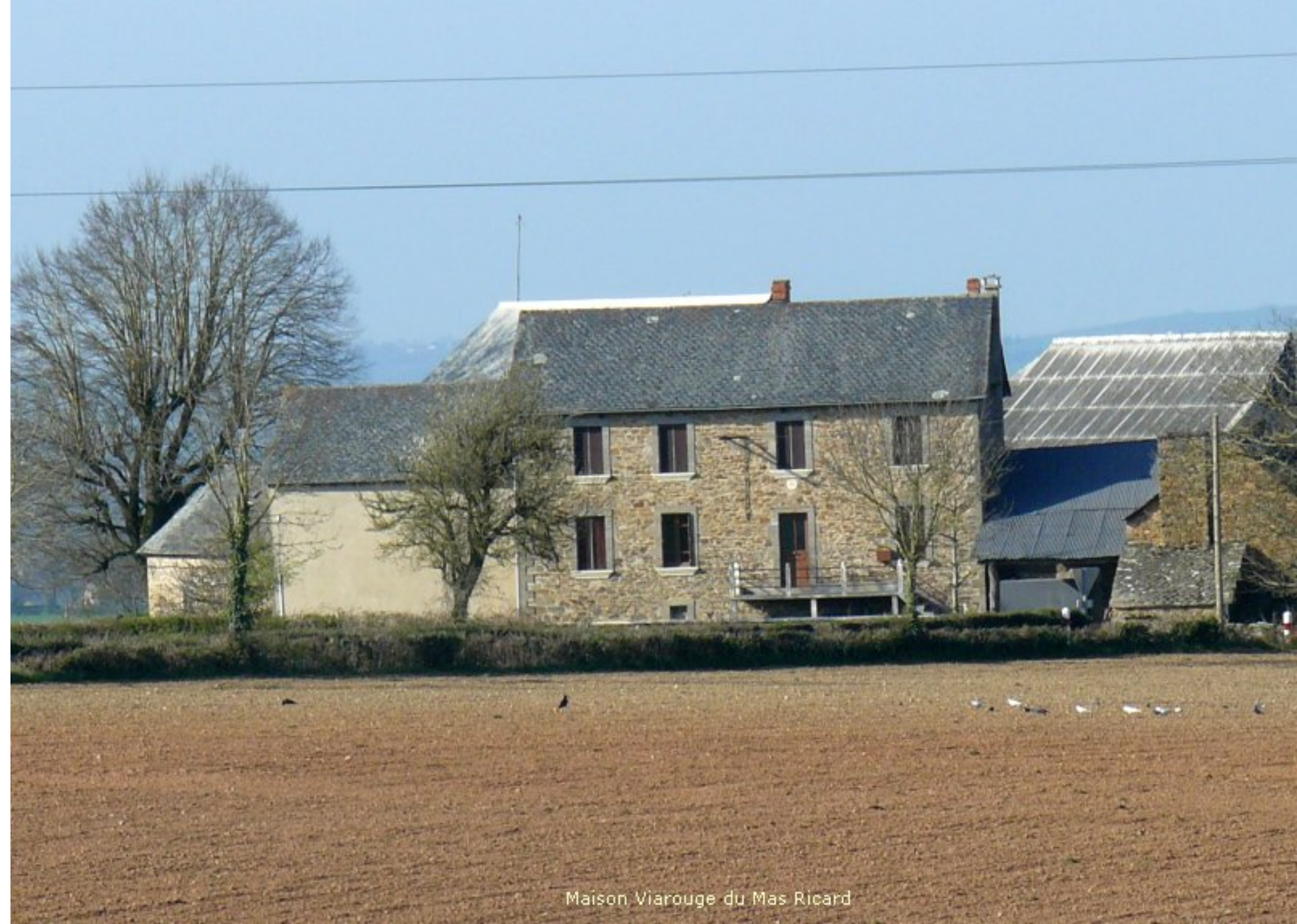
Maison Viarouge du Mas Ricard