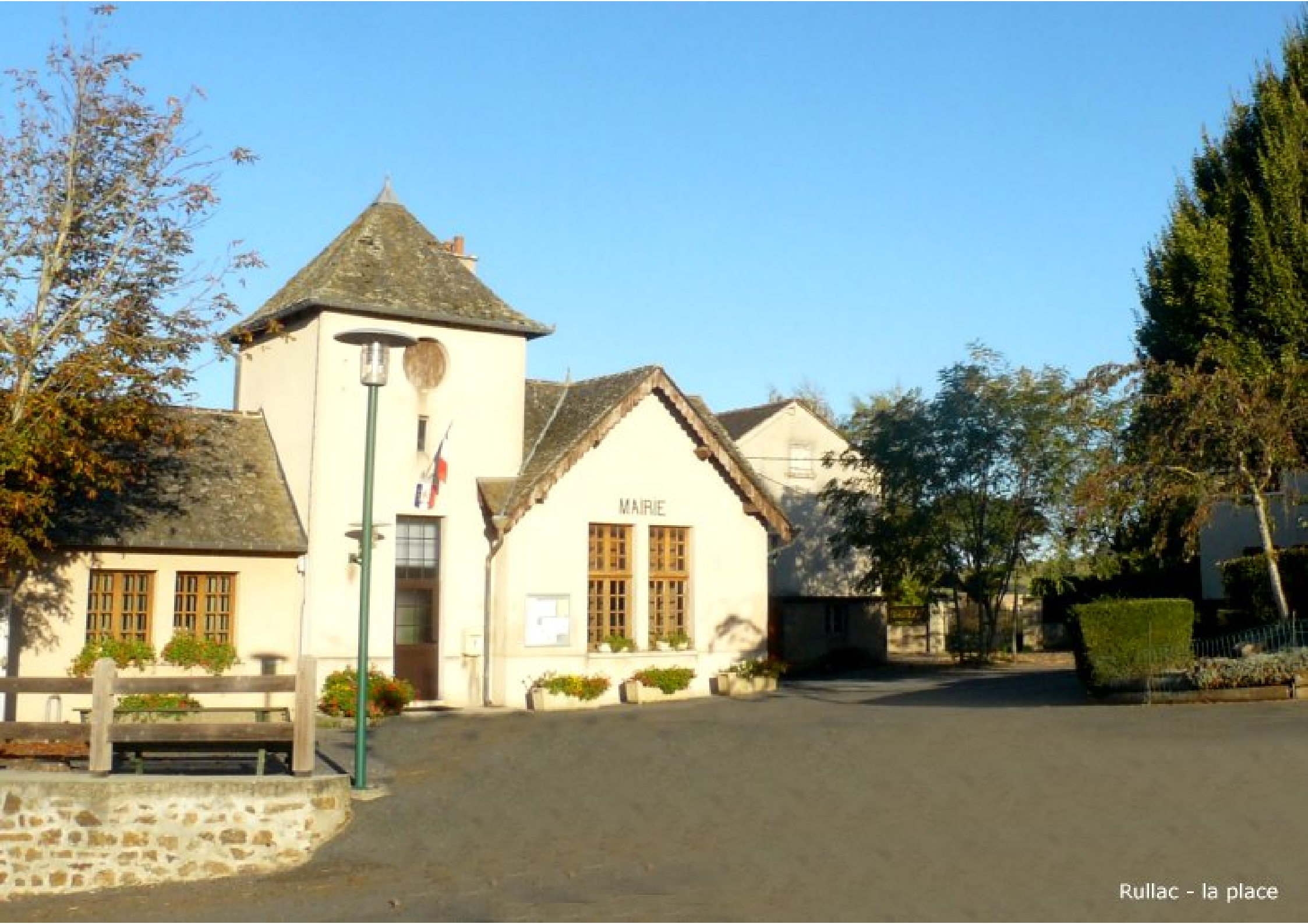
Rullac - la place