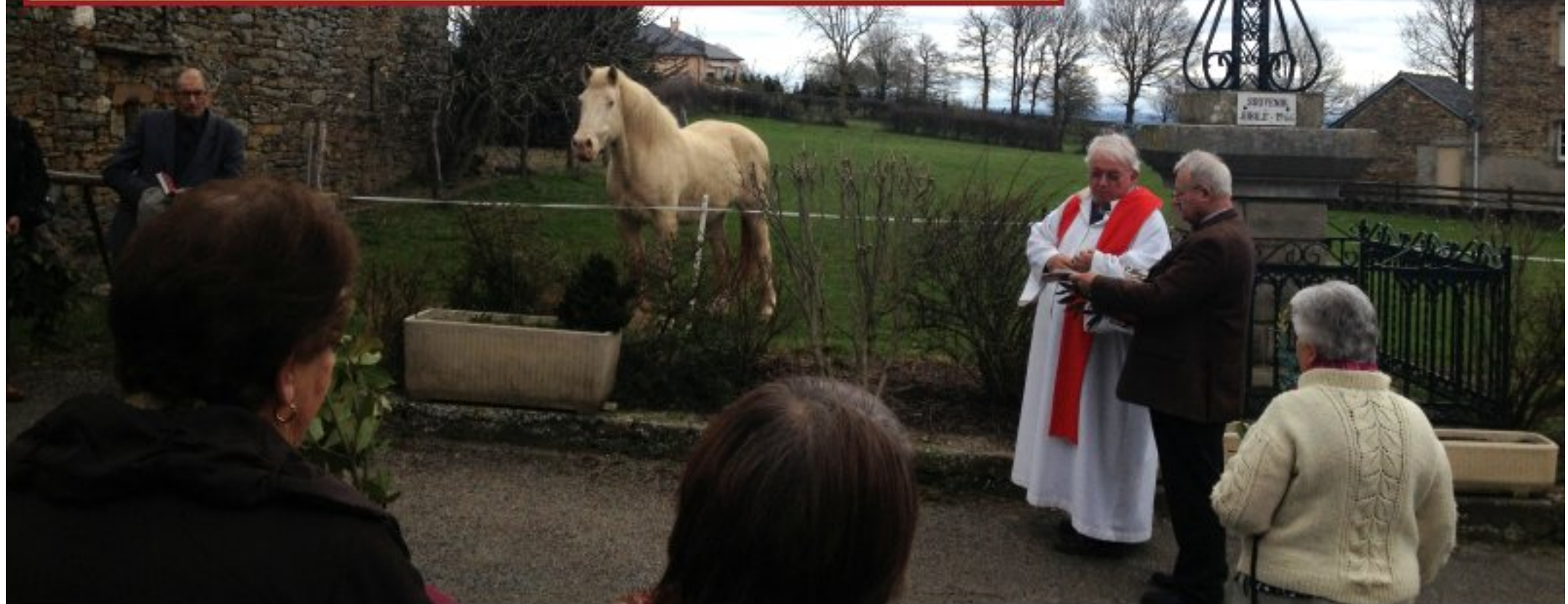
Dimanche des Rameaux - 24 mars 2013 à Meljac : le vent ne souffle pas et le cheval est des plus attentifs...