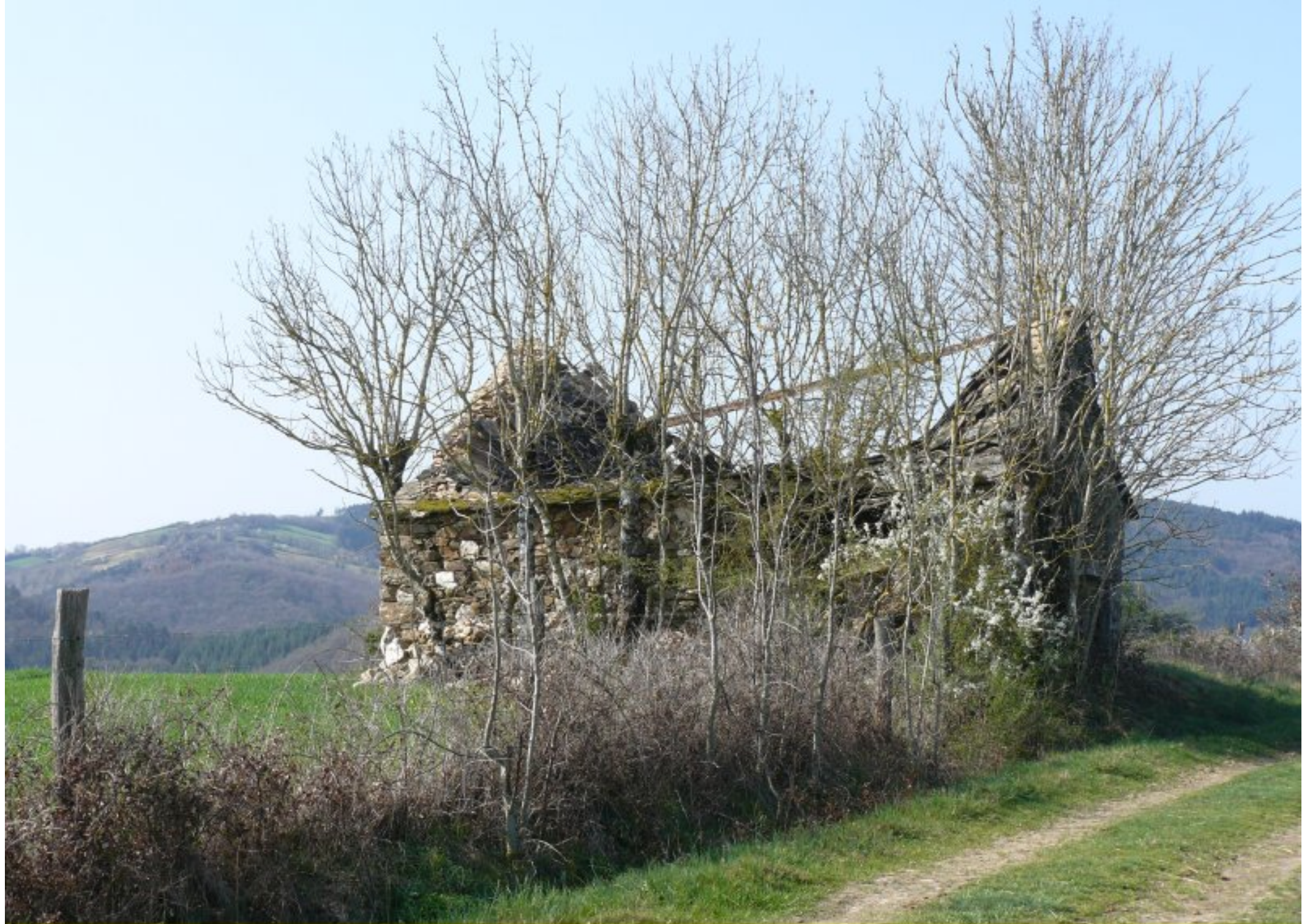
le toit de la "grange de Gustine" à Subrigues a cédé sous le poids des ans en 2012