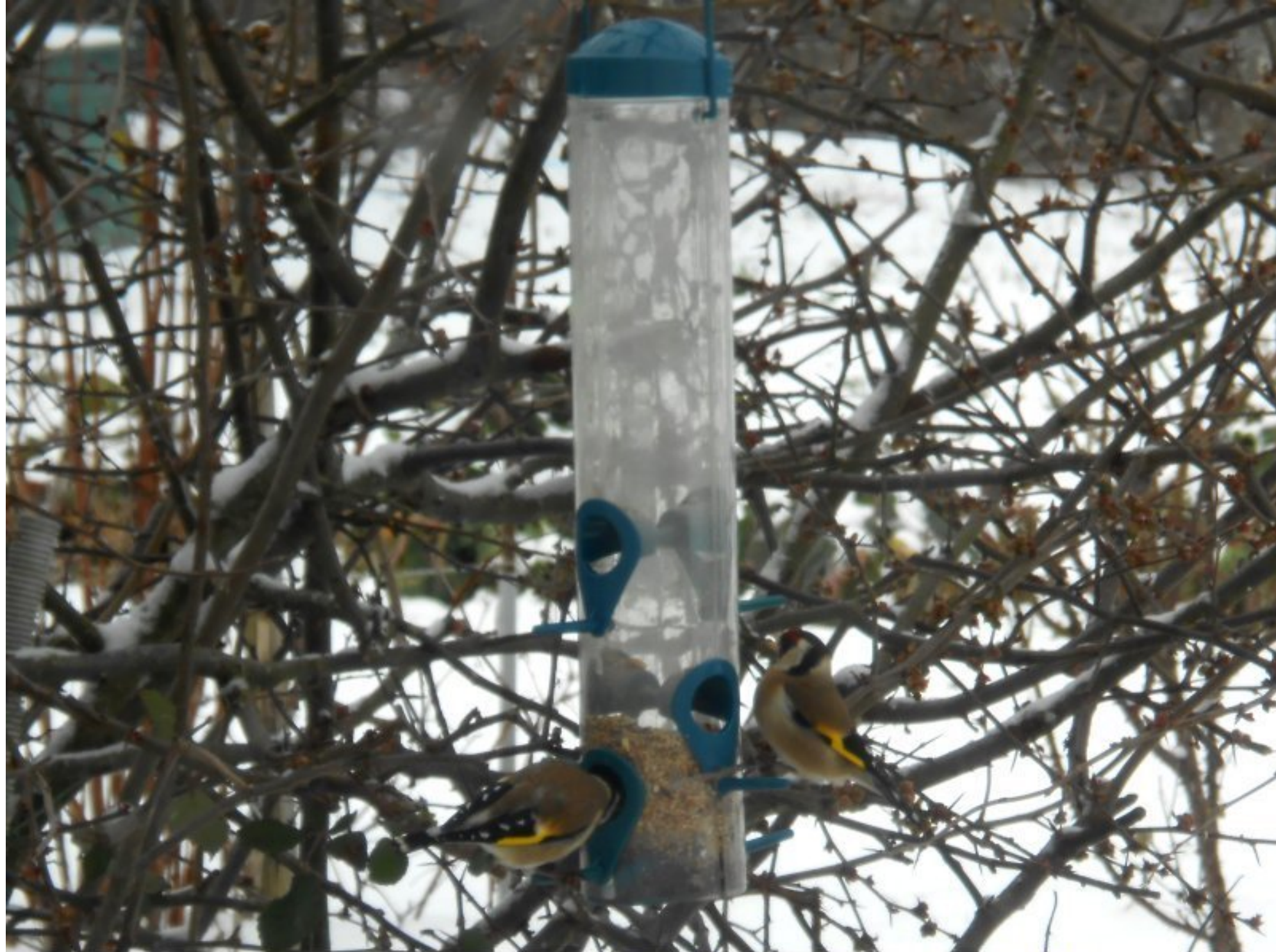
Chardonnerets à la mangeoire - Photo. Geneviève Flottes - janvier 2013

Les dernières "UNES" de www.meljac.net - lo reiet e l'ibern & l'hiver des oiseaux - ont inspiré les amateurs meljacois de photographies