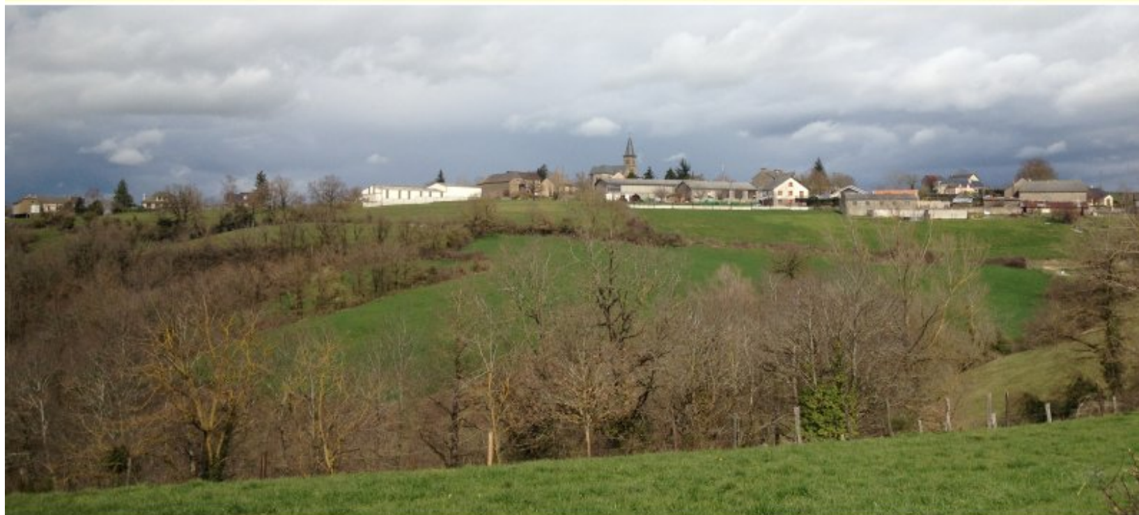
Meljac - photo. Meljac.Net - 24 mars 2013