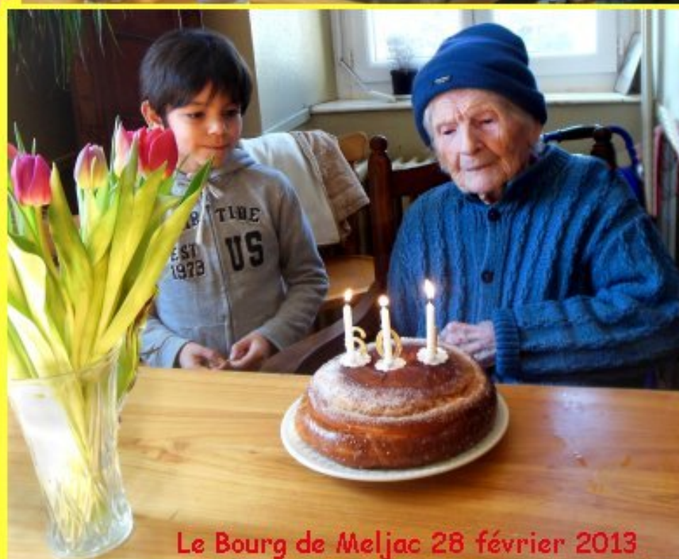
Le Bourg de Meljac 28 février 2013