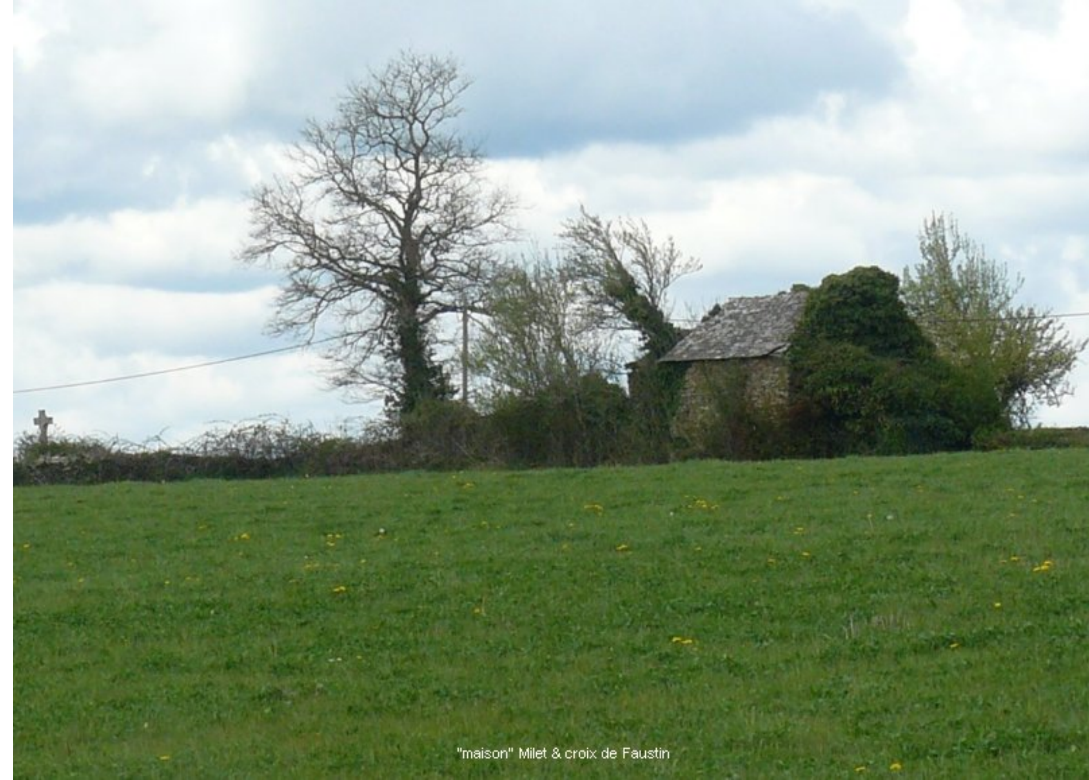
"maison" Milet & croix de Faustin