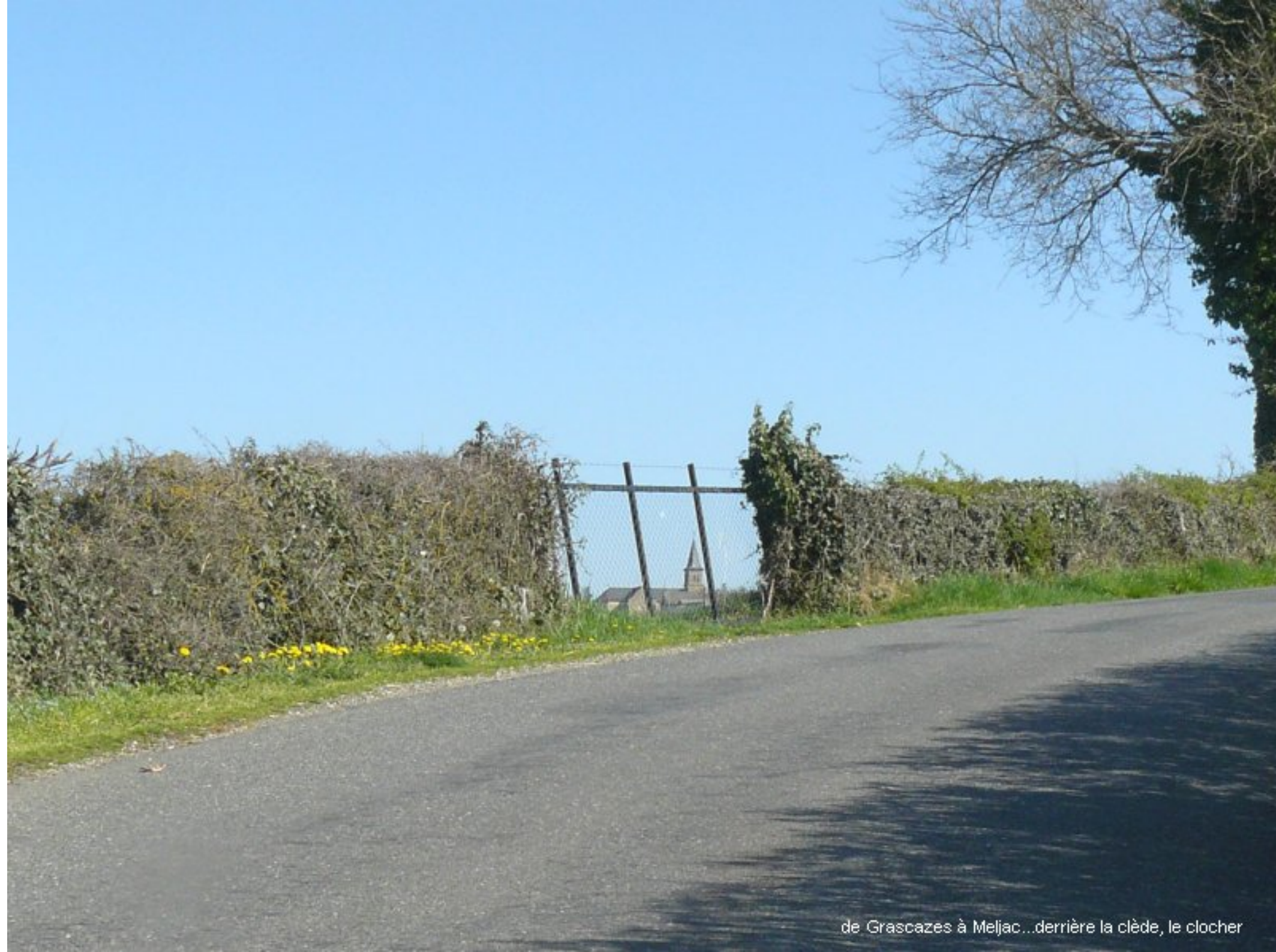
de Grascazes à Meljac...derrière la clède, le clocher