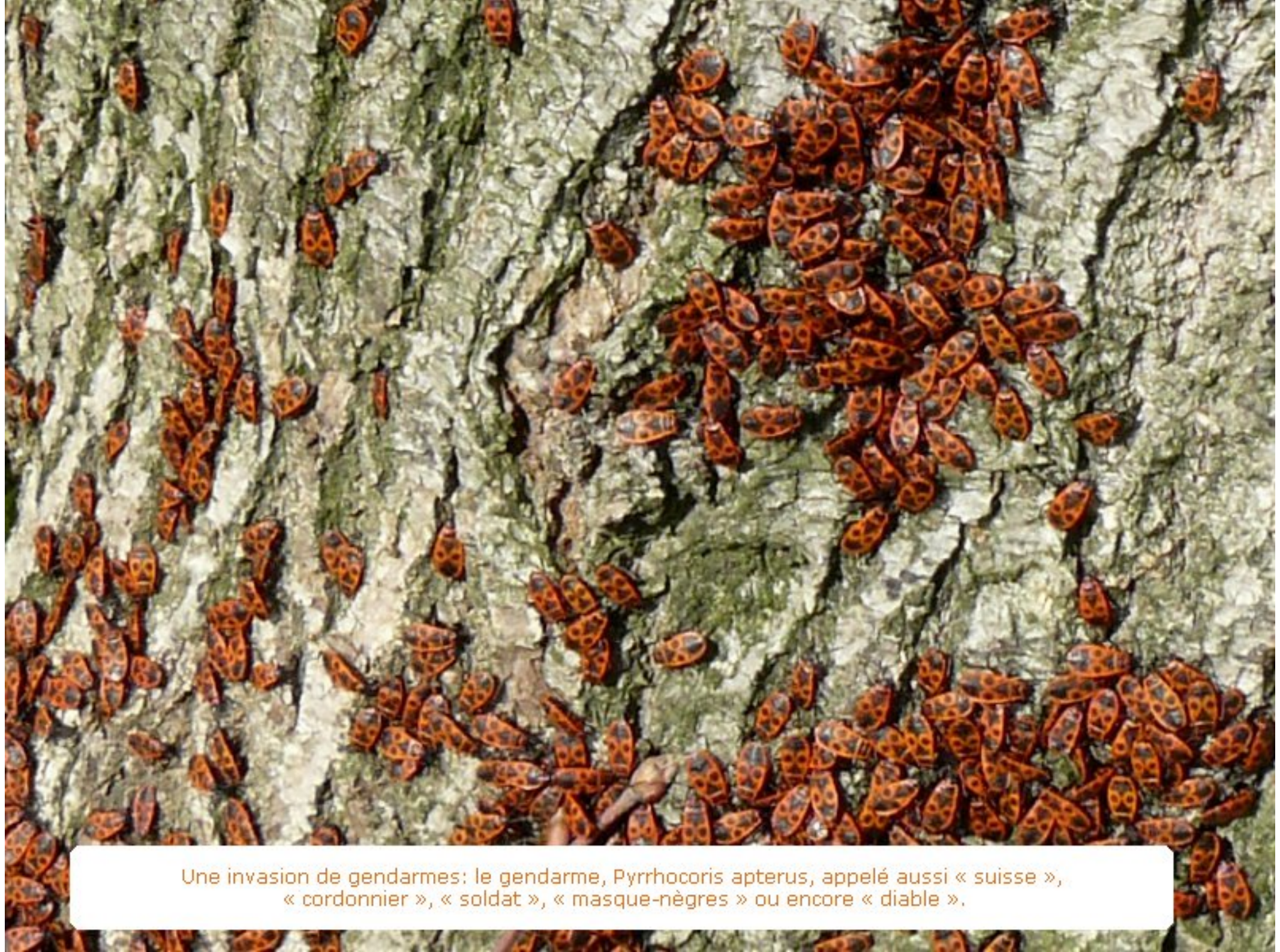
Une invasion de gendarmes: le gendarme, Pyrrhocoris apterus , appelé aussi « suisse », « cordonnier », « soldat », « masque-nègres » ou encore « diable ».