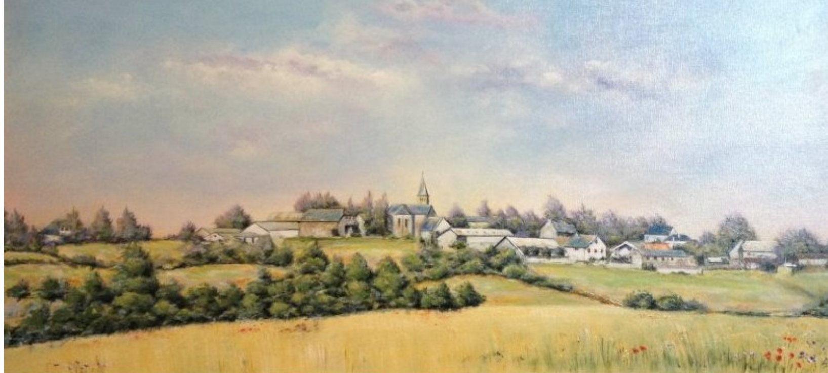
Meljac peint par Georges Gaben du Puech Issaly - 2012 (tableau exposé au secrétariat de la mairie de Meljac)