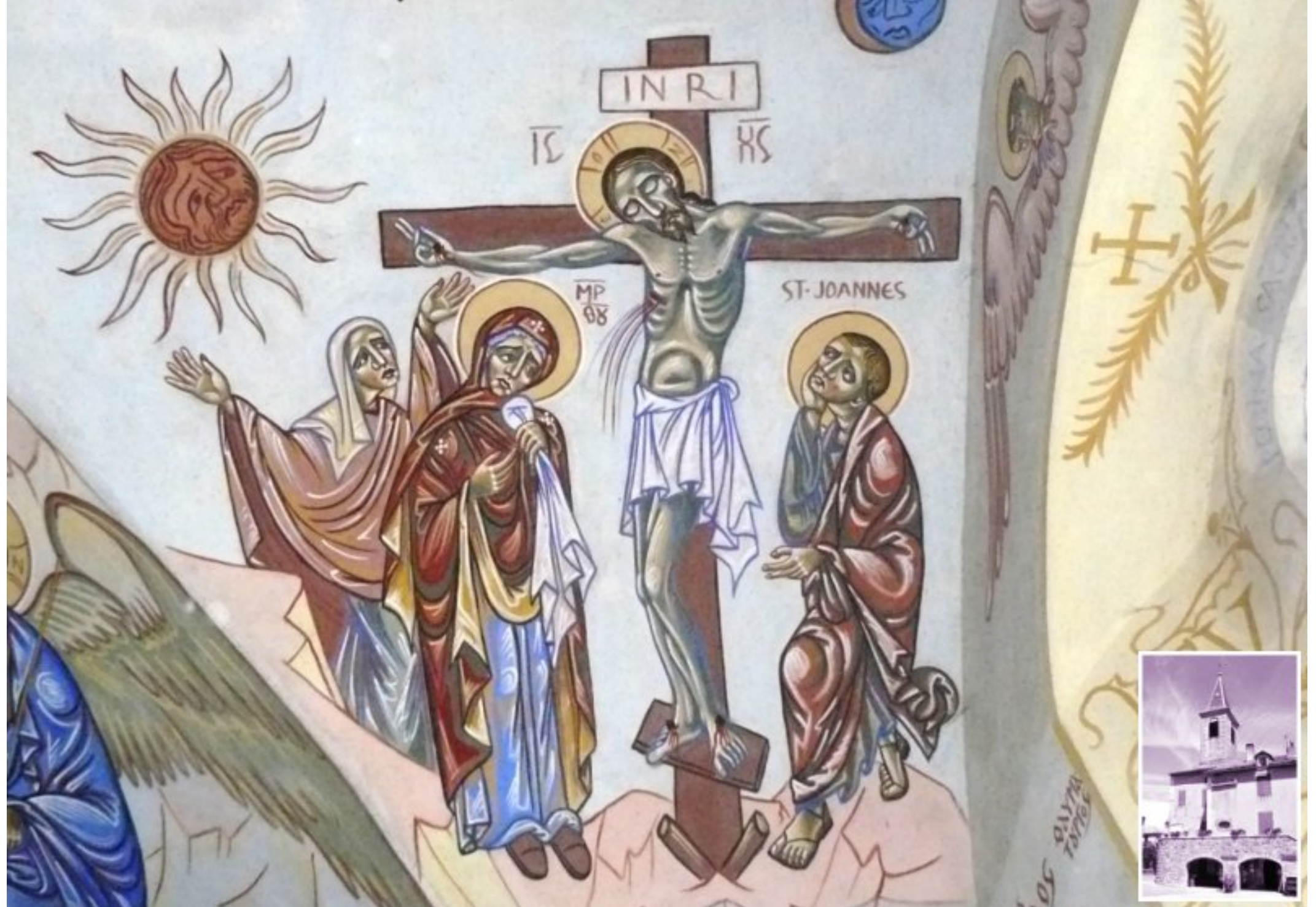
Fresque de Nicolas Greschny - église de Saint-Victor et Melvieu (à 55 km de Meljac)