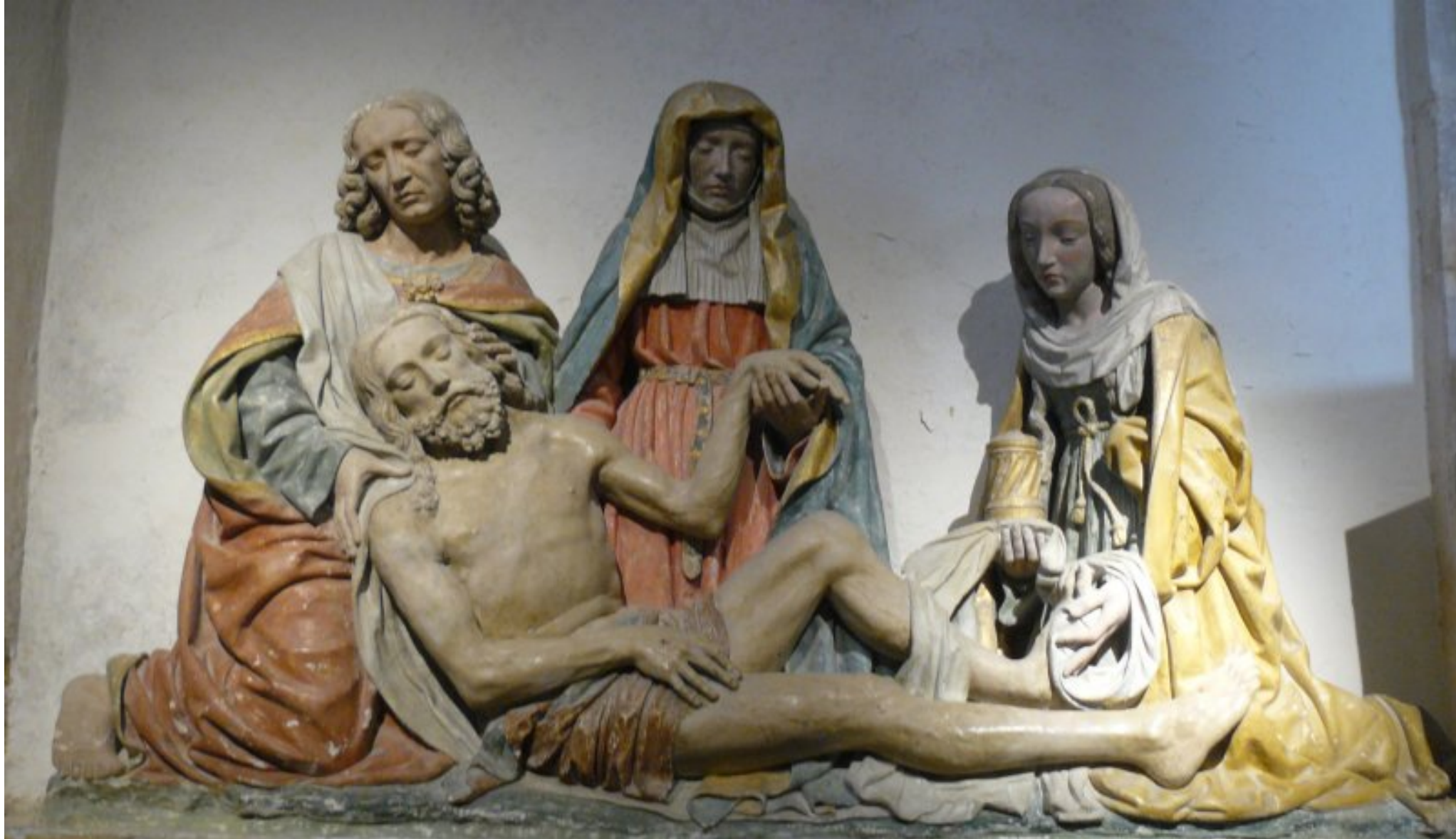
EGLISE de CARCENAC MISE AU TOMBEAU (XVI ème )