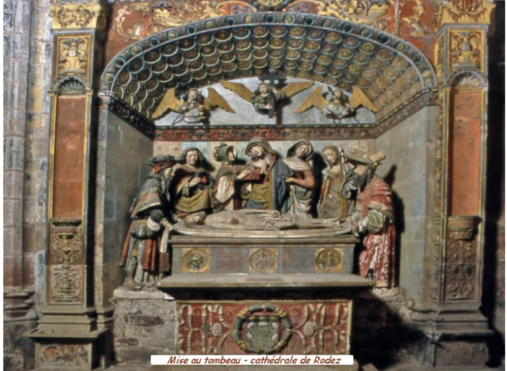
Mise au tombeau - cathédrale de Rodez