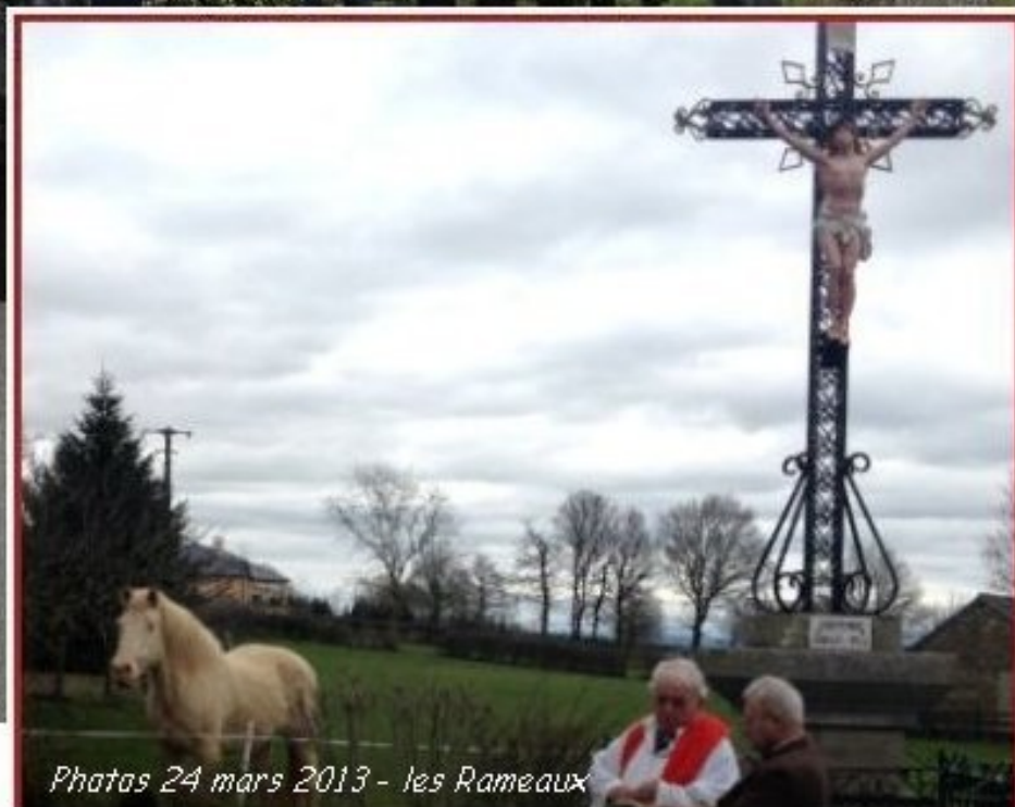
Photos 24 mars 2013 - les Rameaux