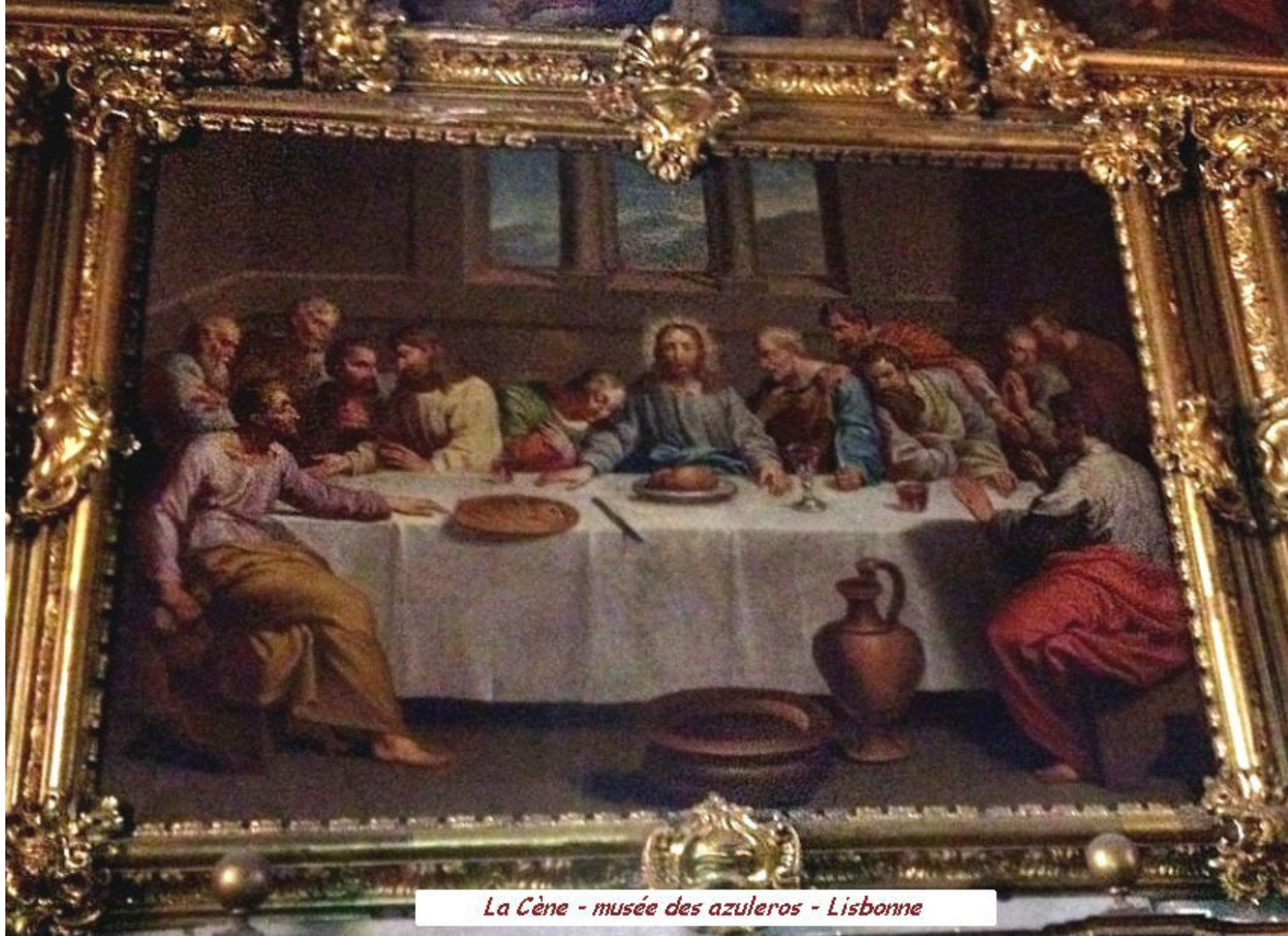
La Cène - musée des azuleiros - Lisbonne