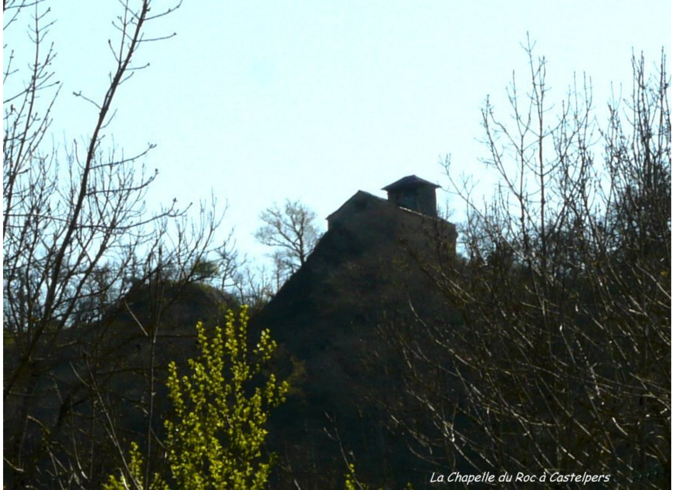
La Chapelle du Roc à Castelpers