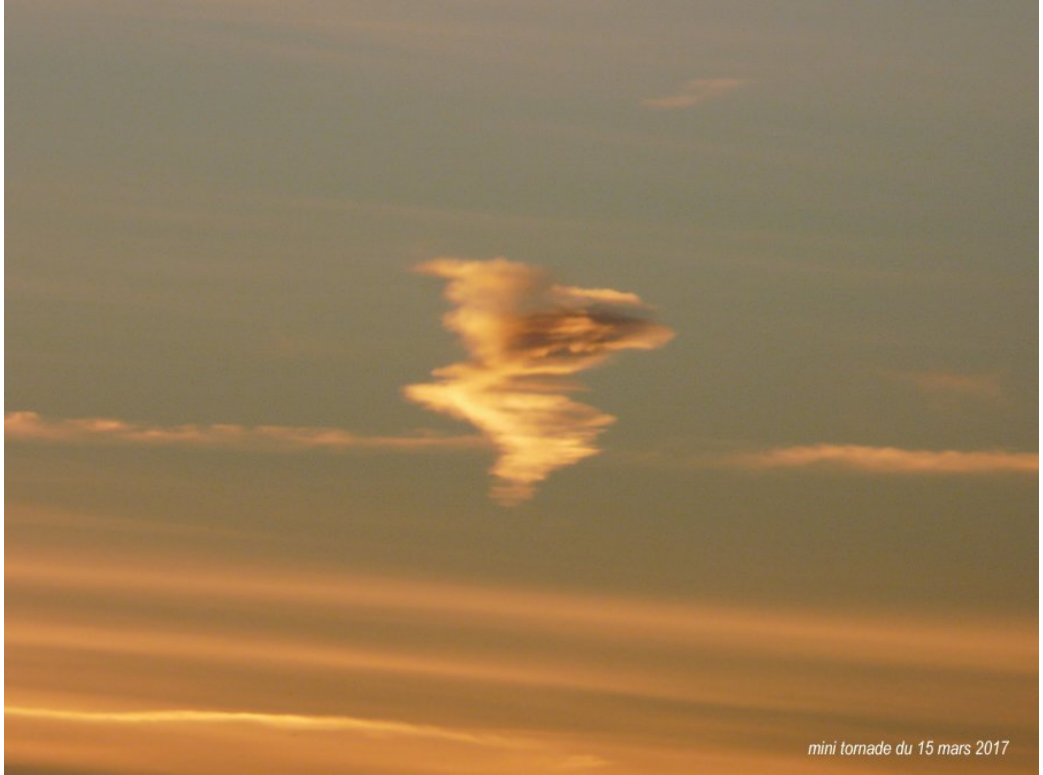
mini tornade du 15 mars 2017