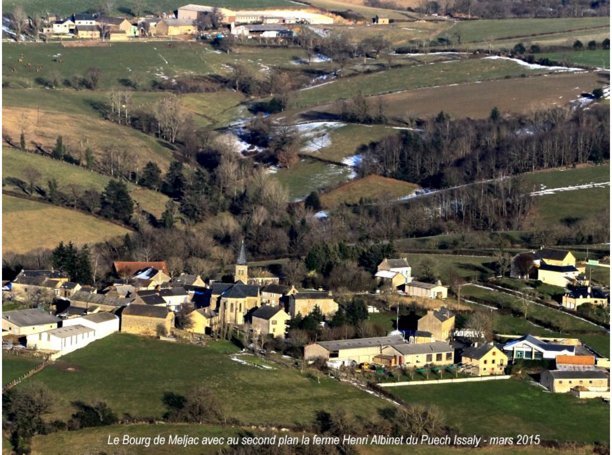
Le Bourg de Meljac avec au second plan la ferme Henri Albinet du Puech Issaly - mars 2015