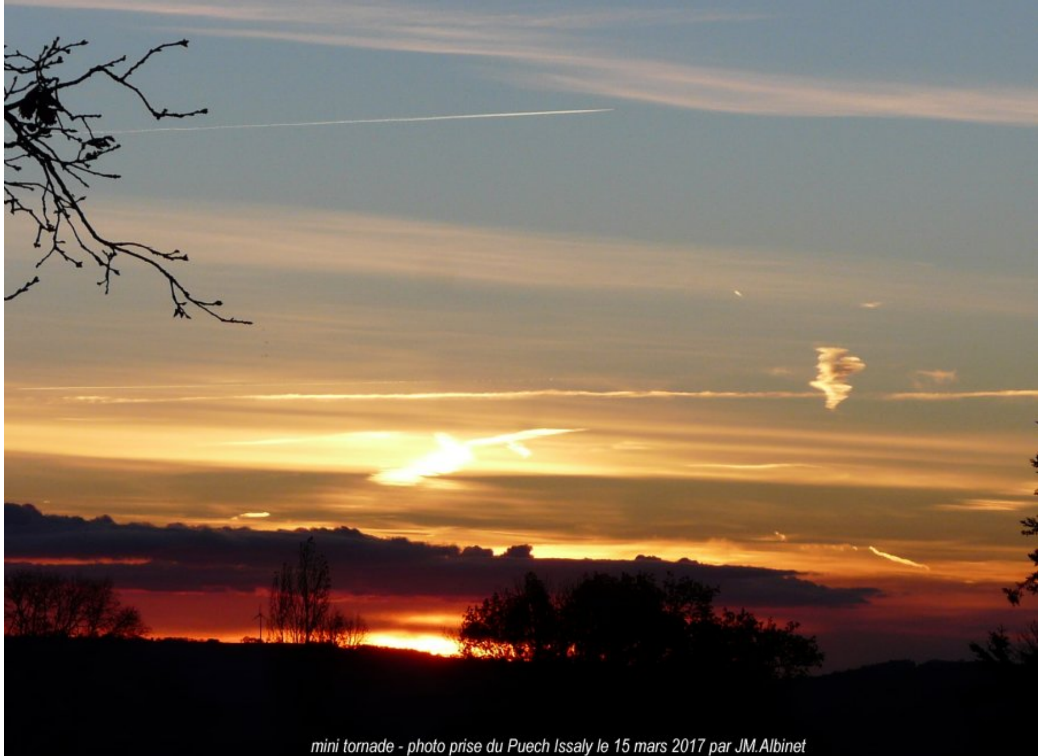
mini tornade - photo prise du Puech Issaly le 15 mars 2017