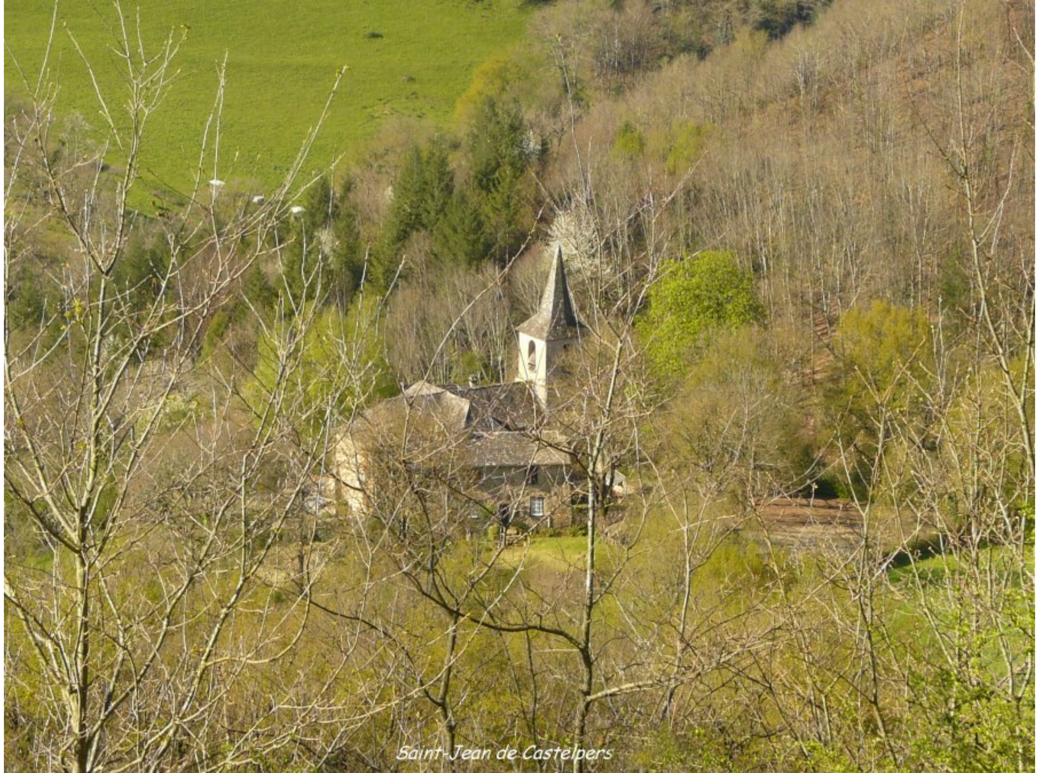
Saint-Jean de Castelpers