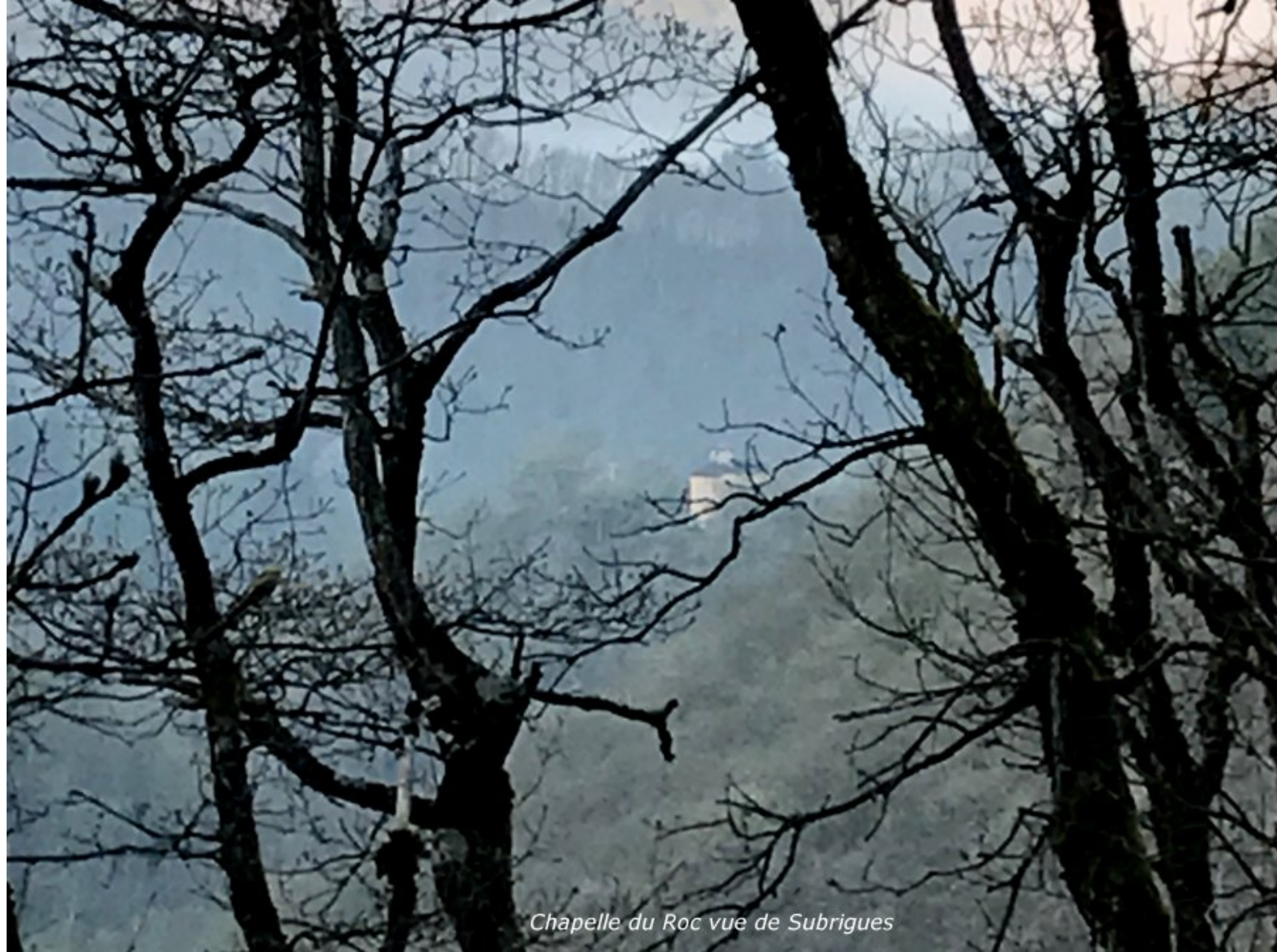
Chapelle du Roc vue de Subrigues