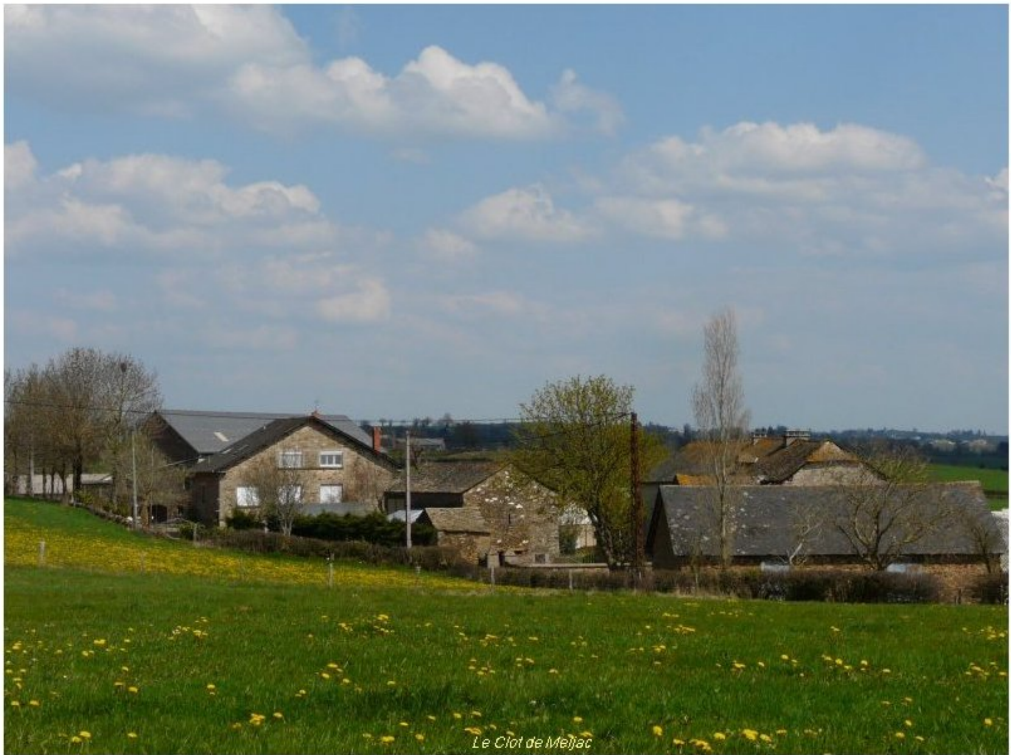
Le Clot de Meljac