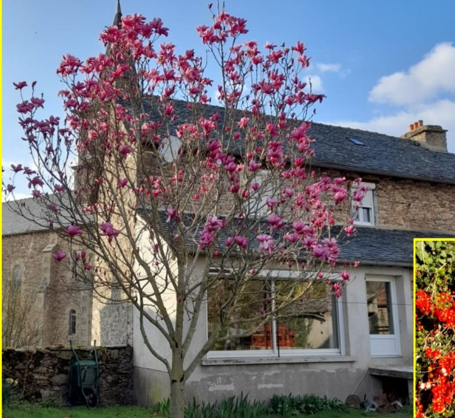
26 mars 2025

Printemps des magnolias et buissons ardents au bourg de Meljac.