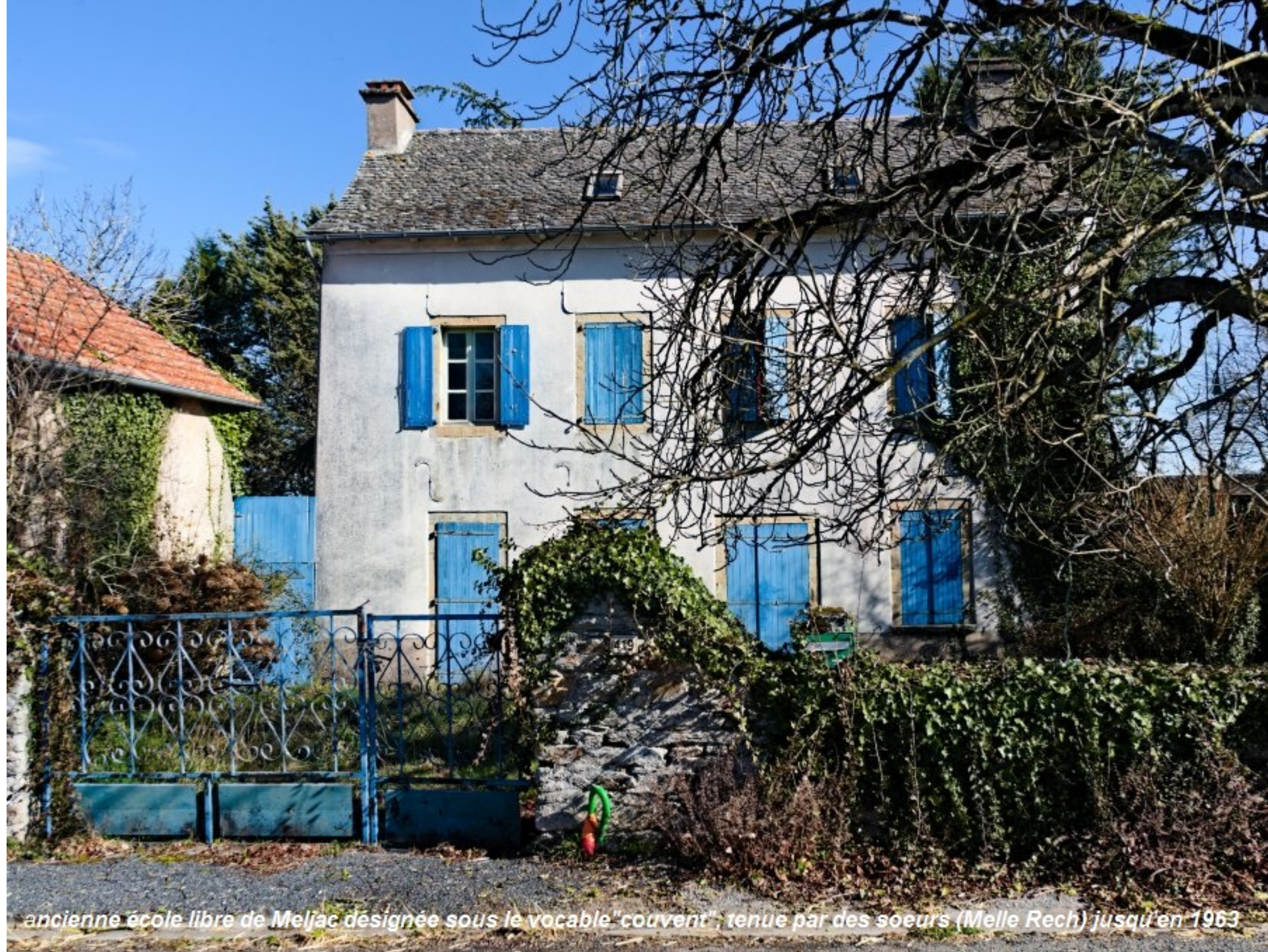
ancienne école libre de Meljac désignée sous le vocable "couvent", tenue par des soeurs (Melle Rech) jusqu'en 1963