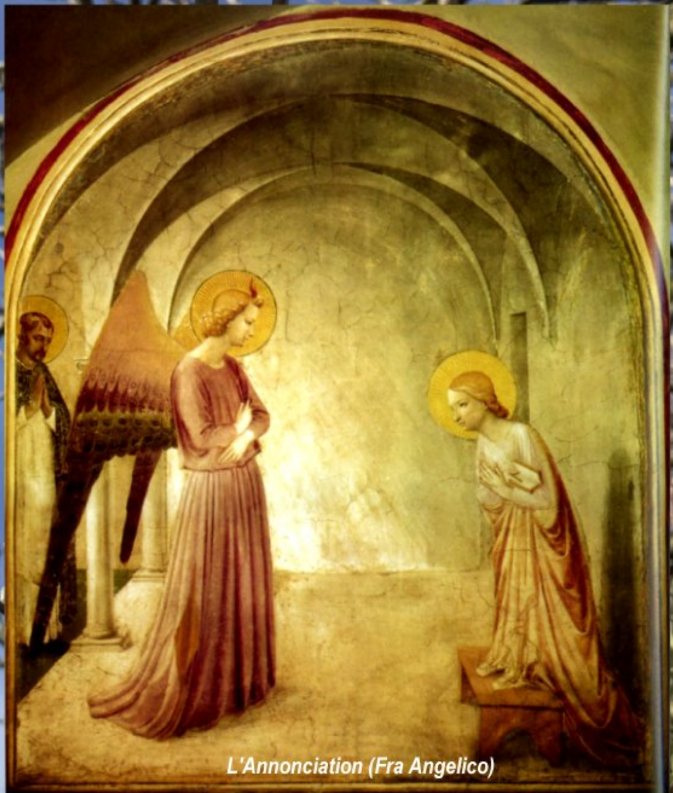
L'Annonciation (Fra Angelico)