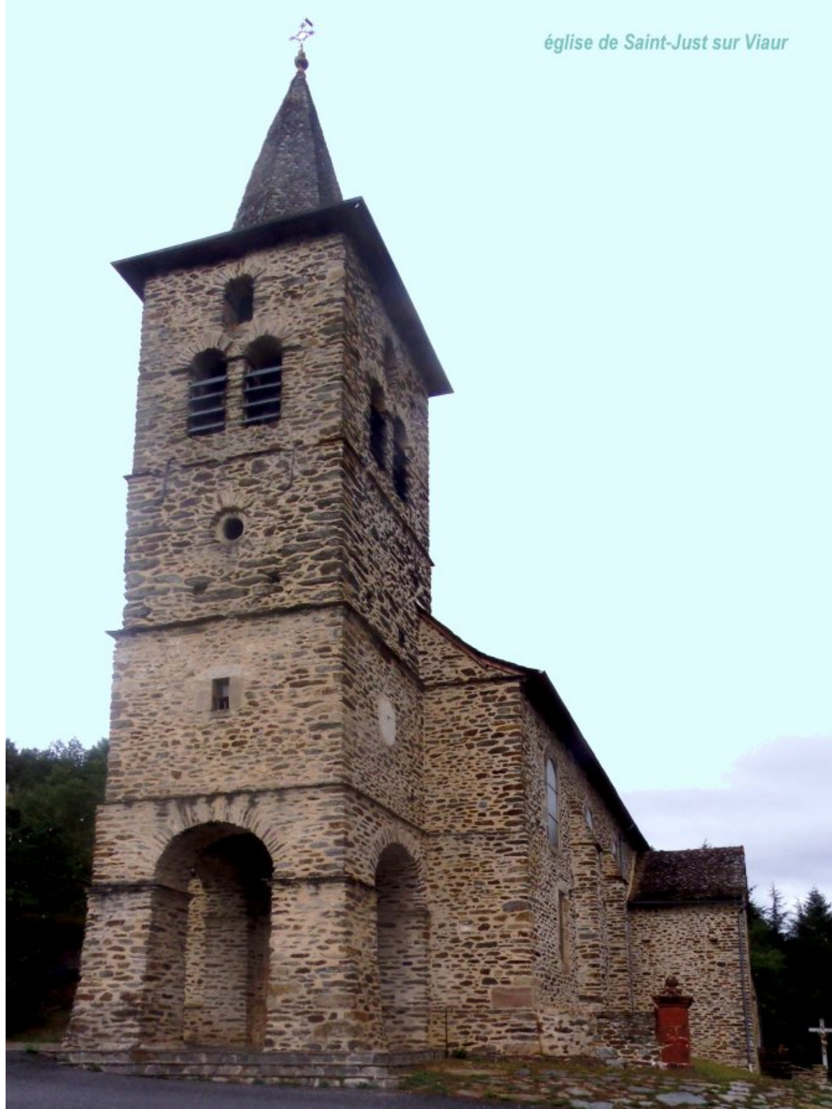
église de Saint-Just sur Viaur