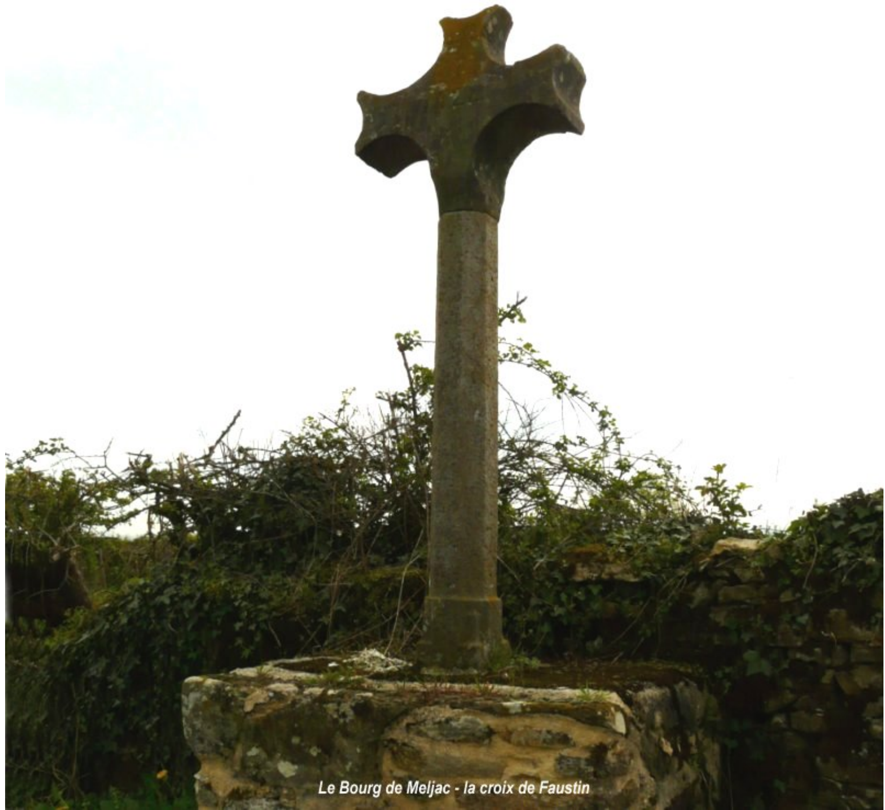
Le Bourg de Meljac - la croix de Faustin