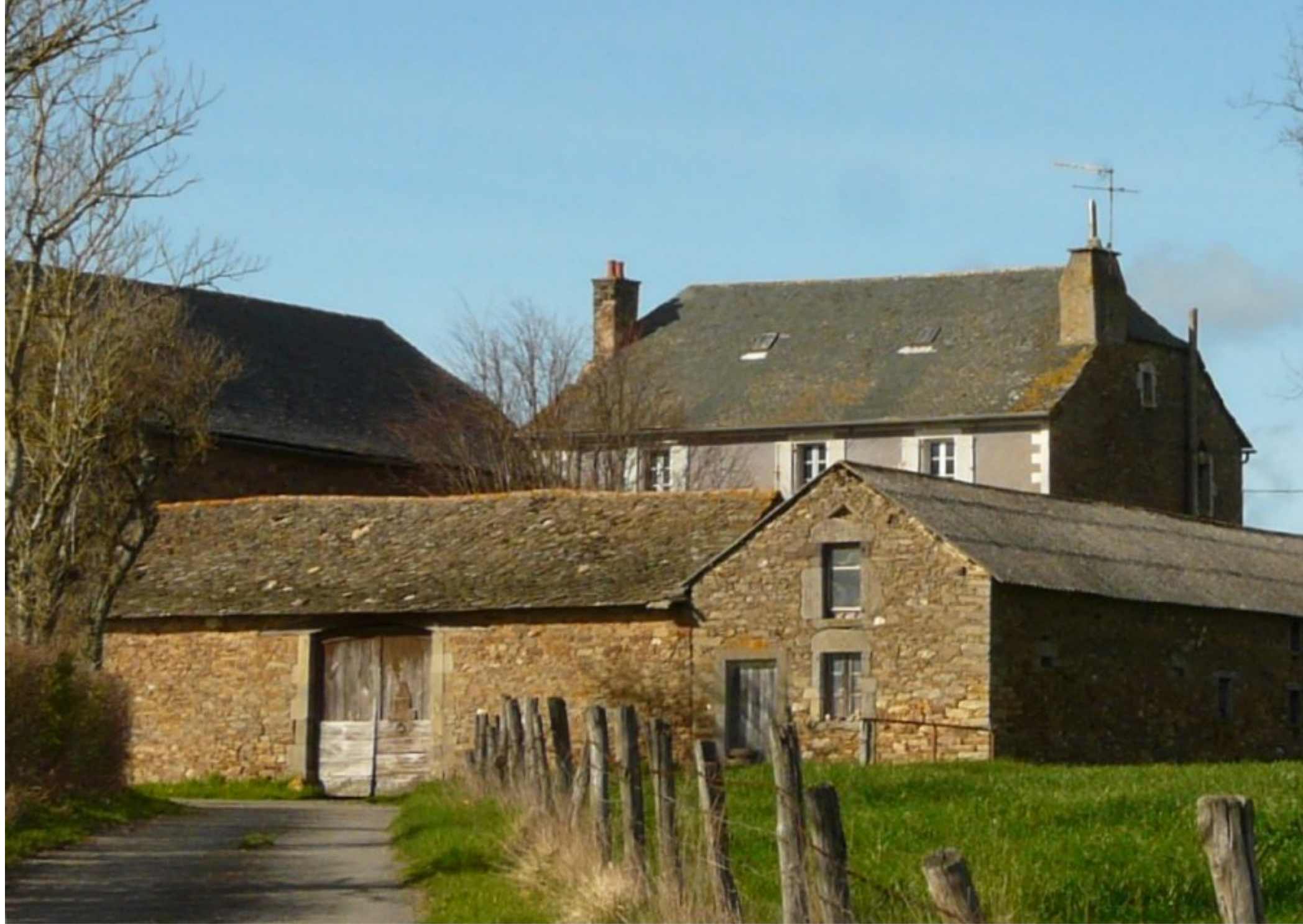
Ancienne ferme Albinet du Clot (inscrite à l'inventaire du petit patrimoine - architecture vernaculaire - photo 2016)