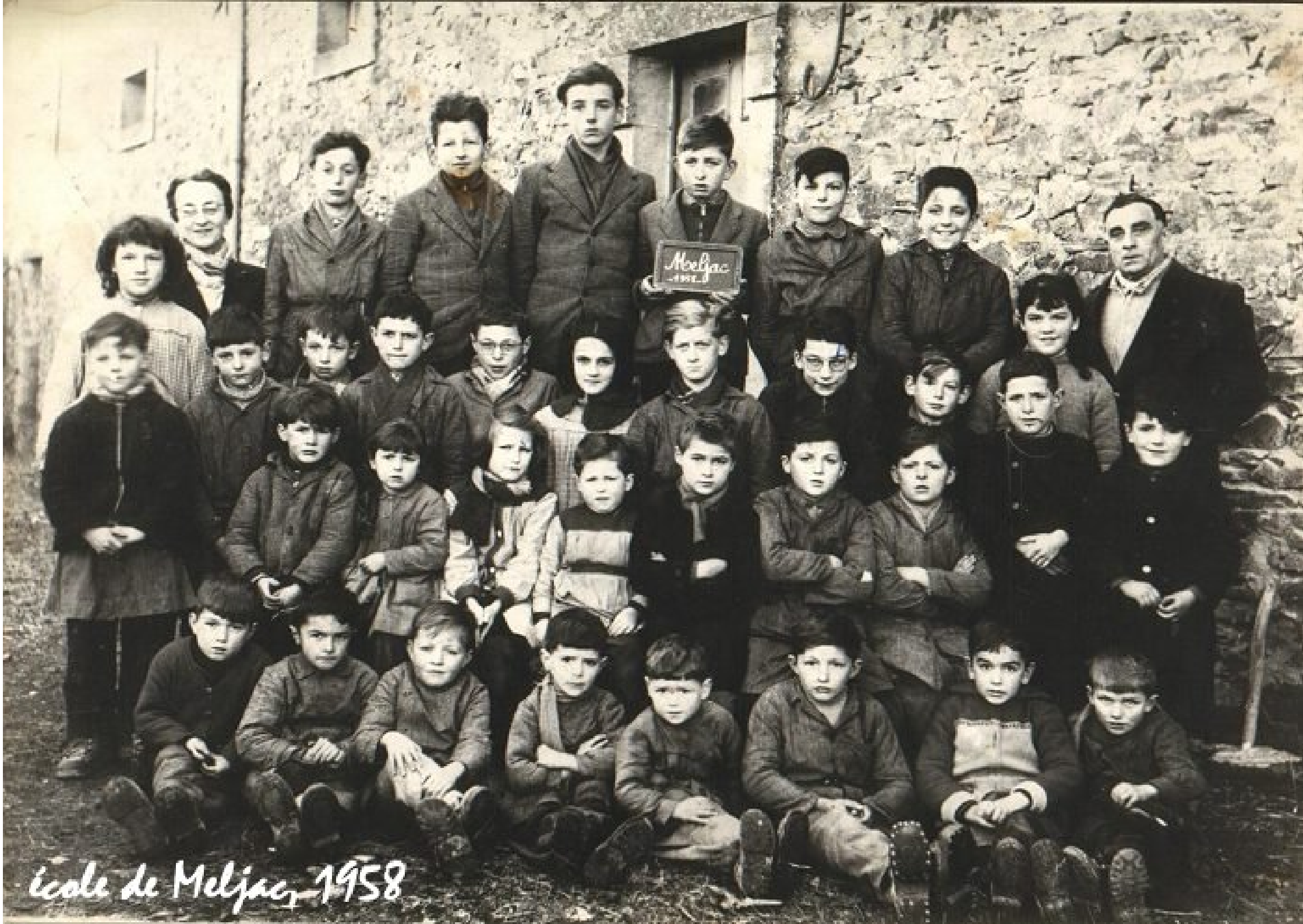
École de Meljac, 1958