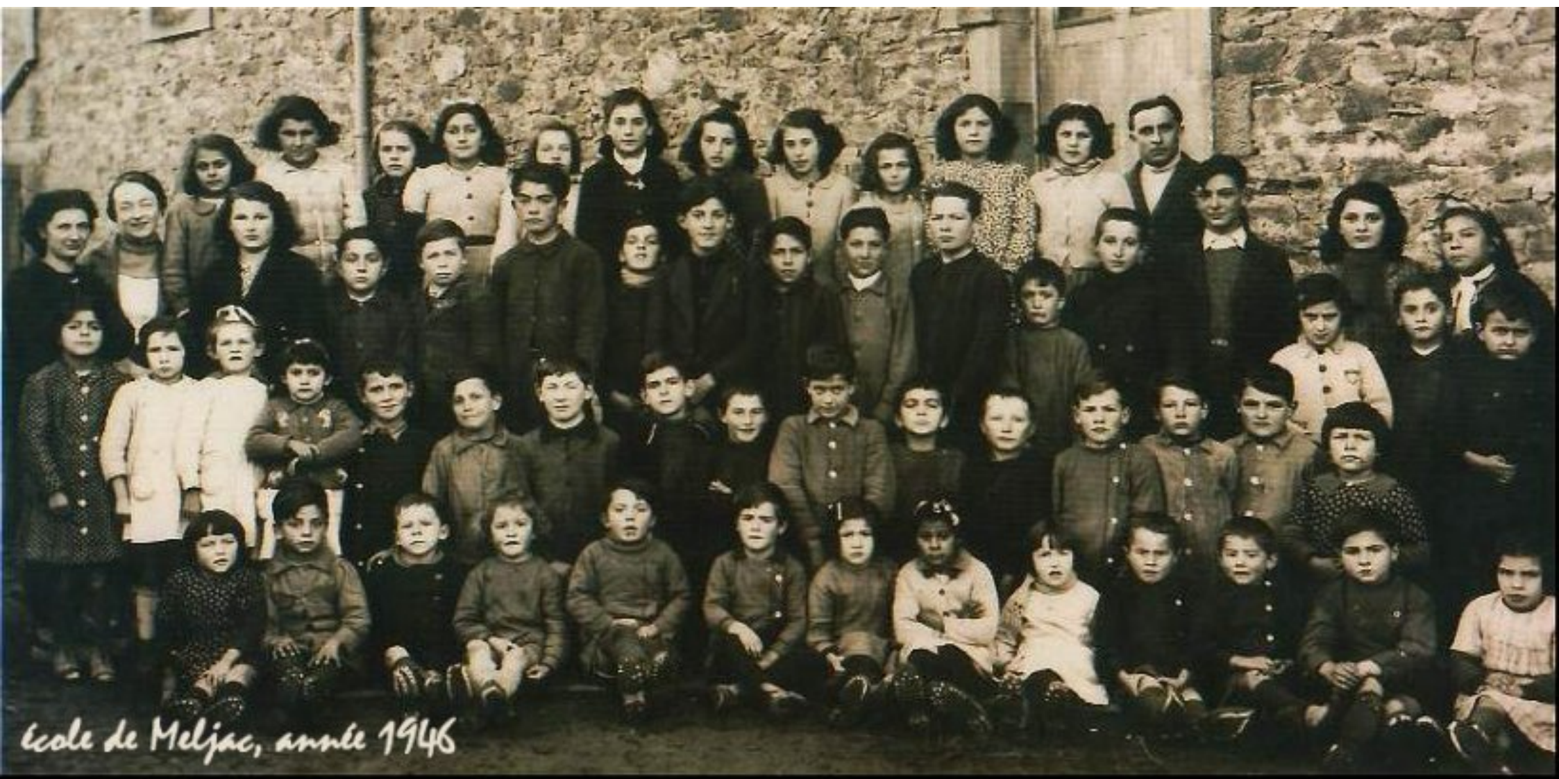
École de Meljac, année 1946