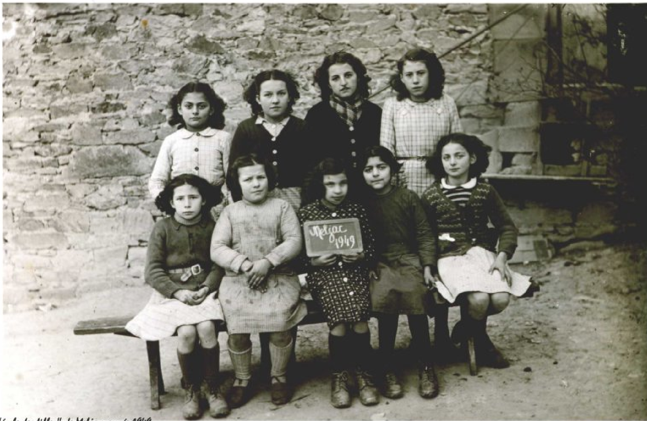
"école des filles" de Meljac, année 1949