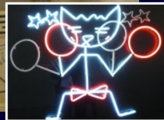
1998 Chat boxeur d'Alain Séchas