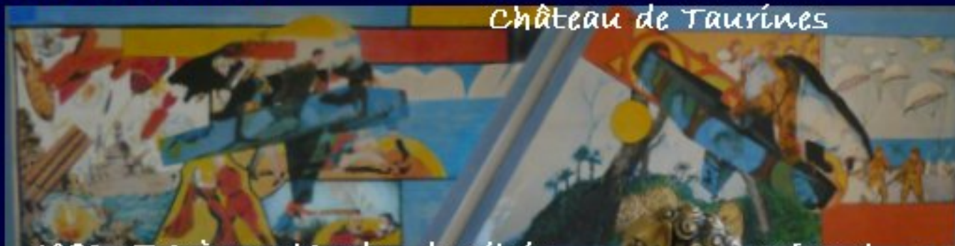
1986 - Trapèze rectangle de Silvie Rouge-jaune-bleu-ours blanc-cercle jaune