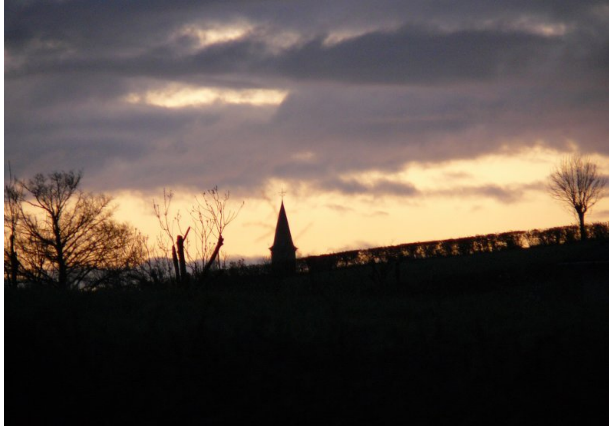
lever du jour - 6H48- sur le clocher de Meljac vu du Martinesq -13 avril 2008