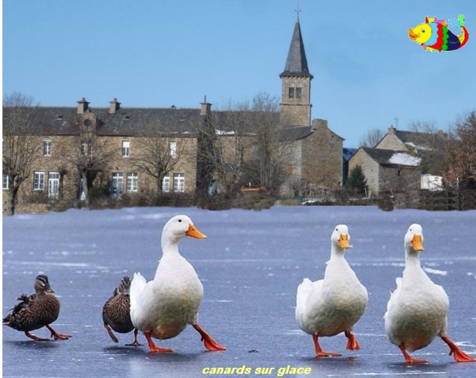
canards sur glace