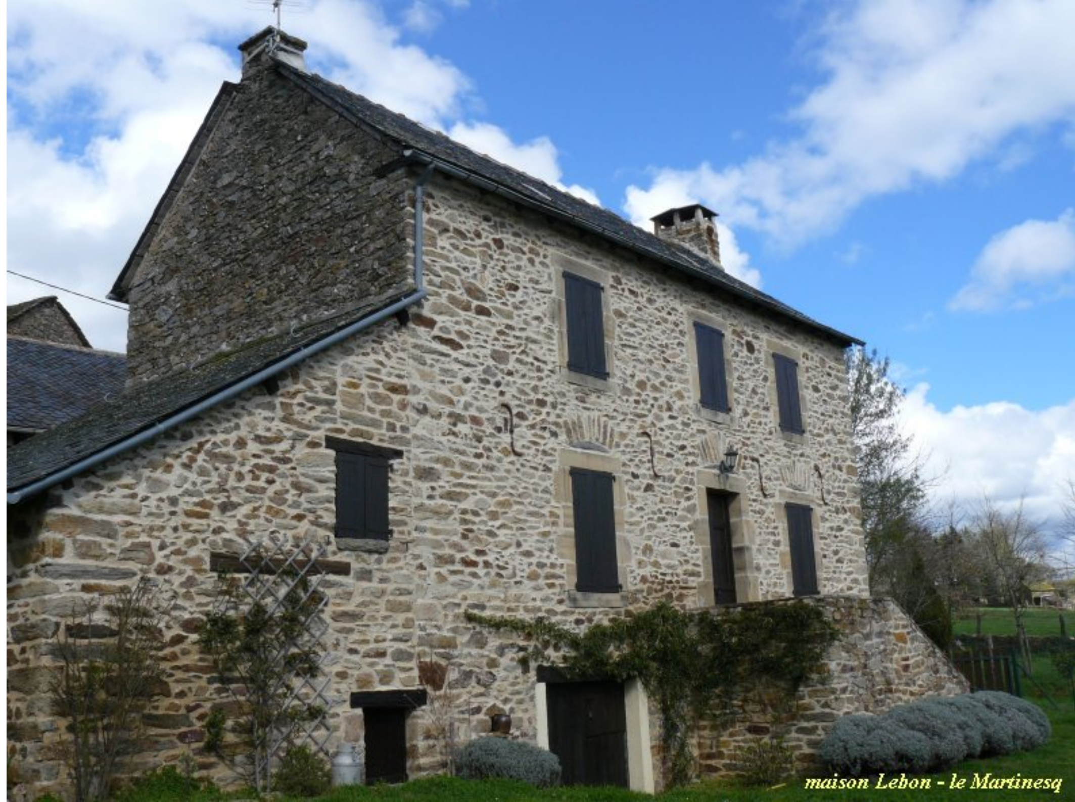
maison Lebon - le Martinesq