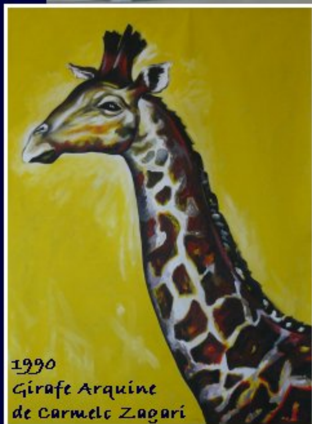
1990 Girafe Arquine de Carmelo Zagari

oeuvres contemporaines de la collection des Abattoirs