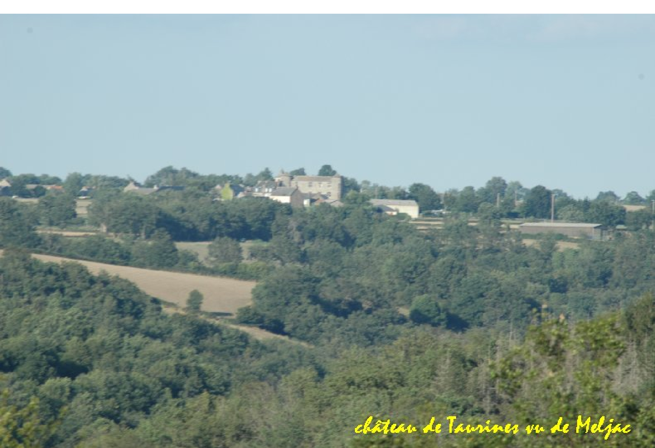
château de Taurines vu de Meljac