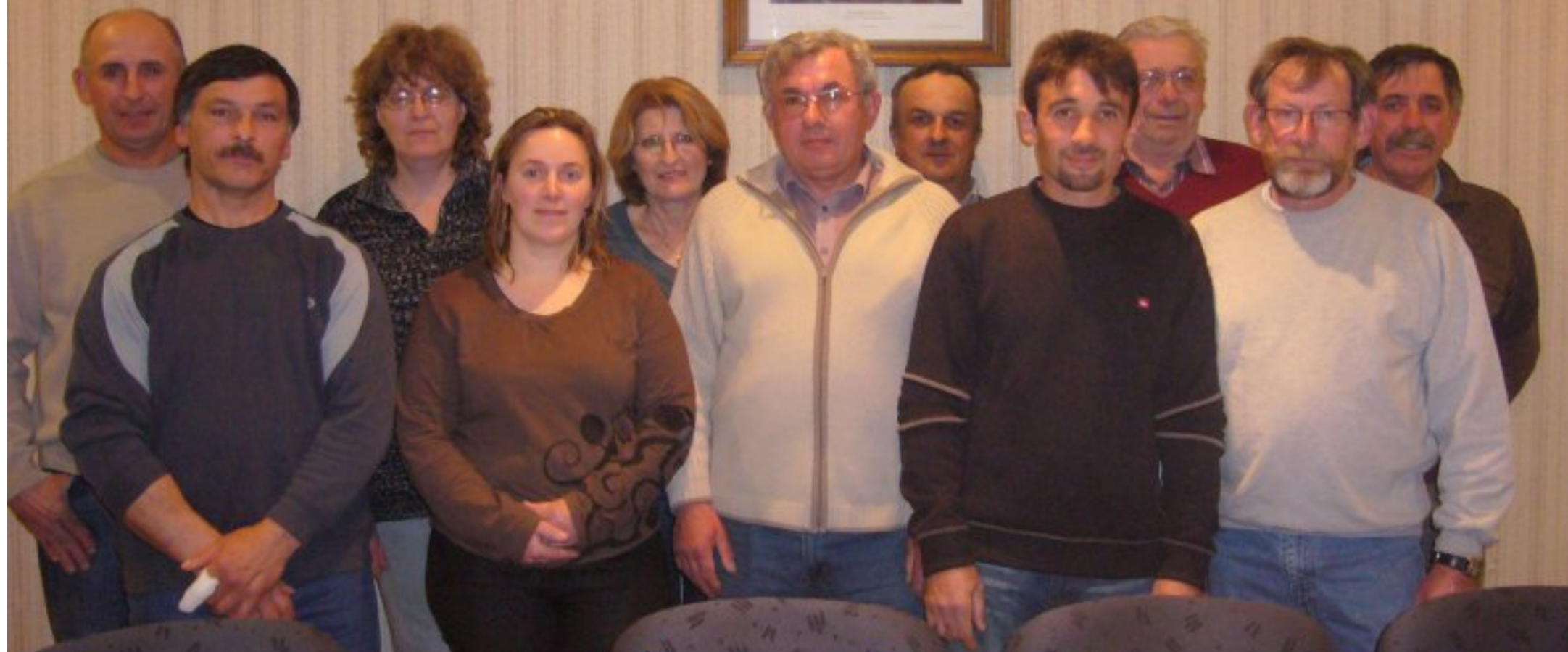
Conseil Municipal de Meljac - 2008 - de gauche à droite