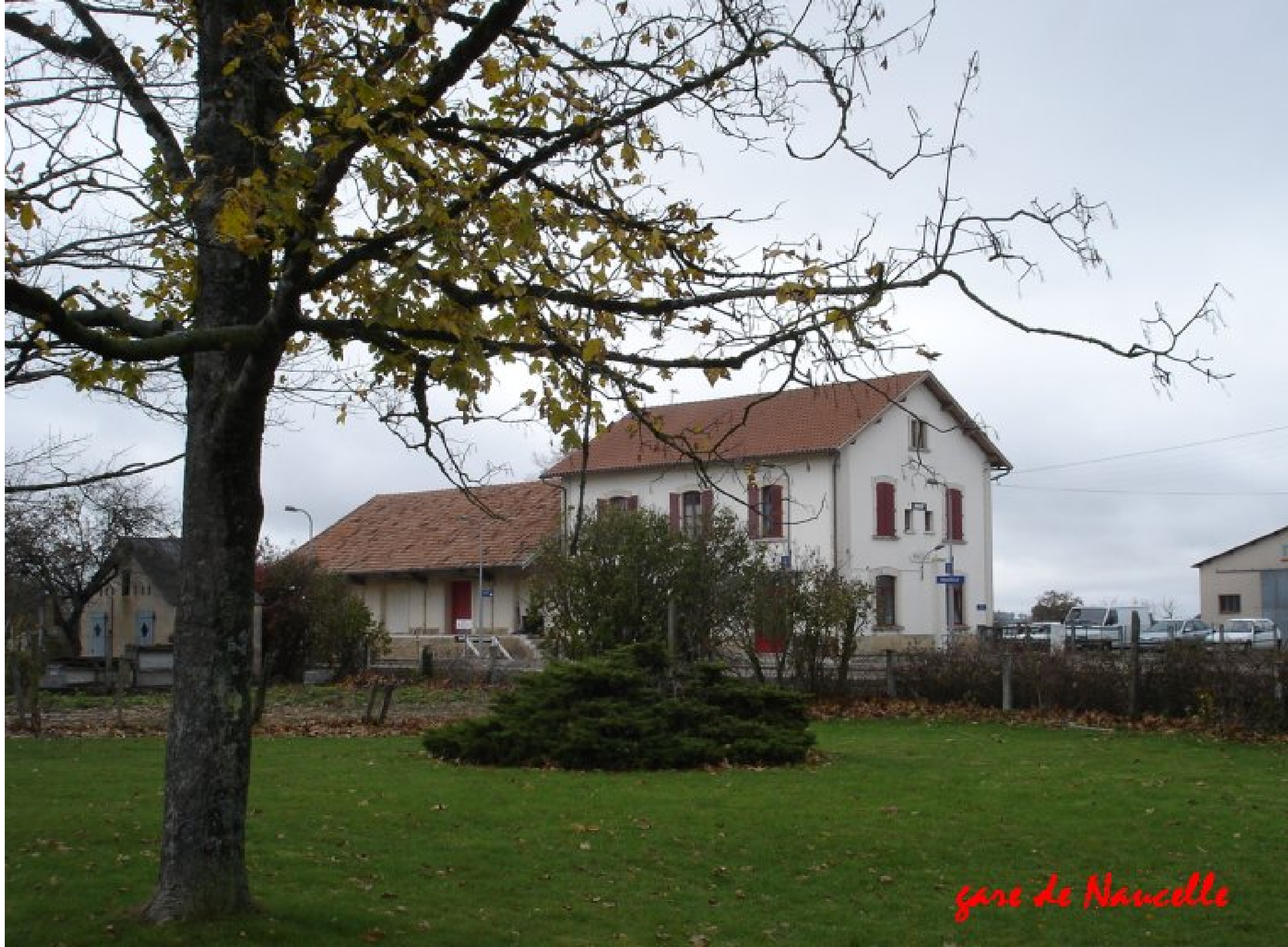
gare de Nancelle