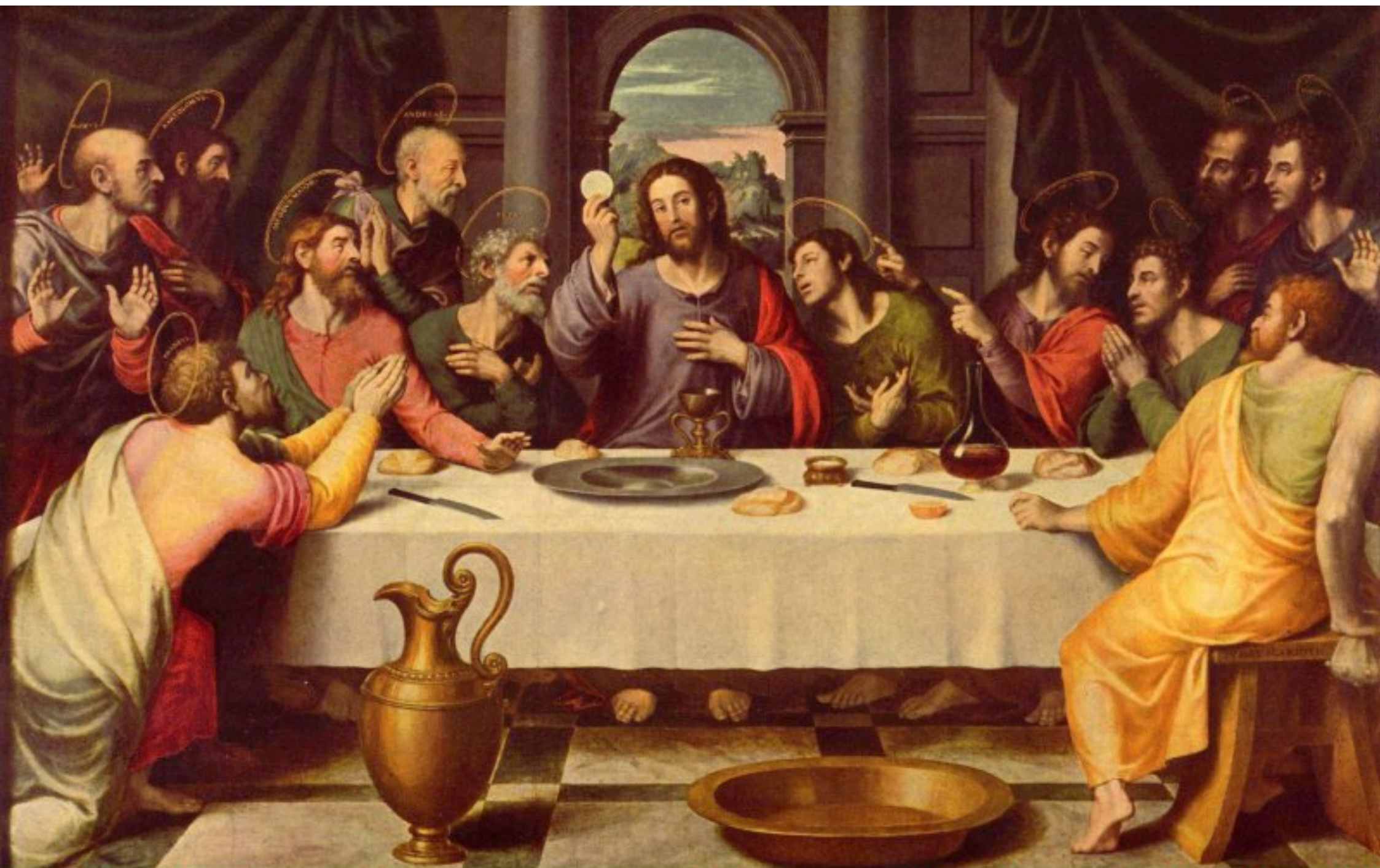
La Cène de Juan de Juanes, peintre de la Renaissance (musée du Prado - Madrid)