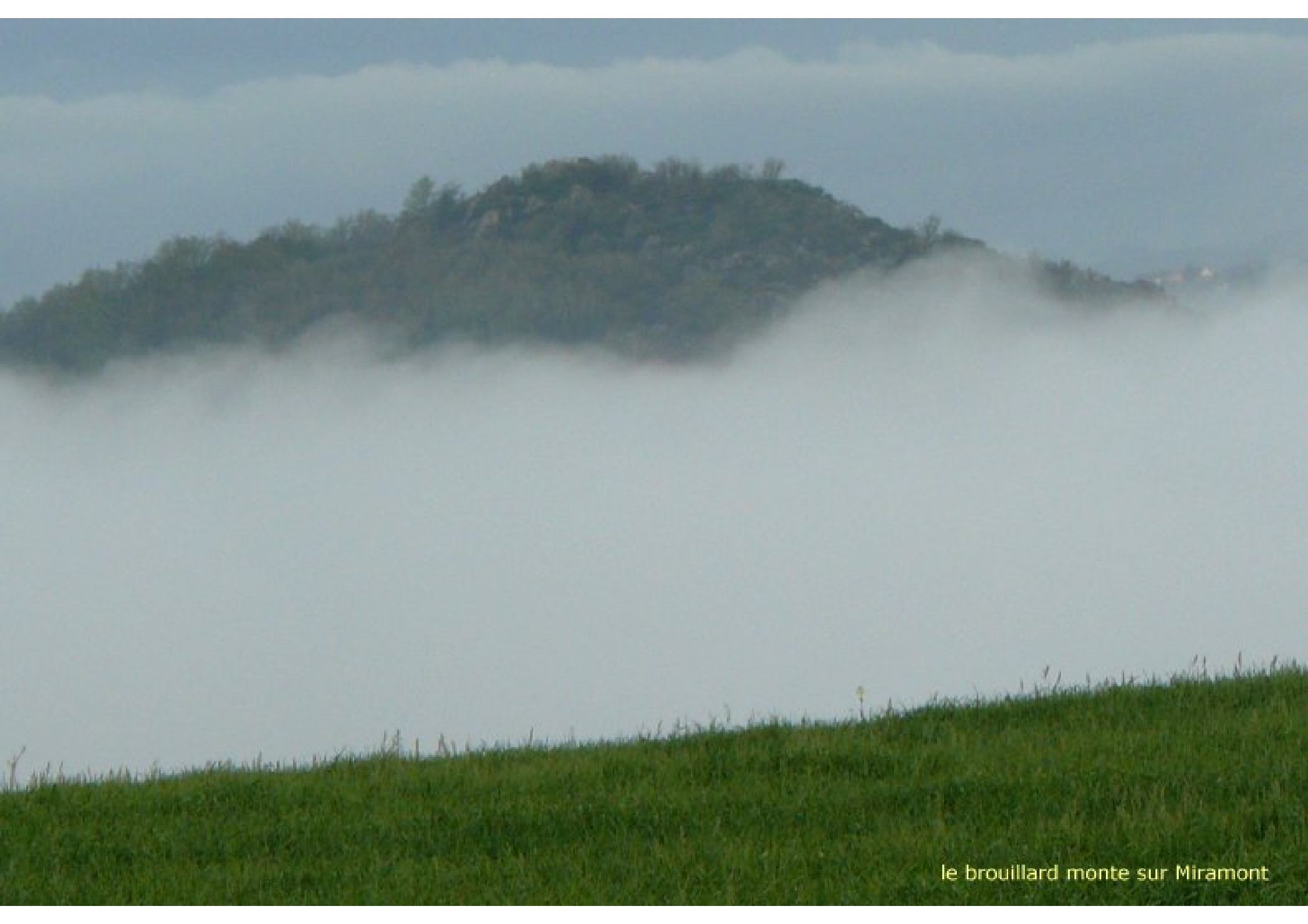
le brouillard monte sur Miramont