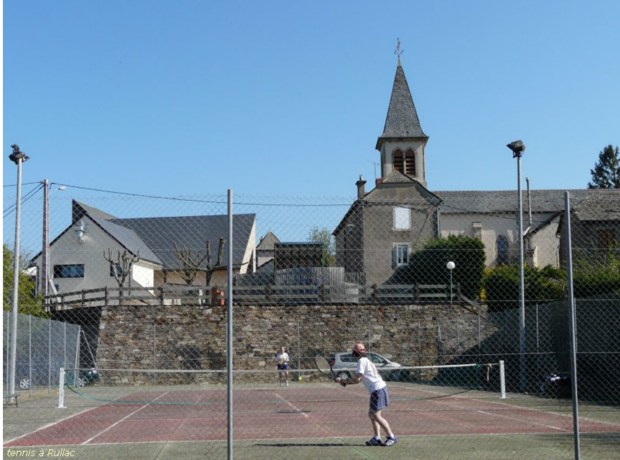
tennis à Rullac