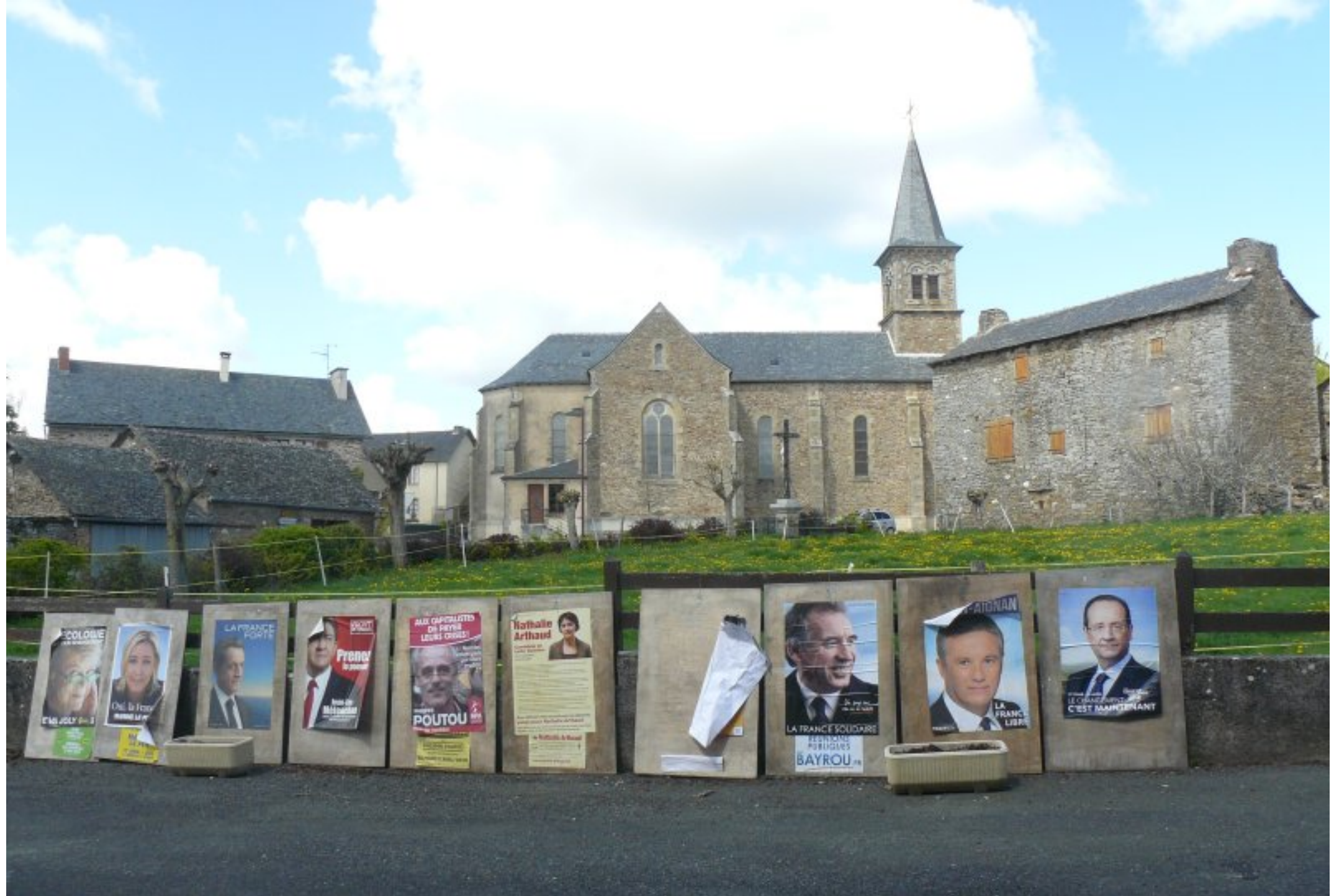
Elections présidentielles: affichage meljacois...comme si le vent avait commencé à faire des choix...