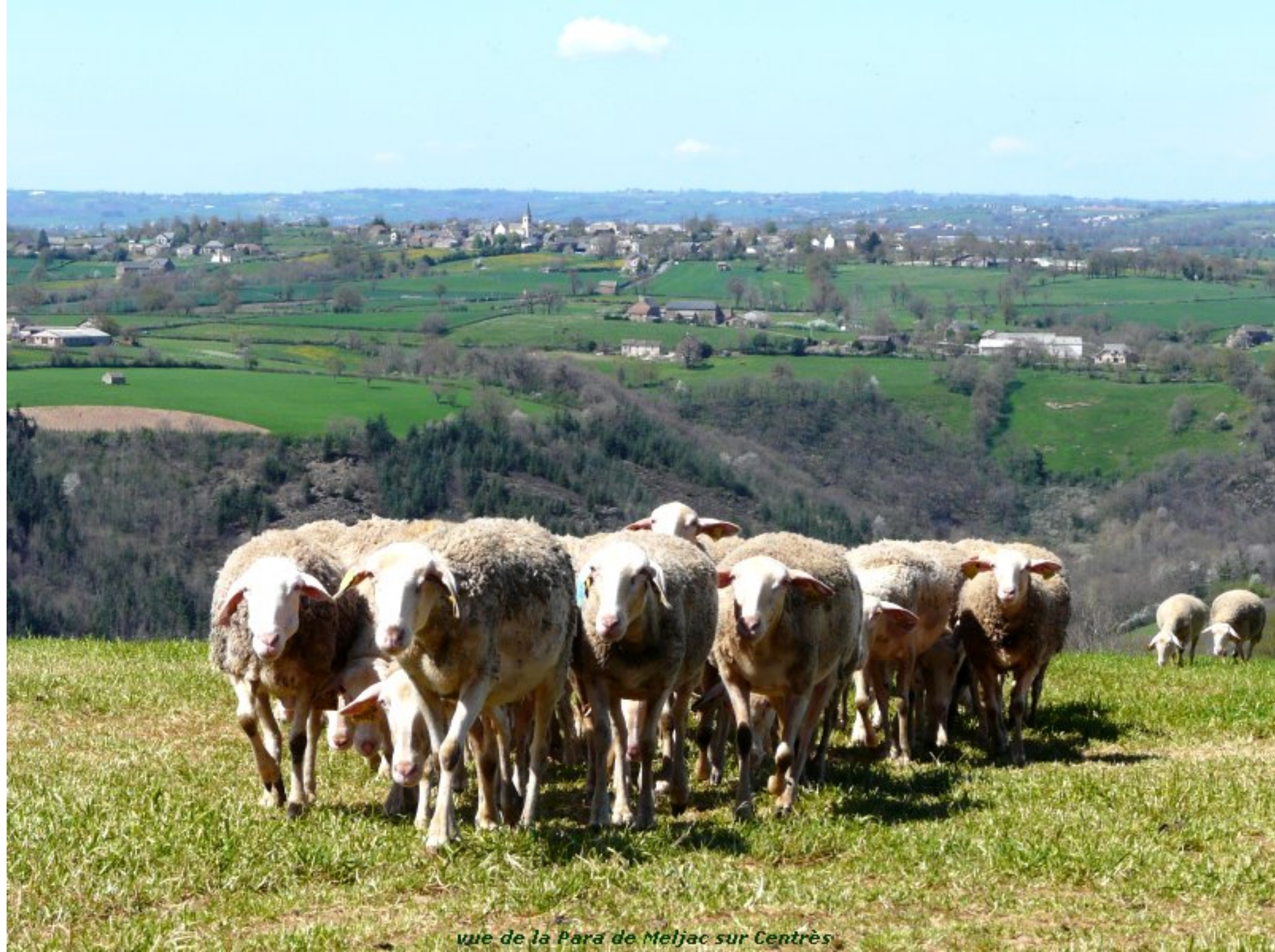
vue de la Para de Meljac sur Centrès