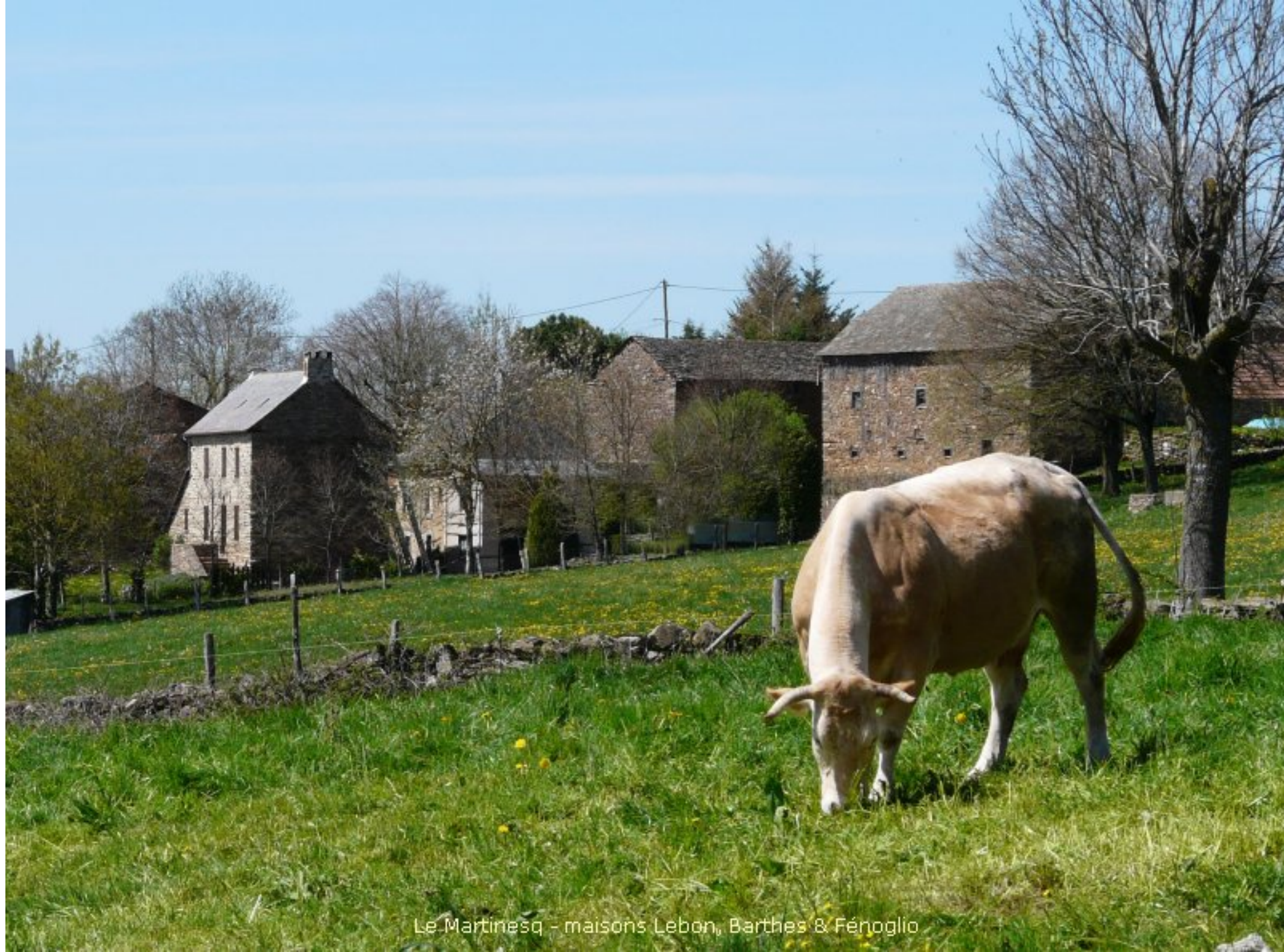
Le Martinesq - maisons Lebon, Barthes & Fénoglio