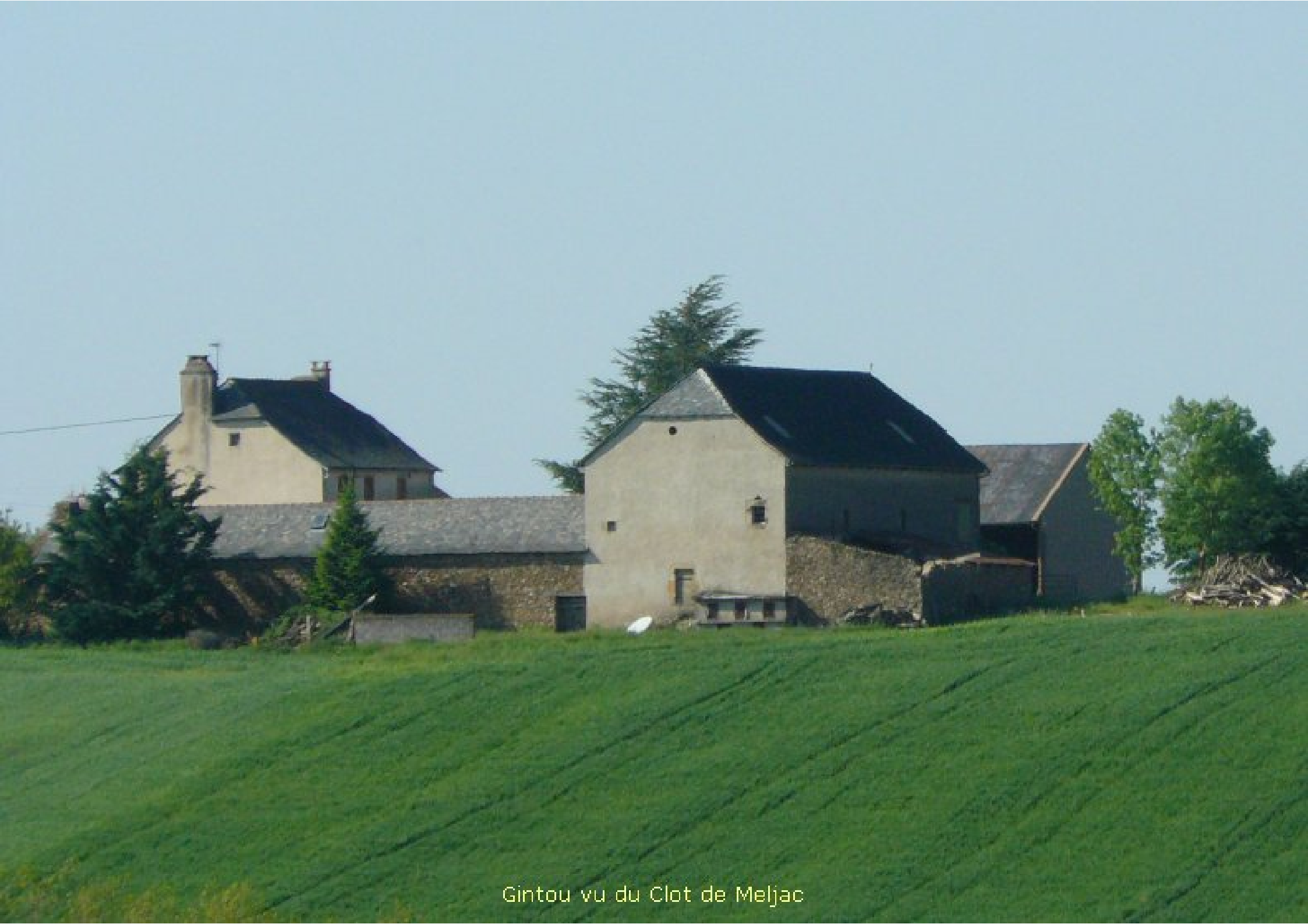
Gintou vu du Clot de Meljac