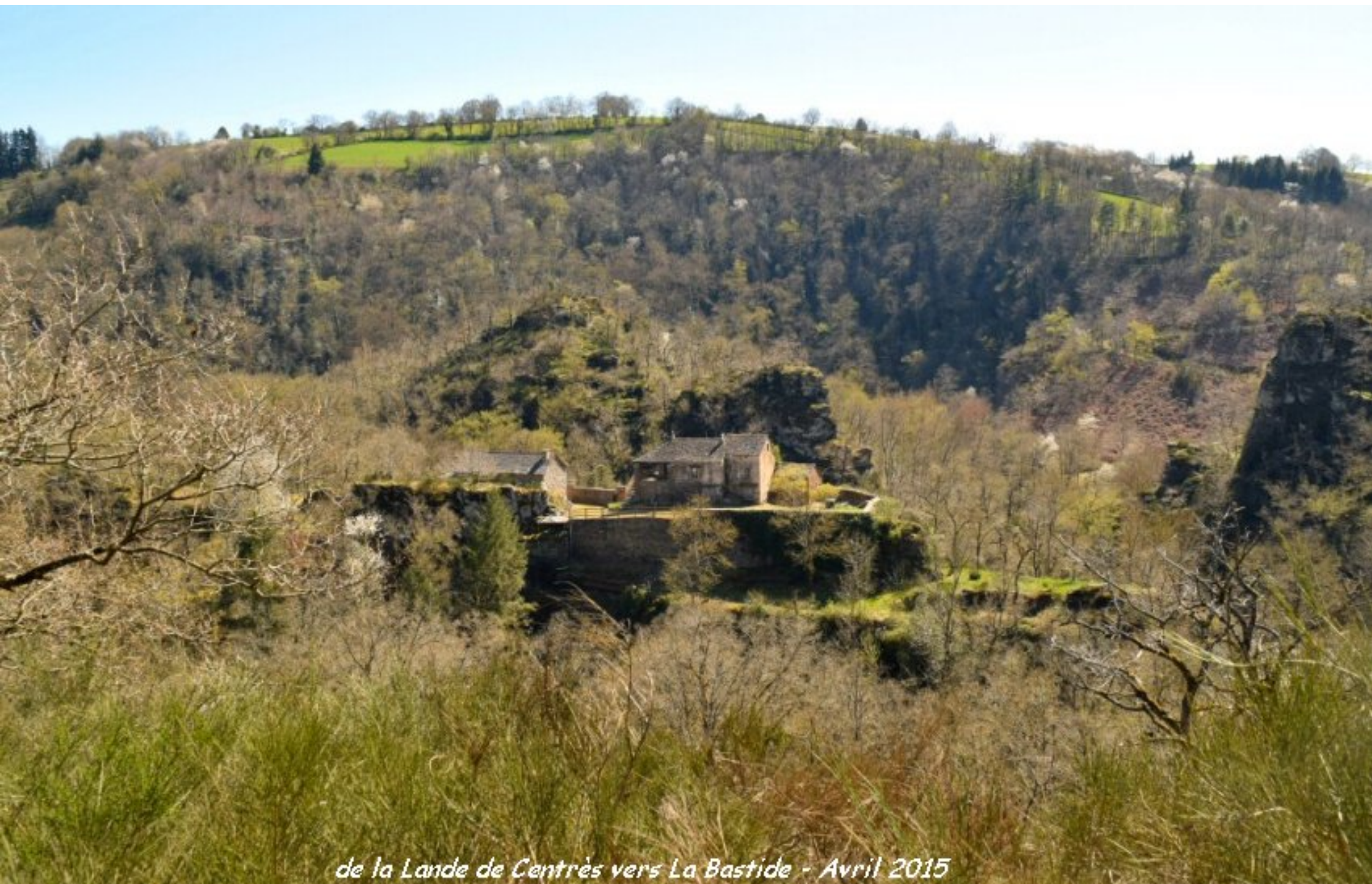
de la Lande de Centrès vers La Bastide - Avril 2015