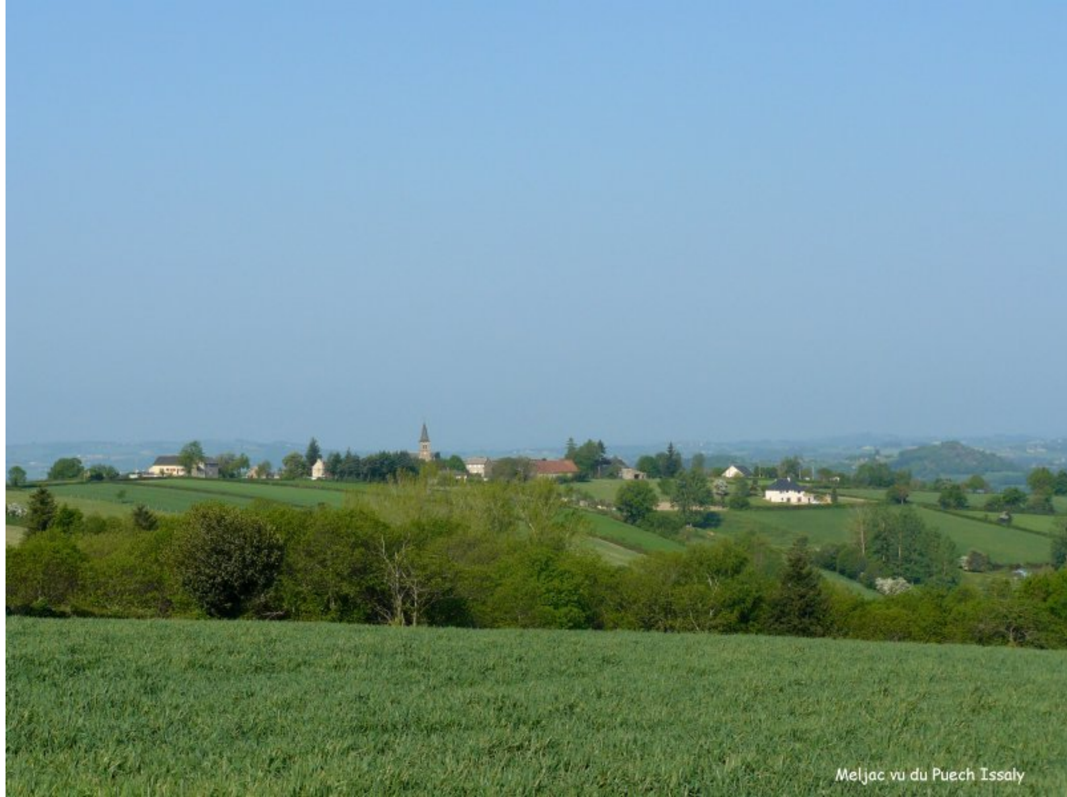
Meljac vu du Puech Issaly