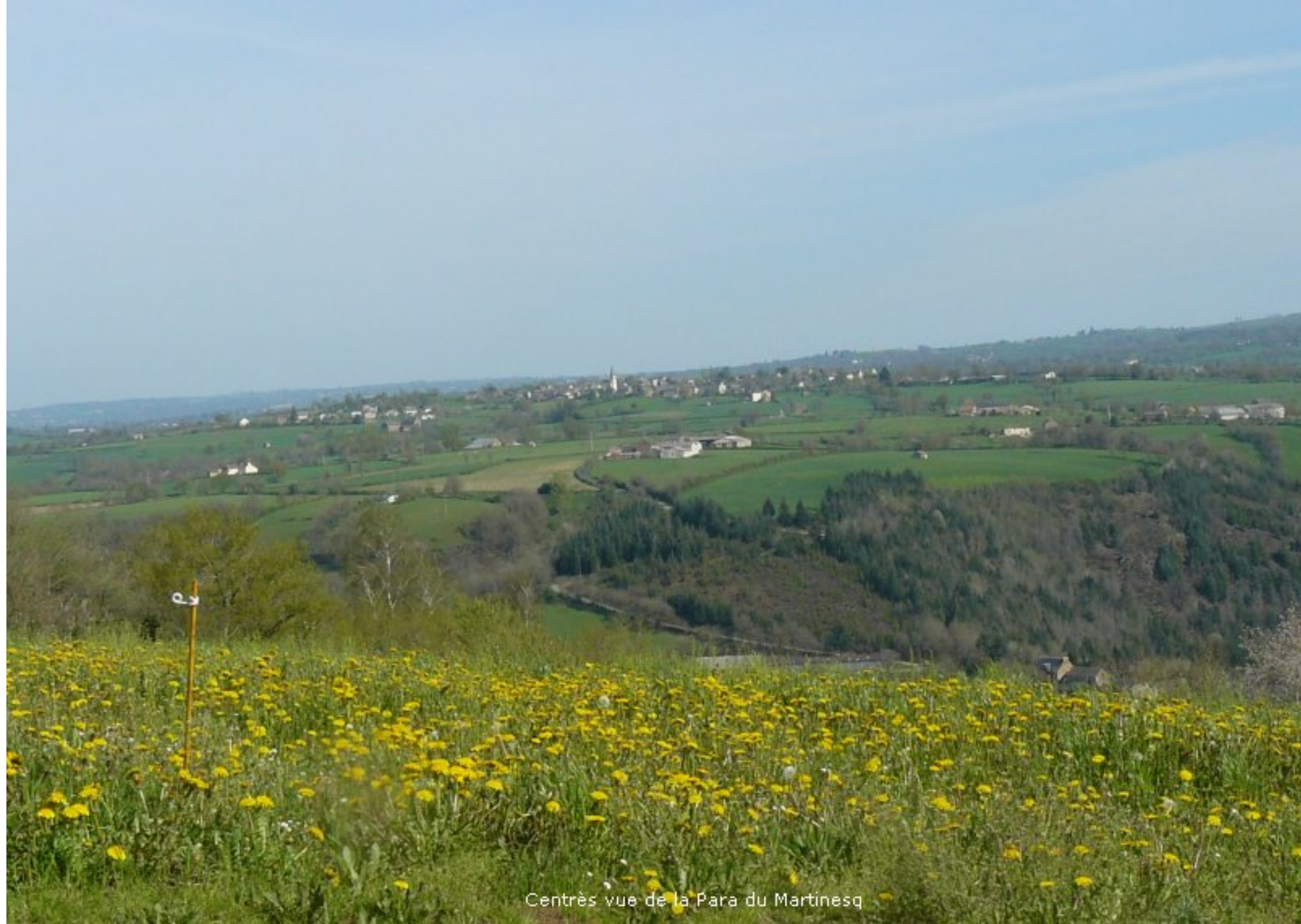
Centrès vue de la Para du Martinesq