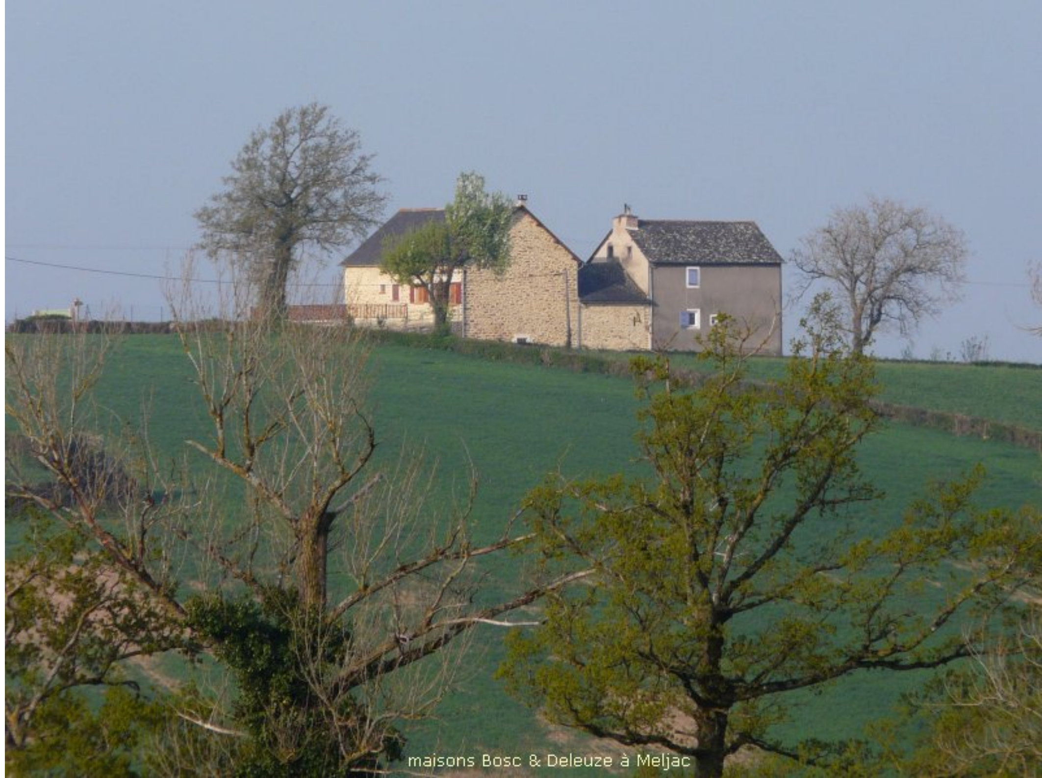
maisons Bosc & Deleuze à Meljac