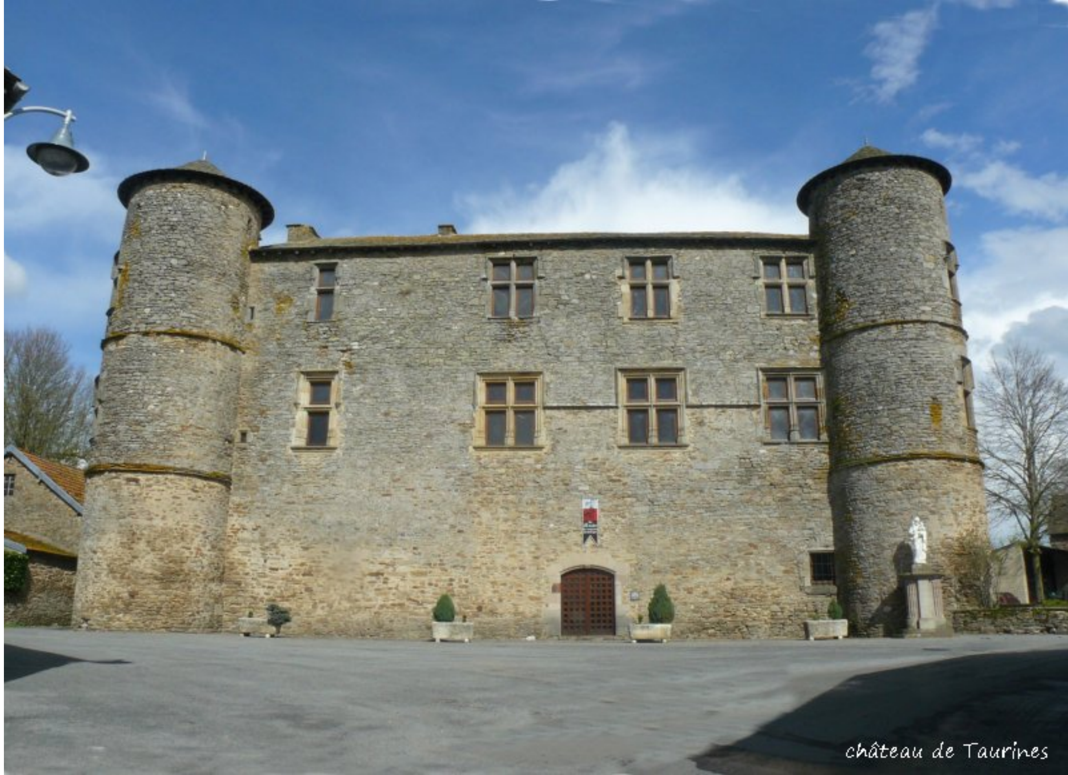
château de Taurines