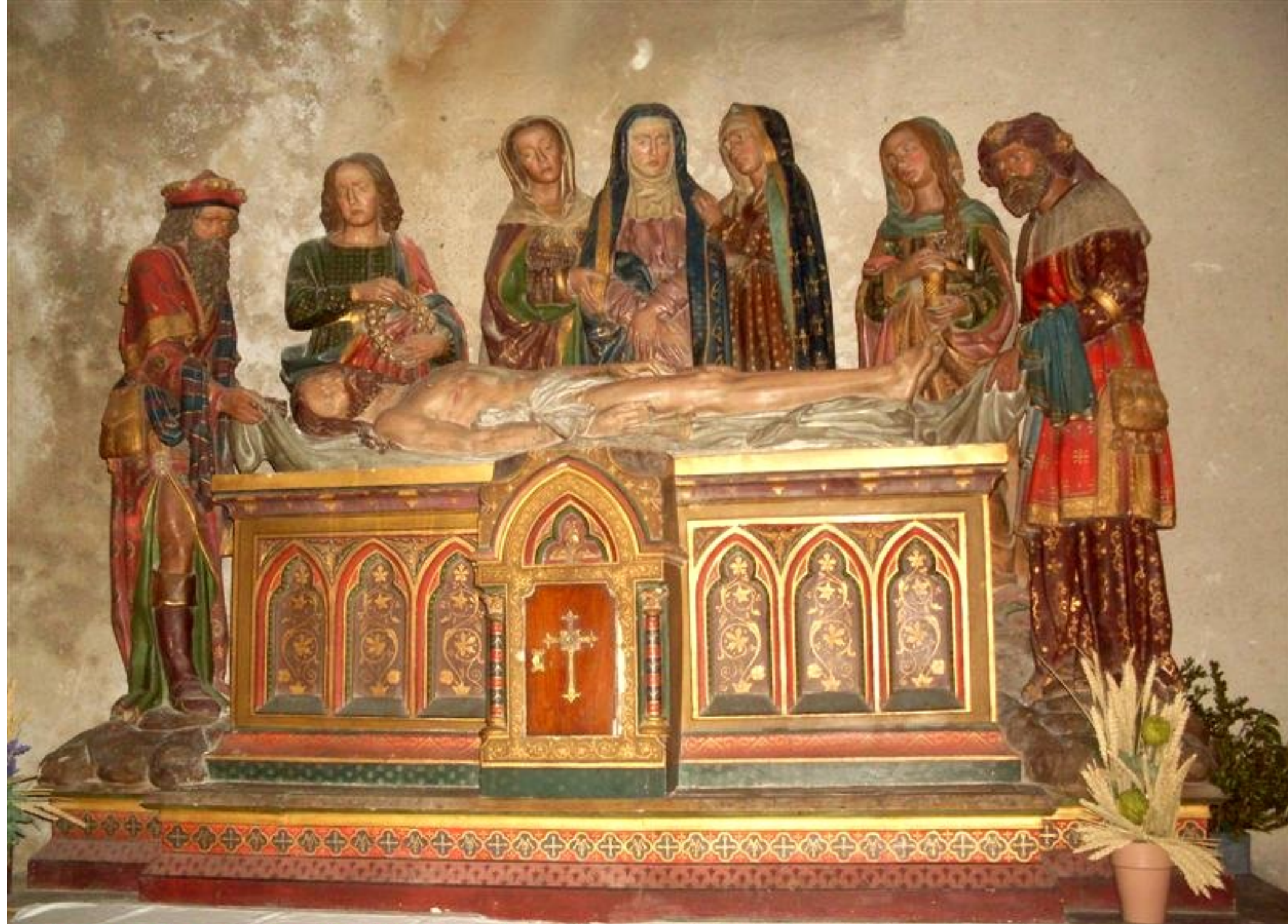
mise au tombeau - église Saint Voluzien à Foix (sortie en Ariège des Aînés de Meljac 22.05.2013)