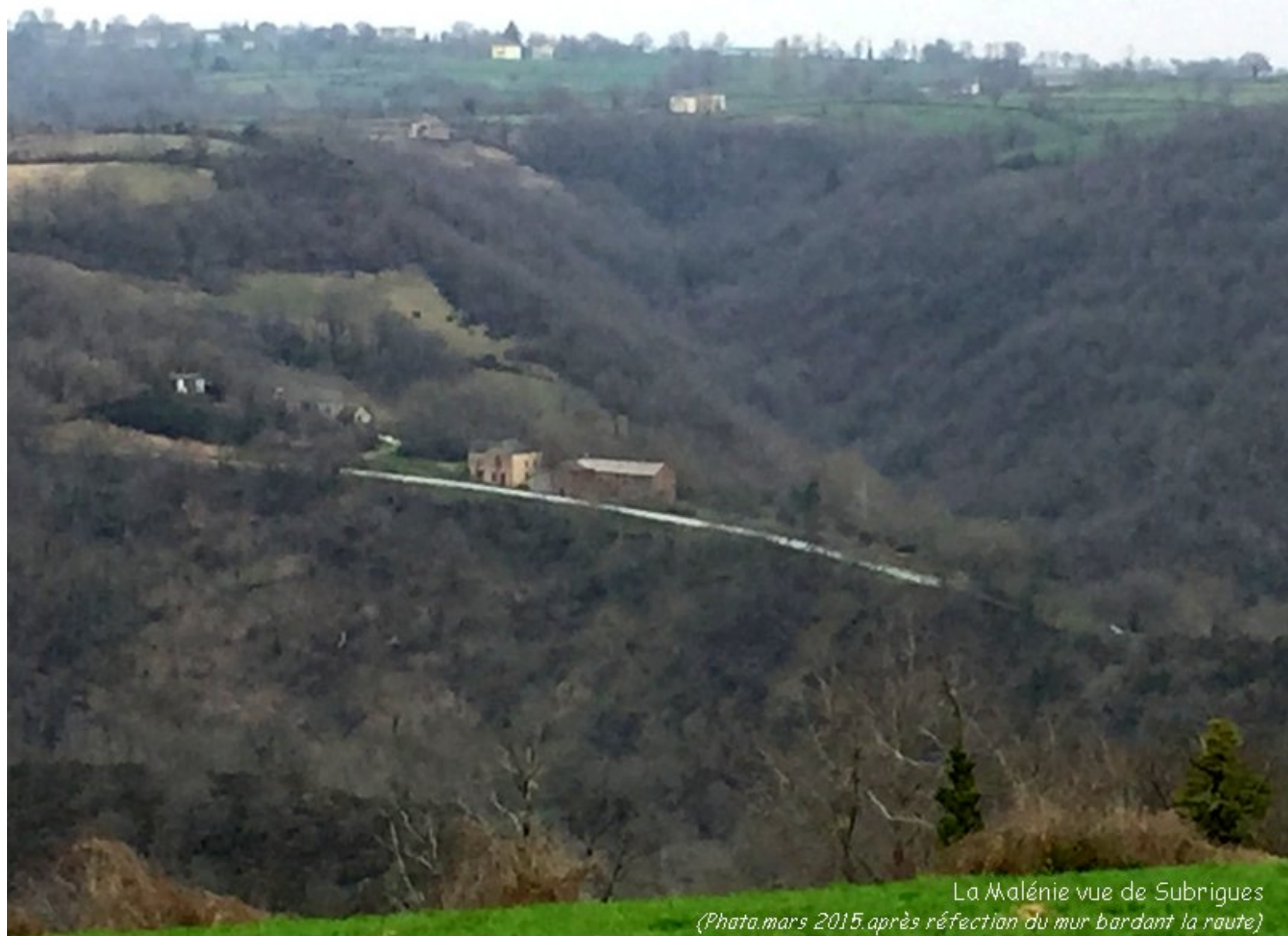
La Malénie vue de Subrigues (Photo.mars 2015.après réfection du mur bardant la route)