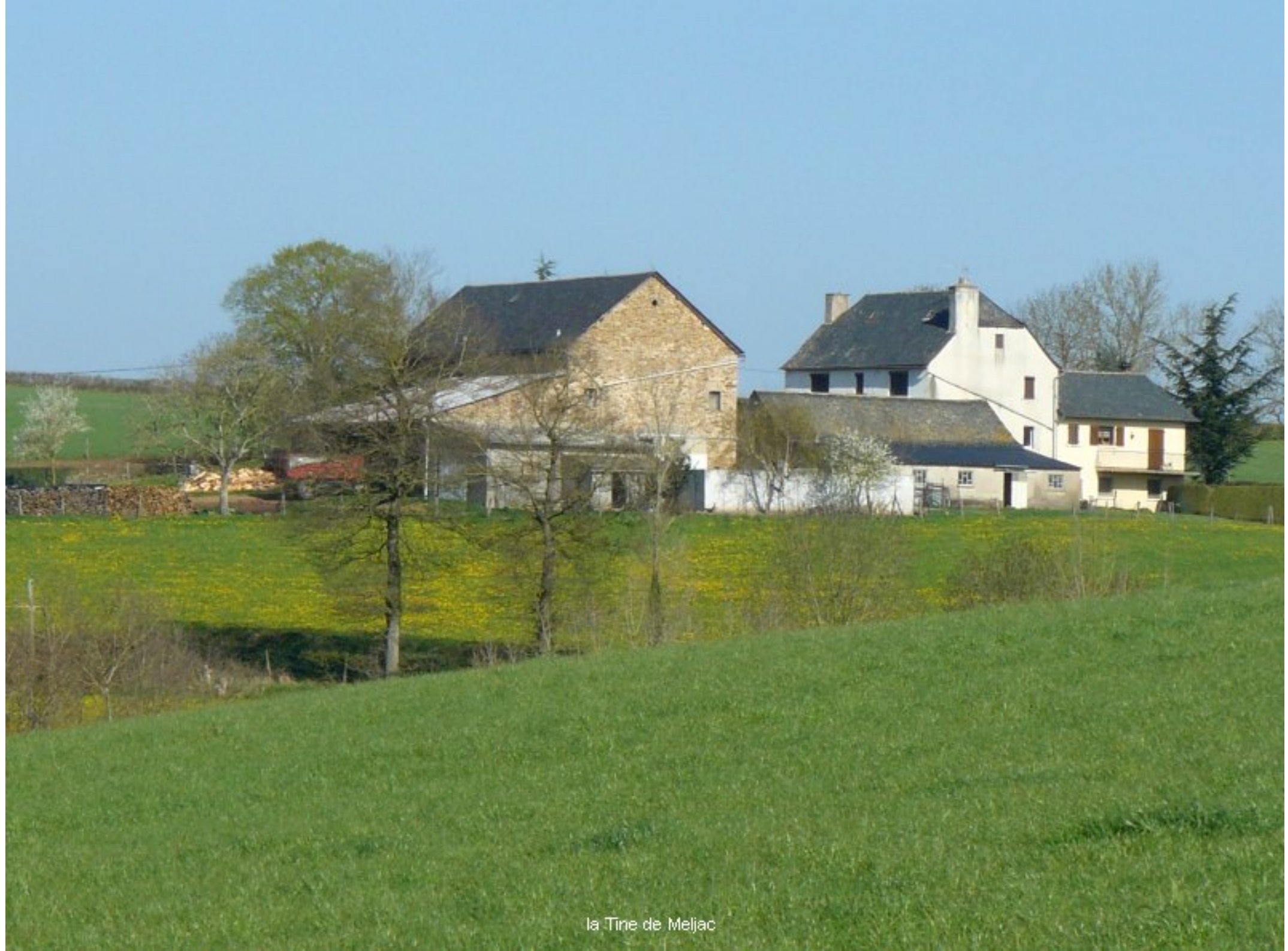
la Tine de Meljac