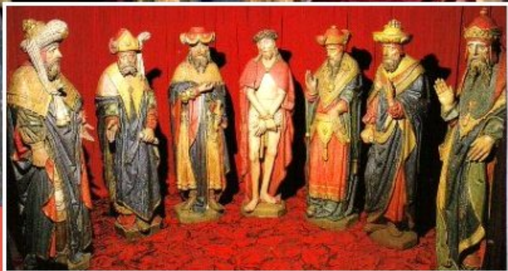
Eglise Saint-Salvy - Albi Le Christ en jugement devant le tribunal du Sanhédrin (personnages en bois polychrome)