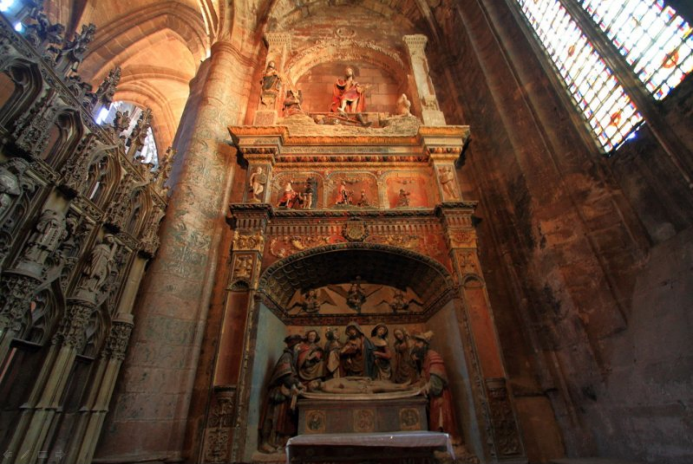
Chapelle de la Cathédrale de Rodez - Mise au tombeau datée de 1523 mêlant les styles gothique et Renaissance