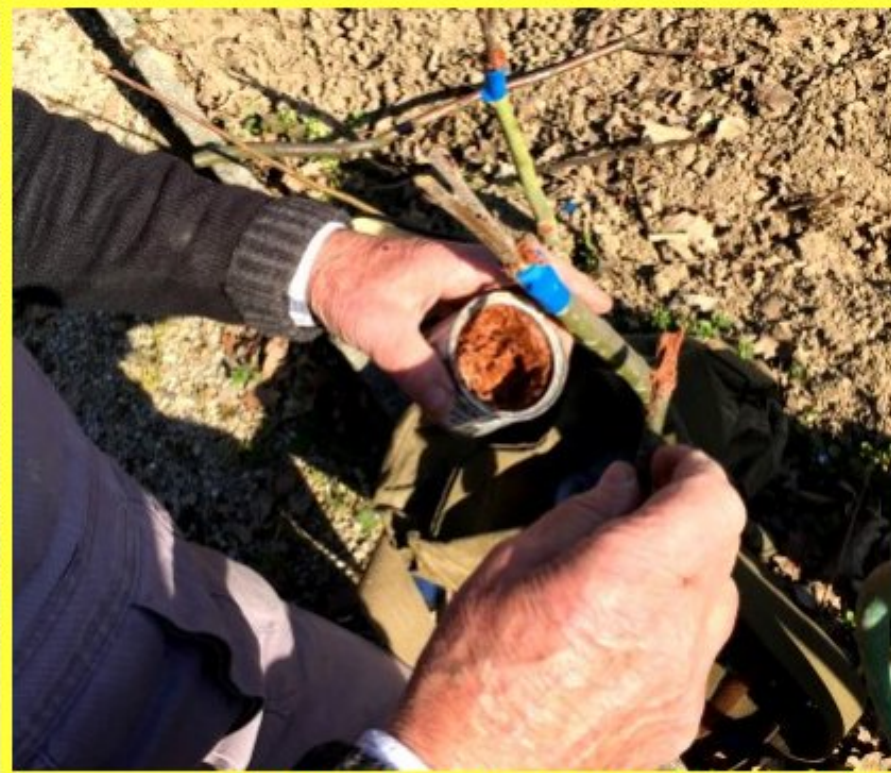
greffe du châtaignier - photos 15 mars 2015