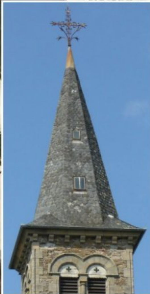
église de Meljac