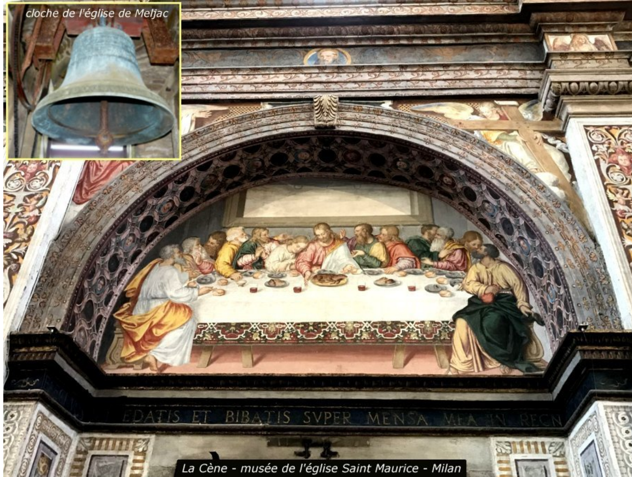
La Cène - musée de l'église Saint Maurice - Milan