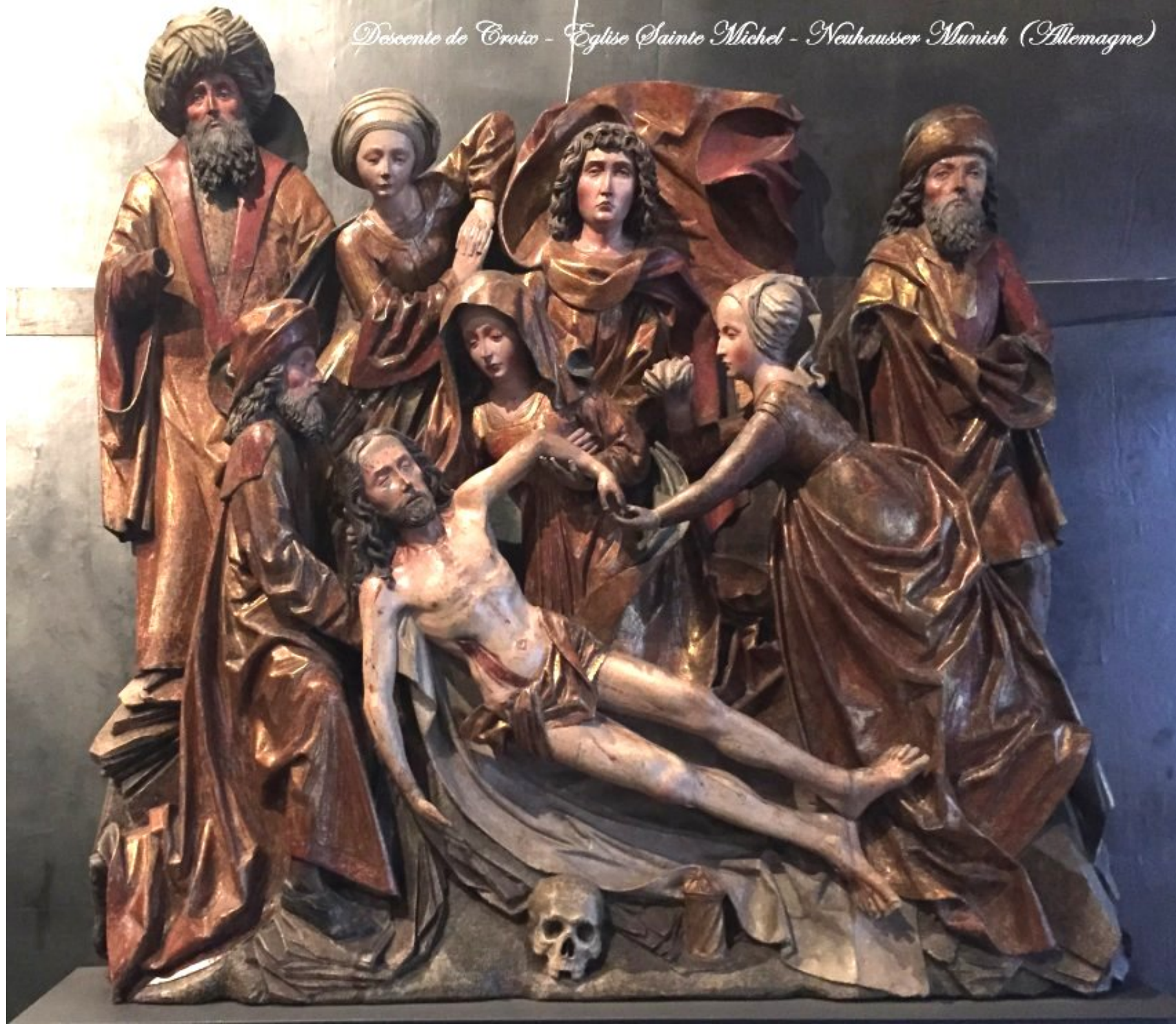
Déscente de Croix - Eglise Sainte Michel - Neuhauser Munich (Allemagne)