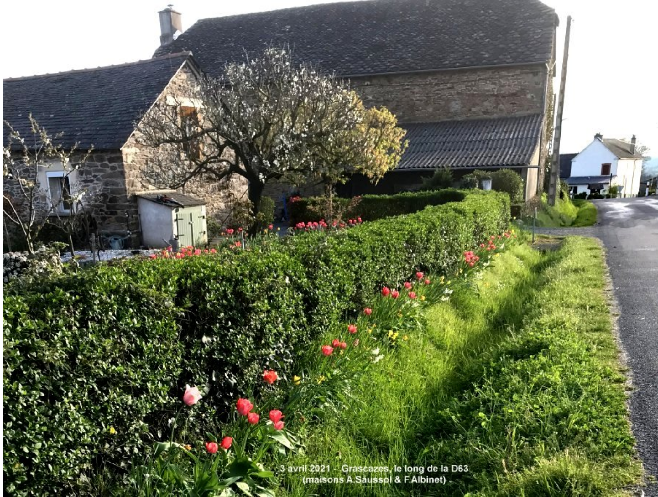
3 avril 2021 - Grascazes, le long de la D63 (maisons A.Saussol & F.Albinet)