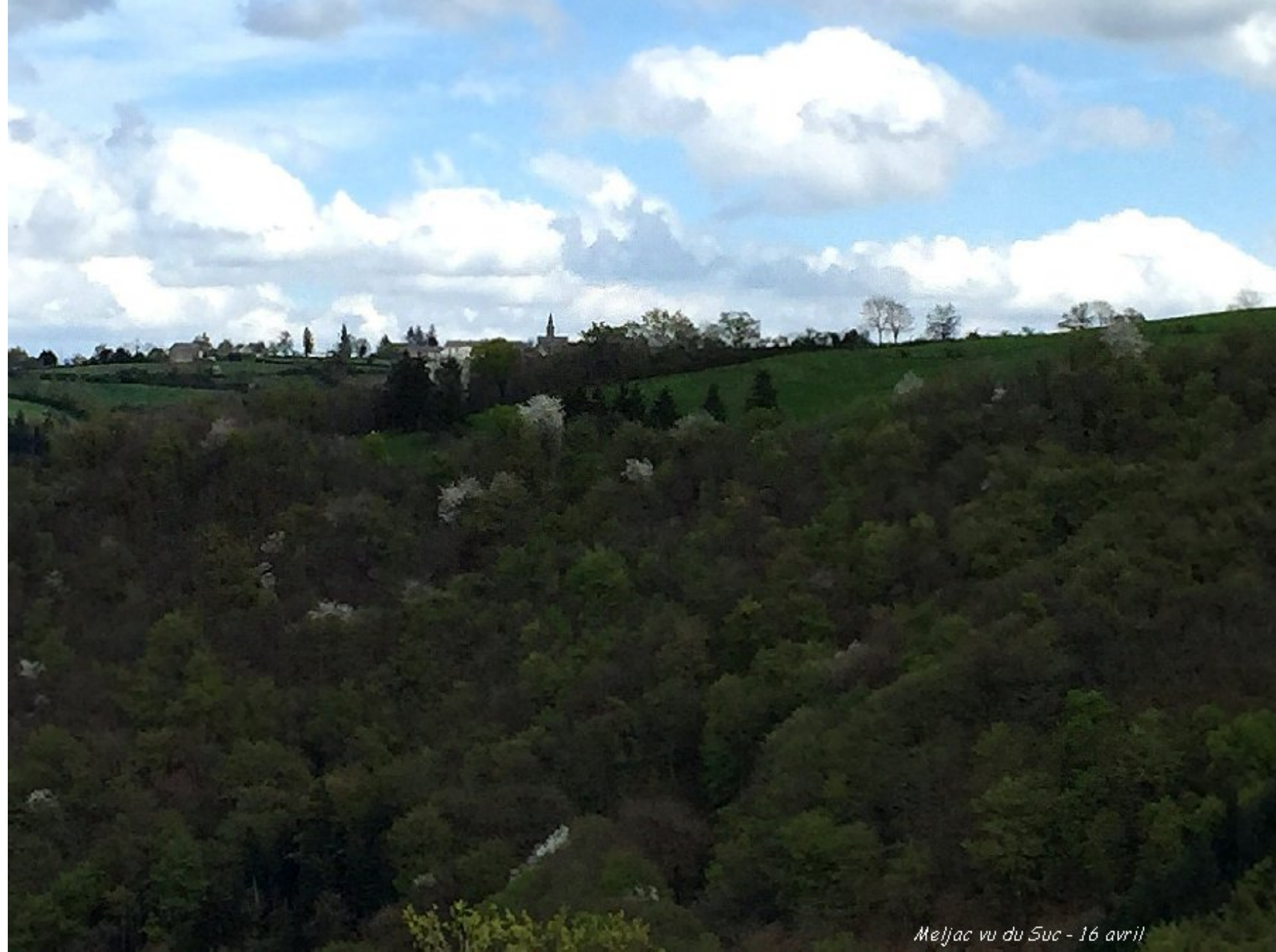
Meljac vu du Suc - 16 avril