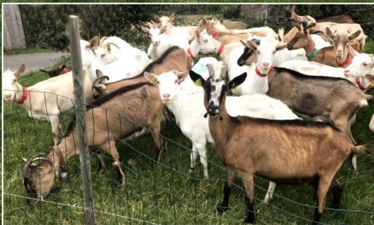
Grascazes - avril 2021