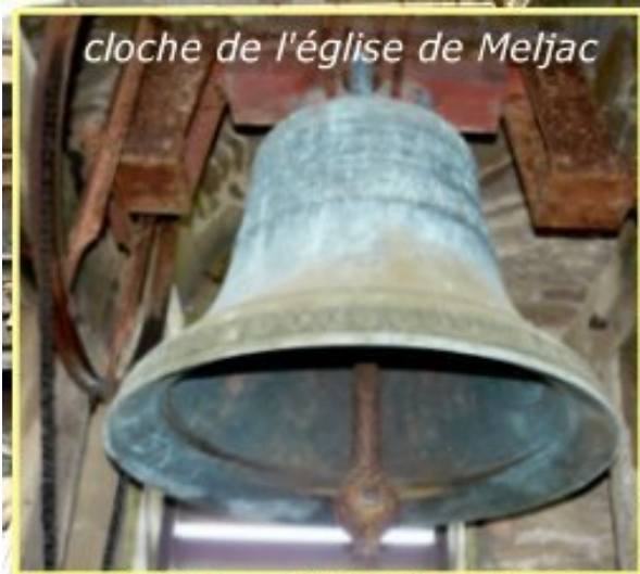
cloche de l'église de Meljac