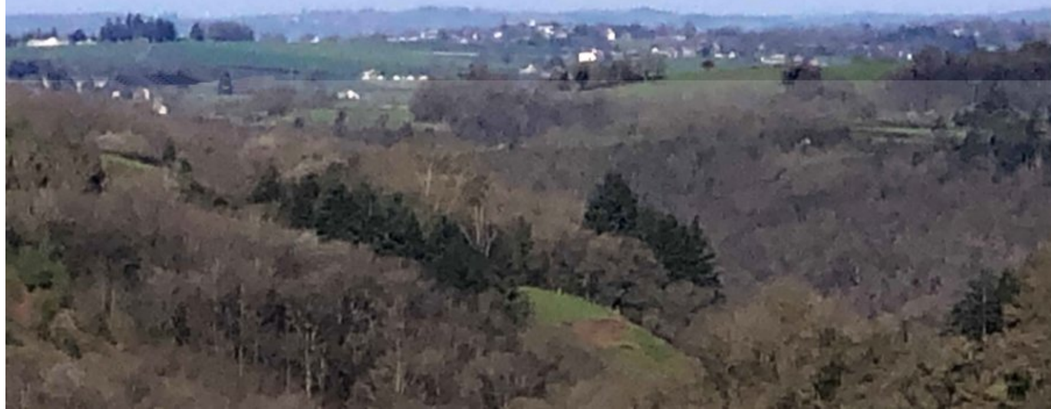
4 avril 2021 au soleil levant, vue de La Bessière sur la vallée du Gintou et à l'horizon, le village de Tauriac