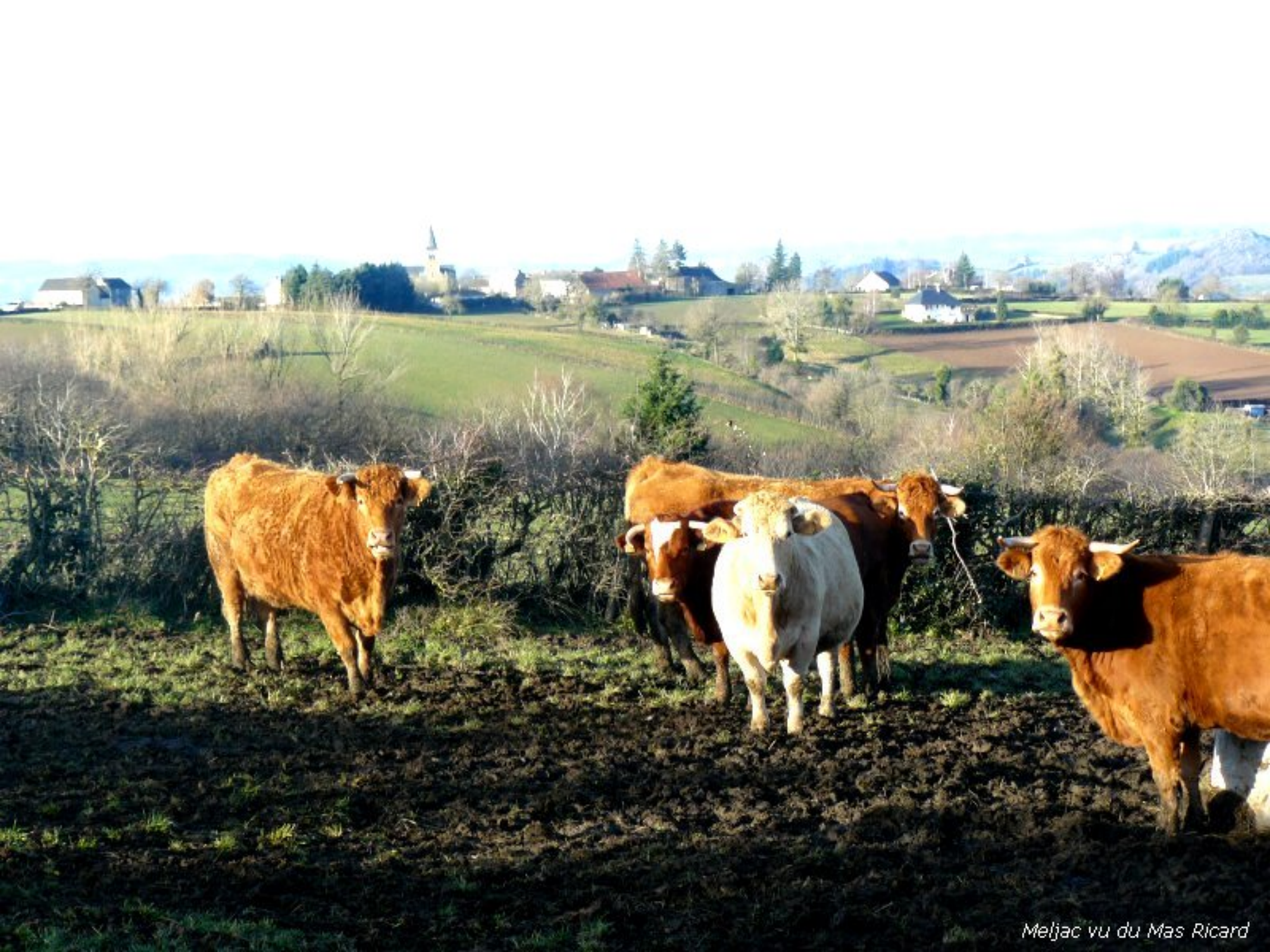
Meljac vu du Mas Ricard