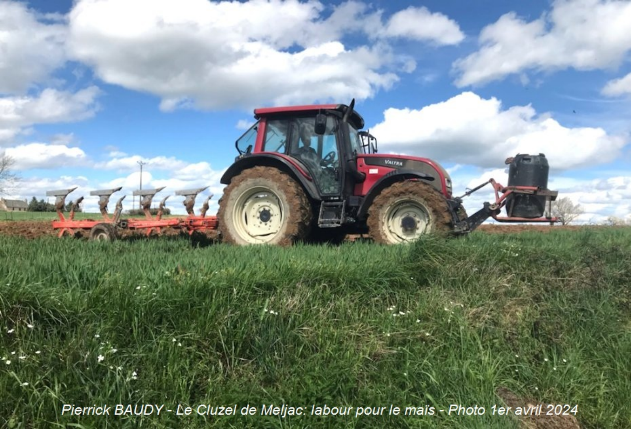
Pierrick BAUDY - Le Cluzel de Meljac: labour pour le maïs - Photo 1er avril 2024