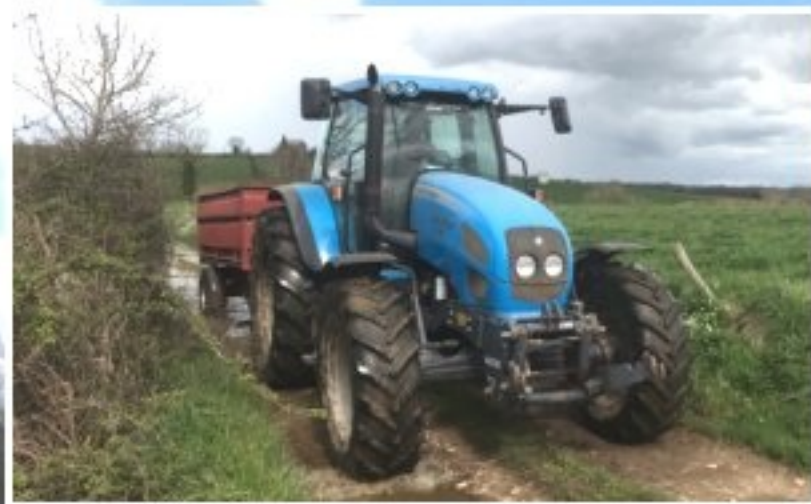
Plantation des piquets à La Bessière de Meljac - Photo André Saussol avril 2024