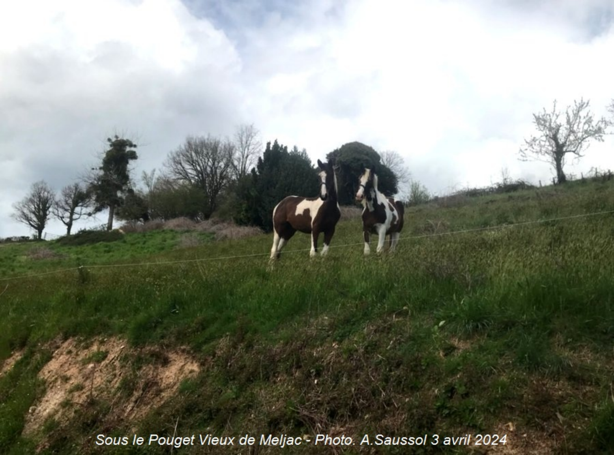
Sous le Pouget Vieux de Meljac - Photo. A.Saussol 3 avril 2024