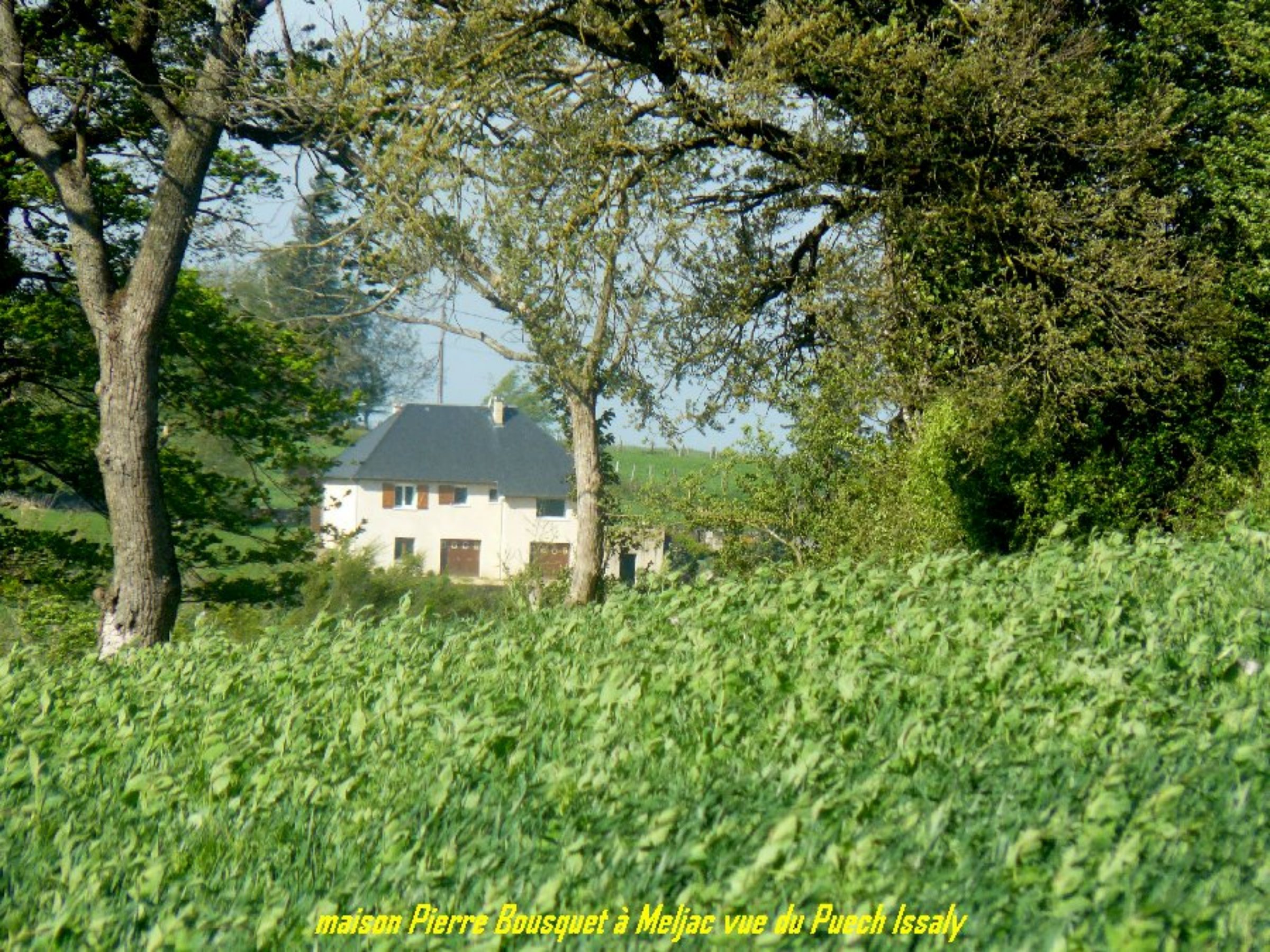
maison Pierre Bousquet à Meljac vue du Puech Issaly