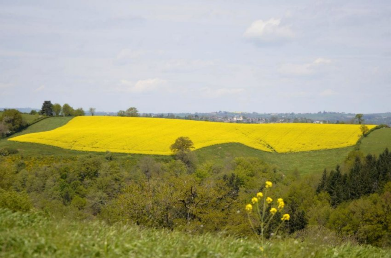
Colza au Martinesq vu de la Borie sur fond de Centrès