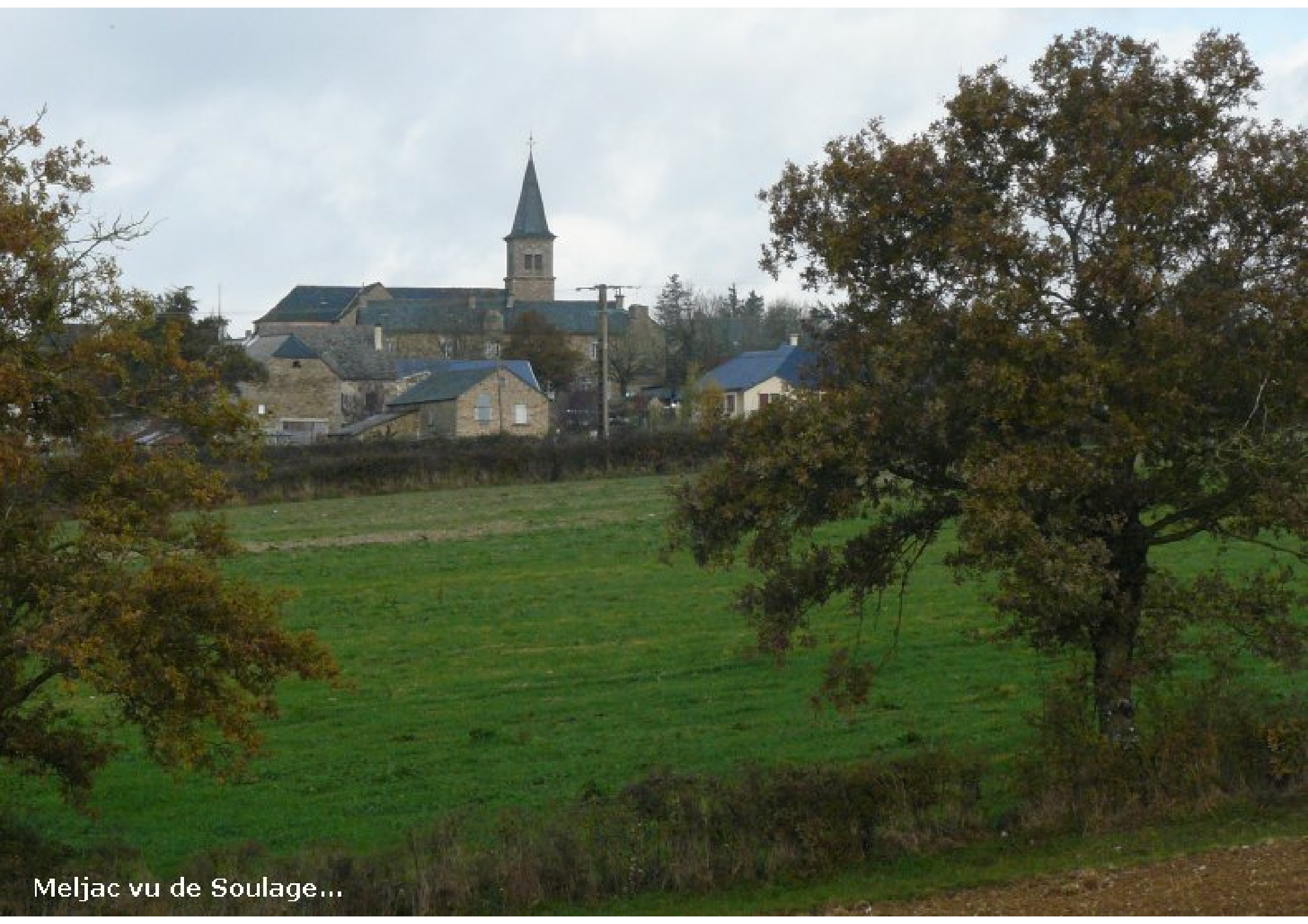
Meljac vu de Soulage...