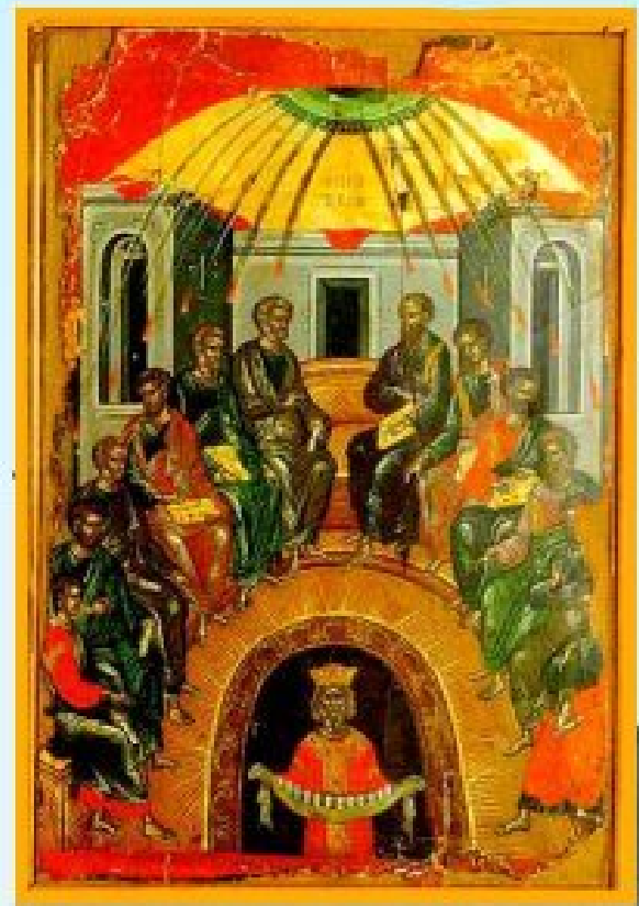
Pentecôte à Meljac