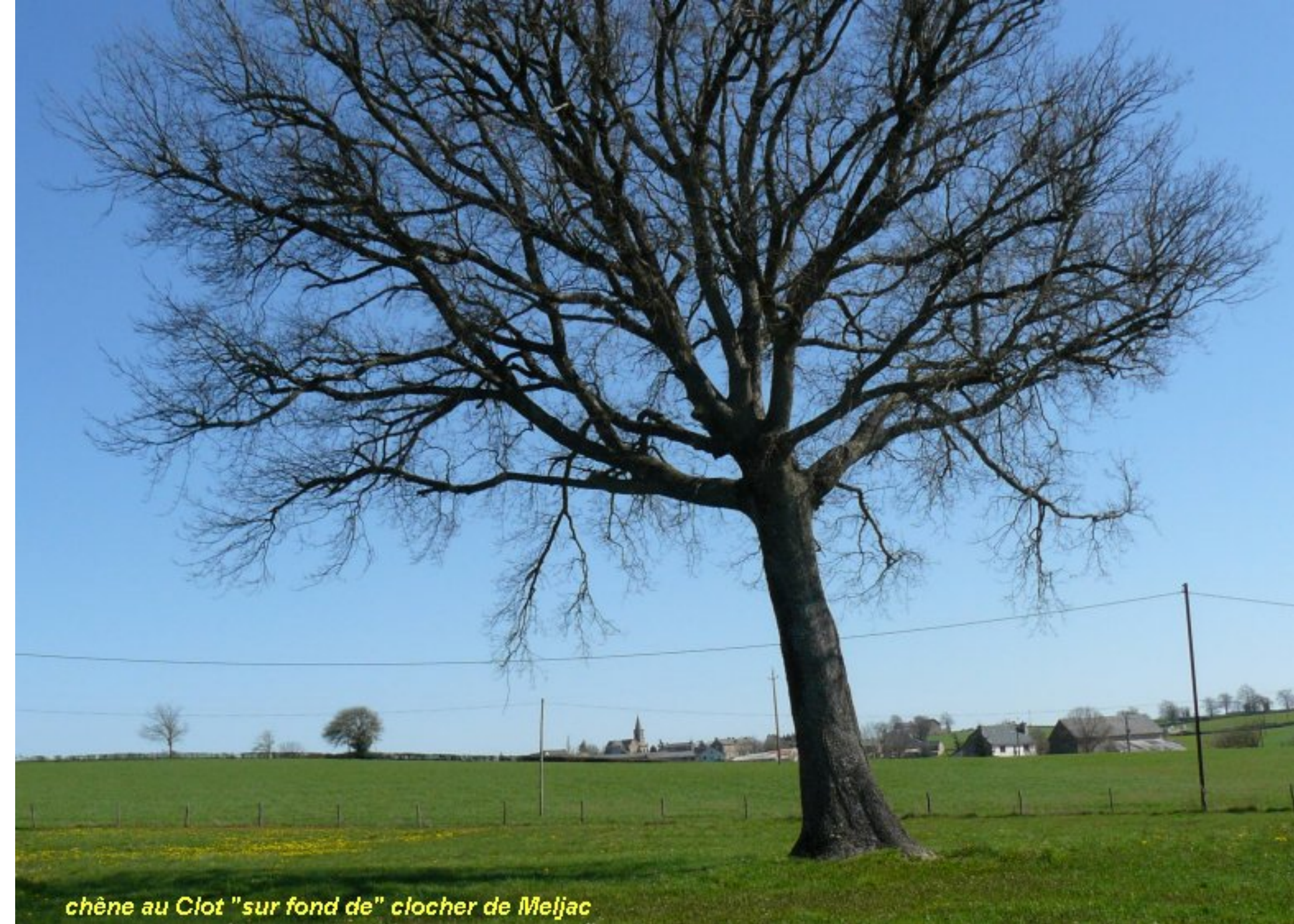
chêne au Clot "sur fond de" clocher de Meljac