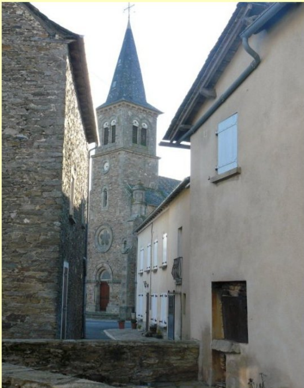
MELJAC le bourg