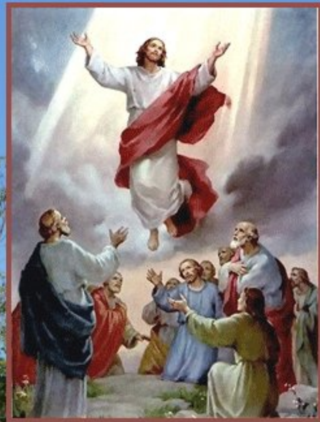
L'Ascension à Meljac