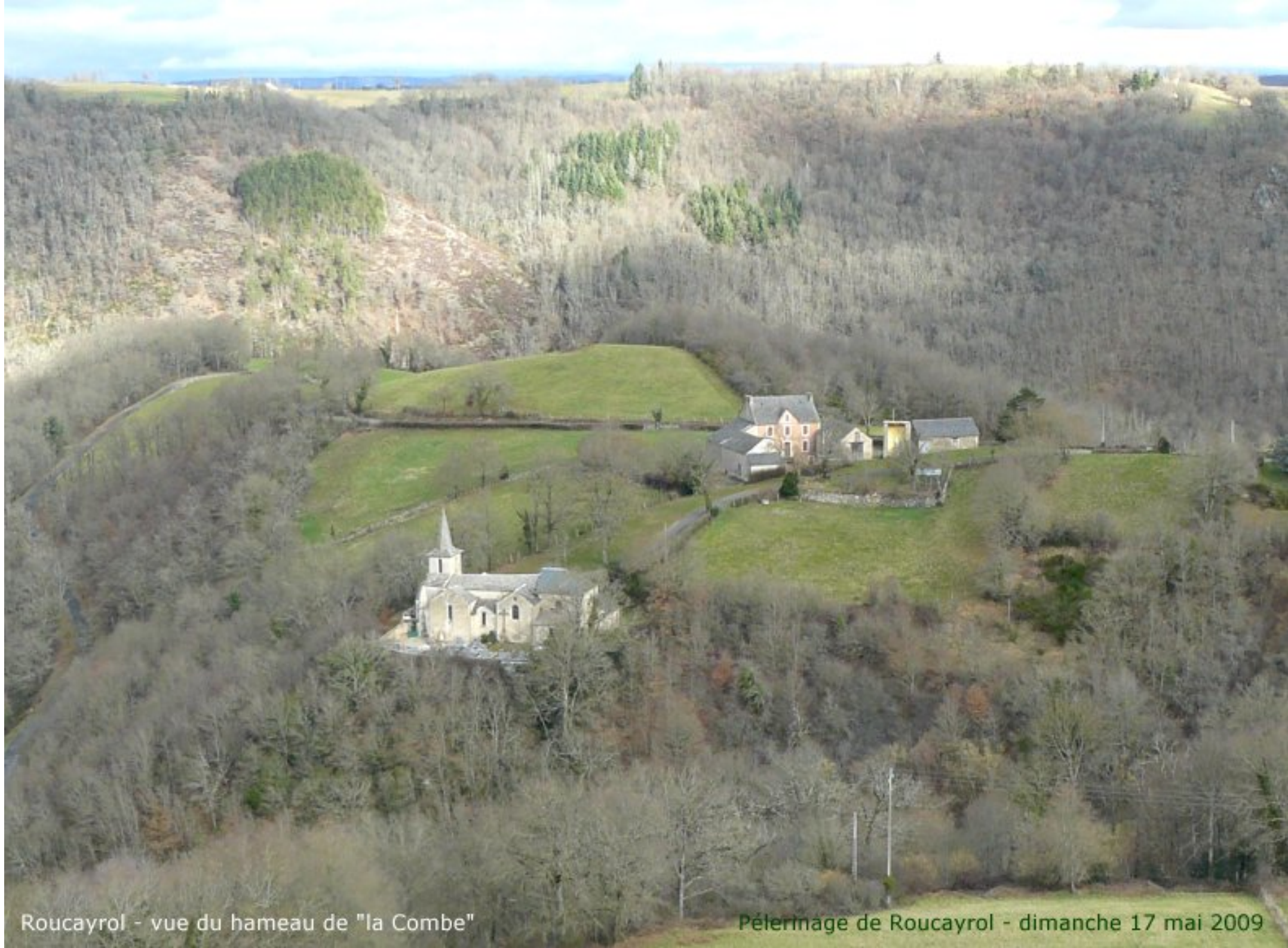
Roucayrol - vue du hameau de "la Combe"

Pèlerinage de Roucayrol - dimanche 17 mai 2009