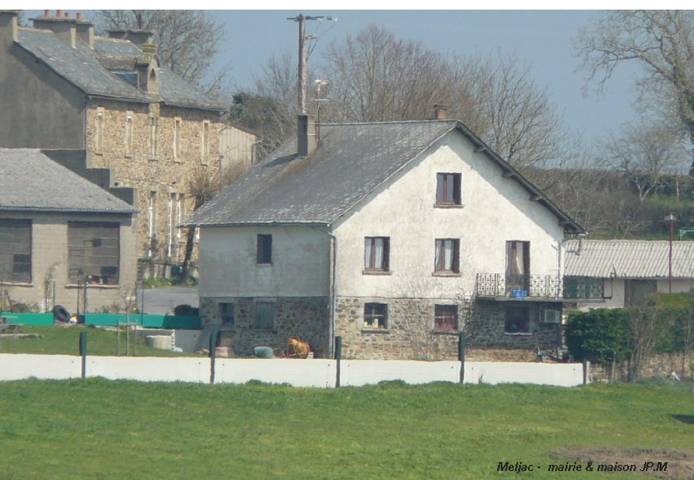
Meljac - mairie & maison JP.M