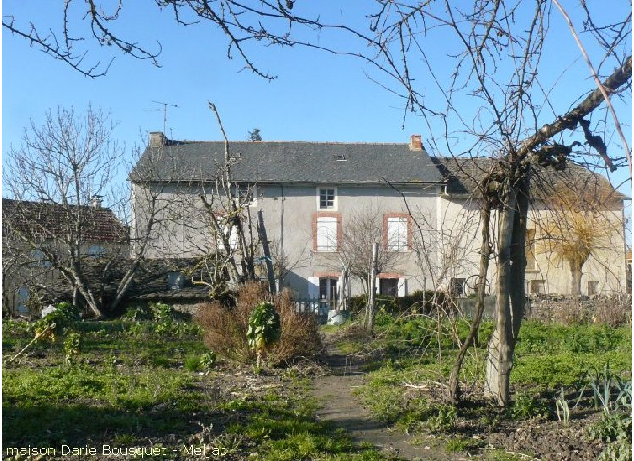
maison Darle Bousquet - Meljac