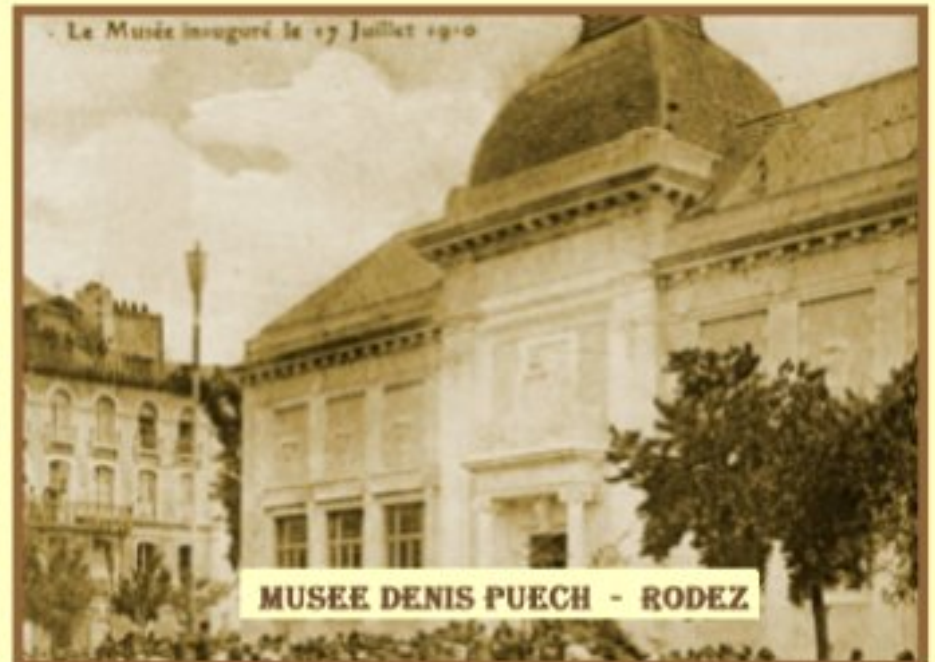
MUSEE DENIS PUECH - RODEZ

Commandée par la Ville de Paris pour la cour d'honneur de l'université de la Sorbonne, La Pensée est refusée pour sa coiffure trop moderne. Puech en expose une version en marbres de couleur au Salon des artistes français en 1902, sans doute celle-ci; les cheveux sont teints à la cire colorée sur le marbre blanc, selon une technique empruntée à la Grèce antique, dont les recherches de polychromie influencent nombre de sculpteurs de l'époque (ainsi Henry Cros, voir Salle 18).