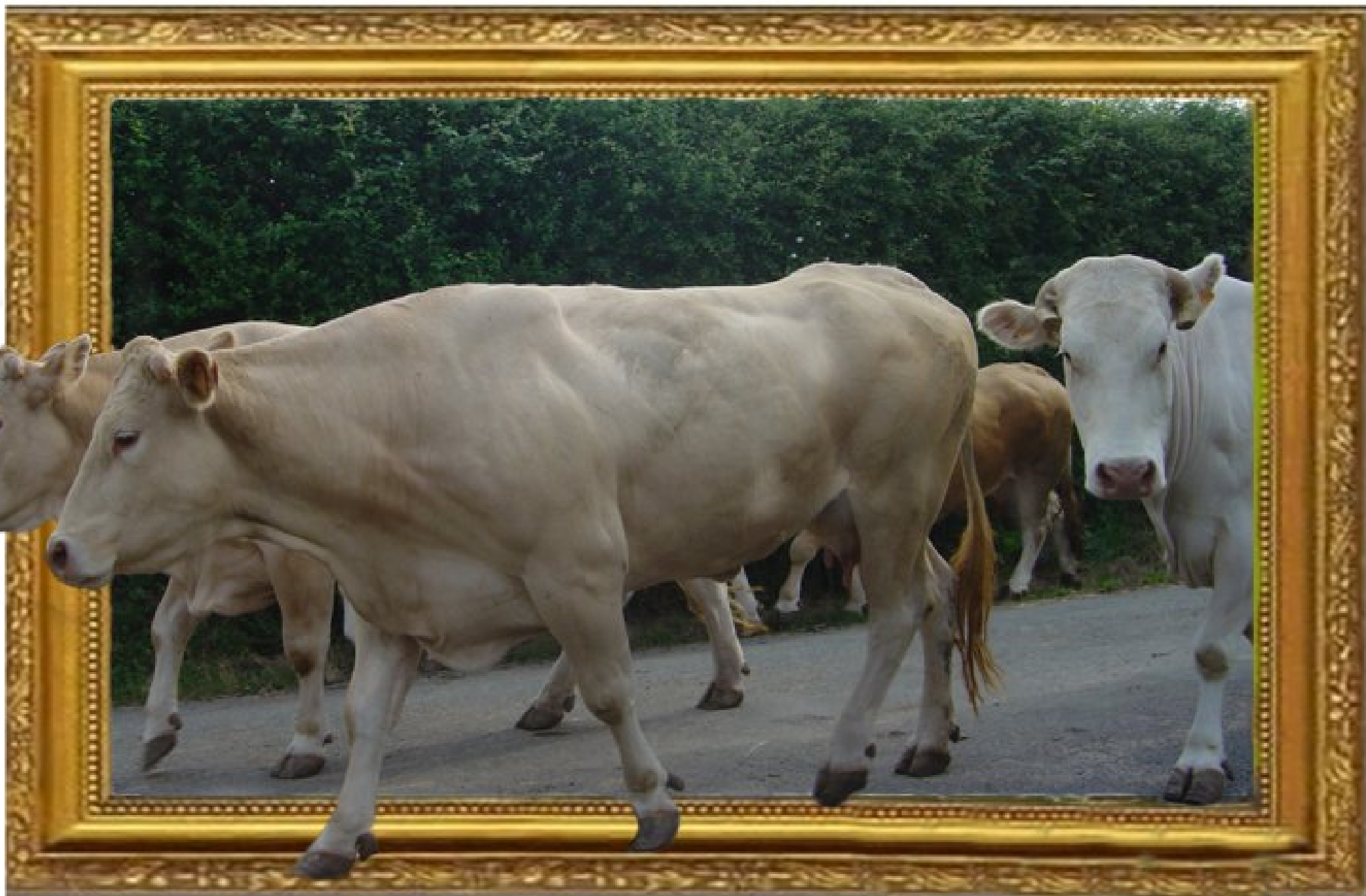
C'était avant l'arrivée de la clôture électrique dans nos contrées; moins efficace mais plus élégant...