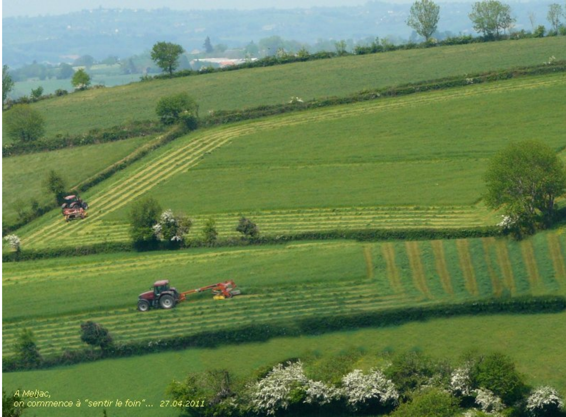
A Meljac, on commence à "sentir le foin"... 27.04.2011