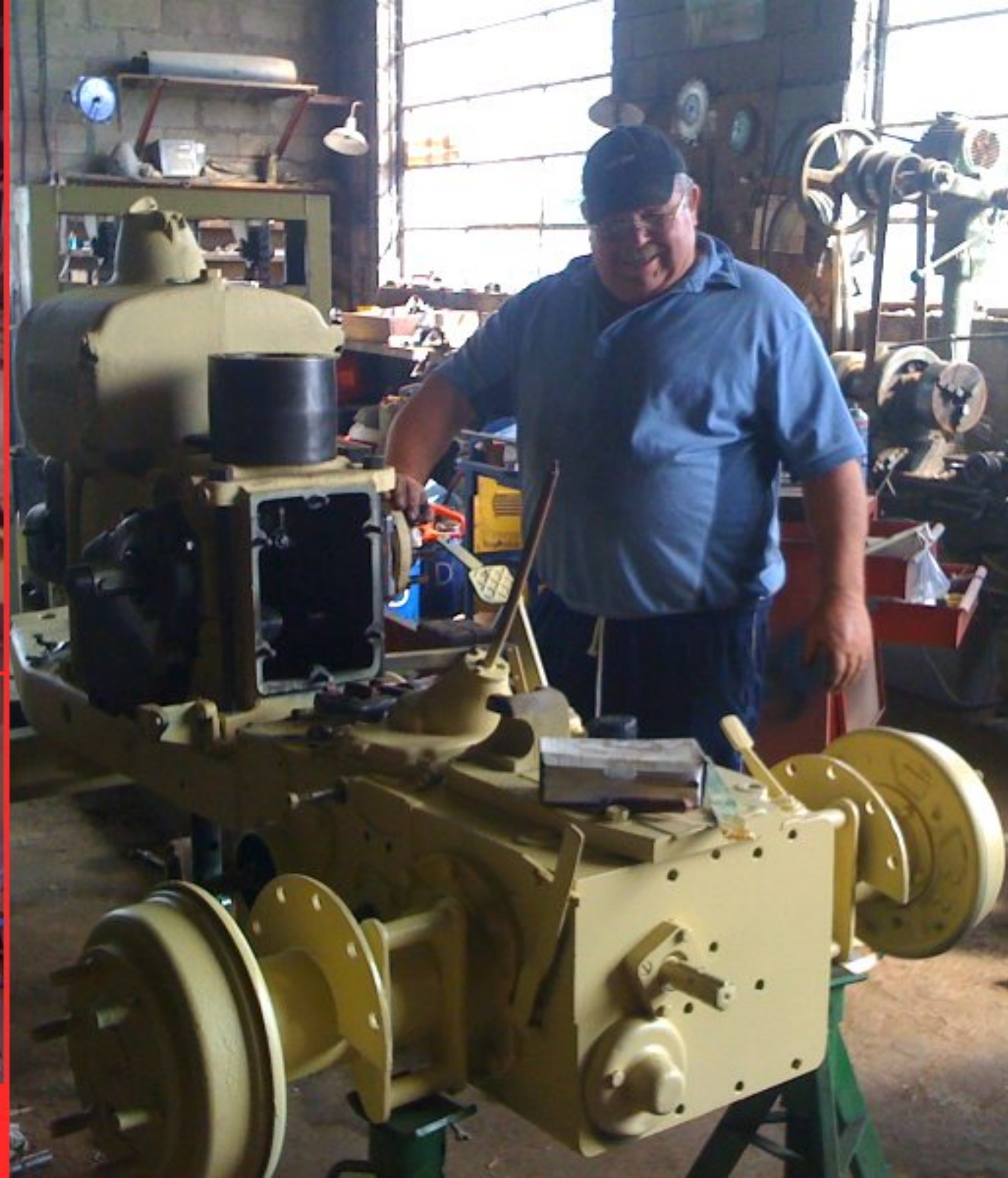
atelier-collection tracteurs JPM "en action" mai 2011