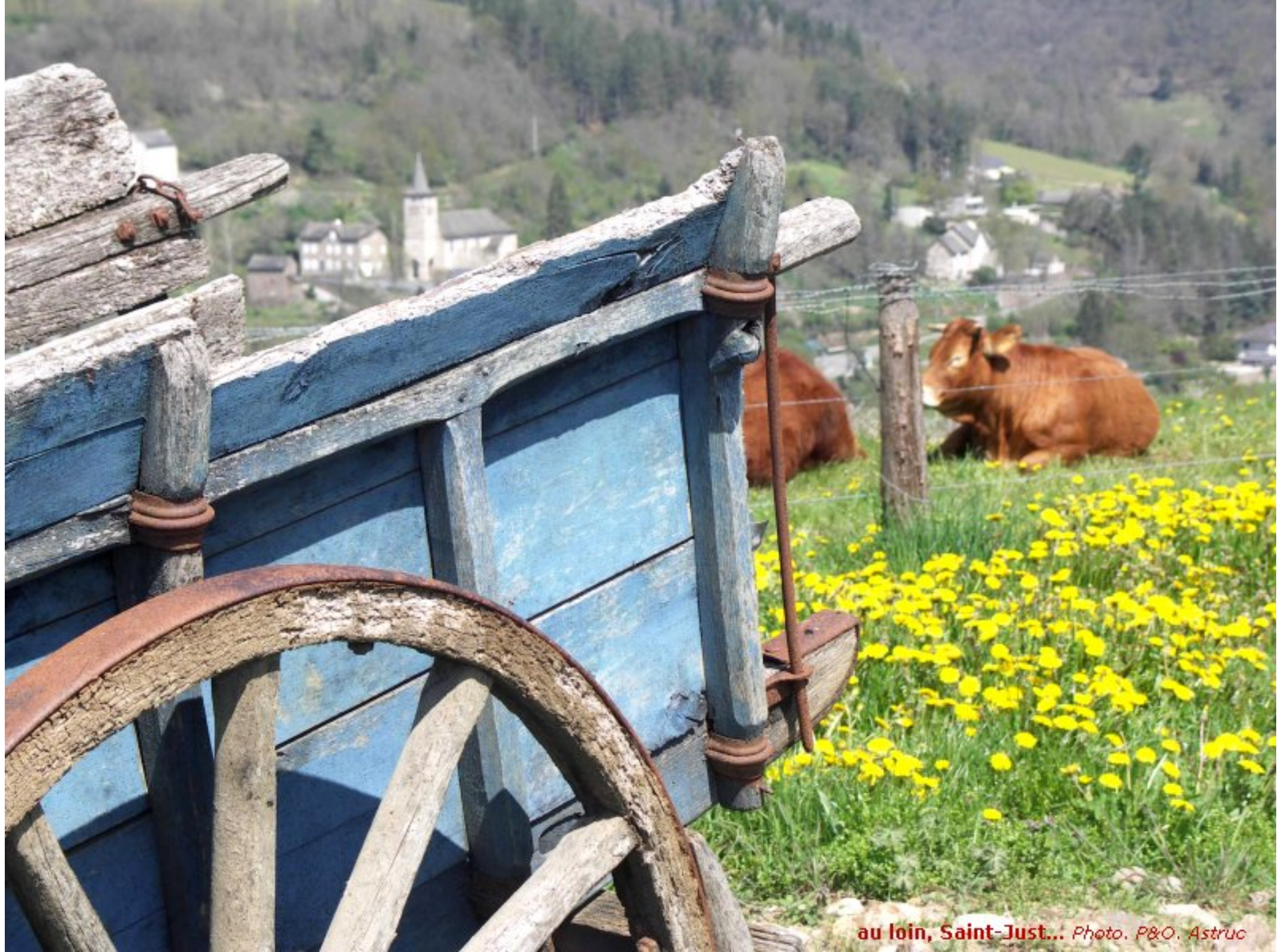
au loin, Saint-Just...