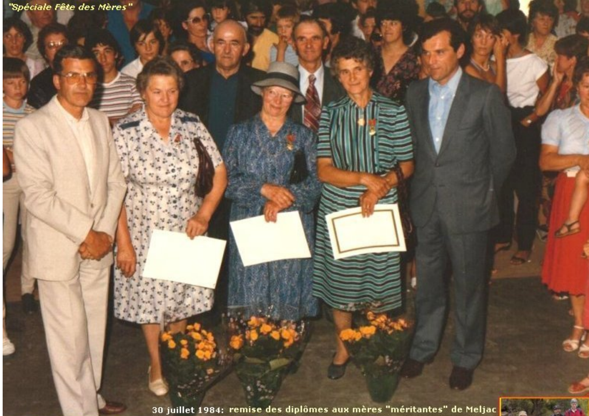
30 juillet 1984: remise des diplômes aux mères "méritantes" de Meljac

Nos marcheurs arrivent aujourd'hui à Lourdes. Ils ont fait étape la nuit dernière à Bagnères de Bigorre. Ils atteindront Lourdes dans la journée après une dernière étape de 26 kms d'un parcours qui en comptait 350. Bravo à toute l'équipe !