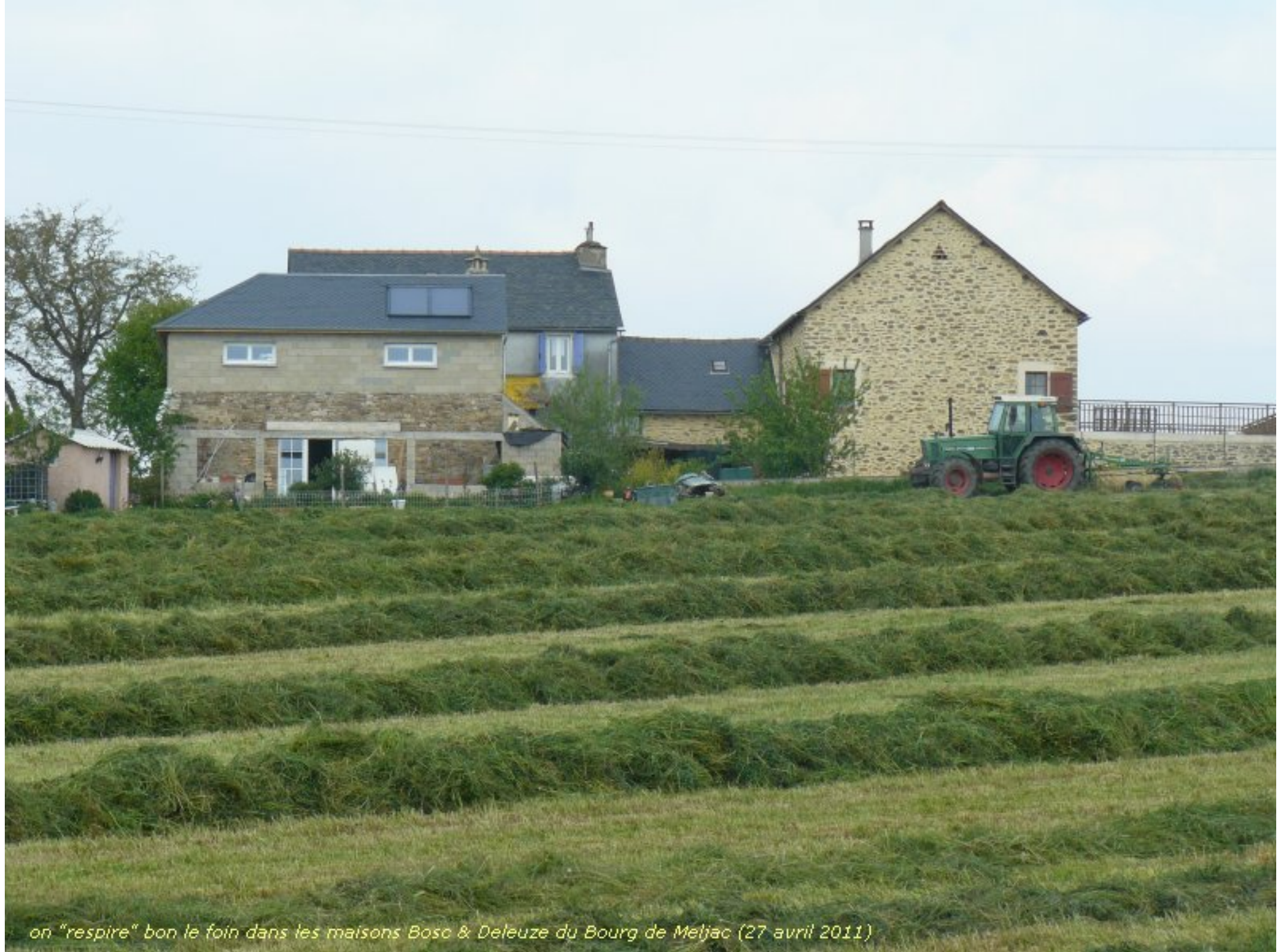
on "respire" bon le foin dans les maisons Bosc & Deleuze du Bourg de Meljac (27 avril 2011)