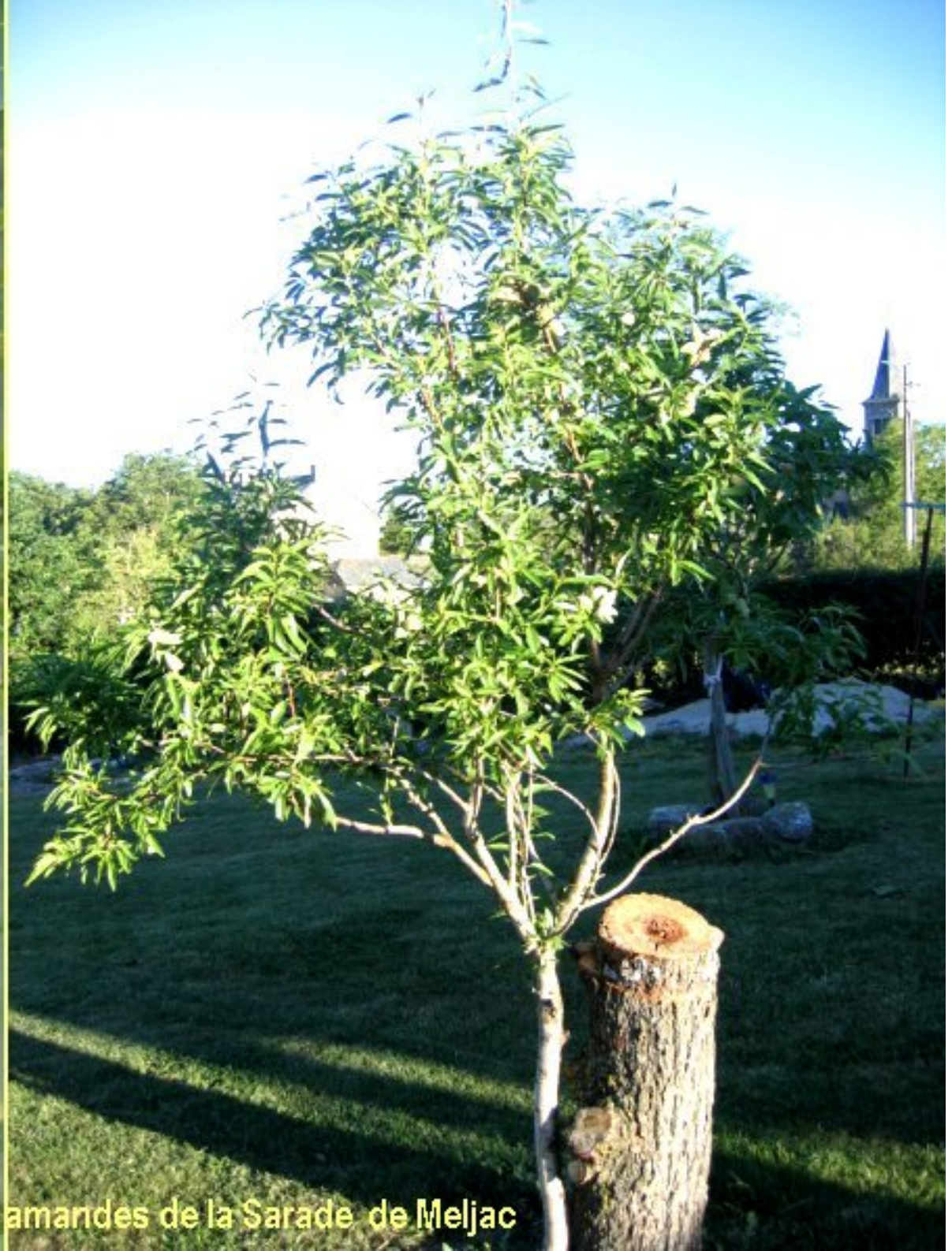
amandier et amandes de la Sarade de Meljac