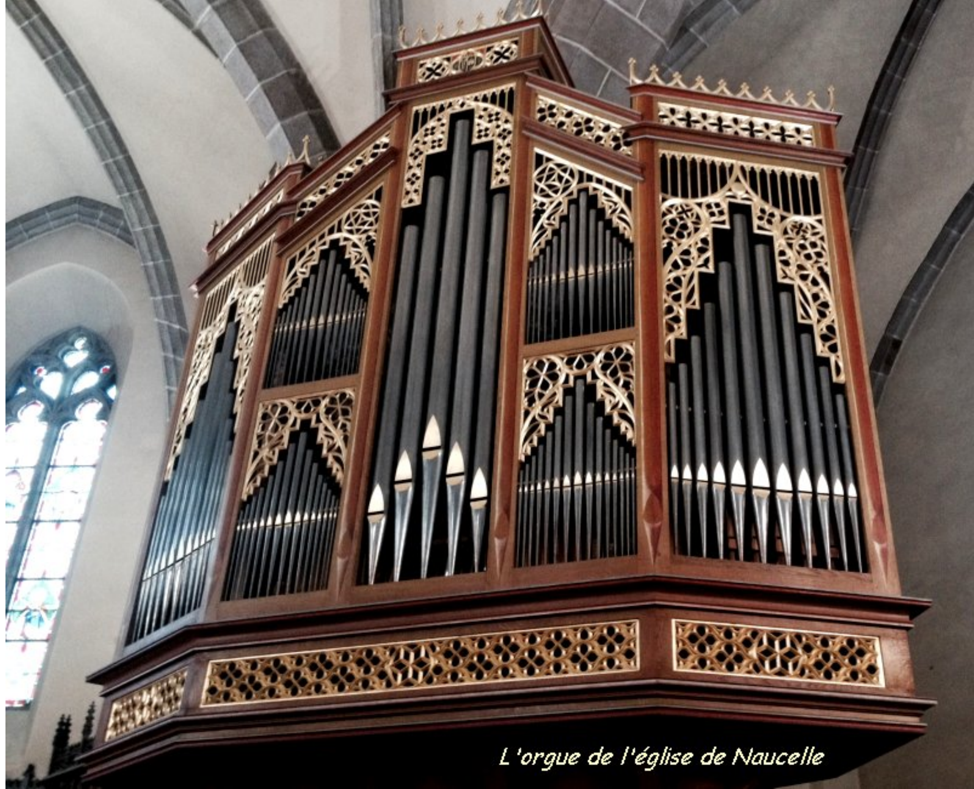
L'orgue de l'église de Naucelle