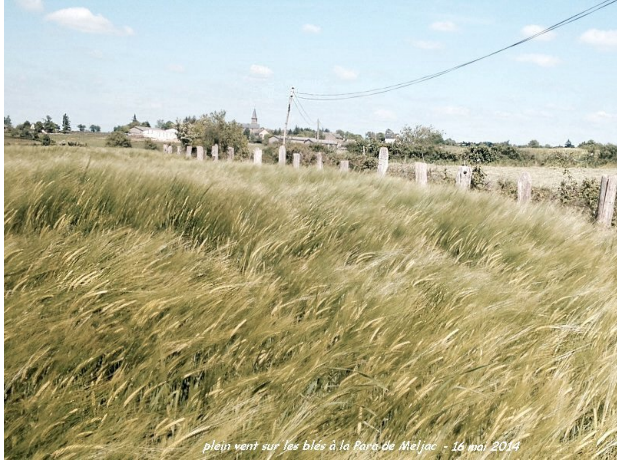
plein vent sur les blés à la Para de Meljac - 16 mai 2014