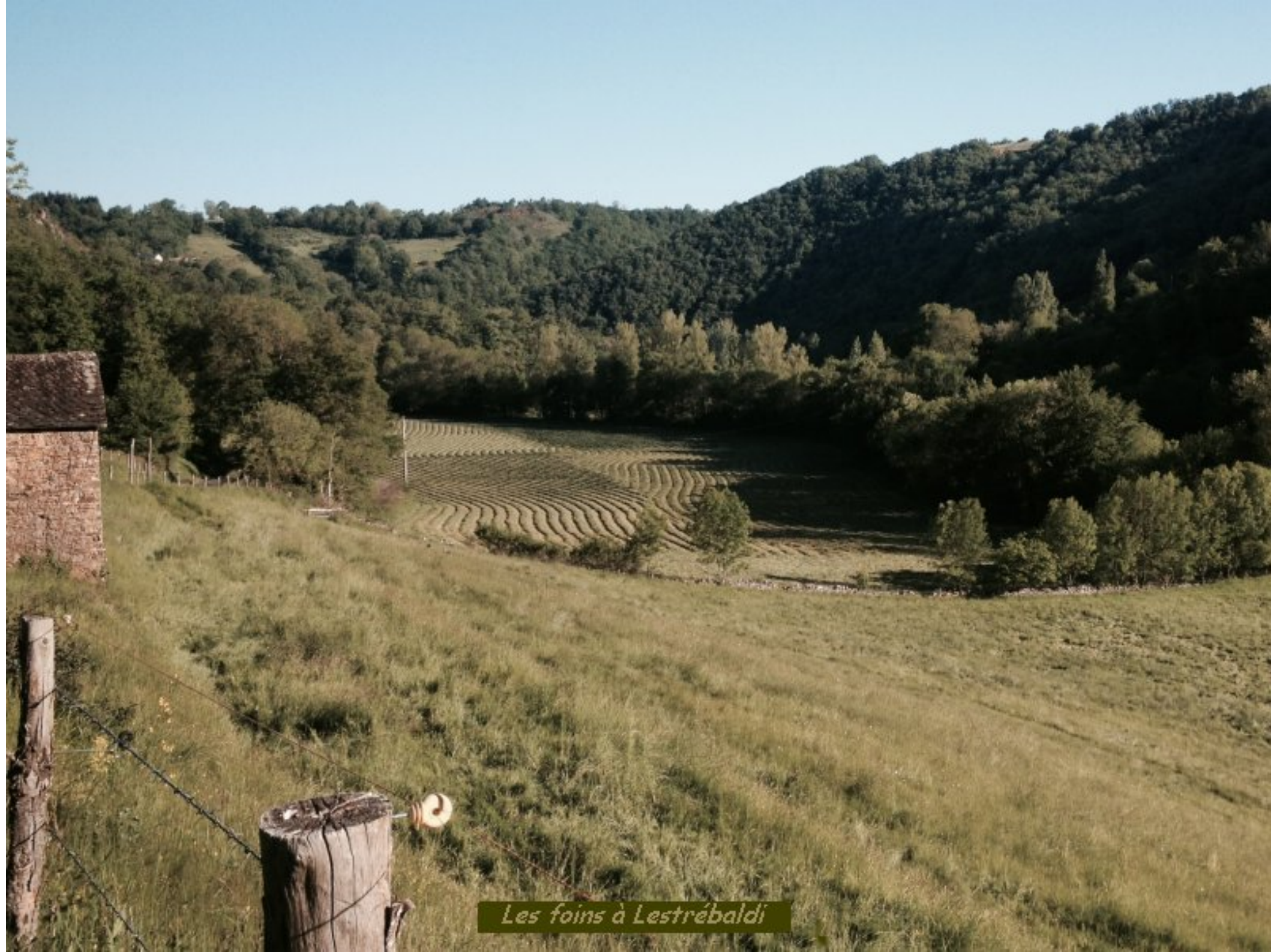
Les foins à Lestrébaldi