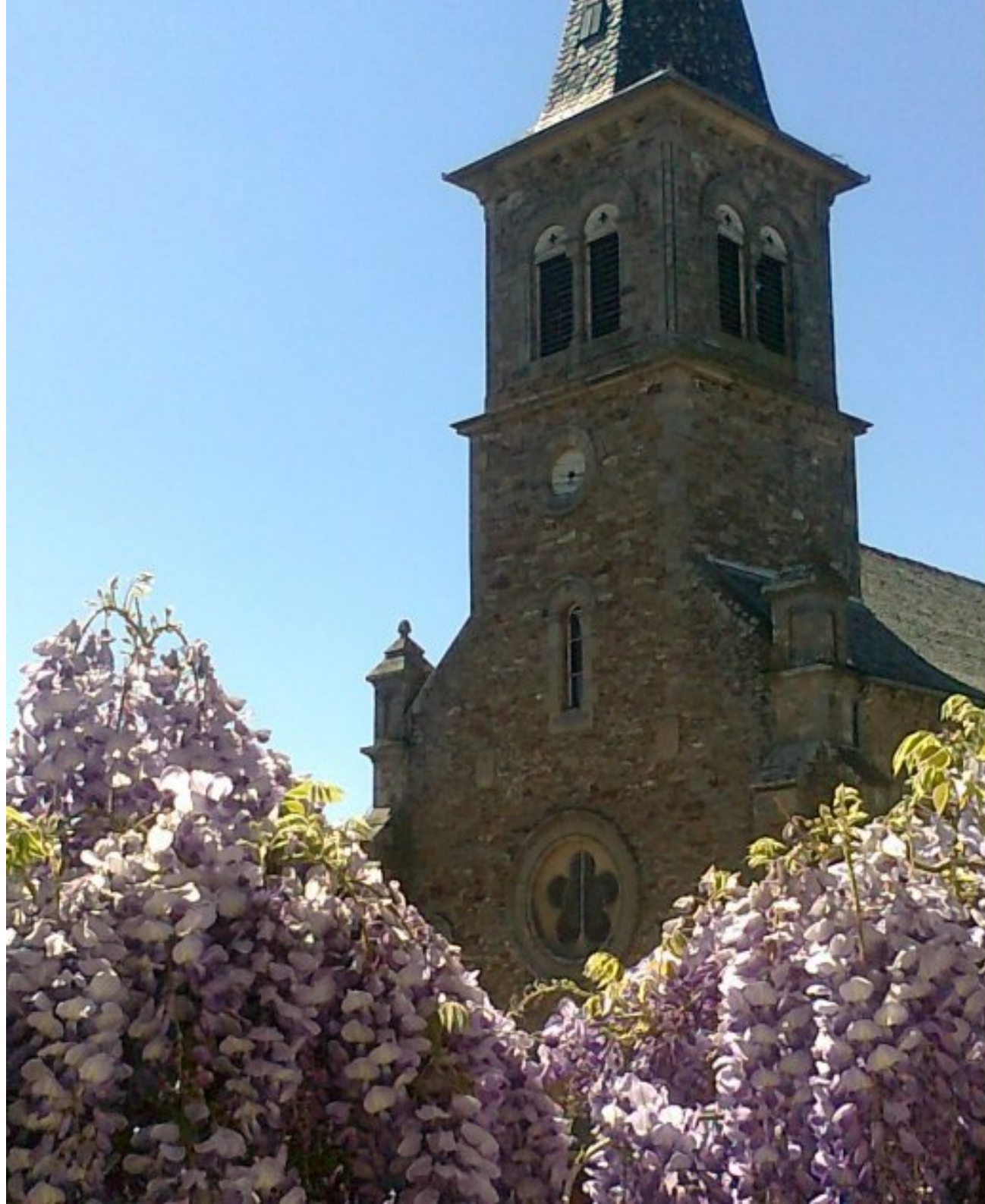
Eglise de Meljac - 28 avril 2014 photo prise de la maison Christiane et Gabriel Cartaud