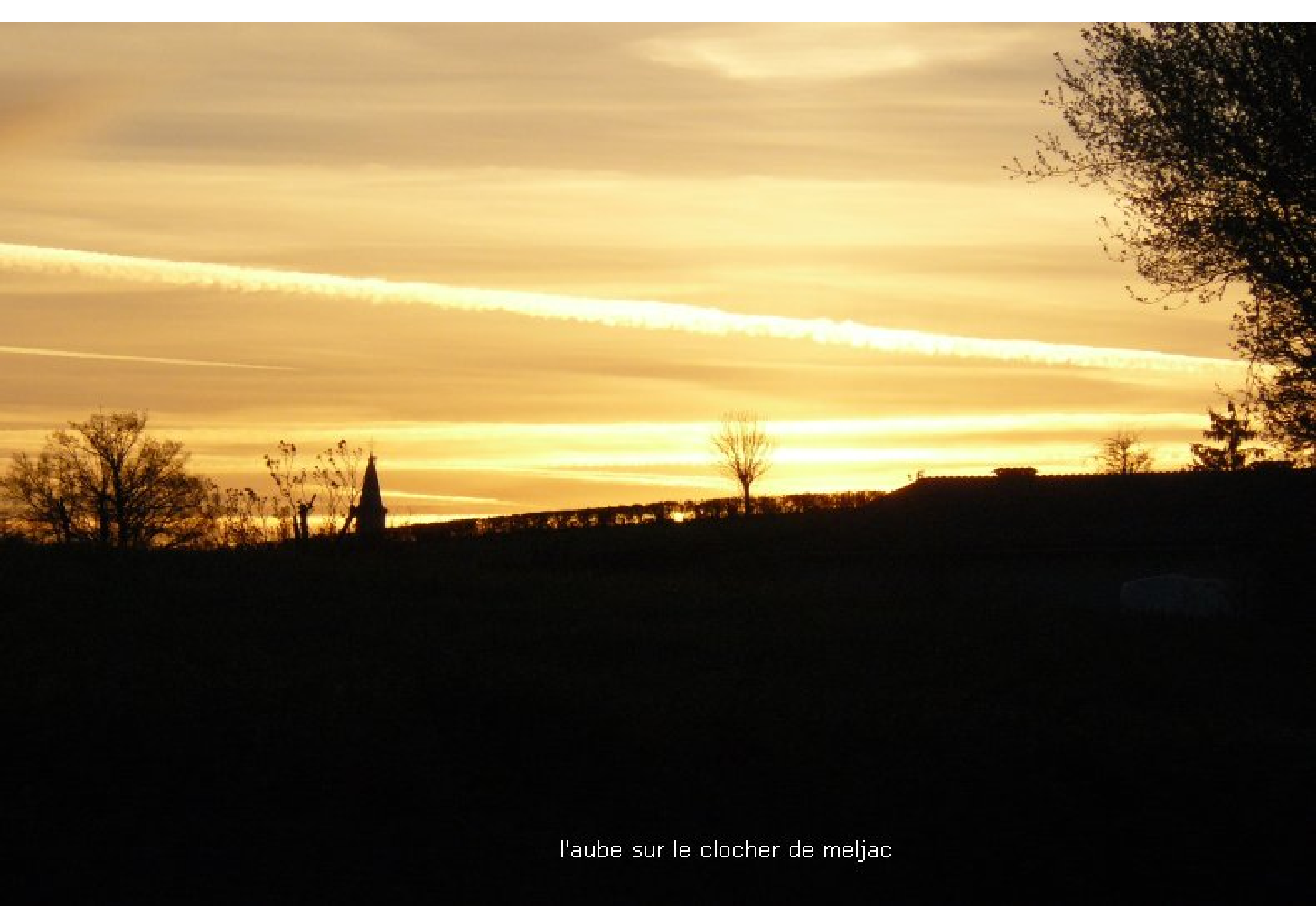
l'aube sur le clocher de meljac