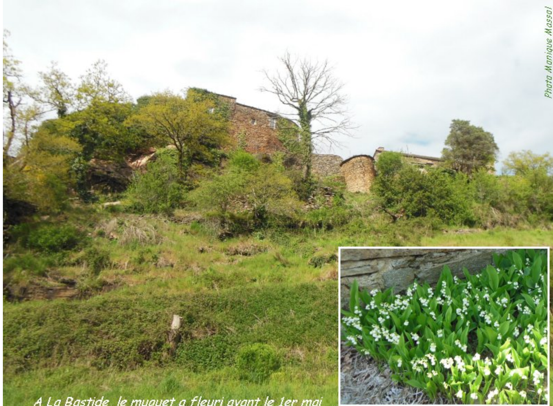
A La Bastide, le muguet a fleuri avant le 1er mai