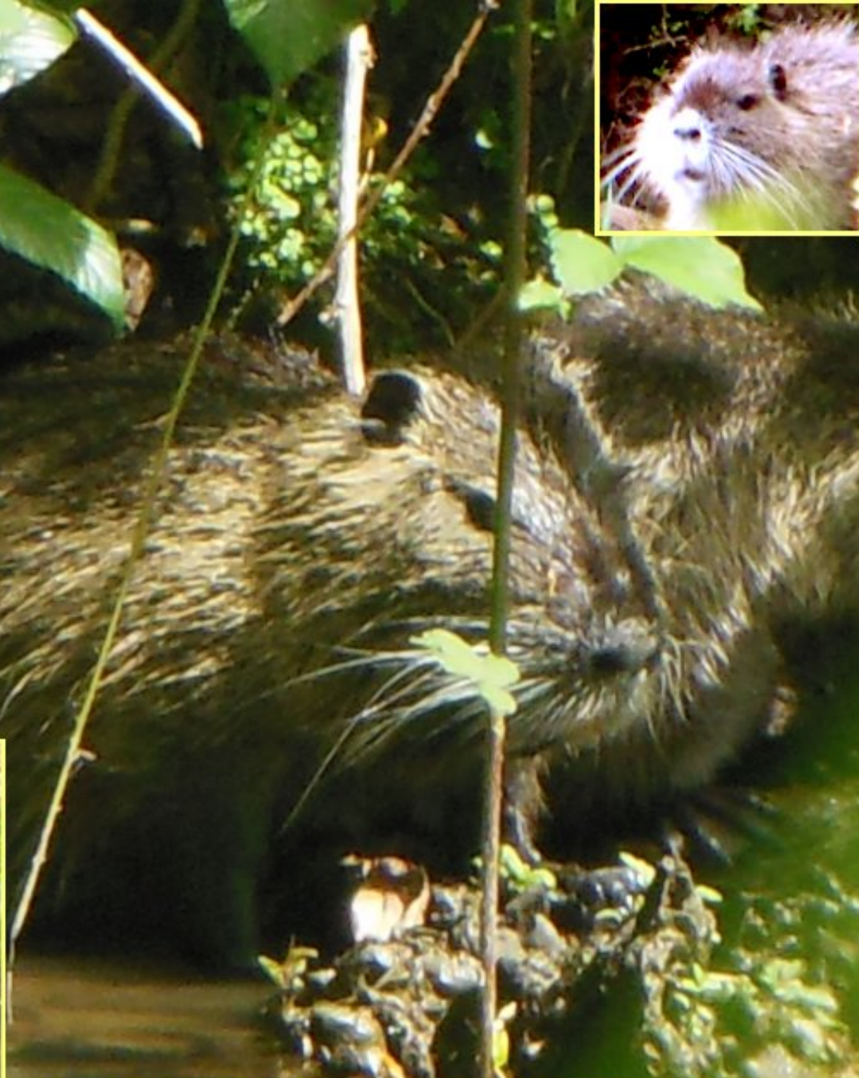
famille de ragondins installée à la Bastide au bord du Céor