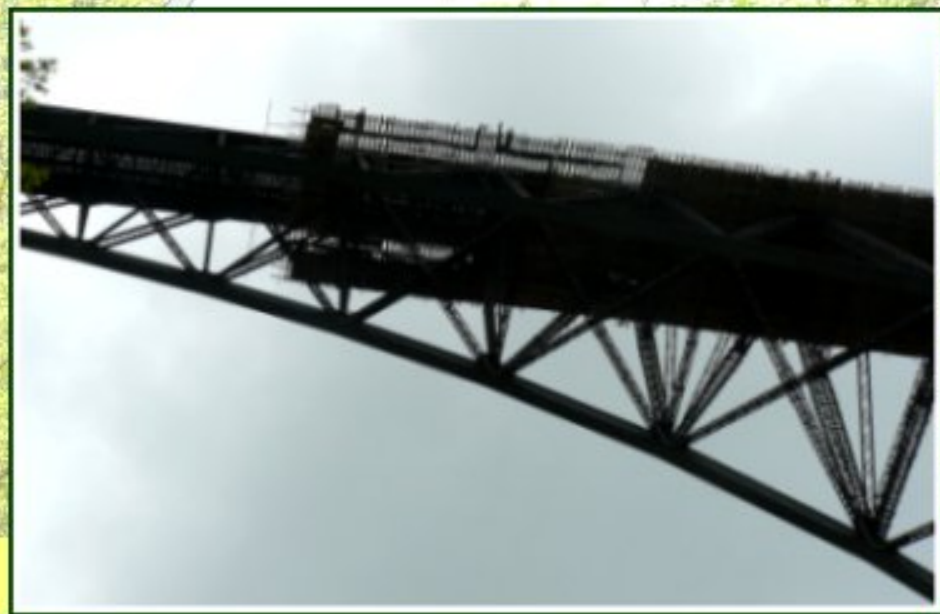
Travaux sur le viaduc du Viaur - trafic interrompu (avril 2014)