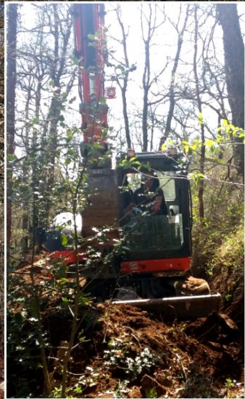
ouverture d'un chemin chez Daniel Tayac -Grascazes