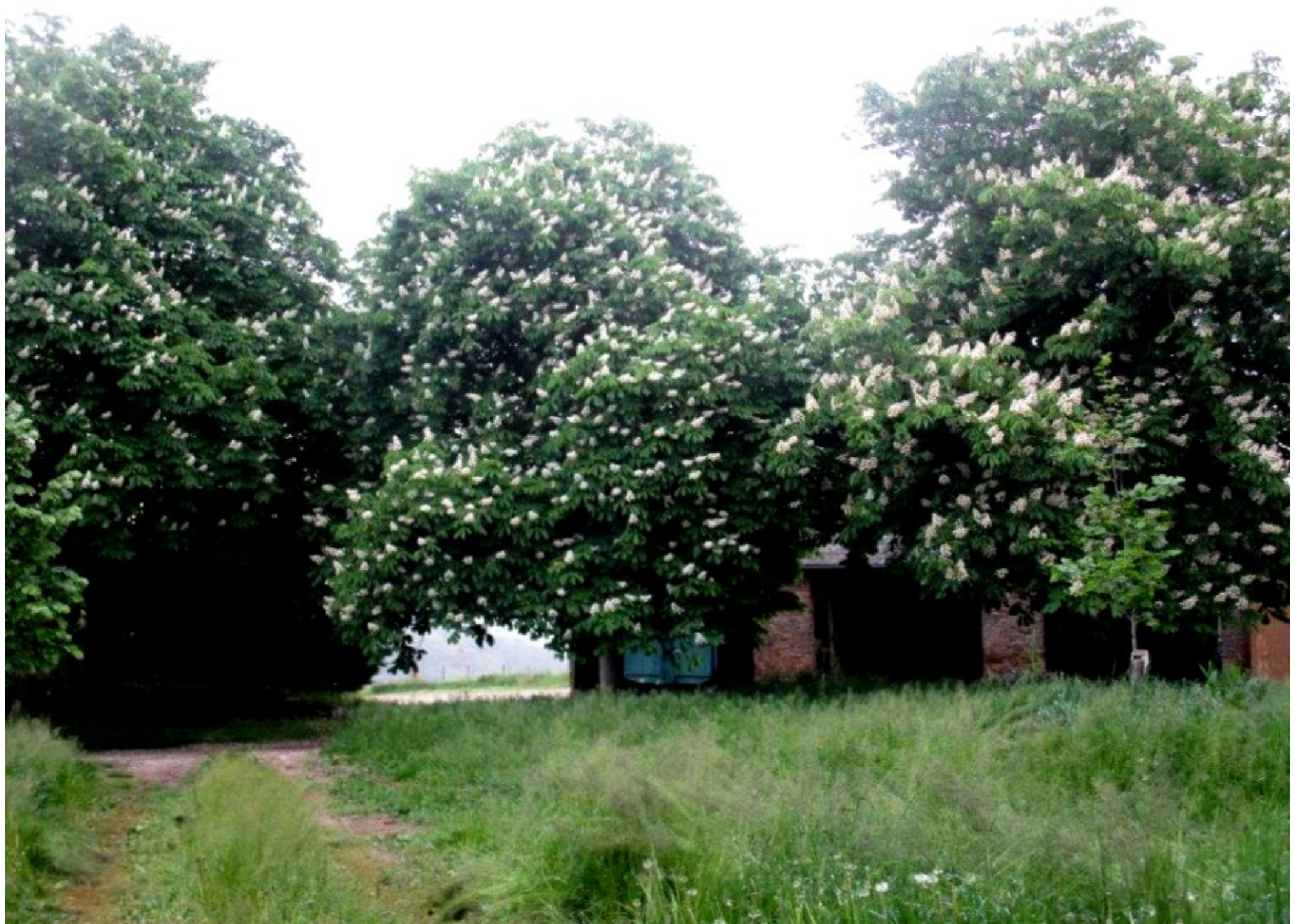
marronniers en pleines fleurs à La Bessière de Meljac au mois de mai