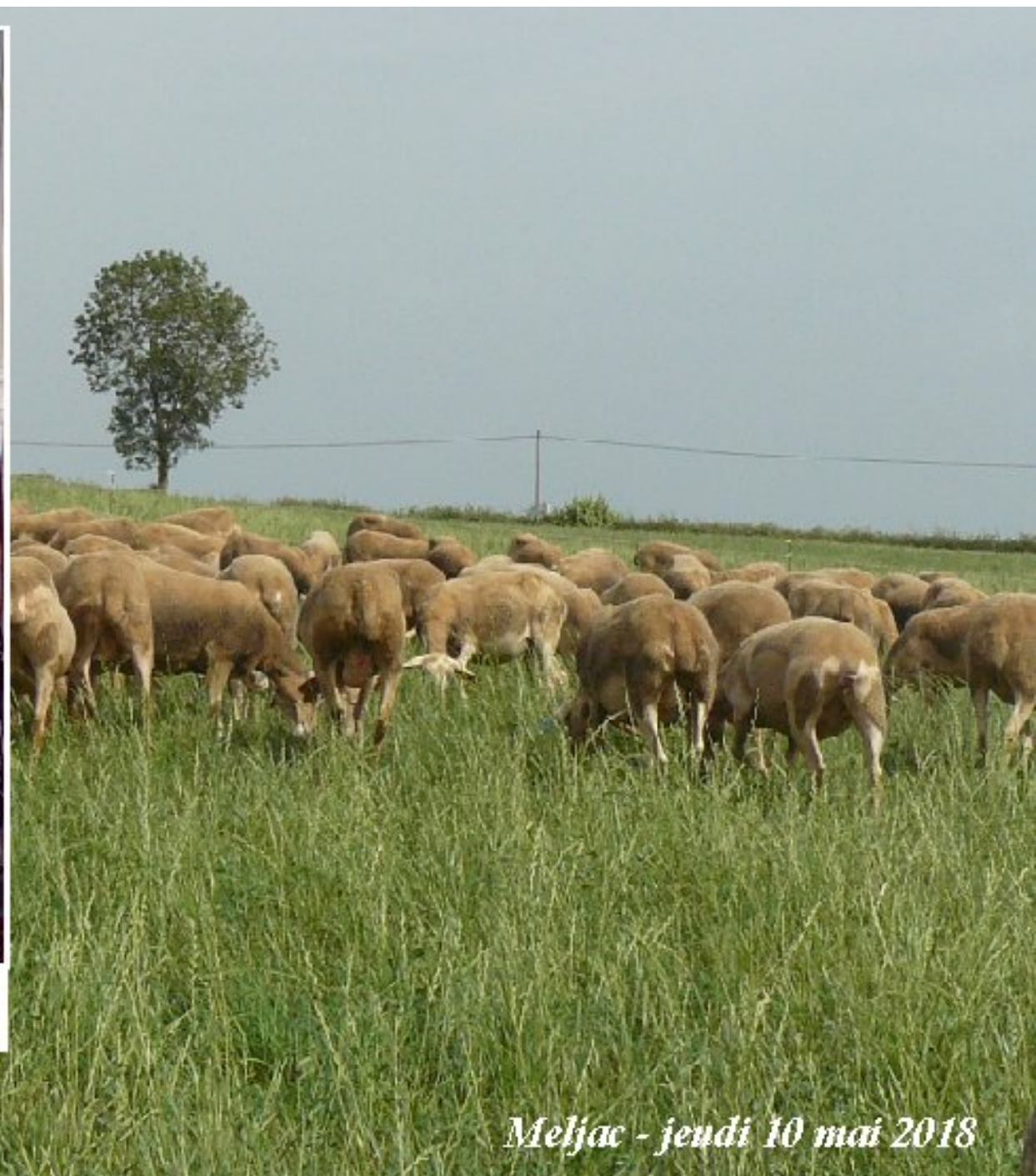
Meljac - jendi 10 mai 2018