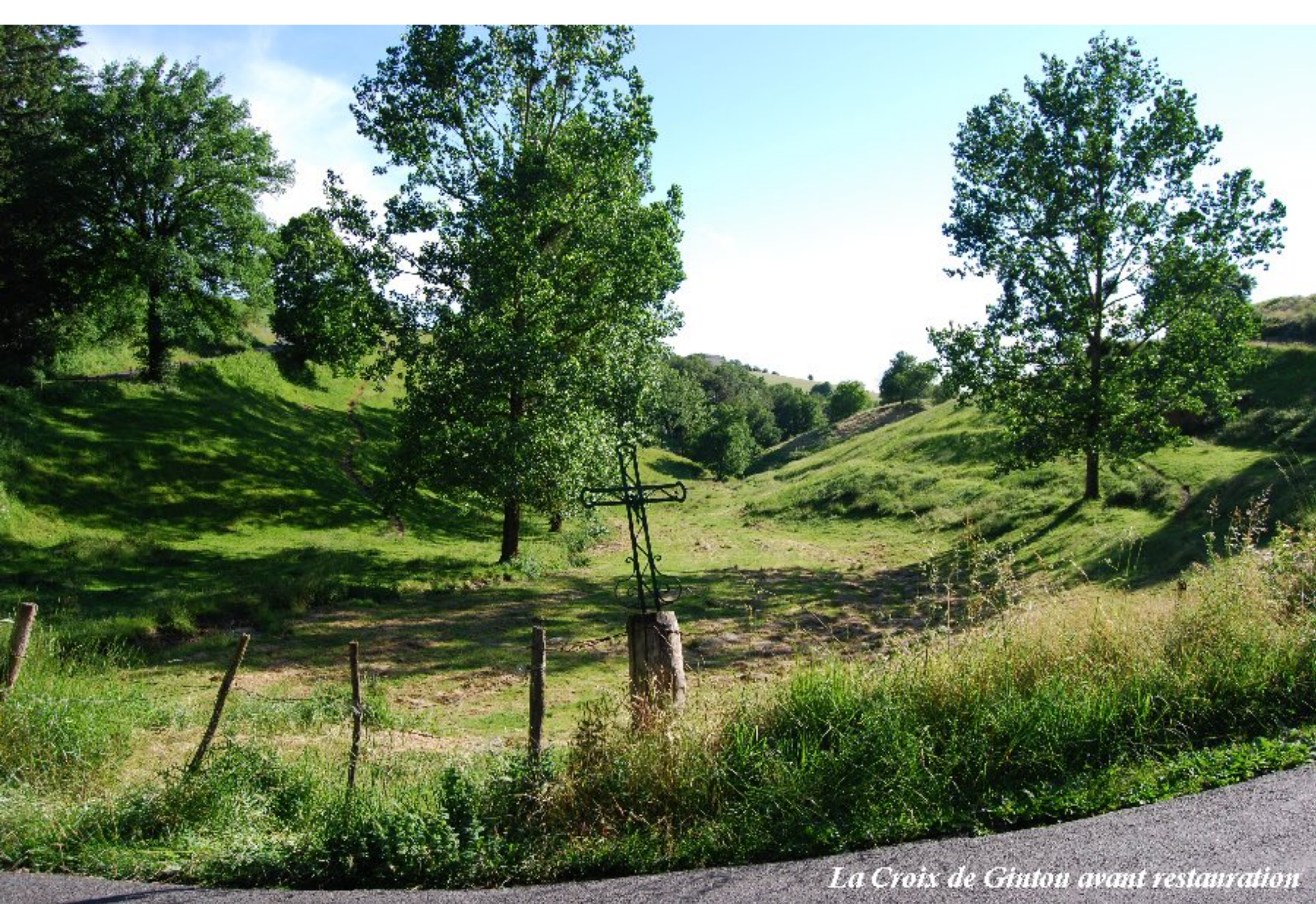
La Croix de Ginton avant restauration