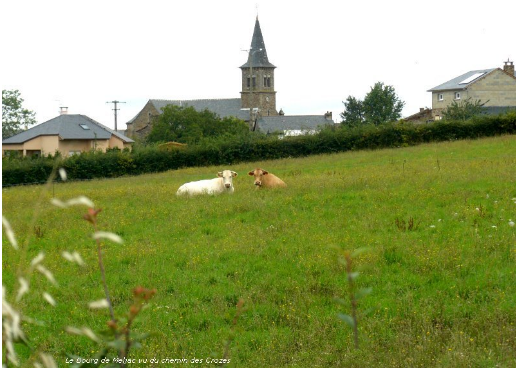
Le Bourg de Meljac vu du chemin des Crozes