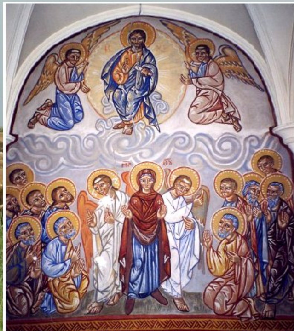
L'Ascension - fresque de Nicolas Greschny église Saint-Benoit de Carmaux