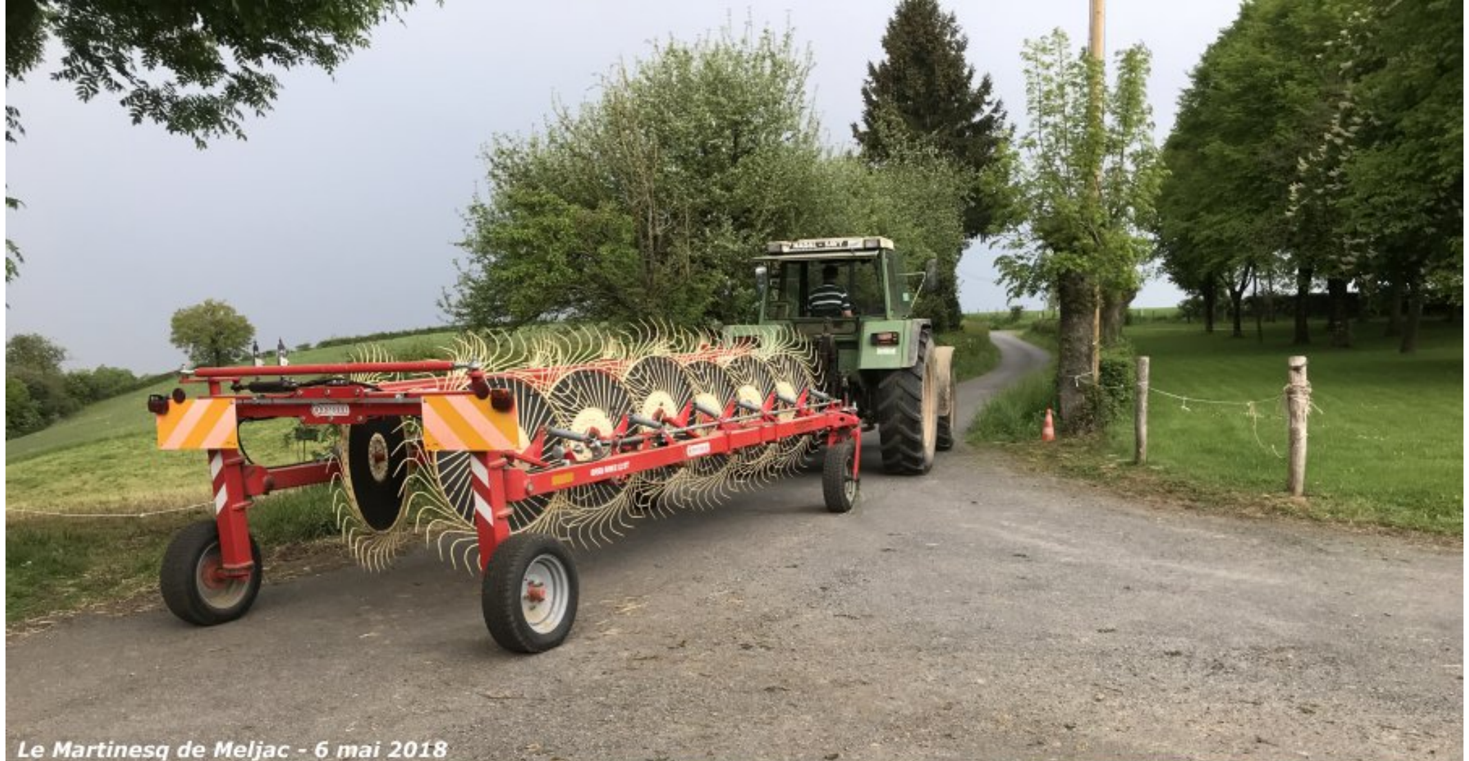
Le Martinesq de Meljac - 6 mai 2018