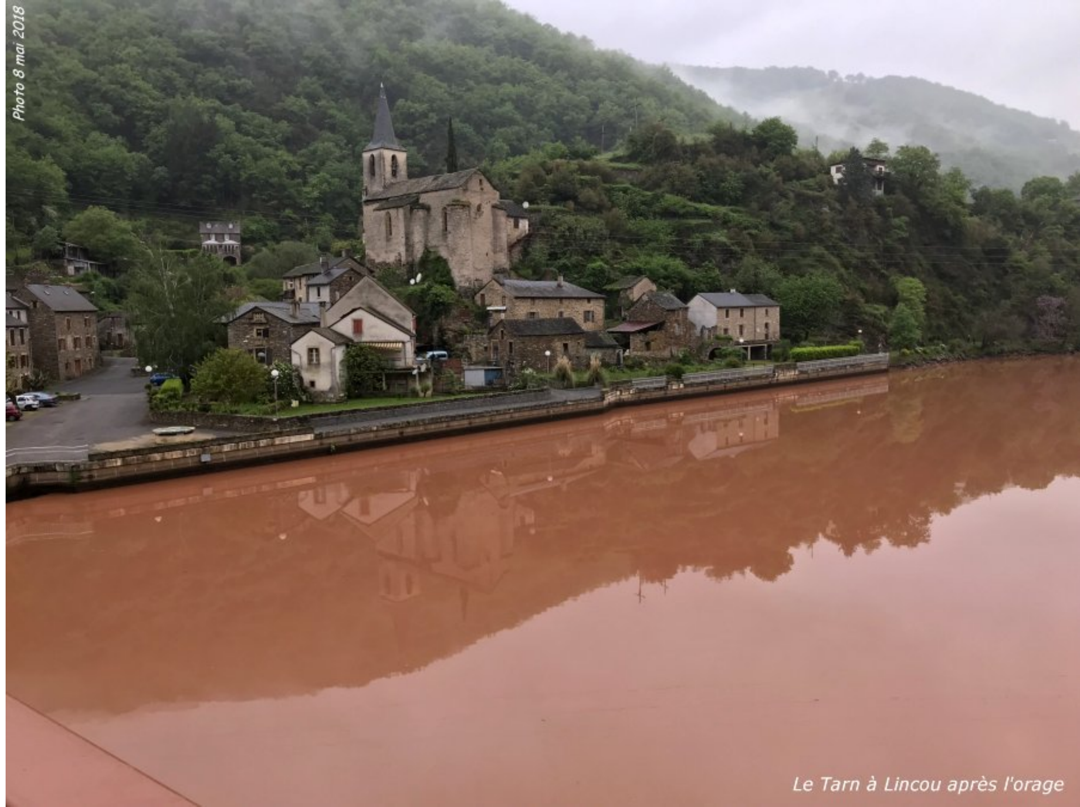
Le Tarn à Lincou après l'orage