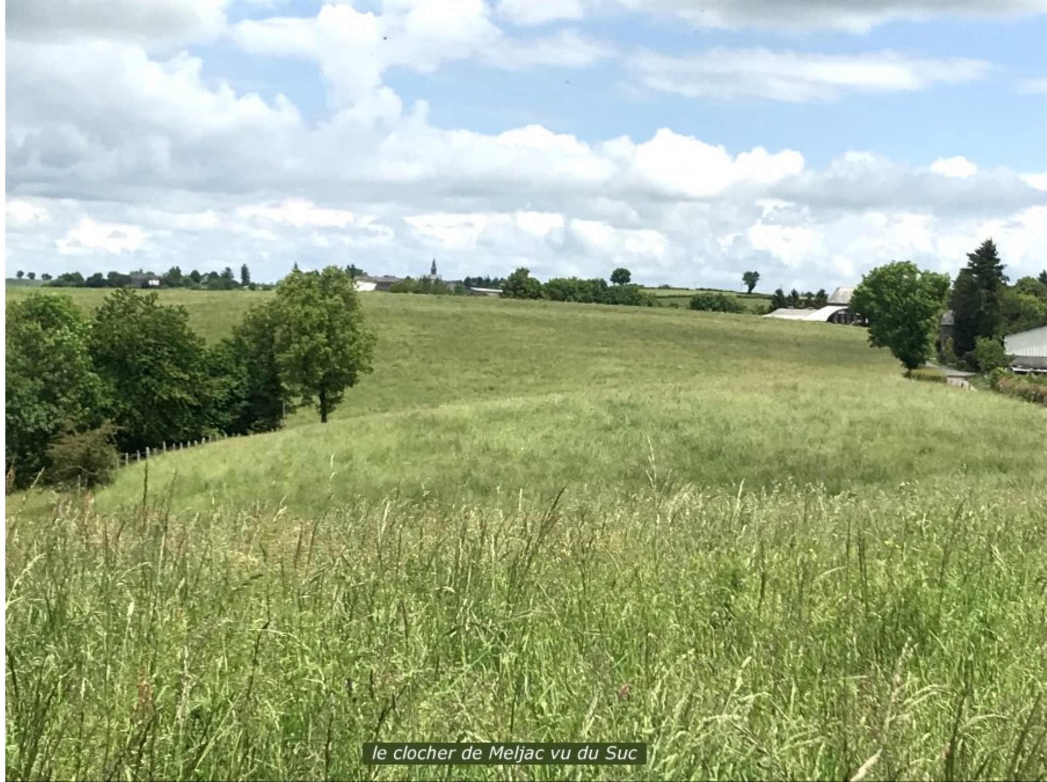
le clocher de Meljac vu du Suc