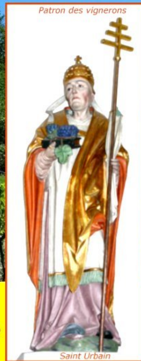
Patron des vignerons