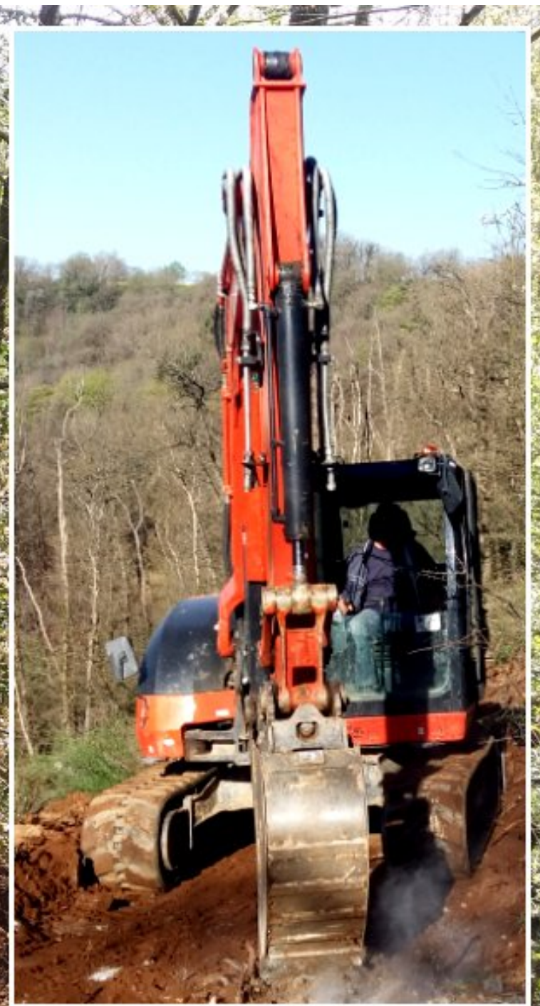
ouverture d'un chemin chez Daniel Tayac -Grascazes