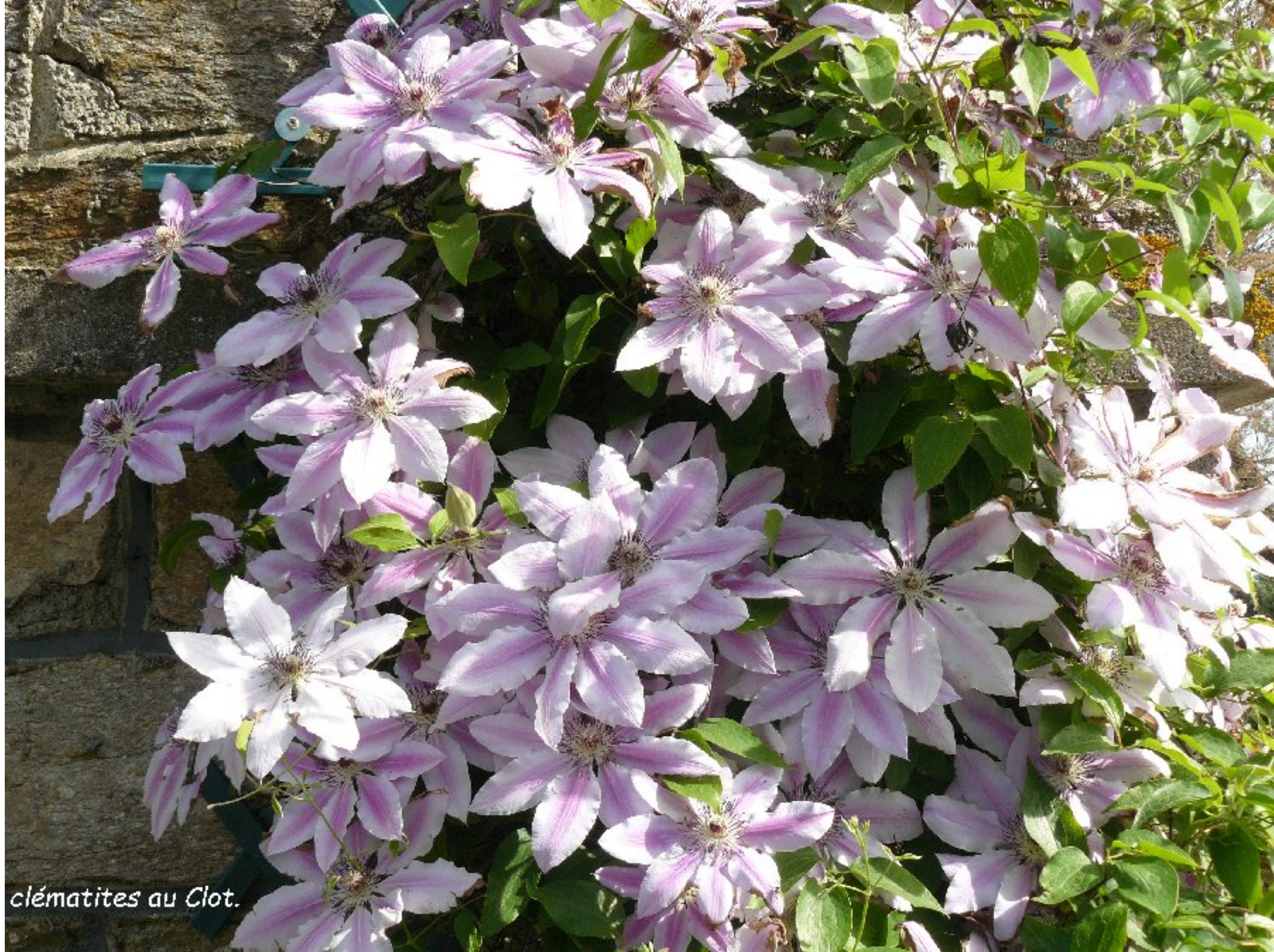
clématites au Clot.