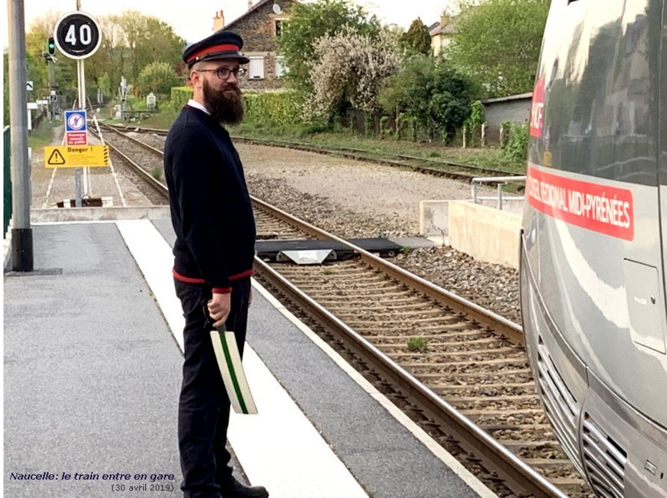
Naucelle: le train entre en gare (30 avril 2019)