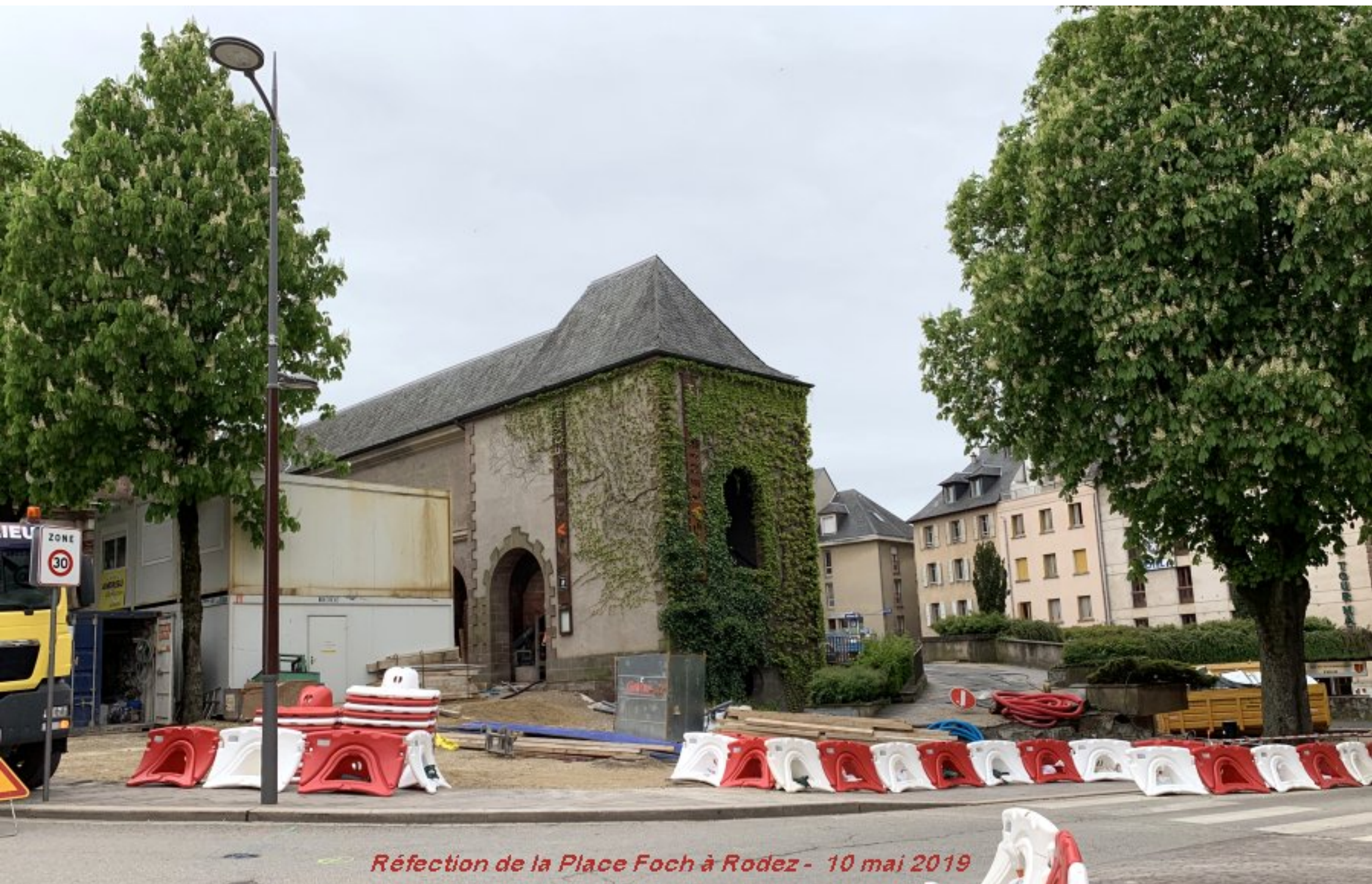
Réfection de la Place Foch à Rodez - 10 mai 2019