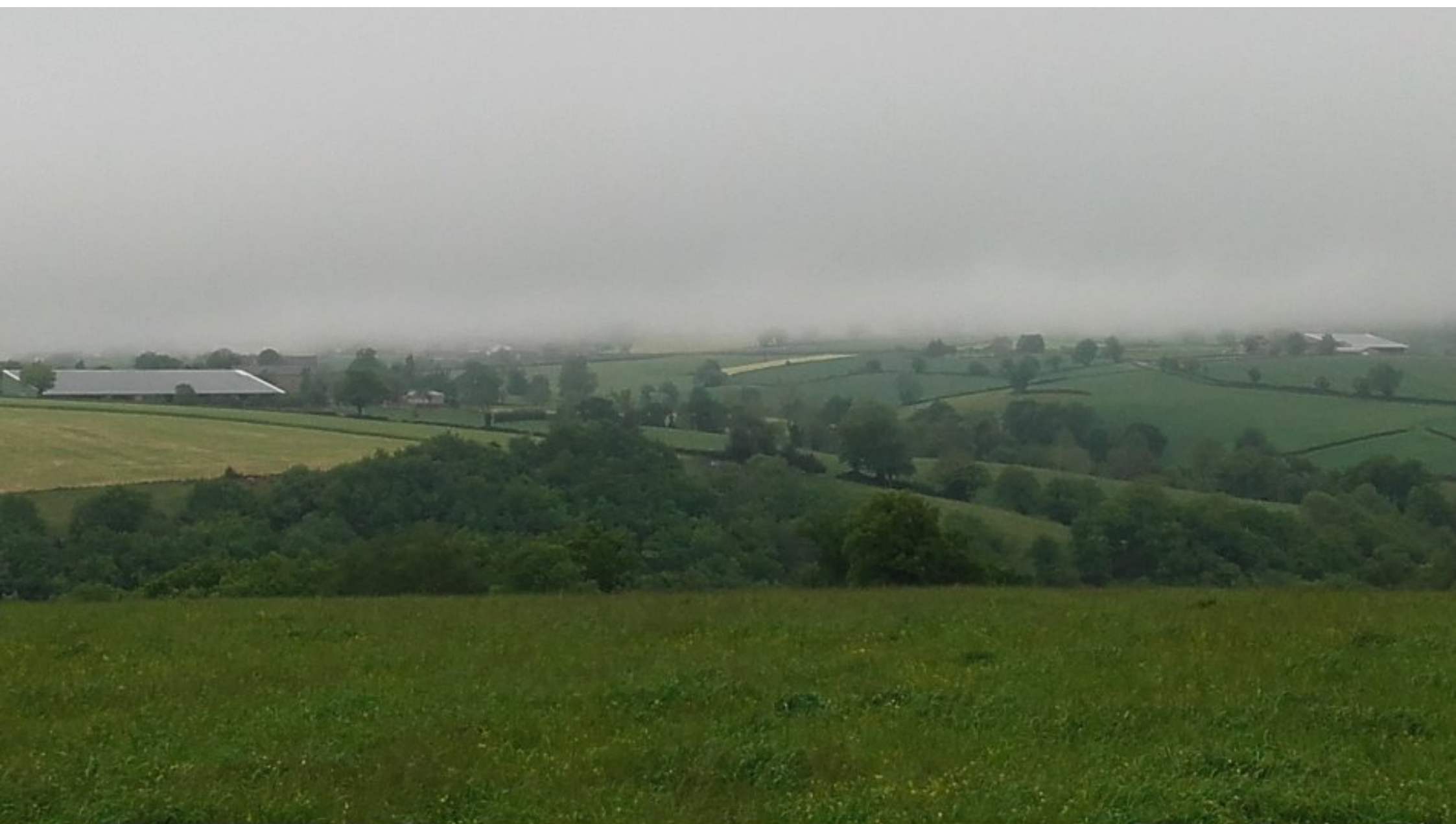
Vue du ciel sur Meljac dans les nuages - Dimanche 19 mai 2019