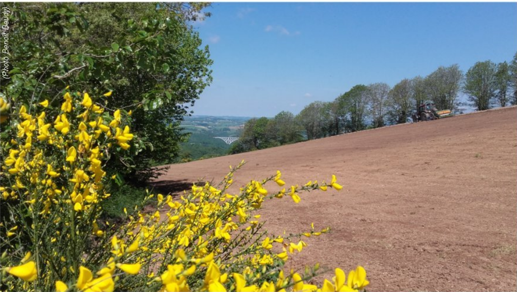
Semis de luzerne au printemps entre genêt et viaduc... (mercredi 22 mai 2019)