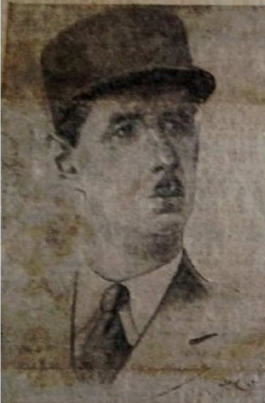
LE GENERAL DE GAULLE