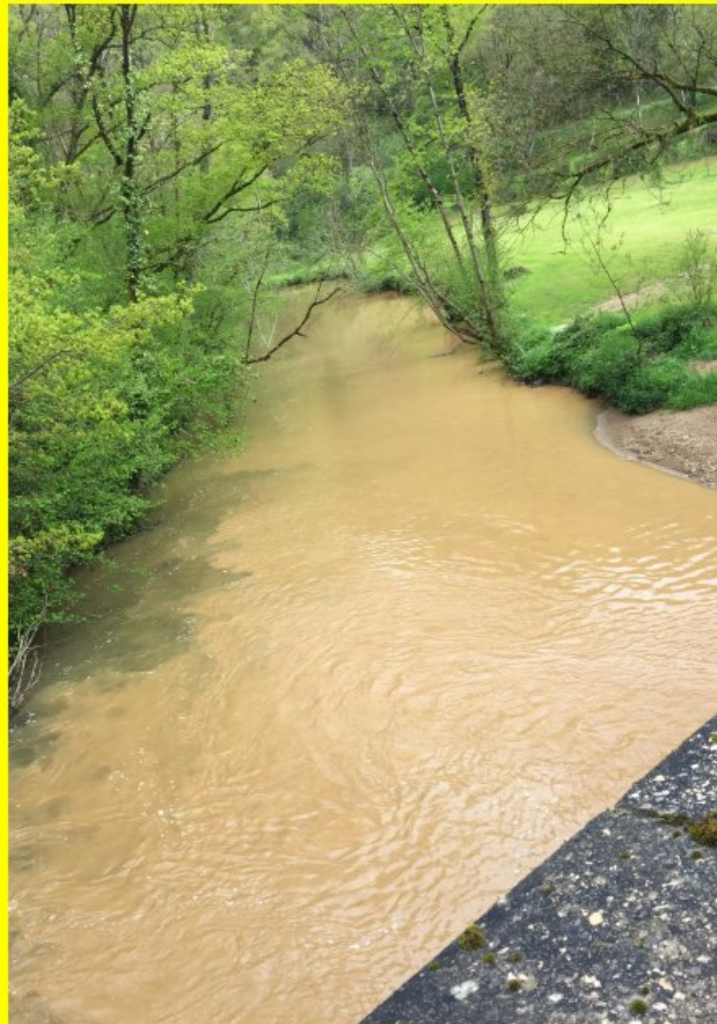
Après l'orage à La Fabrèguerie - 10 mai 2019 (Randonnée des Aînés de Meljac)