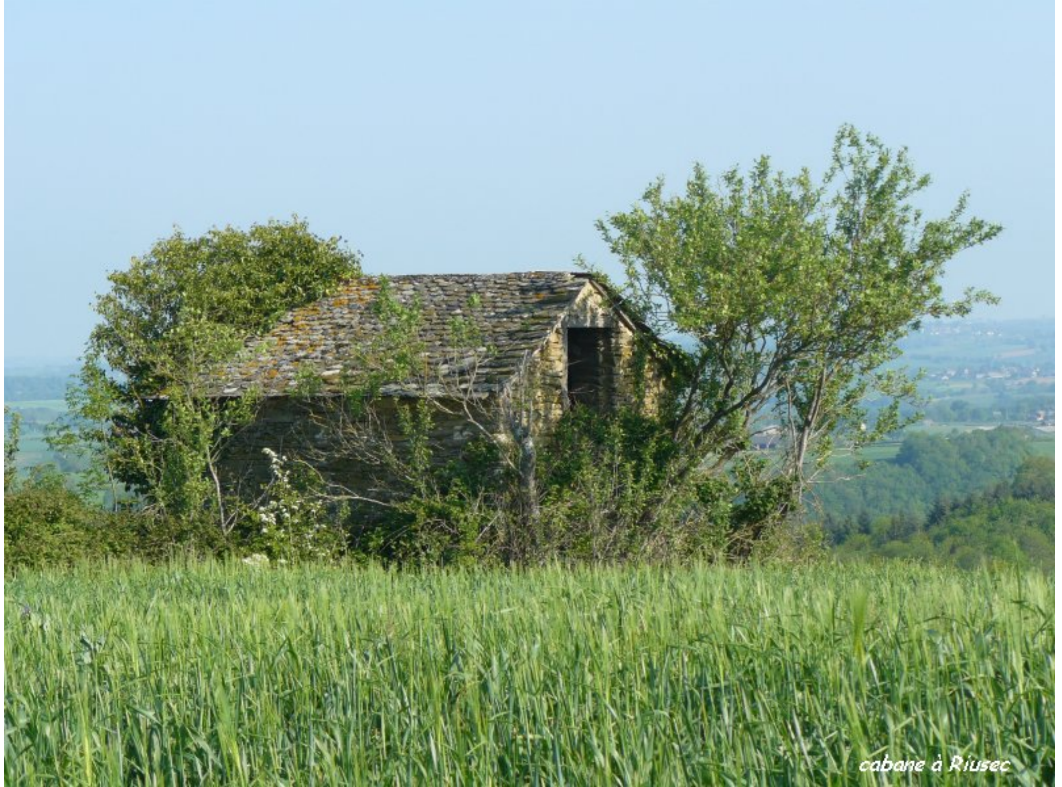
cabane à Riusec