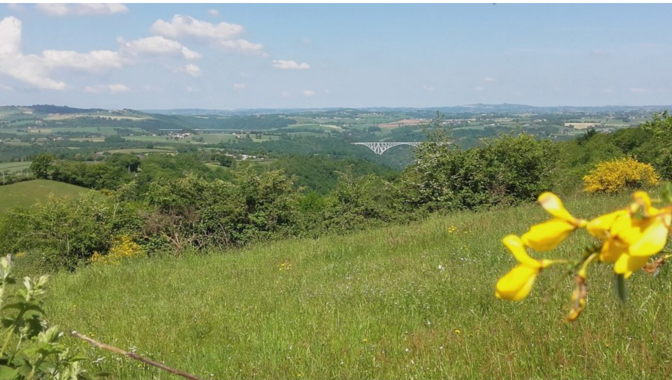
Les deux viaducs du Viaur vus du Puech ce Rouet (mai 2019)