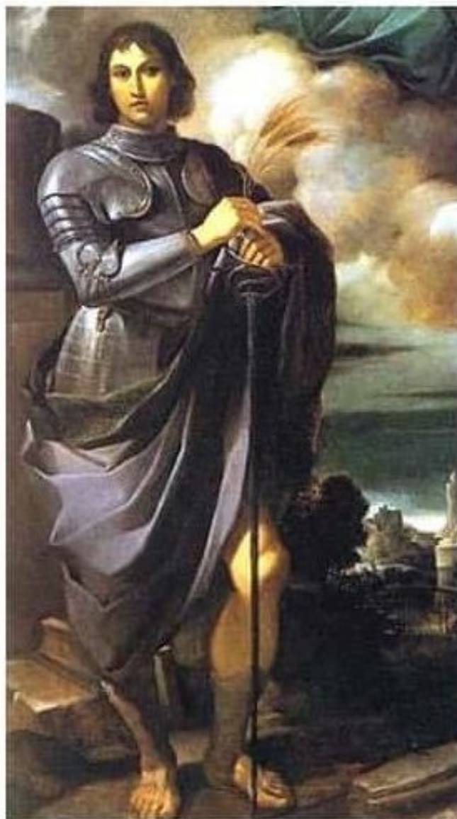
Saint Pancrace 12 mai