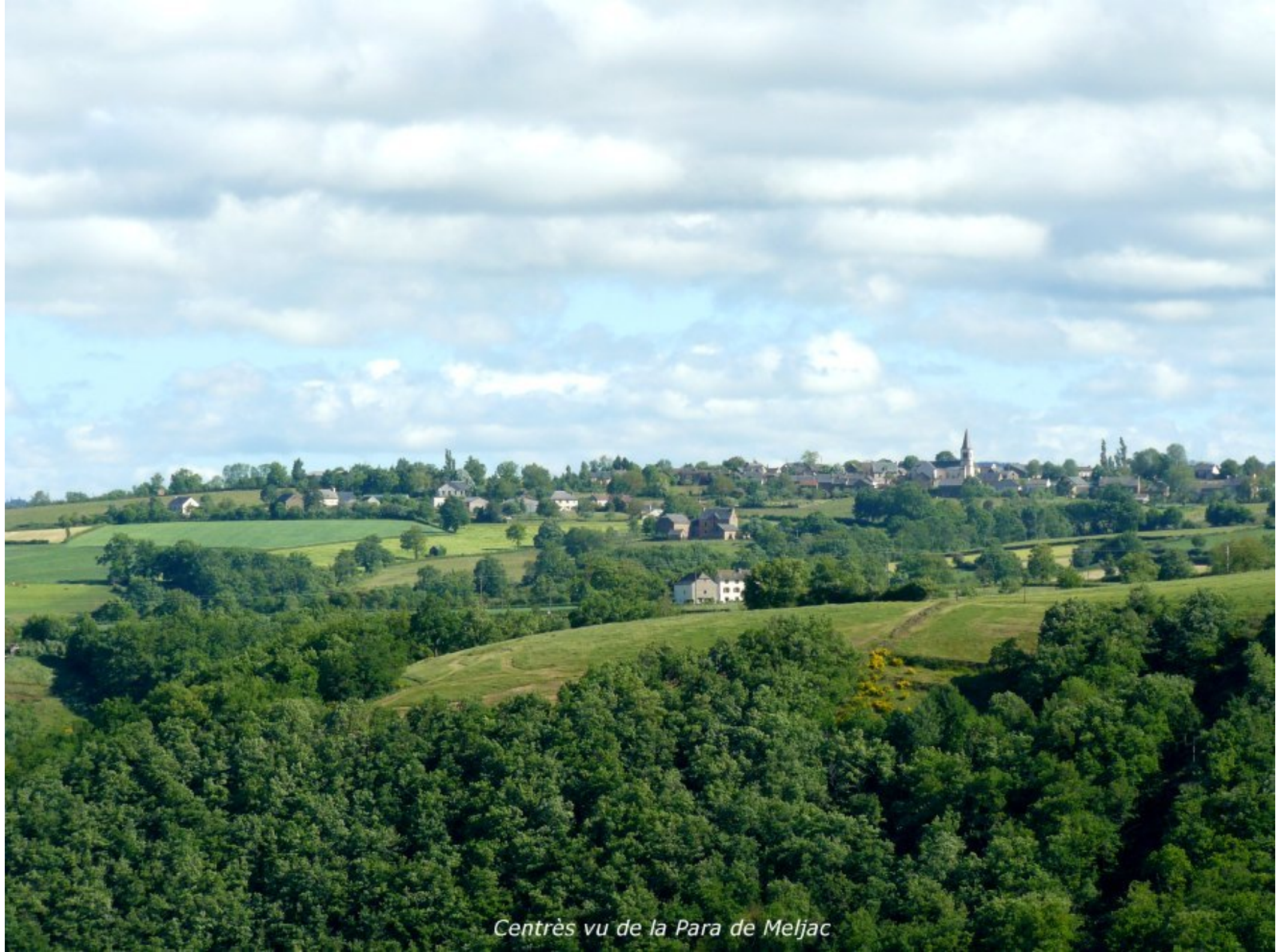
Centrès vu de la Para de Meljac