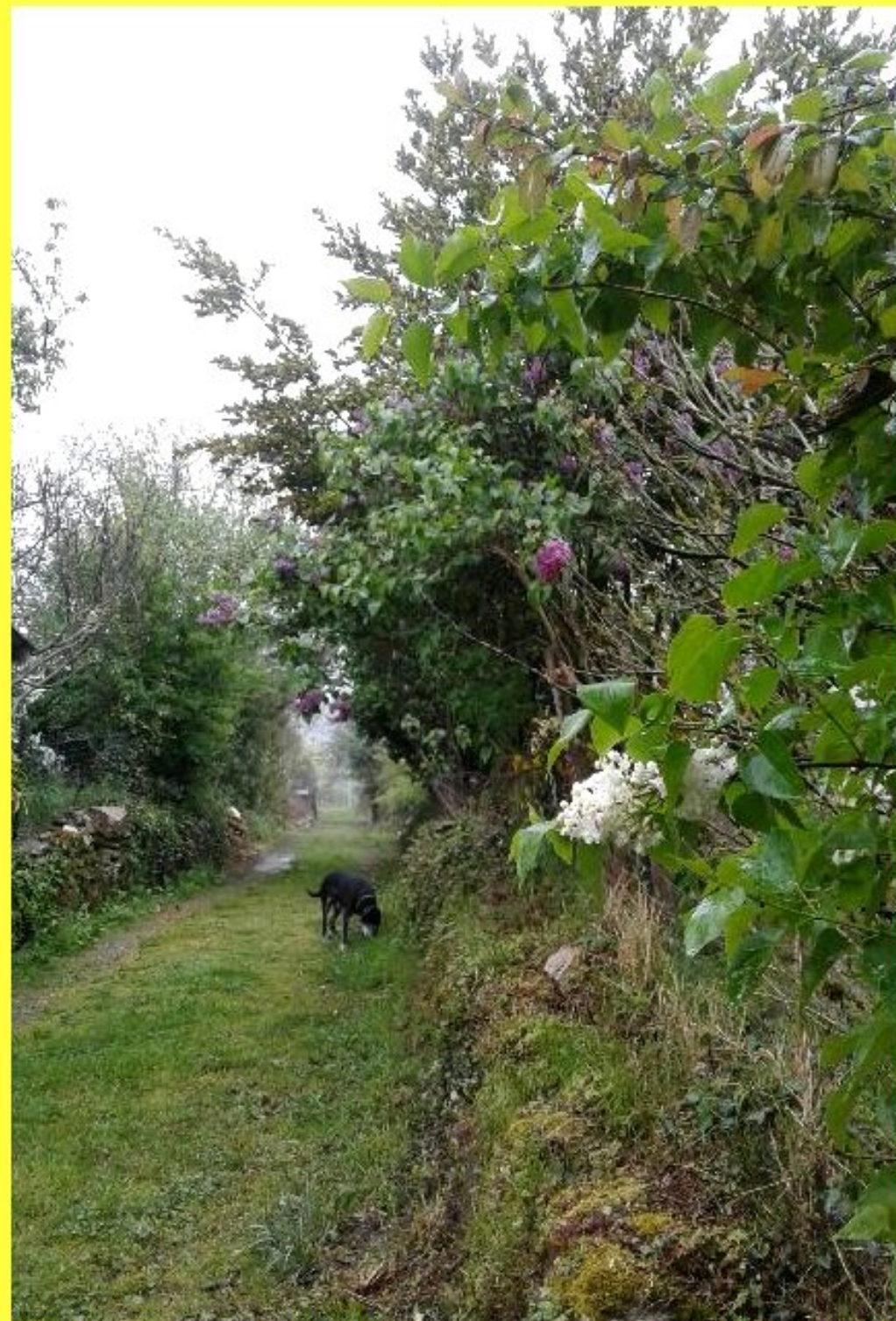
1er mai 2021- Promenade meljacoise avec Charly