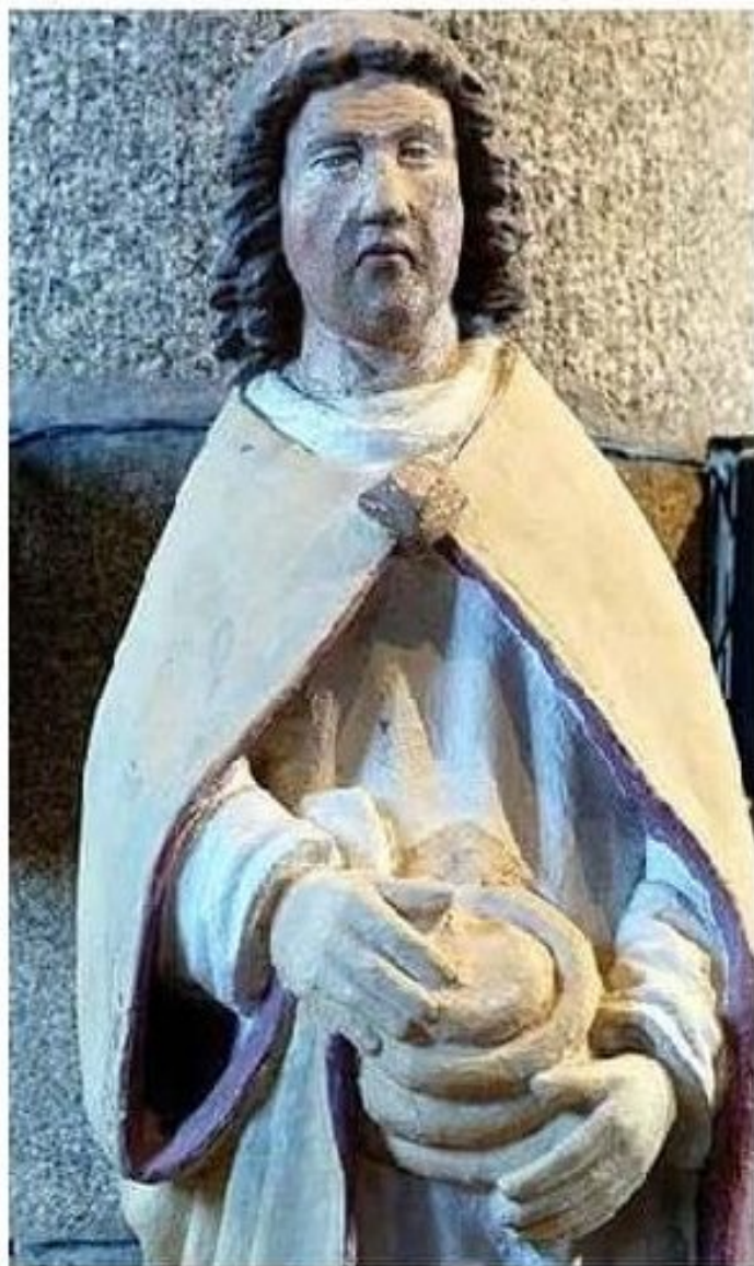
Saint Mamert 11 mai