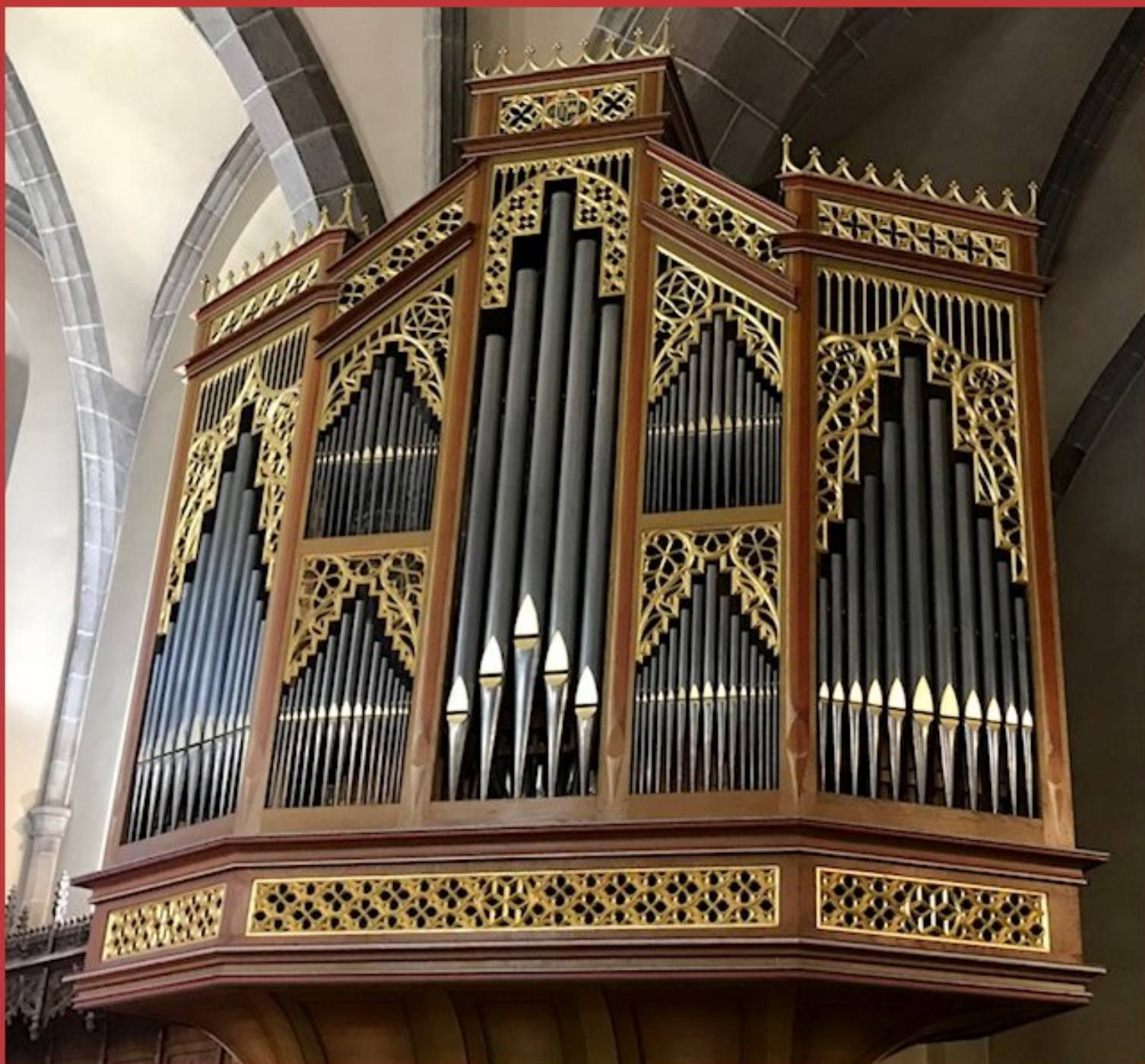
Buffet d'orgue de l'église de Naucelle