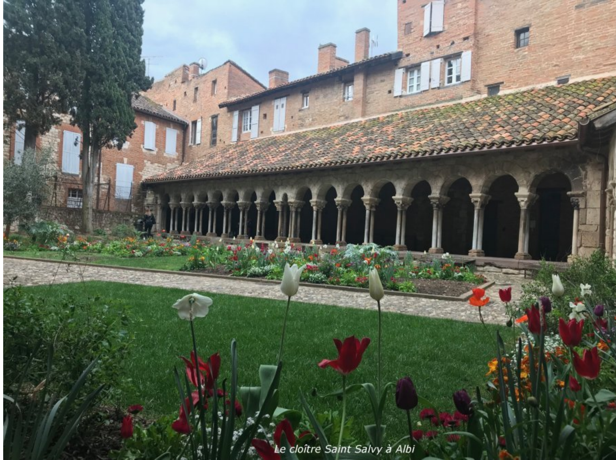
Le cloître Saint Salvy à Albi