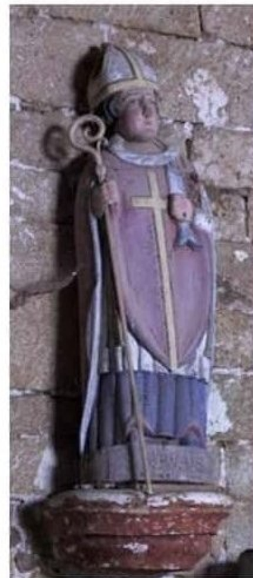
Saint Servais 13 mai

Si les saints célébrés inscrits au calendrier ont pu changer, les dates des Saints de glace, elles, sont restées les mêmes. Il s'agit du 11, 12, et 13 mai. À chacun de ces Saints son dicton, qui peut s'avérer d'une aide précieuse pour les jardiniers. Ainsi le 11 mai, a-t-on coutume d'entendre: « Le premier saint de glace souvent, tu en gardes la trace ». Le 12 mai, « saint Pancrace souvent apporte la glace » et enfin le 13 mai: « Avant saint Servais point d'été, après saint Servais plus de gelée ».