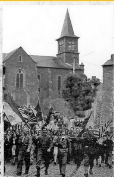
A Meljac, la victoire est fêtée... p.3