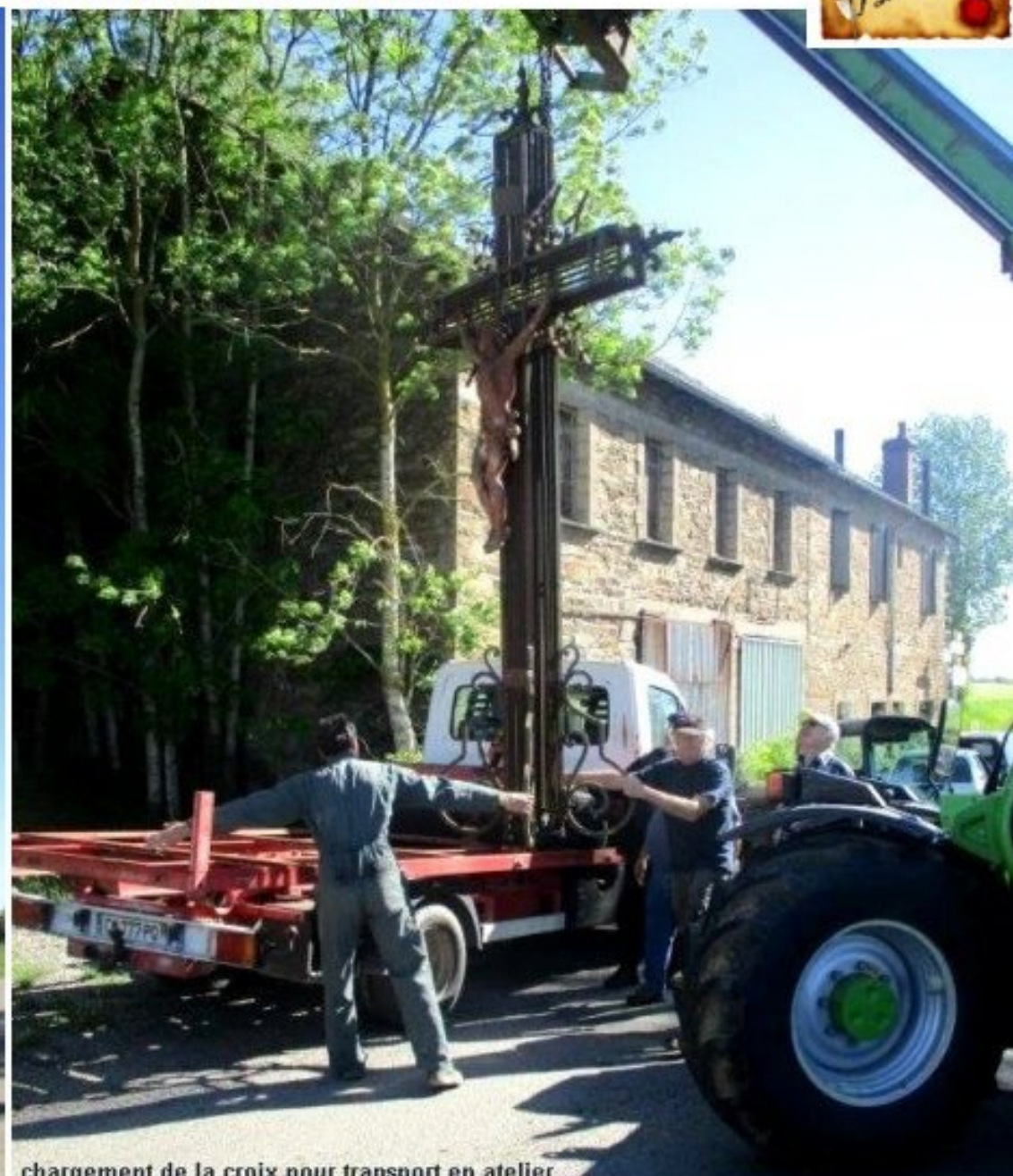
chargement de la croix pour transport en atelier

Mercredi 11 mai 2022 - la 1ère phase de la rénovation de la Croix de l'Homme Mort aura consisté à retirer la Croix de son socle (pour permettre la réfection du socle) et à la transporter en atelier pour restaurer d'une part la structure fer-fonte et d'autre part assurer la rénovation du Christ