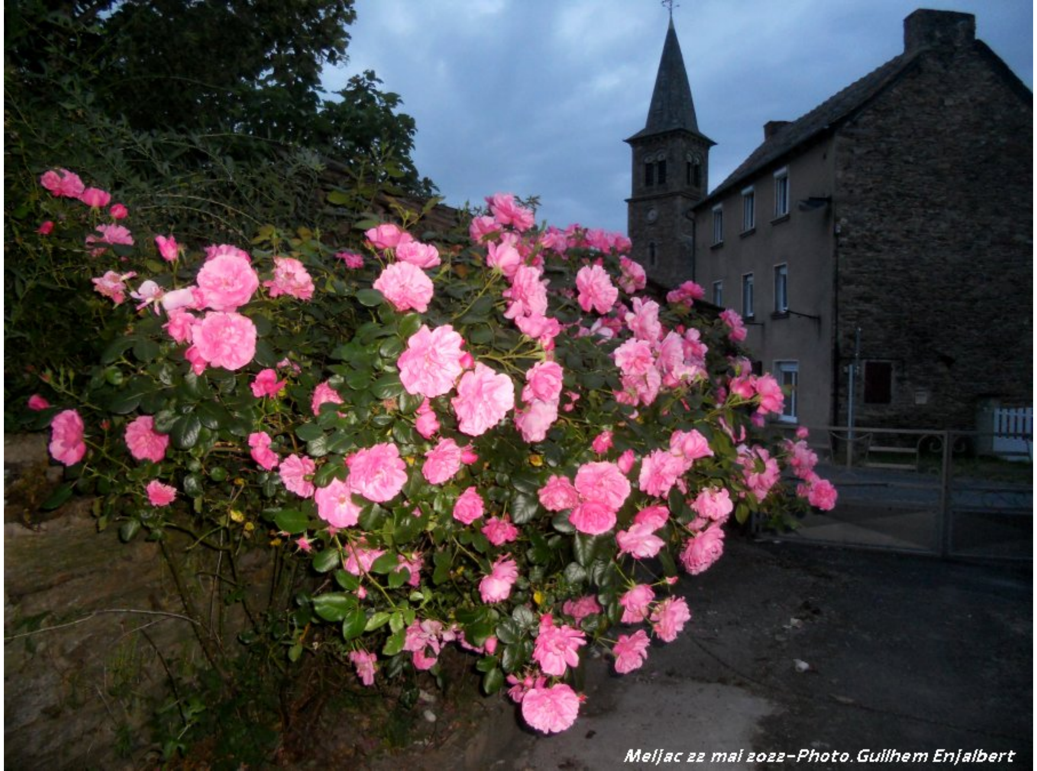
Meljac 22 mai 2022