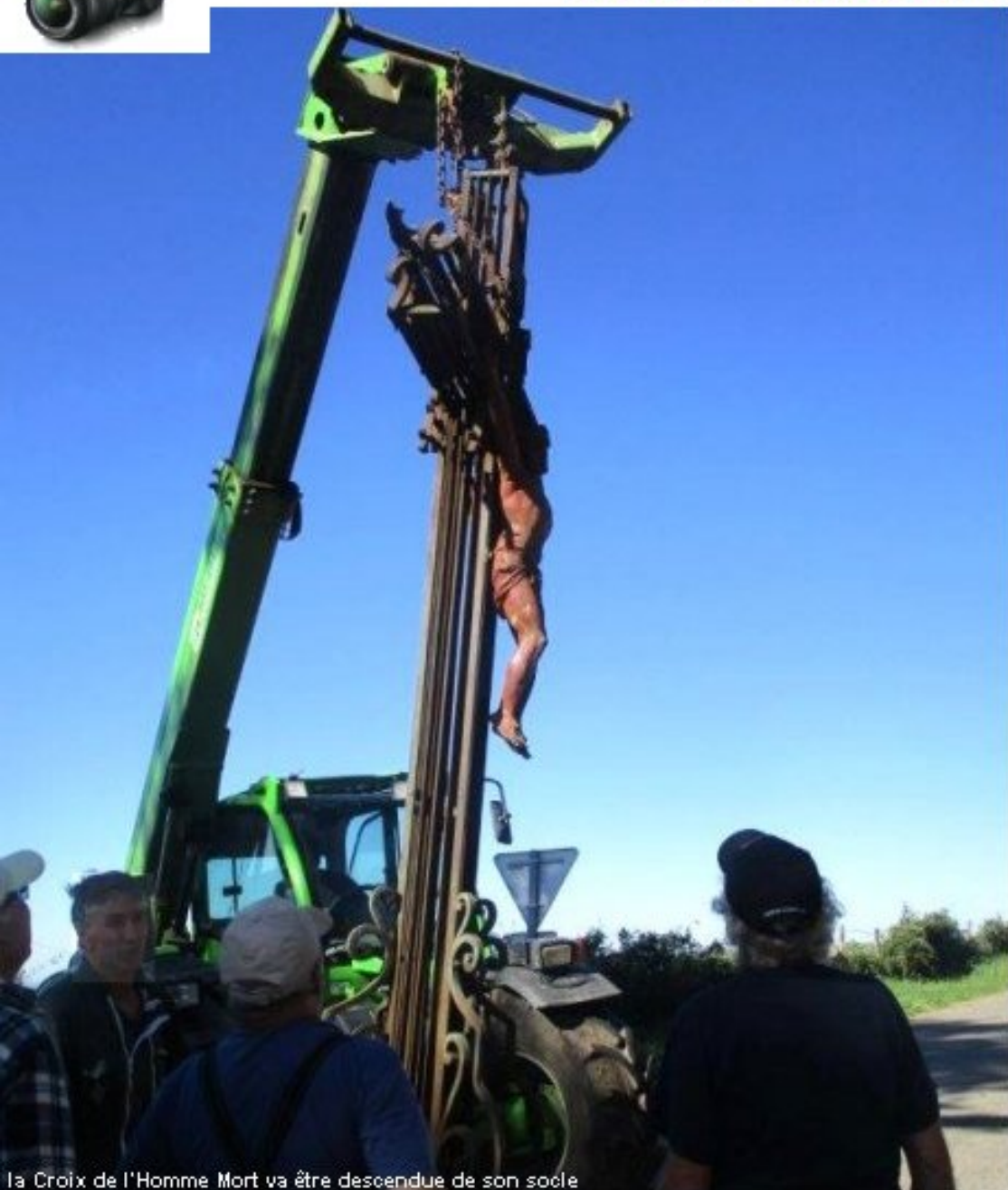
la Croix de l'Homme Mort va être descendue de son socle