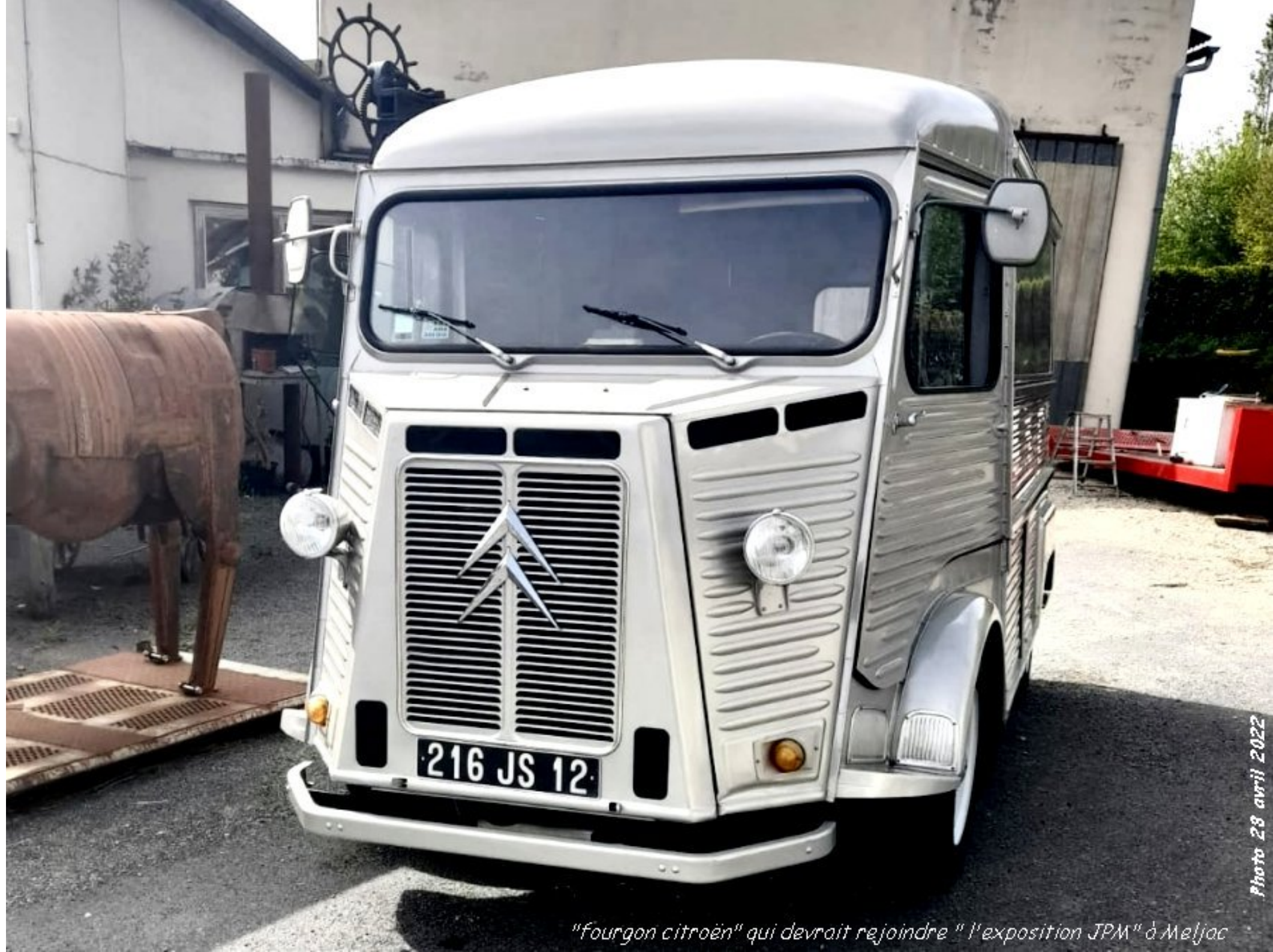
Photo 28 avril 2022