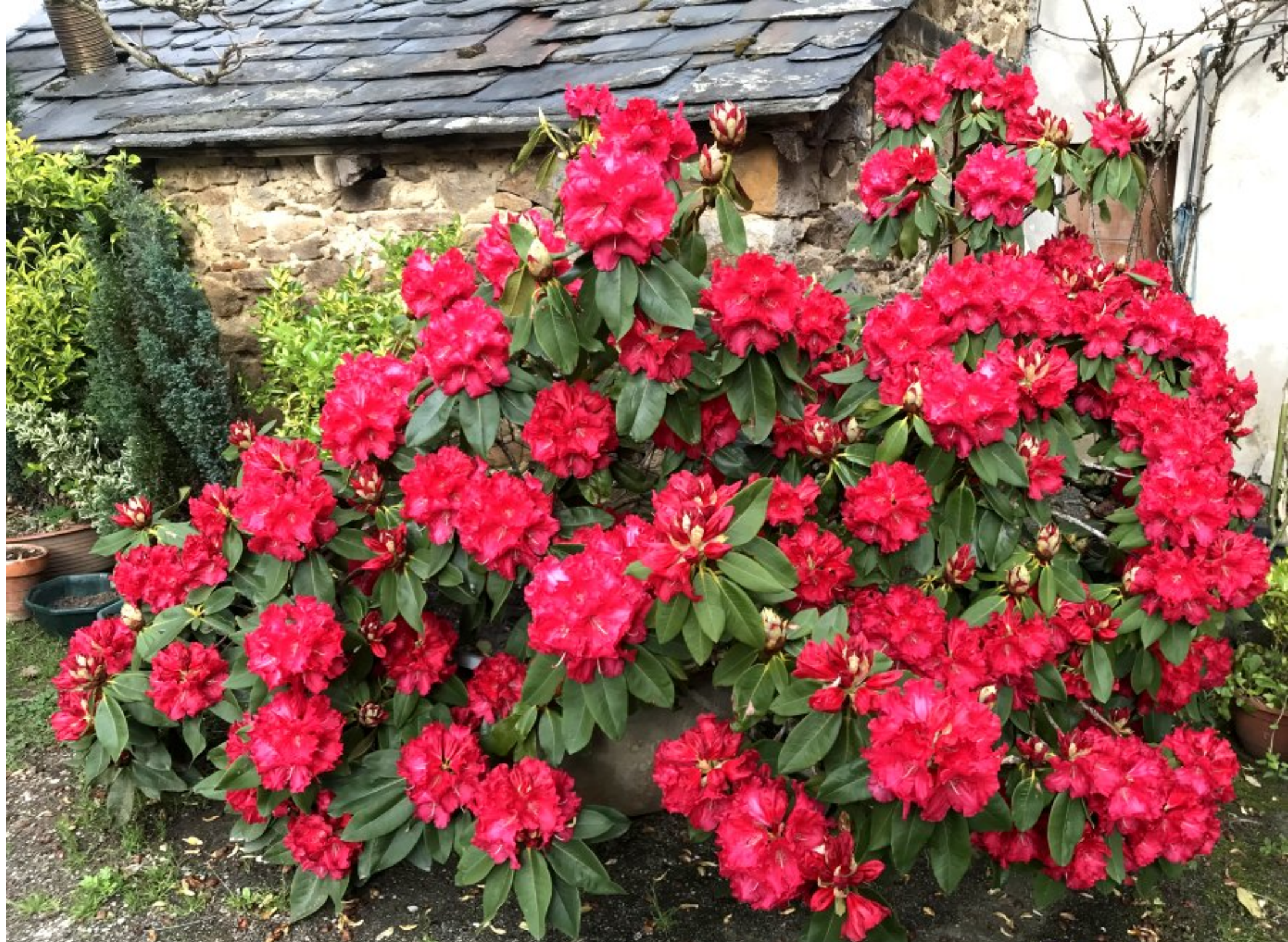
à la Tourénie le rhododendron est en fleurs