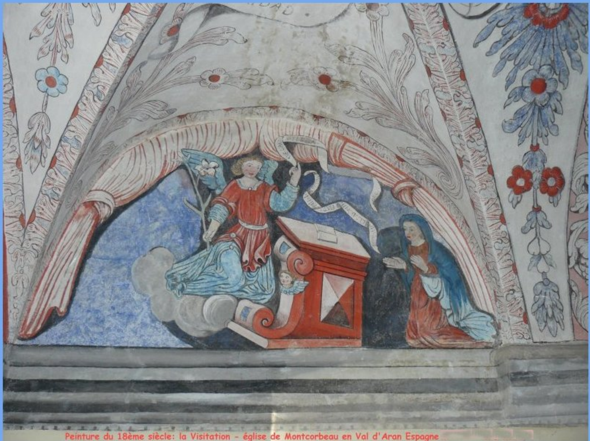
Peinture du 18ème siècle: la Visitation - église de Montcorbeau en Val d'Aran Espagne

La Visitation de la Vierge Marie est une fête chrétienne catholique et chrétienne orthodoxe. Elle est fêtée le 31 mai par les catholiques et le 30 mars par les orthodoxes.