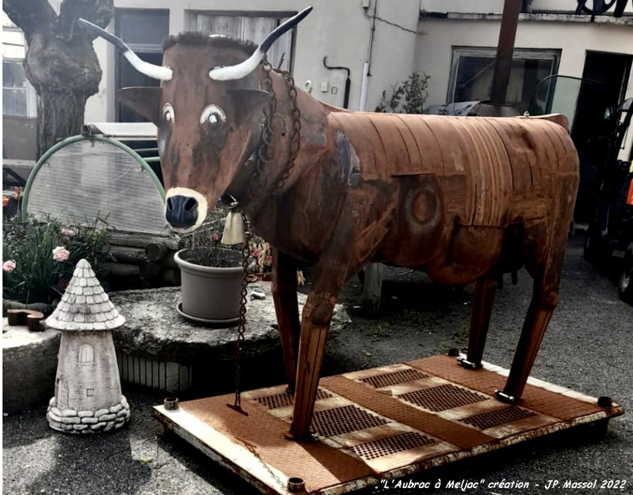
"L'Aubrac à Meljac" création - JP. Massol 2022