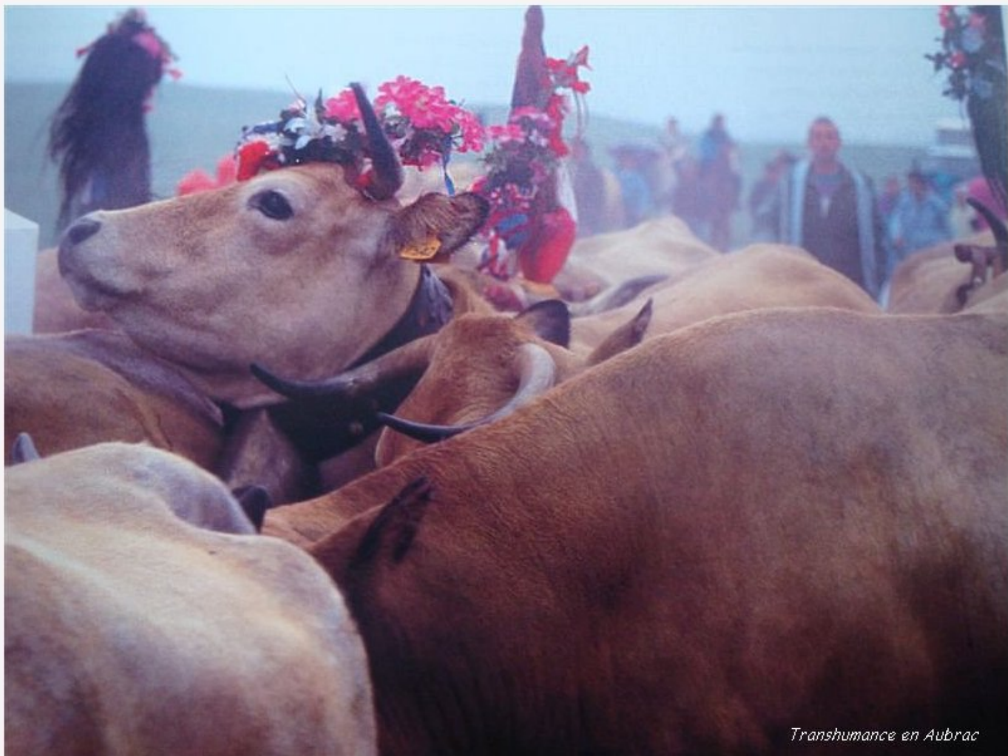
Transhumance en Aubrac