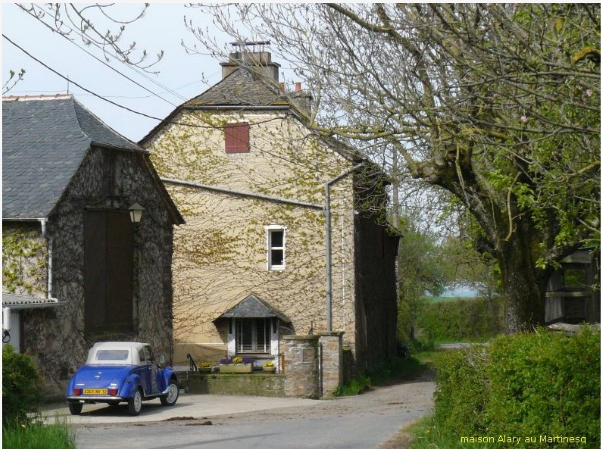
maison Alary au Martinesq