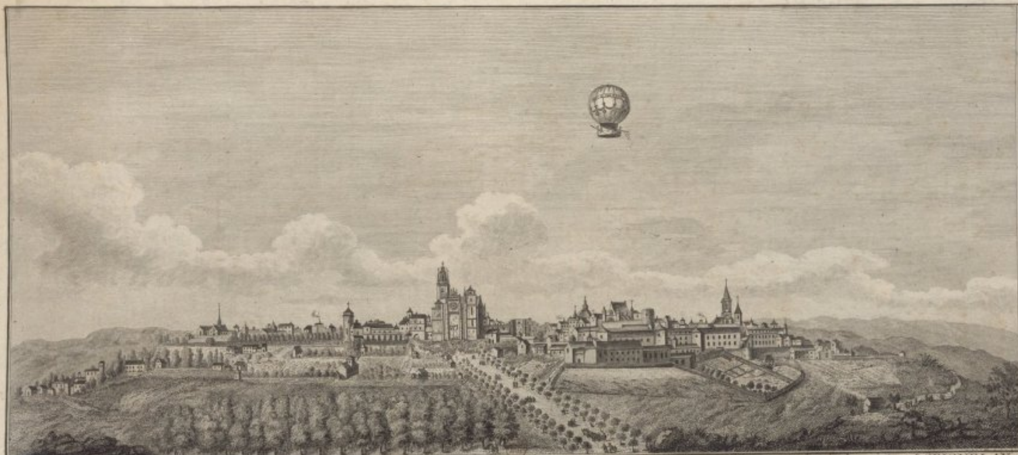
VUE PERSPECTIVE DE LA VILLE DE RODEZ, CAPITALE DU ROUERGUE COLBERT DE CASTLE-HILL, EVEQUE ET COMTE DE RODEZ,

Par son très humble et très Obéissant Serviteur N. J. Carnus, Graveur C'est par un ordre de la cour de la capitale de France, que les auteurs de ce petit ouvrage ont été chargés de donner une idée de la ville de Rodez, et de son clocher, qui est un des plus beaux de France. Ce petit ouvrage est destiné à servir de souvenir à ceux qui ont vu la ville de Rodez, et de son clocher, et à ceux qui ne l'ont pas vue. Il est gravé sur cuivre, et se vend chez les Libraires, et chez les Artistes, à Paris, et dans toutes les Villes de France.