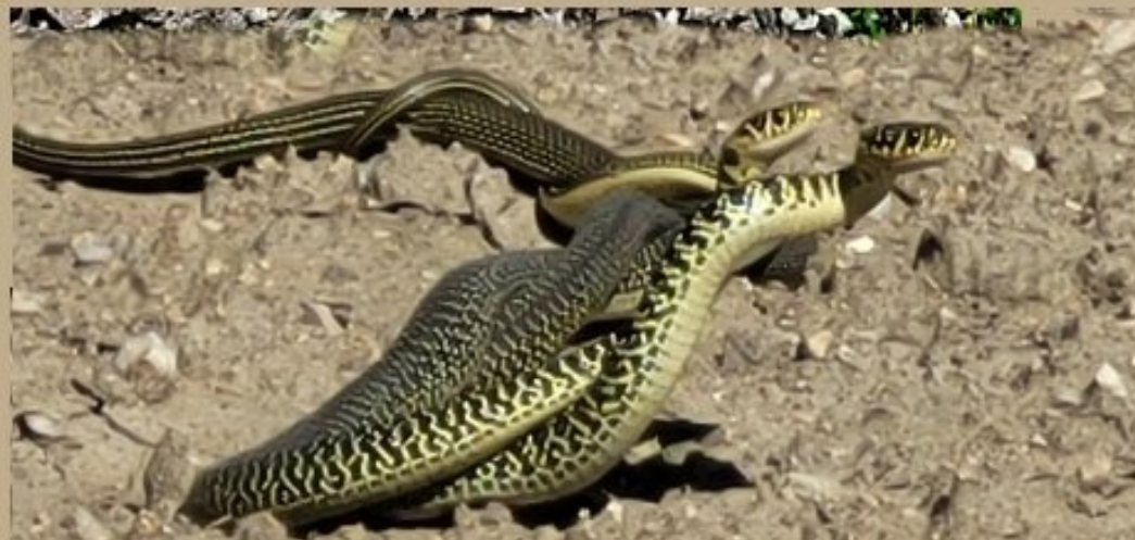
accouplement de couleuvres dans les jardins meljacois 27 mai 2025 au Bourg de Meljac