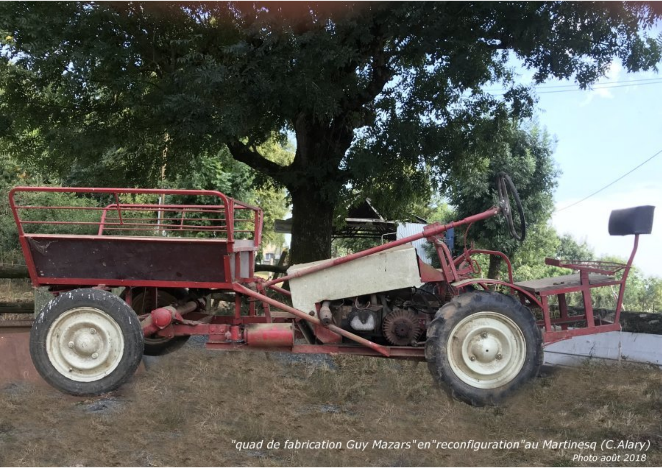
"quad de fabrication Guy Mazars" en "reconfiguration" au Martinesq (C. Alary)