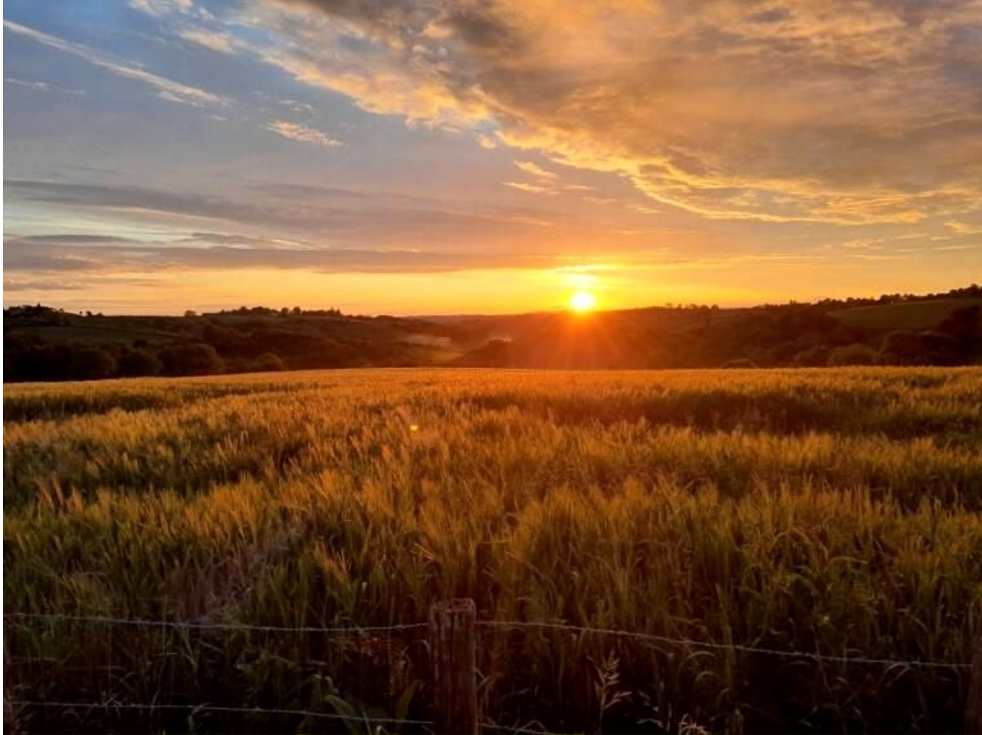
Coucher de soleil sur la vallée du Gintou La Bessière de Meljac 11mai 2025