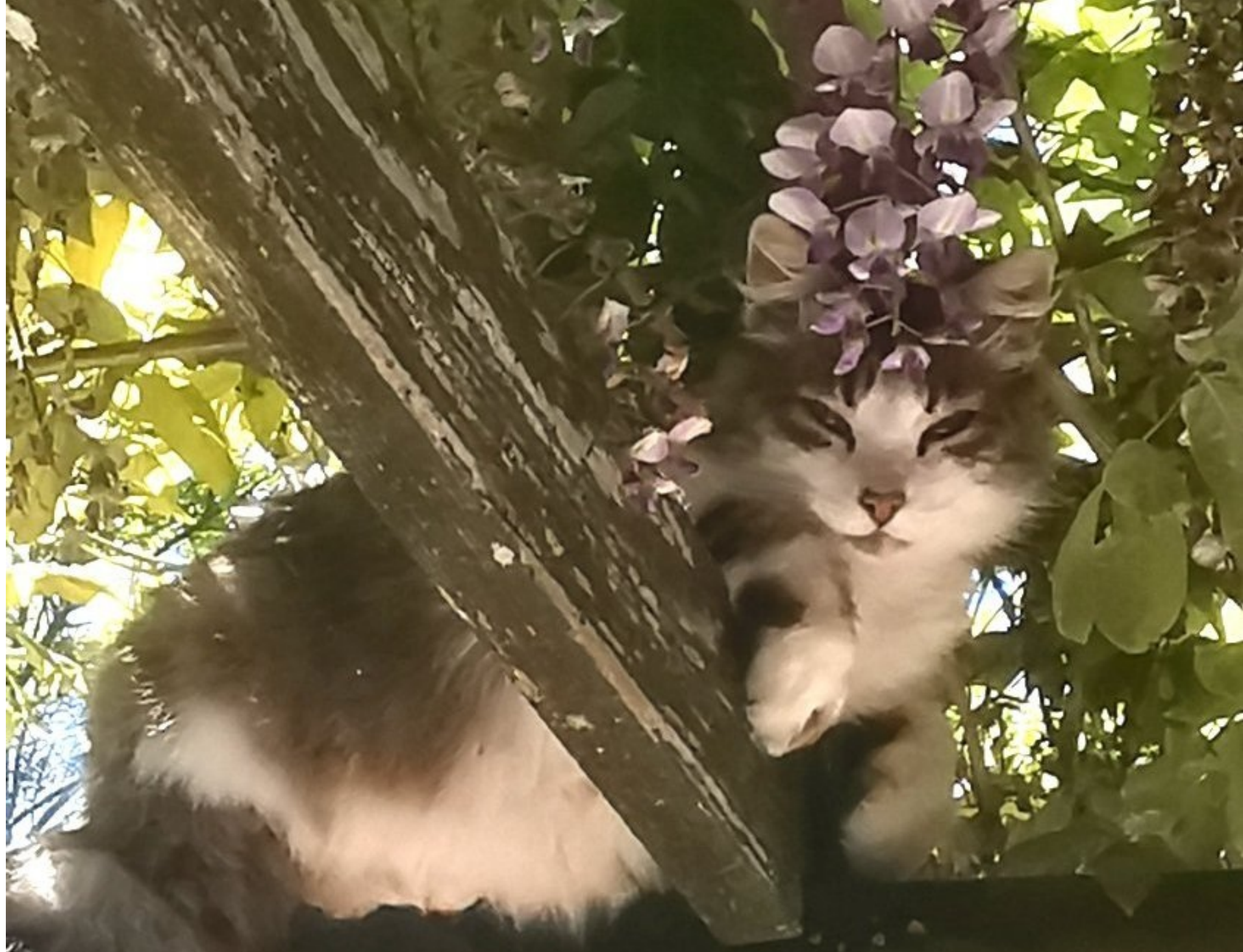
Perchée dans la glycine, Minette surveille les allées et venues à la maison (photo R.Mazars - La Bessière 15 mai 2025)