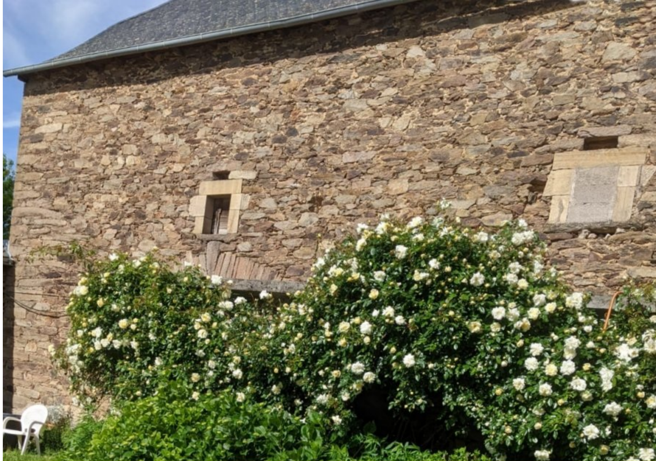
"voici toutes les roses blanches pour la fête des maman" (Photo.Odile Bousquet - 24 mai 2025" Le Pouget de Meljac