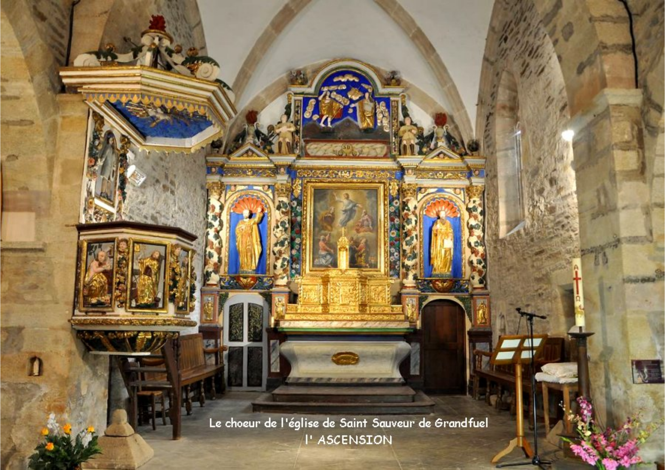
Le choeur de l'église de Saint Sauveur de Grandfuel l' ASCENSION