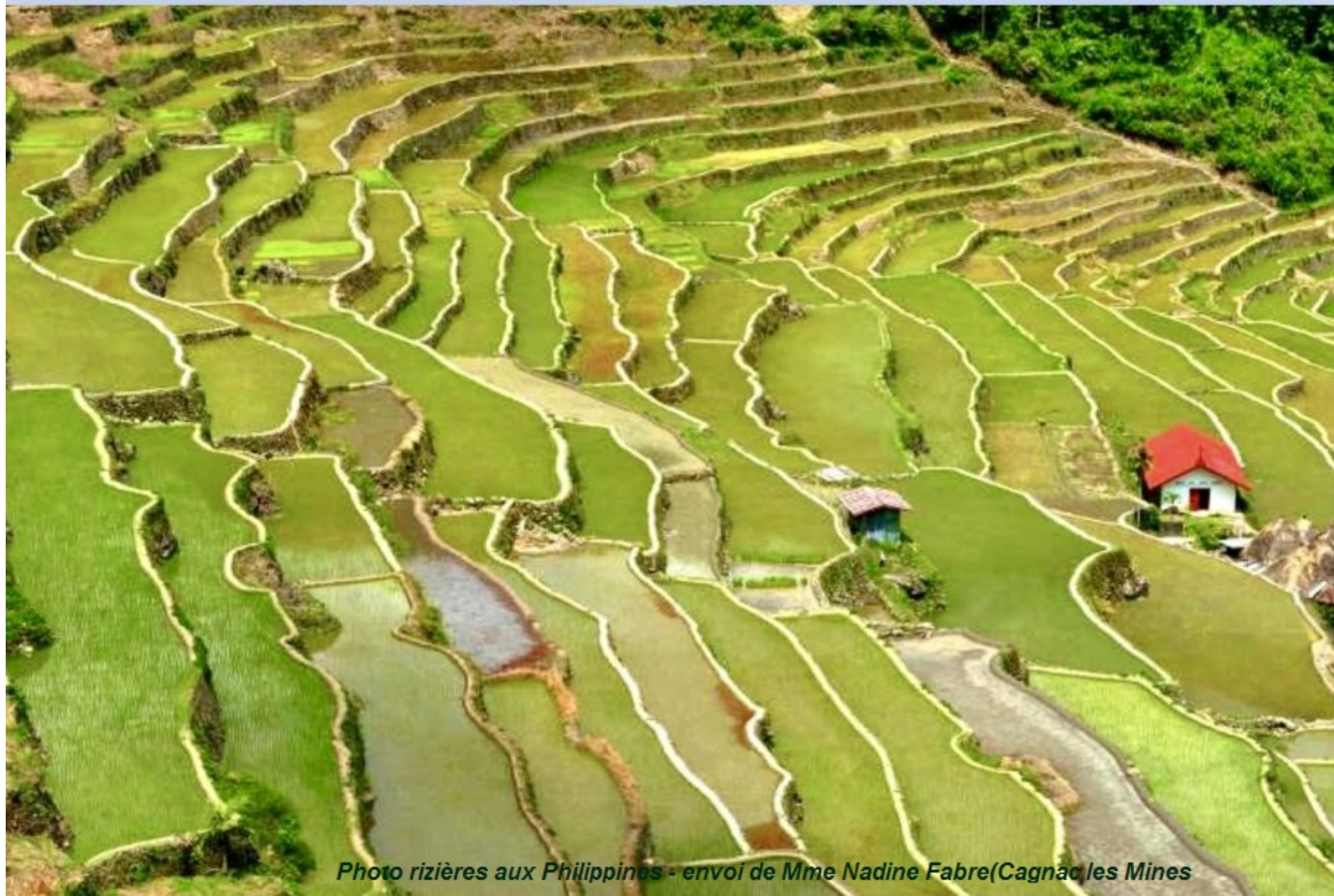
Photo rizières aux Philippines - envoi de Mme Nadine Fabre(Cagnac les Mines

es Rizières de Banaue aux Philippines : Depuis 2 000 ans, les habitants de la région nord de Luçon aux Philippines , se transmettent de génération en génération l'art de cultiver le riz à flanc de colline. Les rizières en terrasse de Banaue , étendues sur plus de 10 000 km 2 , offrent en effet l'un des plus spectaculaires paysages façonnés par l'homme, à voir à environ 10 heures de route de Manille.