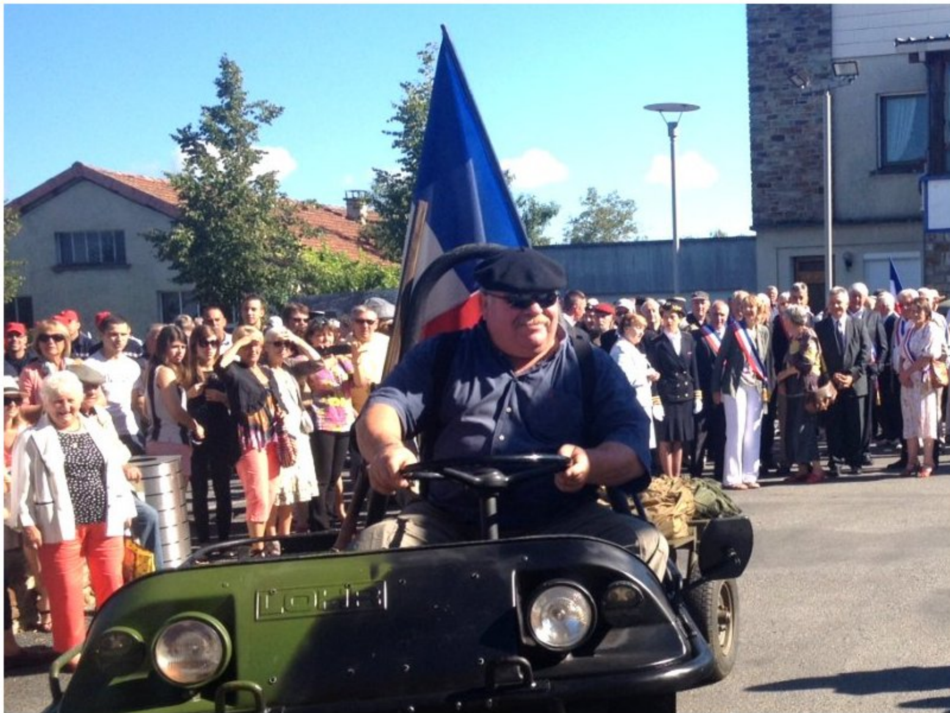
2014 - 70ème anniversaire de la libération du Naucellois