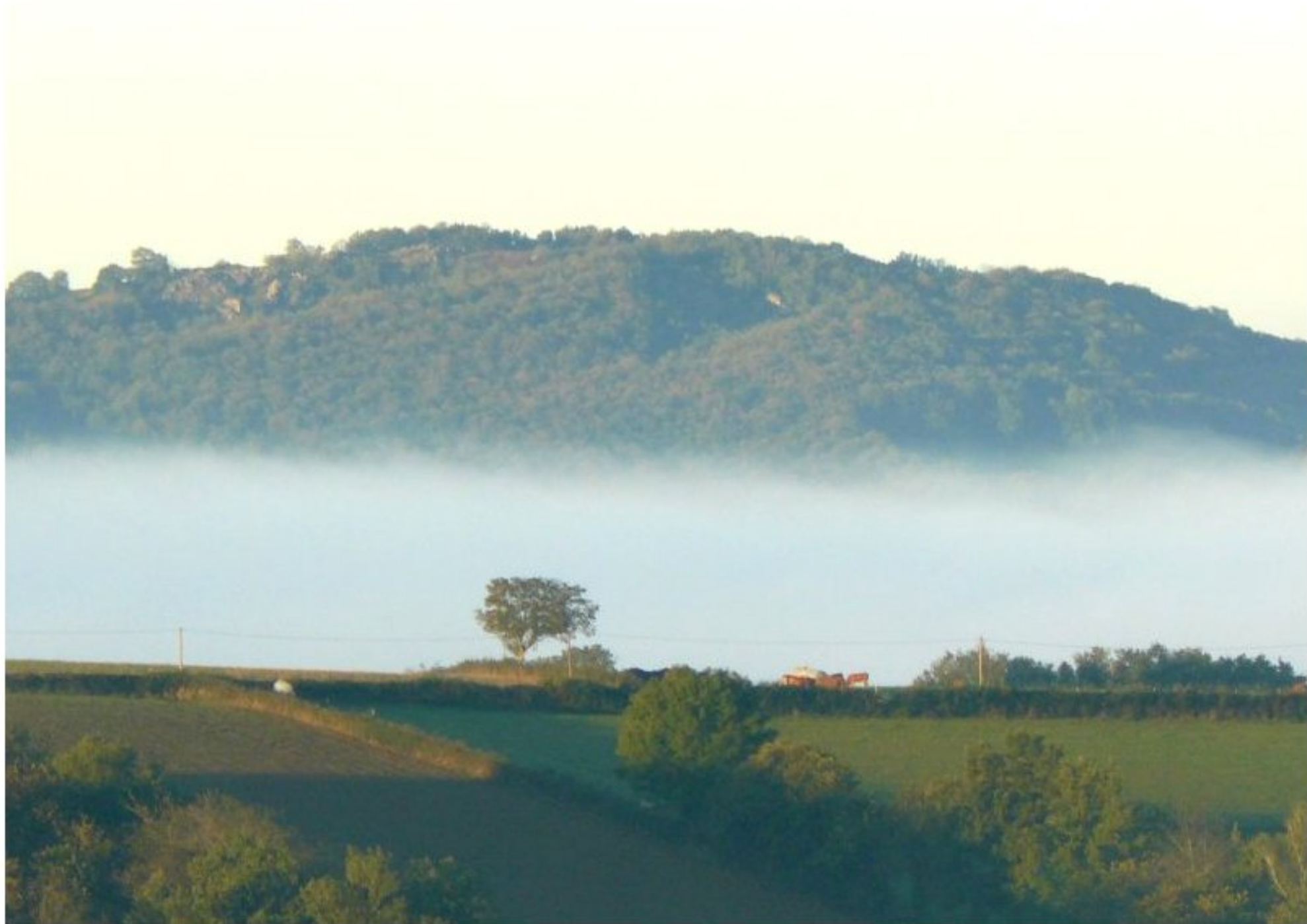
Sur fond de Miramont, brume sur La Lande de Centrès