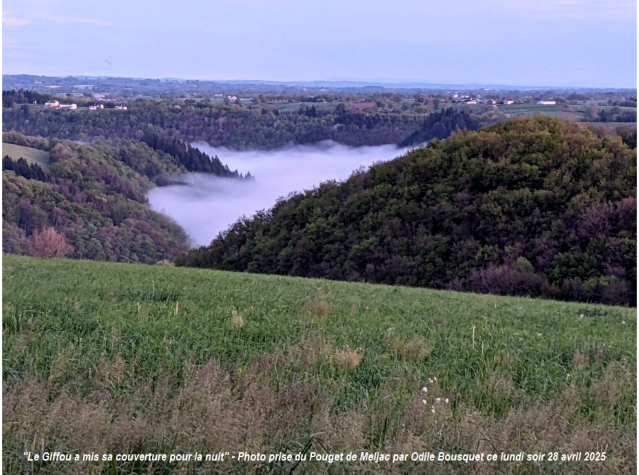
"Le Giffou a mis sa couverture pour la nuit" - Photo prise du Pouget de Meljac par Odile Bousquet ce lundi soir 28 avril 2025