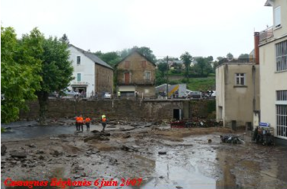
Cassagnes Béghonès 6 juin 2007