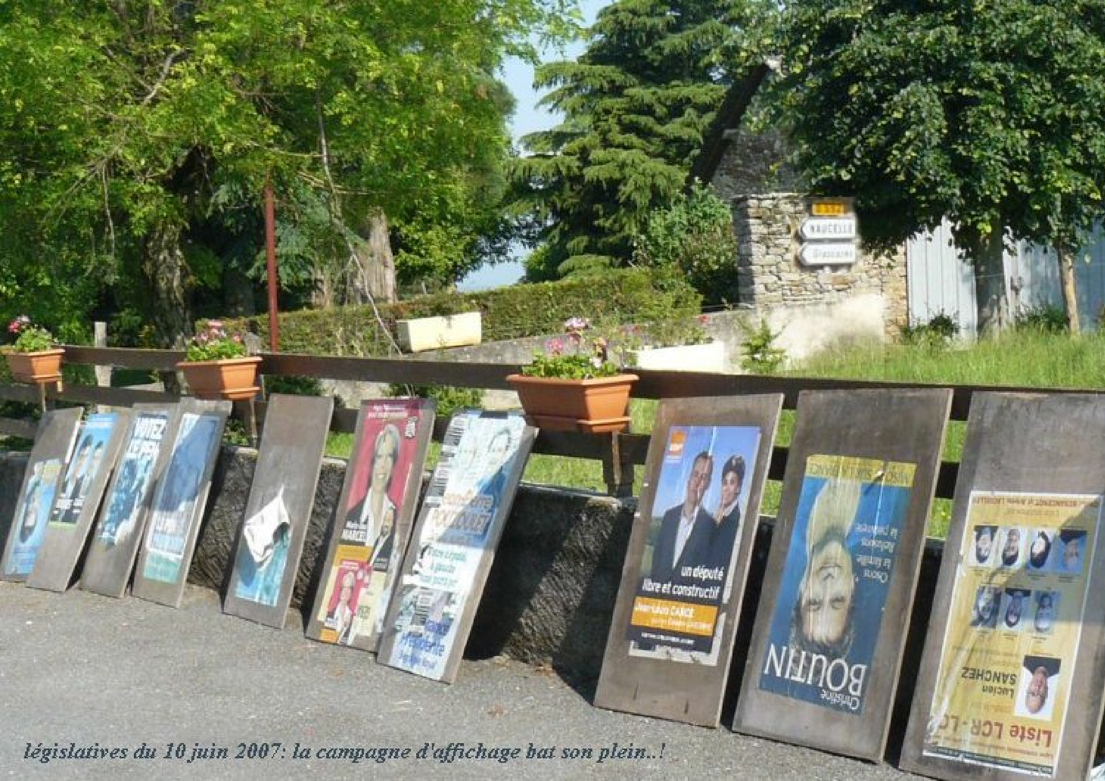
législatives du 10 juin 2007: la campagne d'affichage bat son plein..!