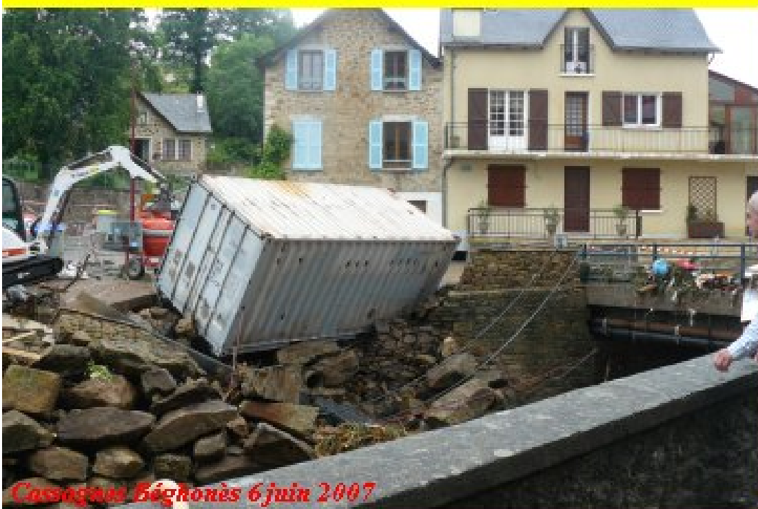
Cassagnes Béghonès 6 juin 2007