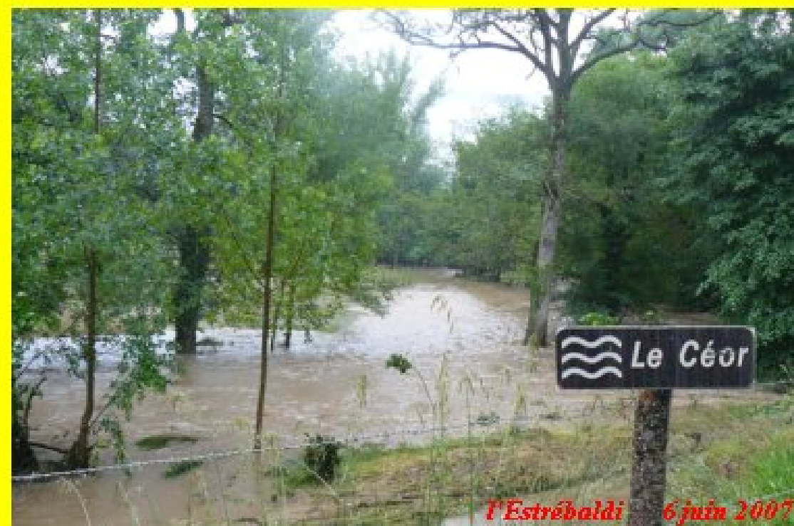
L'Estrébaldi 6 juin 2007