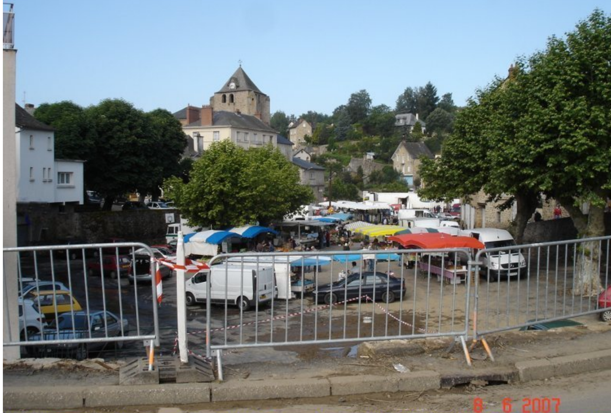
La vie à Cassagnes a repris son cours et dès le vendredi 8 juin, 2 jours seulement après "le déluge" le marché hebdomadaire s'est tenu même si nombre de réparations restent à réaliser (cf. ci-dessus, vue du pont - parapet détruit - de la route Rodez - Réquista).