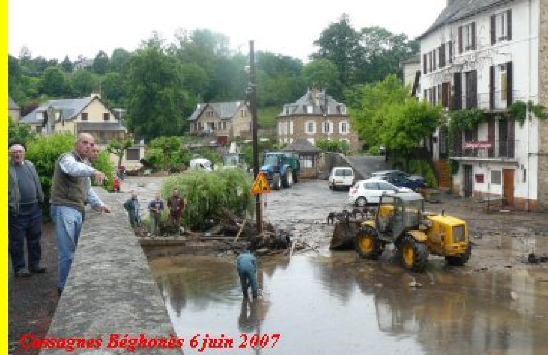
Cassagnes Béghonès 6 juin 2007