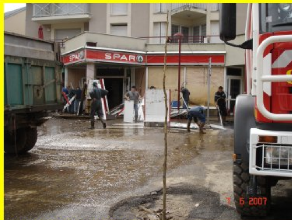
CASSAGNES-BEGONHES PANSE SES PLAIES