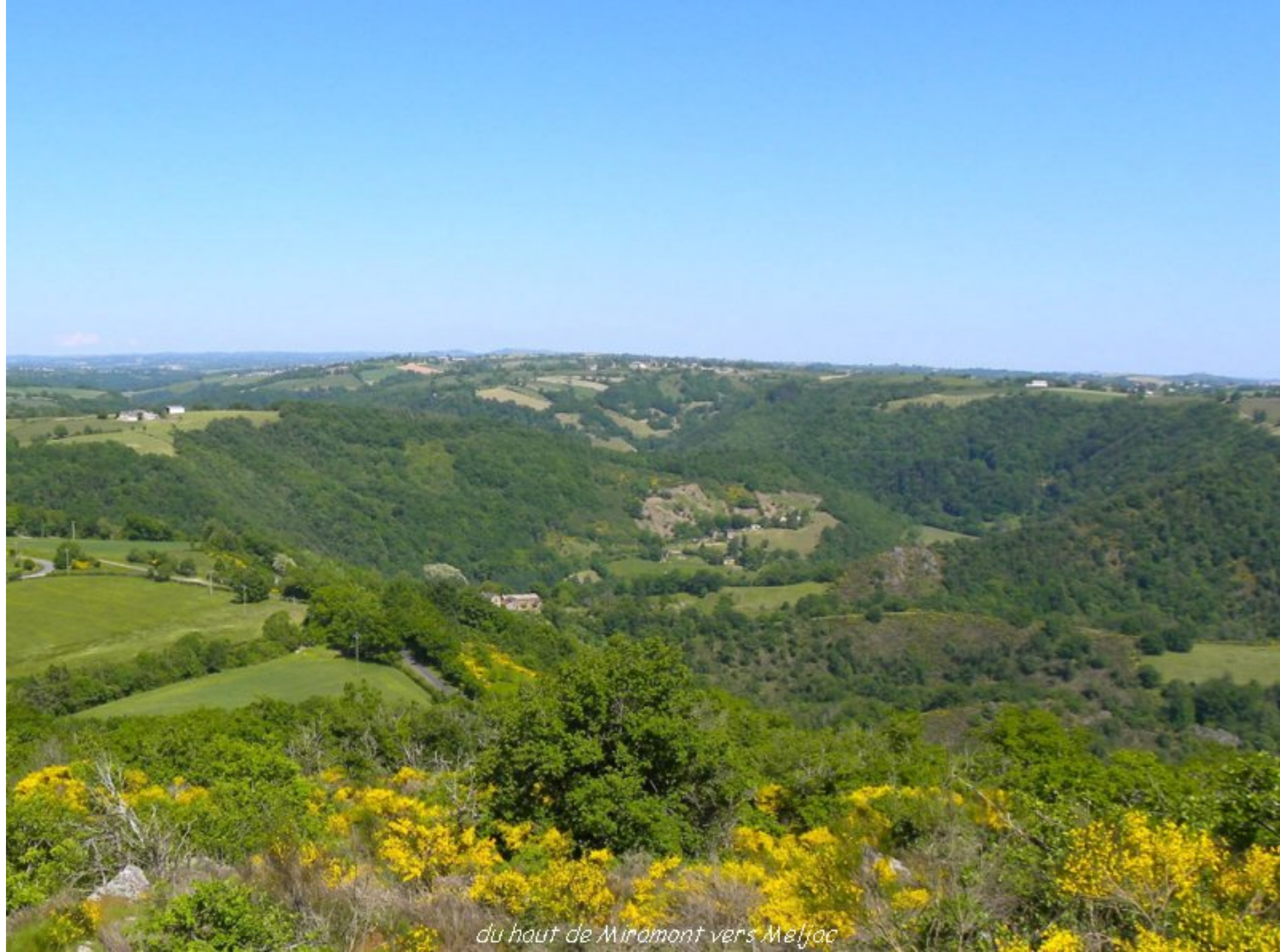
du haut de Miramont vers Melfiac