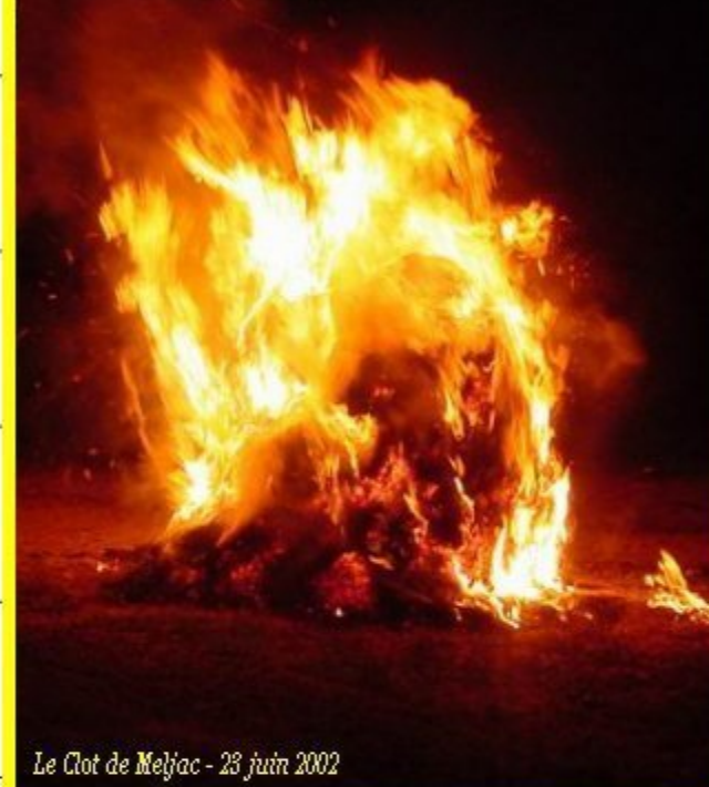
Le Clot de Meljac - 23 juin 2002

"Tinta relotge", chanson ancienne de la Saint-Jean chantée par les domestiques de ferme qui, lors de la foire de "la loue" allaient pouvoir changer de patron. Il existe, selon les régions du Rouergue et du Quercy, voire selon les villages, des versions différentes de ce chant, souvent fonction de l'imagination de son interprète.