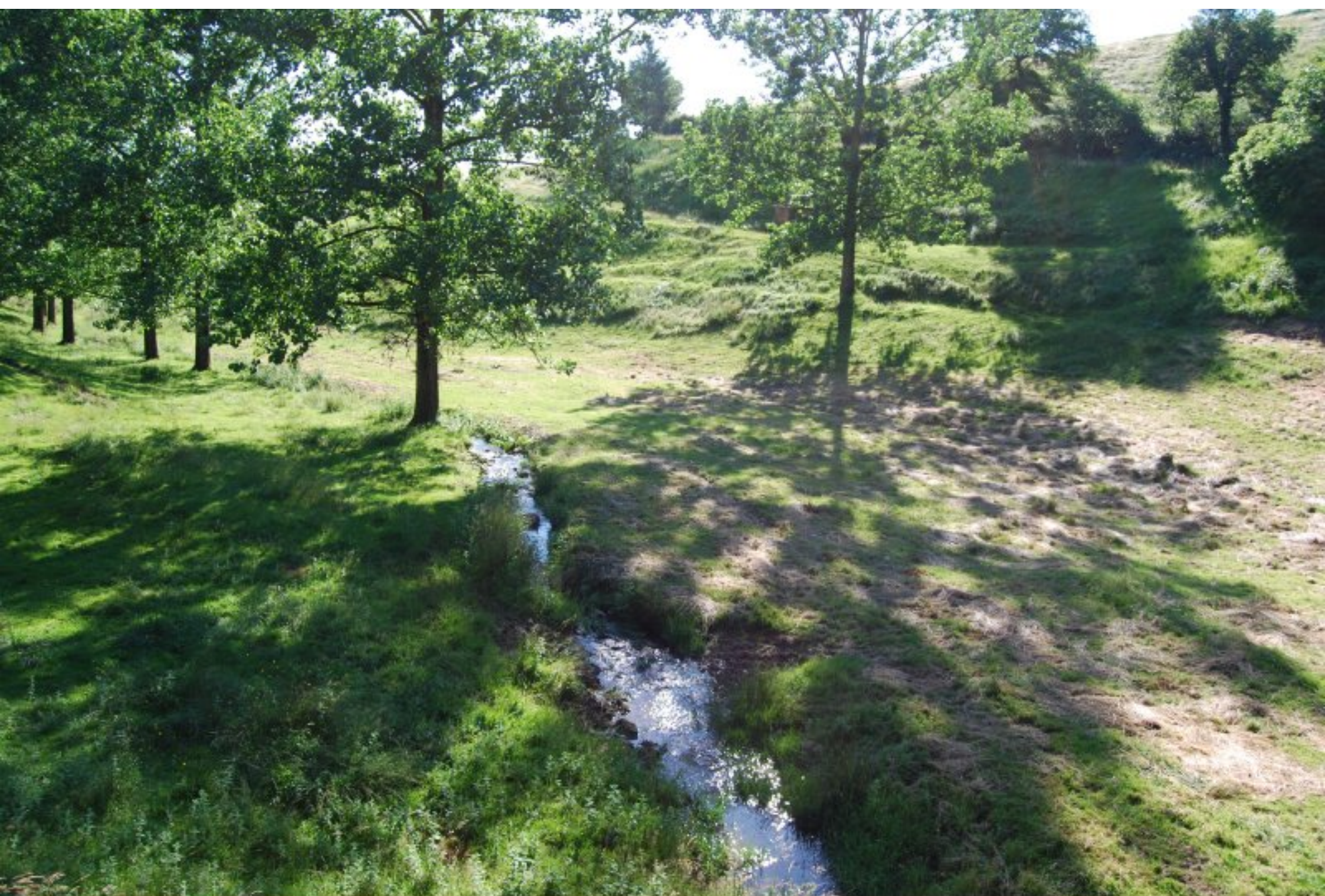
Le Gintou au pont de Gintou