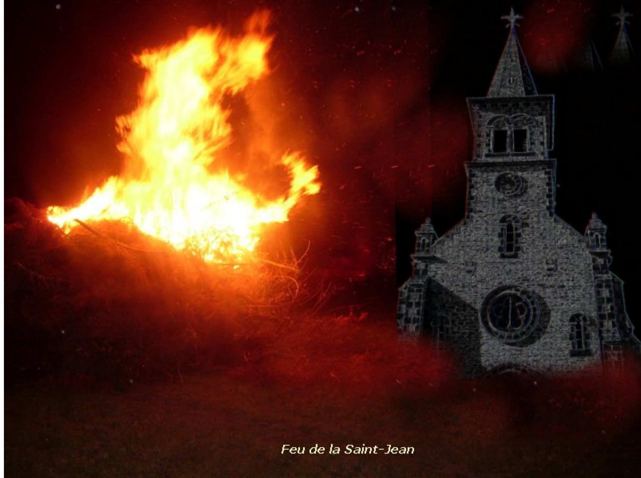
Feu de la Saint-Jean