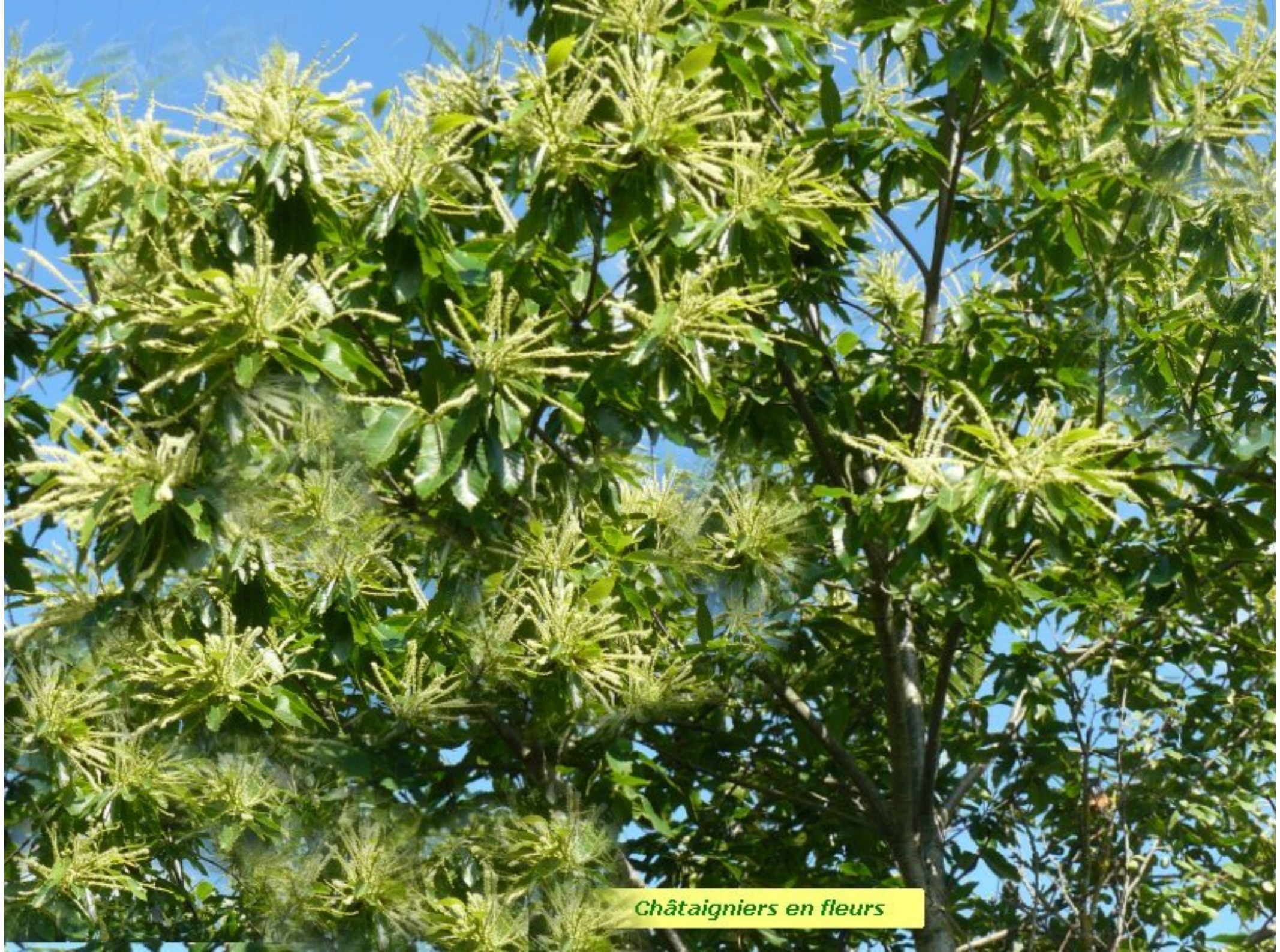
Châtaigniers en fleurs