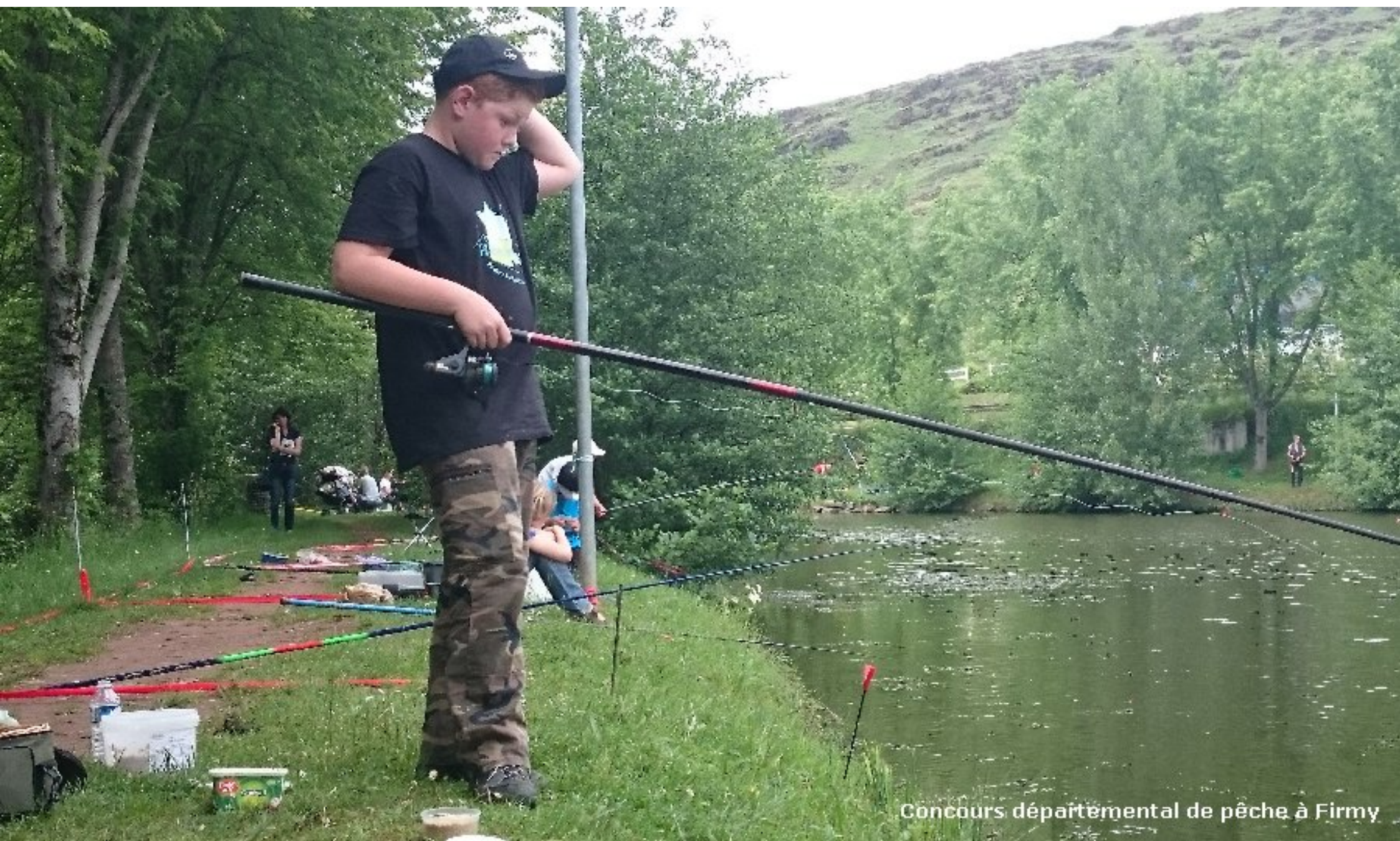
Concours départemental de pêche à Firmy