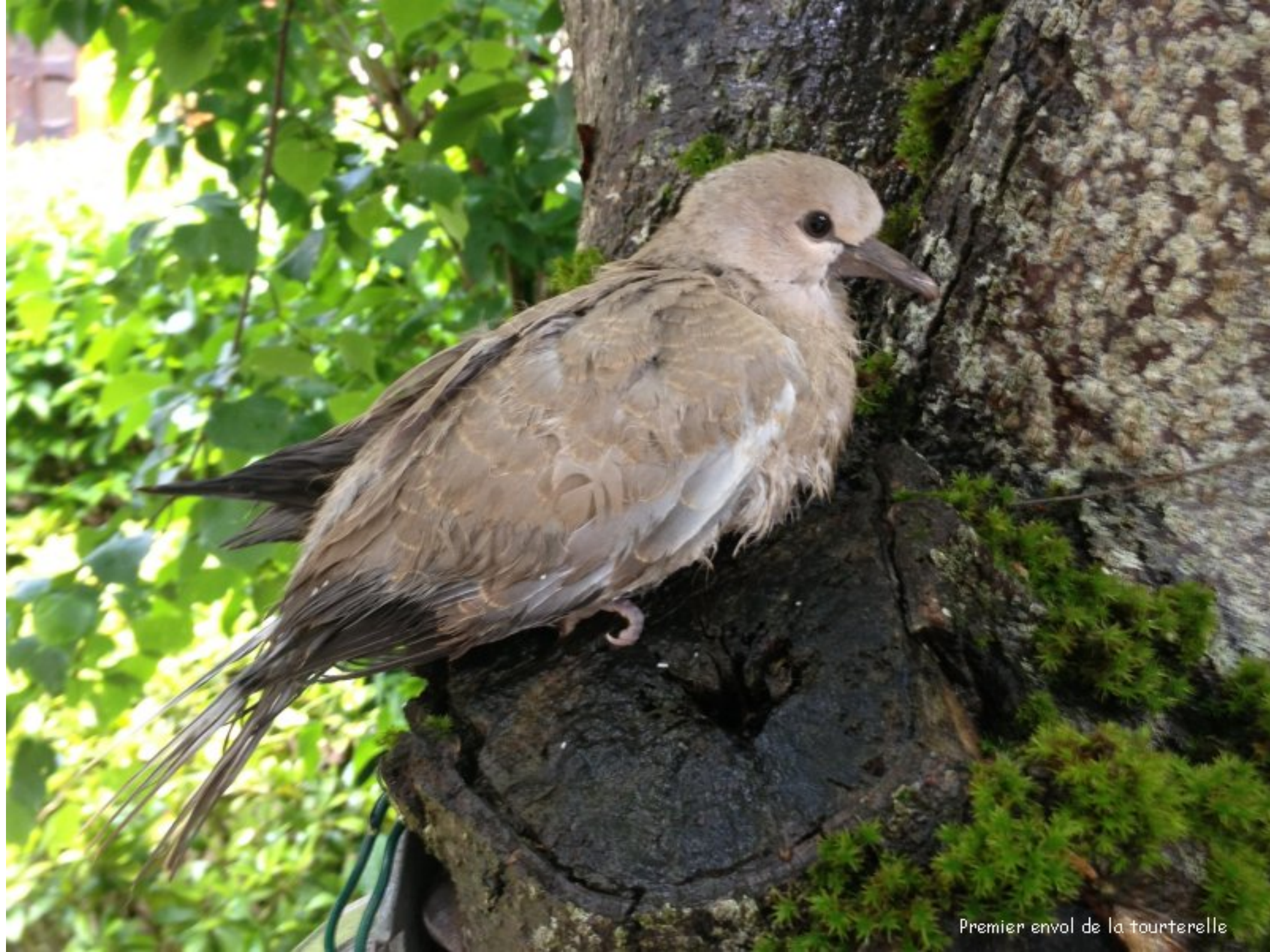
Premier envol de la tourterelle