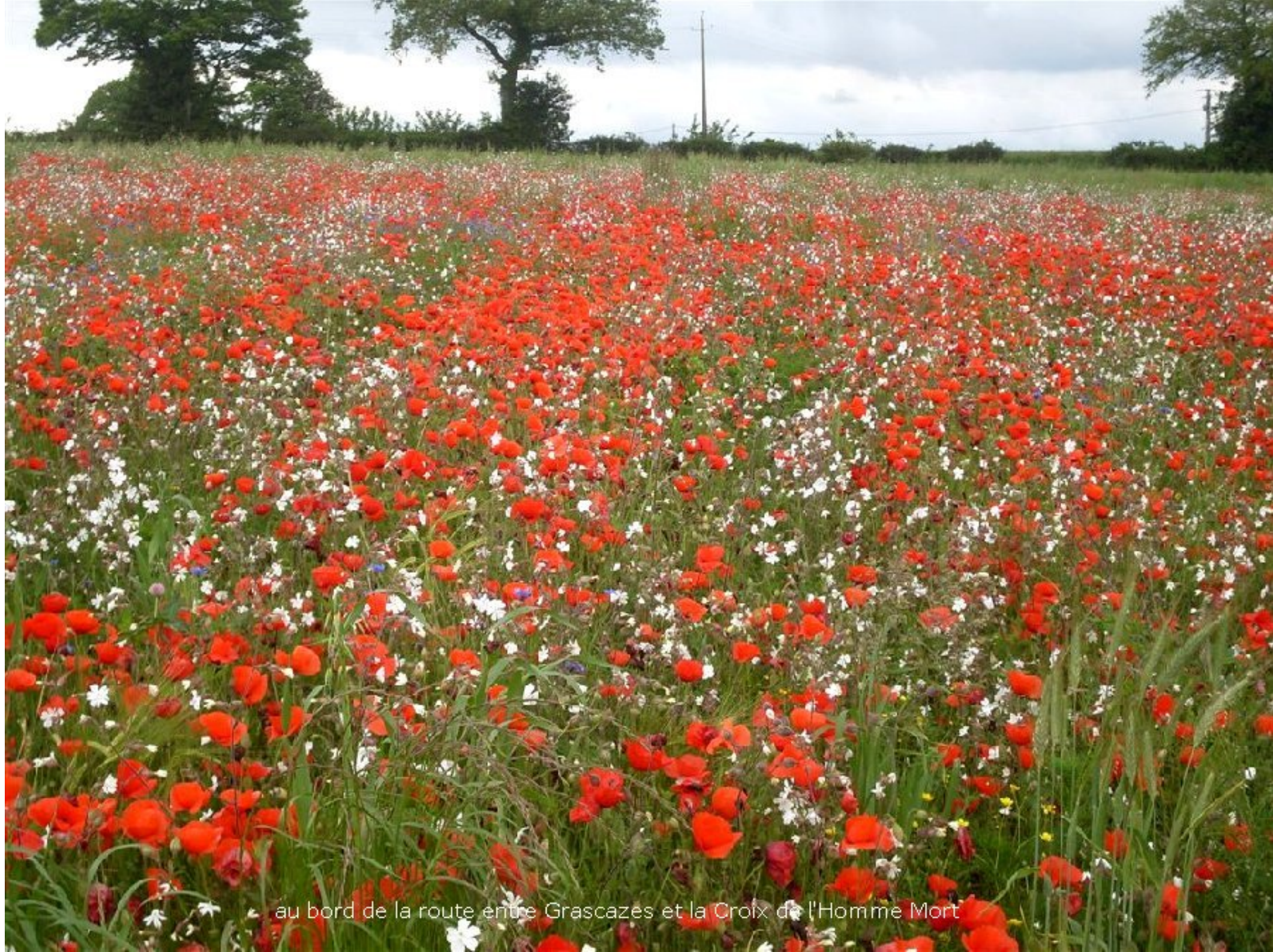
au bord de la route entre Grascazes et la Croix de l'Homme Mort