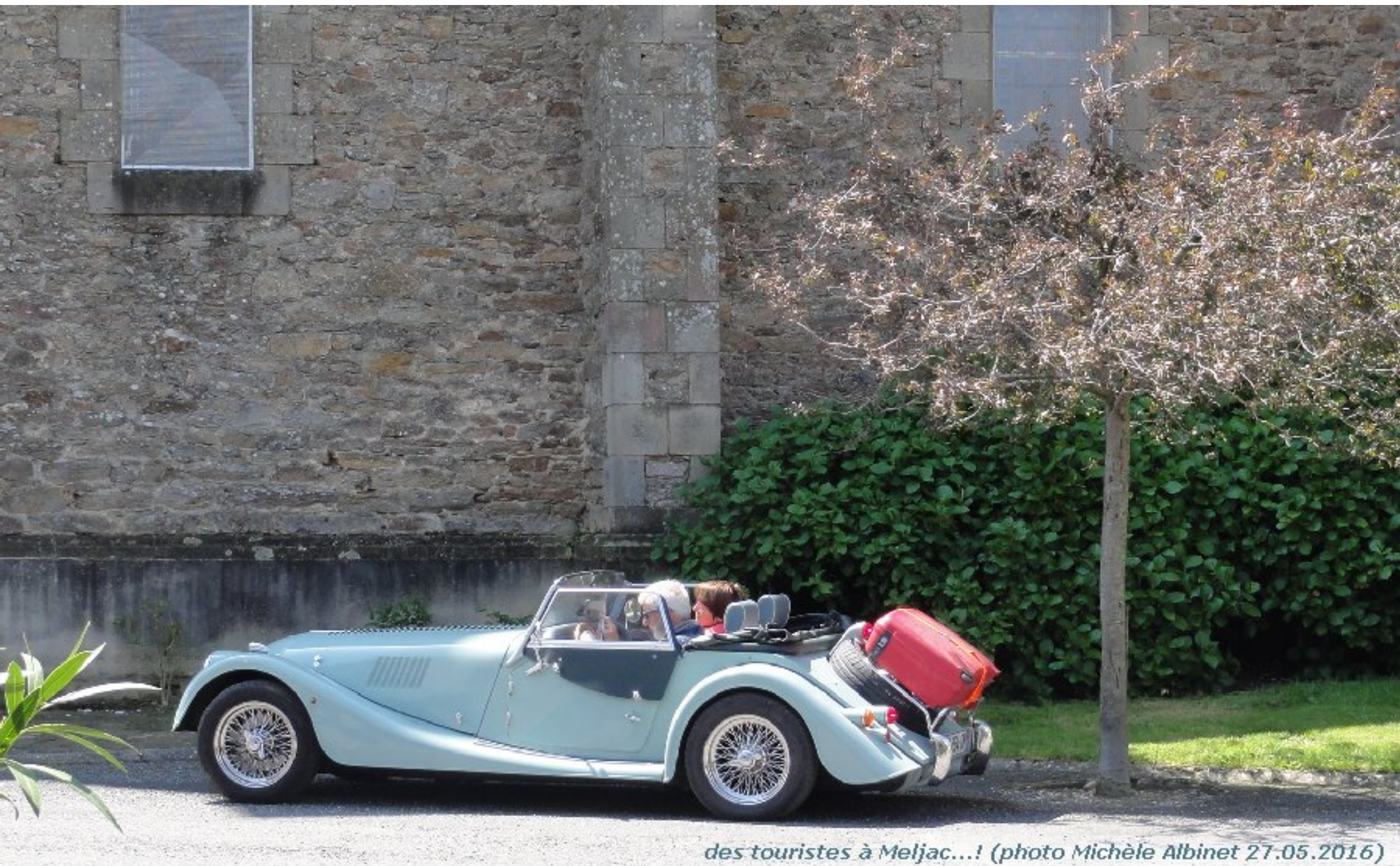
des touristes à Meljac...!