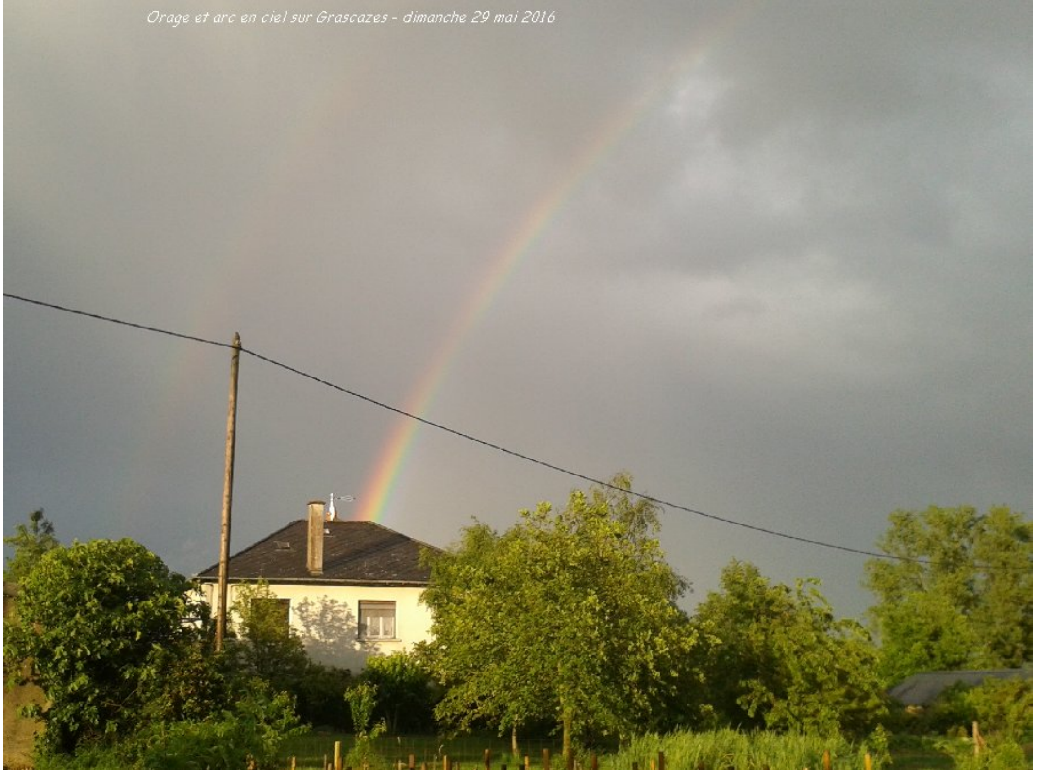
Orage et arc en ciel sur Grascazes - dimanche 29 mai 2016