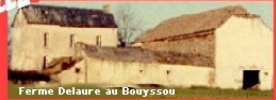
Ferme Delaure au Bouyssou

À MELJAC LE 16 JUIN 1936... « TIRAS SUR LA FICELLE YO LOU LUTZ » (orthographe approximative) "TIRE SUR LA FICELLE IL Y A LA LUMIÈRE"