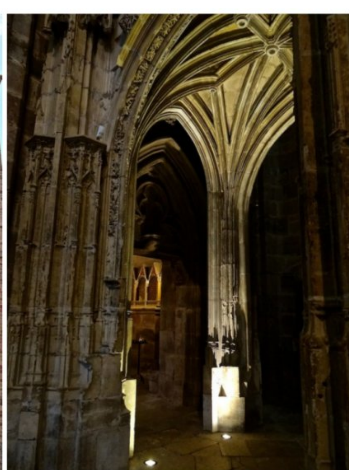
Cathédrale de Radez