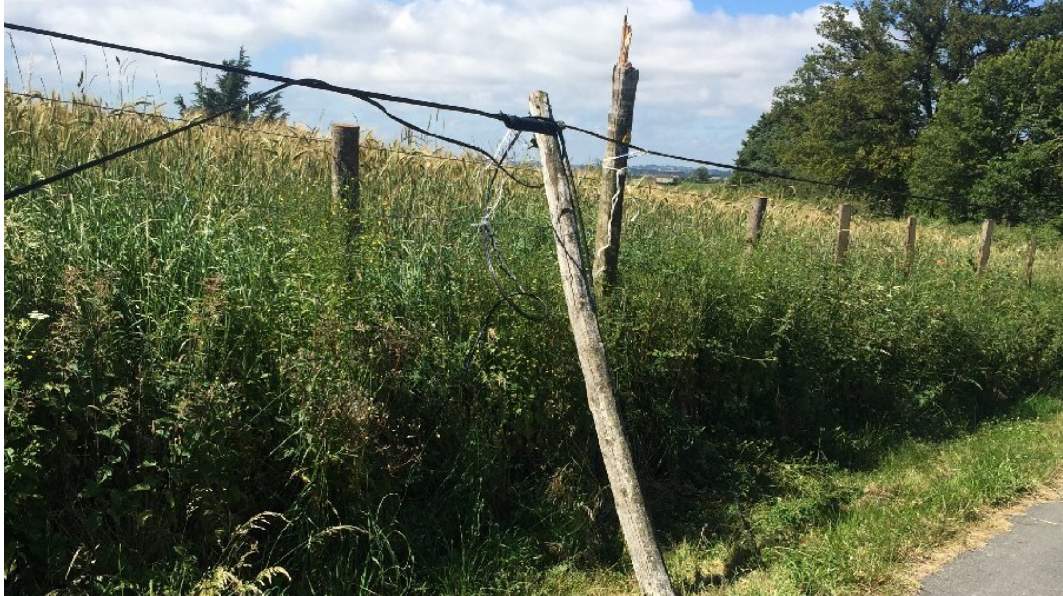
au bord de la route C7 (Meljac=>La Tapie, Le Martinesq) - mardi 28 juin 2016 à 11h

Hélas représentatif de la qualité des connexions internet ou téléphoniques fixes comme mobiles à Meljac