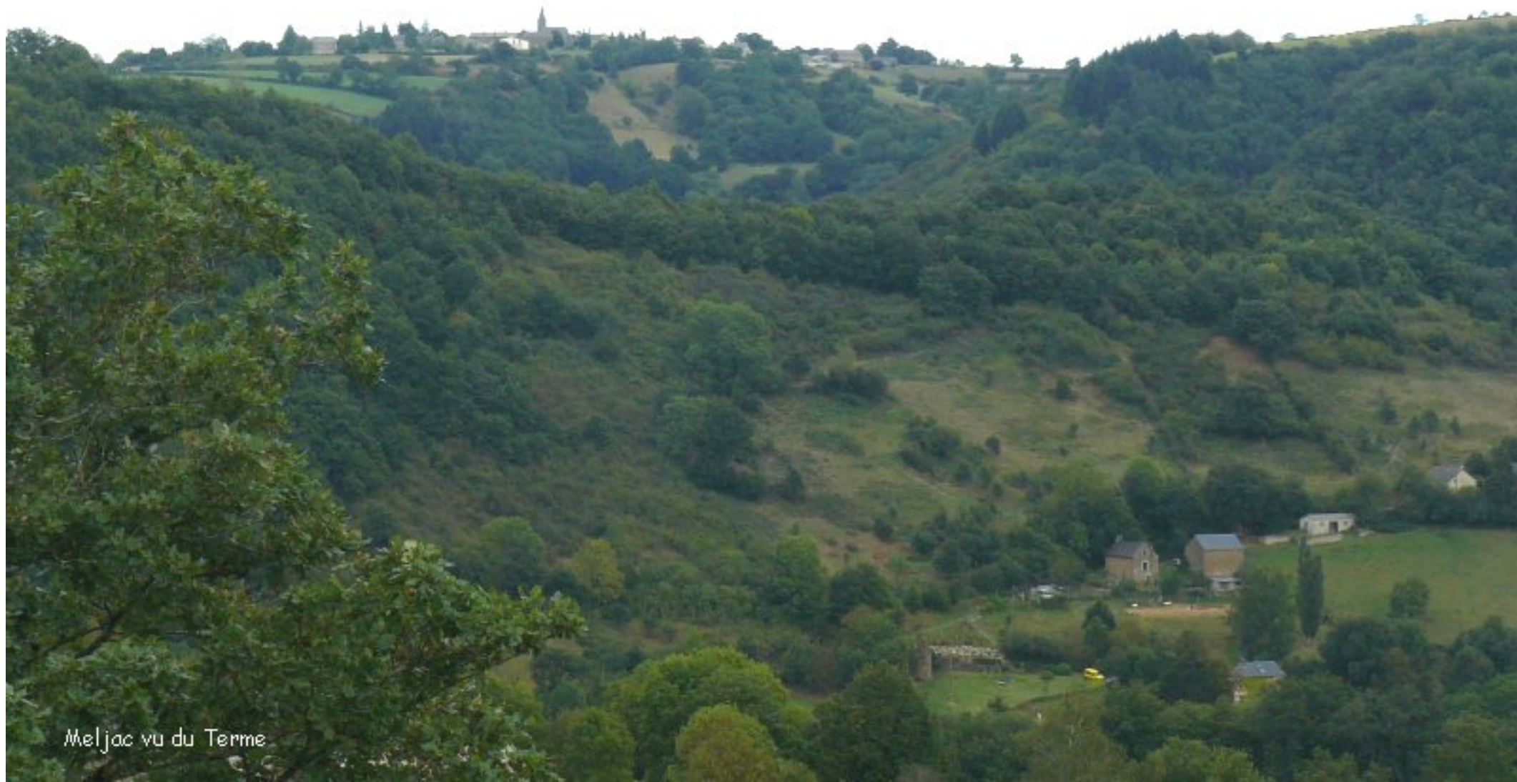
Meljac vu du Terme