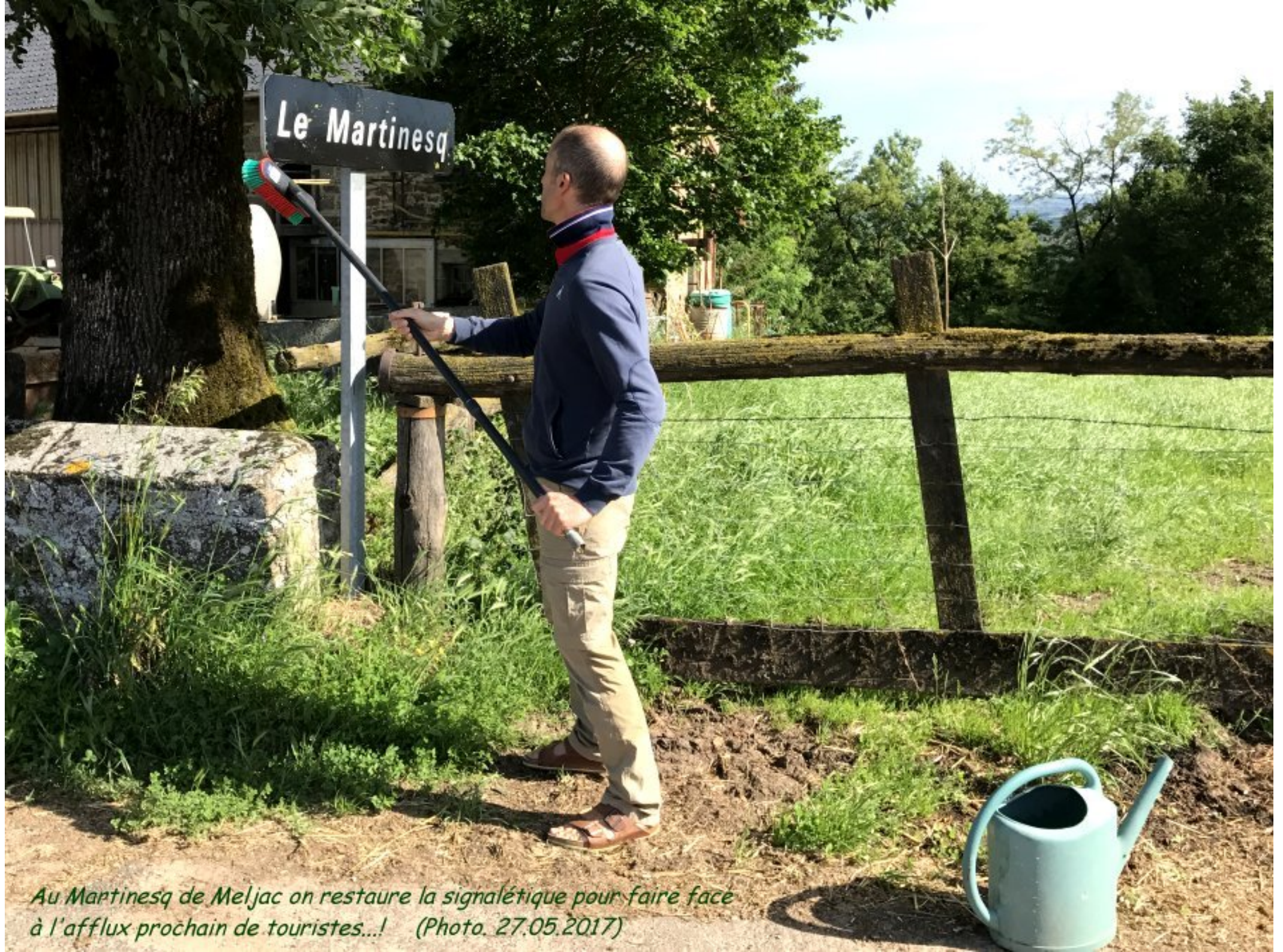
Au Martinesq de Meljac on restaure la signalétique pour faire face à l'afflux prochain de touristes...! (Photo. 27.05.2017)