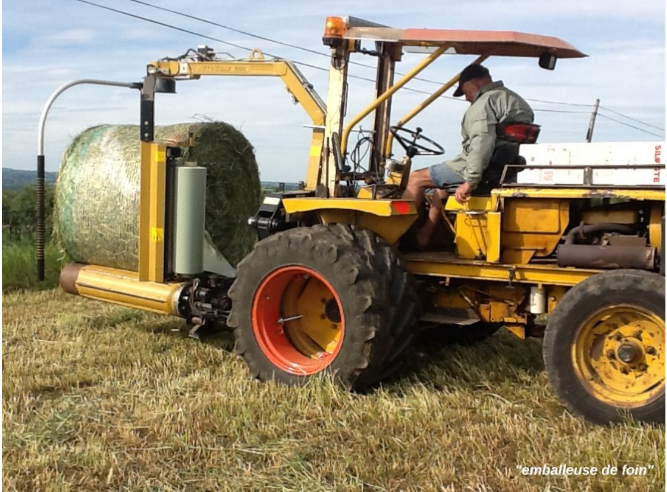
1) "emballeuse de foin"