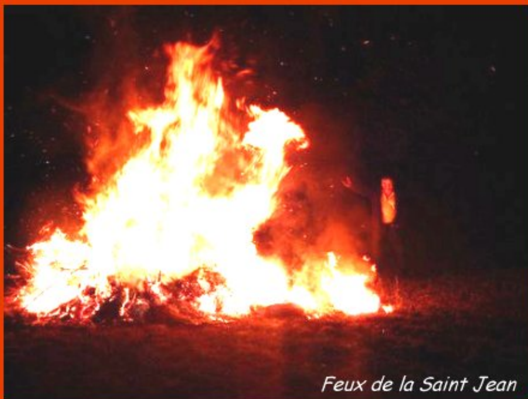
Feux de la Saint Jean