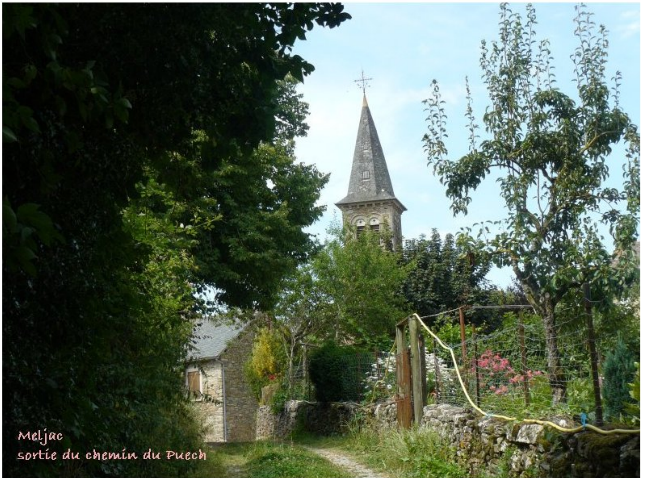
Meljac sortie du chemin du Puech