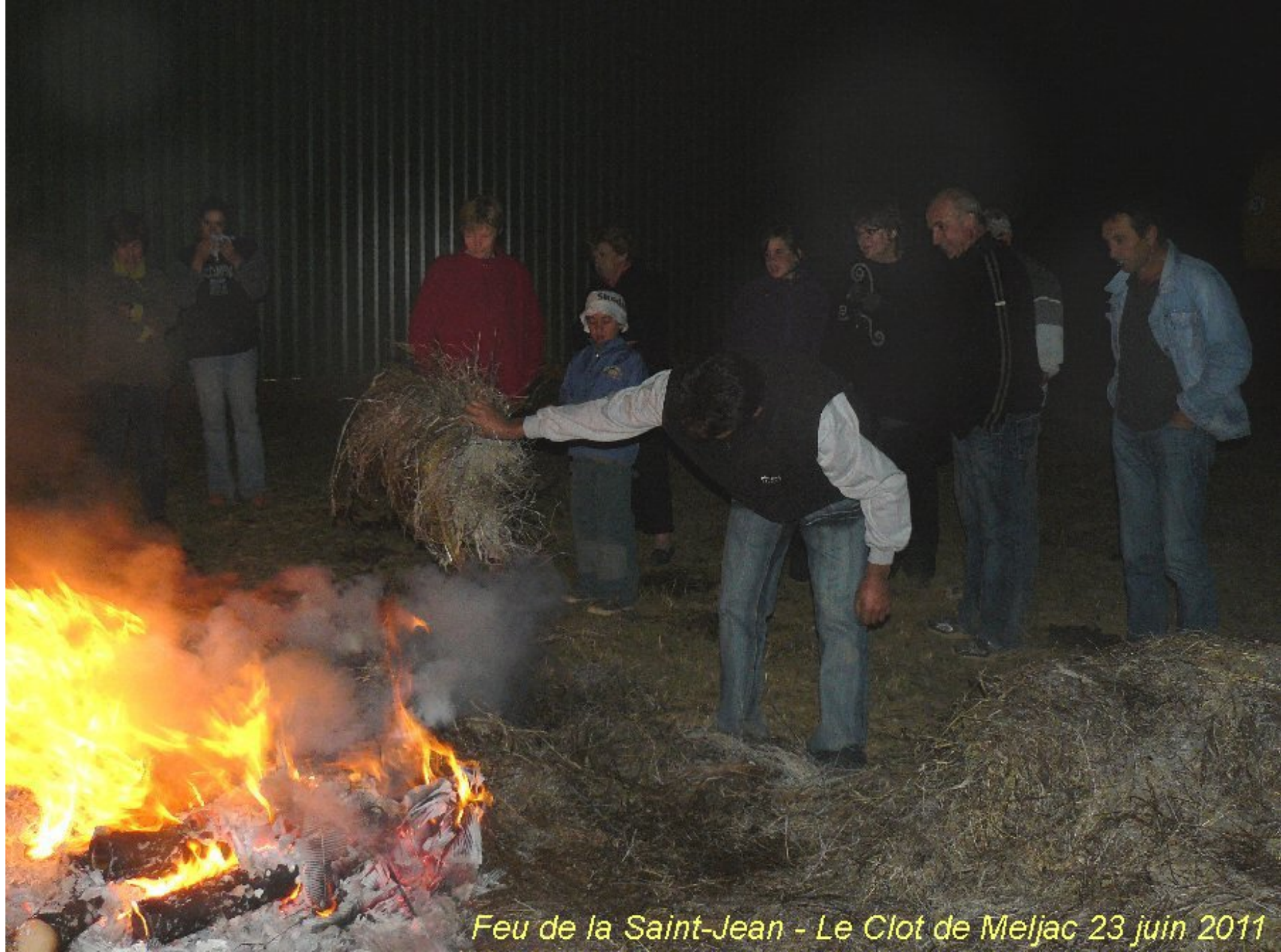
Feu de la Saint-Jean - Le Clot de Meljac 23 juin 2011