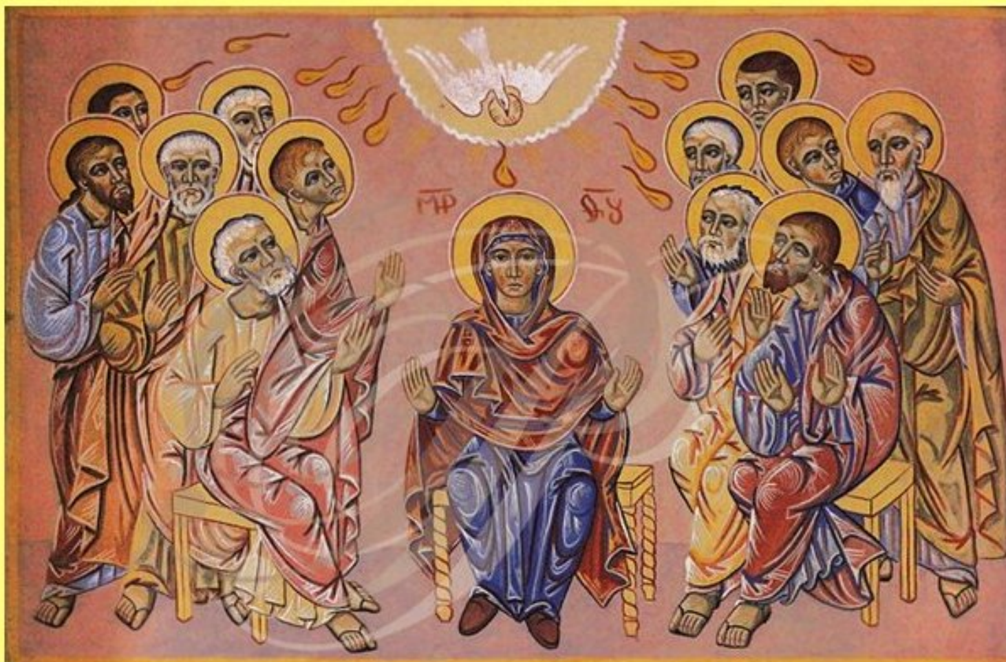
La Pentecôte - fresque de Nicolai Greschny Eglise Notre-Dame d'Alban - Tarn

CE SOIR, À PARTIR DE 20 HEURES À LA SALLE DES FÊTES DE MELJAC "BODEGA DE LA PENTECÔTE"