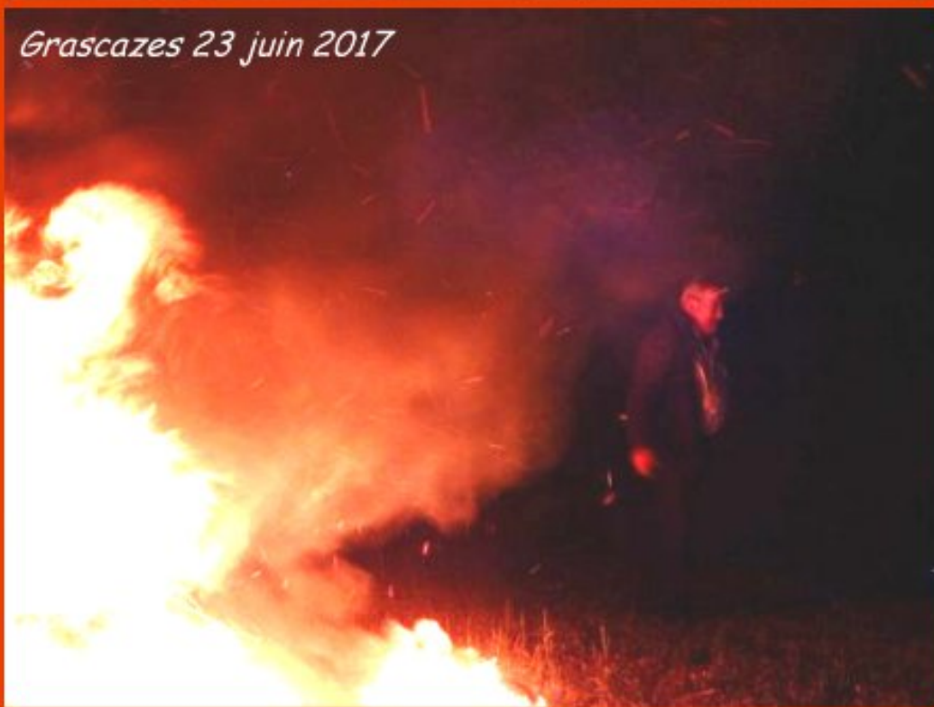
Grascazes 23 juin 2017