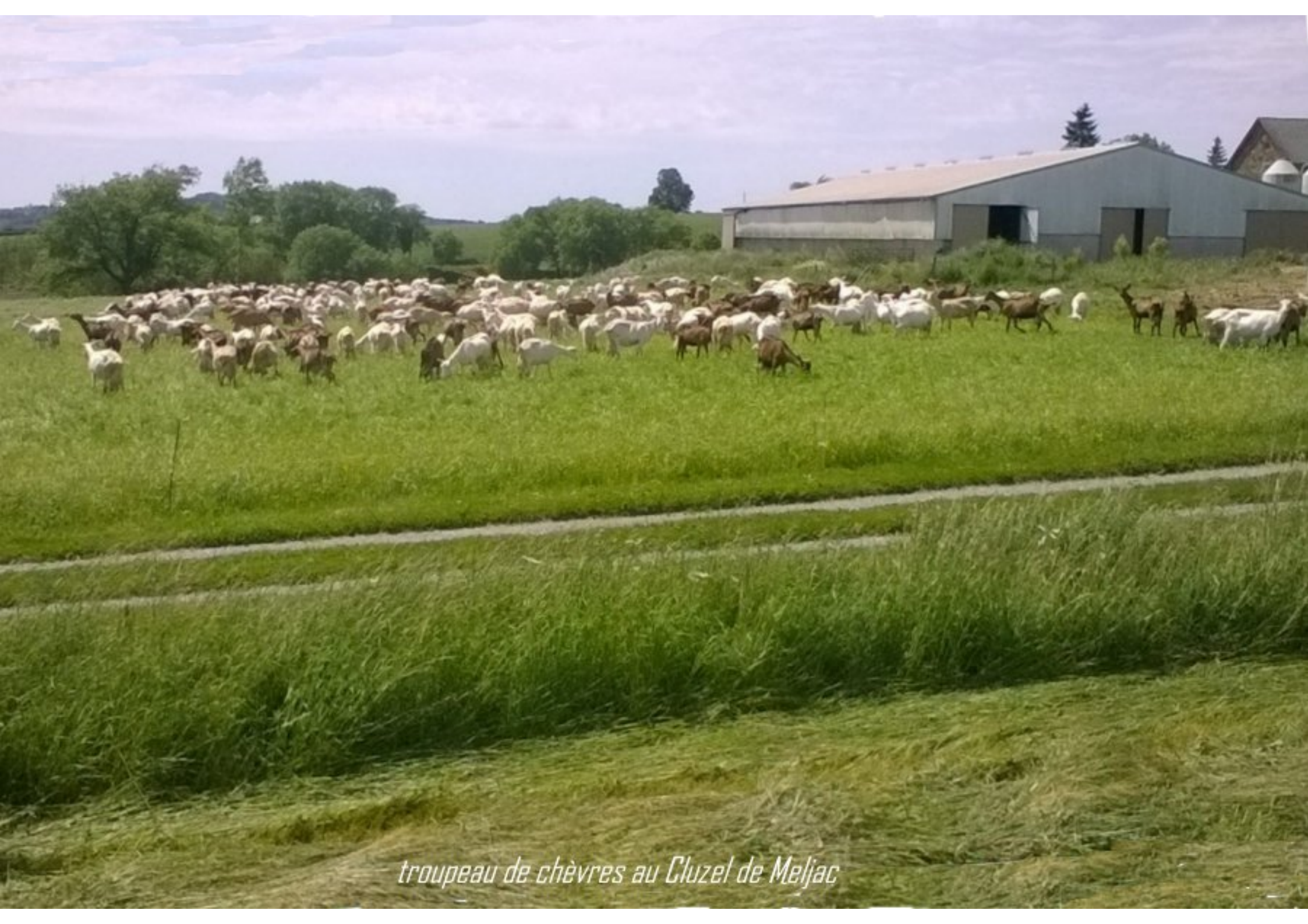
troupeau de chèvres au Cluzel de Meljac