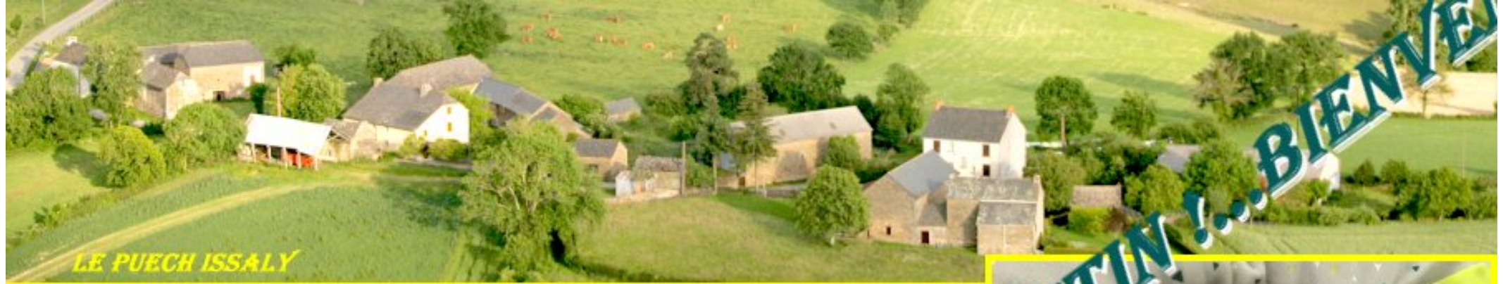
LE PUECH ISSALY