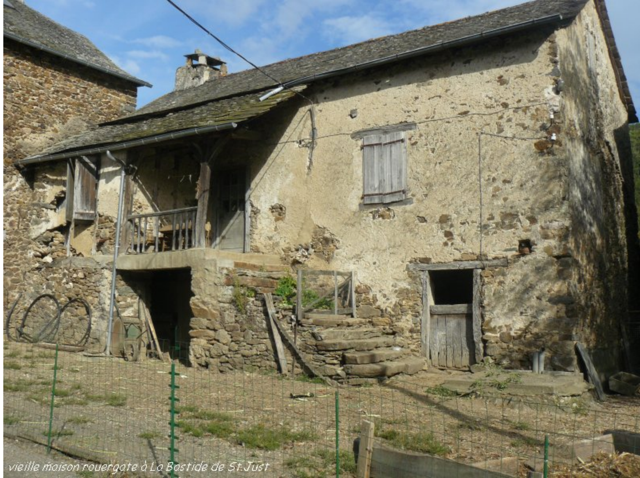
vieille maison rouergate à La Bastide de St. Just