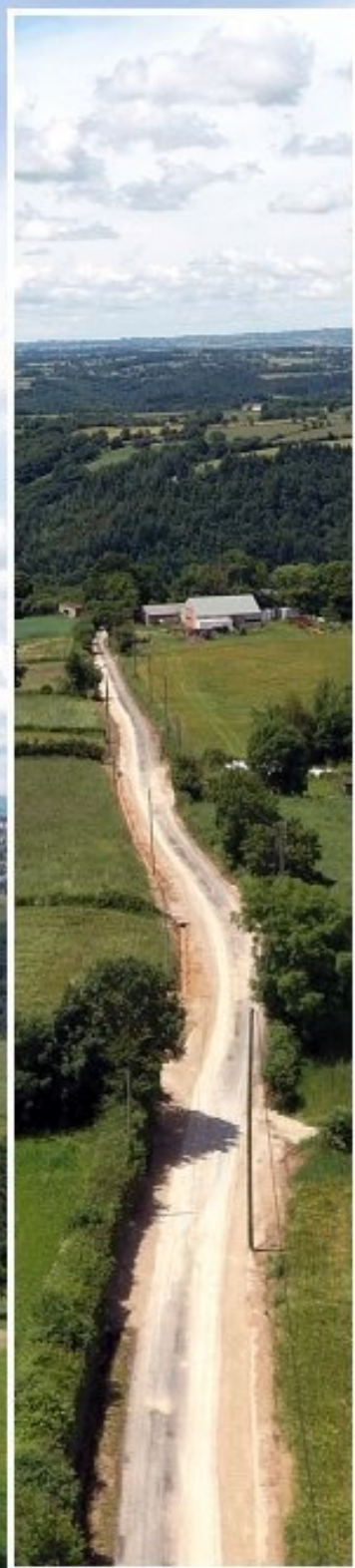
Réfection avec élargissement de la route du Bourg de Meljac à Cabrol (Photo.9 juin 2018)