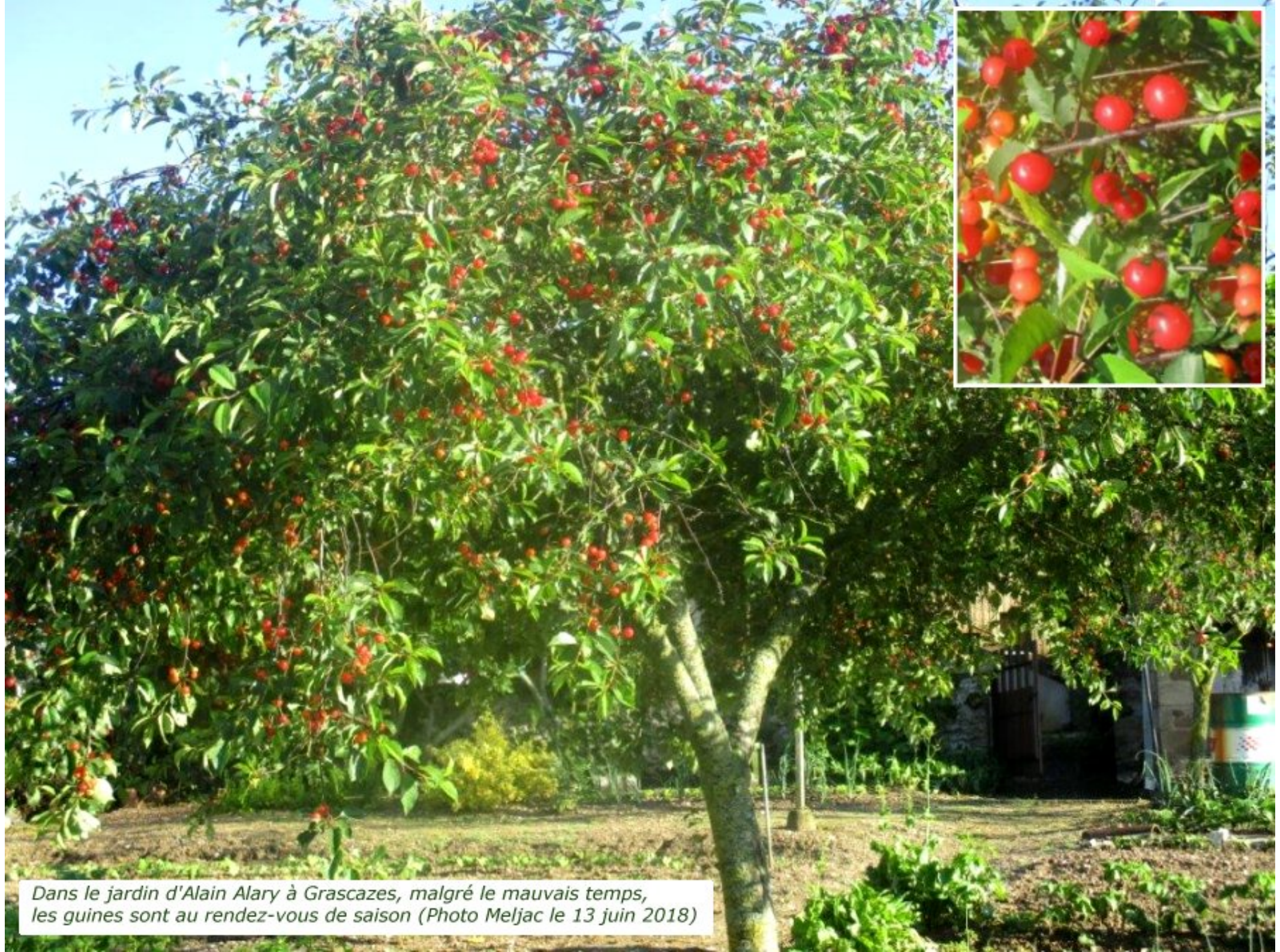
Dans le jardin d'Alain Alary à Grascazes, malgré le mauvais temps, les guignes sont au rendez-vous de saison