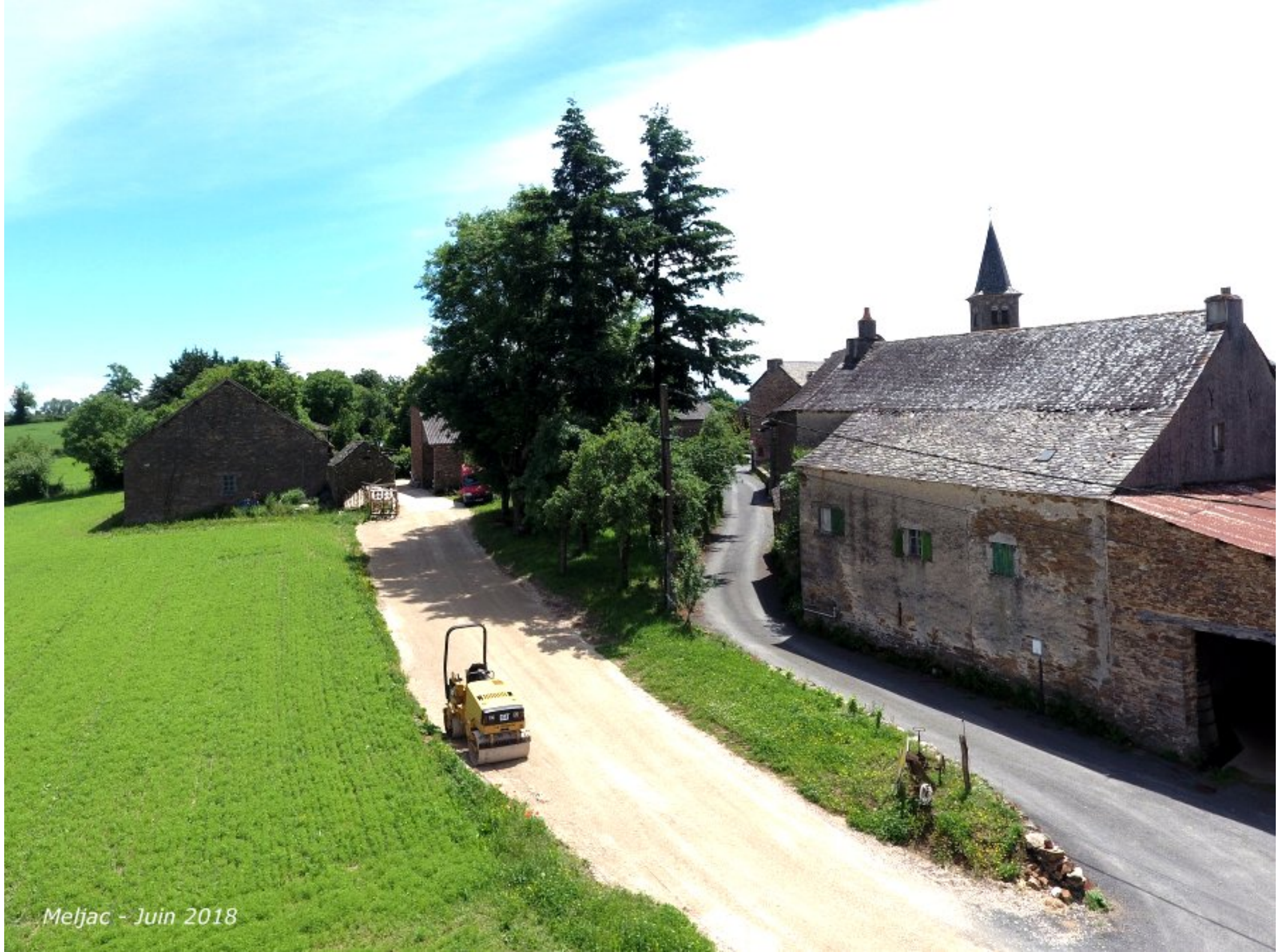
Meljac - Juin 2018