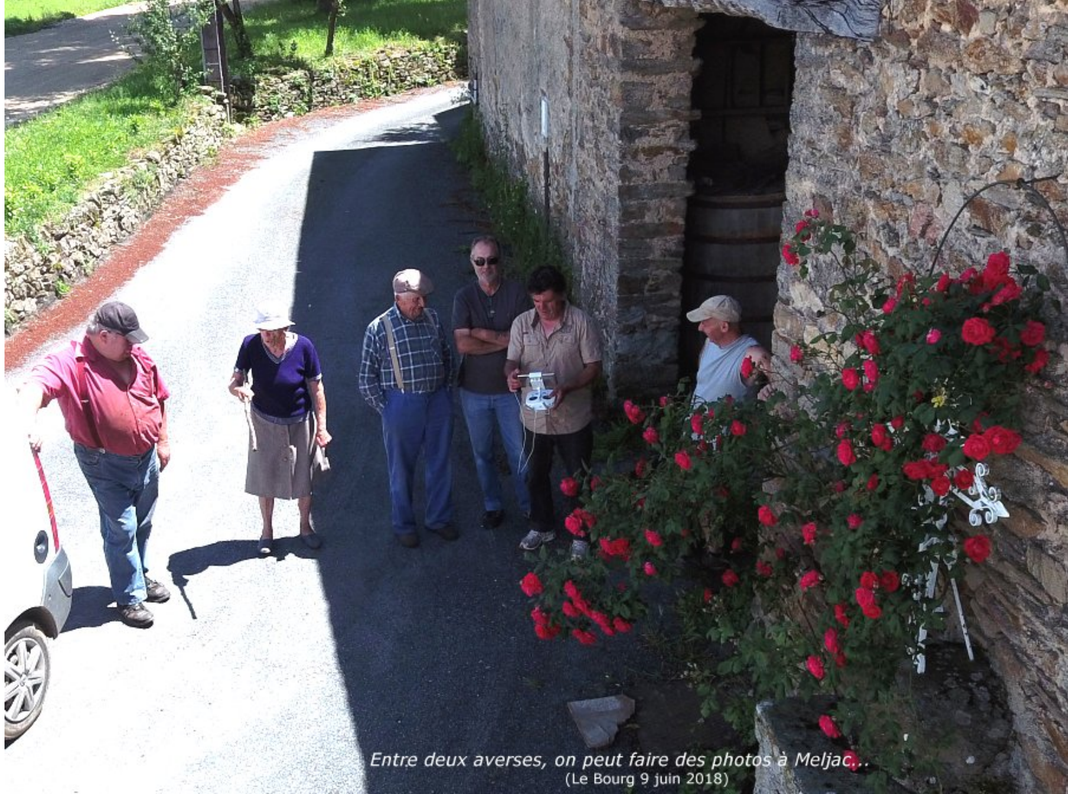
Entre deux averses, on peut faire des photos à Meljac... (Le Bourg 9 juin 2018)