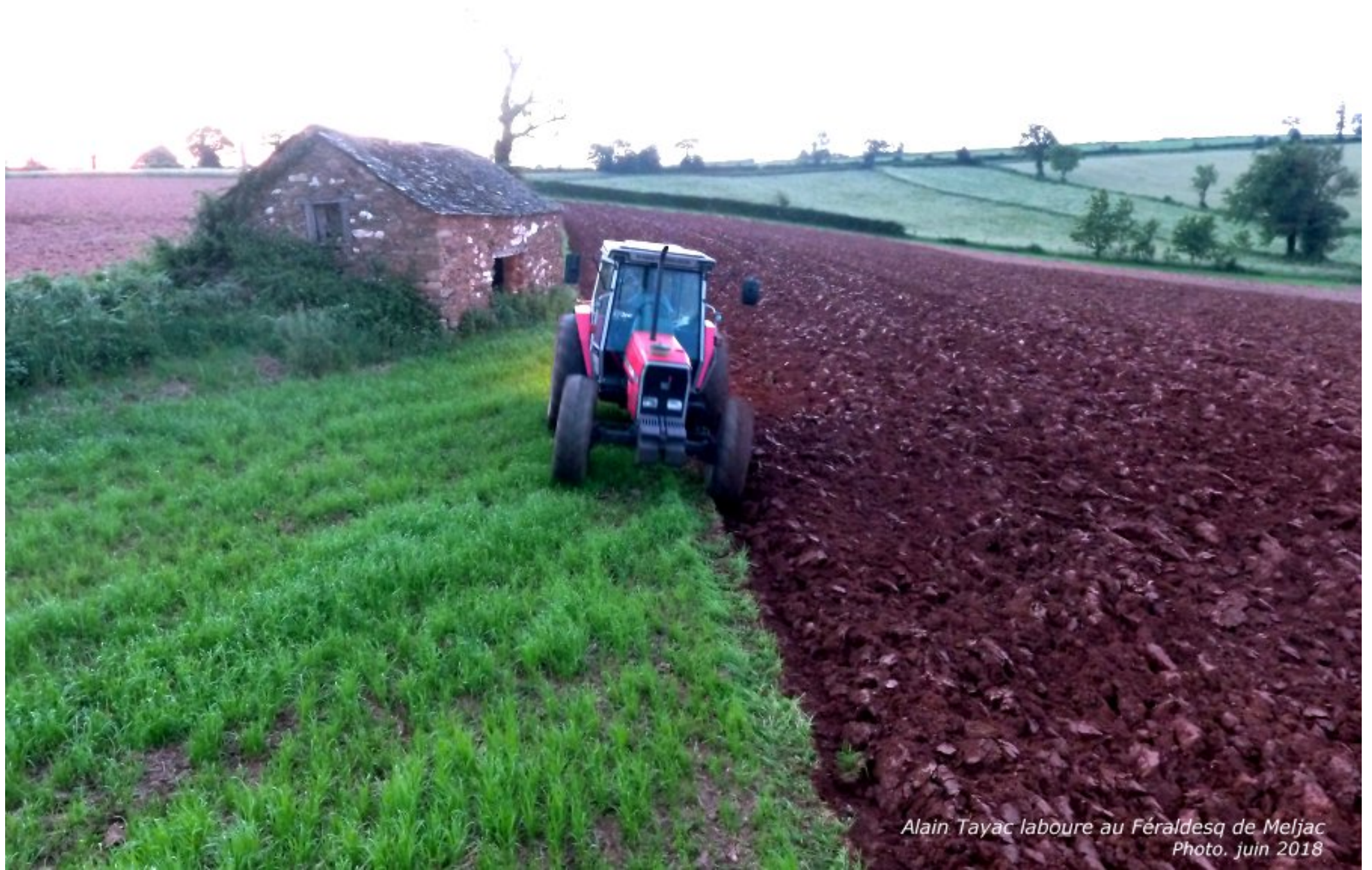
Alain Tayac laboure au Féraldesq de Meljac Photo. juin 2018