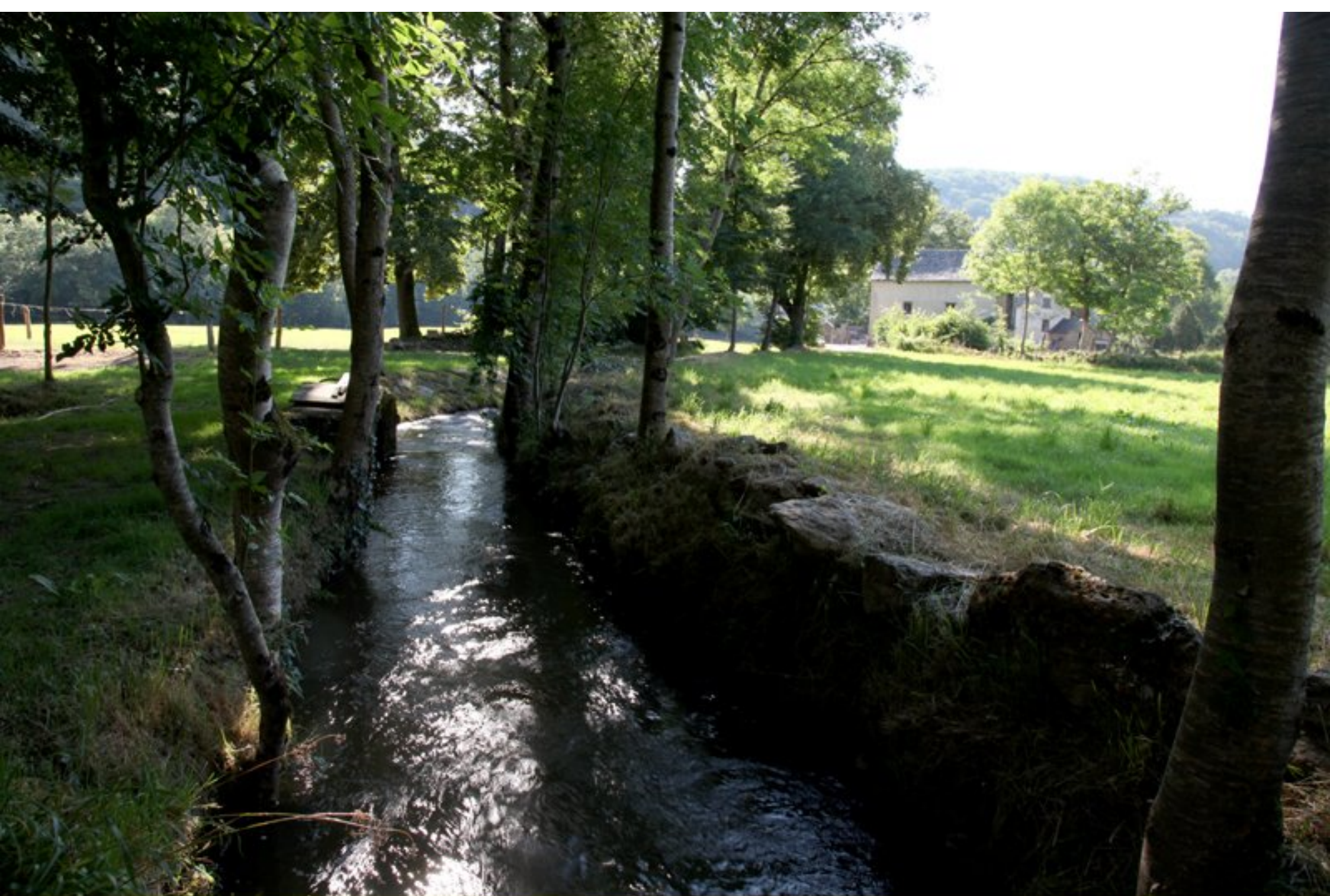
Moulin de Laval