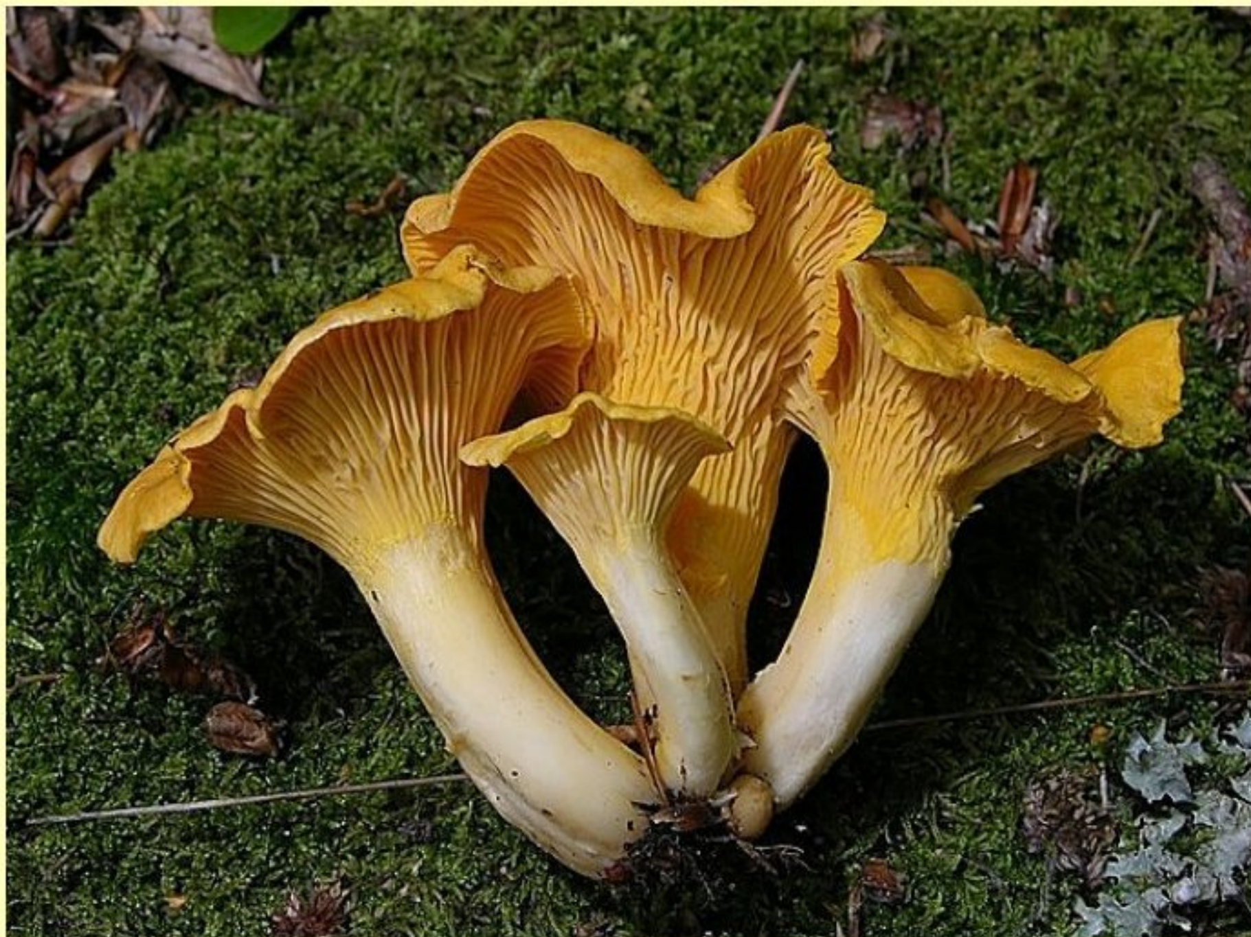
le 8 juin 2018