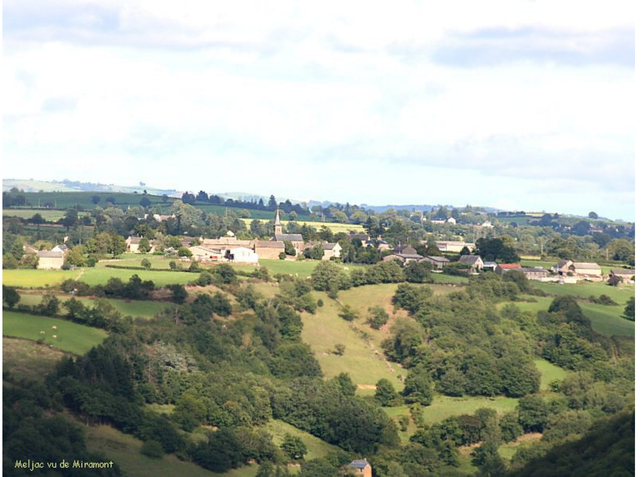
Meljac vu de Miramont