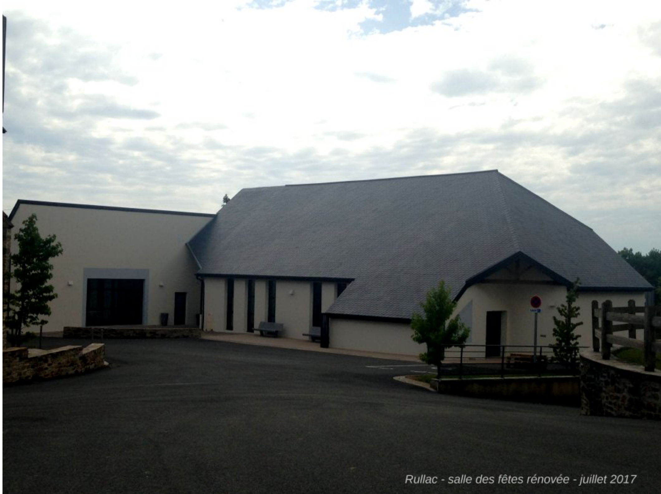
Rullac - salle des fêtes rénovée - juillet 2017