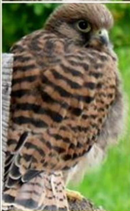
bébé faucon crécerelle né à la Plane de Rullac