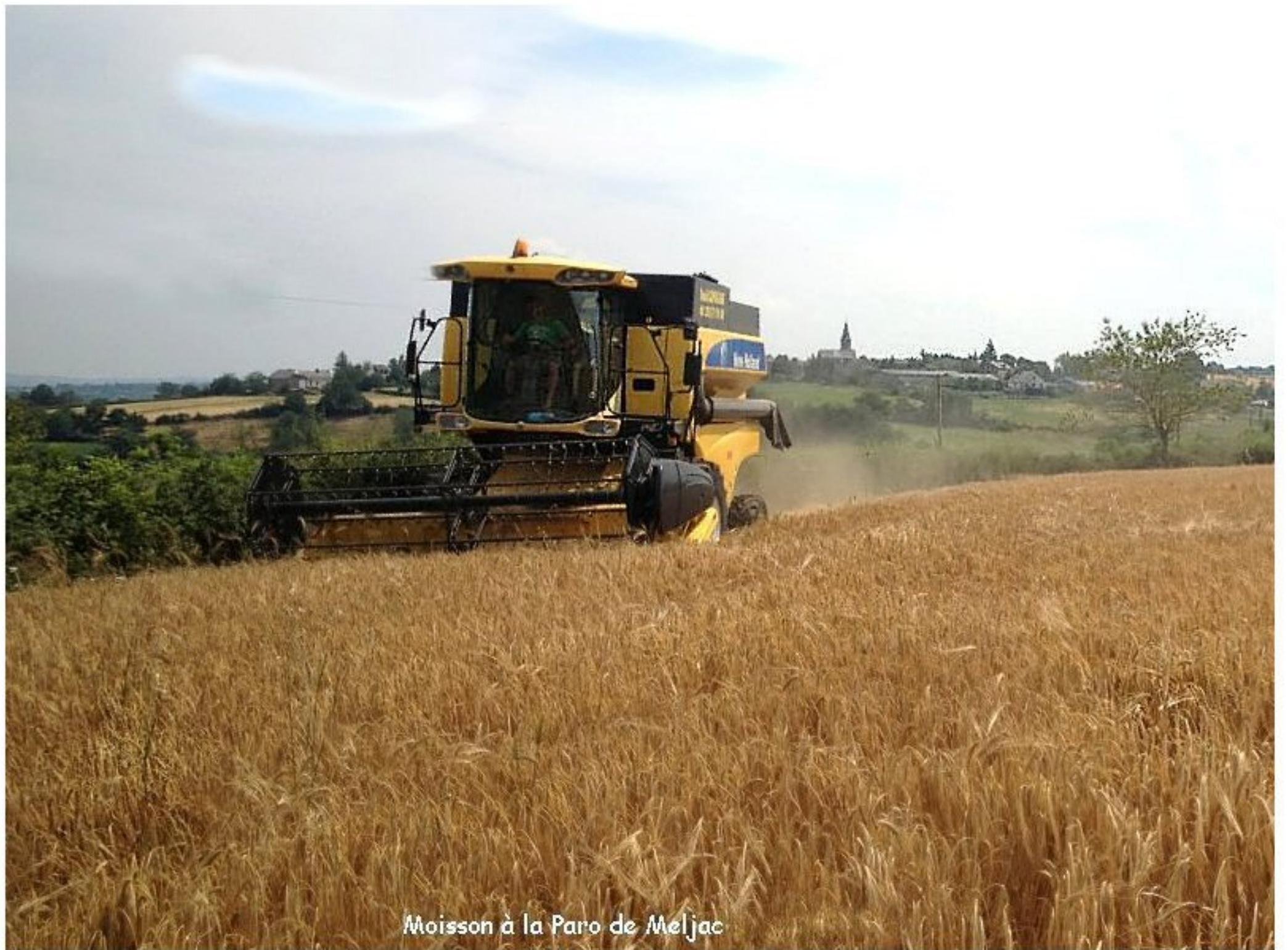
Moisson à la Paro de Meljac