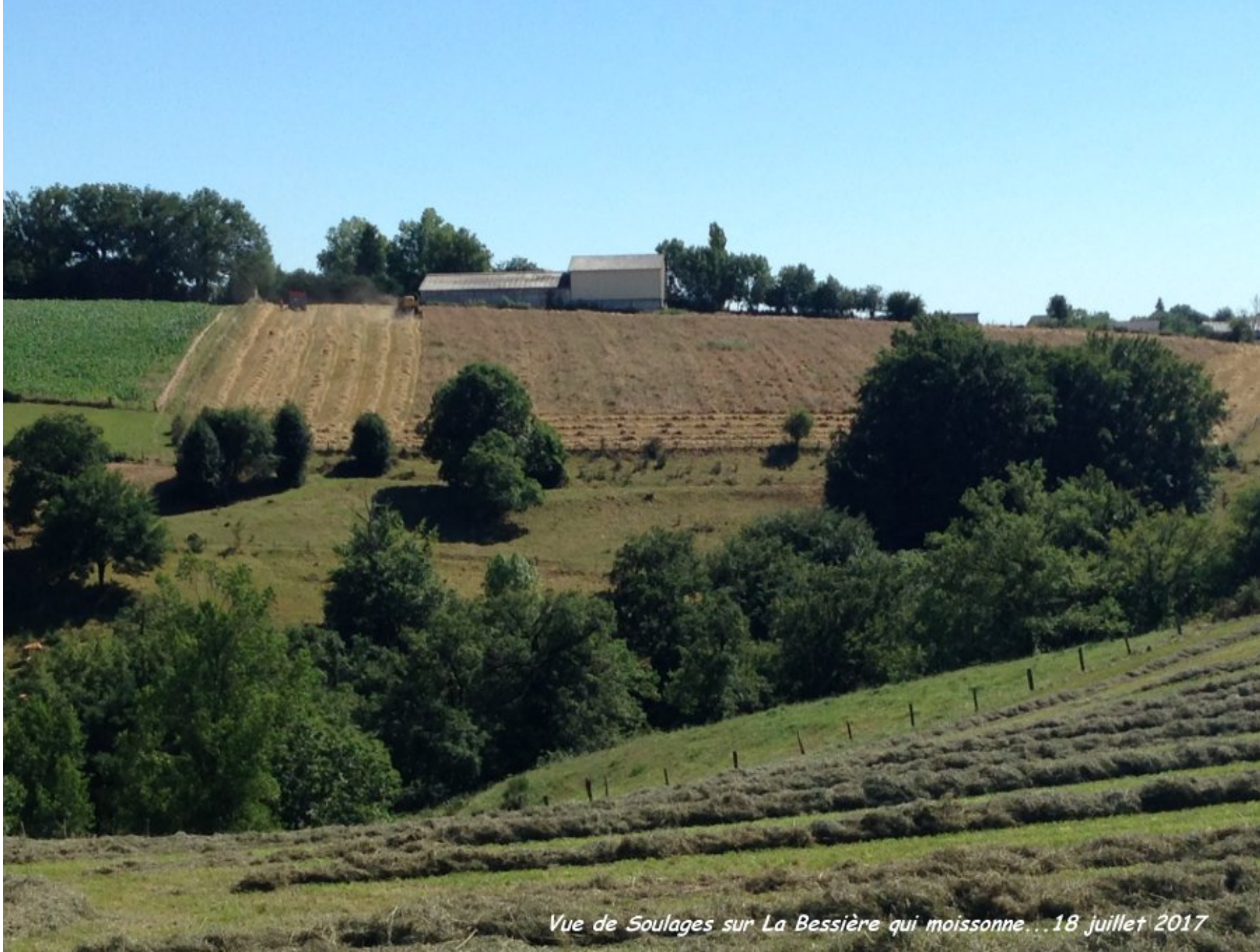
Vue de Soulages sur La Bessière qui moissonne... 18 juillet 2017