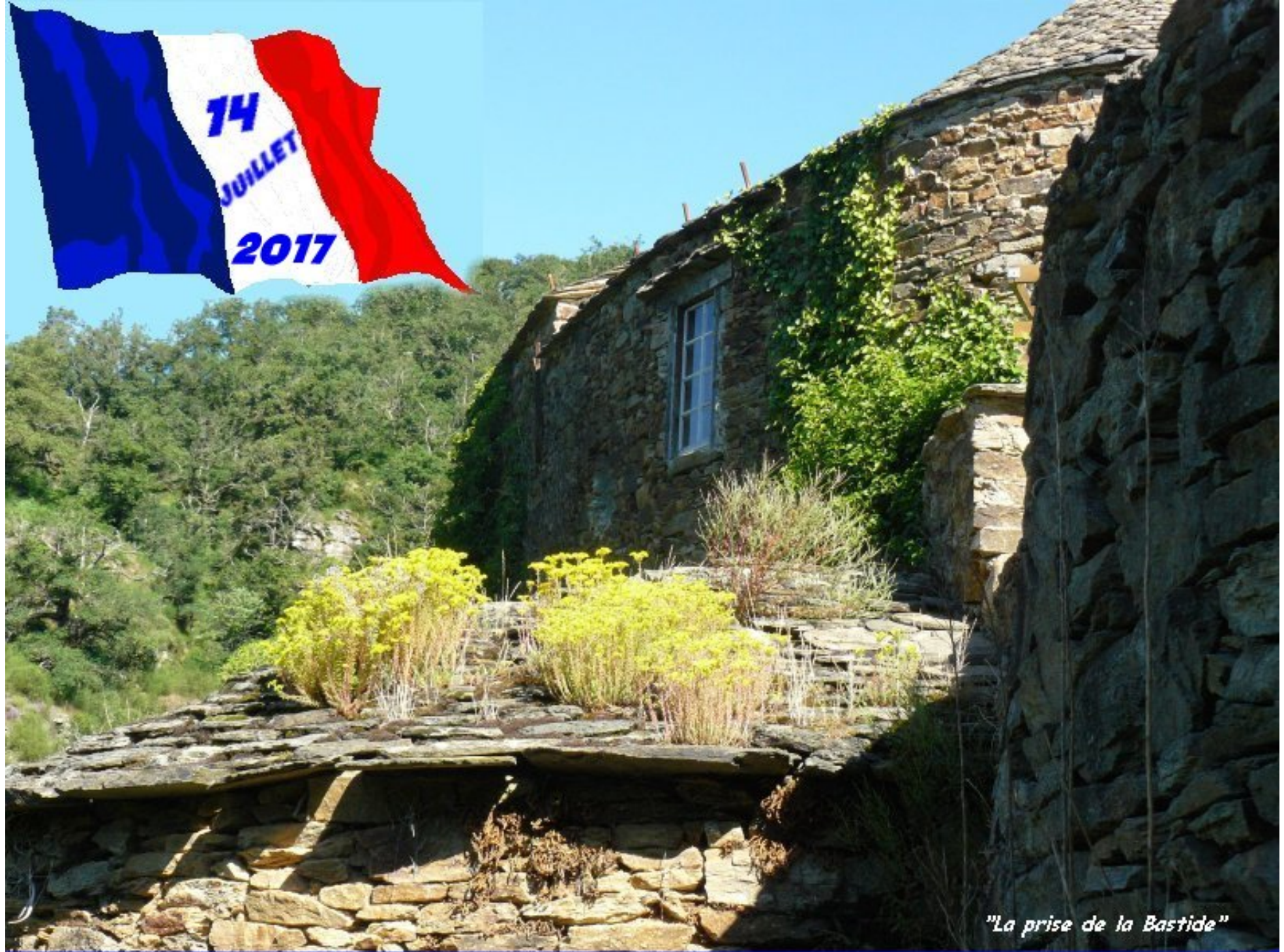
"La prise de la Bastide"