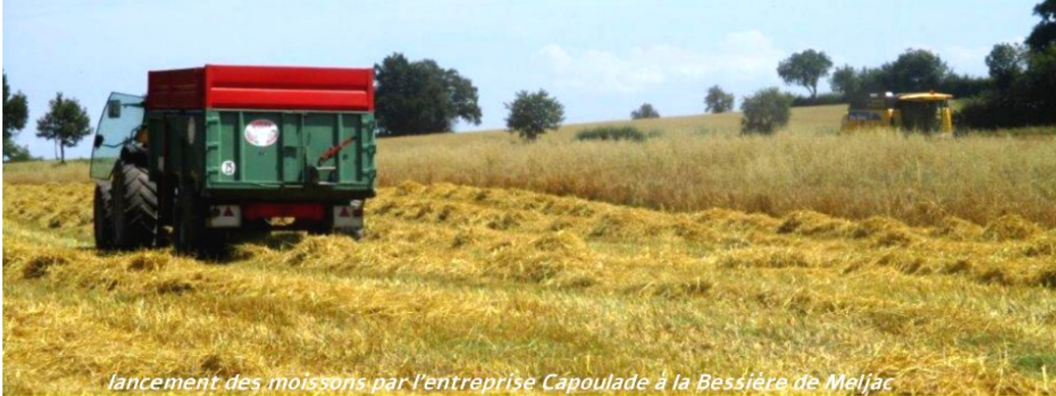
lancement des moissons par l'entreprise Capoulade à la Bessière de Meljac