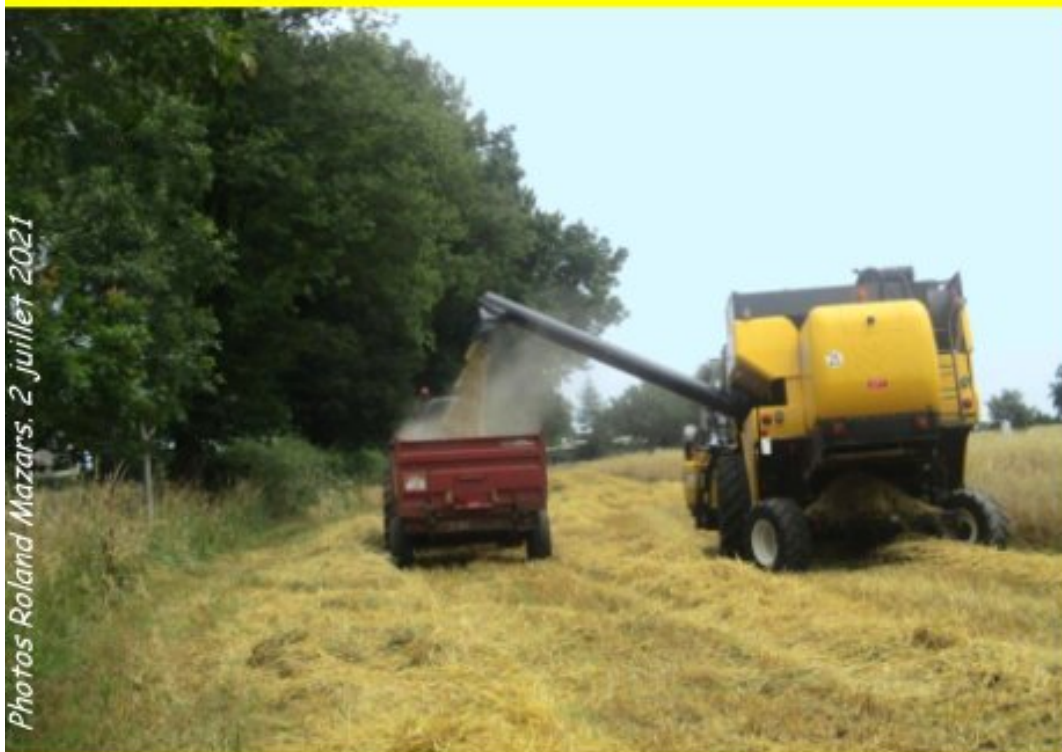
2 juillet 2021