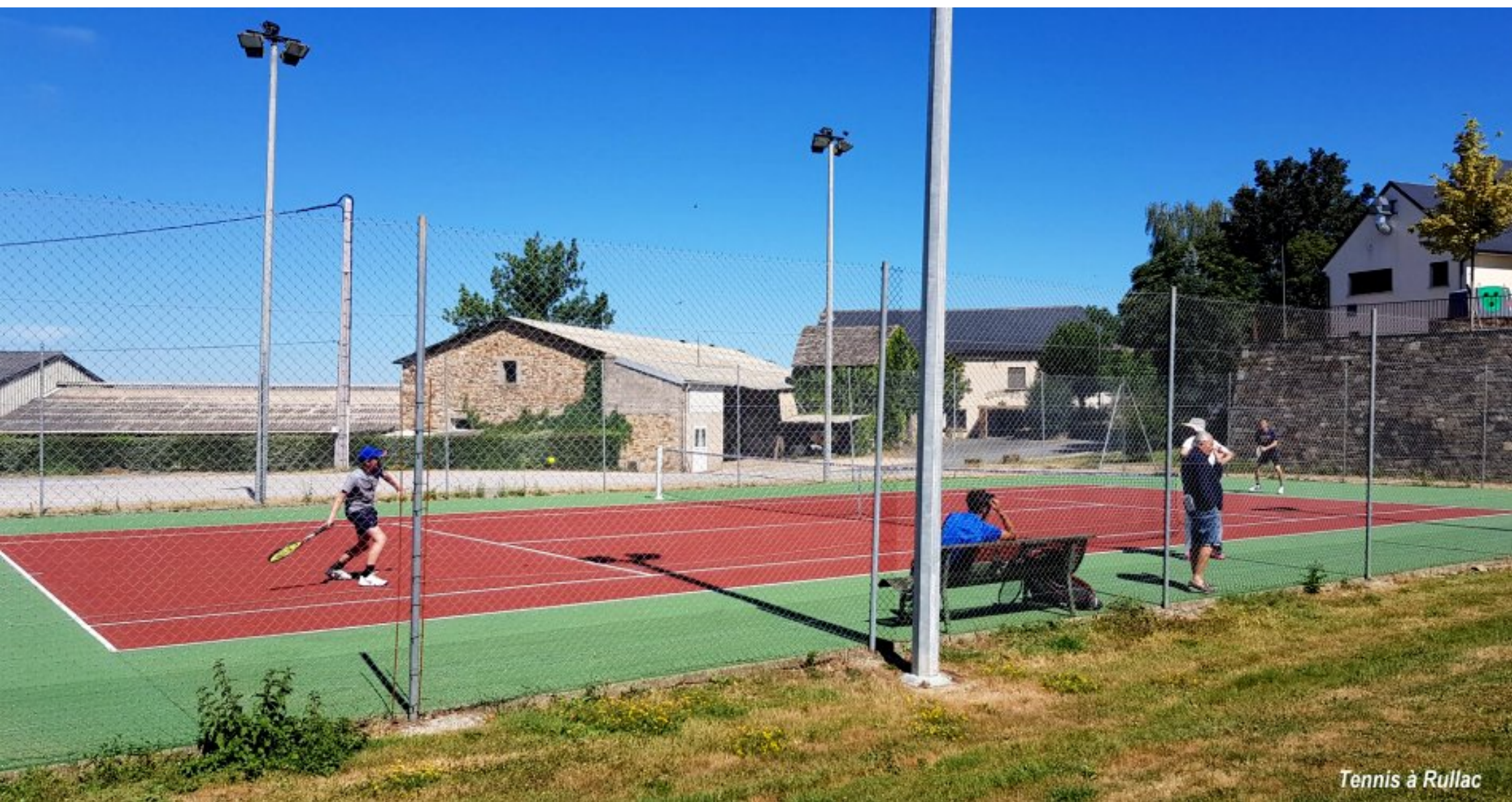
Tennis à Rullac