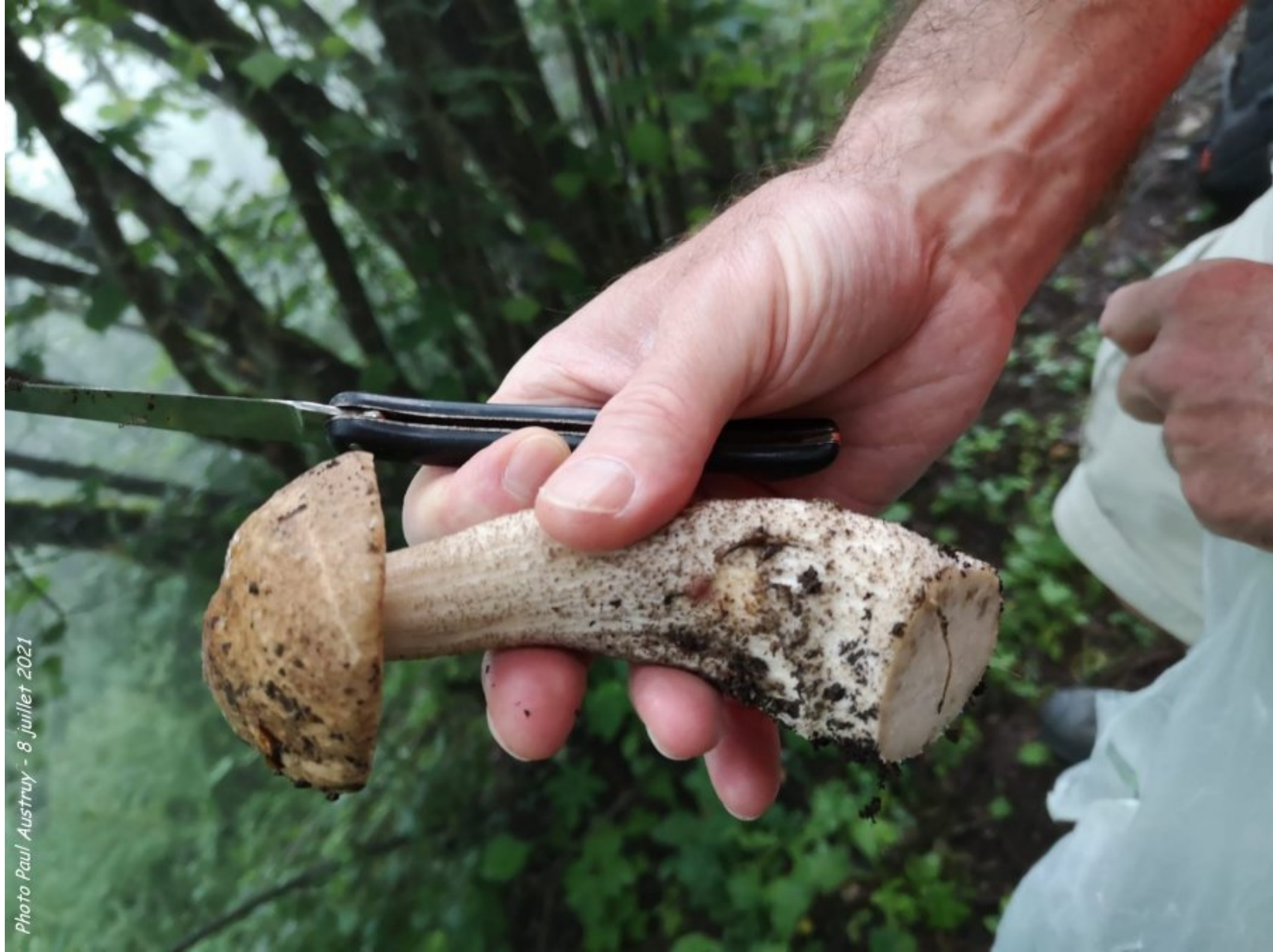
8 juillet 2021