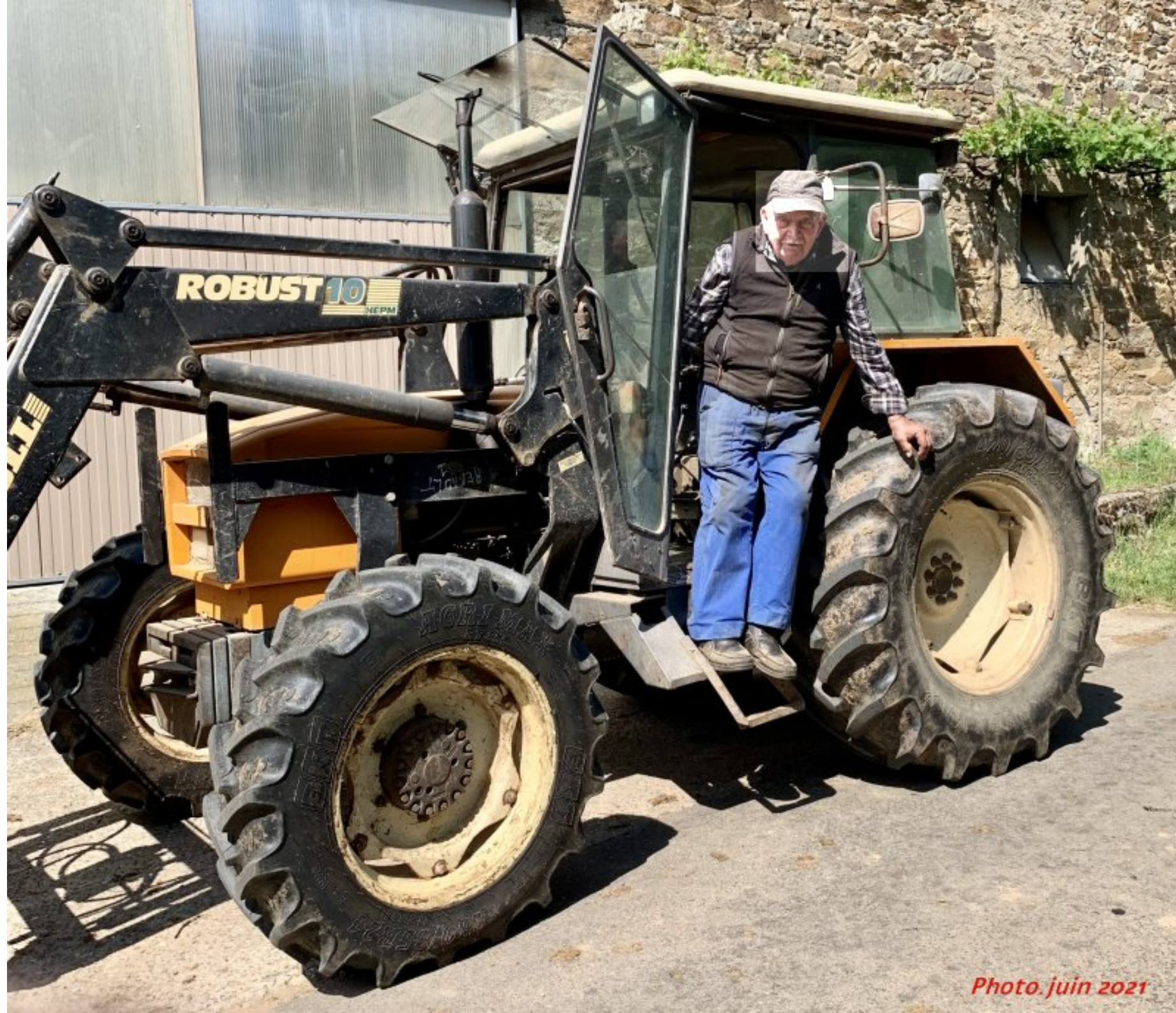
Photo. juin 2021