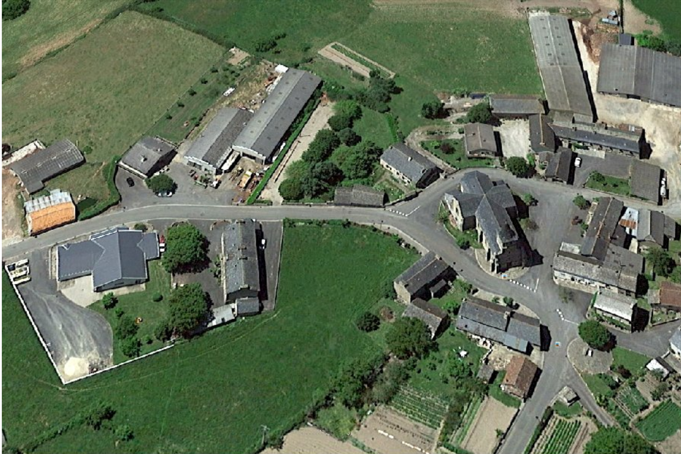
Meljac: l'église, la mairie et la salle des fêtes - image satellite du 5 juin 2014