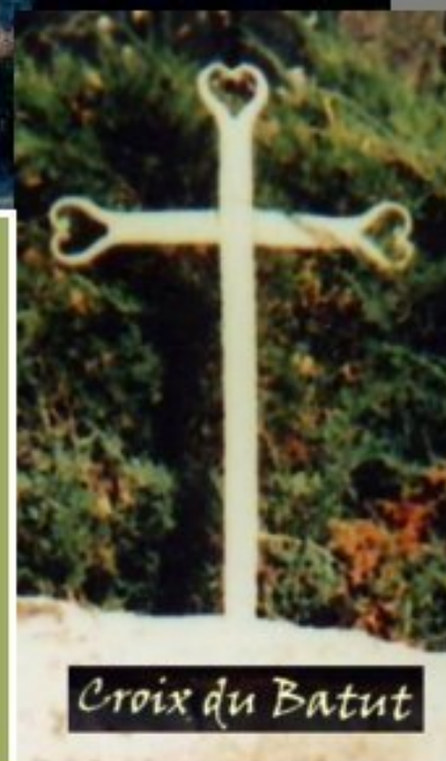
Croix du Batut