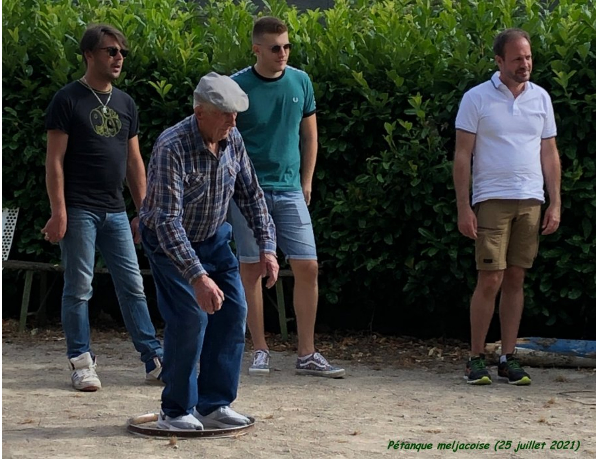
Pétanque meljacoise (25 juillet 2021)