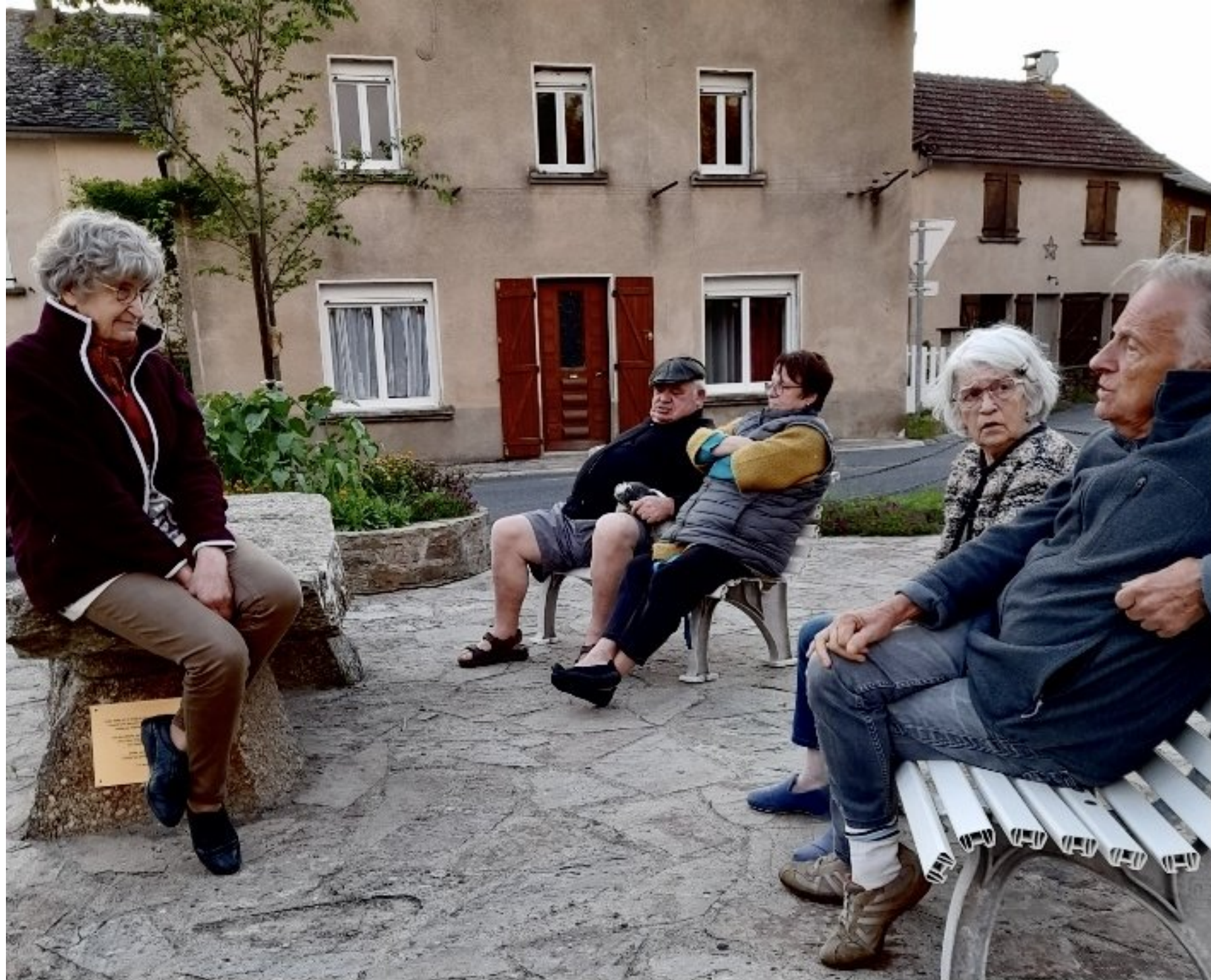
c'est l'été...les bancs de la place de l'église de Meljac ont repris du service