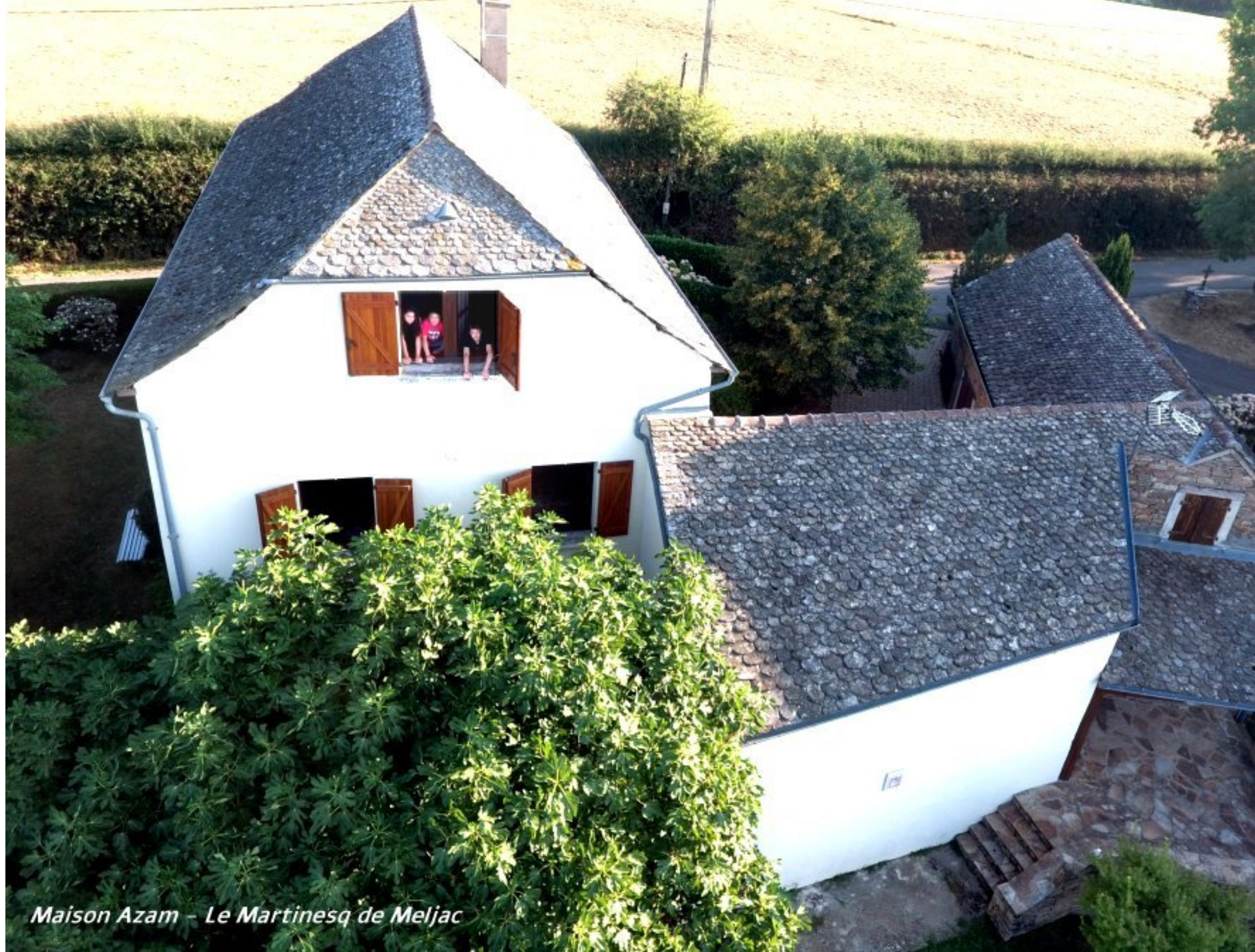
Maison Azam – Le Martinesq de Meljac