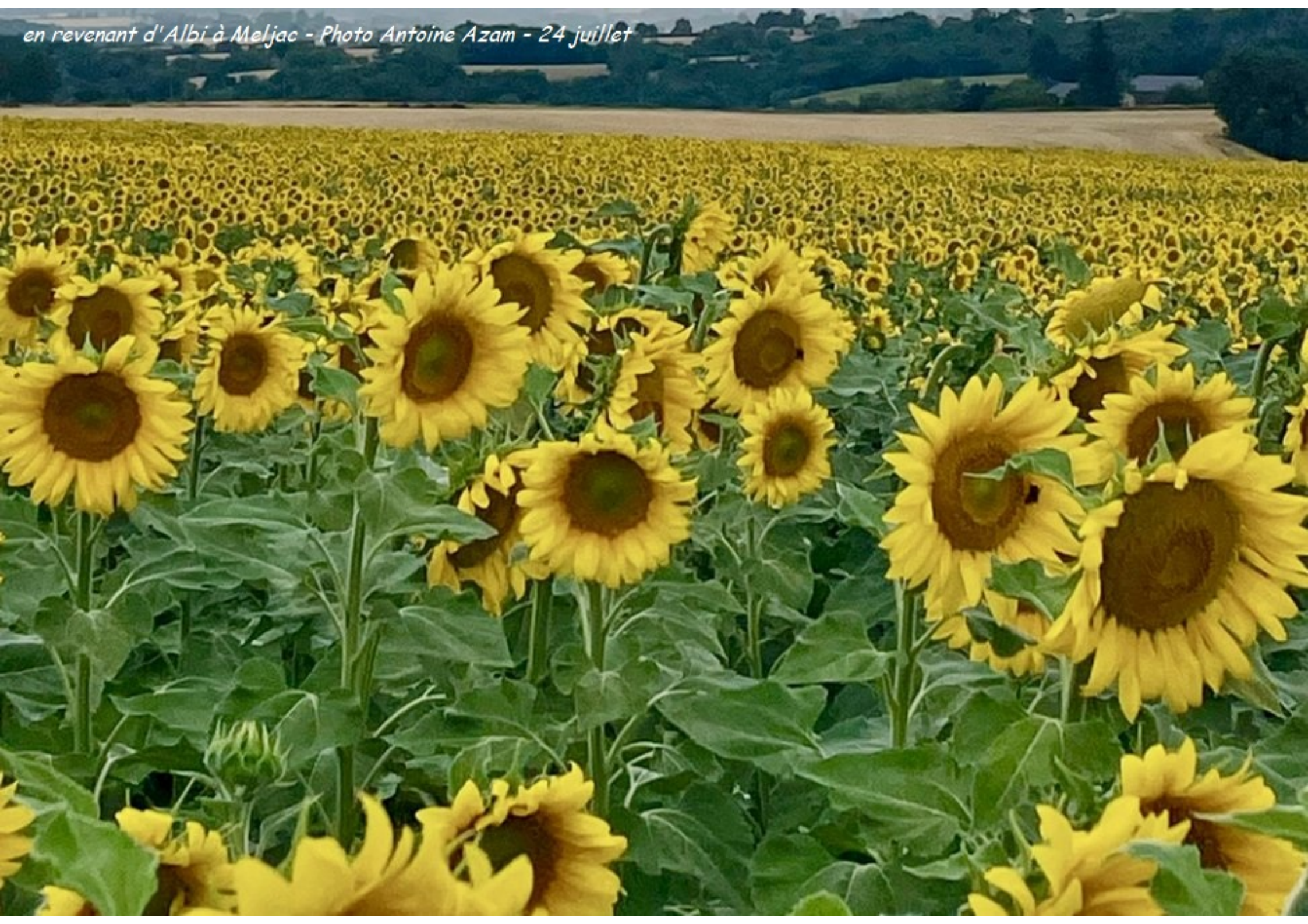
en revenant d'Albi à Meljac - 24 juillet