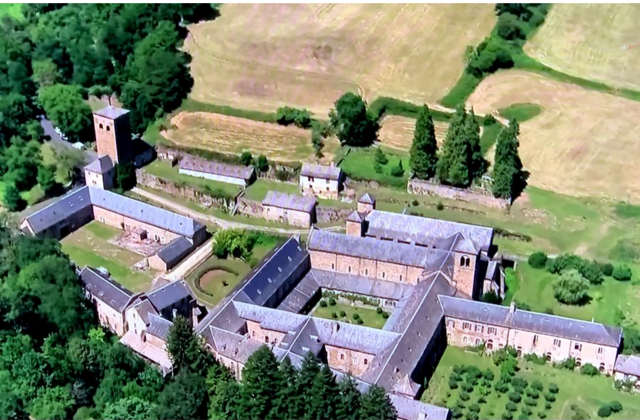
Abbaye de Bonnecombe