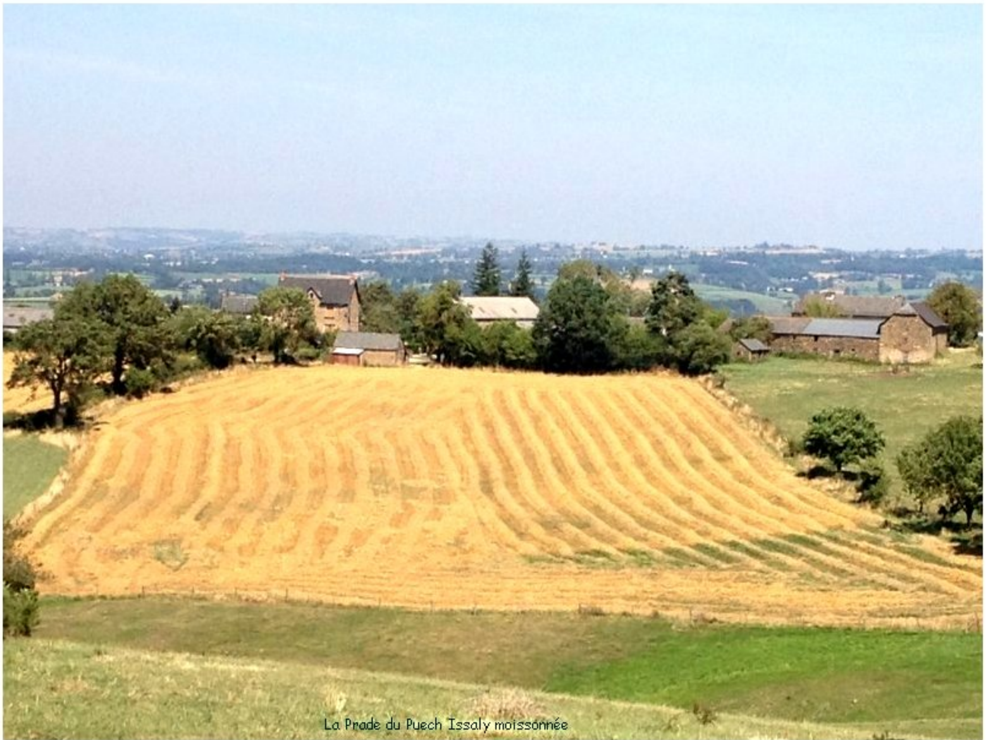
La Prade du Puech Issaly moissonnée