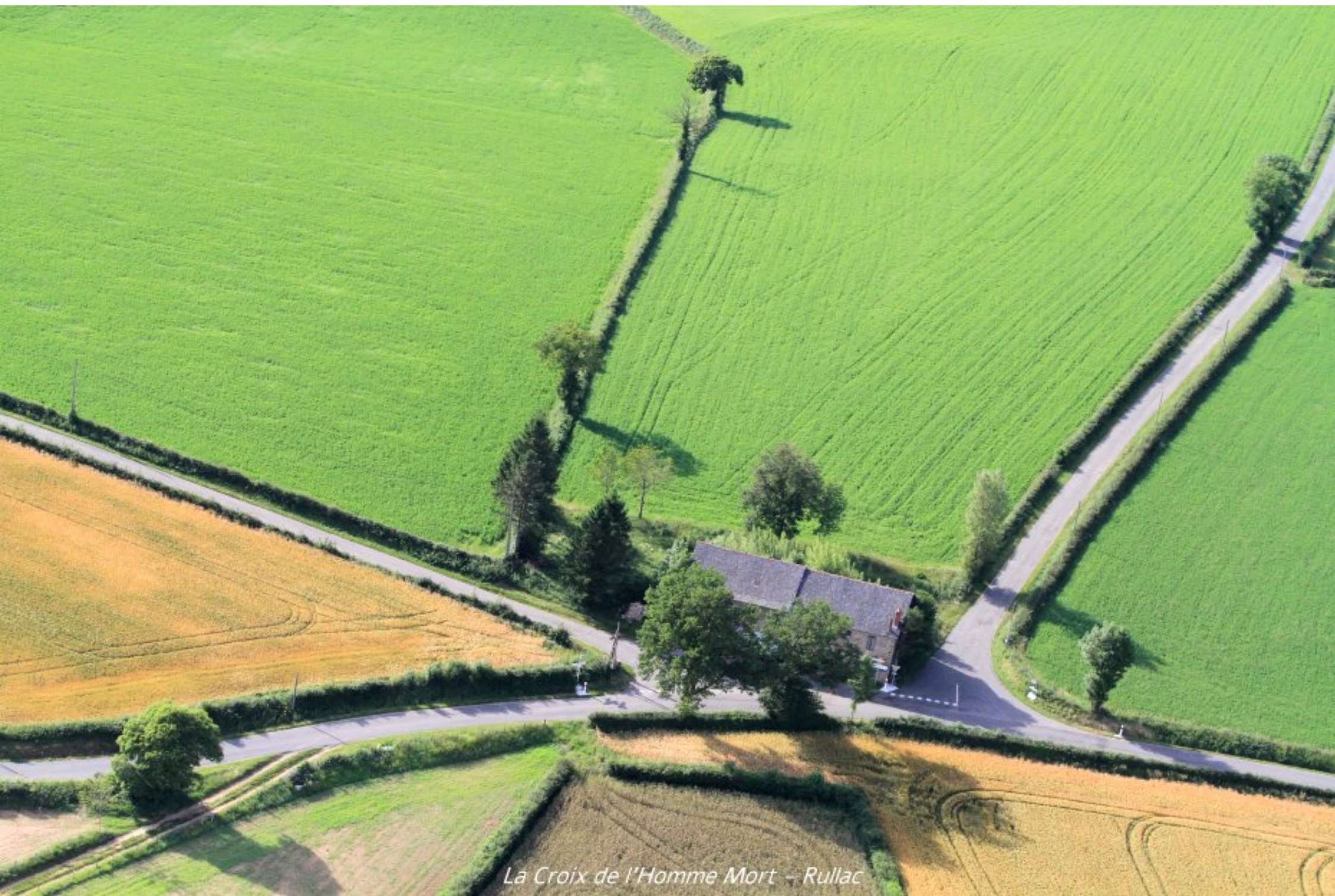
La Croix de l'Homme Mort – Rullac