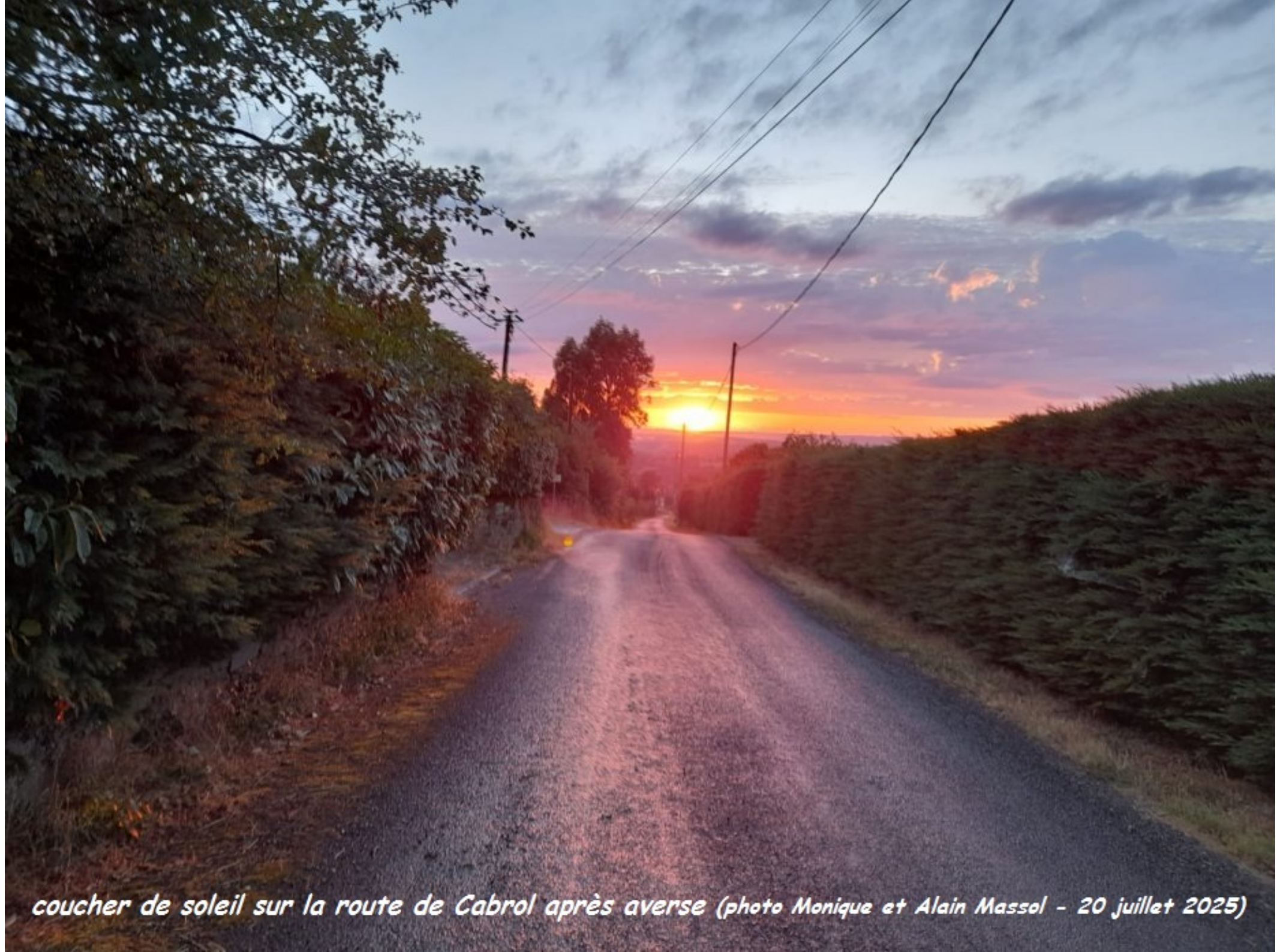
coucher de soleil sur la route de Cabrol après averse (20 juillet 2025)