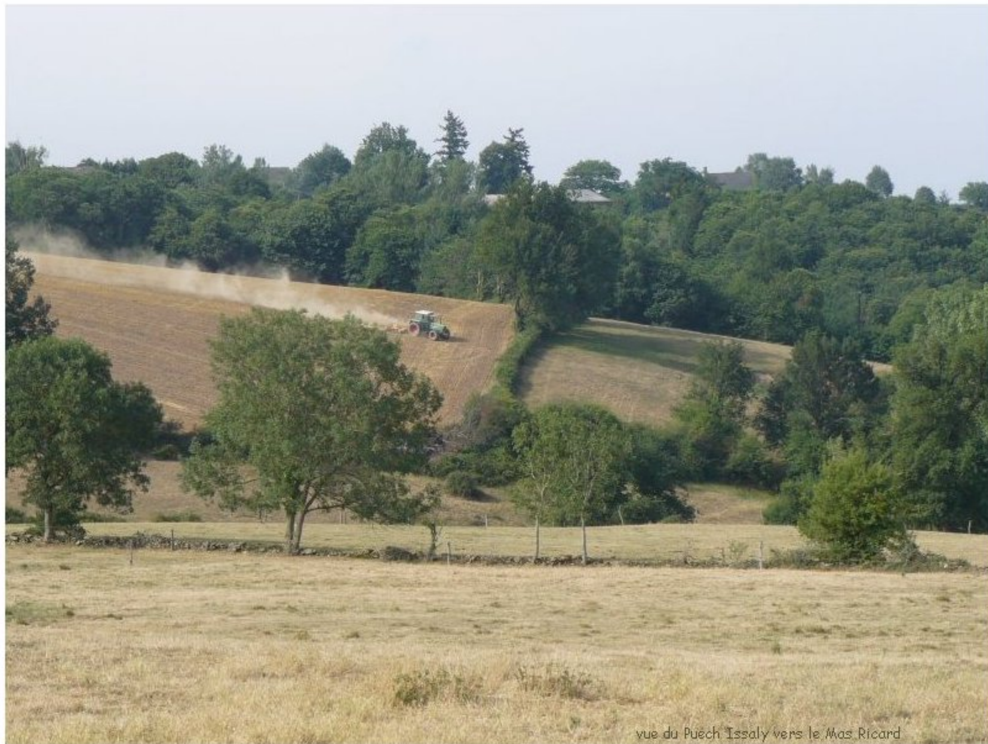
vue du Puech Issaly vers le Mas Ricard