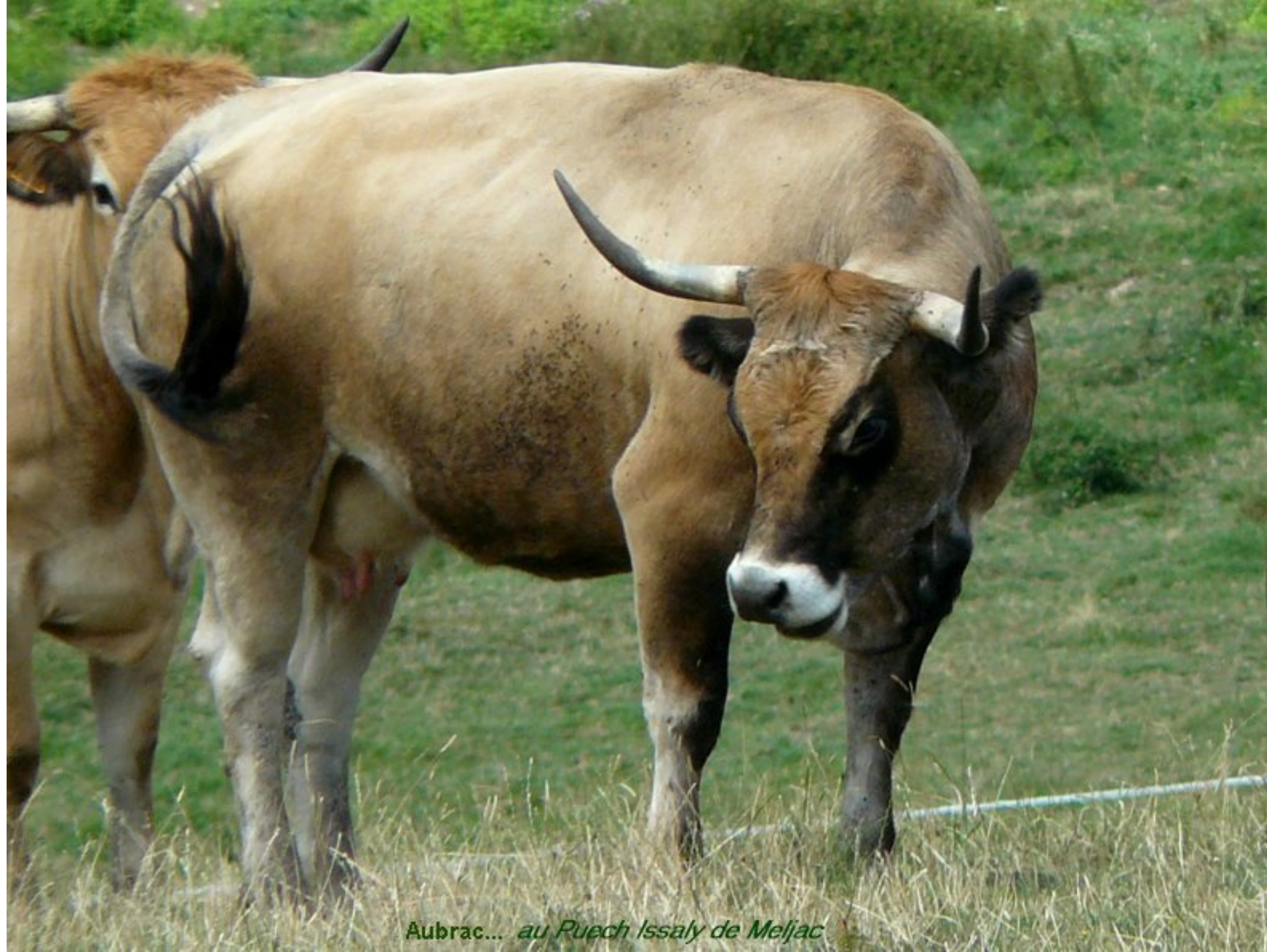
Aubrac... au Puech Issaly de Meljac