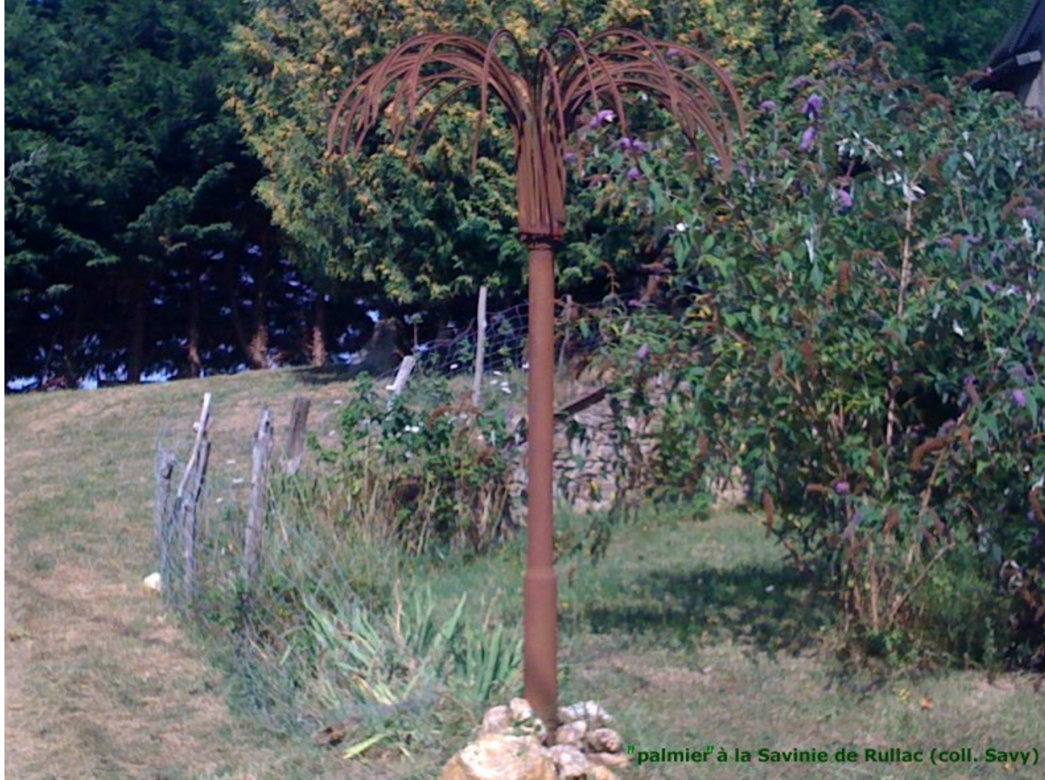
"palmier" à la Savinie de Rullac (coll. Savy)