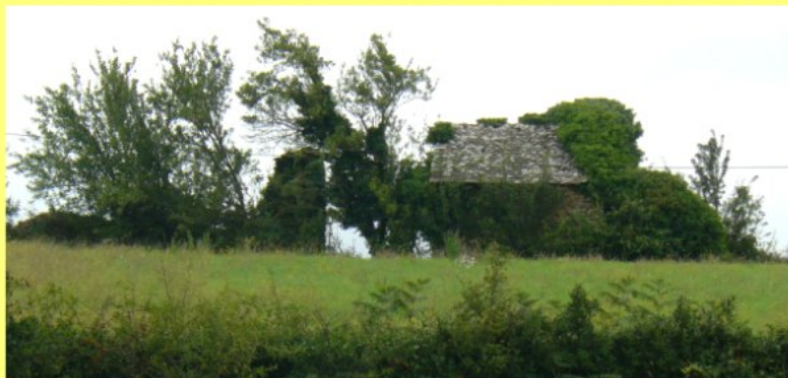
"Vestiges" en 2011 de la maison Boyer du Riou