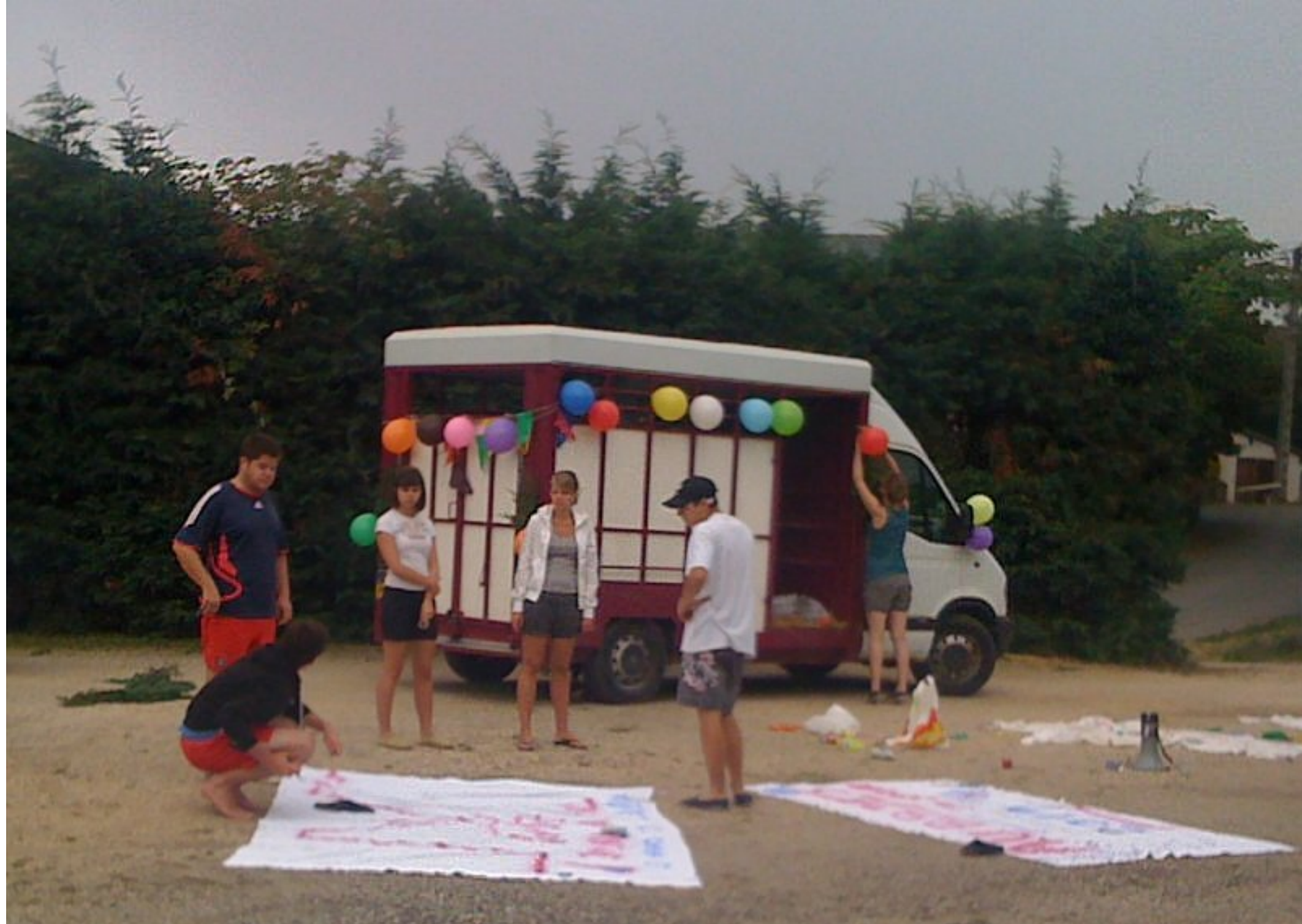
à Rullac, on prépare les aubades de la prochaine Fête