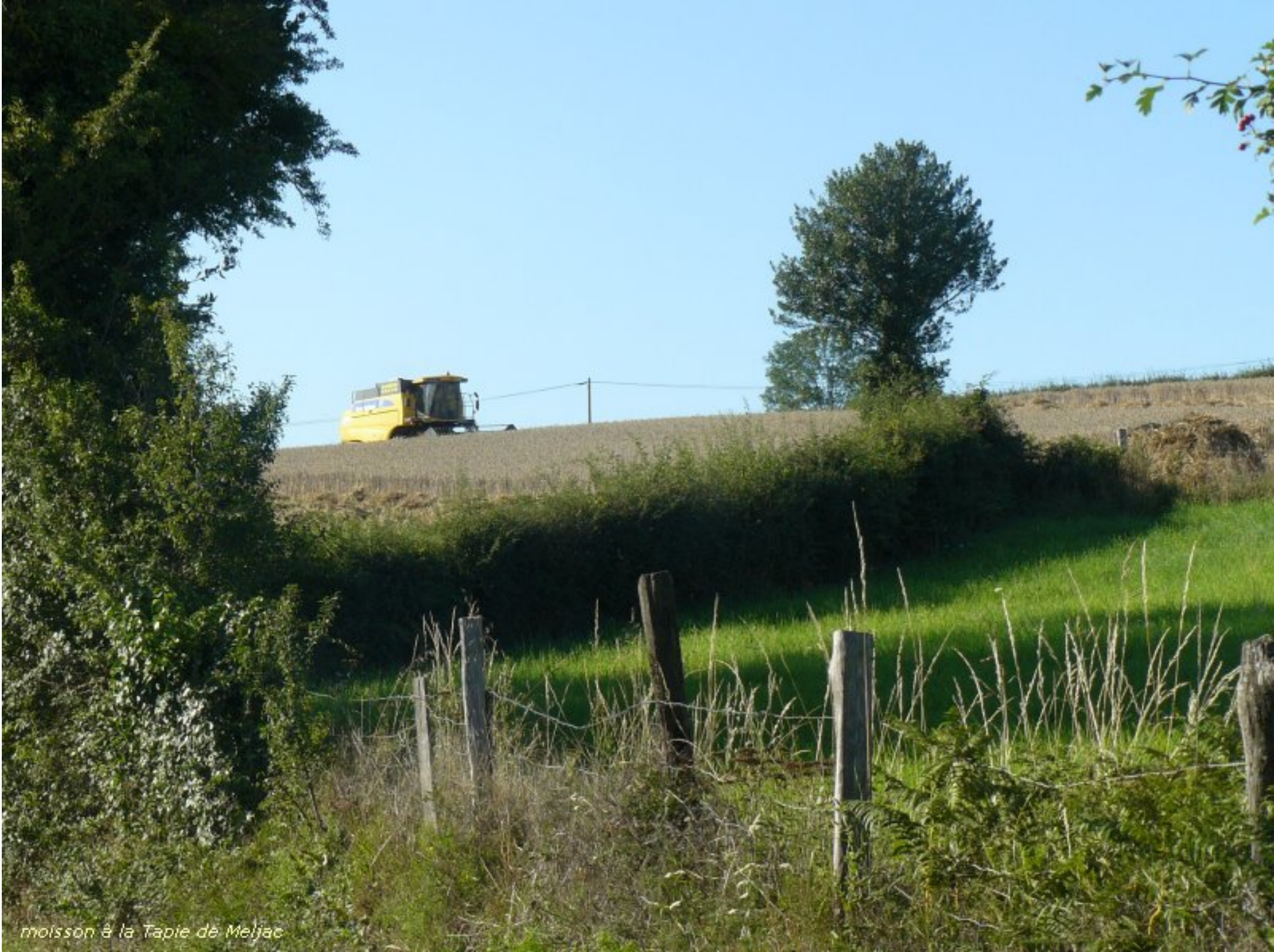
moisson à la Tapie de Meljac