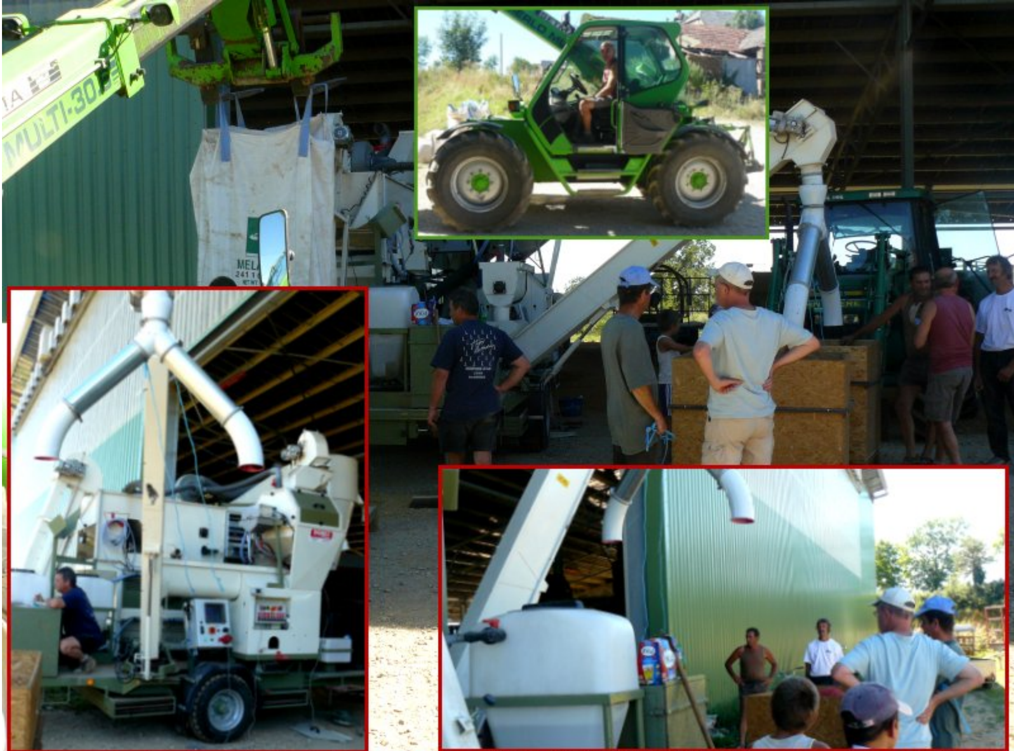
Version moderne du "crible de Baptiste" au Clot de Meljac avec la CUMA du Lagast - 10 août 2012