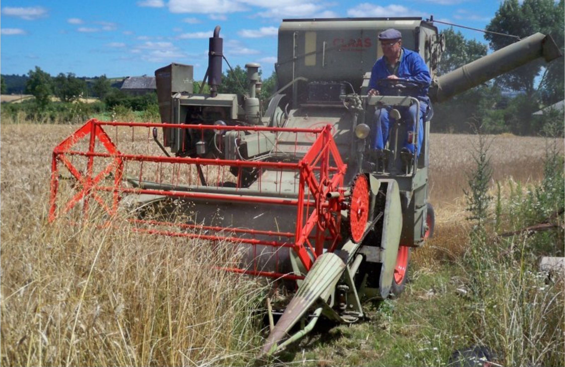
"Moisson d'antan" à Grascazes par Camille Gaubert en juillet 2012