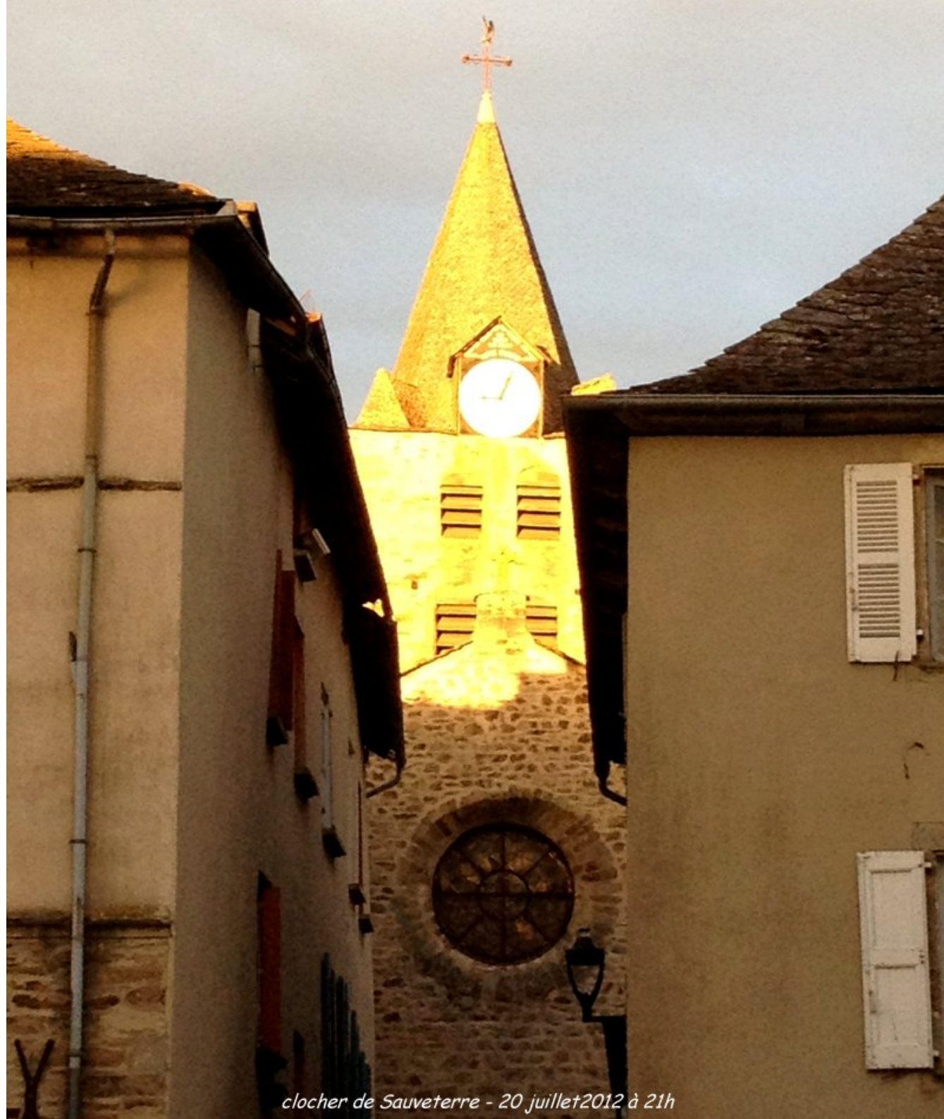
clocher de Sauveterre - 20 juillet 2012 à 21h