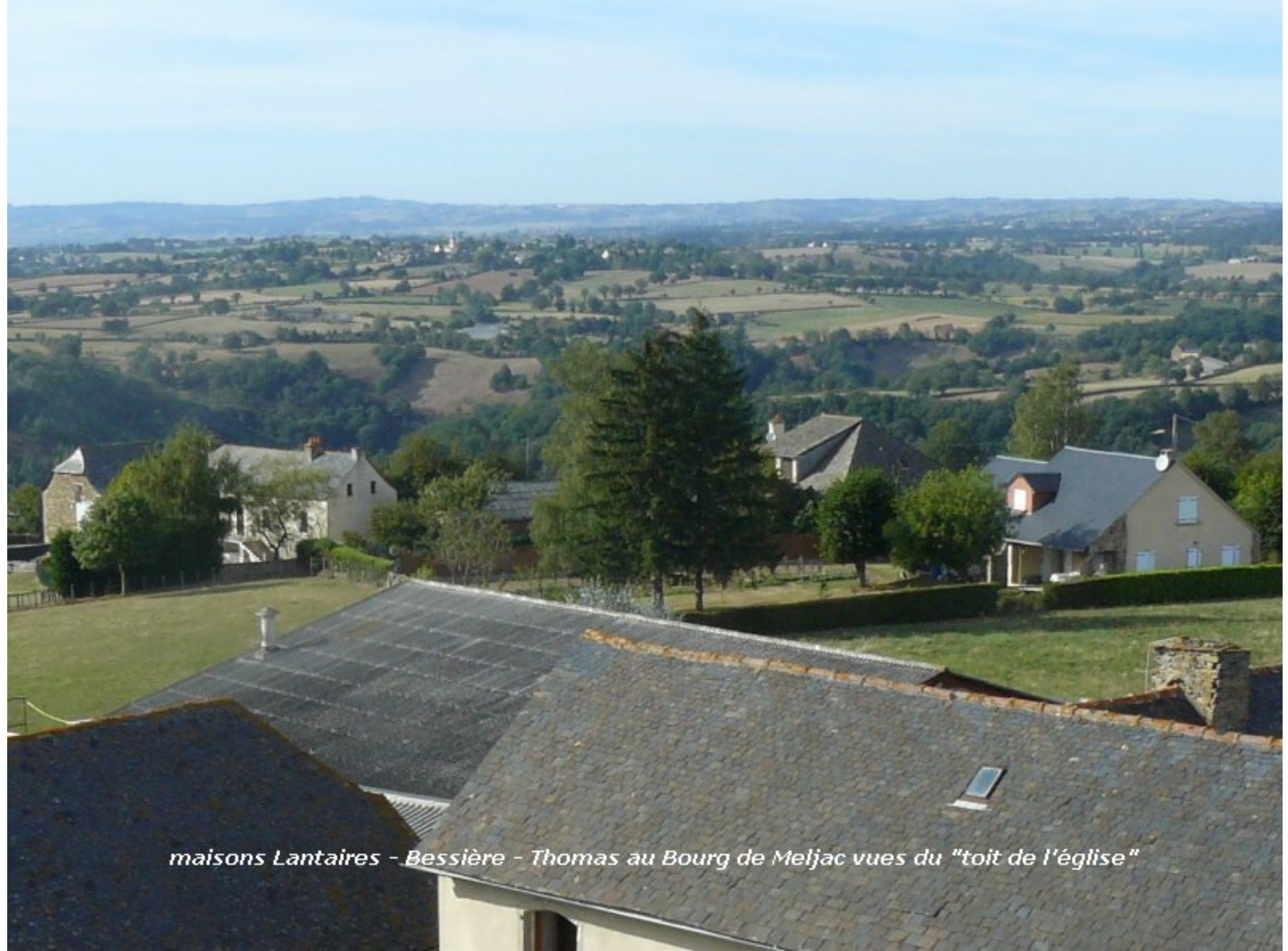
maisons Lantaires - Bessière - Thomas au Bourg de Meljac vues du "toit de l'église"