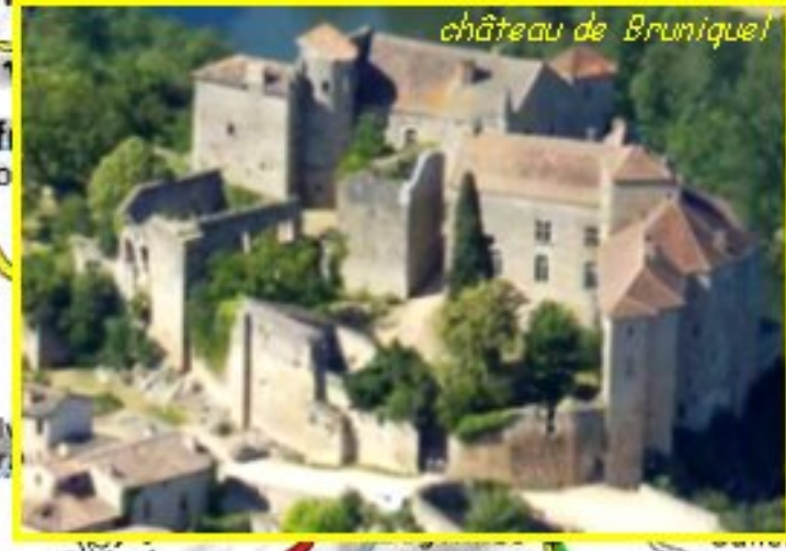
château de Bruniquel