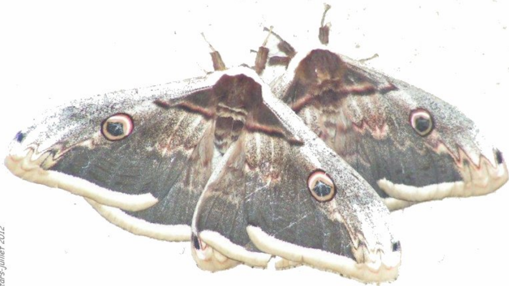
Deux "oiseaux" de nuit