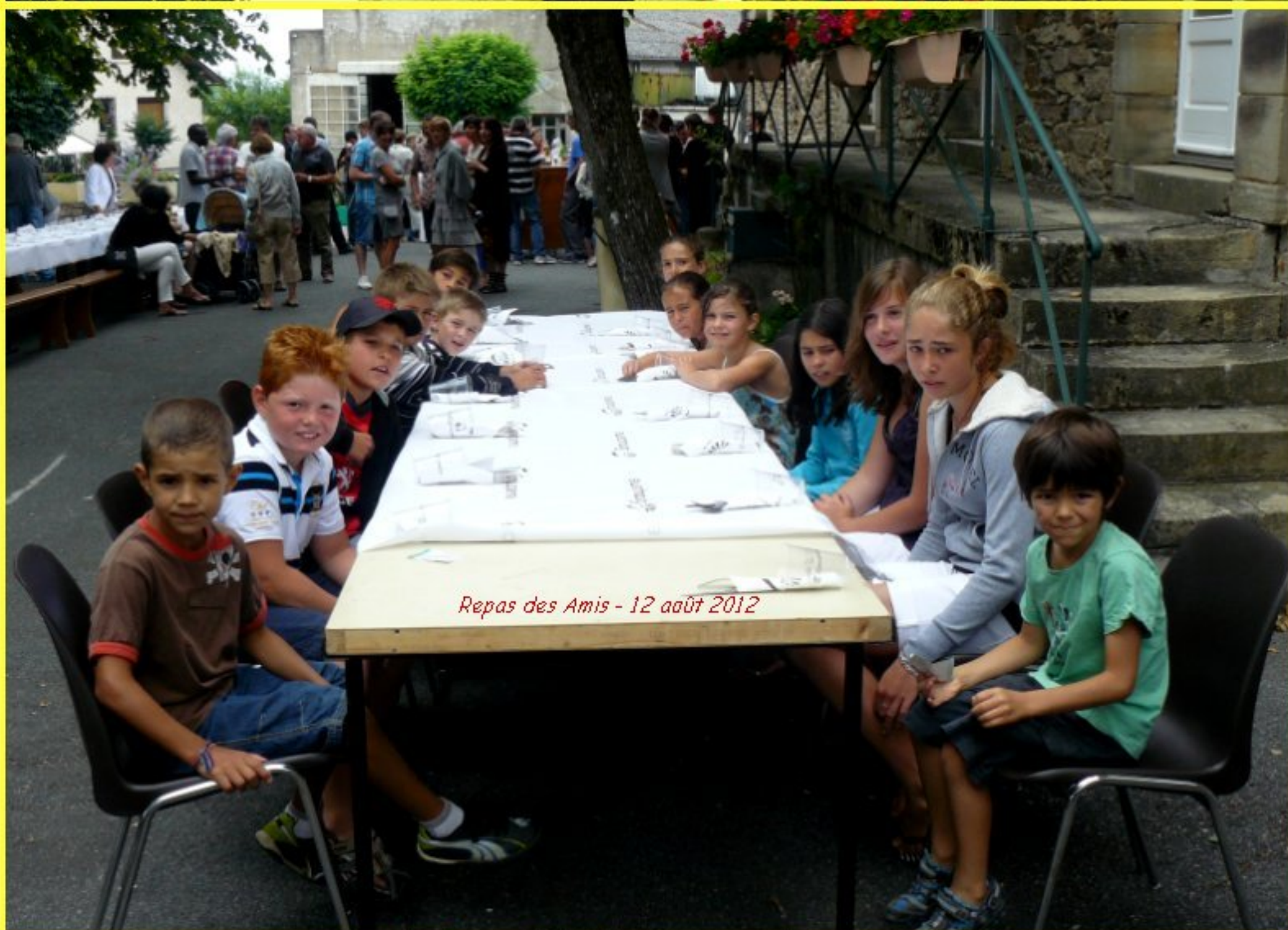
Repas des Amis - 12 août 2012

A Meljac, on s'interroge: faut-il ré-ouvrir l'école? ou au moins la cantine?