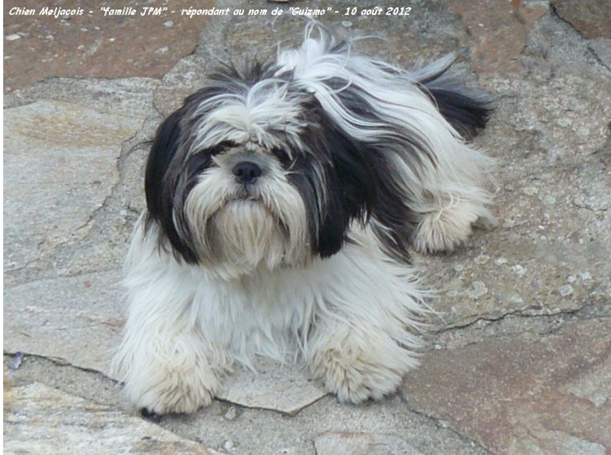
Chien Meljacois - "famille JPM" - répondant au nom de "Guizmo" - 10 août 2012