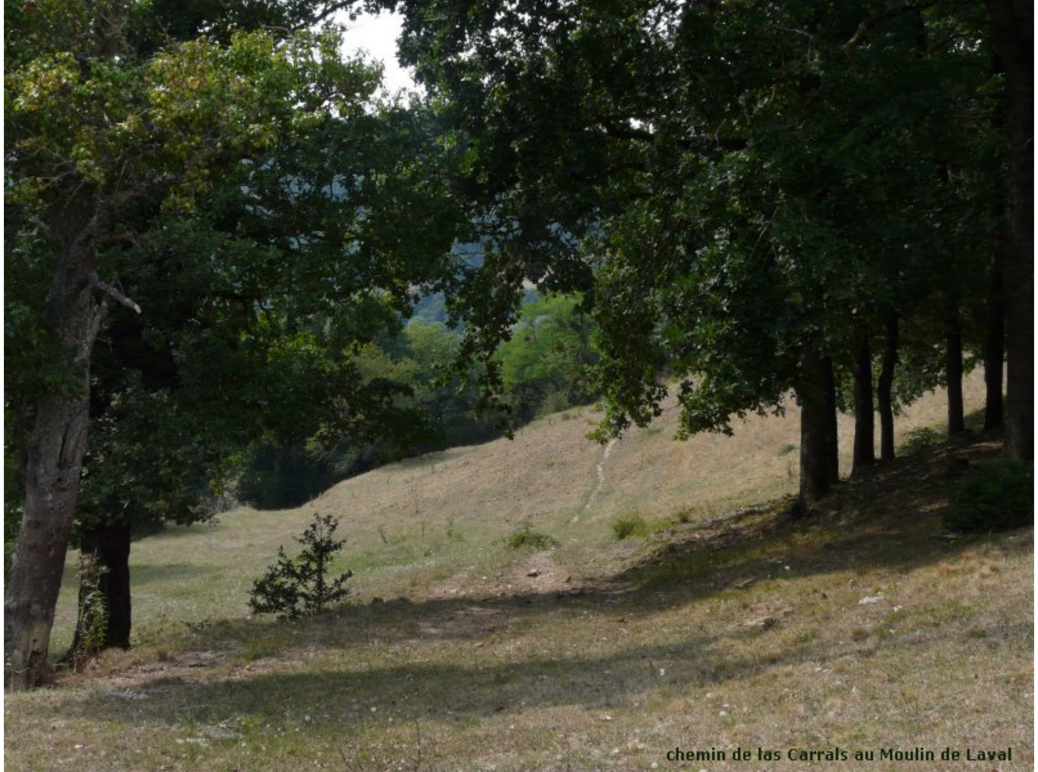
chemin de las Carrals au Moulin de Laval