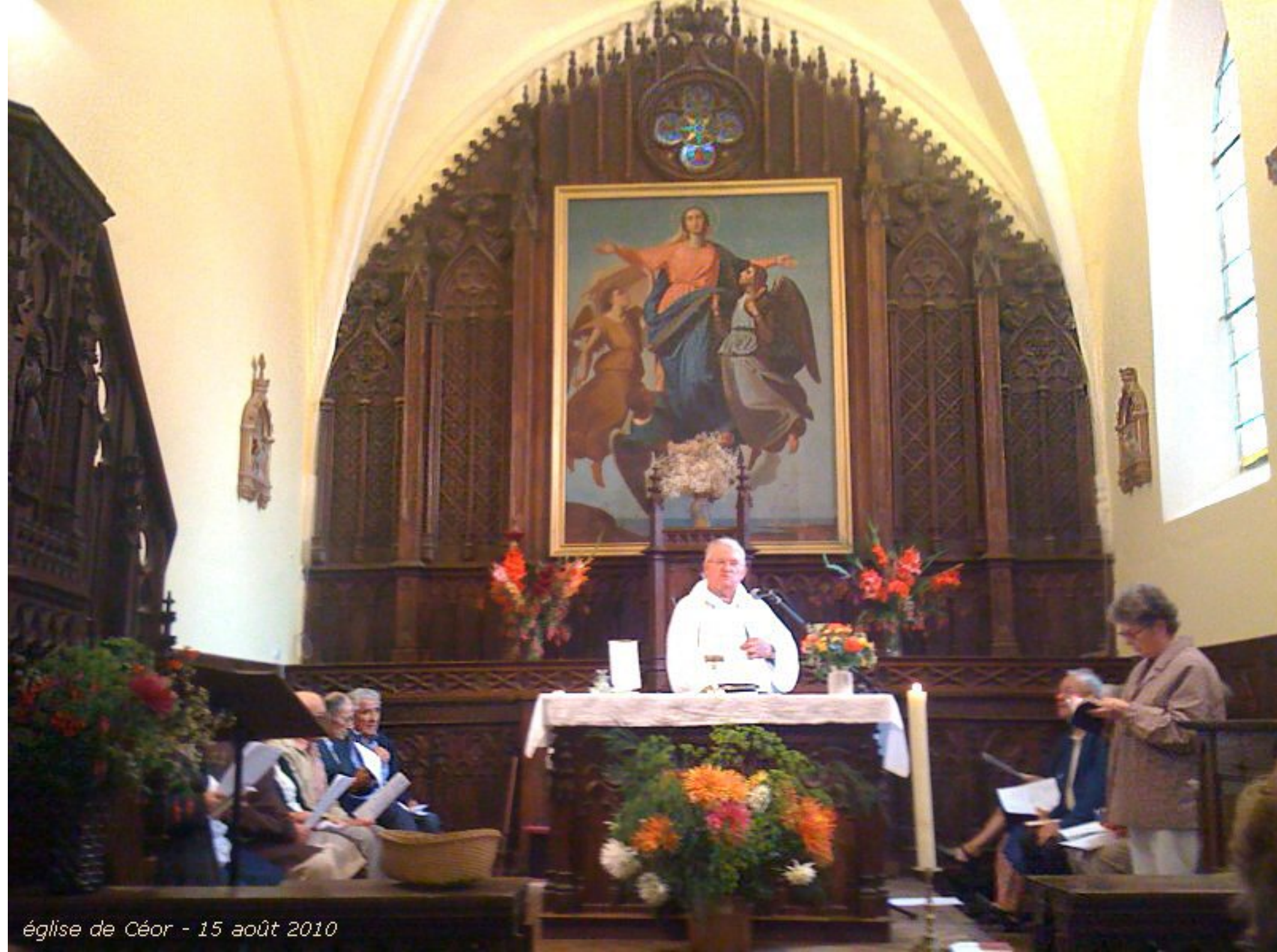
église de Céor - 15 août 2010