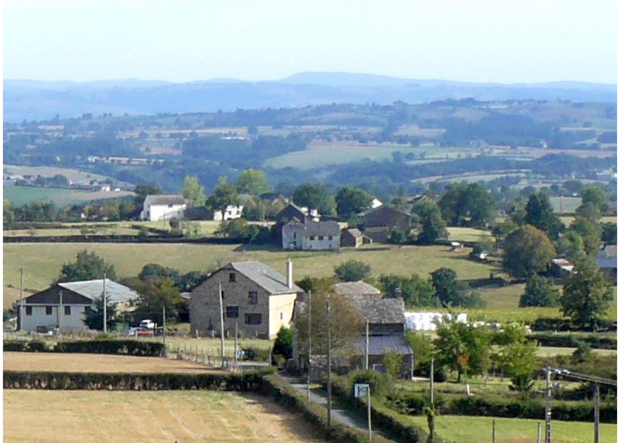
Soulages sur fond de Grascazes-Le Féraldesq vu du "toit de l'église"