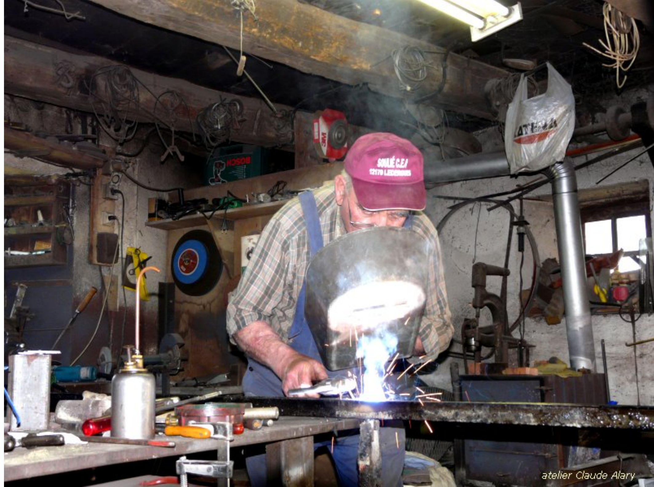
atelier Claude Alary