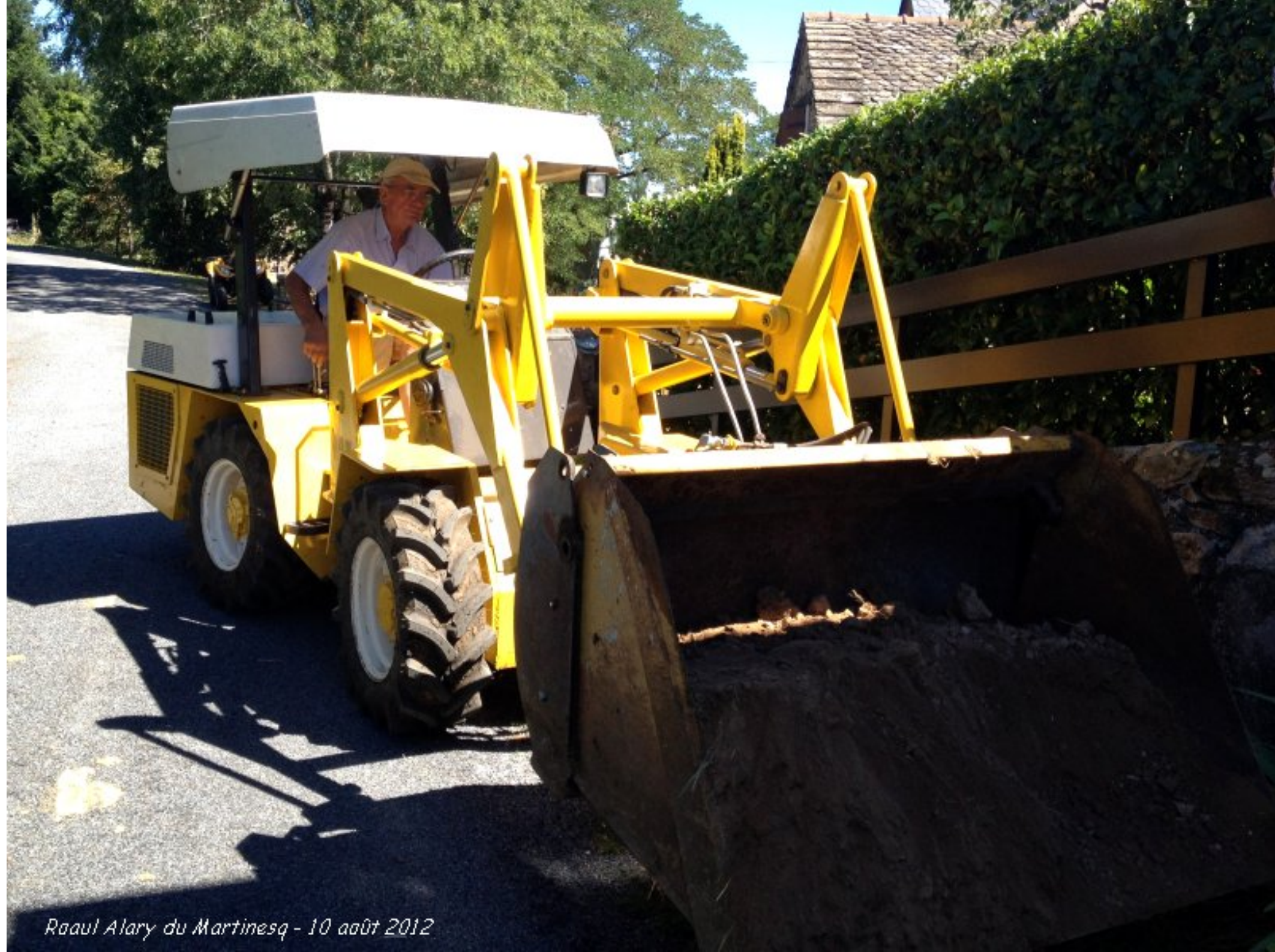
Raoul Alary du Martinesq - 10 août 2012