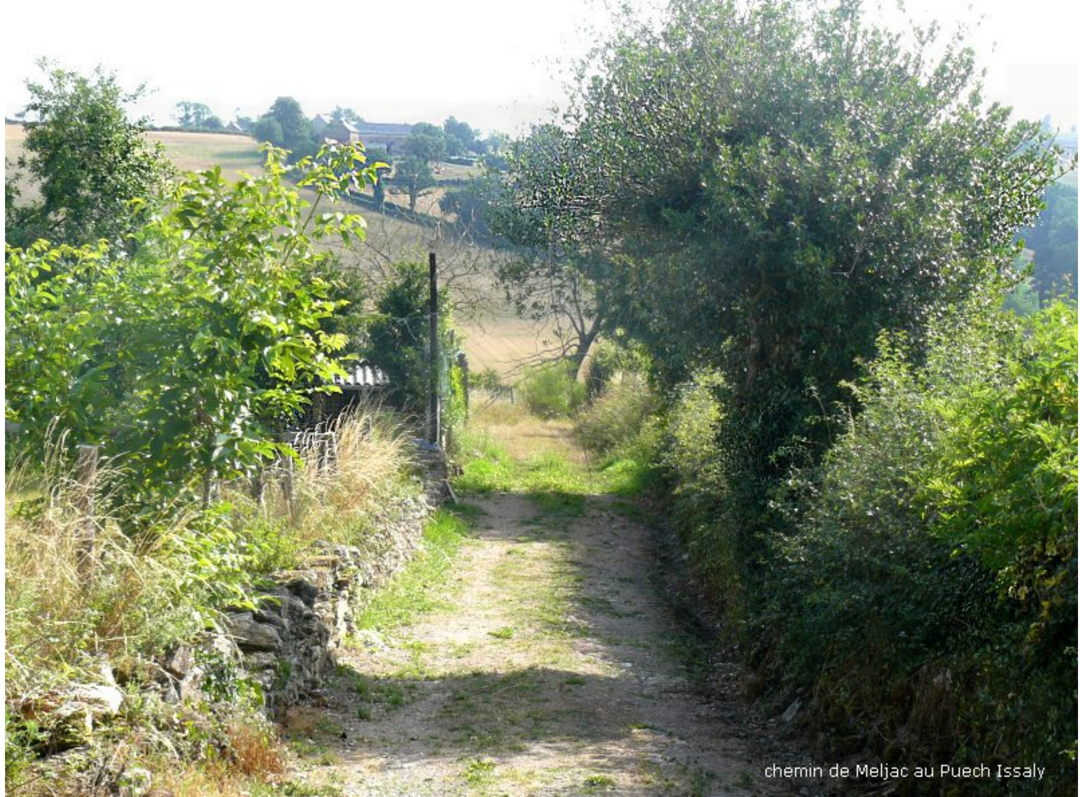
chemin de Meljac au Puech Issaly