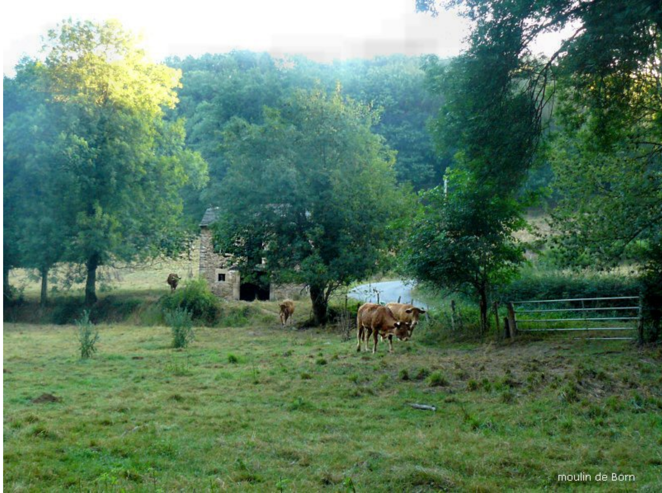
moulin de Born