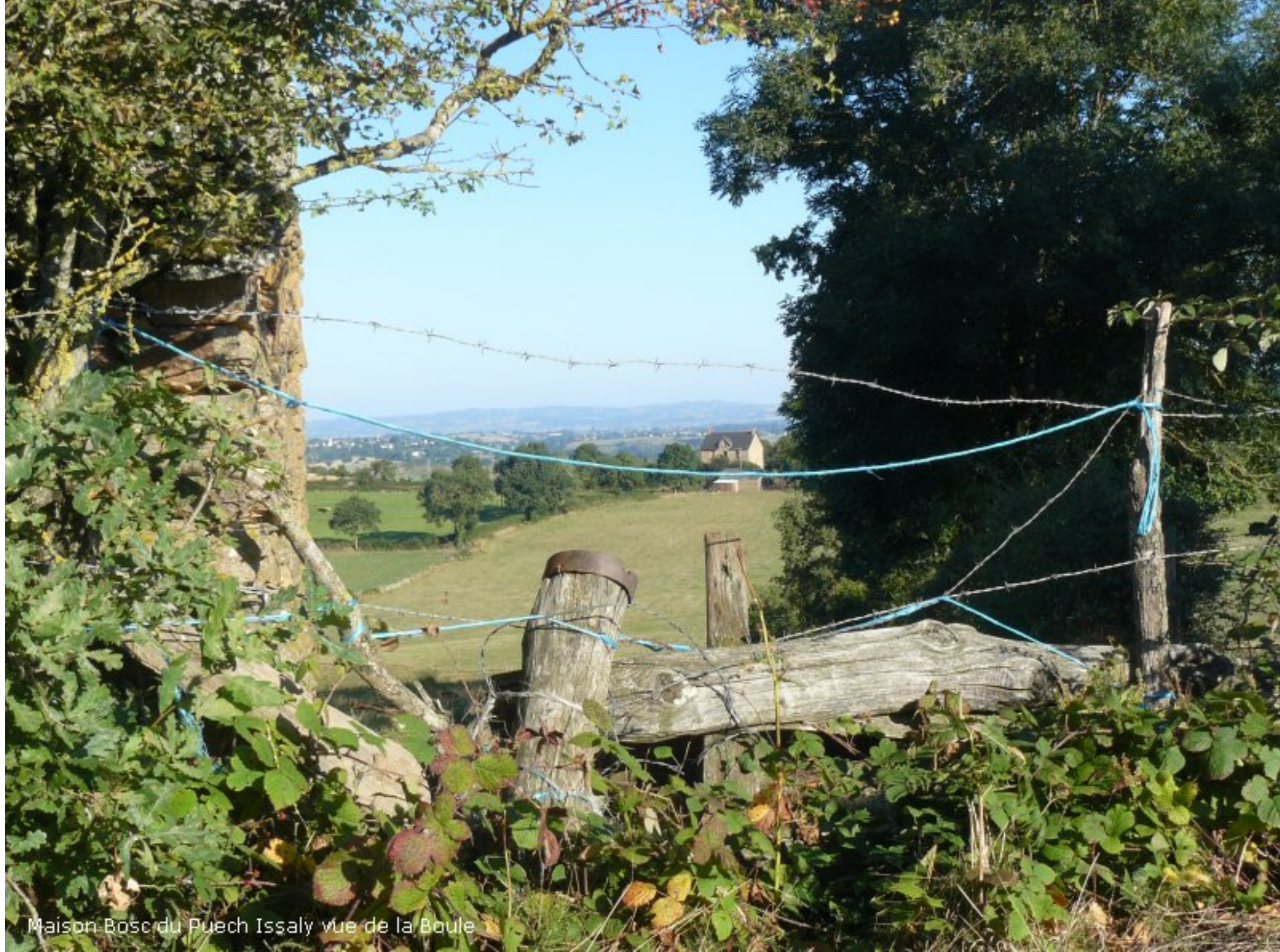
Maison Bosc du Puech Issaly vue de la Boule