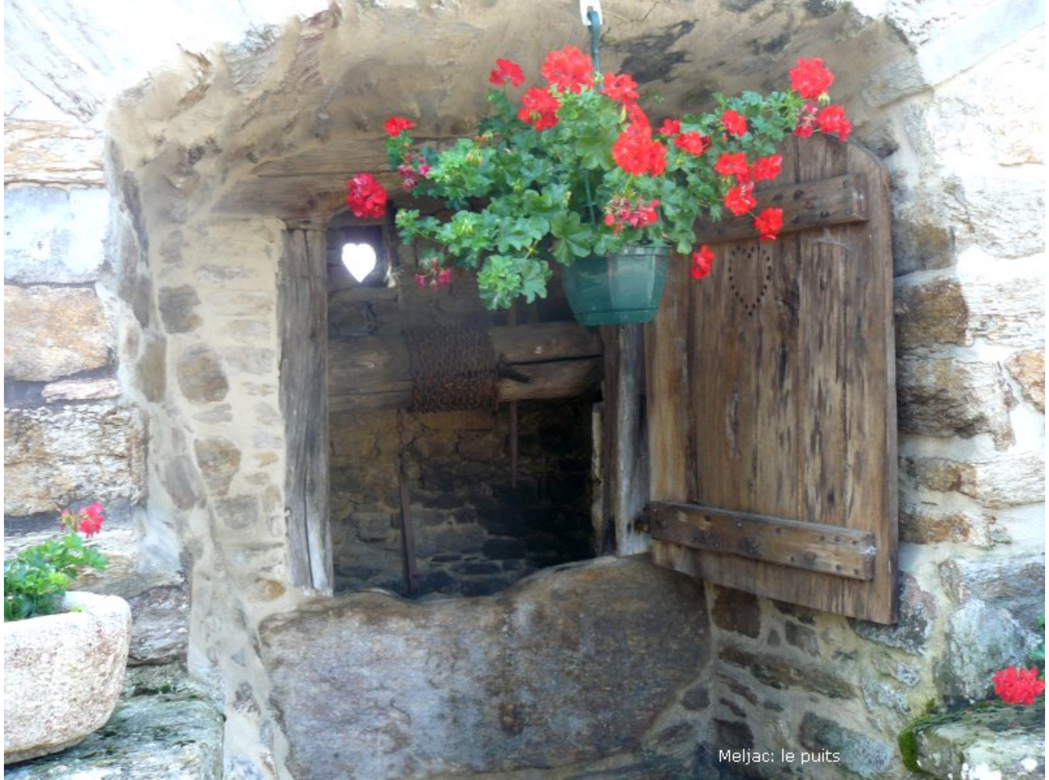
Meljac: le puits