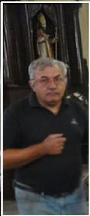
28 août 2012: réfection du sol "bosselé" de la chapelle St. Blaise de l'église de Meljac