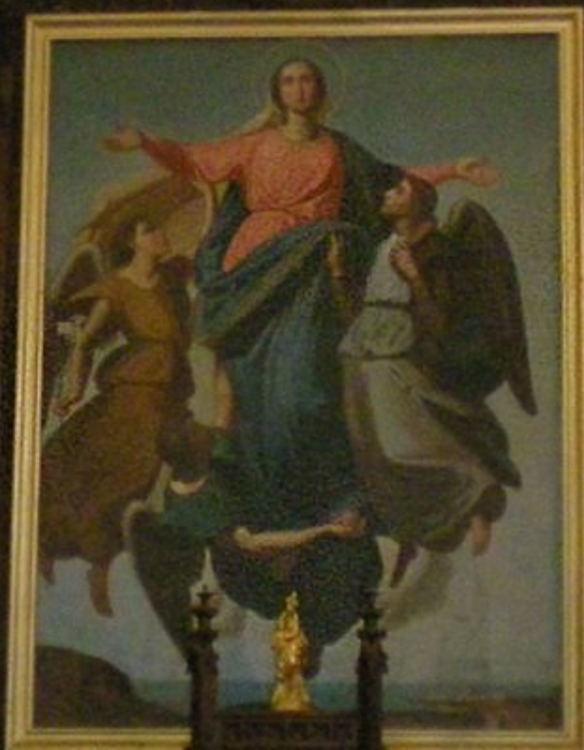
l'Assomption: église de Céor (auteur inconnu)