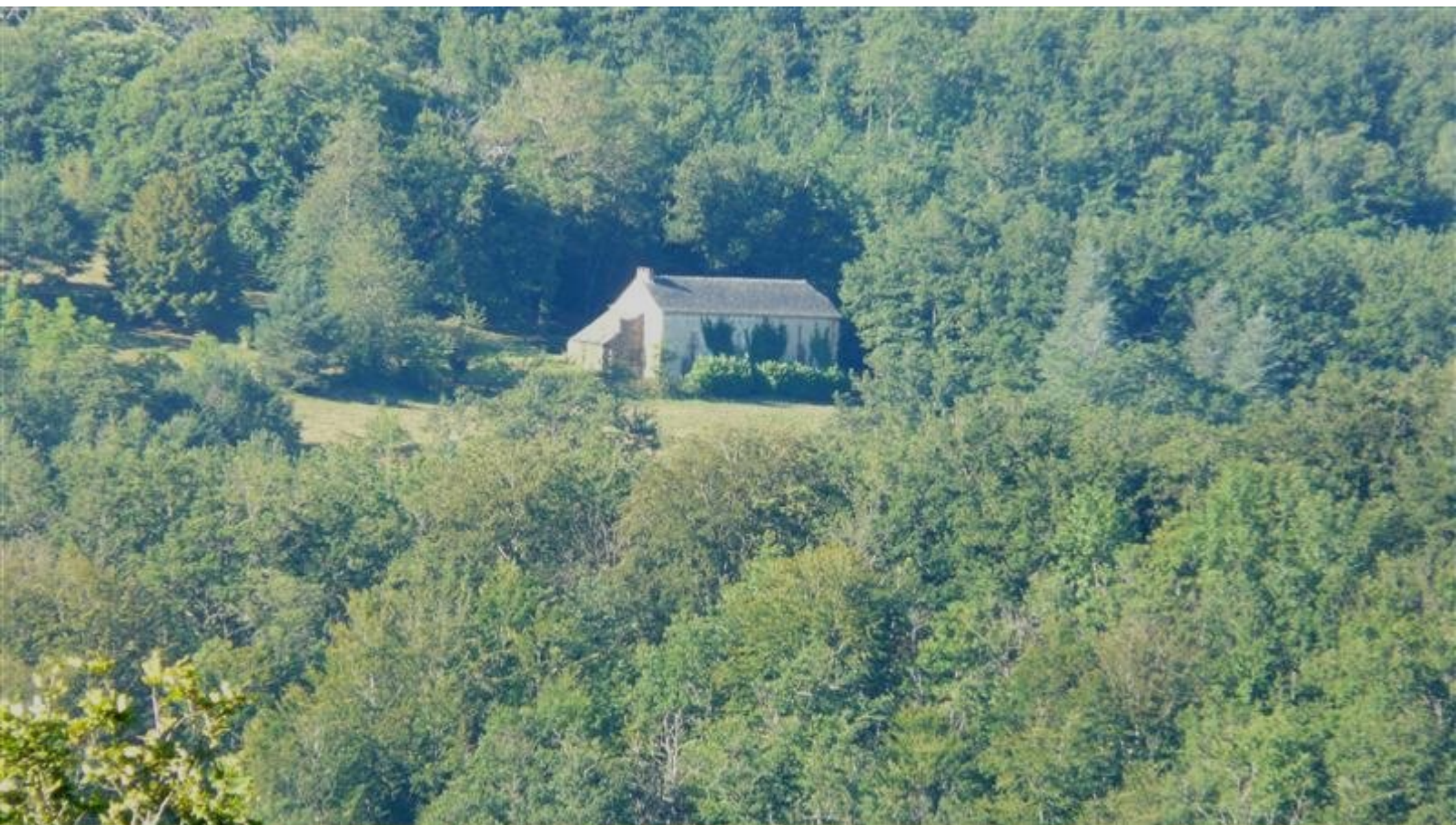
Vue de Triols sur la plantation "la Gasconie" dite encore "Pierre Blanche" (propriété famille Rouzet à Lédergues)