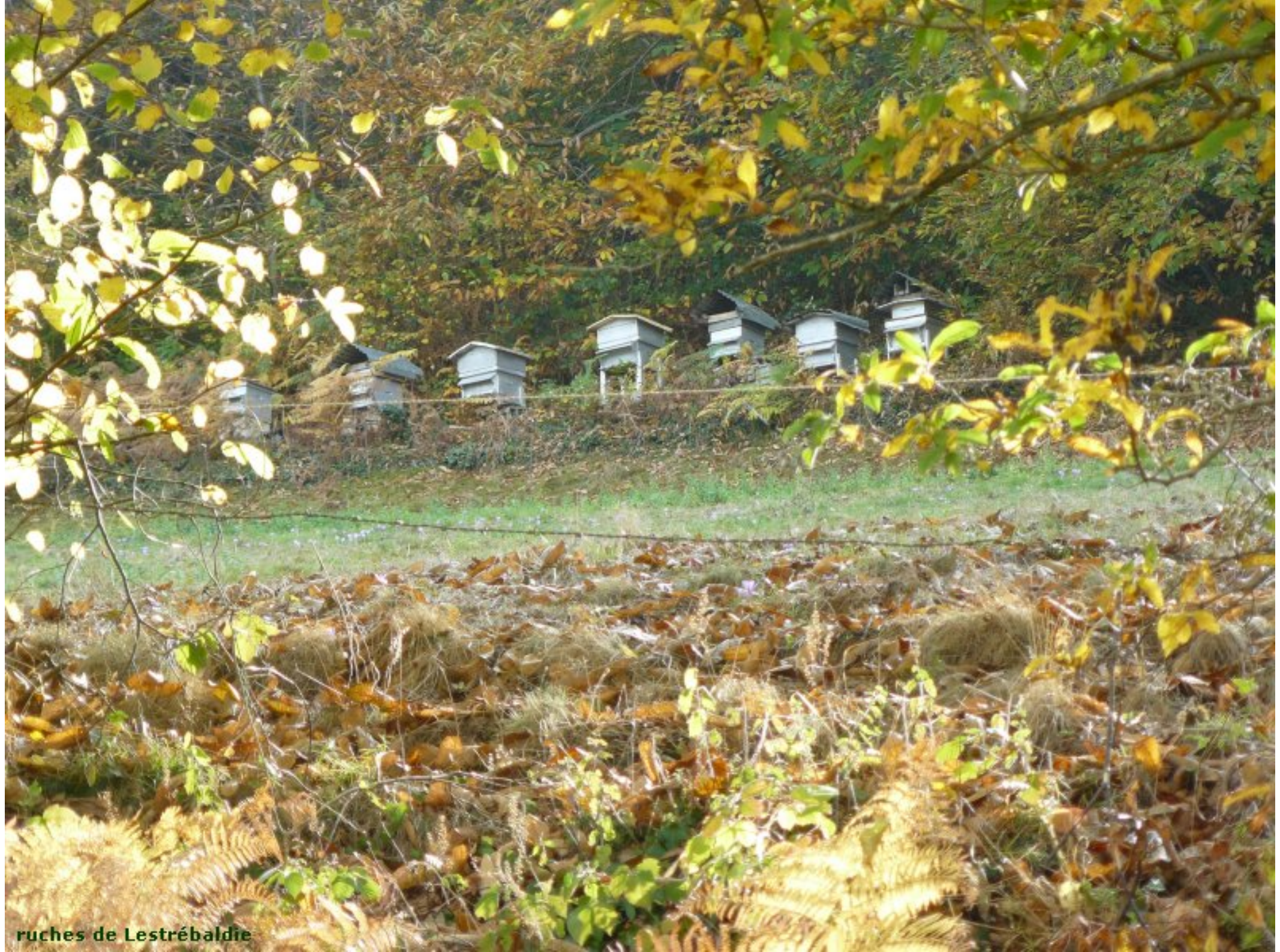
ruches de Lestrébaldie