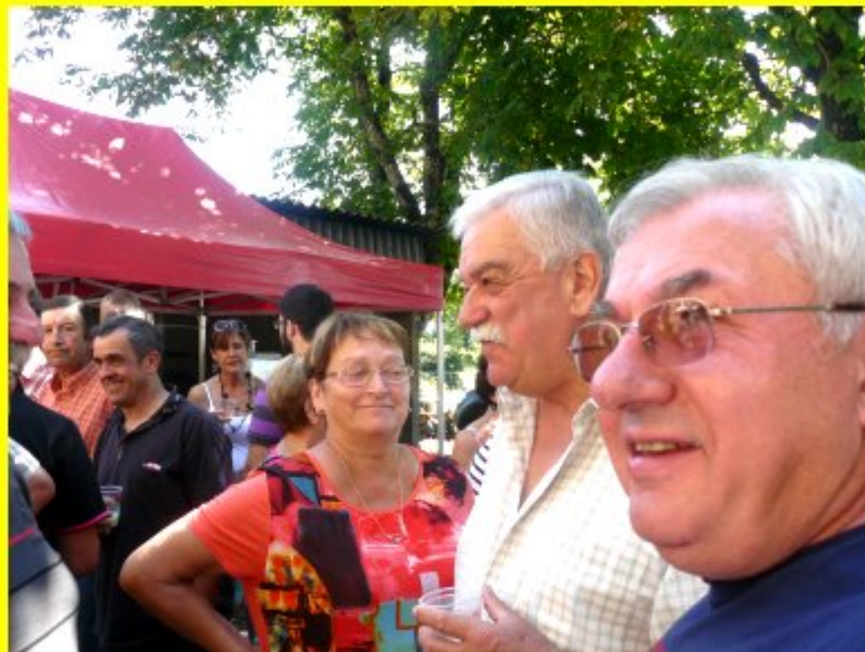
Repas des Amis organisé par le Comité des Fêtes à Meljac le dimanche 18 août 2013