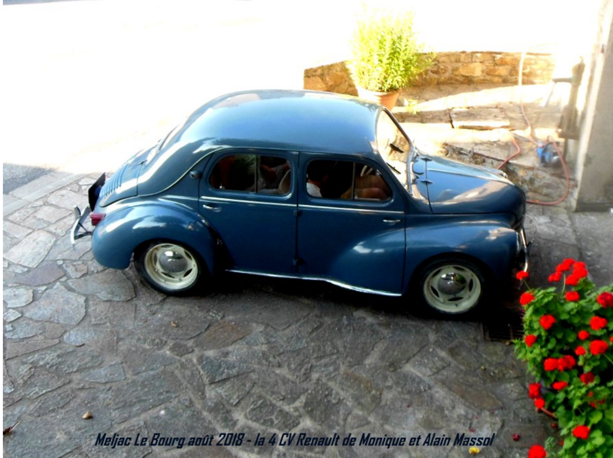
Meljac Le Bourg août 2018 - la 4 CV Renault de Monique et Alain Massol