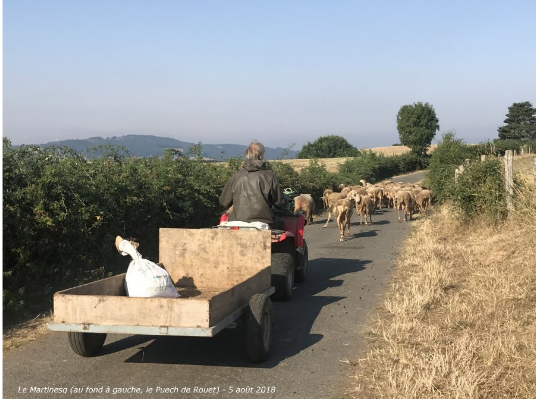
Le Martinesq (au fond à gauche, le Puech de Rouet) - 5 août 2018