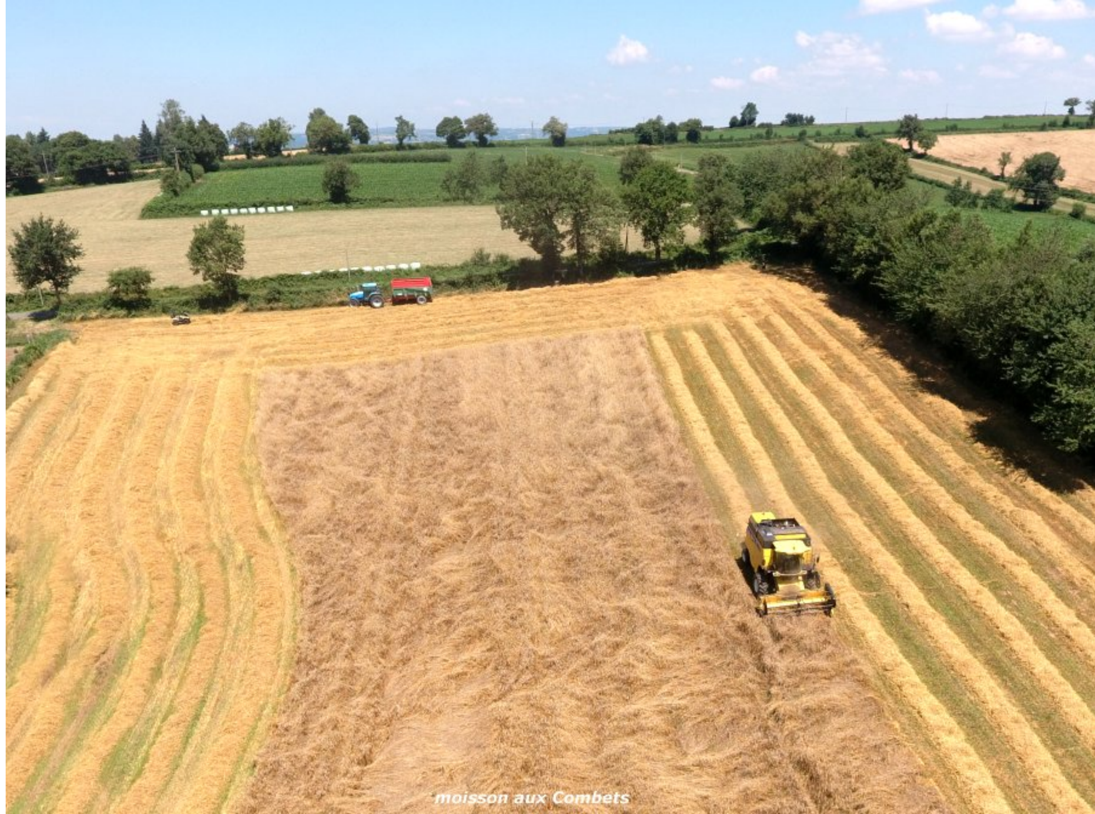
moisson aux Combets