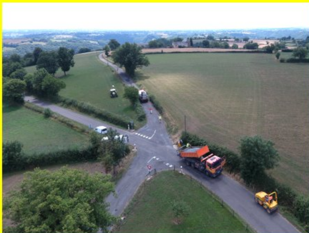
Réfection du chemin du Pouget - Grascazes juillet 2018