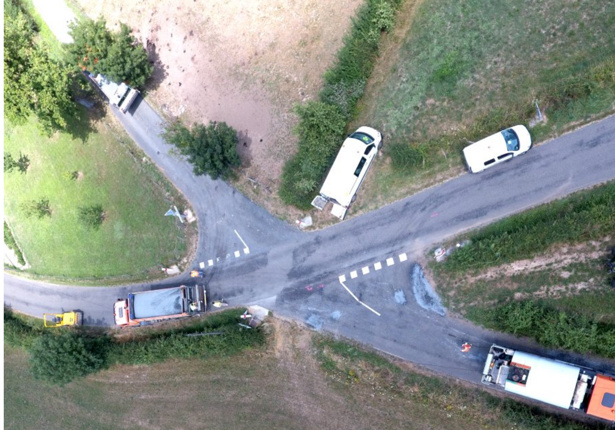
Réfection du chemin du Pouget - Grascazes juillet 2018