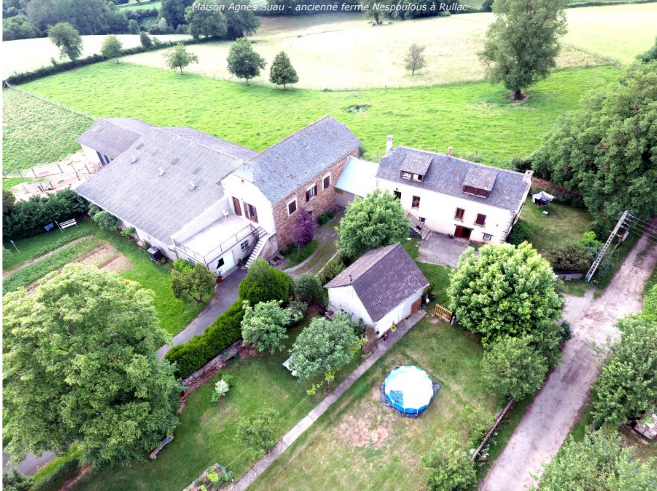
Maison Agnès Suau - ancienne ferme Nespoulous à Rullac