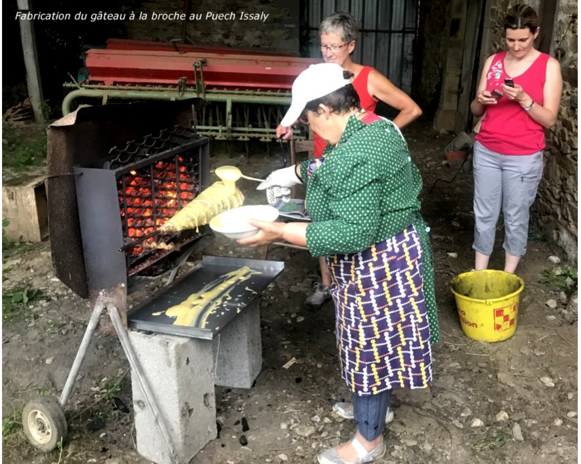
Fabrication du gâteau à la broche au Puech Issaly