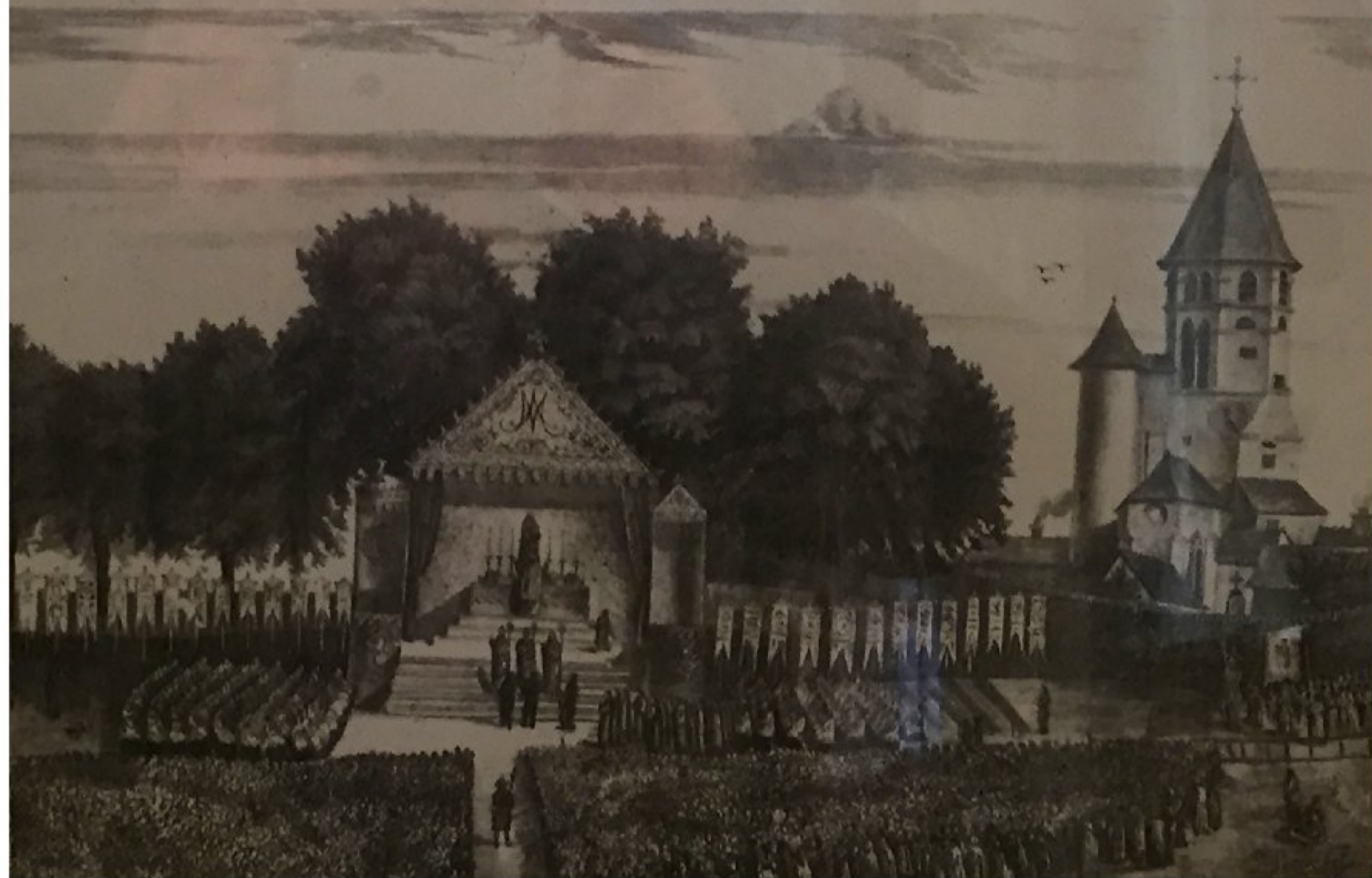
Basilique de Ceignac - gravure de 1873