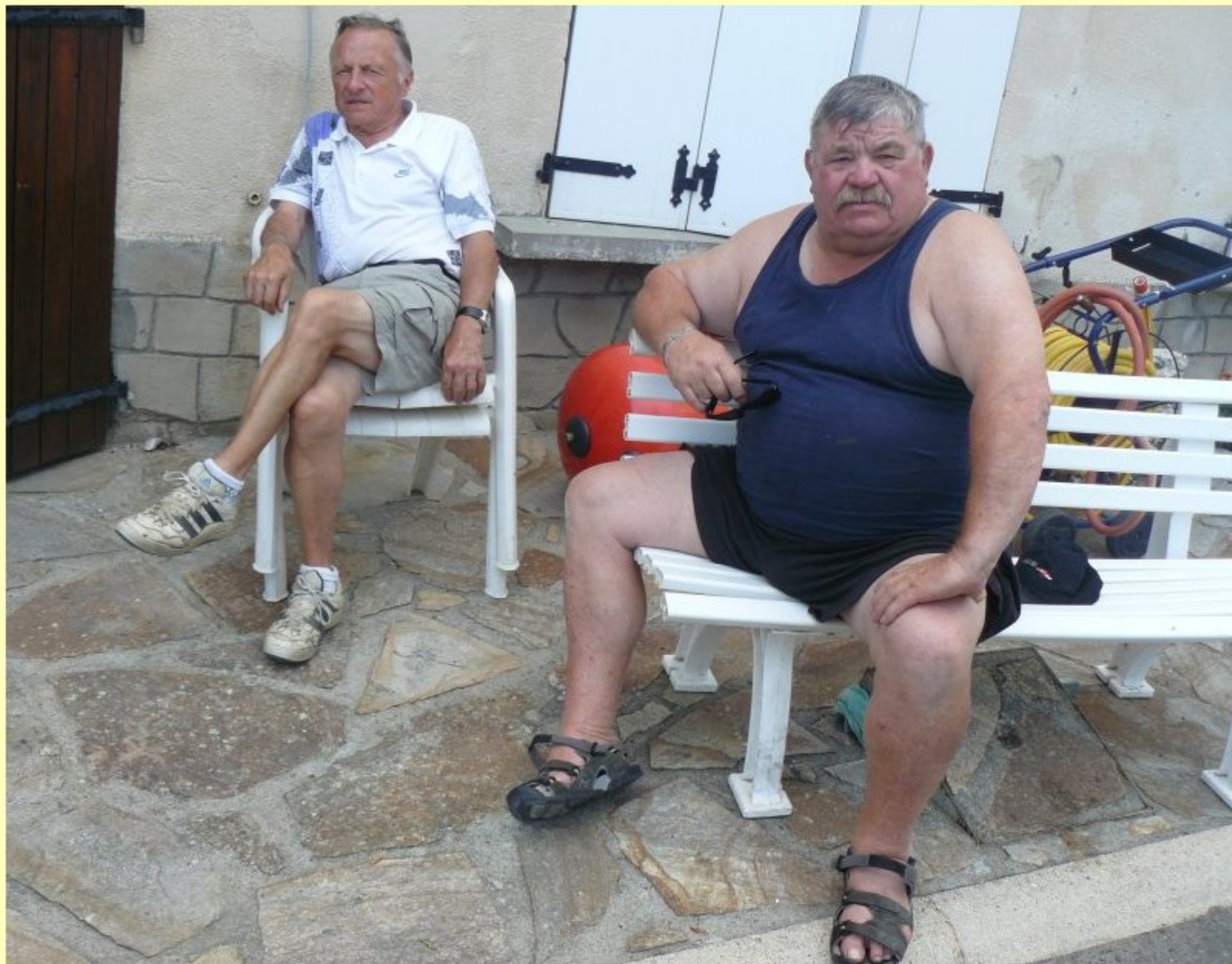
en pause...