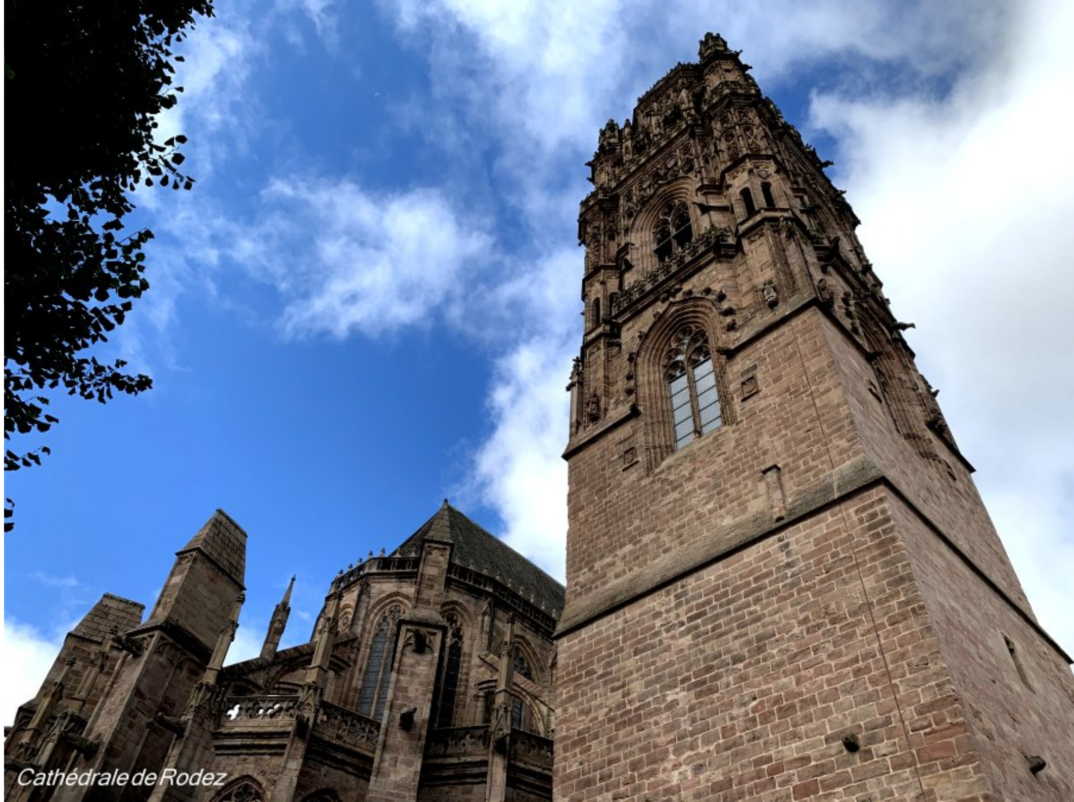
Cathédrale de Rodez