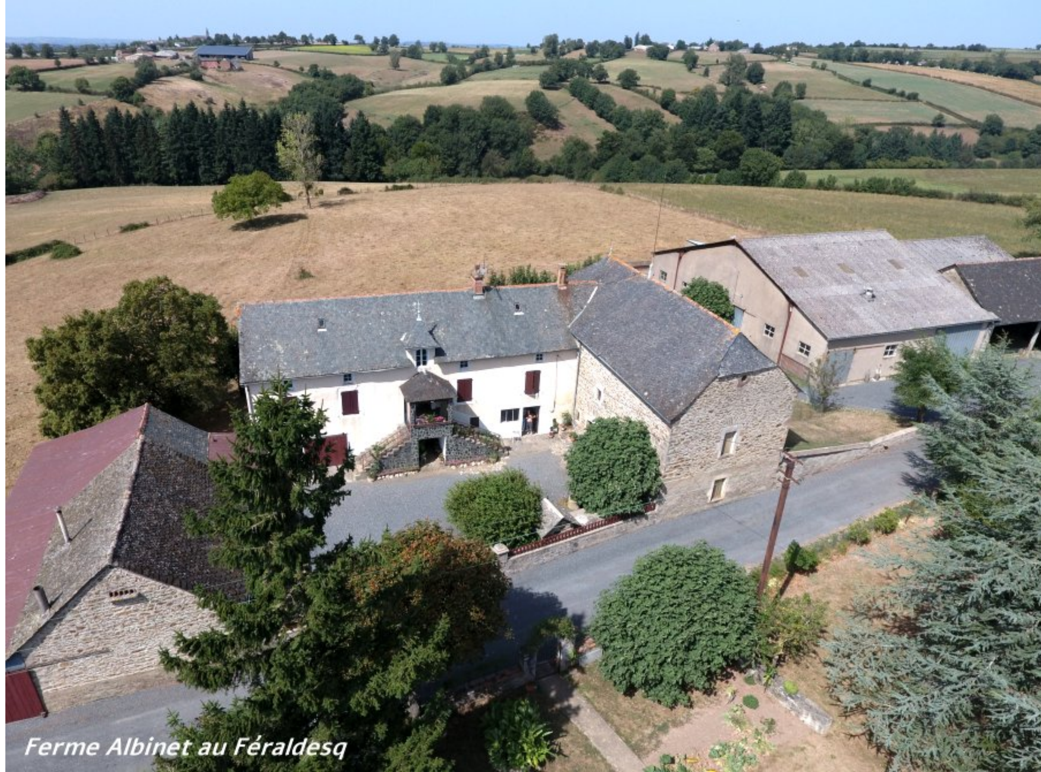
Ferme Albinet au Féraldesq