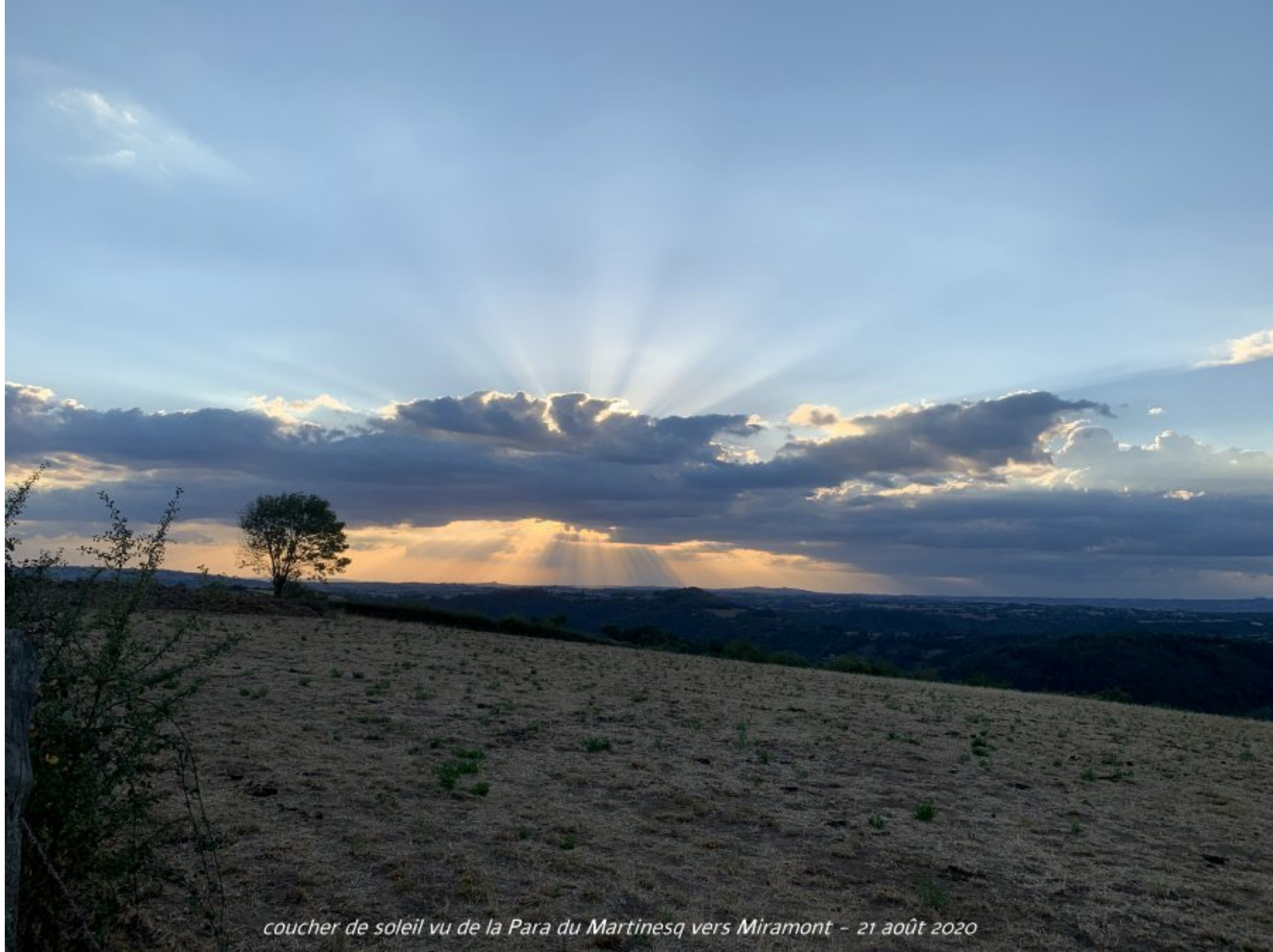
coucher de soleil vu de la Para du Martinesq vers Miramont - 21 août 2020