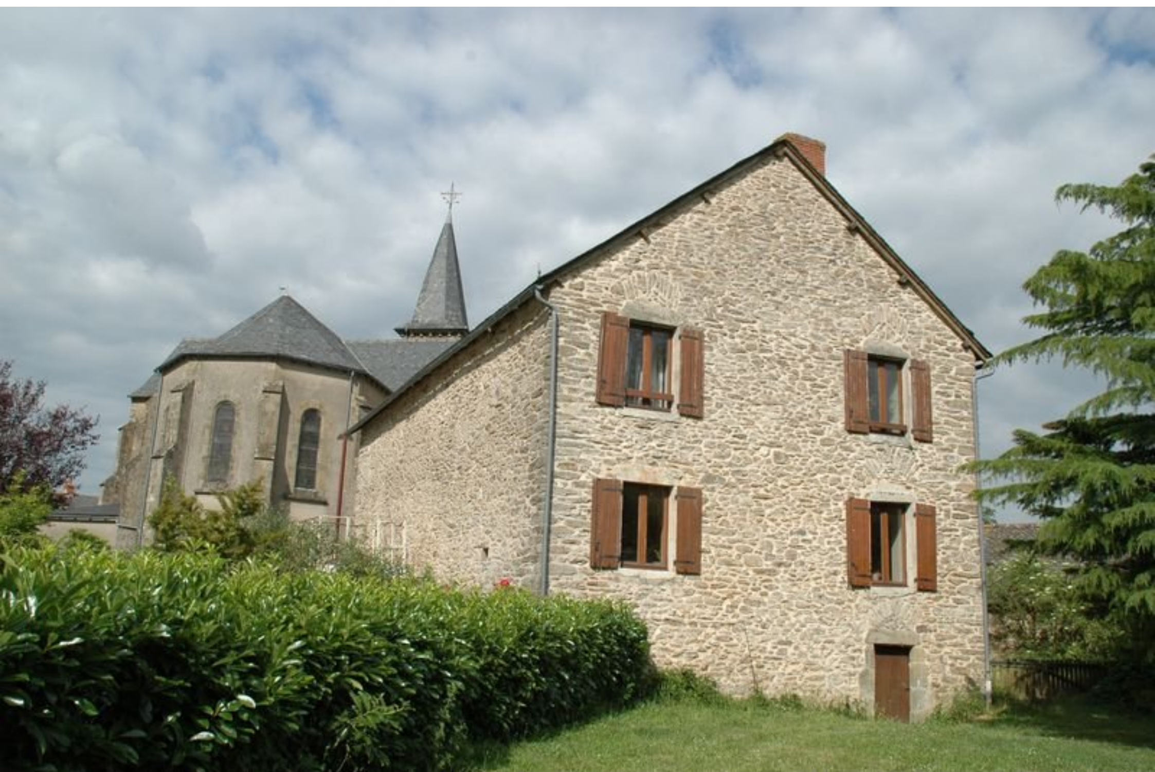
Meljac LeBourg - vue arrière sur l'église et l'ancien presbytère