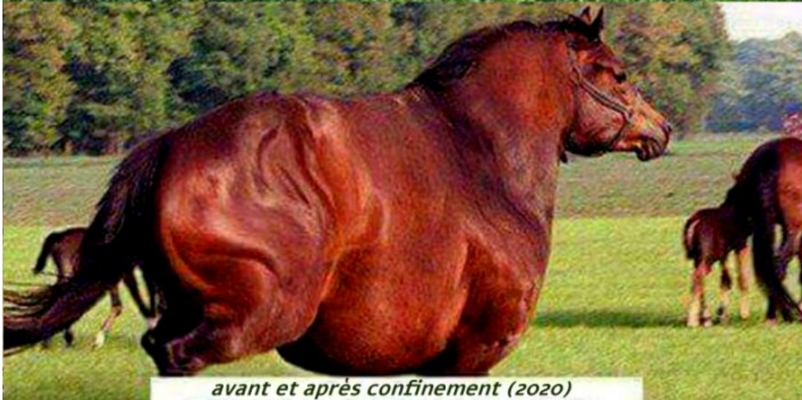
avant et après confinement (2020)