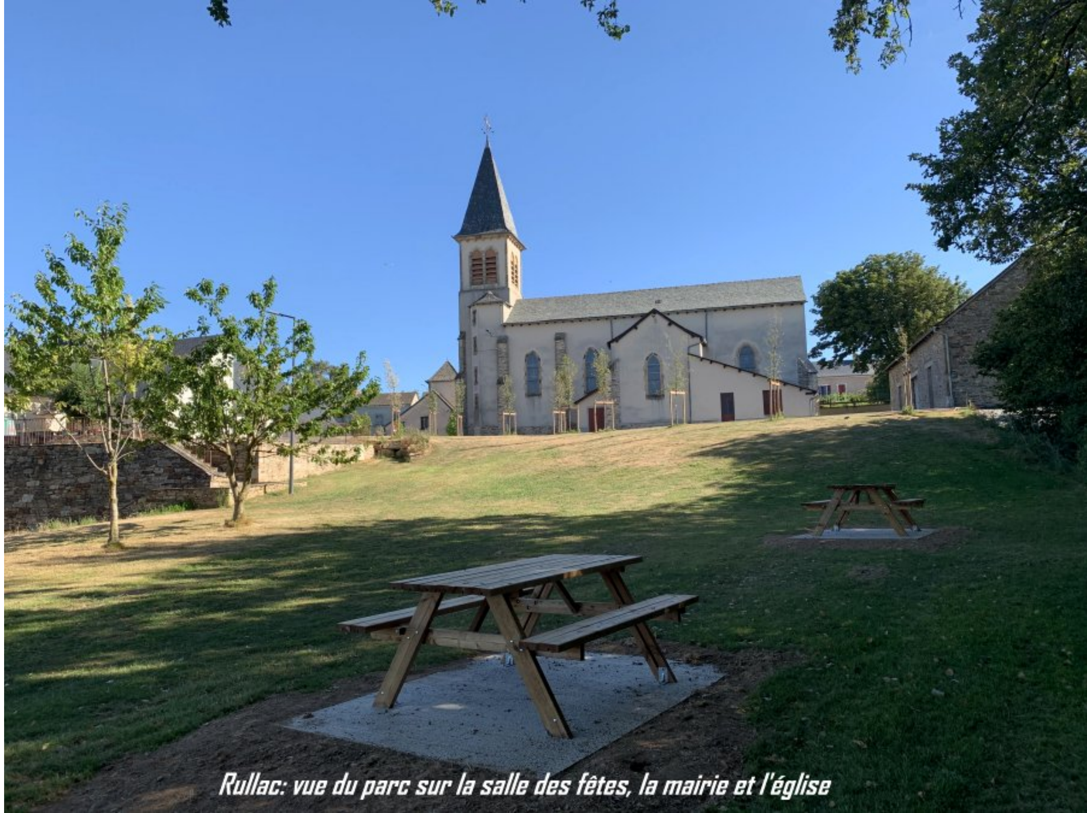
Rullac: vue du parc sur la salle des fêtes, la mairie et l'église