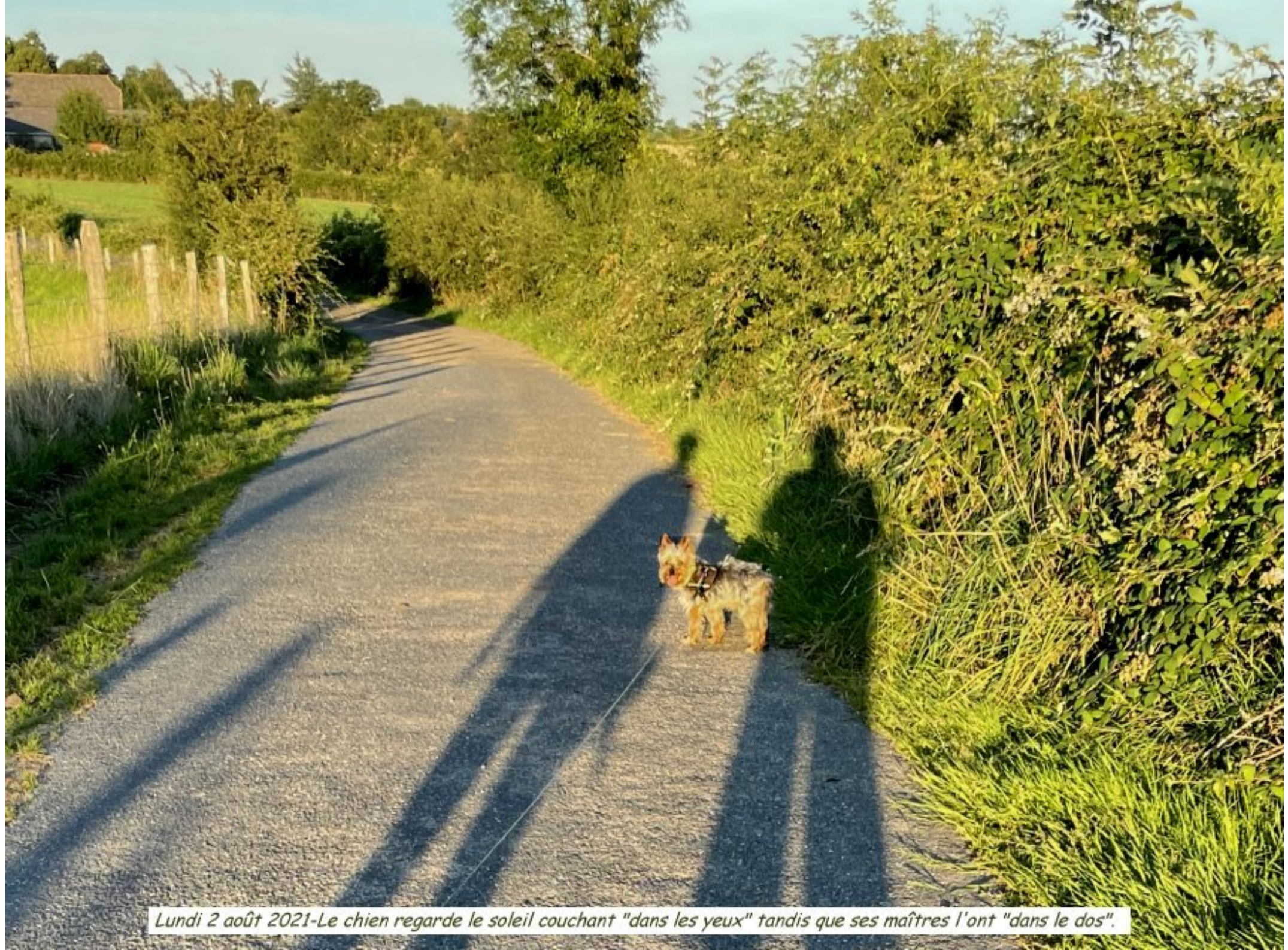
Lundi 2 août 2021-Le chien regarde le soleil couchant "dans les yeux" tandis que ses maîtres l'ont "dans le dos".