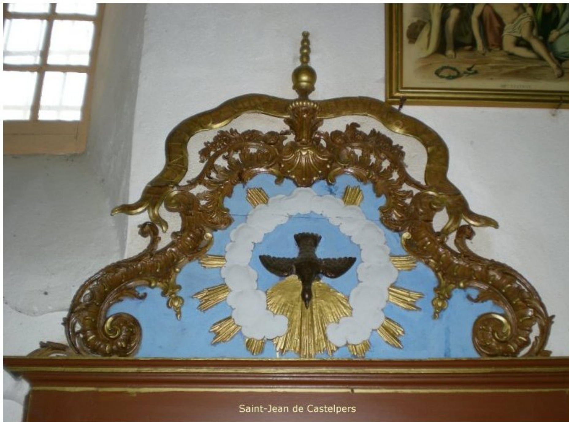
Saint-Jean de Castelpers

Dimanche 15 août 2021, Fête de l'Assomption