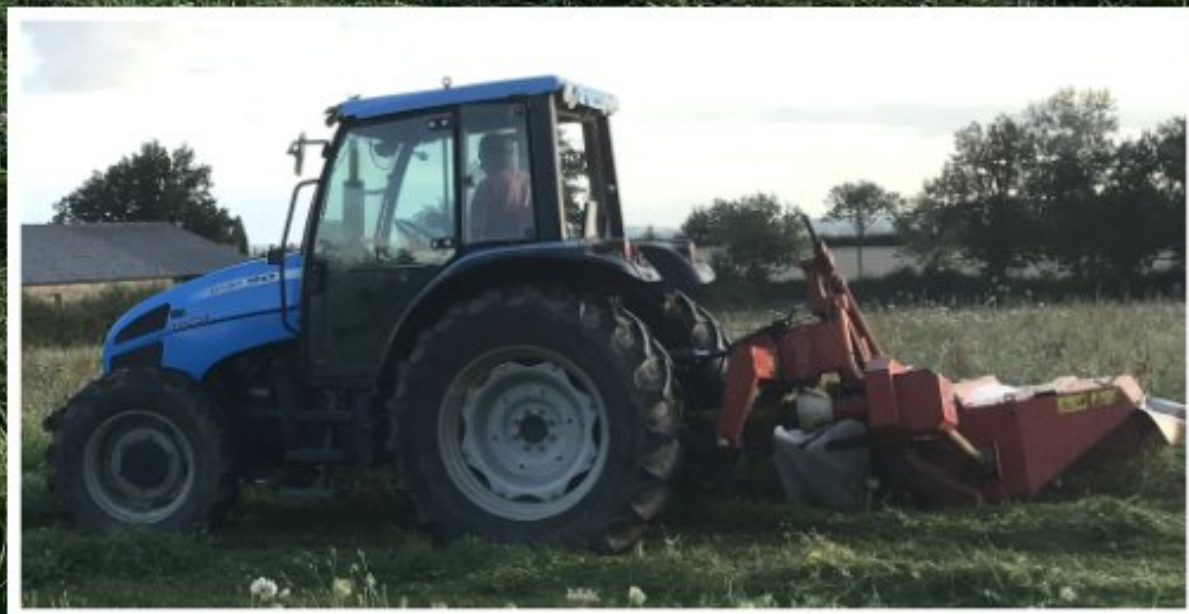
Seconde coupe à Grascazes - août 2021