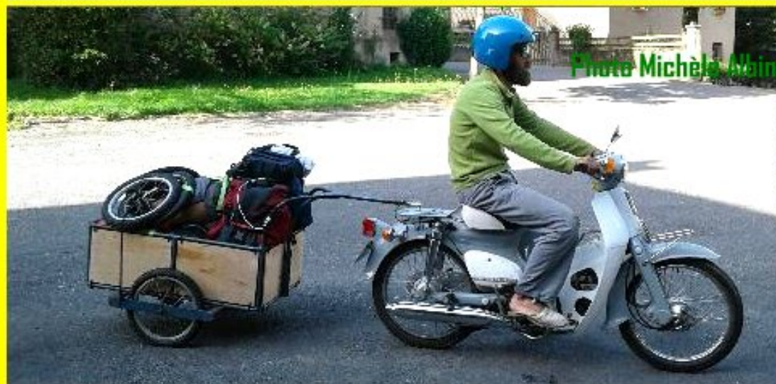
12 août 2021