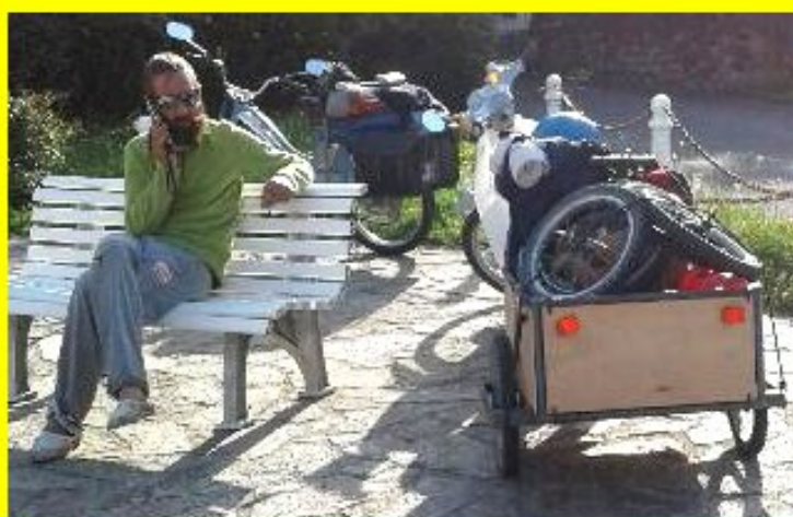
Des touristes en motocyclette font le tour de l'Aveyron en passant par Meljac... Pause à "la Pierre"