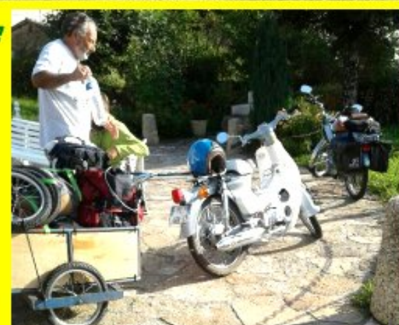
12 août 2021