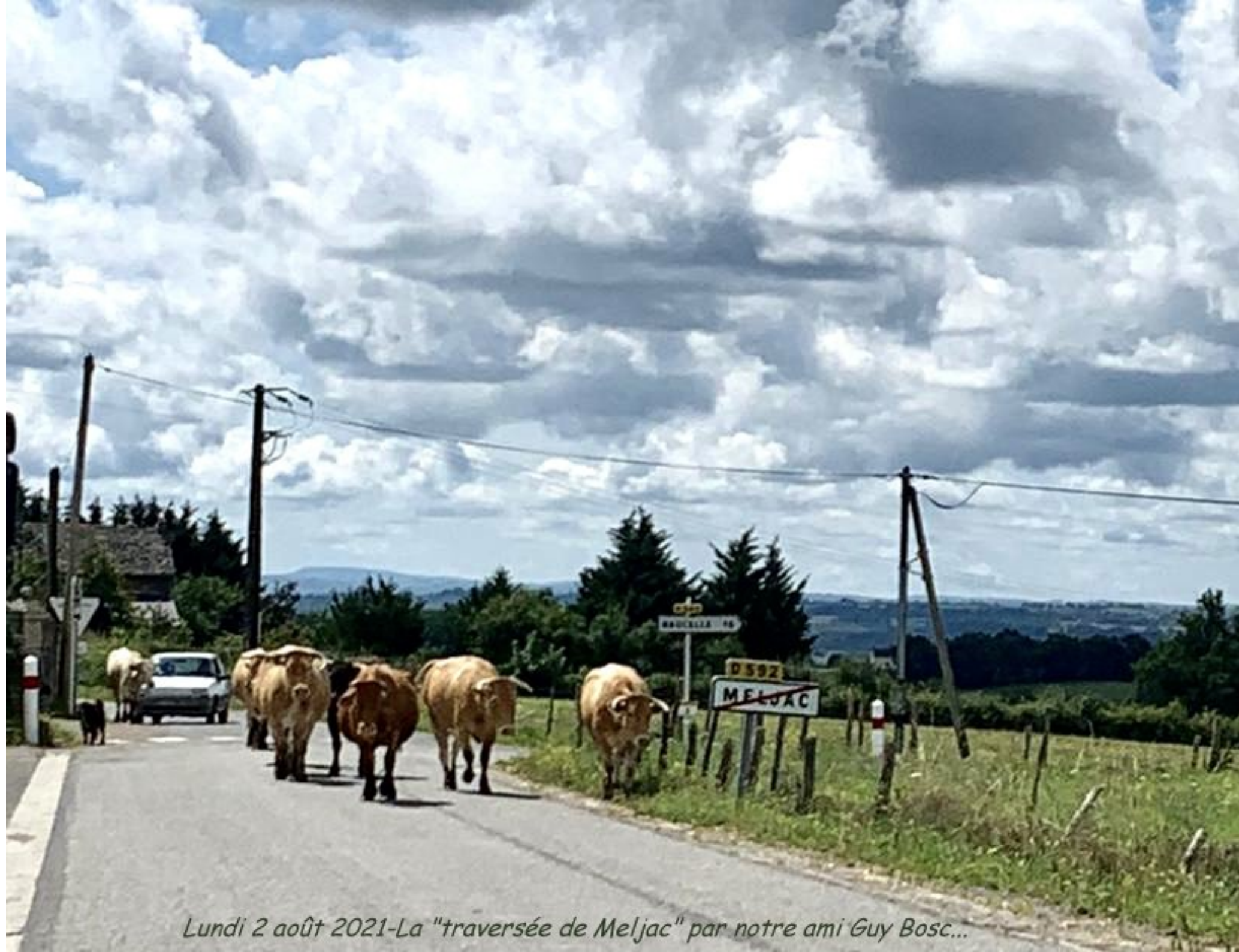
Lundi 2 août 2021-La "traversée de Meljac" par notre ami Guy Bosc...