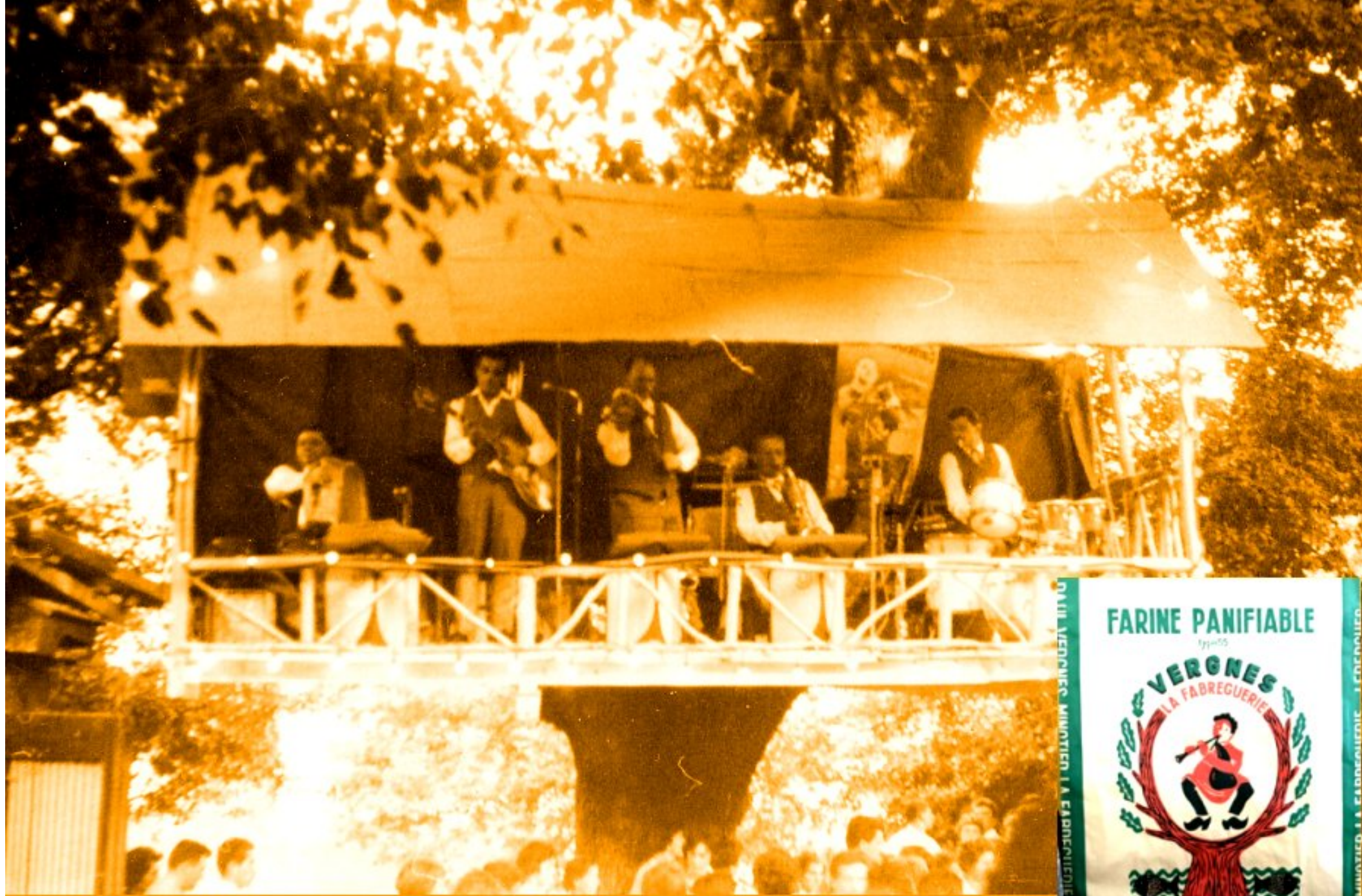
L'orchestre dans l'arbre, à la belle époque des fêtes de fin août à la Fabrèguerie. En vignette, à droite, photo d'un sac d'emballage de "farine planifiable", utilisé par le minotier Paul Vergnes, illustrant, à sa manière "l'orchestre dans l'arbre".