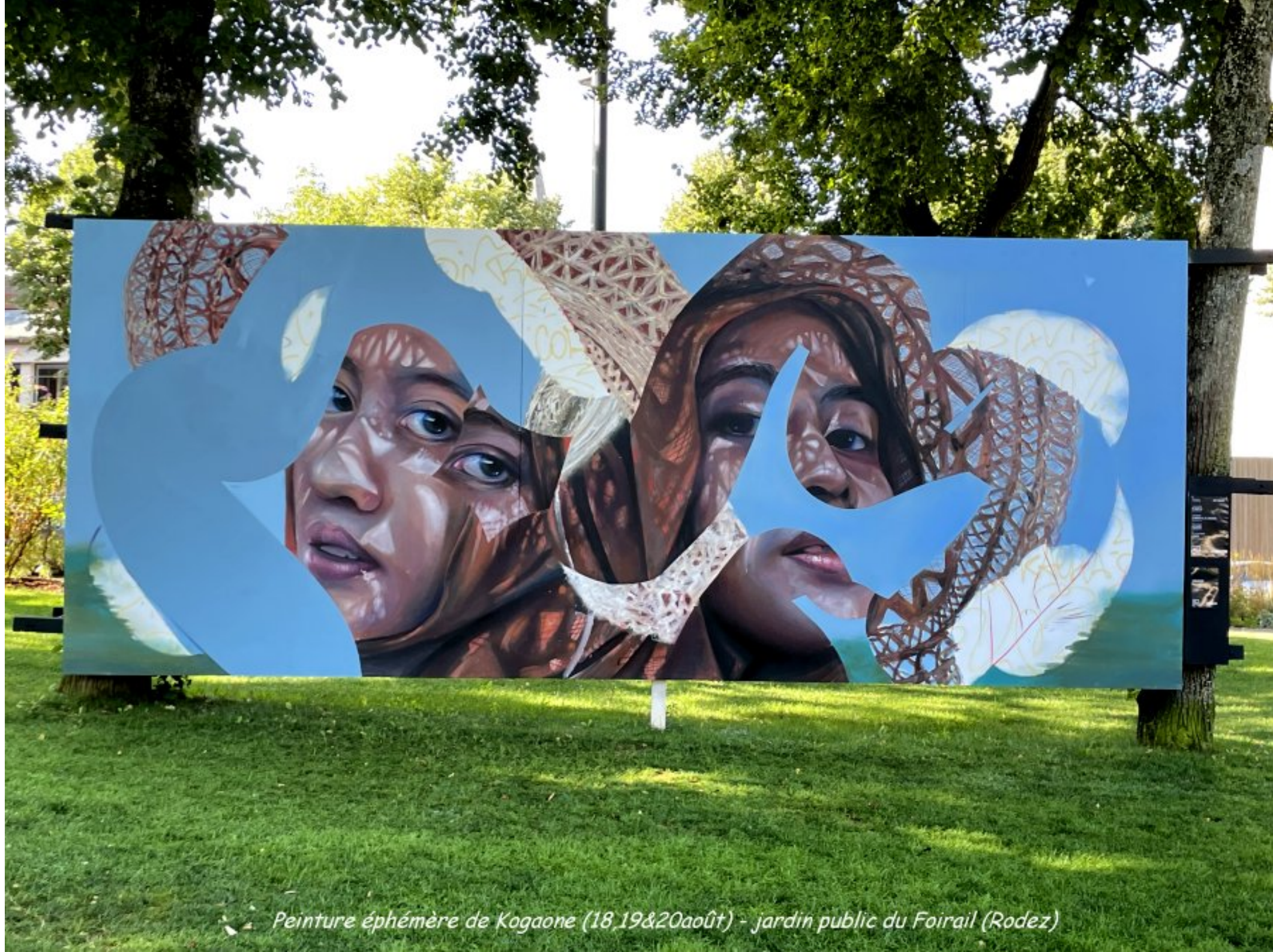
Peinture éphémère de Kogaone (18,19&20août) - jardin public du Foirail (Rodez)