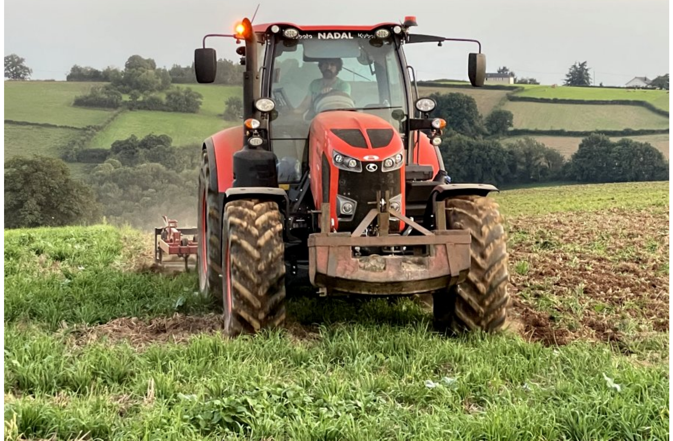
août 2021 - sarclage vespéral au Martinesq de Meljac (vue sur l'ancienne école de La Treillie)