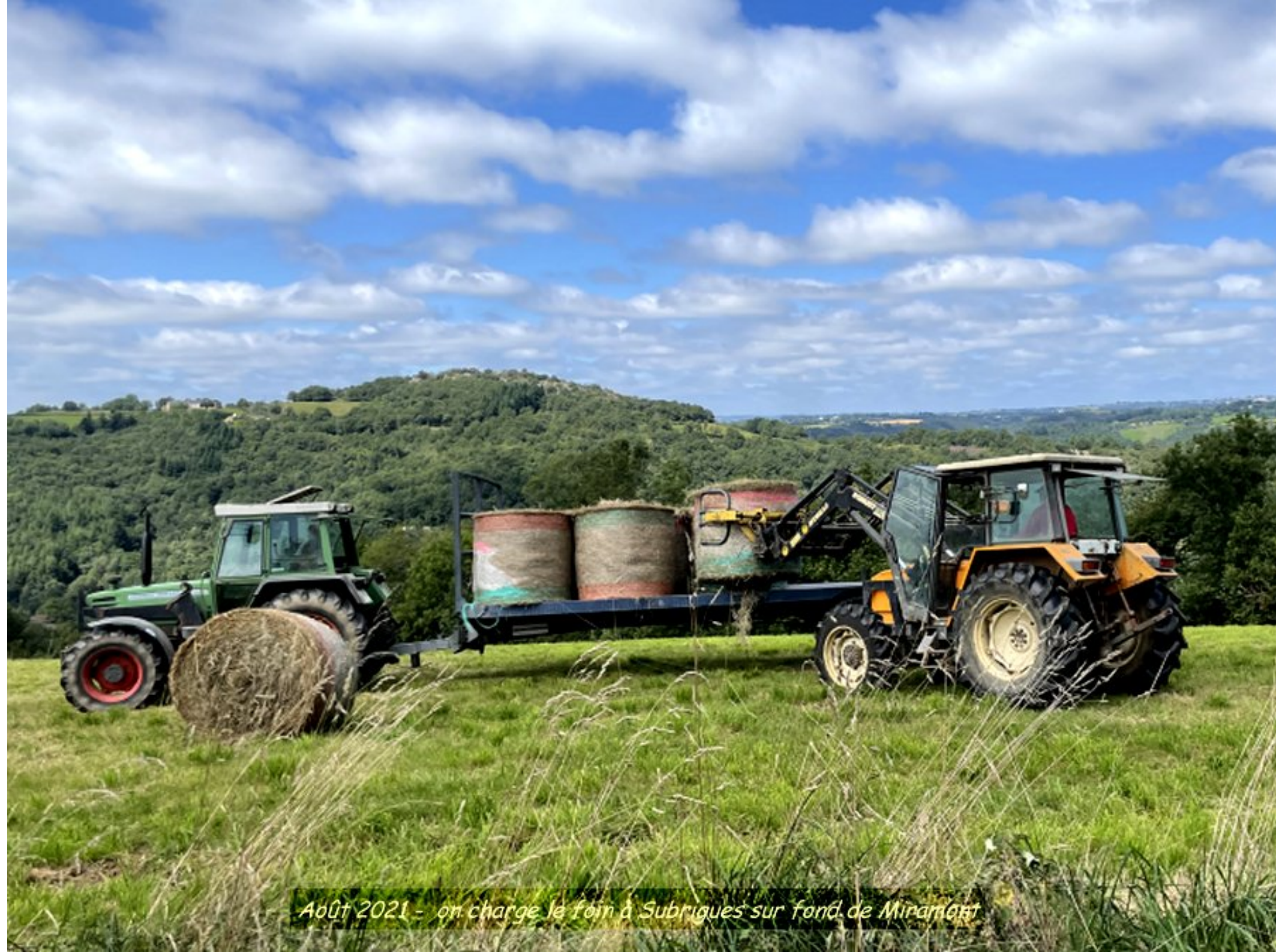
AOÛT 2021 - on charge le foin à Subrigues sur fond de Miramont