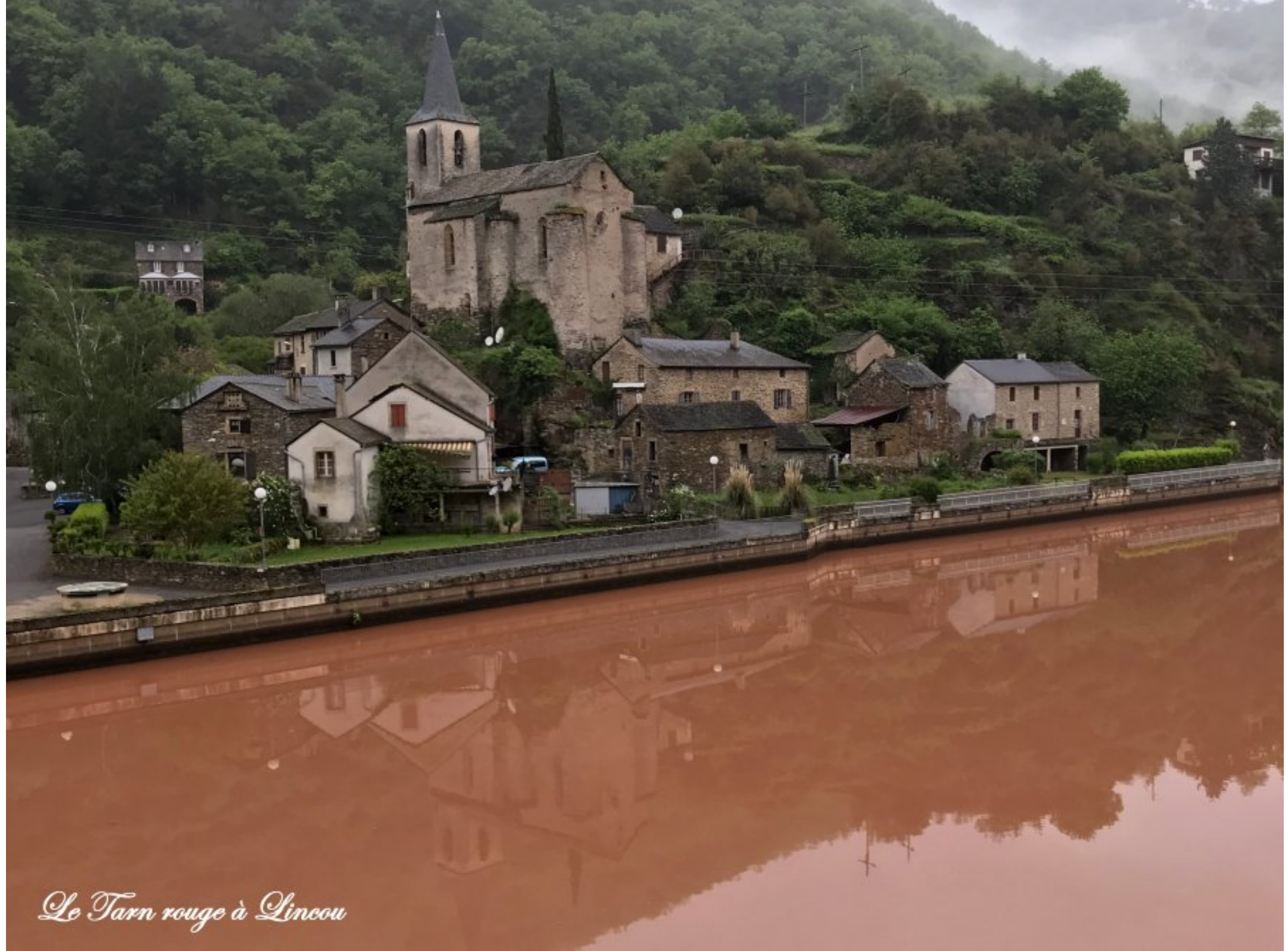
Le Tarn rouge à Lincou