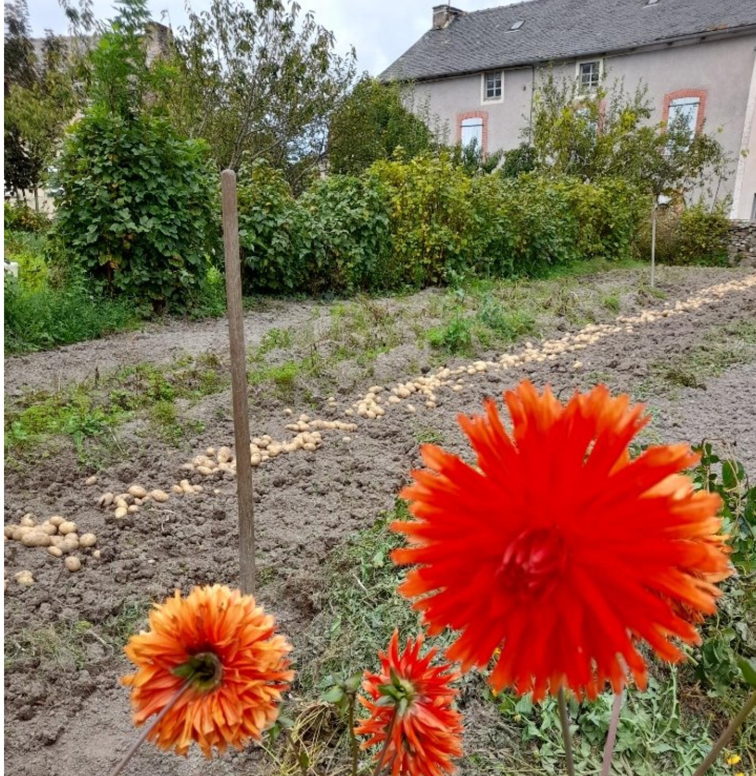
17 août 2021 - Récolte des pommes de terre de Roger Massol - les fleurs aussi sont belles