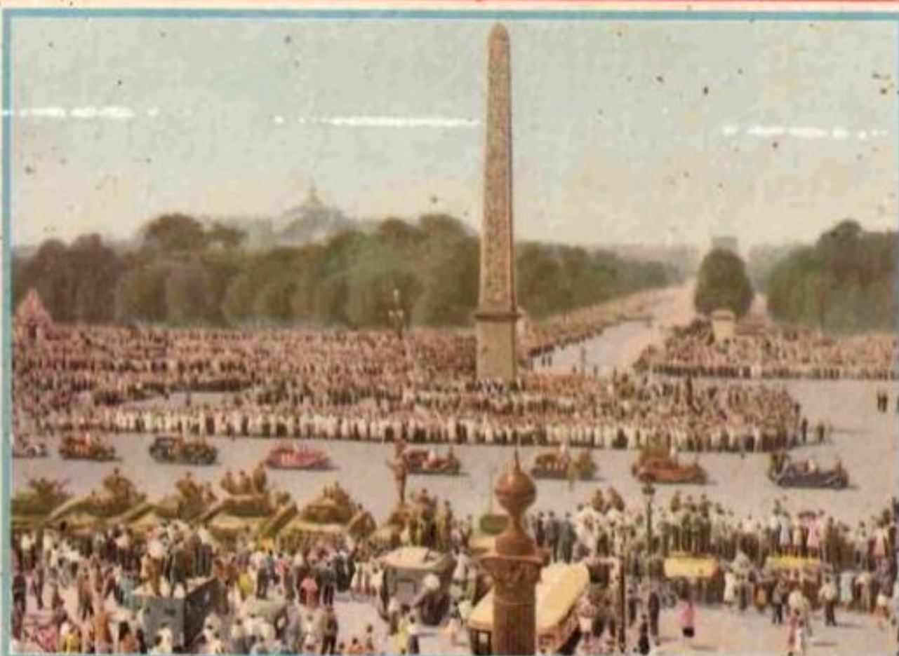
LE GÉNÉRAL DE GAULLE SE RENDANT À L'ARC-DE-TRIOMPHE

SAISONS ~ AUTOMNE 23 SEPTEMBRE HIVER 22 DÉCEMBRE ~