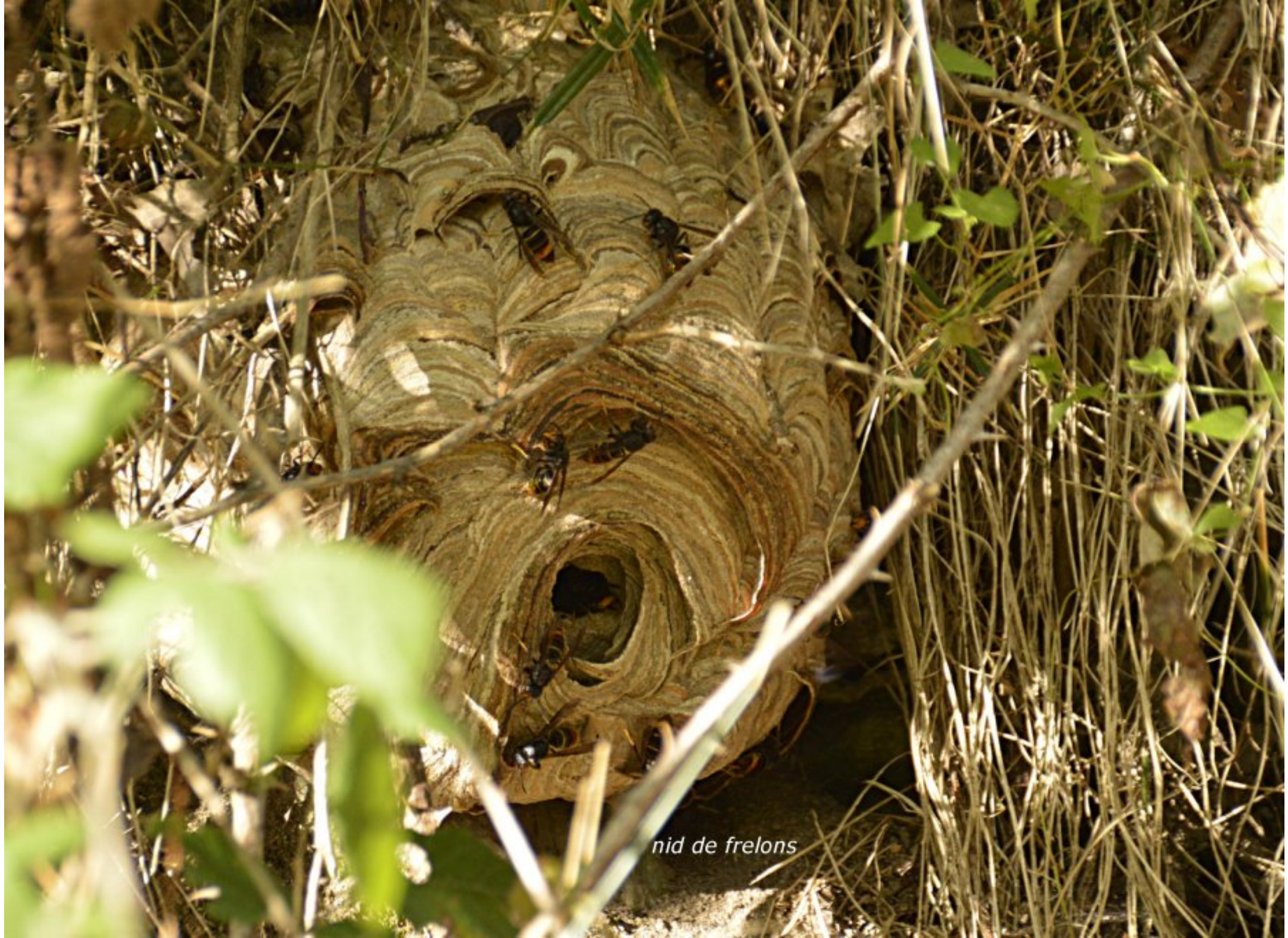
nid de frelons