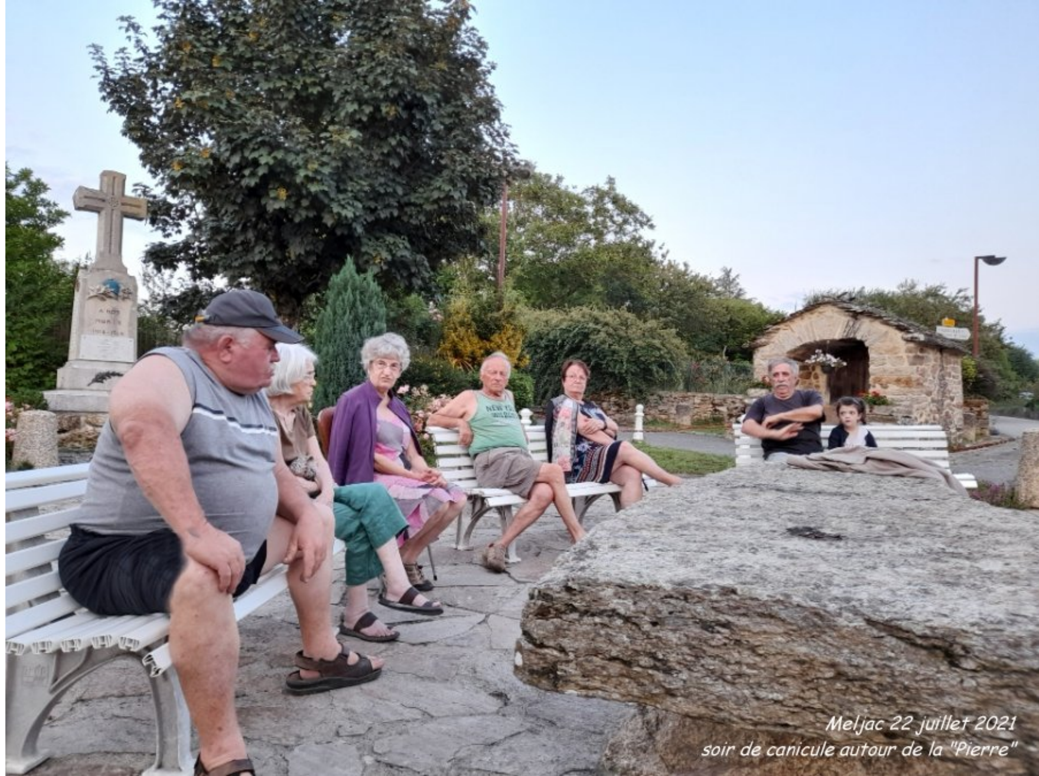
Meljac 22 juillet 2021 soir de canicule autour de la "Pierre"