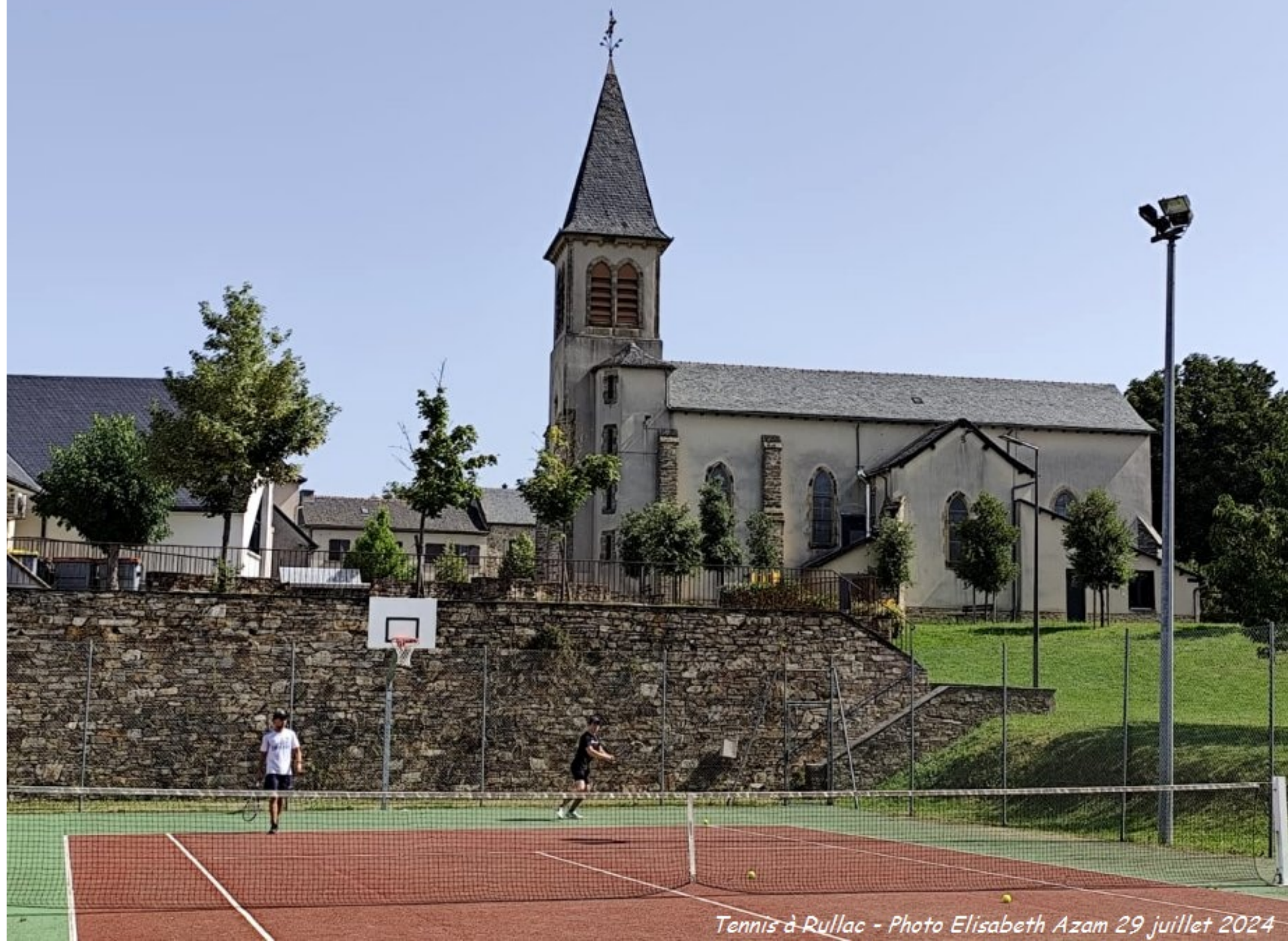
Tennis à Rullac 29 juillet 2024