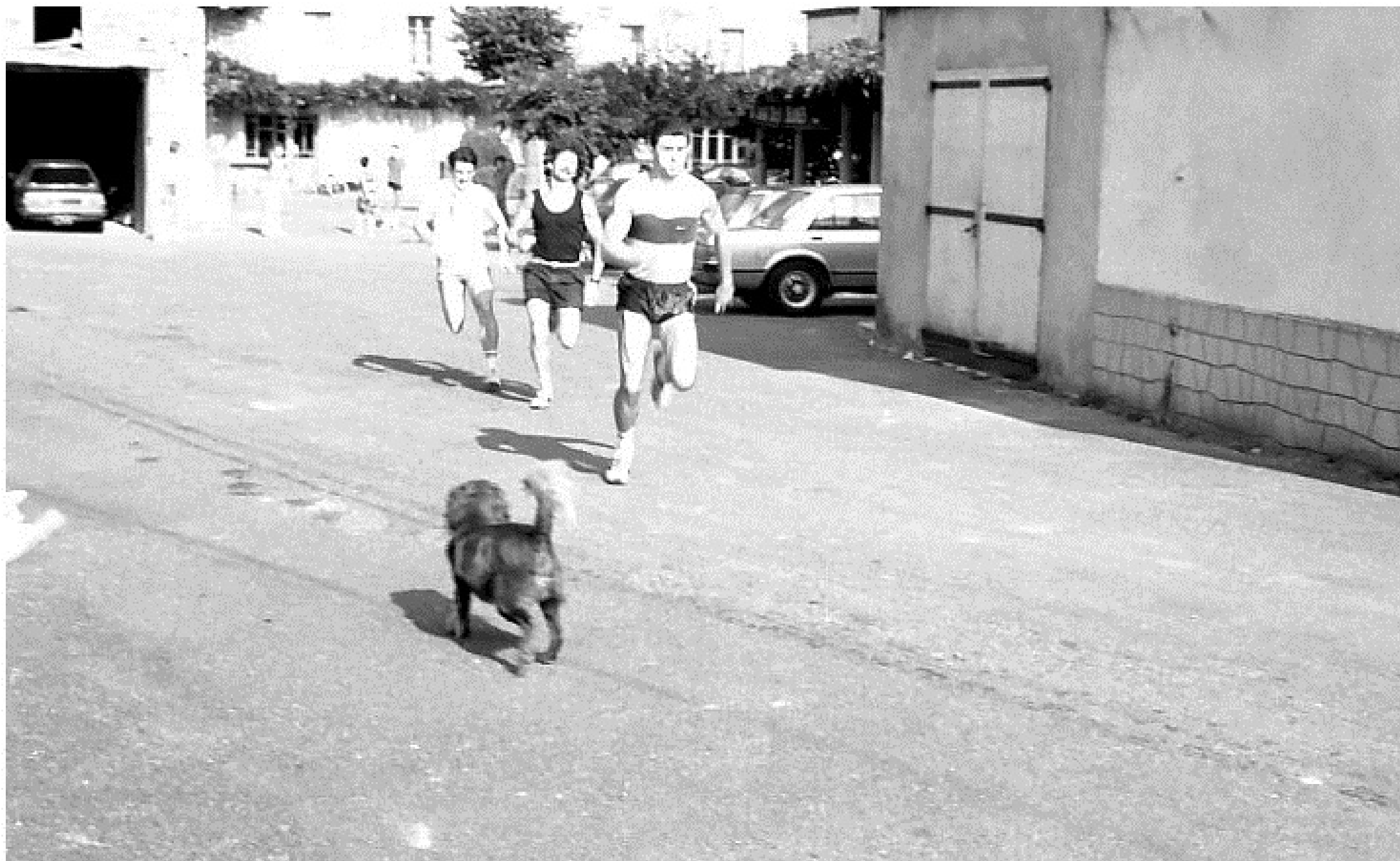
MELJAC - Olympiades 1984