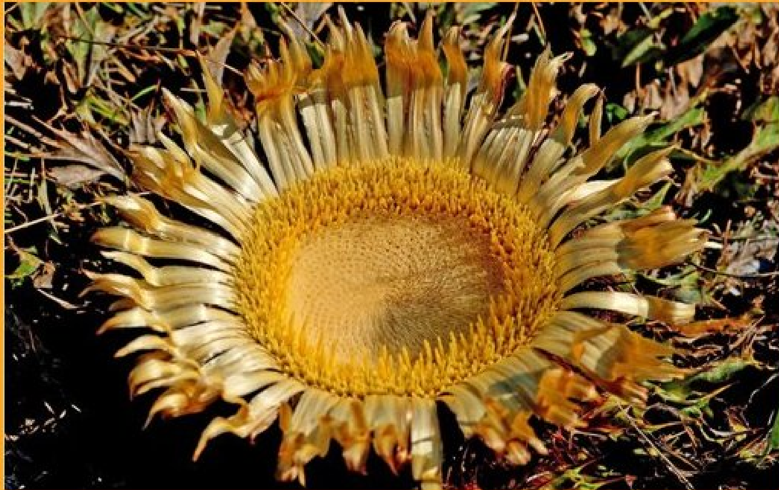
Cardabelle, fleur du Causse du Larzac