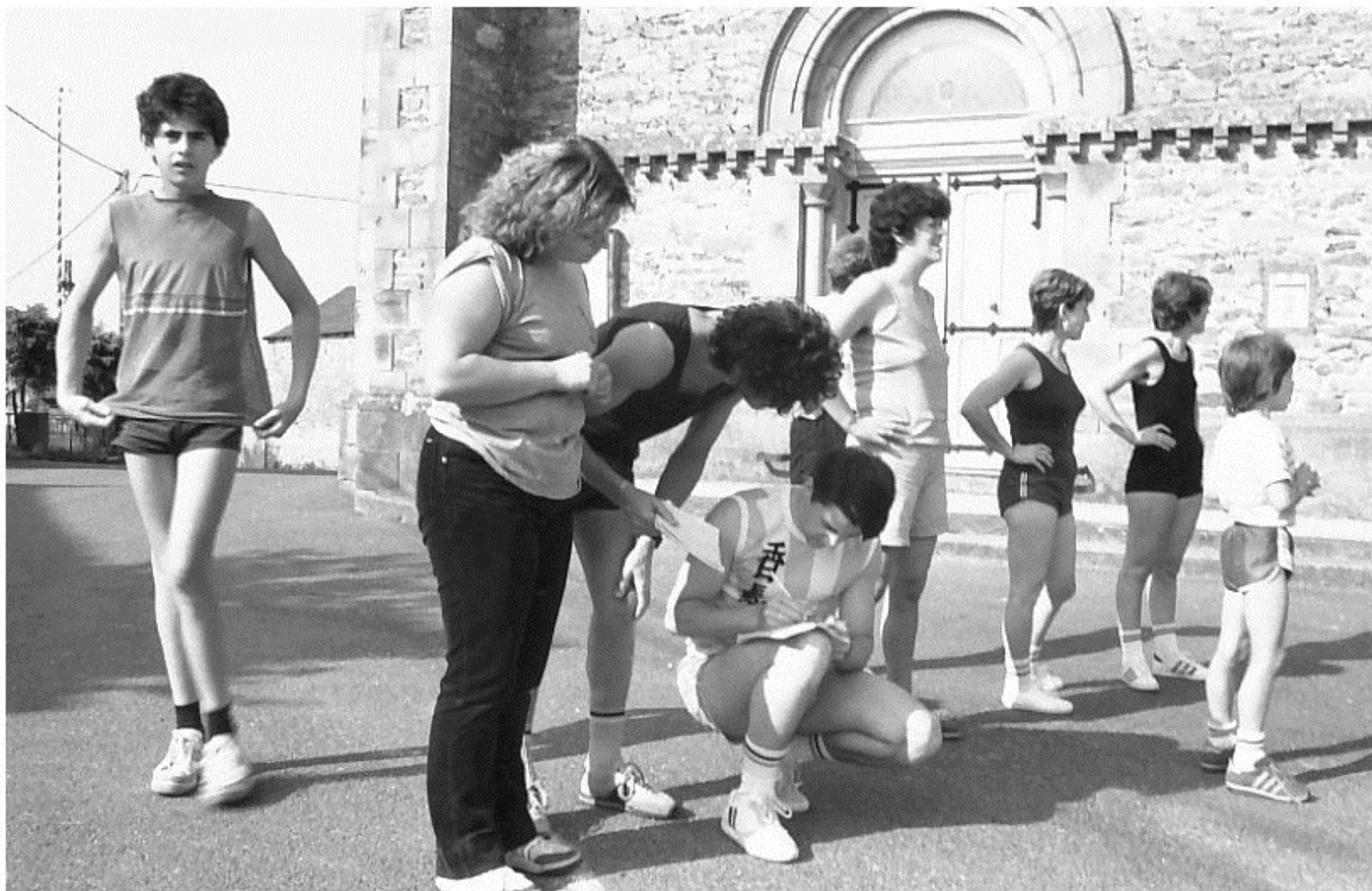
MELJAC - Olympiades 1984