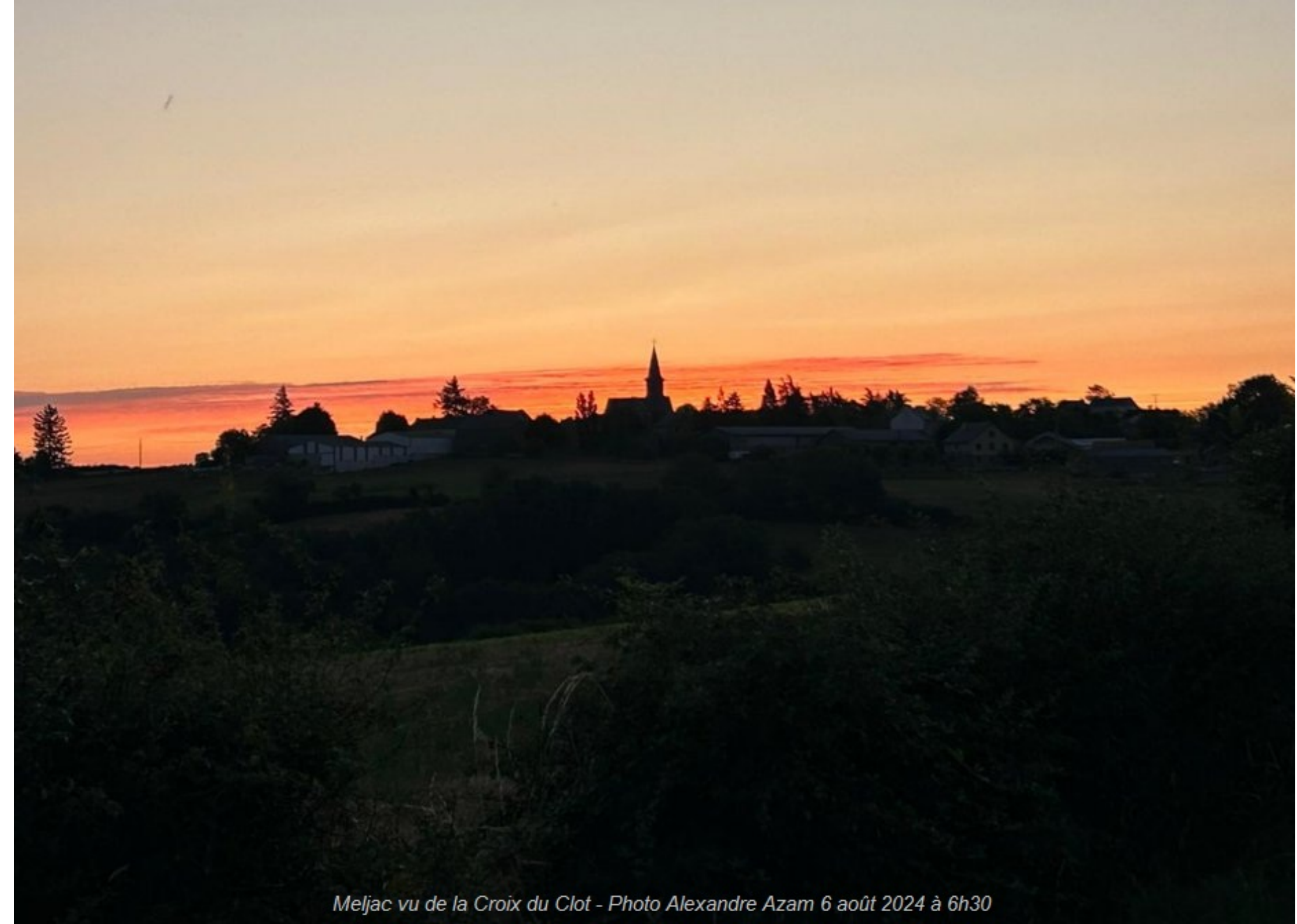
Meljac vu de la Croix du Clot 6 août 2024 à 6h30