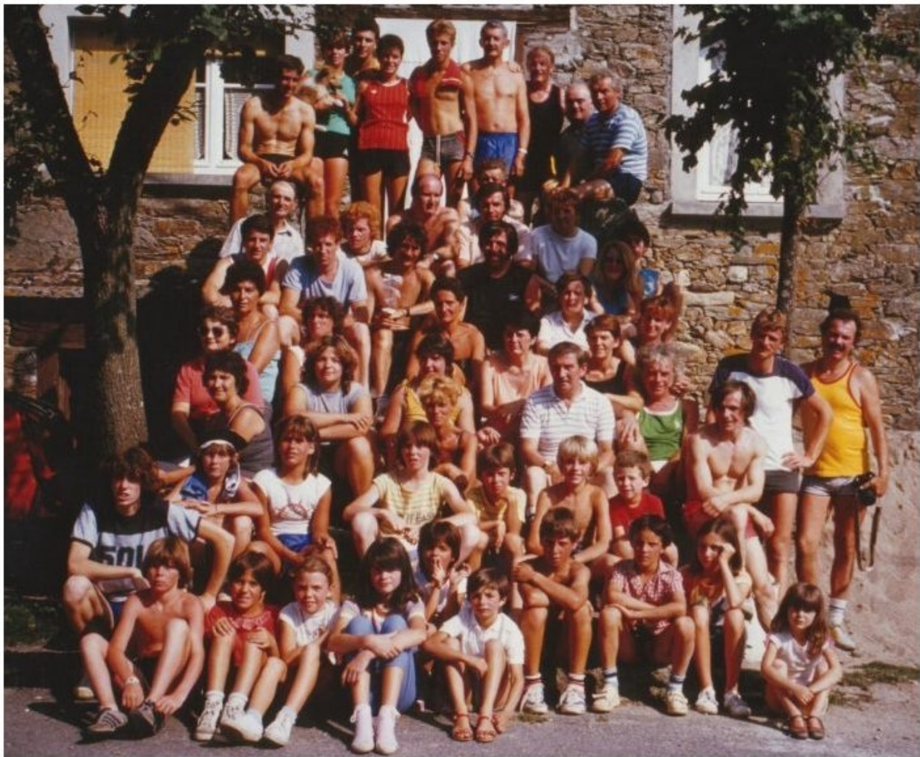
MELJAC - Olympiades 1984