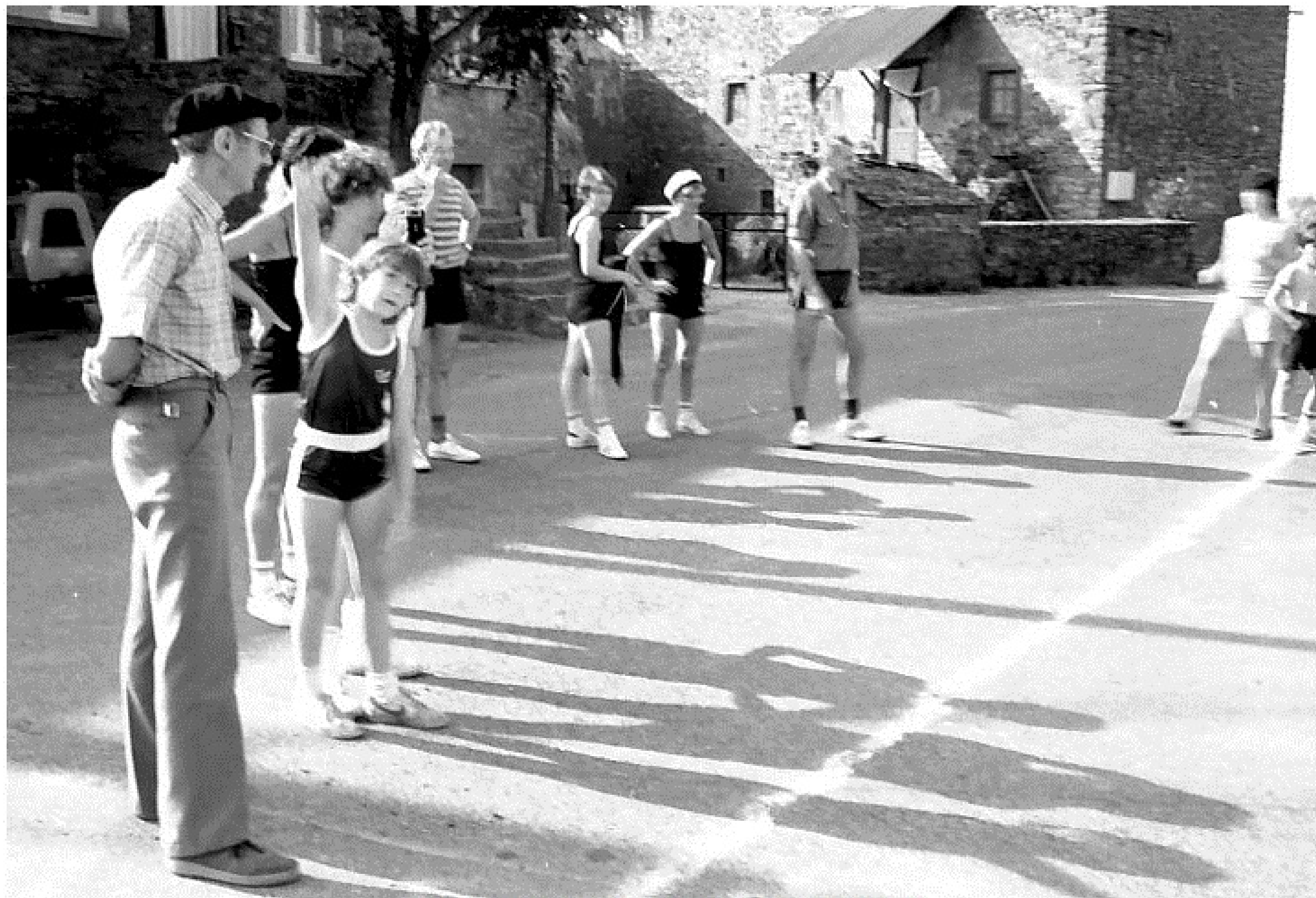
MELJAC - Olympiades 1984