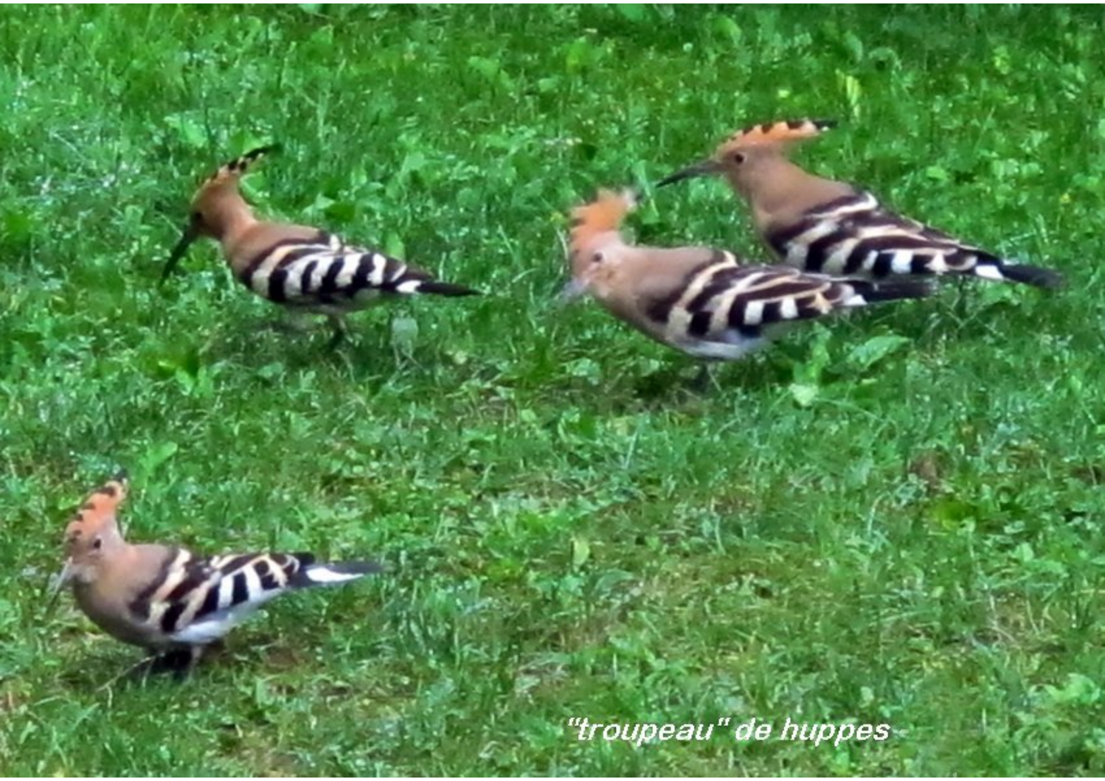
"troupeau" de huppes