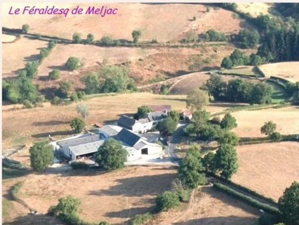
Le Féraldesq de Meljac