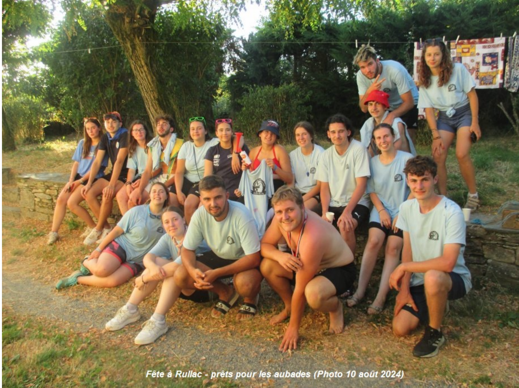
Fête à Rullac - prêts pour les aubades (Photo 10 août 2024)