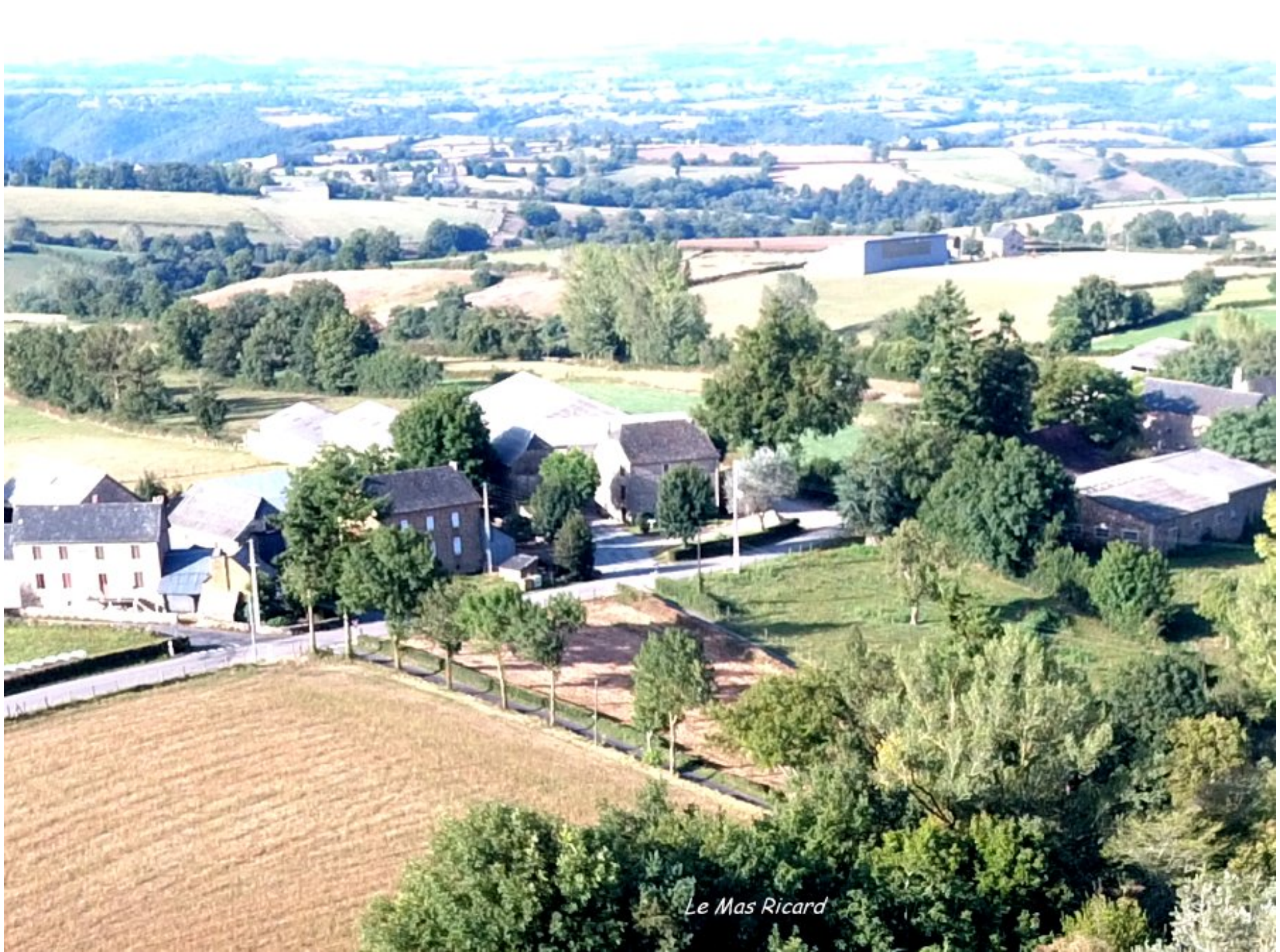
Le Mas Ricard