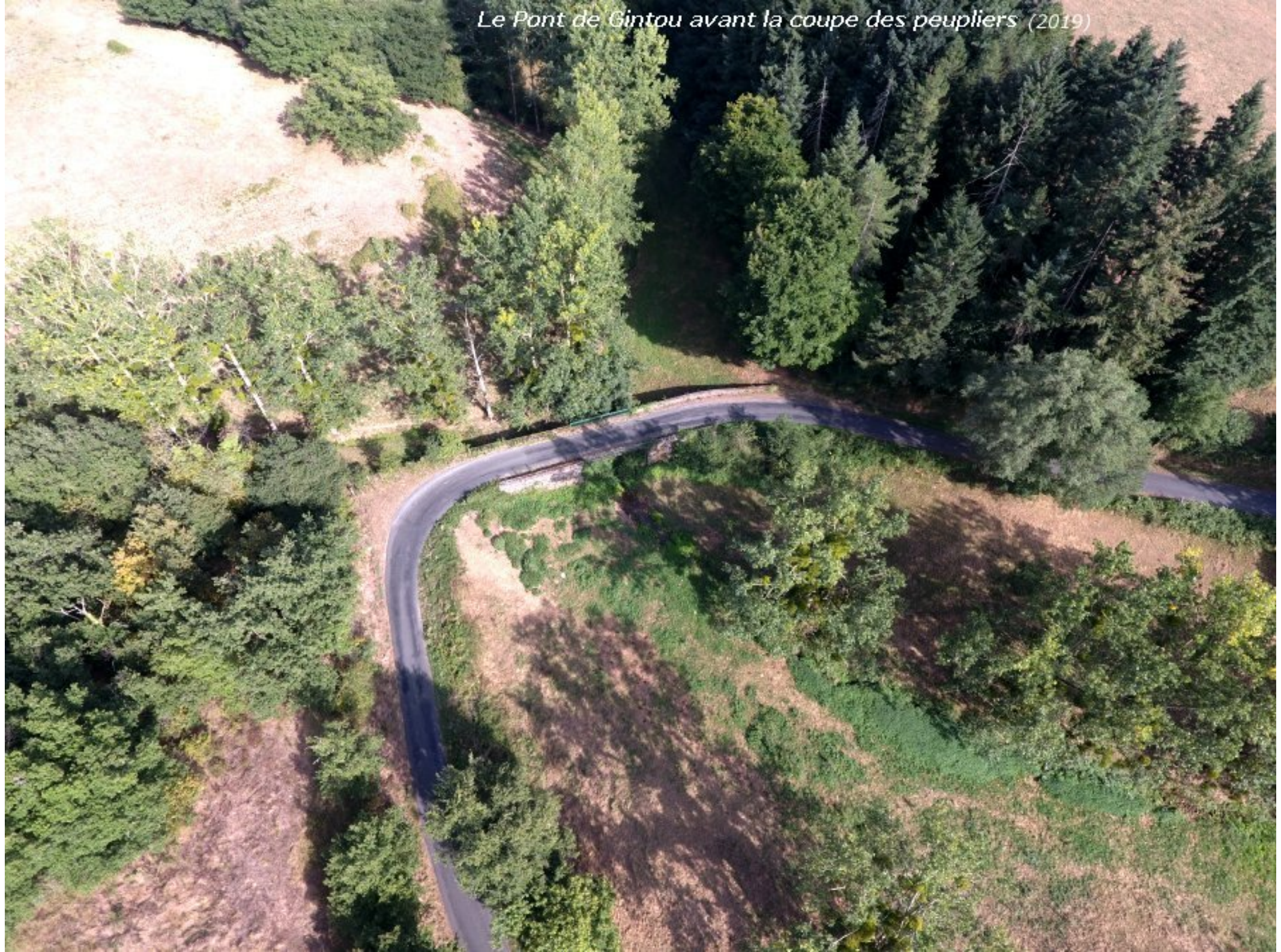
Le Pont de Gintou avant la coupe des peupliers (2019)