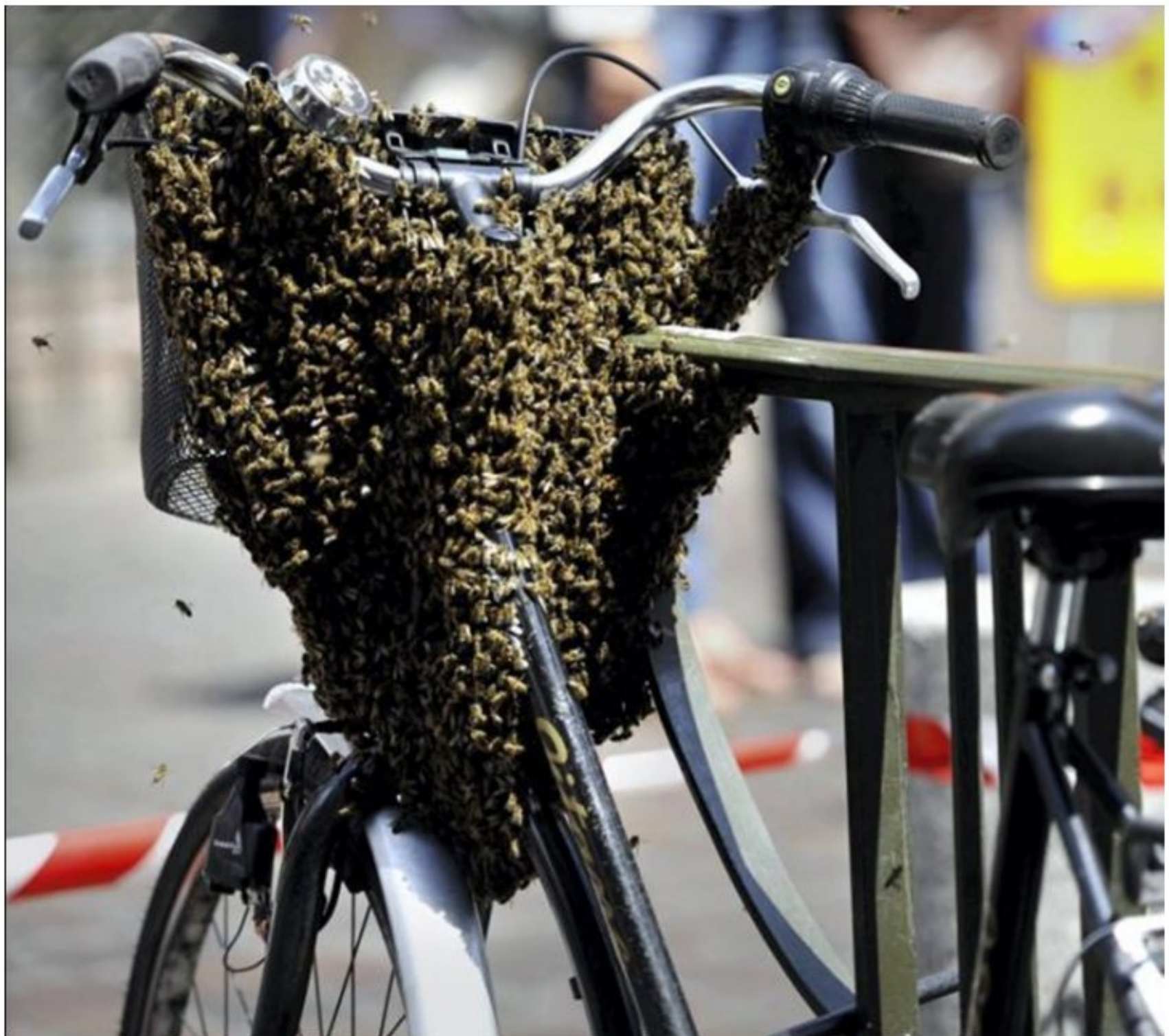
abeilles "en stationnement"