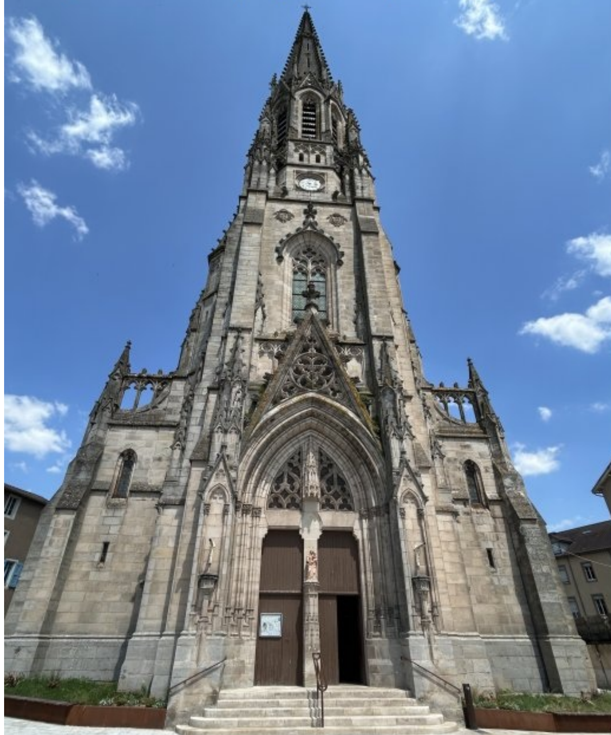
église de St Affrique - juin 2025