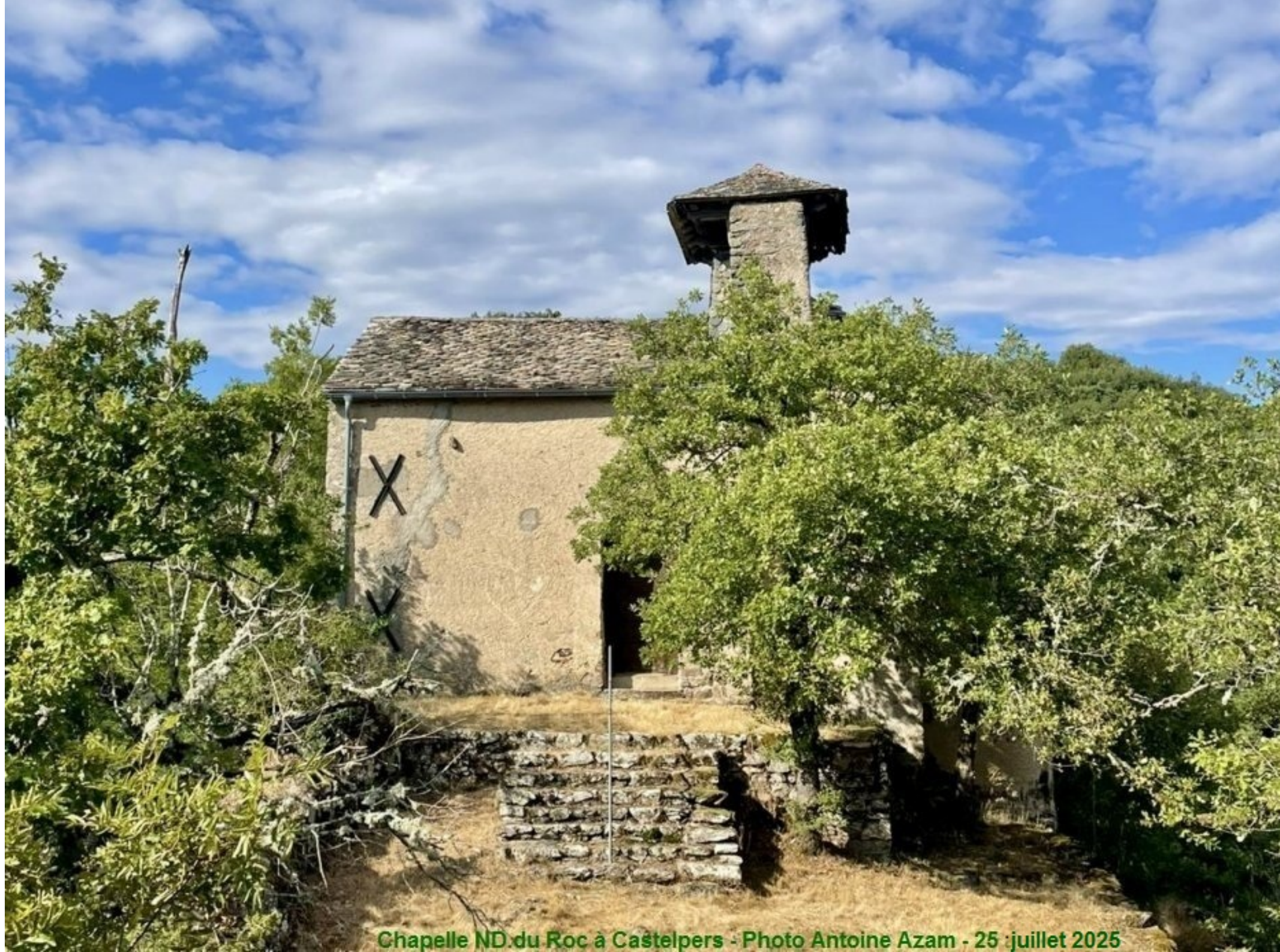
Chapelle ND du Roc à Castelpers - Photo Antoine Azam - 25 juillet 2025