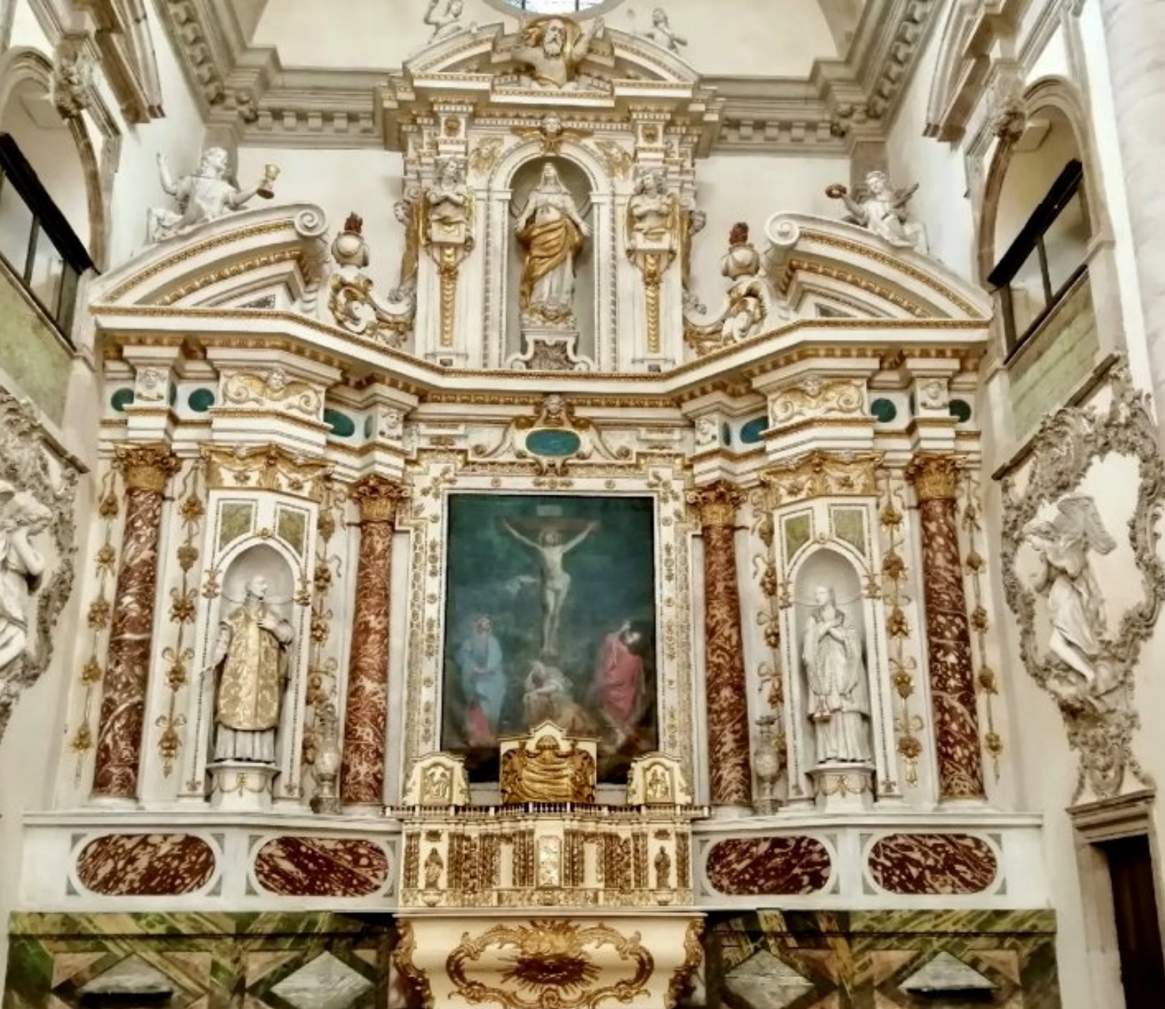
Le grand retable baroque du maître-autel de la Chapelle de l'Ancien Collège Royal de Rodez réouverte aux visites après plus de 10 ans de travaux ; un chef d'oeuvre de l'art baroque à voir absolument... Photo Meljac.net - 22 août 2025