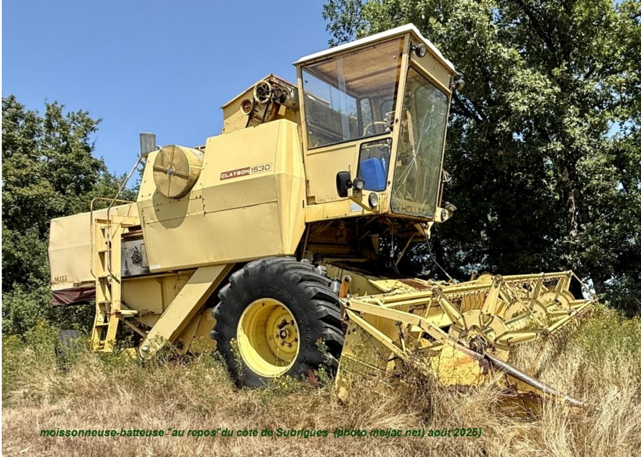
moissonneuse-batteuse "au repos" du côté de Subrigues août 2025)