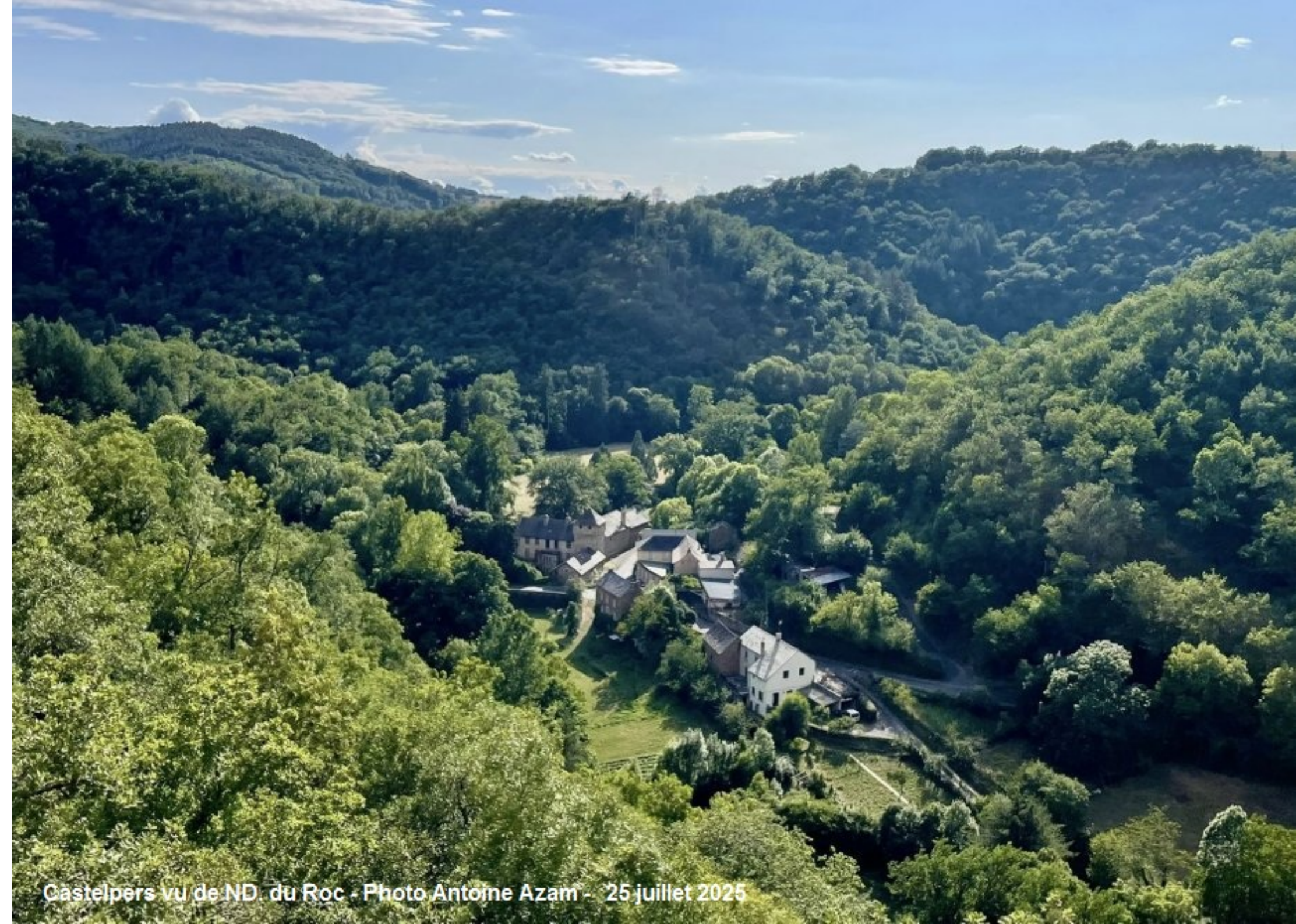
Castelpers vu de ND du Roc - 25 juillet 2025