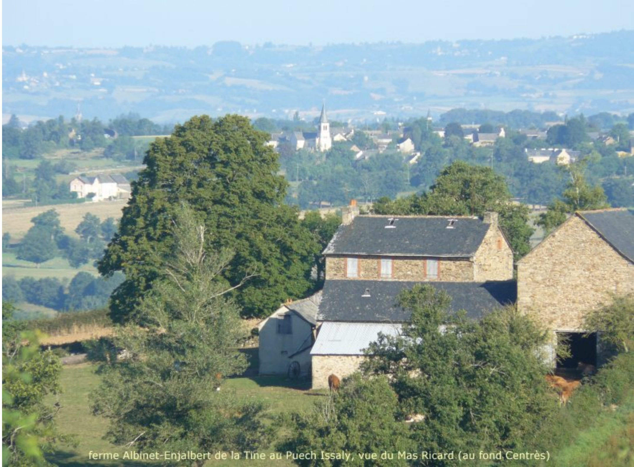
ferme Albinet-Enjalbert de la Tine au Puech Issaly, vue du Mas Ricard (au fond Centrès)