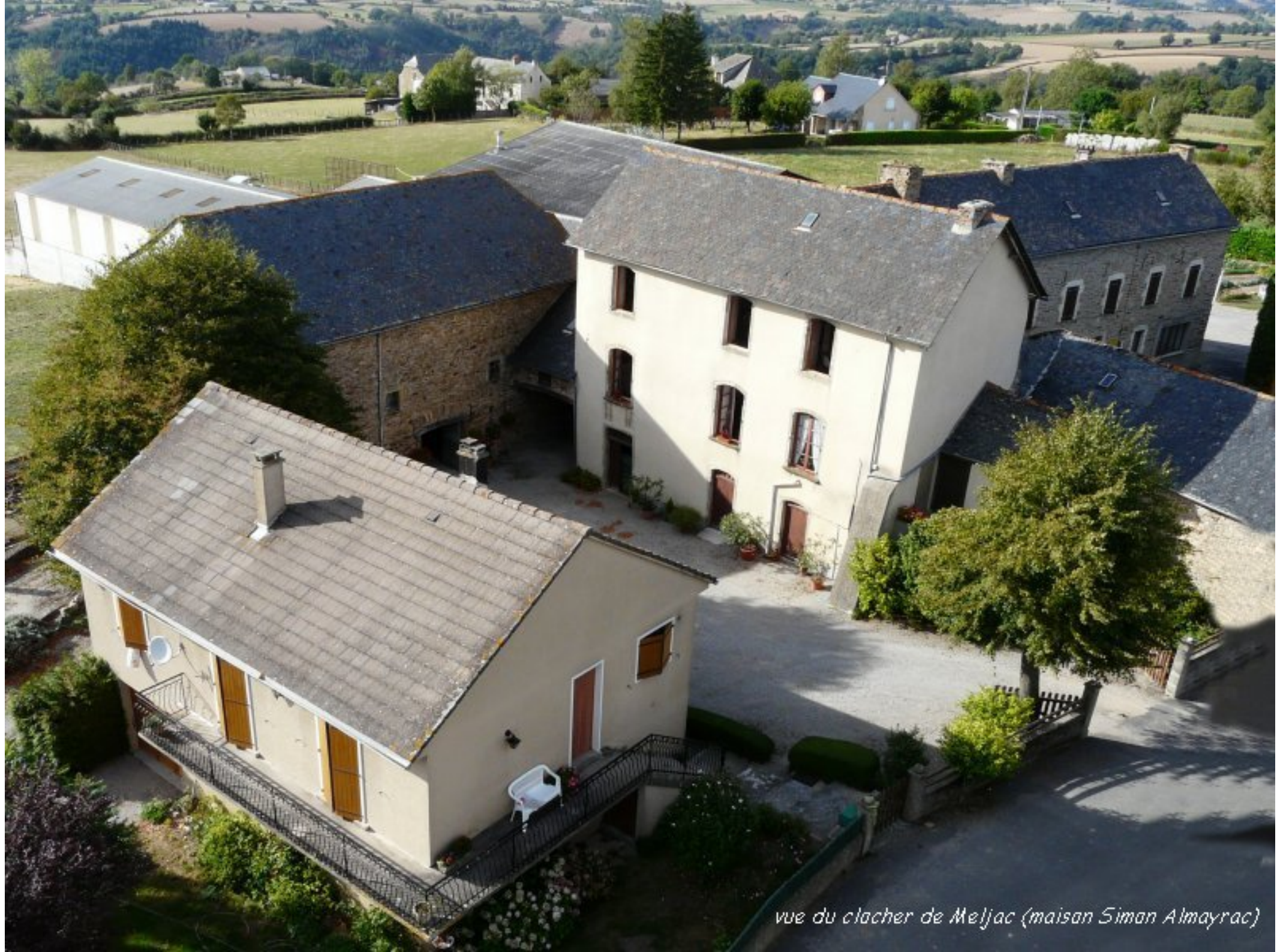
vue du clacher de Meljac (maison Simon Almayrac)