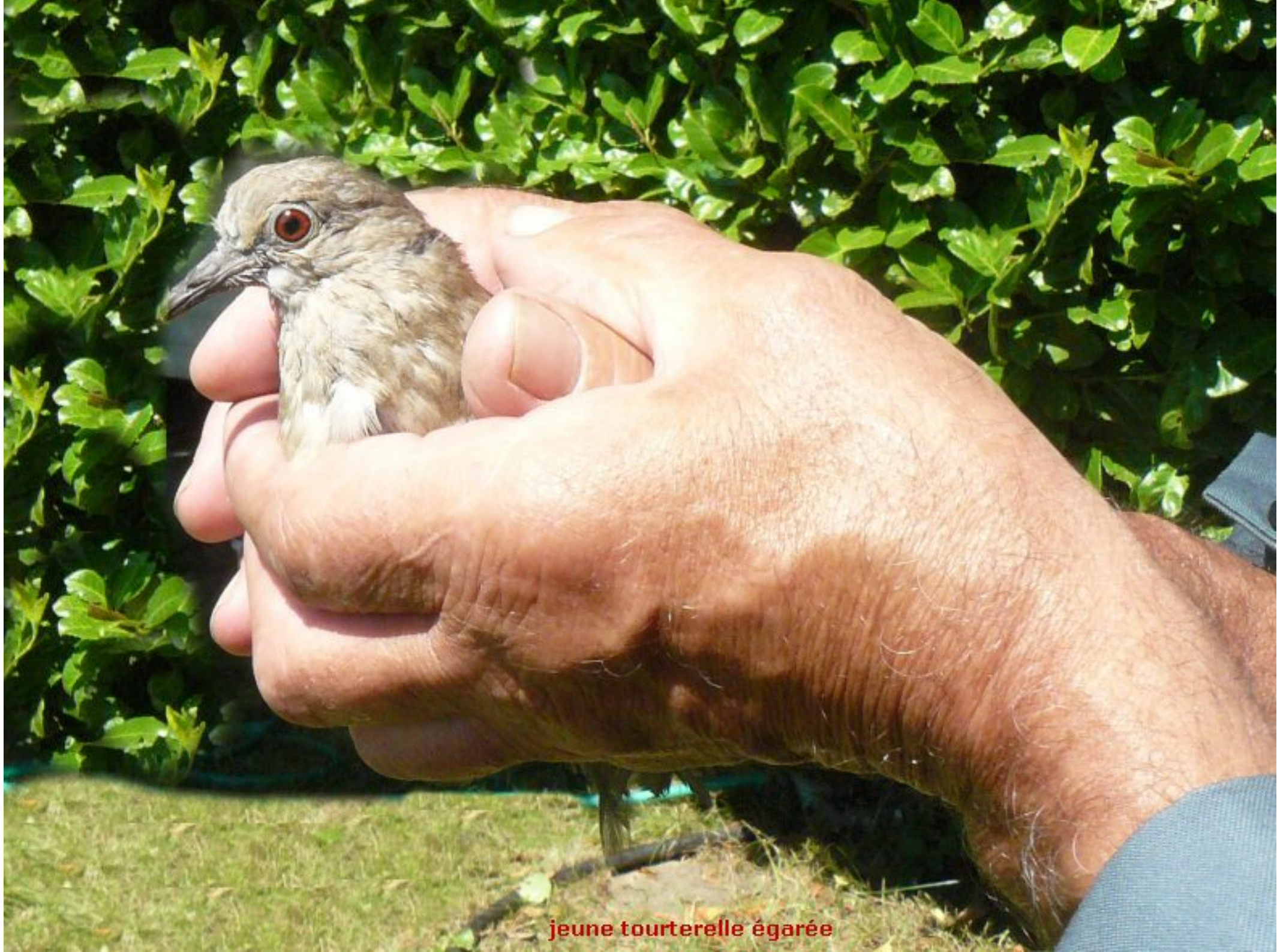
jeune tourterelle égarée