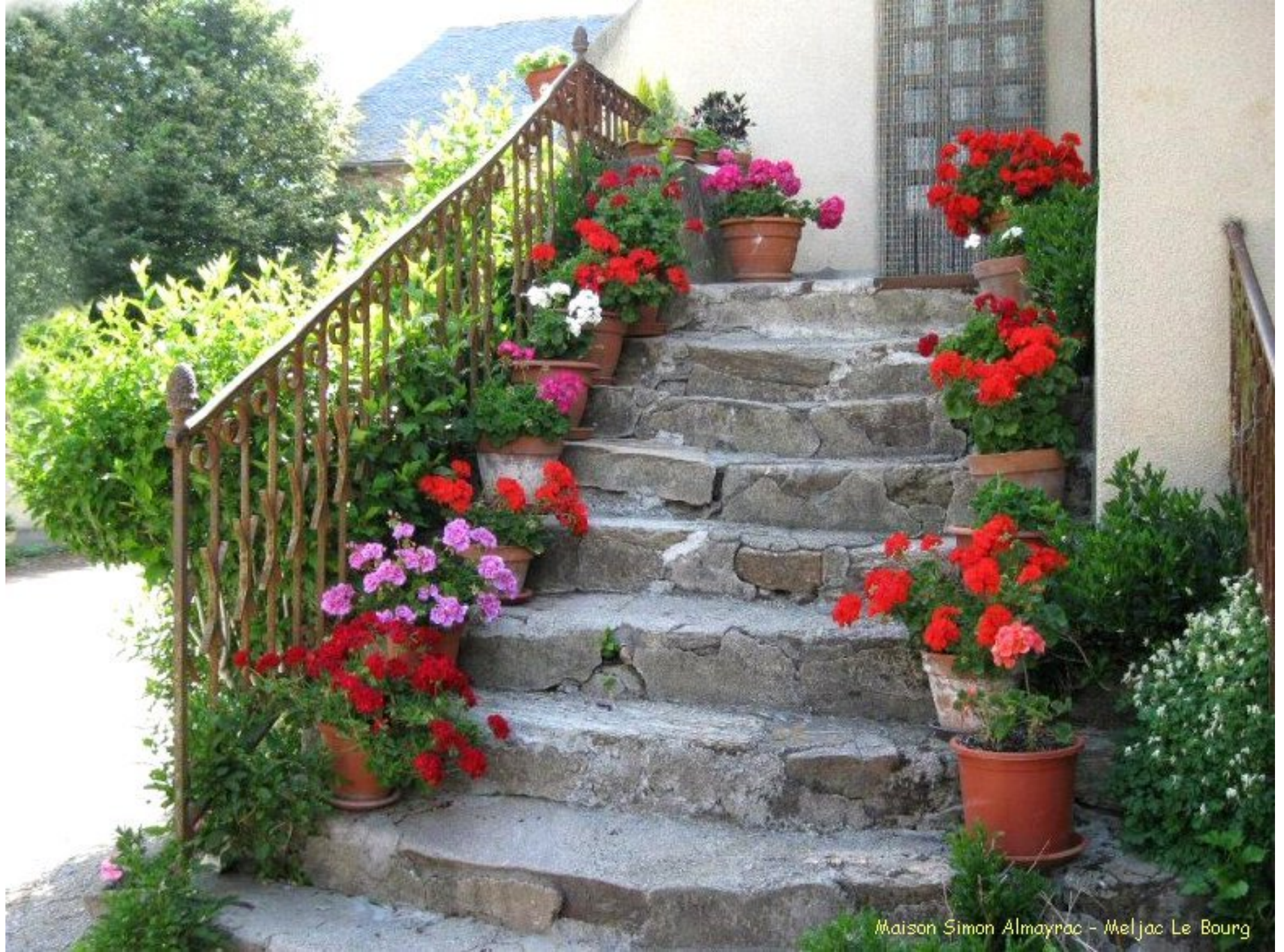
Maison Simon Almayrac - Meljac Le Bourg