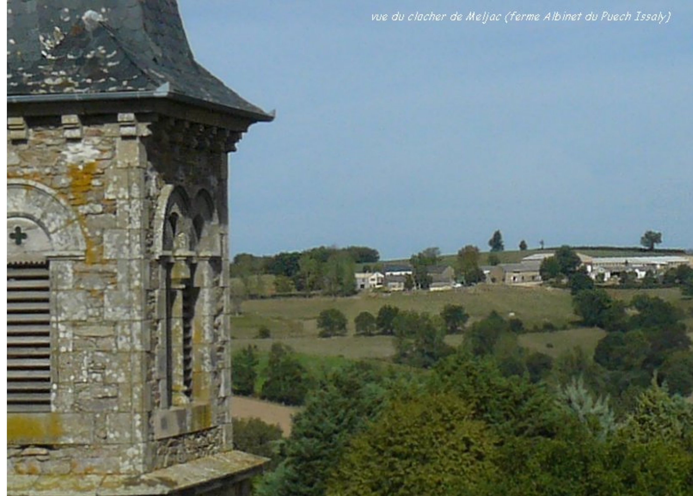
vue du clocher de Meljac (ferme Albinet du Puech Issaly)