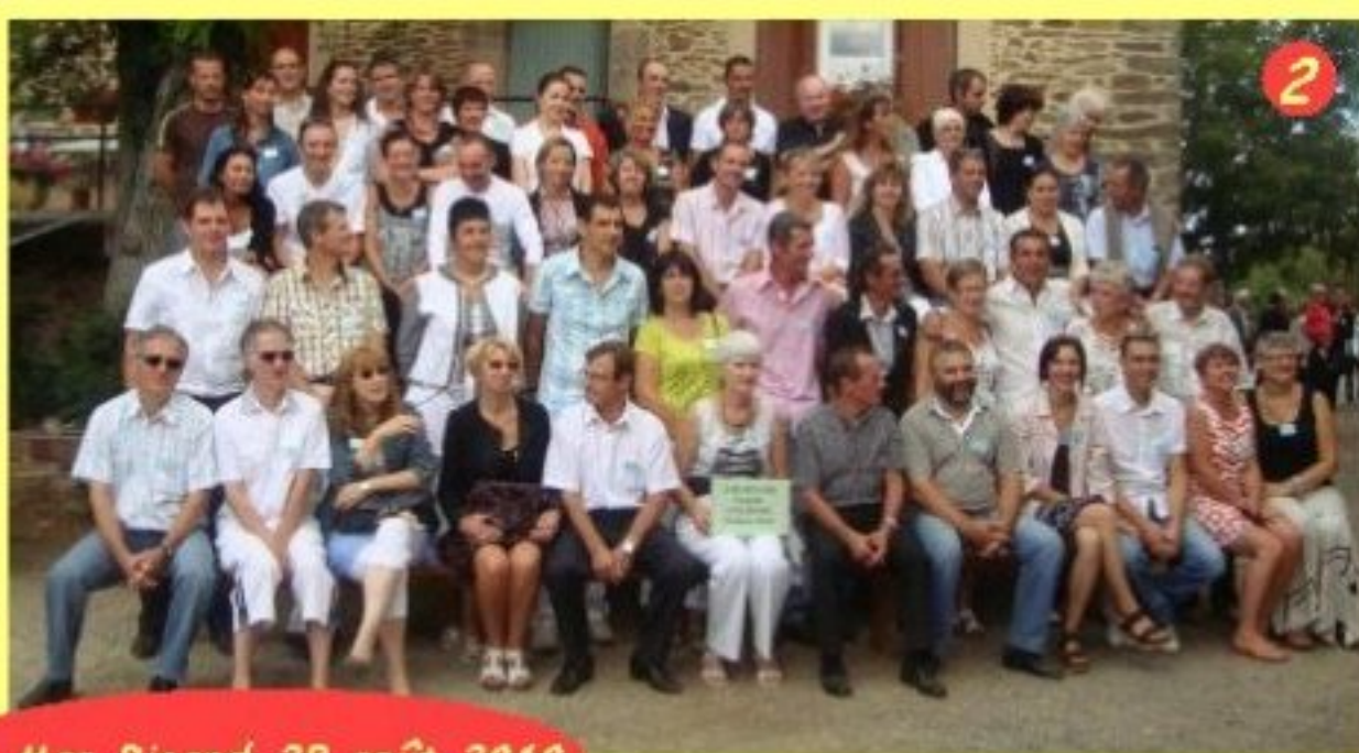
Le Mas Ricard-28 août 2010