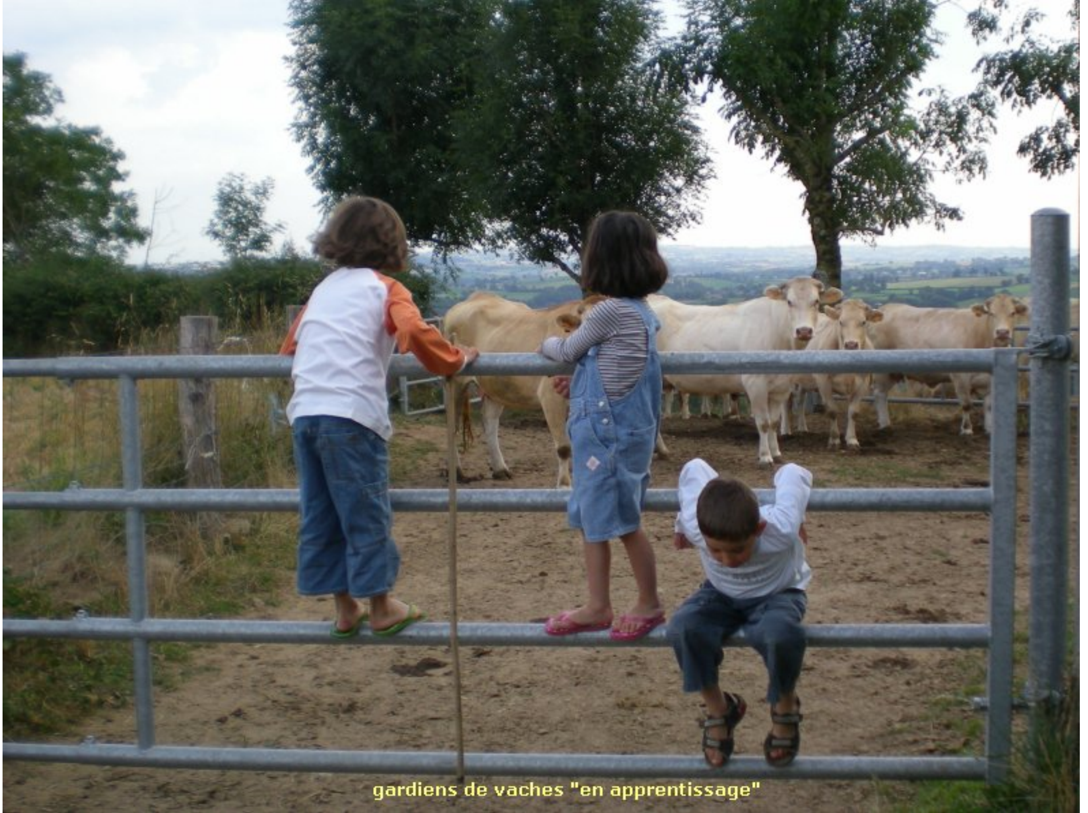
gardiens de vaches "en apprentissage"