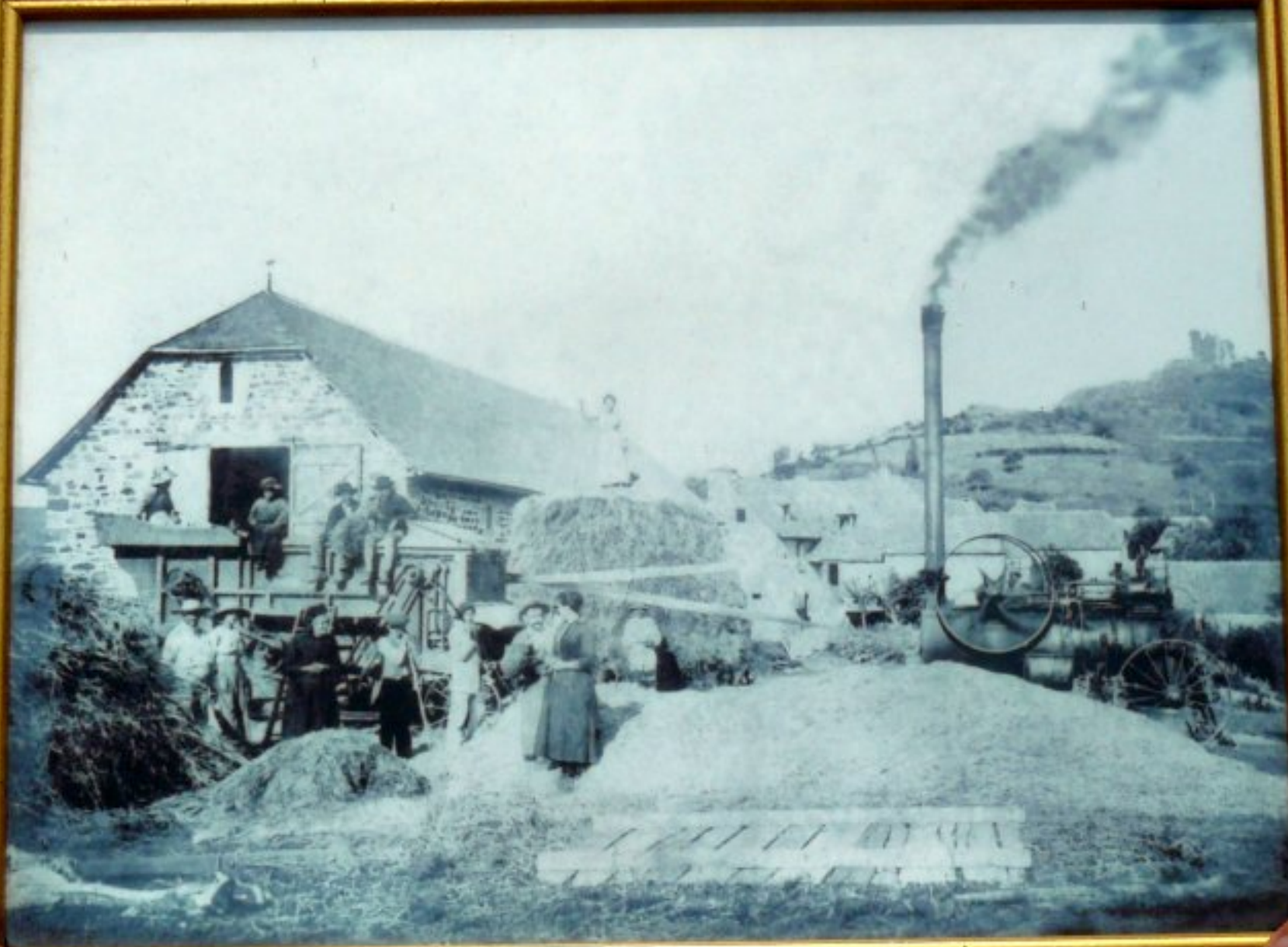
battage à l'ancienne près d'Espalion (cf. château de Calmont - en haut à droite) dans les années 1914-18 (cf. main d'oeuvre majoritairement féminine)