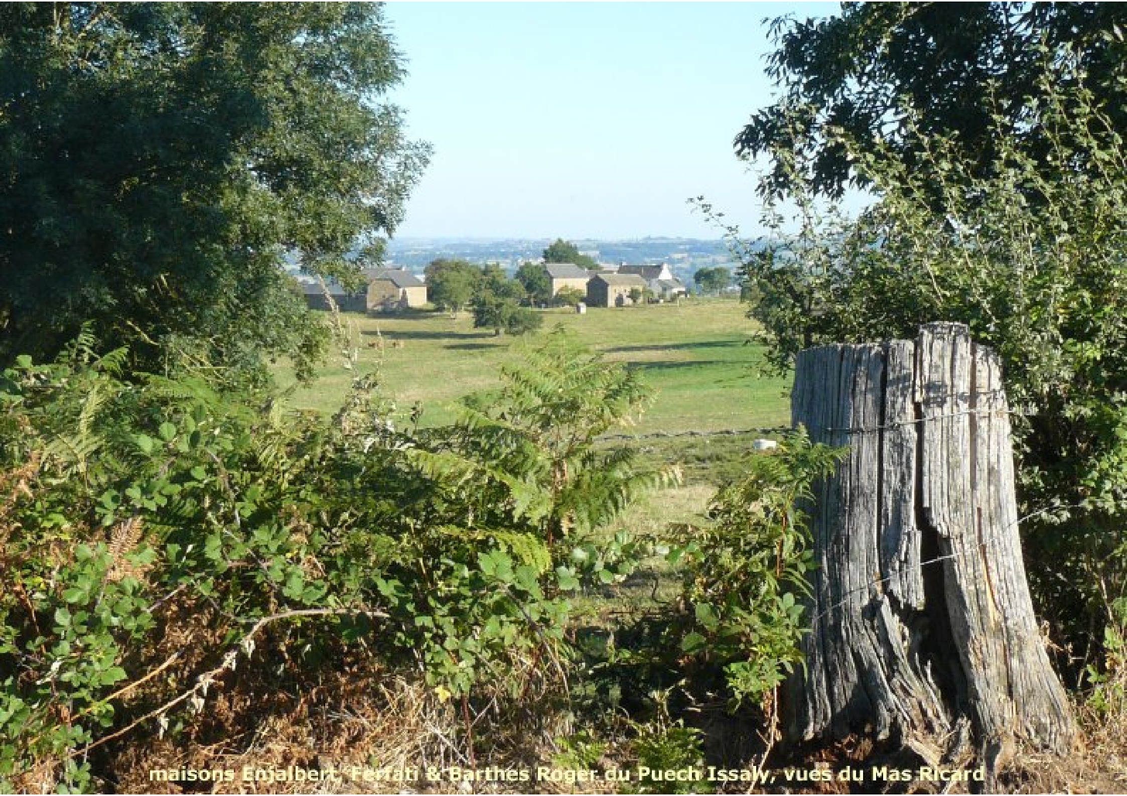
maisons Enjalbert, Ferrati & Barthes Roger du Puech Issaly, vues du Mas Ricard