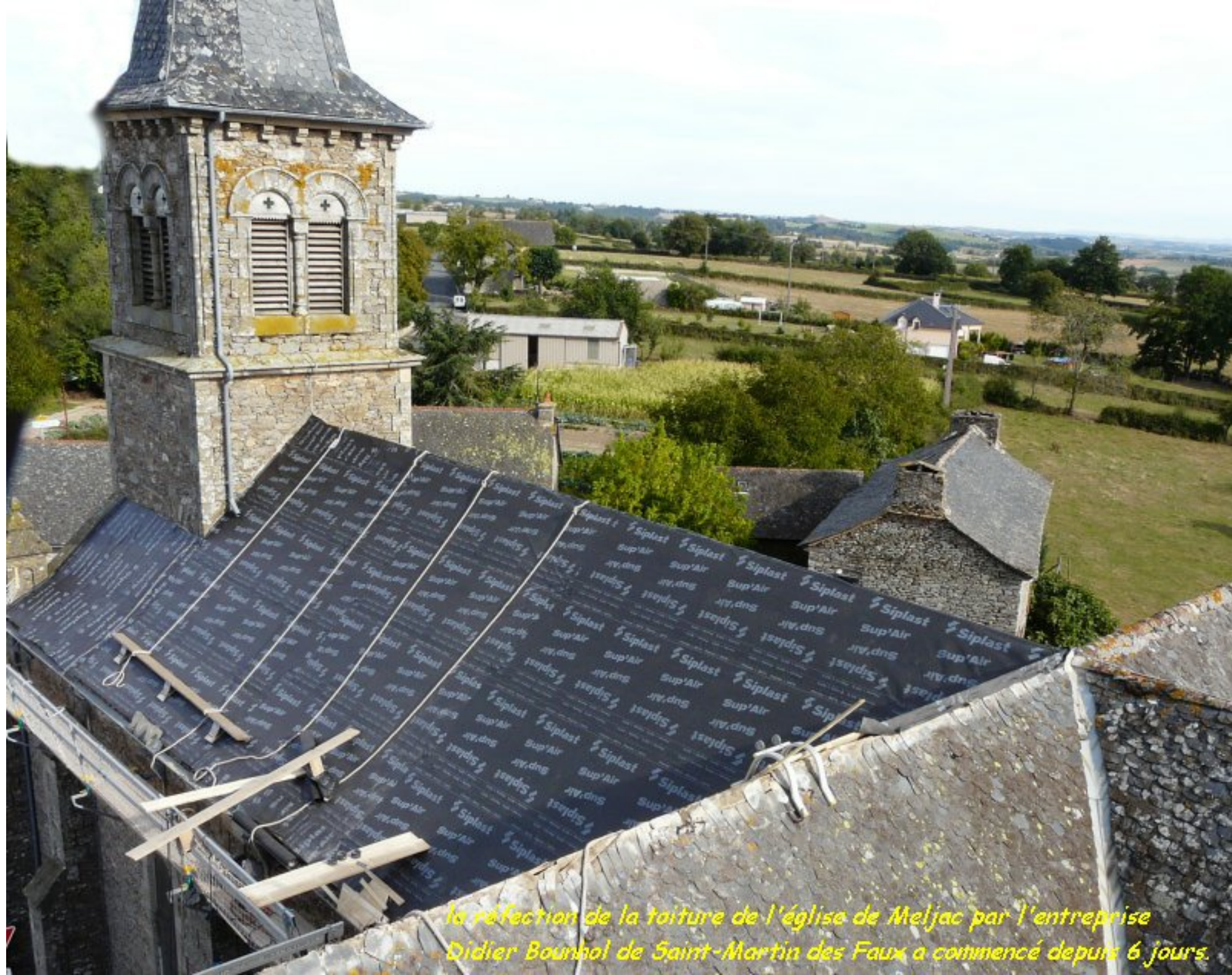
la réfection de la toiture de l'église de Meljac par l'entreprise Didier Bounhol de Saint-Martin des Faux a commencé depuis 6 jours.