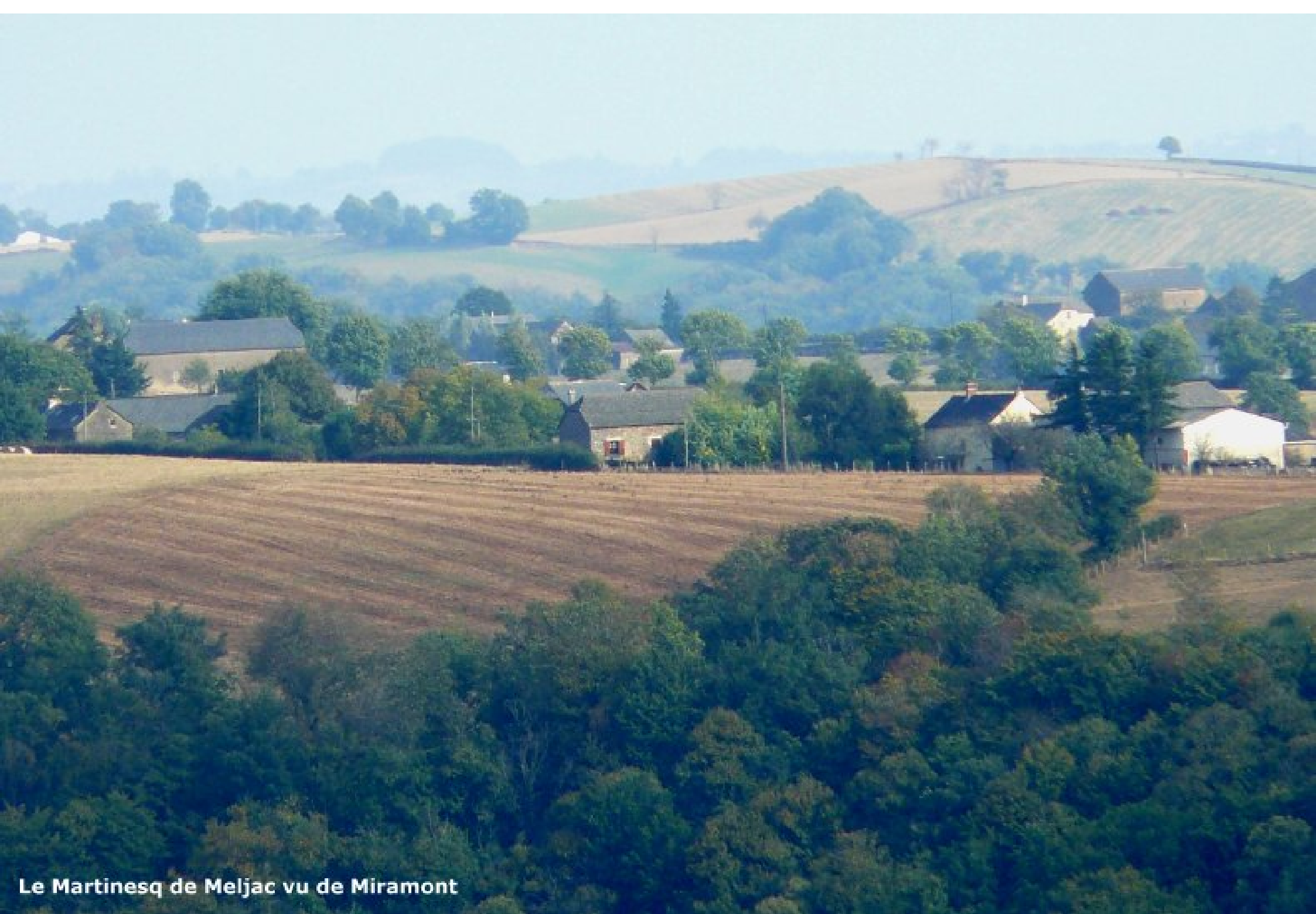
Le Martinesq de Meljac vu de Miramont