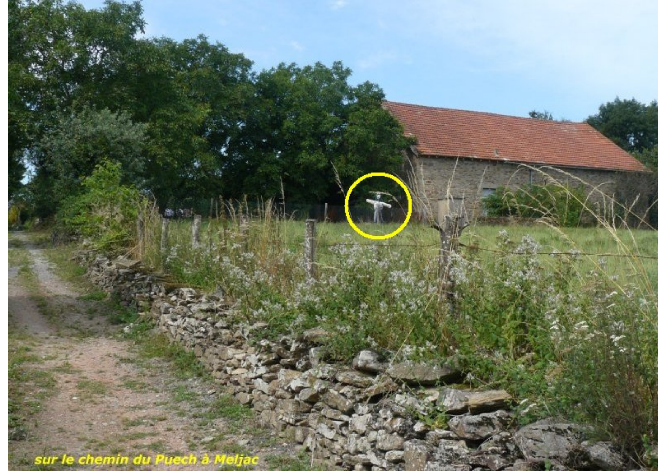
sur le chemin du Puech à Meljac