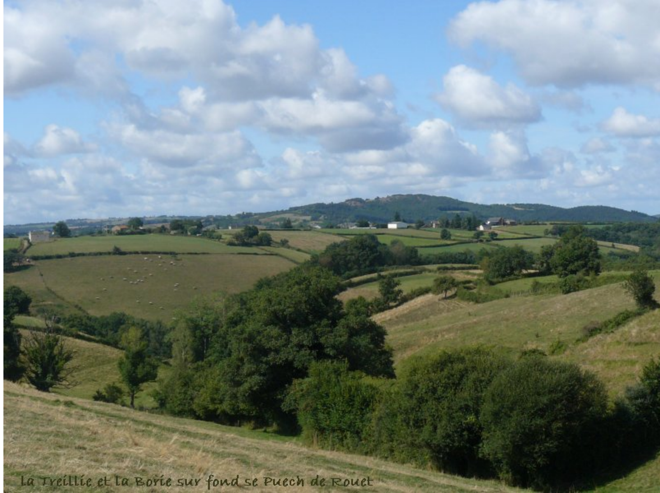
La Treïllie et la Borie sur fond se Puech de Rouet