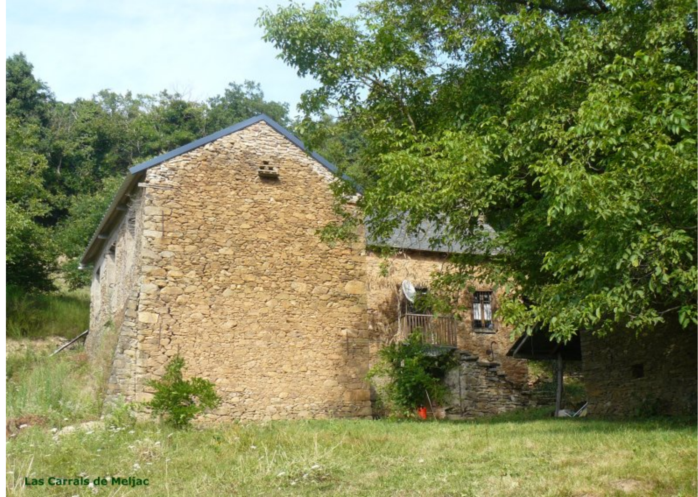
Las Carrals de Meljac