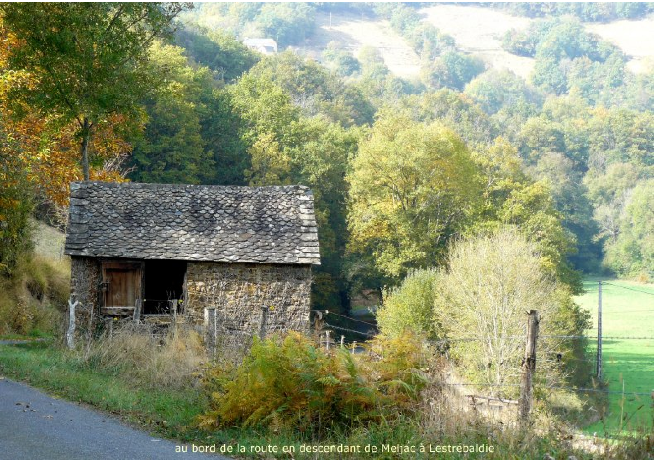
au bord de la route en descendant de Meljac à Lestréaldie