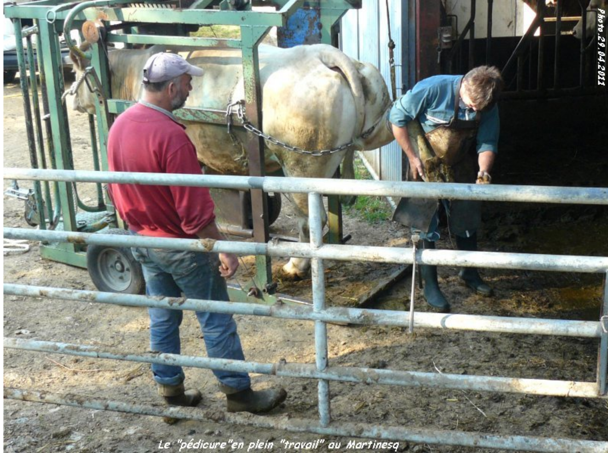
Le "pédicure" en plein "travail" au Martinesq