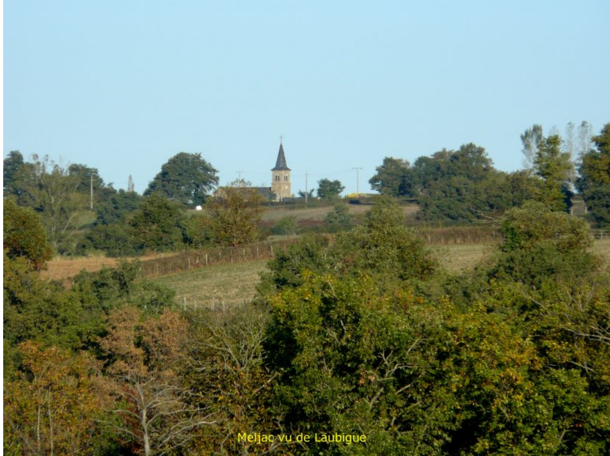
Meljac vu de Laubigue