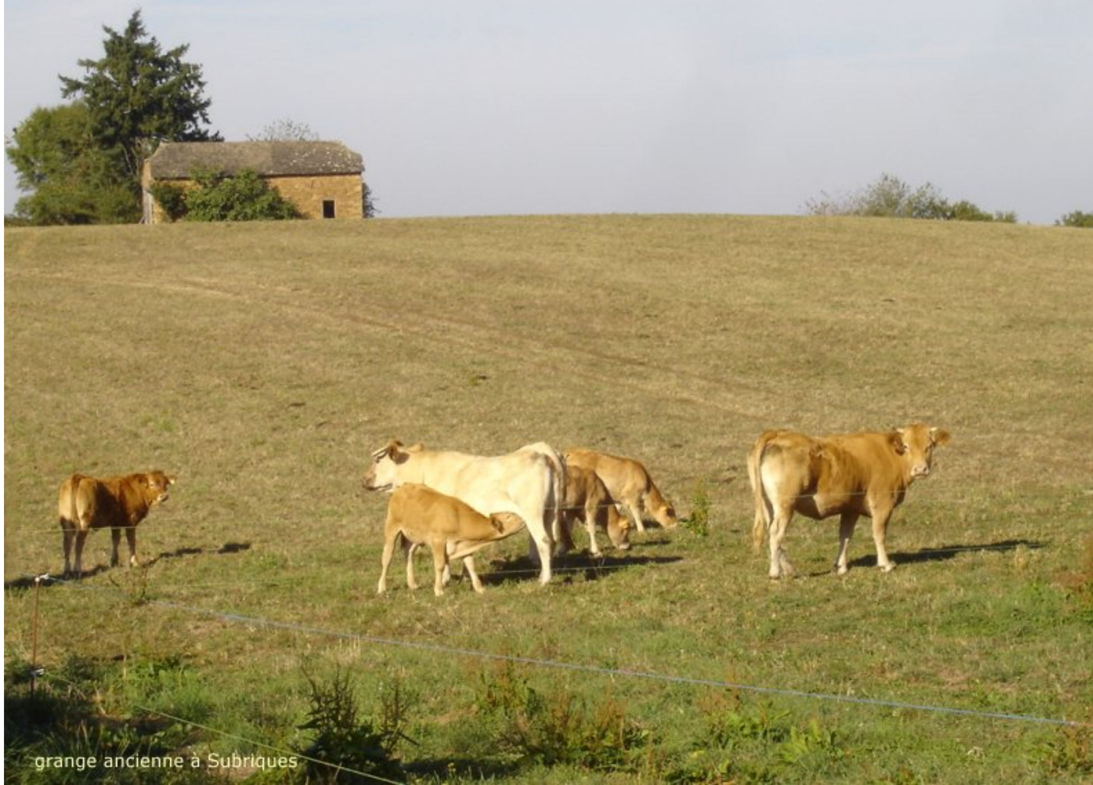
grange ancienne à Subriques